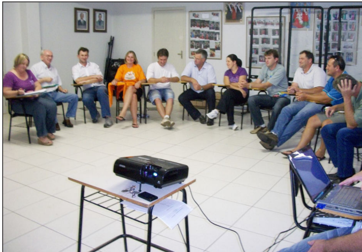
Comissão Organizadora da Westfália em Festa esteve reunida esta semana

N a tarde de quarta-feira, dia 16, a Comissão Organizadora da Westfália em Festa se reuniu para esmerar diversos pontos com vistas ao sucesso do evento. Foram equacionados ajustes e ampliações no layout do parque: realocação do palco e praça de alimentação; ampliação do número de espaços para expositores; andamento das obras viárias (avenida Enio Grave e ruas transversais), das obras do Pavilhão Social do Flamengo; espaços para estacionamento.