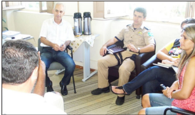
Limitações de carga foi o principal assunto na reunião

O 1º Carnaval Regional de Lajeado acontece no dia 5 de março, na Rua Santos Filho, integrando a participação de seis escolas de samba, sendo quatro de Lajeado, uma de Bom Retiro do Sul e uma de Taquari. O secretário informa ainda que “todos os detalhes estão prontos e haverá novidades, como iluminação extra, cronômetro eletrônico, telão na avenida e seis jurados da Associação de Julgadores de Carnaval do Rio Grande do Sul”. O Regulamento já foi elaborado pela Comissão Organizadora, formada em março do ano passado.