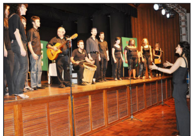
Coral Vocalize encantou os presentes