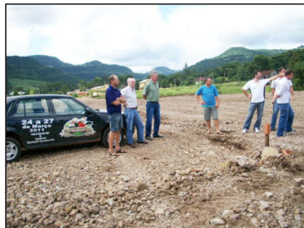
Participantes da reunião observando as obras