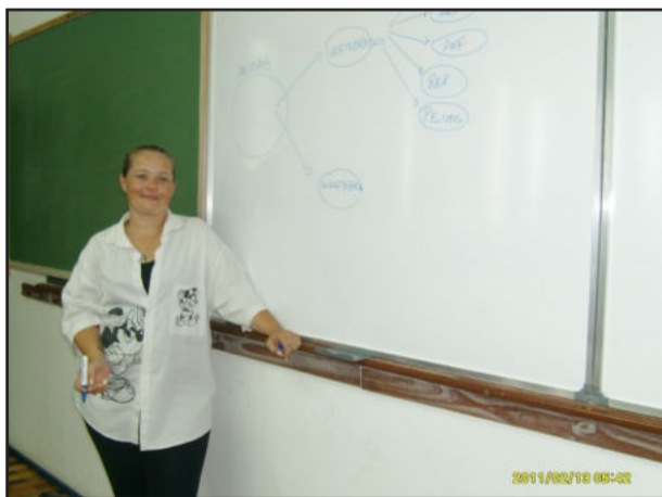
Professora satisfeita com quadro novo