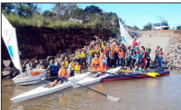
Aprendizado de esportes náuticos no Projeto Navegar

As inscrições ainda estão abertas. Interessados podem ir à sede do Projeto Navegar (na Rua Arnaldo José Diehl no Pavilhão da Prefeitura - antiga sede da Ambev).