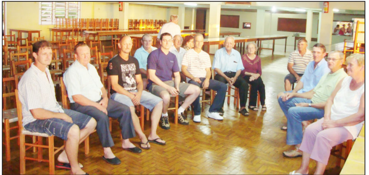
Em reunião com a comunidade, Administração definiu próximo encontro comunitário em Linha Germano

Pela primeira vez em 30 anos, prefeito e equipe administram a partir das comunidades