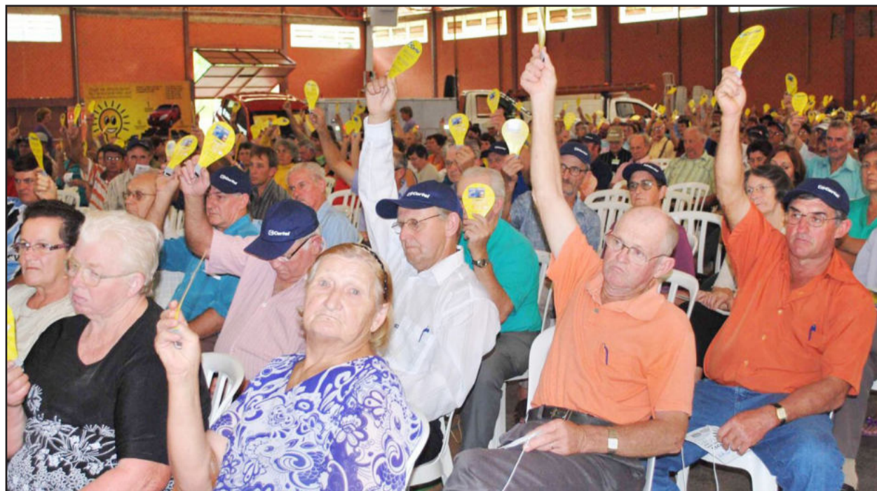
Associados são o maior patrimônio da Certel