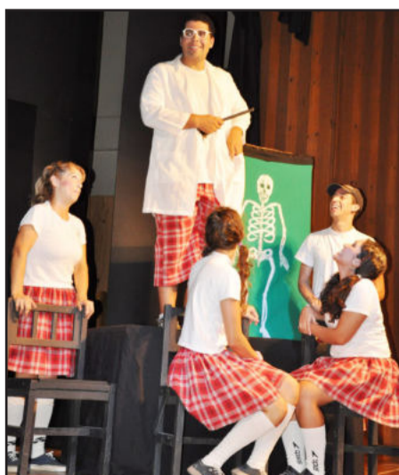
Teatro na abertura do ano letivo 2011