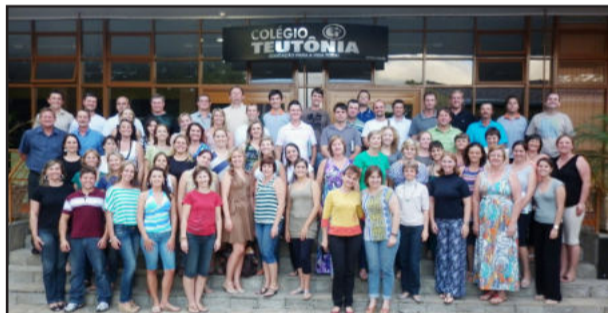
Equipe de professores e colaboradores do Colégio Teutônia volta motivada para início do ano letivo 2011