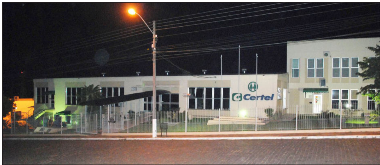
Sede administrativa da Certel em Teutônia