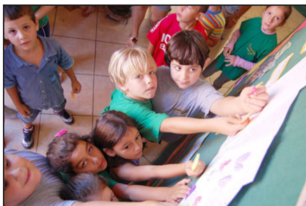
Alunos do primeiro ano

Nesta terça-feira, dia 15, à noite, no Centro Comunitário Evangélico do Colégio Alberto Torres, foi realizado o evento de abertura do ano letivo com os professores, estagiários, monitores e recreacionistas da rede municipal de educação. Eles puderam conferir a apresentação do Coral Vocalize, da Univates, e da peça “Quadro Negro”, encenada pelo grupo Luz & Cena, de Novo Hamburgo. Durante o teatro os presentes divertiram-se e emocionaram-se com as situações apresentadas, que retratam a visão da educação através dos olhos do artista, que dedica amor a tudo que faz.