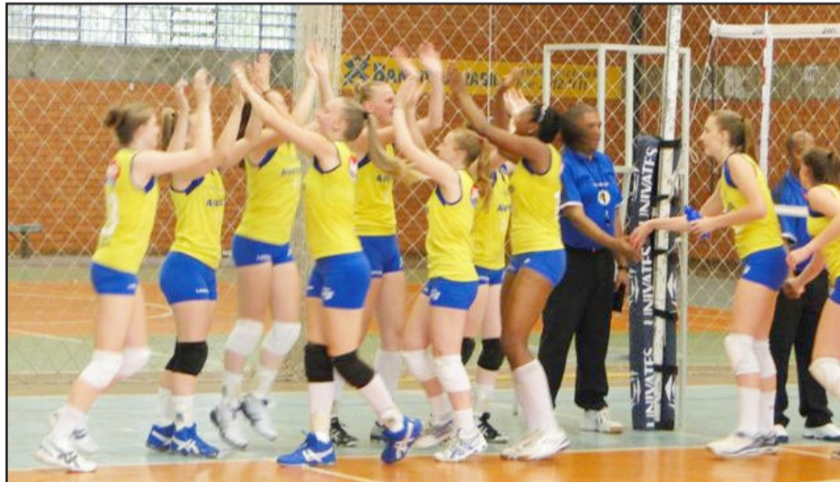
Repetir o sucesso de 2010 dentro das quadras será um desafio para as equipes da AVATES