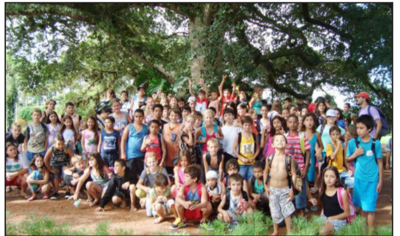
Cerca de 200 crianças e adolescentes participaram do Colônia de Férias