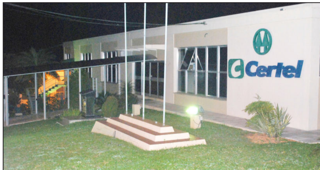
Sede administrativa da Certel é no Município de Teutônia. Página 7