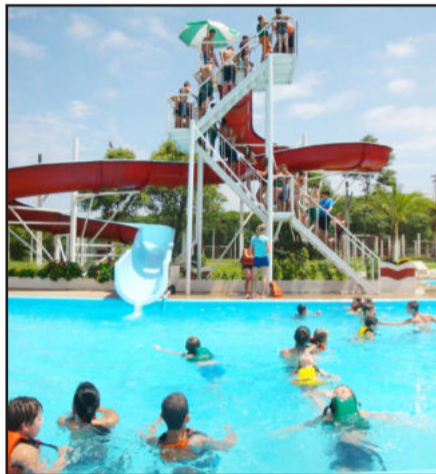
Nas piscinas da Sociedade Rio Branco

O Colônia de Férias atendeu crianças e adolescentes entre 07 e 17 anos, em seis locais distintos: Comunidade Nossa Senhora Auxiliadora (Bairro Auxiliadora), AMBI (B. Indústrias), EMEI Criança Feliz (Bairro Moinhos), EMEF Odilo Afonso Thomé (Imigrantes), CTG Raça Gaúderia (Loteamento Popular Boa União) e Projeto Navegar (Centro).