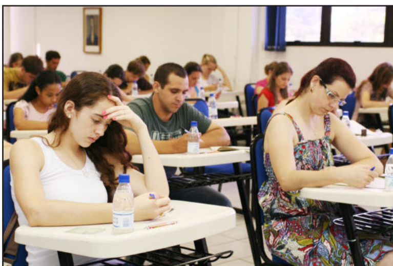
Candidatos terão três horas para realizar a prova

Os vestibulandos deverão estar no local da prova, meia hora antes do início da avaliação, munidos de documento de identidade e do comprovante de pagamento da inscrição. A lista completa da localização das salas está disponível no site www.univates.br/vestibular/localize-sua-sala . A divulgação dos resultados será na próxima terça-feira, dia 22, às 17h, no site da Univates. Mais informações podem ser obtidas pelo telefone 0800 707 0809.