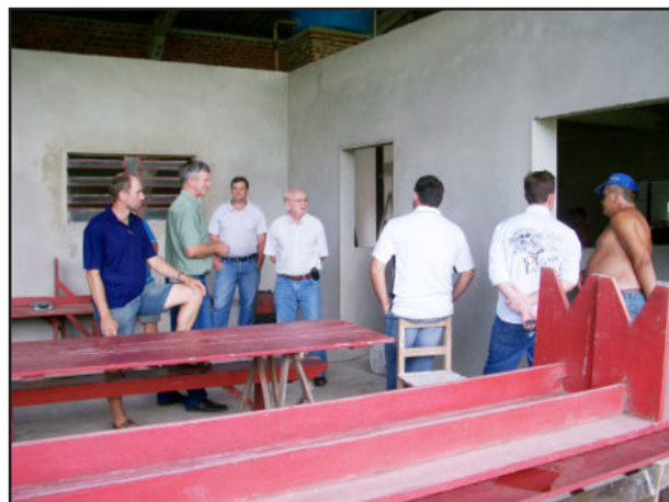
Ajustes no espaço do Flamengo Futebol Clube

O secretário da Educação, Gustavo Sieben, informou que 17 candidatas estão inscritas para o Concurso das Soberanas de Westfália, com mandato de dois anos, cuja escolha figura na programação da Westfália em Festa no sábado dia 26 de março.