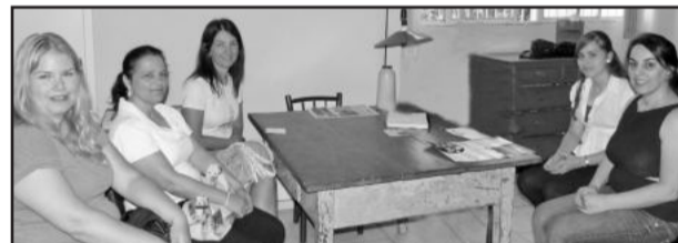
Grupo visitou a Folha Popular Garibaldi-Carlos Barbosa

consultas médicas e orientação sobre cuidados básicos na saúde. Existirá atenção especial à terceira idade, com feira sobre artes, habilidades, e dicas de cuidados que nessa época não podem ser negligenciados. Prevê-se uma sessão de cinema exclusiva para mulheres, competições esportivas, espetáculo teatral, entre outras atividades, que têm por objetivo comemorar uma data lembrada internacionalmente, que lembram o quão importante as mulheres são.