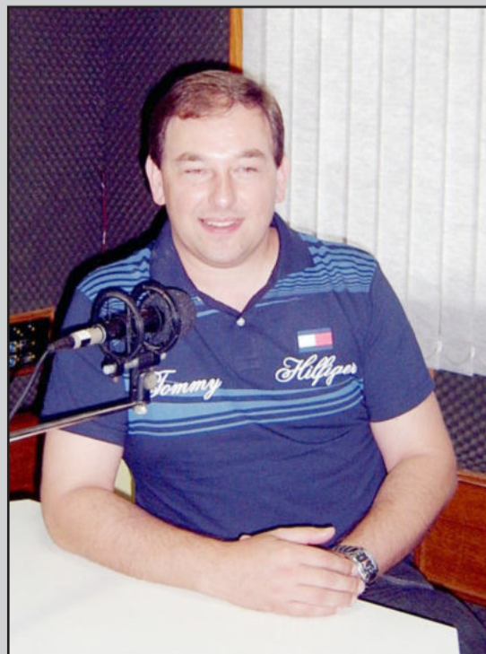
Keller anuncia mais um asfaltamento

A obra terá também, em toda sua extensão de 1390 metros, calçada de passeio num dos lados da via, para o tráfego de pessoas com segurança, especialmente das crianças. “Temos esta preocupação para garantir a segurança porque o fluxo de pessoas é bastante intenso e pode aumentar mais ainda”, destaca o prefeito.