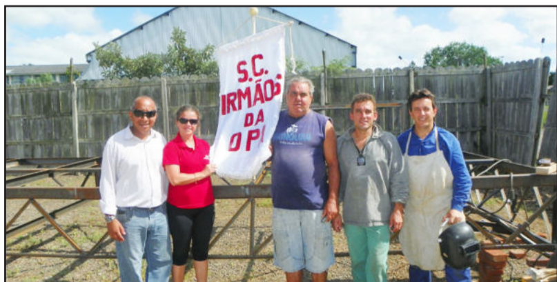
Irmãos da Opa estreia neste ano no Carnaval de Rua de Fazenda Vilanova

O Carnaval de Rua de Fazenda Vilanova é realizado pela administração municipal e bloco Foliões da Fazenda.