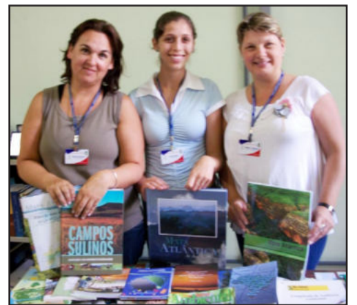
Novos exemplares no acervo bibliográfico

Os materiais serão integrados ao acervo bibliográfico existente na Sala Verde, constituído atualmente por cerca de 830 volumes, reforçando os objetivos e as ações do Projeto Sala Verde em disponibilizar e ampliar o acesso a informações ambientais para a comunidade.