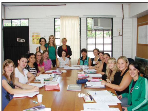
Questões referentes a regimento, planos de estudos e avaliações também foram abordadas

A reunião de planejamento do ano letivo entre a Secretaria Municipal de Educação e as diretoras e coordenadoras das escolas de Educação Infantil de Teutônia foi realizada na manhã de terça-feira, dia 15 de fevereiro, junto à sala 62 do Centro Administrativo. A meta principal para 2011 está em fortalecer as escolas como grupo, sob o enfoque “Escola e família unidas pela educação das crianças”.