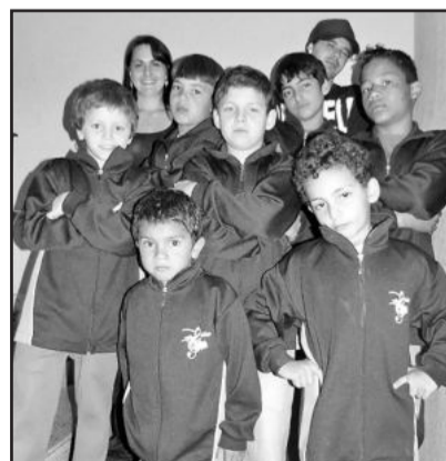
Crianças do Projeto Crescendo com a Dança