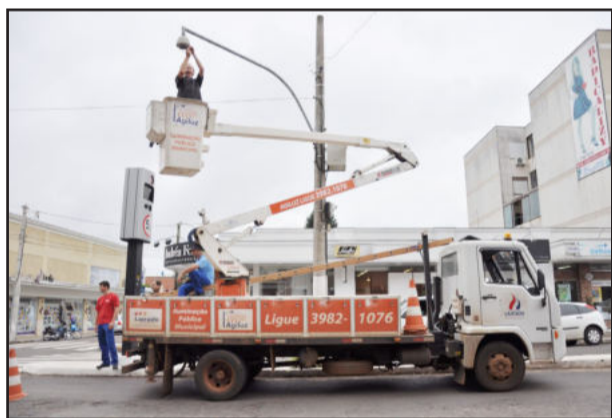
Câmeras estão localizadas em pontos estratégicos de Lajeado

Equipamentos que estavam em manutenção há duas semanas voltaram a funcionar