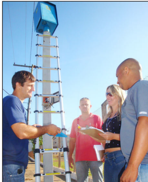
Lombadas foram aferidas pelo Inmetro