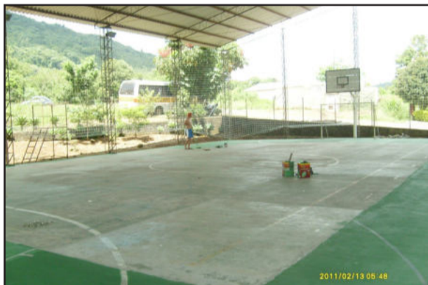
Quadra de esportes recebe nova pintura