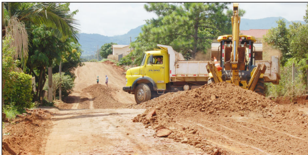
Começaram as obras para a pavimentação da Rua Leopoldo Klepker, no Bairro Alesgut

A Conpasul iniciou nesta semana as obras de pavimentação da Rua Leopoldo Klepker, no Bairro Alesgut, no trajeto compreendido entre as ruas Major Bandeira e Erno Dahmer, interligando duas partes importantes do bairro. Além de ser uma obra estratégica para o fluxo de veículos, tem o aspecto de pavimentar o acesso principal ao ginásio da Escola Municipal Leopoldo Klepker e a Igreja Católica Santos Mártires. A fase de terraplenagem e alinhamento da via começou com as máquinas terceirizadas pela Conpasul executando esta etapa da obra.