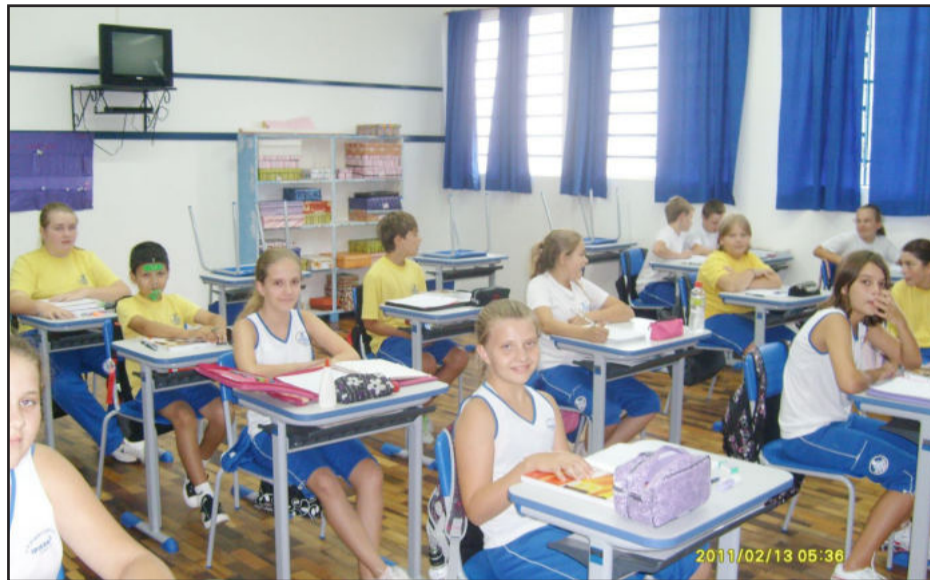
Salas receberam novas classes, cadeiras e quadros

Mas a principal mudança, comemorada por professores e alunos neste início das aulas, foram os novos móveis adquiridos. Todas as salas foram equi-