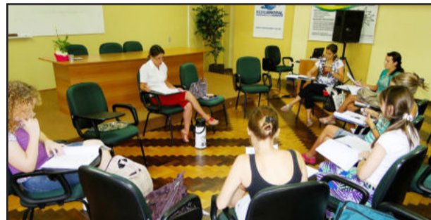
Docentes participaram de reuniões pedagógicas por área e por nível de ensino