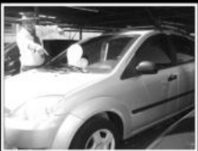
fiesta 2003, limpador e desembaçador traseiro, 4 portas, R$ 23.000

FONES: 3710.1929 / 3714.5724 / 3011.1929 Confira fotos em www.belloveiculos.com.br AV. BENJAMIN CONSTANT, 2333 - LAJEADO