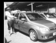
corsa premium 2009, completo, R$ 34.000,