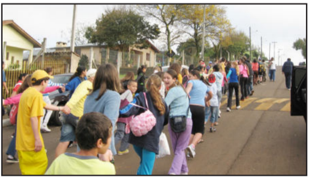
Integração entre alunos e pais

Para os educadores, Gandin fortalece as ideias quando prevê: "acreditar na participação é acreditar nas pessoas como sujeitos. Não é possível gerar a participação se não se incentiva o crescimento dos membros da Escola, para que eles possam atuar como interlocutores qualificados".