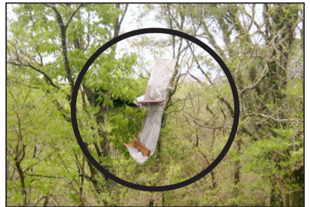
Folhas de zinco voaram para o mato