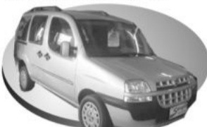
Prata COMPLETA 7 lugares R$ 46.500