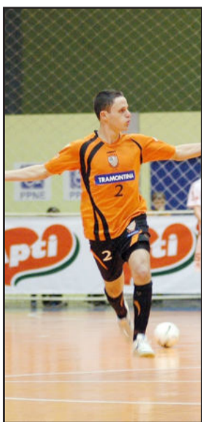
ACBF, do fixo Rodrigo, busca a vitória fora de casa nas quartas da Liga

A Associação Carlos Barbosa de Futsal (ACBF) entra em quadra nesta segunda-feira, dia 21, às 19h15min, para o seu primeiro jogo válido pelas quartas-de-final da Liga Nacional 2009. A equipe laranja enfrenta o Copagrill/Faville, Marechal Cândido Rondon - PR, no Ginásio Ney Braga, na cidade paranaense.