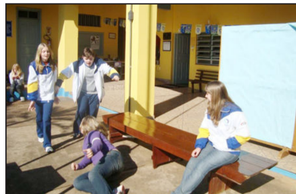
Alunos ensaiam no intervalo