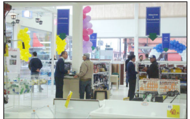
Carazinho recebe a 60ª loja da Certel

Foi inaugurada, no dia 11, em Carazinho, a sexagésima loja da Cooperativa Regional de Desenvolvimento Teutônia (Certel). Identificada como Home Center Certel e localizada na Avenida Flores da Cunha, Centro, a filial oferece móveis, eletrodomésticos, eletroeletrônicos e materiais de construção de primeira linha, com qualidade reconhecida.