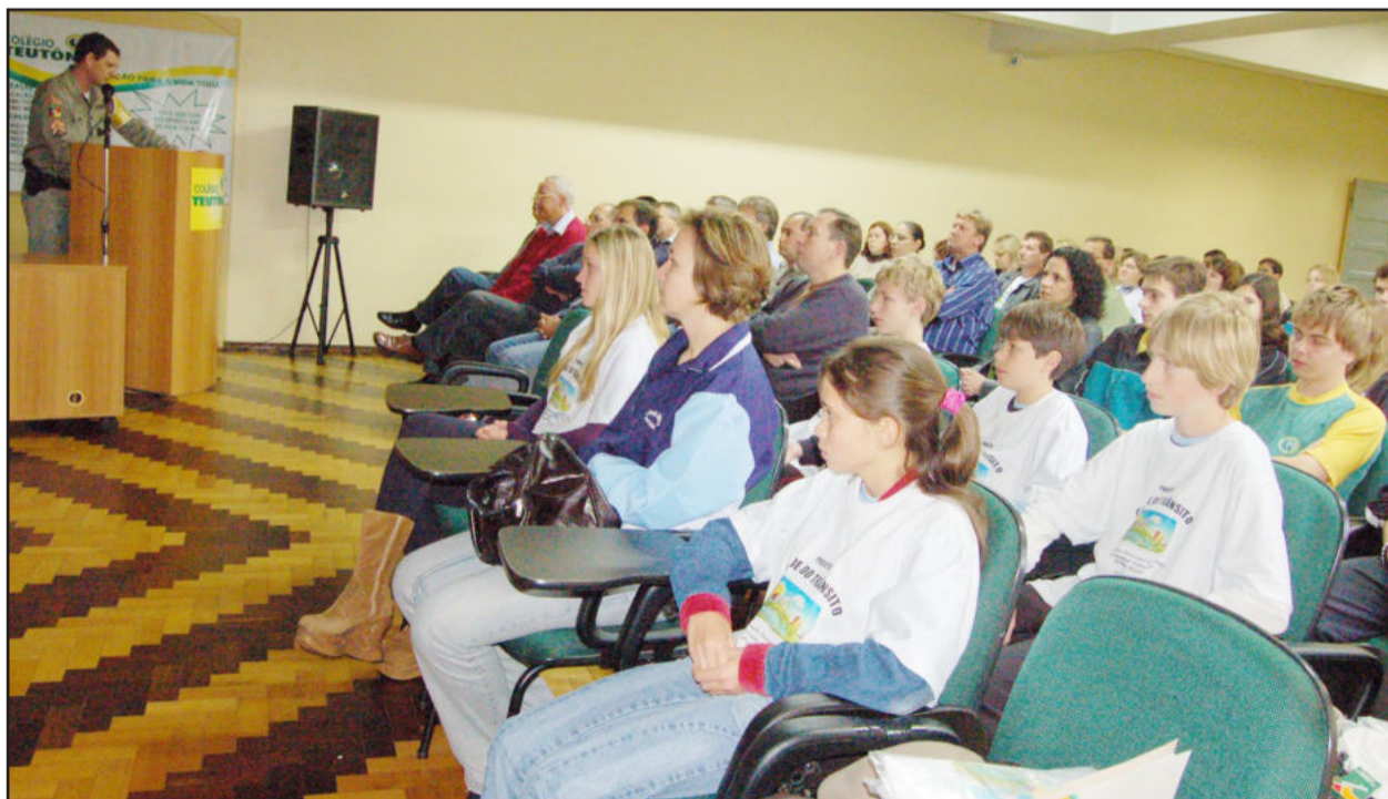
Lançamento da Semana do Trânsito em Teutônia