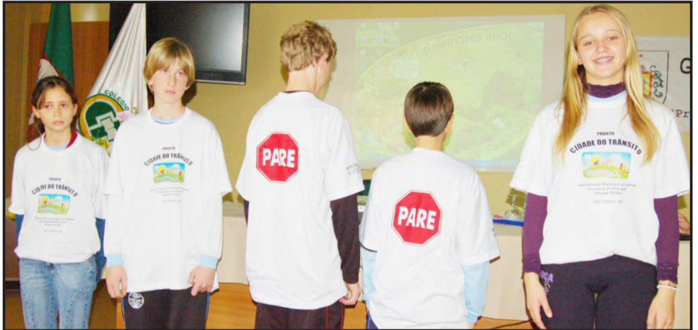
Projeto Cidade do Trânsito foi lançado ontem, envolvendo alunos e comunidade na redução de acidentes nas rodovias e ruas do Município. Páginas 12 e 13