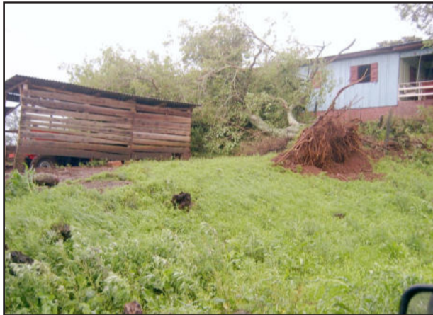
Árvore cafu entre galpão e casa