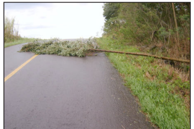
Eucalipto caiu sobre a pista