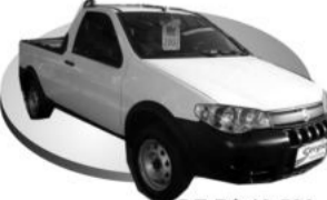
Branca DE R$ 19.500, POR R$ 18.800