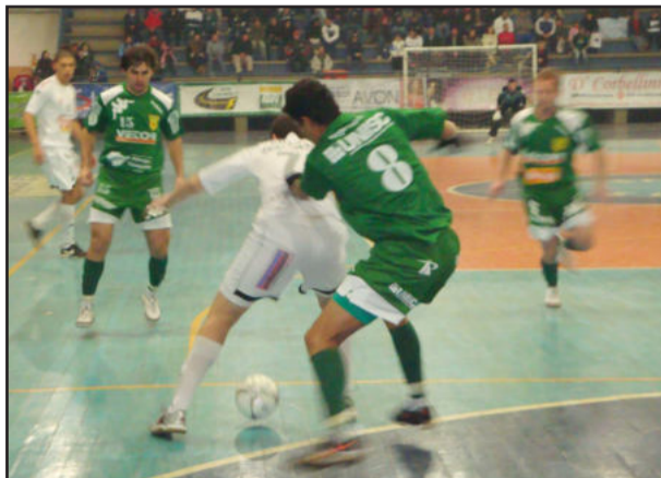
ALAF (branco) perdeu no meio da semana e pode ceder quinto lugar

O confronto é considerado de 6 pontos, pois as duas equipes disputam vaga na próxima fase. Enquanto a ALAF está em quinto lugar, com 25 pontos, a AGEL vem na sexta colocação com 23 pontos. Como a ALAF perdeu para o Atlântico por 4 a 0, na quarta à noite, as duas agremiações estão com o mesmo número de jogos e, portanto, podem decidir uma vaga à fase eliminatória.