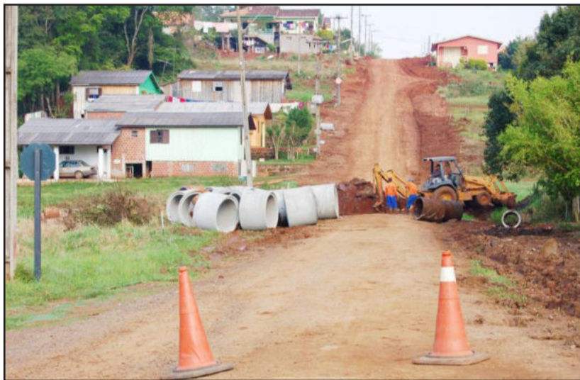
Obras de microdrenagem na Rua Edvino Schaeffer

Os recursos são provenientes de emenda do deputado federal Enio Bacci, no valor de R$ 888,7 mil para a pavimentação de ruas na Vila Popular. Ainda haverá uma contrapartida da Prefeitura para a concretização da obra. O projeto contempla a pavimentação de trechos das seguintes ruas: Sete, Gérbera, Elói José Corbellini, das Hortências e Edvino Schaeffer (entre a rua Bruno Driemeyer e o calçamento existente).