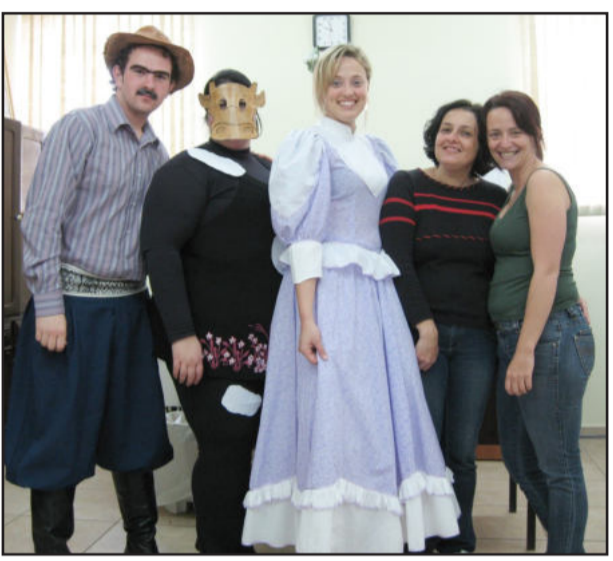
Professores incorporaram personagens

O encerramento da gincana da Escola Municipal 24 de Maio, do Loteamento 8, ocorreu no dia 5 deste mês, no Parque Poliesportivo em Canabarro, e teve a participação dos alunos de quinta a oitava séries dos turnos da manhã e da tarde. Foram realizadas atividades físicas e intelectuais que envolveram todos os integrantes das equipes. A gincana contou com a colaboração de professores dos anos finais.