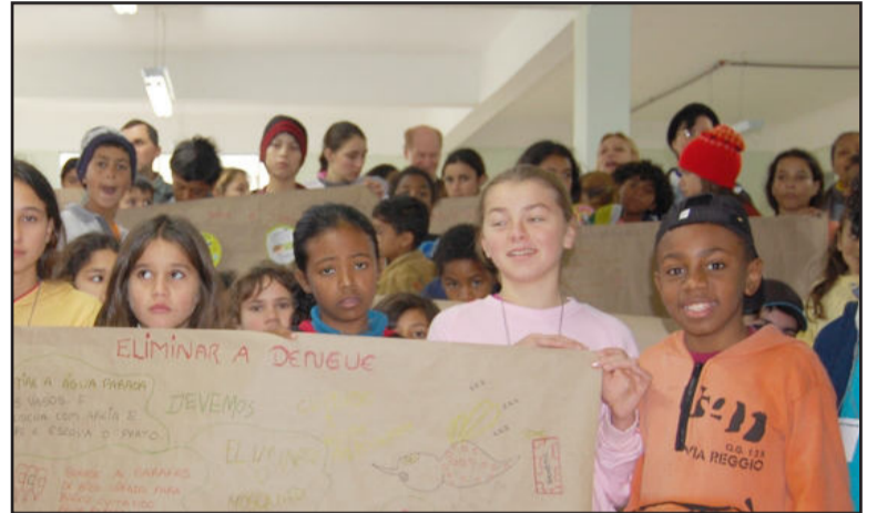
Prevenção contra dengue foi tema da gincana de 2007

A enfermeira justifica que neste bairro a equipe do posto atende uma população de elevado risco social que vive em precária situação de saneamento e junto a resíduos que ocasionam doenças. "Por isso, através dos agentes comunitários e da equipe do posto, os profissionais em saúde já vem se empenhando no estímulo à prevenção e entendemos que a divulgação em massa destes cuidados tornará mais efetivo o resultado", ressalta. Segundo ela, crianças e adolescentes têm maior poder de assimilação e posterior divulgação em suas residências. "Já percebemos isso pela mudança de atitude na população do bairro desde as duas primeiras edições da gincana realizadas nos anos anteriores, sendo que desta vez ela também contará com pais das crianças e adolescentes convidados, tendo as equipes já sido inscritas nas escolas e residências pe-