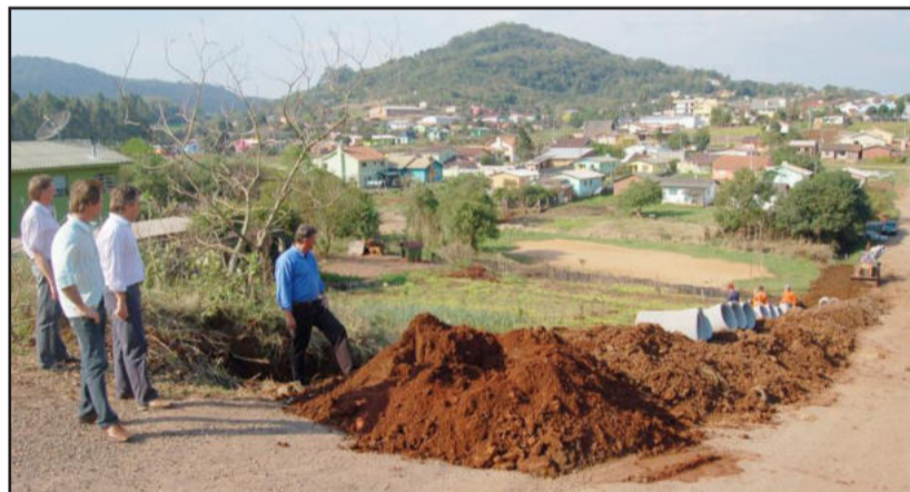
Administração vistoriou início das obras de microdrenagem