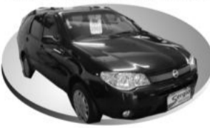
Prata COMPLETA R$ 30.800,