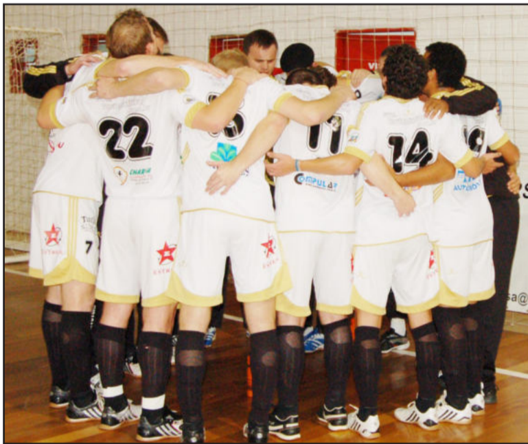
ASTF demonstra união para jogo decisivo em Porto Alegre

Apesar dos esforços da diretoria da Associação Teutoniense de Futsal (ASTF) há vários dias, a Federação Gaúcha de Futsal e a diretoria do Porto Alegre FC não se sensibilizaram com a dificuldade da ASTF em jogar domingo à noite. Sem o comum acordo da equipe de Teutônia (conforme rege o regulamento), a Federação impôs, no fim da tarde desta quarta-feira, a realização da partida entre Porto Alegre FC e ASTF para este domingo, dia 20 de setembro, às 19h30min, no ginásio Tesourinha, na capital.