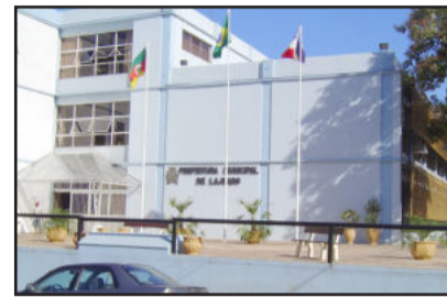
Prédio da Prefeitura de Lajeado

A prefeita de Lajeado Carmem Regina Pereira Cardoso descartou a possibilidade do Legislativo se instalar no mesmo prédio do Executivo. Alguns edis teriam sugerido a construção de mais pavimentos no prédio do Centro Administrativo que abriga a Prefeitura de Lajeado para, ali, instalar a sede do Poder Legislativo. Segundo Carmem, embora o atual prédio da Prefeitura tenha estrutura para construção de mais seis pavimentos, existe um impeditivo legal. Trata-se de restrições construtivas impostas pela Secretaria da Cultura do governo do Estado. As restrições limitam a altura das construções em parte das quadras que circundam a Casa de Cultura, tombada pelo Instituto de Patrimônio Histórico e Artístico do Estado (IPHAE). A norma diz que não poderão ser construídos prédios com mais de dois pavimentos nas proximidades da Casa de Cultura.