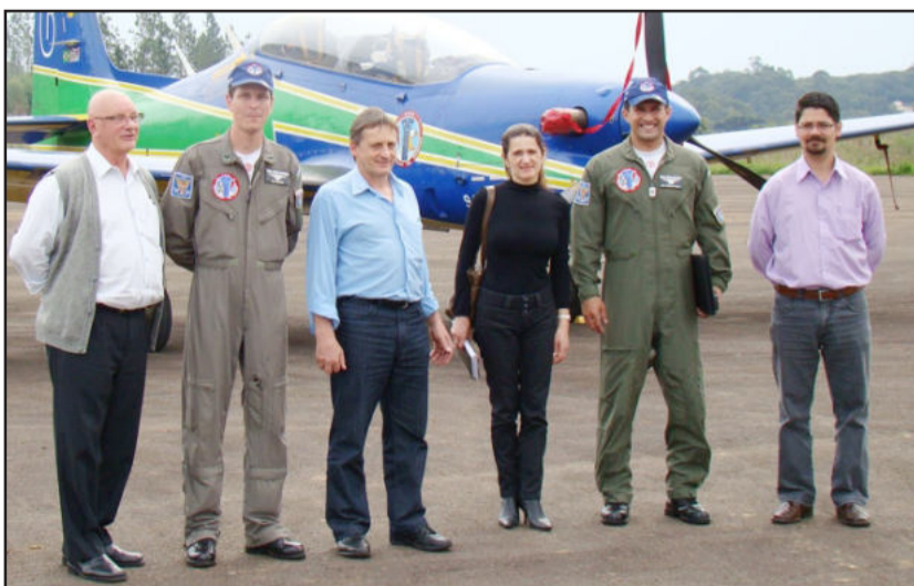
Capitães vieram nesta quarta

“Os fumaceiros”, como são conhecidos, reservam uma apresentação remodelada, com novas manobras que foram proibidas de serem exibidas nos Estados Unidos, quando das apresentações da esquadrilha naquele País.