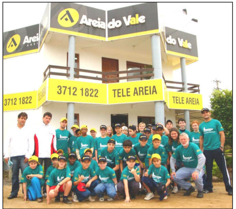
Crianças participantes do Projeto Navegar com a camiseta doada pela empresa