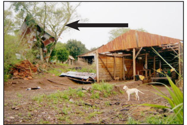
Telhado do galpão parou numa árvore

Outras propriedades próximas também foram atingidas. Árvores foram arrancadas, postes e telhados de casas e galpões ficaram danificados. Um morador de mais idade informou, inclusive, de que esta não foi a primeira vez que fatos desta natureza são observados no local. “Há algumas décadas passou por aqui um ciclone que fez muitos estragos. Chegou a arrancar totalmente um galpão, também conhecido como paiol. Aqui, tradicionalmente, venta muito. Hoje, causou estrago pois não era normal. Para mim, isso aqui era um redemoinho”, comentou o idoso, referindo-se a um possível tornado.