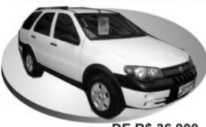
Prata COMPLETO, Air Bag DE R$ 36.900, POR R$ 35.800