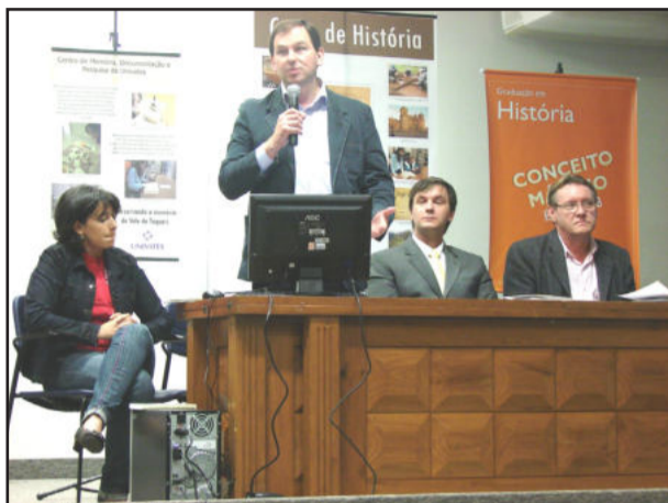
Prefeito Gilberto Keller (de pé) esteve presente no evento

No início de 2008, foi firmado convênio entre a Prefeitura Municipal de Colinas e o Centro de Memória, Documentação e Pesquisa da Univates para o desenvolvimento da