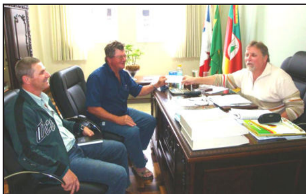
Ato de entrega do cheque de R$ 5 mil

Os recursos serão utilizados na aquisição de materiais a serem utilizados na construção do ginásio esportivo da Ambi.