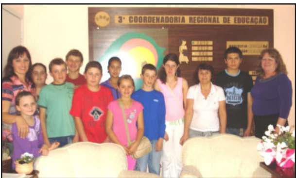
Alunos conhecendo 3ª CRE em Estrela