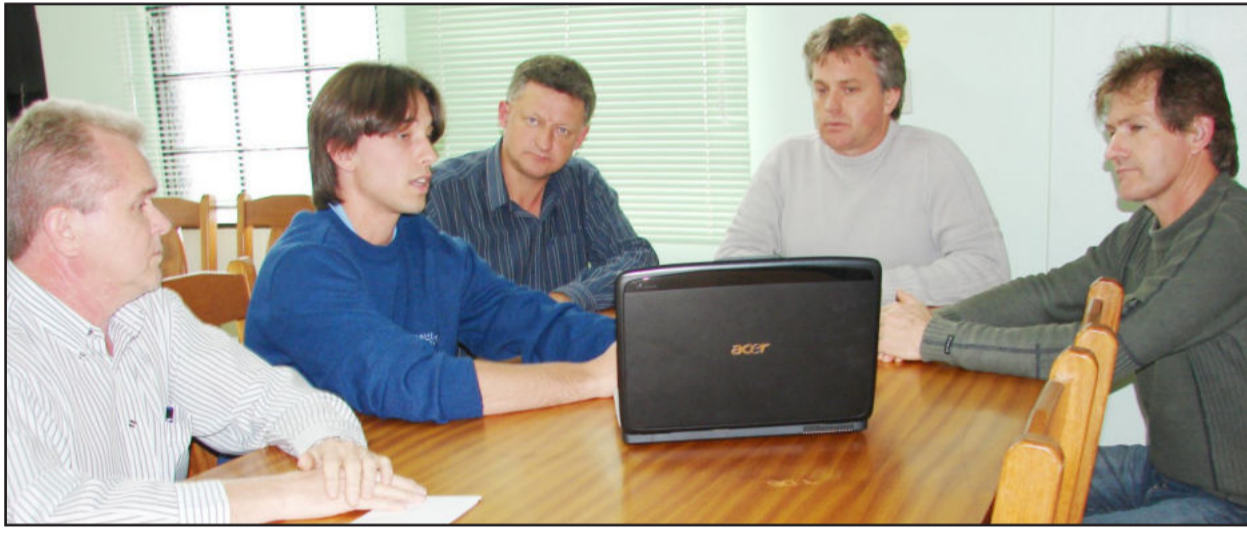
Wessel apresenta site na internet

A tradicional empresa de material escolar, escritório, livros, papelaria, brinquedos, informática, presentes e muito mais é de propriedade da família Wessel e tem sede em Teutônia. Depois de anos atuando no mercado, Lojas Wessel inovou ao implantar o novo sistema de comércio eletrônico dos produtos em seu site da internet, o www.lojaswessel.com.br . A nova ferramenta permite que uma pequena empresa de Teutônia ofereça seus produtos não somente no mercado regional, mas sim para todo o Brasil.