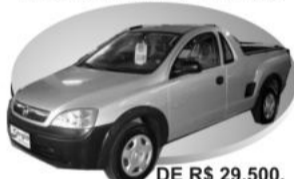
Cinza AR, DH DE R$ 29.500, POR R$ 28.900