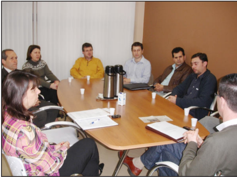
Reunião entre a administração e a Apeme

Outra sugestão é de que a adminis-tração municipal possa adquirir uma área dentro do Distrito Industrial,