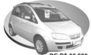
Prata COMPLETO DE R$ 36.900, POR R$ 35.900