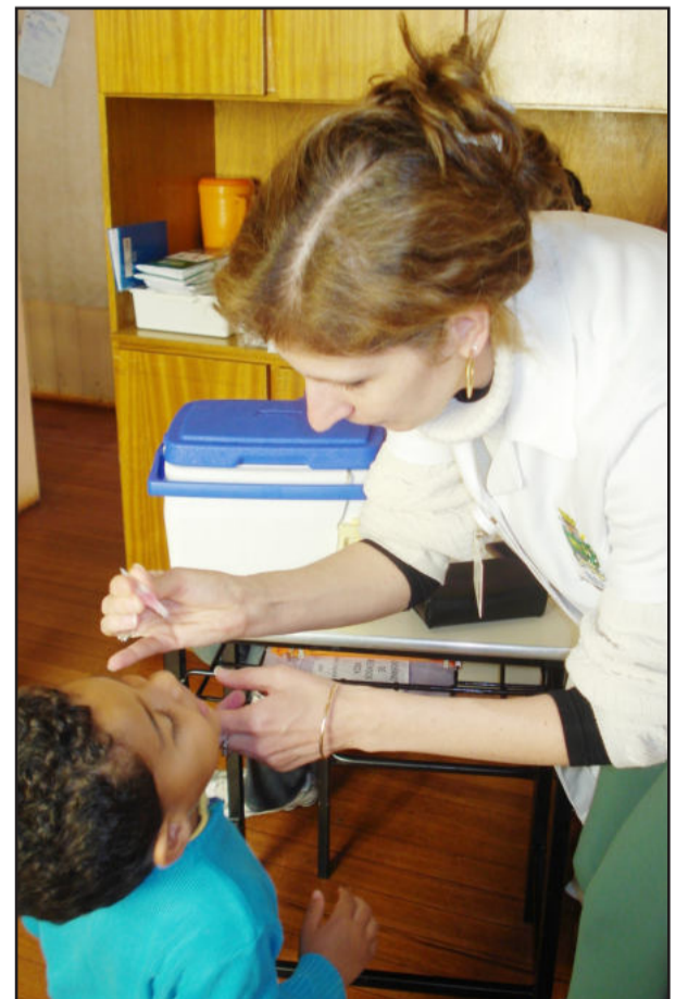
Vacinação nas creches começou segunda