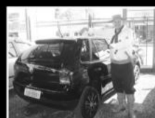
gol 1.6 4portas, 2009, GIV, completo, R$ 31.000,