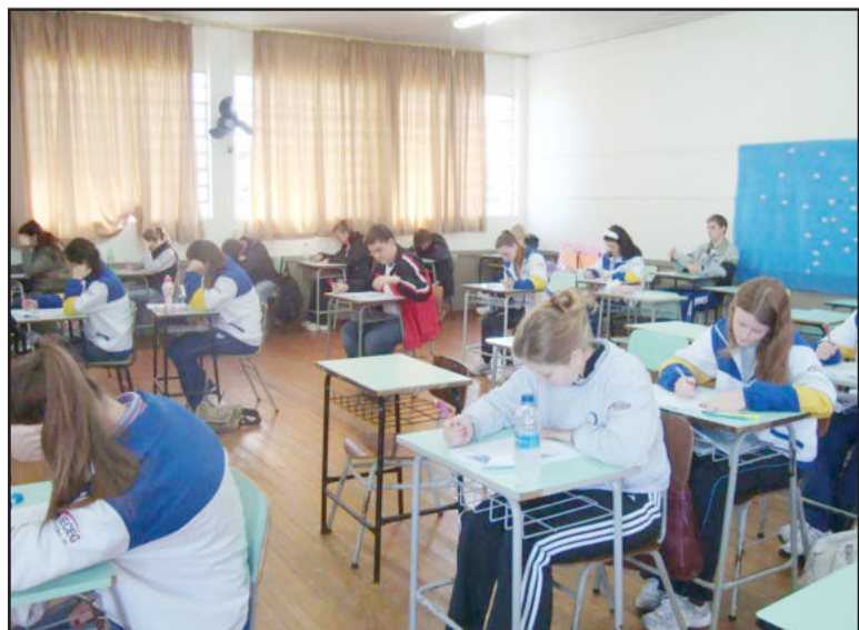
Provas preparatórias ao Enem são aplicadas

O Instituto de Educação Cenequista General Canabarro (Iceceg), sempre preocupado com o aprendizado de seus alunos, propiciou aos estudantes do terceiro ano do Ensino Médio, nesta terça-feira, dia 15, uma prova preparatória para o Enem 2009. Essa atividade vem ao encontro da proposta do Instituto de desenvolver a construção do conhecimento e preparar os alunos para os desafios, dentre eles, o Enem do próximo dia 3 de outubro.