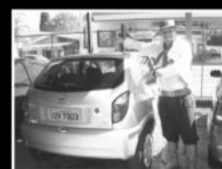
celta 2009, ar e direção, R$ 28.500,