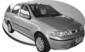
Prata COMPLETA R$ 24.500,