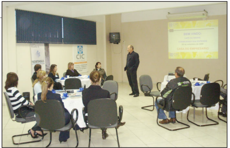
Evento ocorre trimestralmente