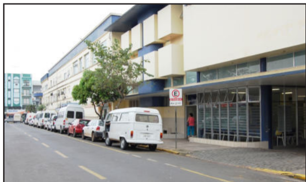
Ambulâncias com máximo de uma hora para estacionar na Rua Carlos von Koseritz