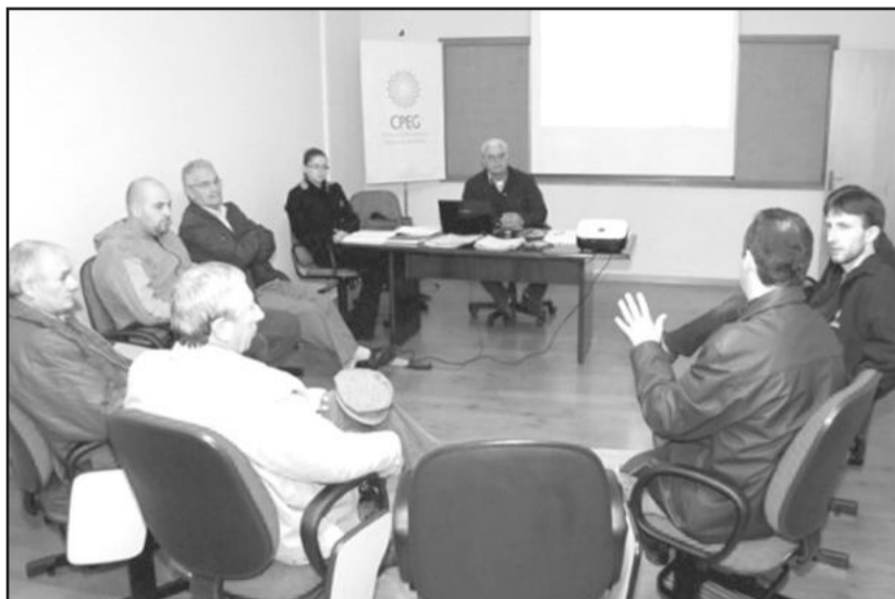
Encontro definiu as auditorias

termina que um espumante elaborado pelo método tradicional (champanoise) deverá ter um ciclo mínimo de doze meses, prazo idêntico ao exigido nas regiões de Champagne na França e Cava na Espanha.