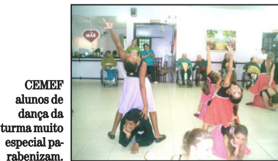
CEMEF alunos de dança da turma muito especial parabenizam.