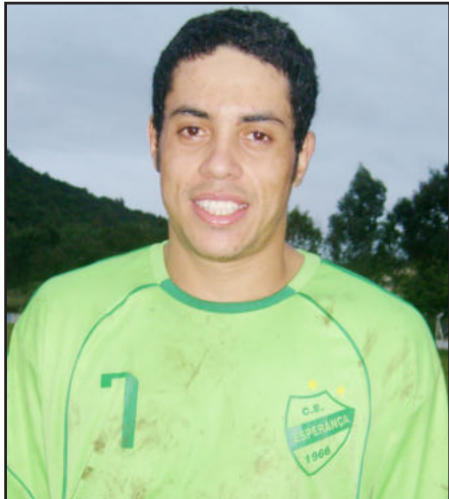
Pico fez o gol do Esperança de Berlim Fundos, finalista no Força Livre