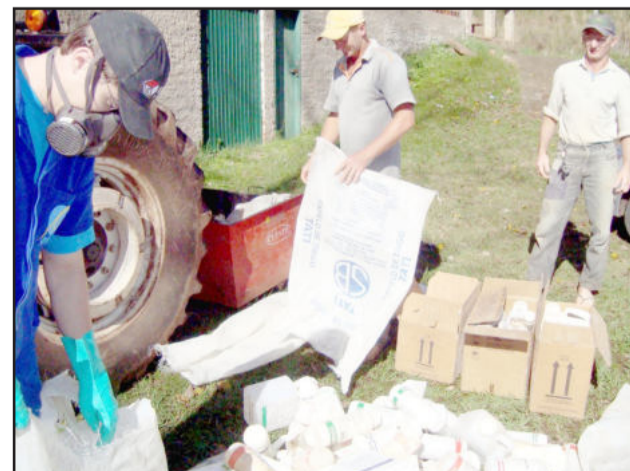
Coleta sendo realizada em Imigrante

melhorar, mas aos poucos a população está se conscientizando da necessidade de dar atenção à reciclagem”.