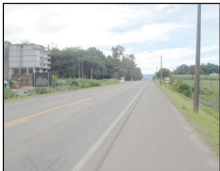
Viaduto será construído na RS-130, proximidades do Posto do Arco