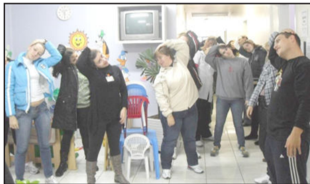
Atividade física no posto de saúde