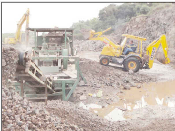
Britador produz material britado de excelente qualidade para as estradas