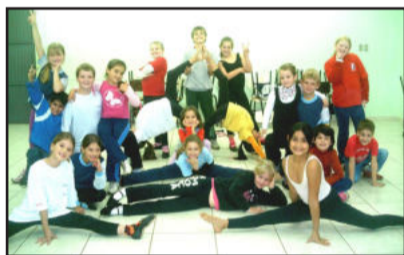
CEMEF alunos de dança, turno tarde, parabenizam: “Paz e amor”.

“Teutônia, Cidade que Canta, DANÇA e Encanta”