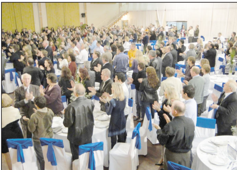
Grande coral cantou o Parabéns à Você