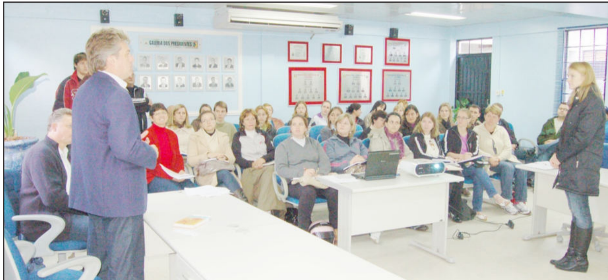
Reunião com direções de mantenedoras das creches

A administração municipal de Teutônia reuniu os dirigentes das entidades mantenedoras das escolas de Educação Infantil na quarta-feira, dia 26 de maio, para explicar a nova sistemática de repasse das subvenções, recentemente aprovadas pela Câmara de Vereadores.