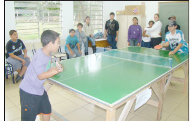
Torneio de ping-pong

A criançada se divertiu com os brinquedos infláveis e com as atrações oferecidas na segunda edição do Comunidade Alerta 2010. O evento foi realizado sábado, dia 29, nas dependências da Escola Municipal de Ensino Fundamental de Turno Integral José Victor Mairesse, na localidade de Matutu.