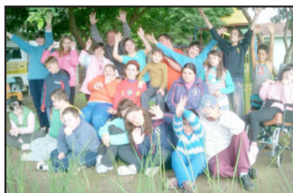
APAE alunos turno da tarde parabenizam com ALEGRIA.