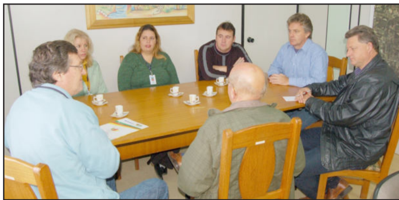
Emater apresentou relatório de atividades de 2009