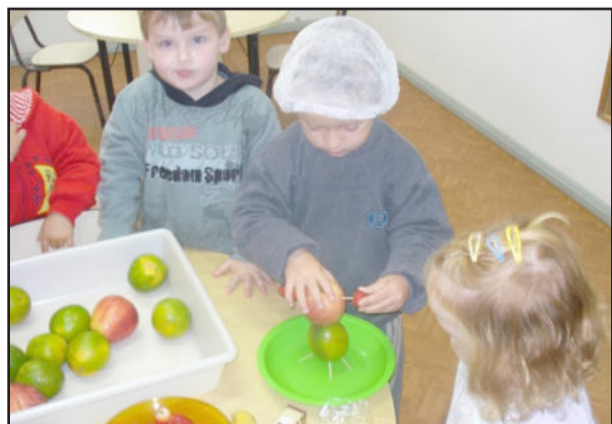
Crianças fazendo suco de frutas

Assim, pais e crianças estiveram em envolvimento durante toda a semana, sendo com a doação de frutas (carambola, nozes, maçã, laranja, bergamota, maçã, banana...) ou durante as refeições com a degustação de mais variedades durante a Hora da Fruta e sobremesa.