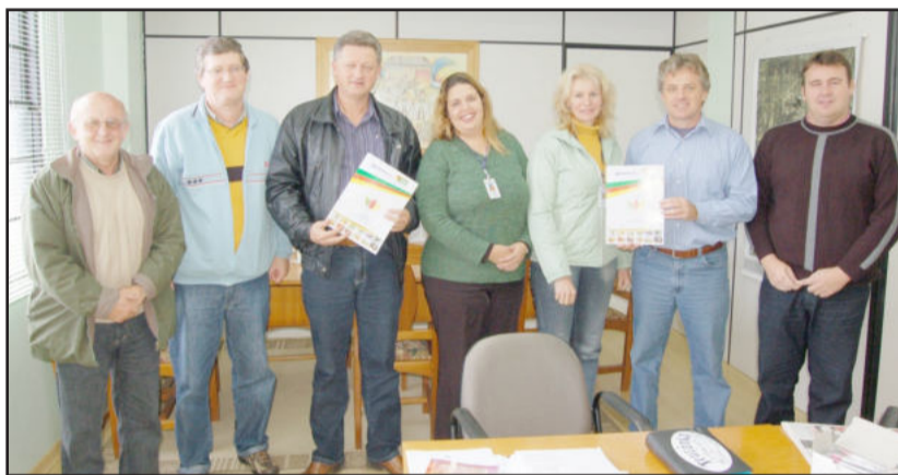
Emater e Prefeitura celebram parceria que beneficia produtor rural

nhecimento e apoio para projetos novos, como reflorestamento e calcário.