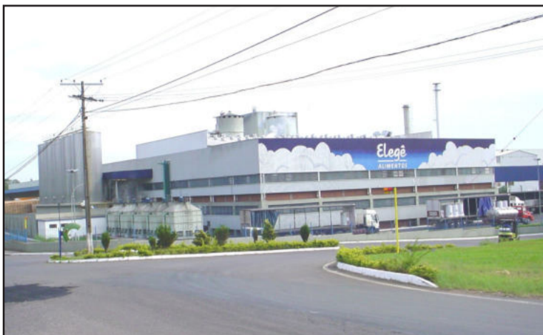
Indústria continua sendo a maior empresa de Teutônia

Em abril de 1996, o controle acionário da CCGL passou para o Grupo Avipal. Empresa nacional do ramo de alimentos (carnes e grãos). “Em 1999, o Grupo Avipal ampliou sua capacidade e mix de produtos, entre os quais, produção de