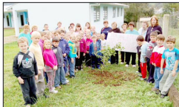
Árvore plantada na Escola Arco-Iris