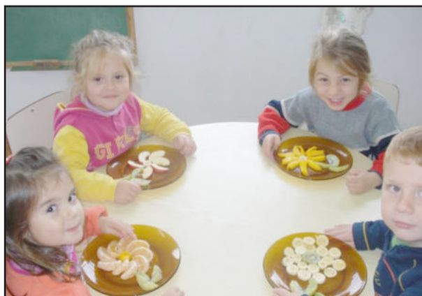
Comendo as frutas de forma divertida