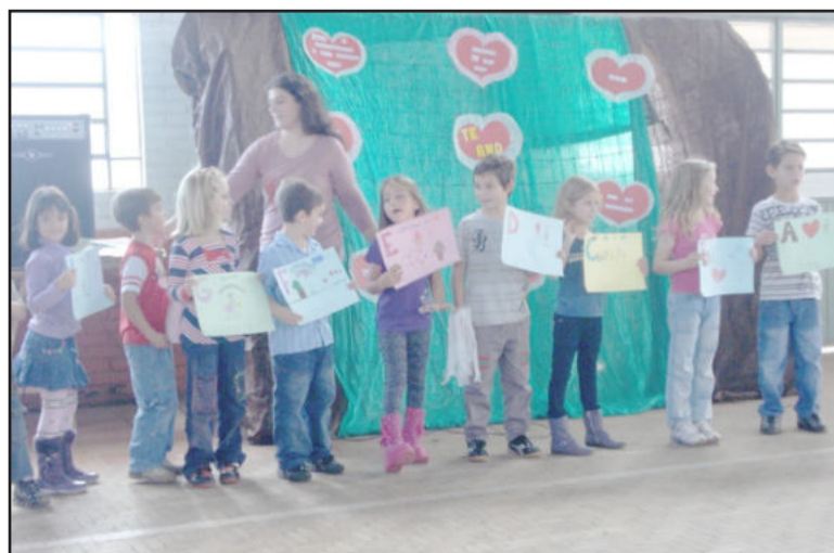
Homenagem dos alunos das escolas Santana e Rui Barbosa