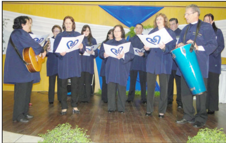
Grupo Vocal Vozes da Saúde recebeu os convidados