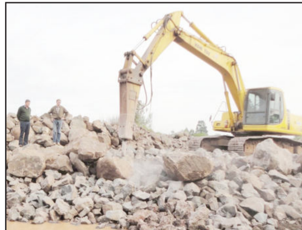
Equipamento quebra pedras e facilita uso no britador