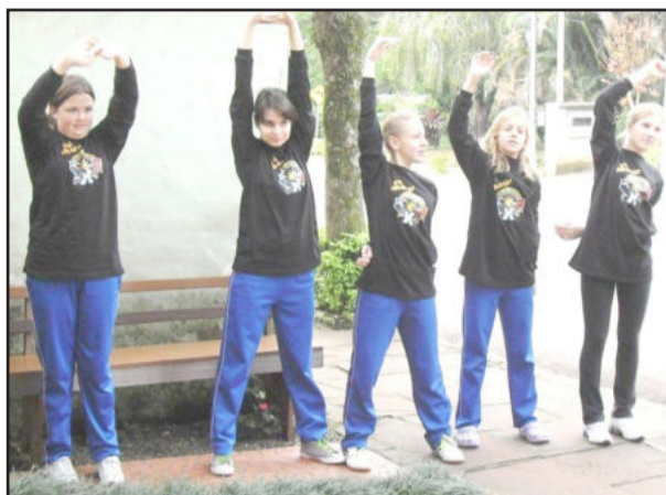
Estudantes em atividade de alongamento

Em 2010, o evento contou com o apoio das Prefeituras Municipais, da Assembleia Legislativa e do Governo do Estado.