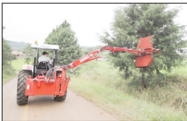
Roçadeira hidráulica adaptada ao trator permite limpeza completa das laterais

A Prefeitura adquiriu, mediante licitação - modalidade pregão presencial, todos equipamentos com recursos próprios. Foram R$ 72 mil para a compra do trator Agrale, mais R$ 37,5 mil para a roçadeira hidráulica da marca Lavrale. Ainda foram compradas 11 roçadeiras e 1 moto-poda da marca Stihl e um máquina de cortar grama da marca Trapp. No total, o investimento da Prefeitura chega a R$ 18.430,00 nestes equipamentos de pequeno porte, também com recursos próprios. São quase R$ 128 mil em equipamentos para beneficiar toda a comunidade, com o embelezamento das ruas e estradas.