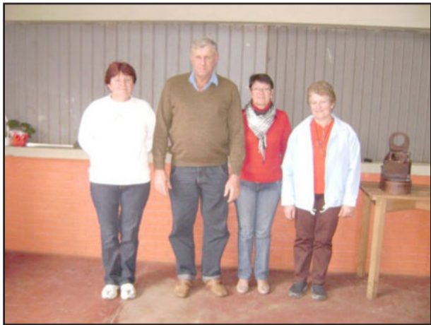
Diretoria da Terceira Idade de Santana