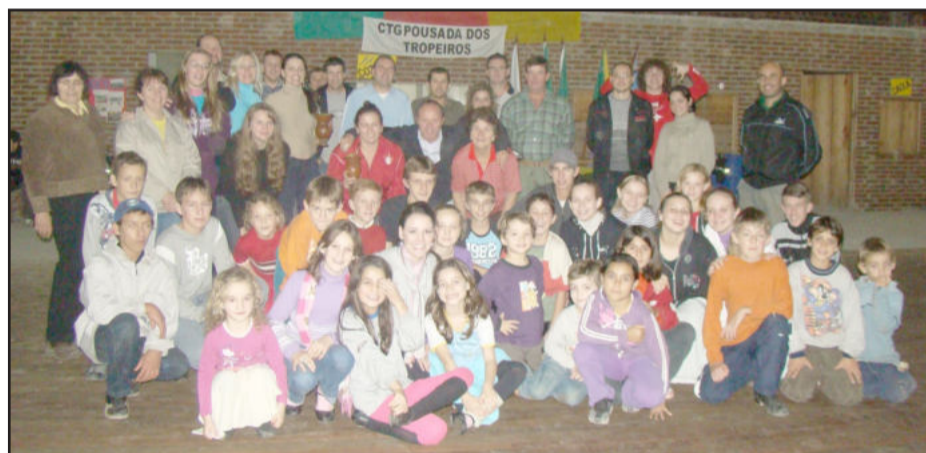
CTG Pousada dos Tropeiros realiza oficina gauchesca