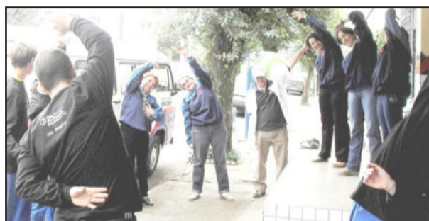
Atividade física nas empresas