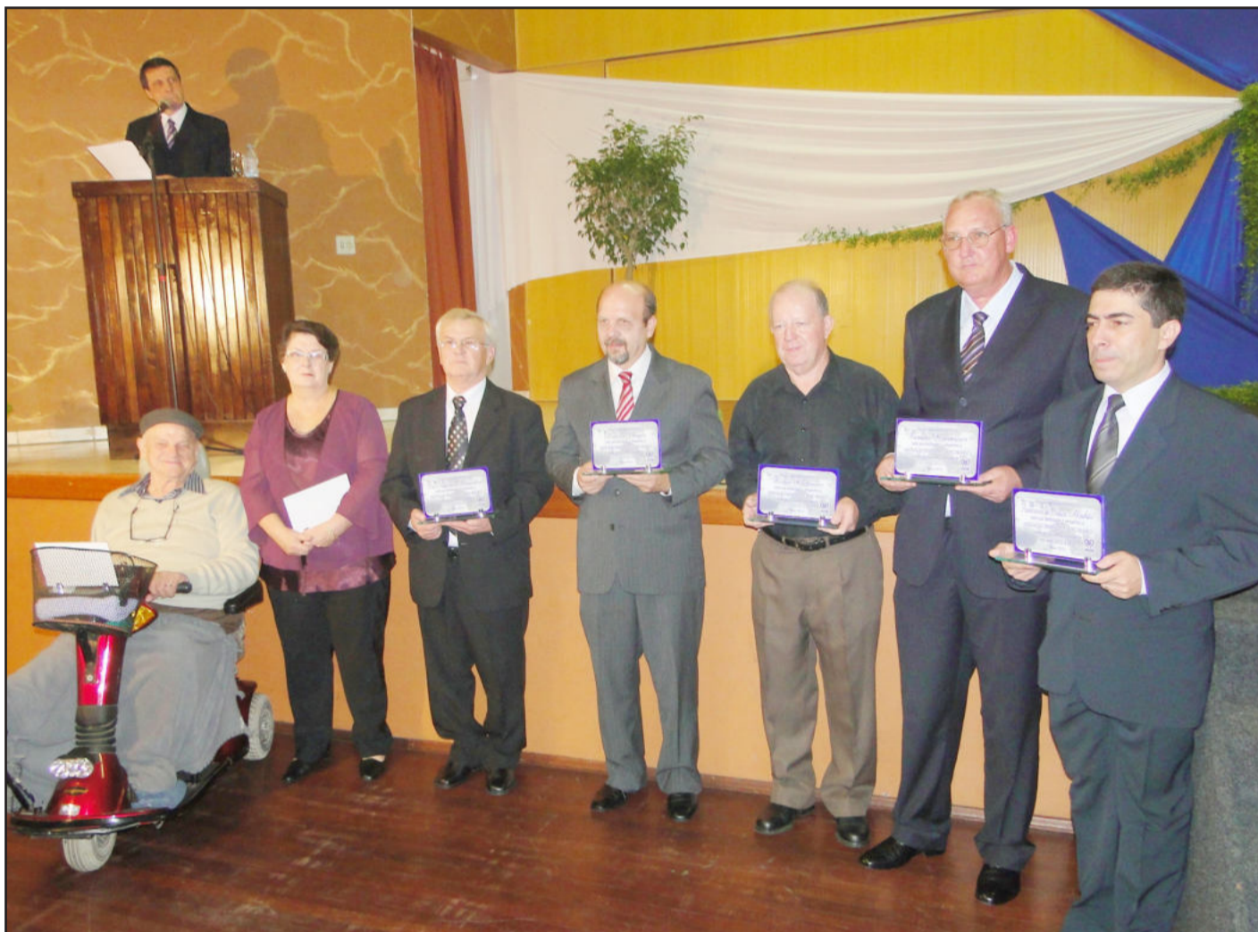
Reconhecimento aos ex-presidentes da entidade mantenedora do Hospital Ouro Branco de Teutônia. Página 3