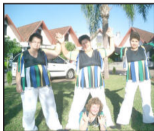
Melhor Idade - alunas parabenizam: “Somos a história da cultura de um povo, fortalecemos o presente e idealizamos o futuro cada vez melhor com muito ritmo e prosperidade.”