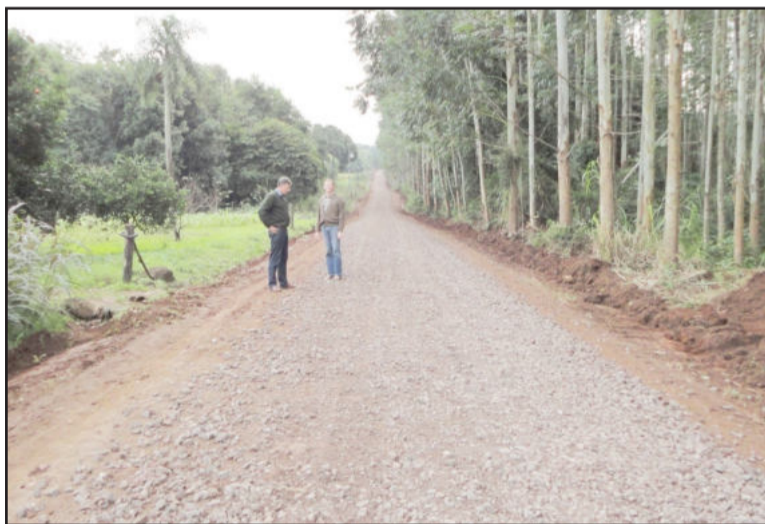
Britado colocado nas estradas do interior melhora a durabilidade

Já nas áreas não pavimentadas, a Secretaria de Obras conta com a atuação de uma máquina para quebrar pedras e um britador para produzir um britado de excelente qualidade para a recuperação das estradas. O material já está disponível para ser utilizado nas estradas principais do interior e também na zona urbana.