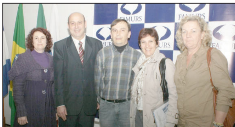
Teutonienses presentes no Seminário de Educação

Outro tema debatido foi a obrigação dos municípios em terem um plano de carreira para o magistério. A atual administração municipal de Teutônia implantou o plano de carreira para o magistério municipal durante o mês de fevereiro deste ano.