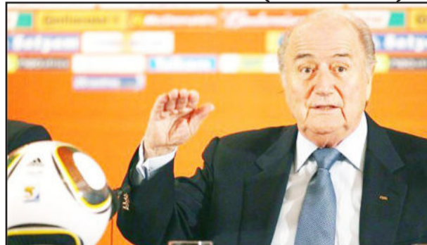
Joseph S. Blatter