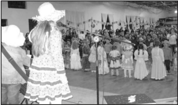
Alunos realizaram apresentação

No mês de junho são realizadas as tradicionais festas juninas, sempre com muita comida típica, dança de quadrilha, quermesses, casamento caipira, músicas típicas, balões. Também é tradicional as escolas promoverem suas festas para divertir pais e alunos. No sábado, dia 26, a Escola Municipal de Ensino Fundamental Duque de Caxias, de Boa Vista do Sul, realizou a sua festa no Salão São Francisco Xavier, no Centro da cidade.