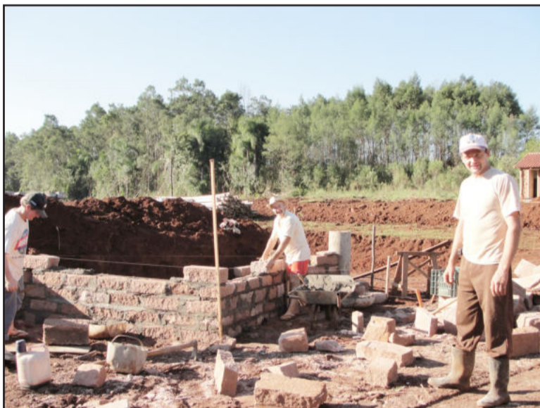
Celso: dois novos galpões para suínos