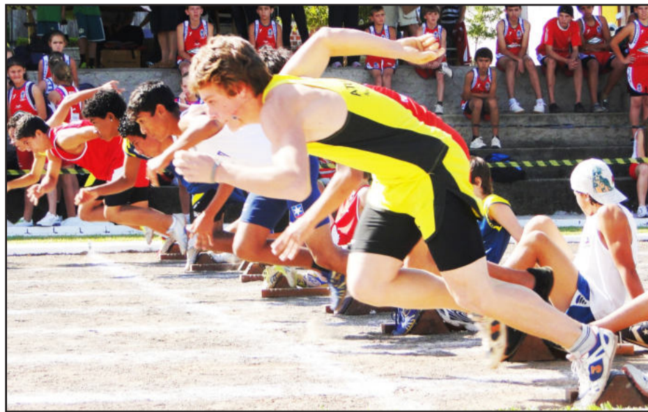
Ontem os alunos entraram na pista de atletismo

Já amanhã, sexta-feira, e no sábado, dias 2 e 3 de julho, o complexo esportivo do Colégio Teutônia recebe professores e funcionários da Rede Sinodal de Educação para a Olimpíada Nacional. Mais de 250 atletas