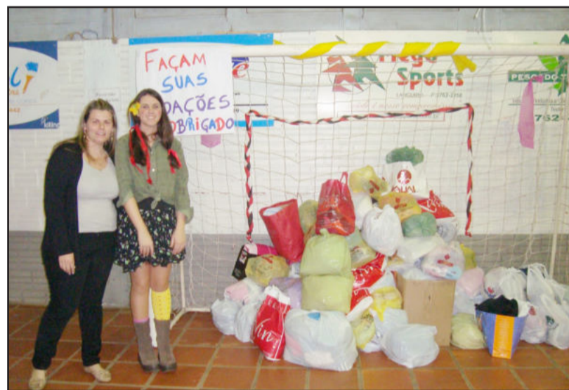
Entrega dos agasalhos arrecadados