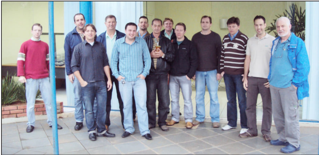
Equipe da Milkparts faz curso prático de manejo

Nos dias de hoje, a tecnologia na produção de leite é essencial para o desenvolvimento das propriedades. Com essa missão, a empresa teutoniense Milkparts está firmando uma parceria com a SCR, de Israel, que é referência mundial em tecnologia de produção leiteira. Nessa semana os israelenses estão ensinando, na prática, o manejo e operação dos recursos disponíveis para aumento da qualidade e produtividade através das ordenhadeiras Milkparts.