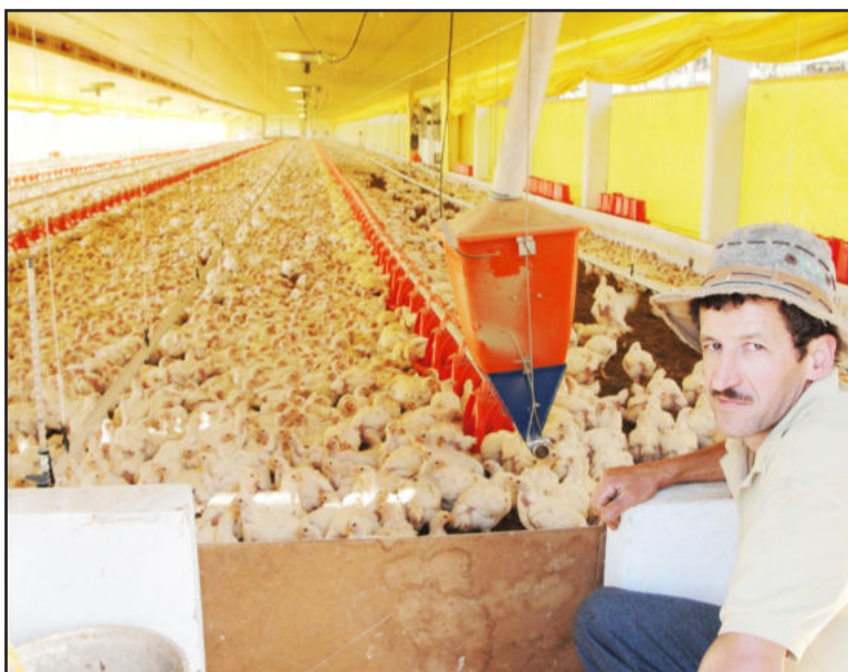
Mota: 28 mil frangos no novo galpão

Os seis empreendimentos em fase de implantação vão gerar mais de R$ 2,6 milhões de valor adicionado de ICMS ao ano para o Município. Todos contam com terraplenagem, abertura de acesso, manobrador, transporte de material e apoio na elaboração dos projetos e licenciamentos, concedidos pela municipalidade através do Programa de Incentivos.