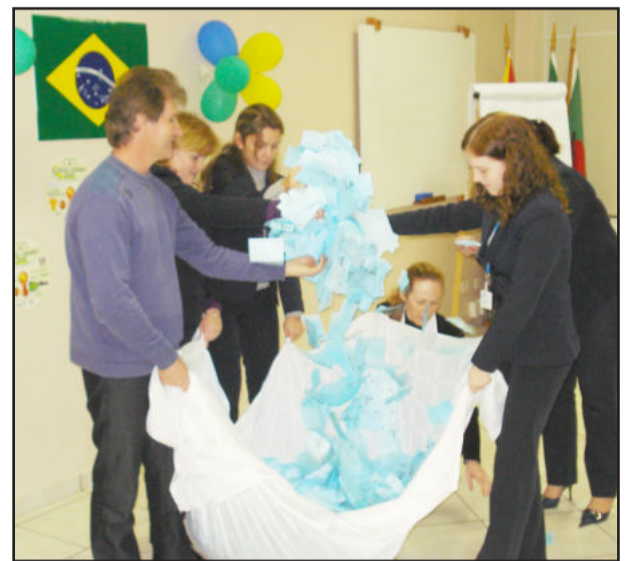
Sorteio foi nesta terça-feira