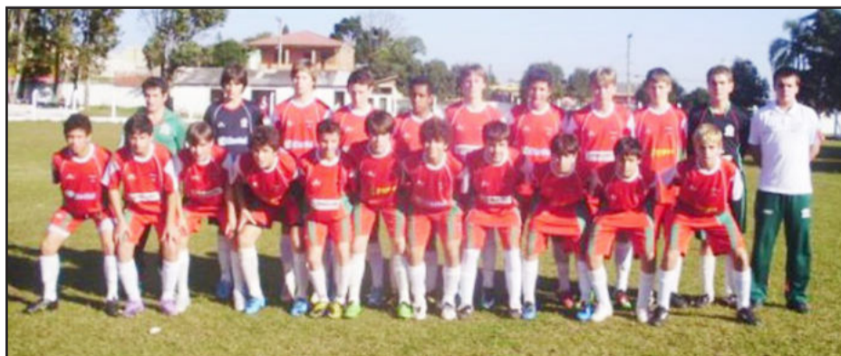
Categoria 98 da Juventus venceu por 2 a 0 em Soledade

No próximo domingo, dia 4 de julho, a Juventus recebe em Teutônia o Anchieta de Porto Alegre, indo em busca de mais um resultado positivo no certame estadual.