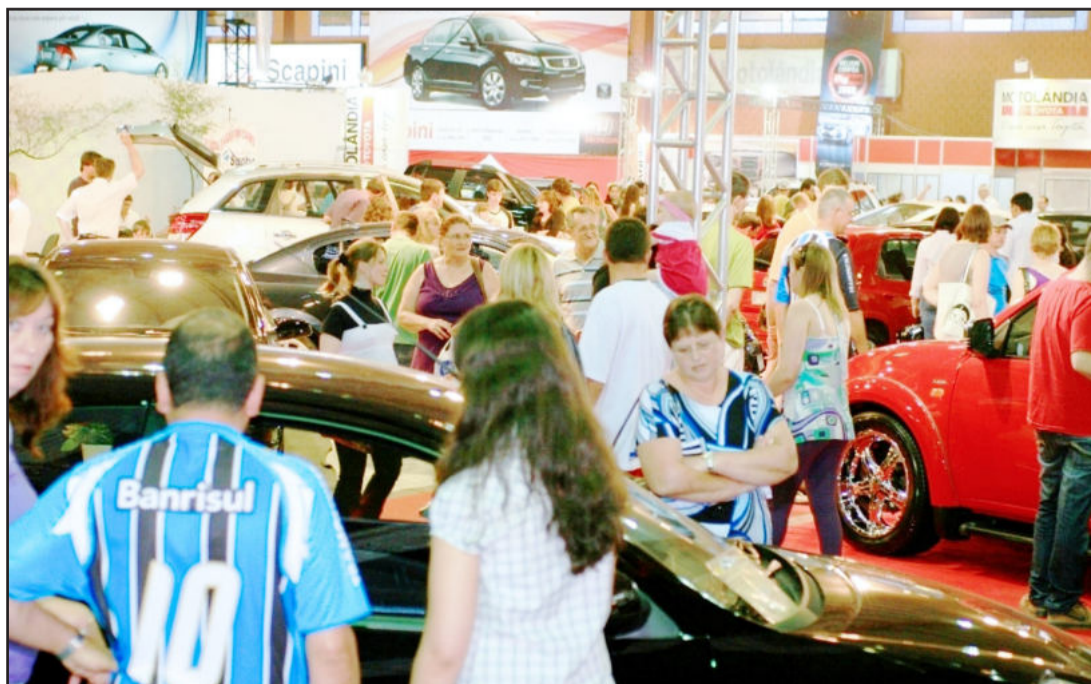
O Salão do Automóvel da Expovale 2010 terá dez concessionárias. Página 6