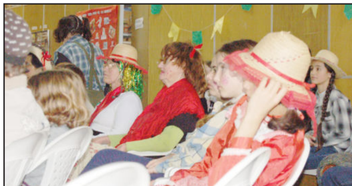
Clima de São João tomou conta do CRAS