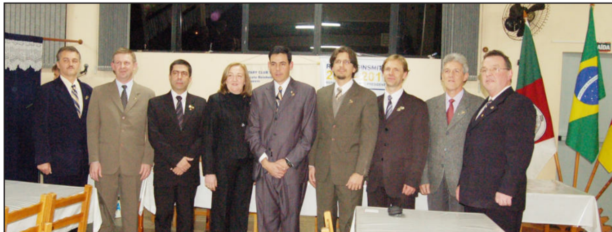
Representantes do Rotary Club Teutônia empossados