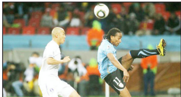
Uruguai usará força e mística da alma azul celeste

Como únicos representantes da África nesta fase da Copa do Mundo, Gana ganha o apoio e a simpatia de outras nações. E justamente neste clima de “sangue doce” ou “franco atirador” é que Gana se sente livre, leve e solta para encarar o Uruguai. Nada de tensão ou pressão, só se for para cima dos adversários dentro de campo.