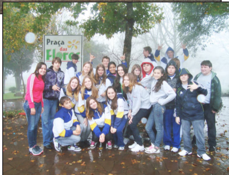
Grupo visitou locais turísticos da Serra

ografia, pontos turísticos e a sociedade alemã, o que cria uma proximidade maior dos alunos com seus antepassados. Além dos conteúdos programados em aula, a professora, que passou três meses na Alemanha, traz sua experiência vivida na Europa para a turma.