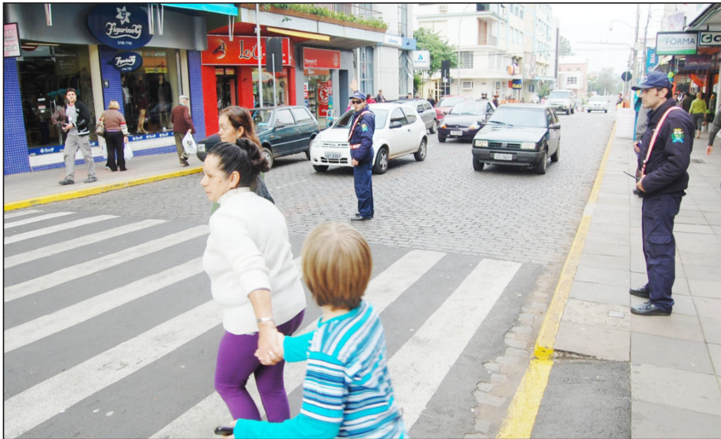
Fiscal de trânsito orienta motoristas e pedestres no Centro da cidade. Página 7