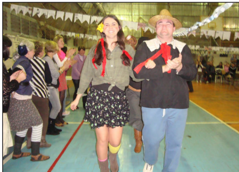
Espírito caipira presente na festa