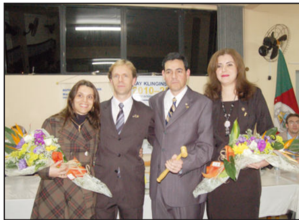
Os casais presidentes na transmissão do cargo