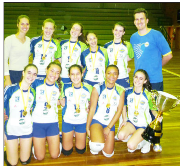
Equipe Infantil levou o título do Campeonato Aberto de Voleibol