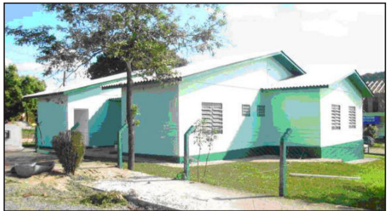
Casa da Criança tem Círculo de Pais e Mestres

A diretoria terá mandato de dois anos e ficou com a seguinte