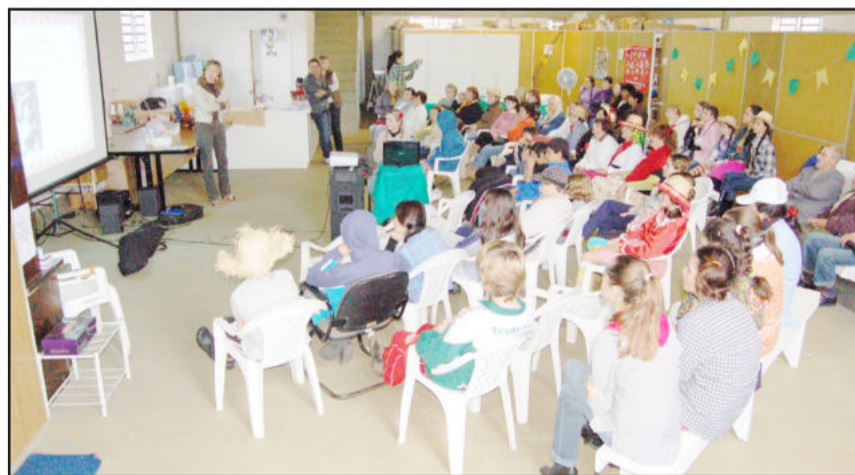
Além da confraternização, grupo se reuniu para assistir Brasil e Chile

Como acontece todos os meses, este momento é tratado de forma toda especial, pois reúne as famílias em vulnerabilidade social para confraternizar. Após a mensagem inicial, houve o sorteio de prêmios, entrega de presentes para os aniversariantes do mês e apresentações. E os comes e bebes foram o acompanhamento perfeito para a vitória do Brasil sobre o Chile por 3 a 0, em jogo exibido em telão nas dependências do CRAS.