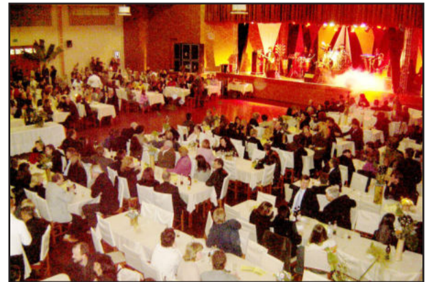
Evento será no dia 17 de julho

No dia 17 de julho o Colégio Teutônia e a Associação dos Professores e Funcionários do Colégio Teutônia (Aprocote) promovem o 9º Jantar-Baile da Fundação Agrícola Teutônia (FAT). O evento comemora os 58 anos da Fundação, mantenedora do Colégio Teutônia. Tendo por local a Associação Pró-Desenvolvimento de Languiru, a programação inicia às 20h e terá na animação a Banda Voga, de Santa Cruz do Sul.