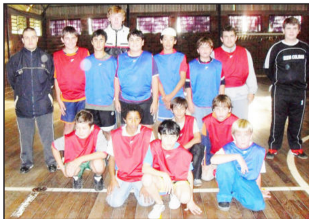
Escolinha de Futsal em Colinas já conta com 20 alunos