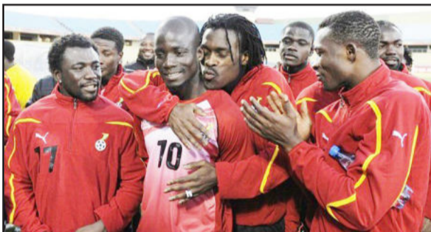
Gana acredita ter forças para chegar à semifinal