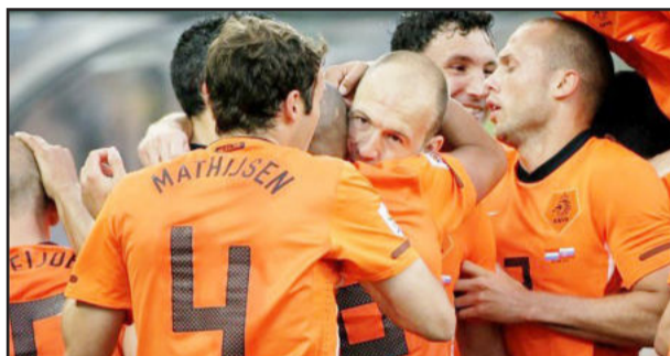
Holanda busca a memória de 1974 e quer esquecer 1994 e 1998