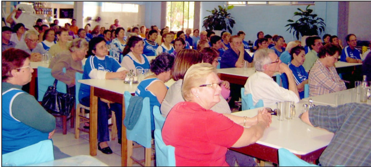
Encontro foi realizado nesta quarta-feira