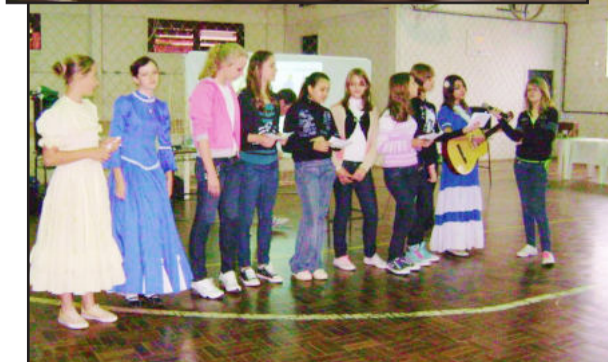
Atividades envolveram os alunos