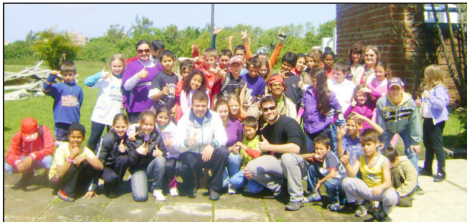
Turma do Cemef durante a viagem de estudos