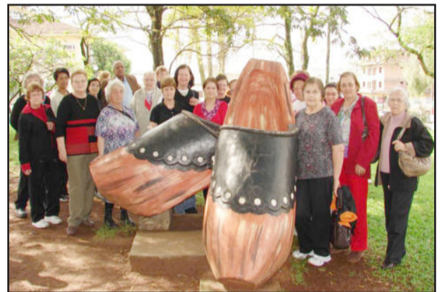
Visitantes tiraram muitas fotos diante do Sapato de Pau que é um dos símbolos do Município