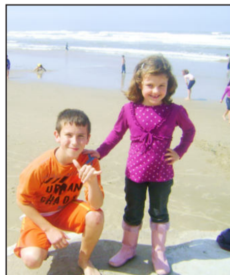
A emoção de ver o mar pela primeira vez