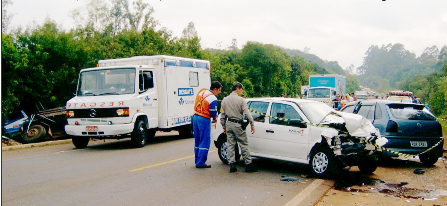
Trânsito ficou interrompido por cerca de três horas

Acidente, ontem de manhã, envolveu três automóveis e dois caminhões. Página 11