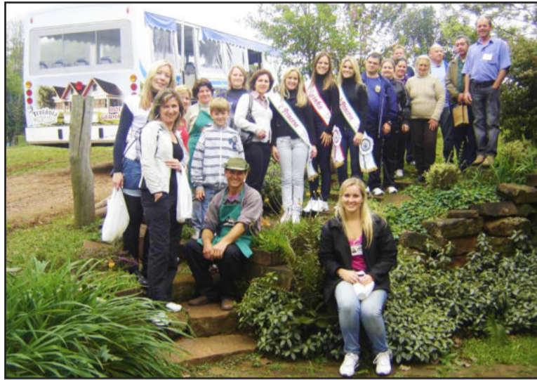
Grupo também visitou o Engenho Quatro Ventos, na Linha São Jacó

O Pacote 1 da Temporada de Turismo - que contempla o Centro Administrativo, Bella Luna Aromas, Harmonia das Rosas, Lagoa da Harmonia, Artesanato Sapato-de-Pau e Soll Cogumello - será realizado no dia 10 de outubro, segundo domingo do mês, também com