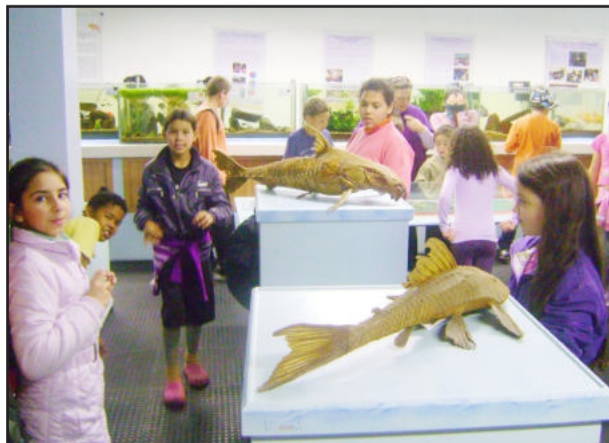
Estudantes visitando o museu