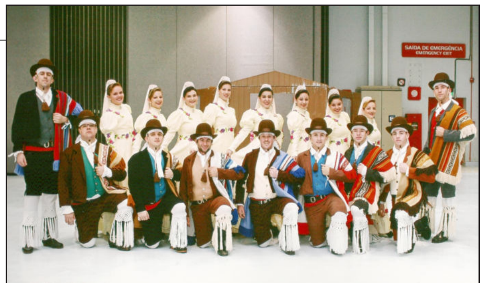
Grupo adulto do CTG Porteira dos Pampas

“Sucesso de organização e na participação deste evento. O grupo adulto está de parabéns pela grande e animada apresentação, deixando de boca aberta os 400 seminaristas que estavam presentes no Centro de Eventos da PUC. E para o CTG, é um grande passo rumo ao crescimento de nossa marca,