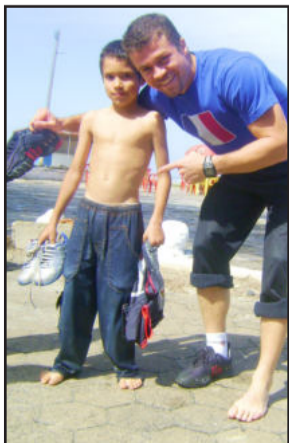
Cadê o outro tênis?