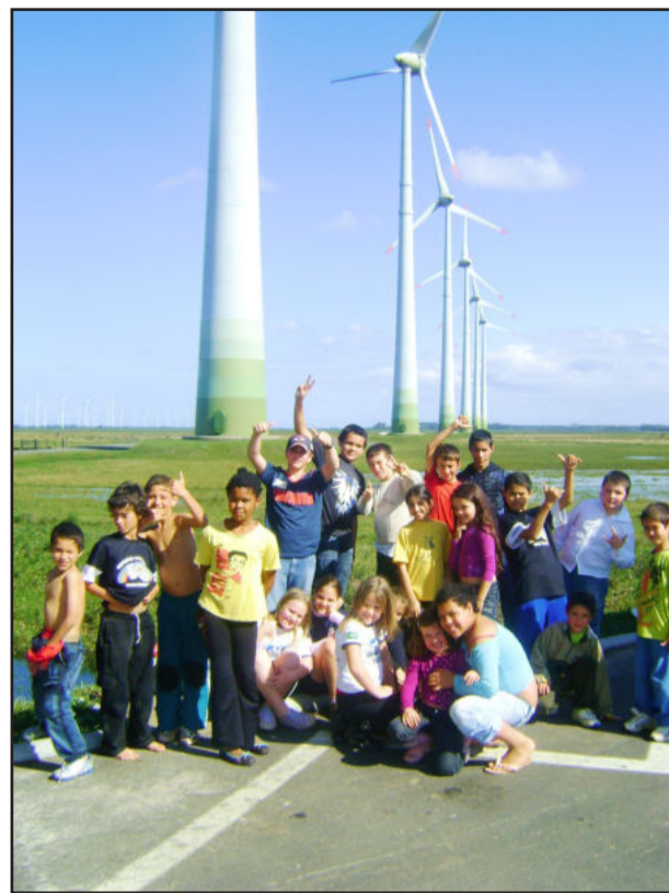
Estudantes no Parque Eólico em Osório