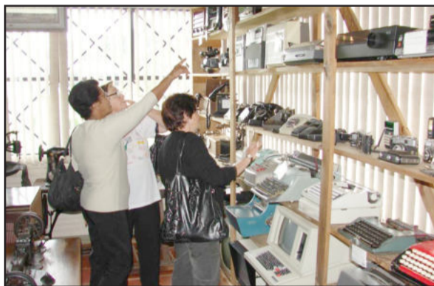
Atrativos do Centro Administrativo e Museu encantaram santacruzenses