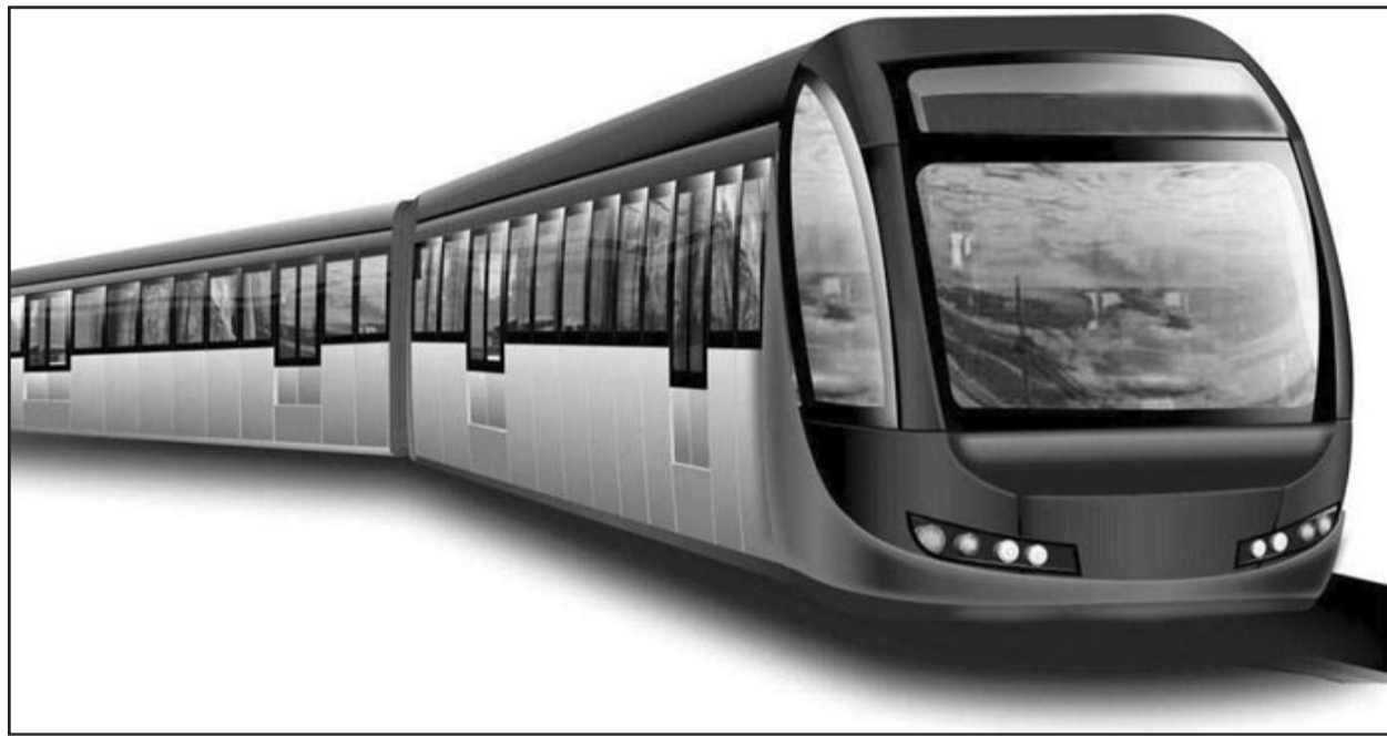
Modelo do trem a ser utilizado na linha entre Caxias do Sul e Bento Gonçalves

A ligação ferroviária de 63 quilômetros entre Bento Gonçalves e Caxias do Sul, passando por Carlos Barbosa e Garibaldi, foi um dos 14 projetos selecionados pelo Programa de Resgate do Transporte Ferroviário de Passageiros, do Ministério dos Transportes. A rota foi escolhida por ser um trecho curto e abranger região com grande densidade populacional, além ser um destino turístico importante.