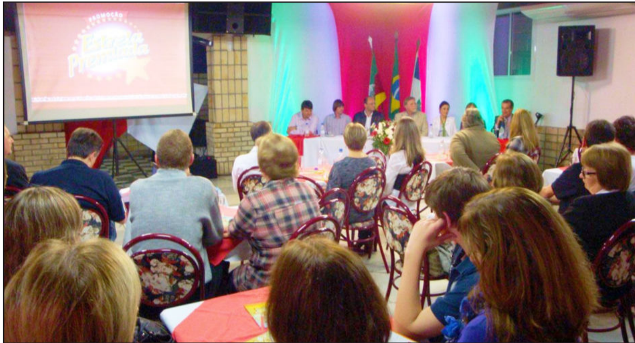
Lançamento da Campanha Estrela Premiada ocorreu nesta quinta-feira

Com a presença de autoridades e representantes da indústria e do comércio de Estrela, ocorreu na noite desta quinta-feira, dia 30 de setembro, o lançamento da Promoção Estrela Premiada, realizada pela Prefeitura, Câmara de Dirigentes Lojistas (CDL) e Associação Comercial e Industrial de Estrela (Acie). Este ano a promoção sorteará um veículo Peugeot zero quilômetro, duas motos Honda CG 125 Fan e R$ 6 mil em vale-compras.