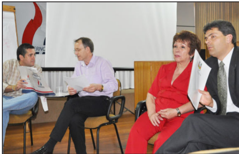
Mozart, Lânus, Carmen e Diefenbach na reunião detalhando medidas de garantias