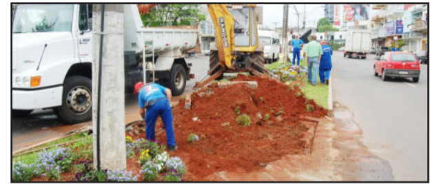
Canteiro central está sendo adequado para receber retorno e semáforo