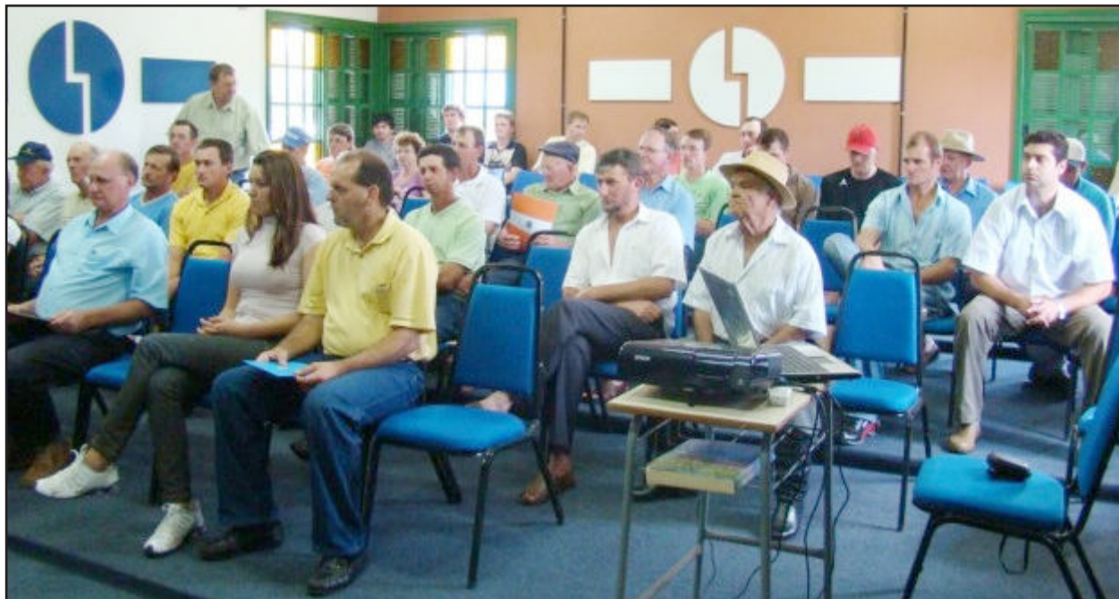
Diversos produtores participaram da última edição do Simpósio do Leite

A administração municipal está promovendo a quarta edição do Simpósio do Leite de Fazenda Vilanova. O evento acontece na próxima quinta-feira, dia 7, e é destinado a todos os produtores que estejam interessados em melhorar a administração e a qualidade de suas produções leiteiras.