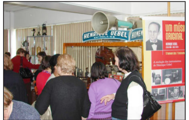
Peças do Museu Henrique Üebel chamaram a atenção dos visitantes