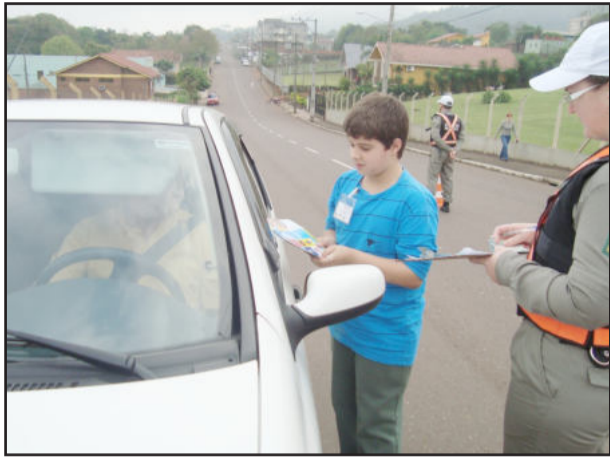
Alunos entregaram material de orientações aos motoristas

Conscientizar as crianças sobre os problemas do trânsito, afim de que elas possam levar o bom exemplo ao seu convívio familiar, é uma prática que tem dado muito certo no Instituto de Educação Cenequista General Canabarro (Icecg). Alunos e escola mostram sua preocupação diante de tantas mortes a cada final de semana no trânsito brasileiro.