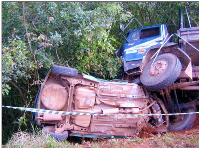
Corsa e caminhão desceram barranco