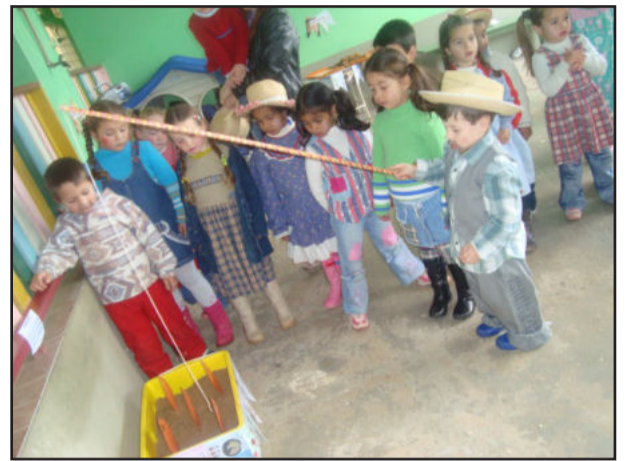
Pescaria fez a alegria das crianças

No "arraia" da Escola Municipal de Educação Infantil Fazendinha, a festa de São João foi muito animada. A comemoração das mais de 60 crianças que frequentam a escola foi realizada na quarta-feira, dia 24, com muita pipoca, batata doce, amendoim, rapaduras, pinhão e outras comidas típicas. Diversas brincadeiras e muita música caipira também fizeram parte da festança que contou a participação dos pais e familiares dos alunos.