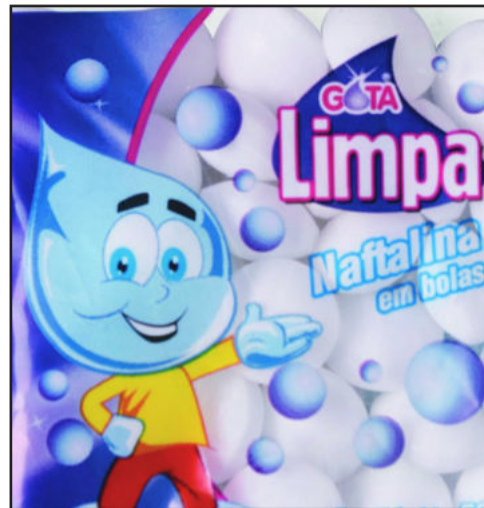
Novo Gota Limpa

Para não prejudicar a saúde da família, o ideal é arejar