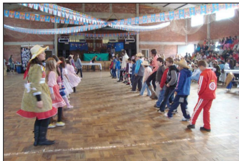
Alunos fizeram apresentação de danças