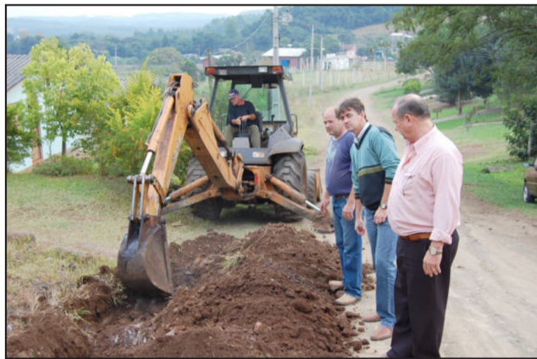
Investimentos em redes de água