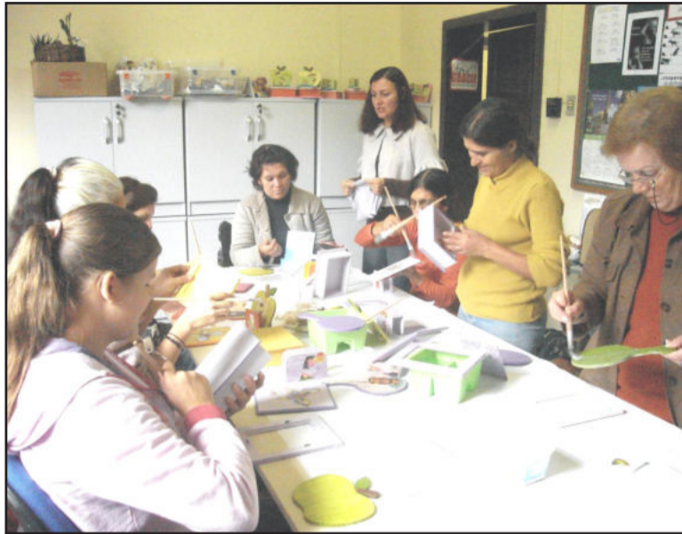
Oficinas geram conhecimento e renda

“Essa metodologia de oficinas de conhecimentos, para