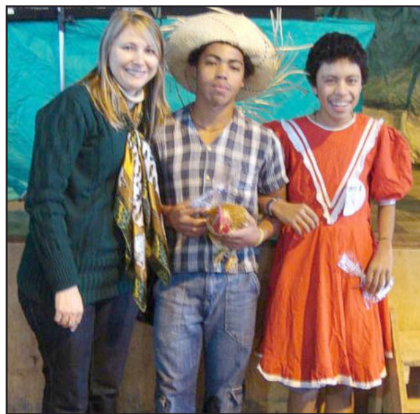
Casal caipira recebeu prêmio da primeira-dama