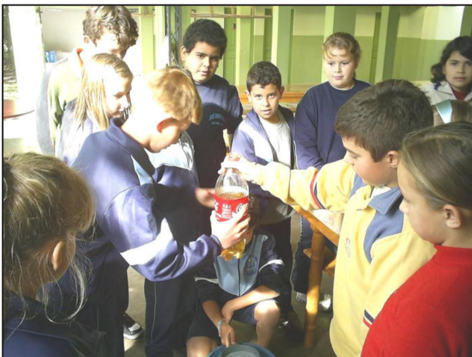
Alunos produzindo o sabão artesanalmente

Desde cedo devemos incentivar os estudantes a adquirir bons hábitos, principalmente quando se trata de contribuir para preservar o meio ambiente. Foi com esse intuito que os alunos da quarta série da Escola Municipal de Ensino Fundamental José Bonifácio produziram sabão com azeite usado. A produção ainda teve a confecção de rótulos na aula de informática, onde cada dupla criou uma marca para cada sabão. Durante esta semana os alunos se organizaram criando reportagem para divulgar o produto.