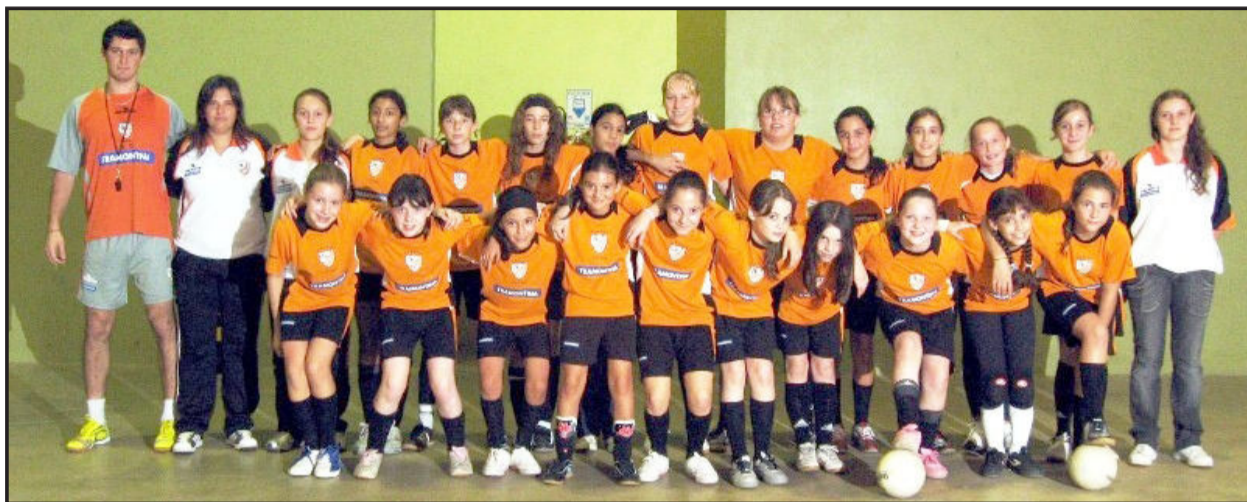
Escolinha feminina da ACBF realiza primeiros amistosos

A Equipe Juvenil (Sub-20) da ACBF venceu por WO, na última segunda-feira, dia 29, o Inter da Praça, de Guaíba,