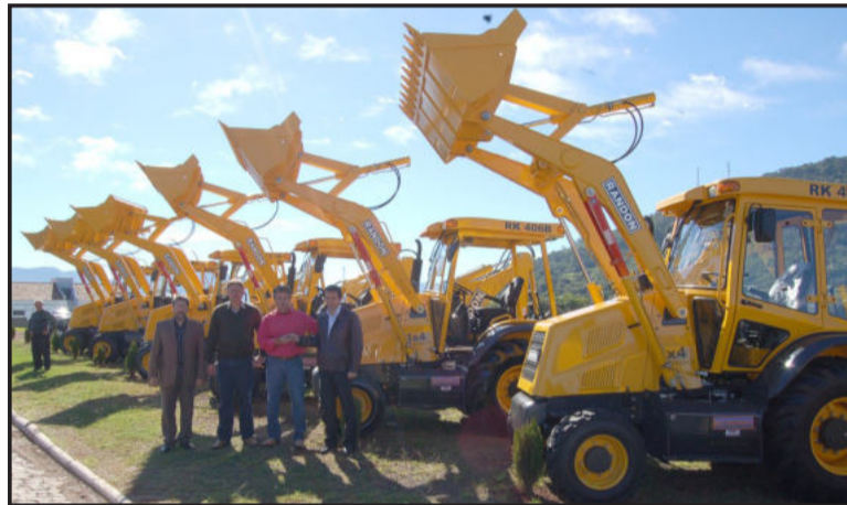
Máquinas vão atender capatazias de Obras e agricultura

Nestes primeiros seis meses foram comprados: novos veículos com motor flex (ambientalmente corretos e como meta para a neutralização de emissão de carbono), uma nova ambulância, uma nova patrula e seis retroescavadeiras. Além disso, anunciou que o Executivo pretende comprar, ainda, um micro-ônibus e mais uma ambulância ainda durante o mês de julho. "Investir em equipamentos é, de certa