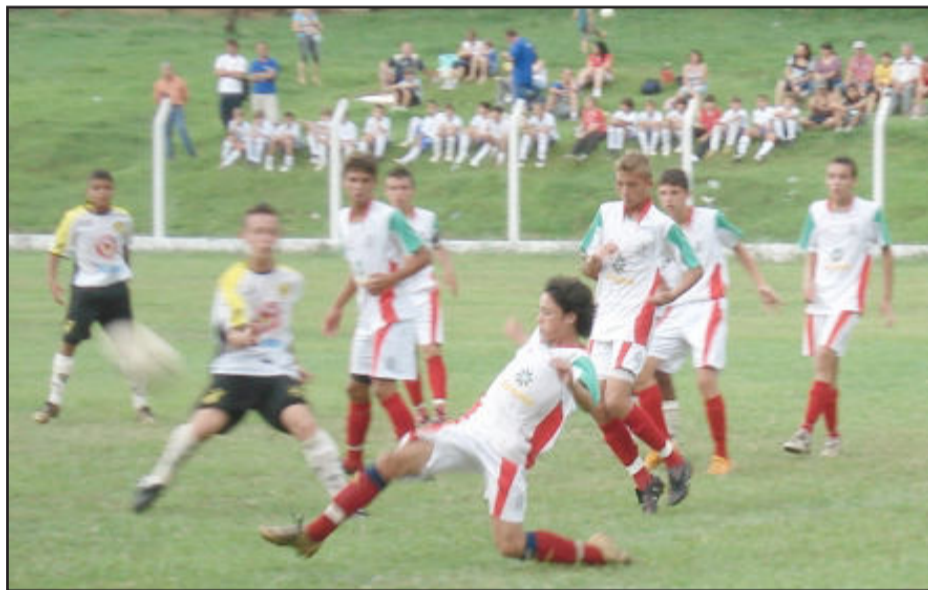
Categoria 94 vai em busca de sua terceira vitória