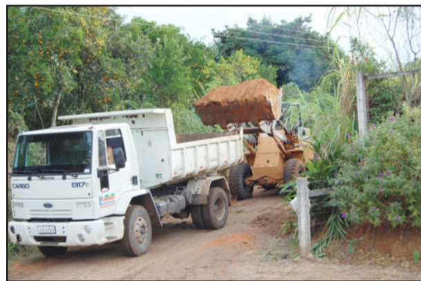
Recuperação de estradas

pes do Vale do Taquari. Em maio, Paverama é declarado o primeiro Município do Vale do Taquari a aderir ao programa RS Amigo do Idoso.