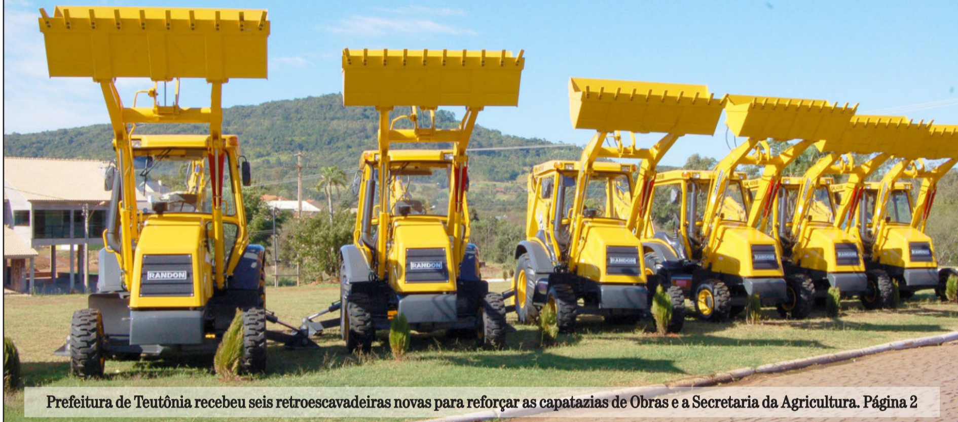
Prefeitura de Teutônia recebeu seis retroescavadeiras novas para reforçar as capatazias de Obras e a Secretaria da Agricultura. Página 2