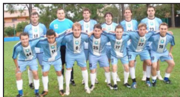
Boka Bier possui a melhor campanha geral

* Classificação: Boka Bier 24; Galera's HC 18; Afibinho 16; Alambique II 15; Só Pela Ceva/Sport 13; LDU/Peugeot 12; Ton'Área e Xernobyl/Sicredi 11; Als Faloa 10; Babilônia 7; Falcons 5; Os Kururus NC 4.