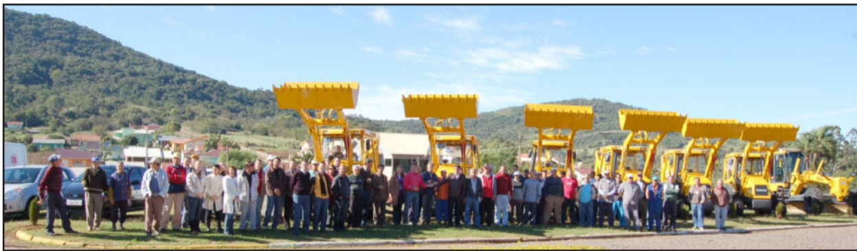
Entrega das seis novas máquinas foi nesta terça-feira

No fim da manhã desta terça-feira, dia 30, a Retromac Máquinas e Equipamentos fez a entrega de seis novas retroescavadeiras para a Prefeitura de Teutônia, que realizou e teve o financiamento liberado via Banrisul. A empresa entregou cinco retroescavadeiras com tração nas quatro rodas e cabine simples, mais uma retroescavadeira com tração 4x4 e cabine fechada com ar-condicionado. Os equipamentos reforçam o parque de máquinas do Município para possibilitar o atendimento às necessidades na zona urbana e rural.