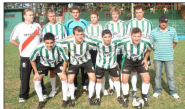
Komedores está em primeiro na 1ª Divisão

* Classificação: Komedores 11; Demonhos Jr e Alambique FCB 10; Barril Jr. 9; Passa Bola B 7; Thundercats A e Só Kako 6; Satanás 4; Alambique e Hooligans 3.