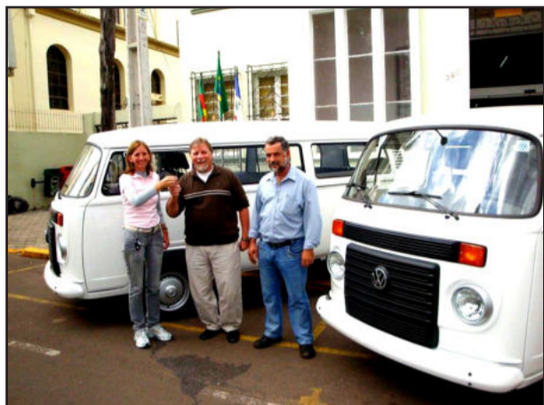
Entrega das chaves das Kombis