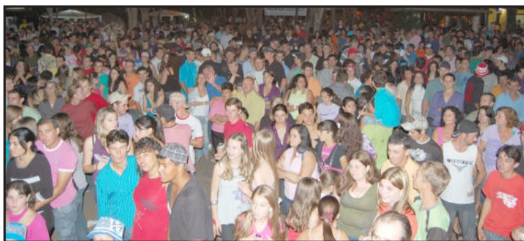
Parque lotou na festa de aniversário

Contatos em Brasília e no Daer - Semanalmente, os representantes da administração entram em contato com representantes do Daer, diretamente em Porto Alegre. Nos últimos dias, os mesmos receberam uma ótima notícia do governo estadual: Paverama tem grandes possibilidades de entrar na cota dos municípios que receberão verbas para construção de novos acessos asfálticos. A liberação dessa verba seria para o novo asfalto que ligará Paverama a Teutônia e para o recapeamento da VRS 835, que liga a cidade com a BR 386.