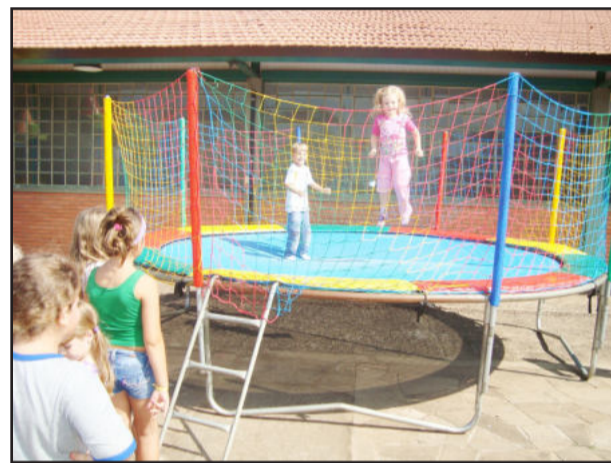
Crianças se divertiram

O sábado, dia 17, foi de integração, brincadeiras e esporte para a família Ieceg (Instituto de Educação Cenequista General Canabarro). Alunos, pais e professores aproveitaram o dia de sol e reuniram-se no Sesi de Teutônia para um agradável piquenique. Os alunos do Ieceg passaram o dia com seus amigos e colegas. E foram diversas atividades. Jogaram vôlei, futebol, fizeram "looks" divertidos nos cabelos e confraternizaram com os colegas do dia-a-dia. A cuia de chimarrão e o violão também acompanharam alunos das turmas do Ensino Médio. Os alunos do "Terceiraço", como eles se denominam, aproveitaram para desfilarem a camiseta de 2010, ano que eles estarão completando seus estudos no Ieceg. Os menores se divertiram nos brinquedos infláveis, na piscina de bolinha e no pula-pula.