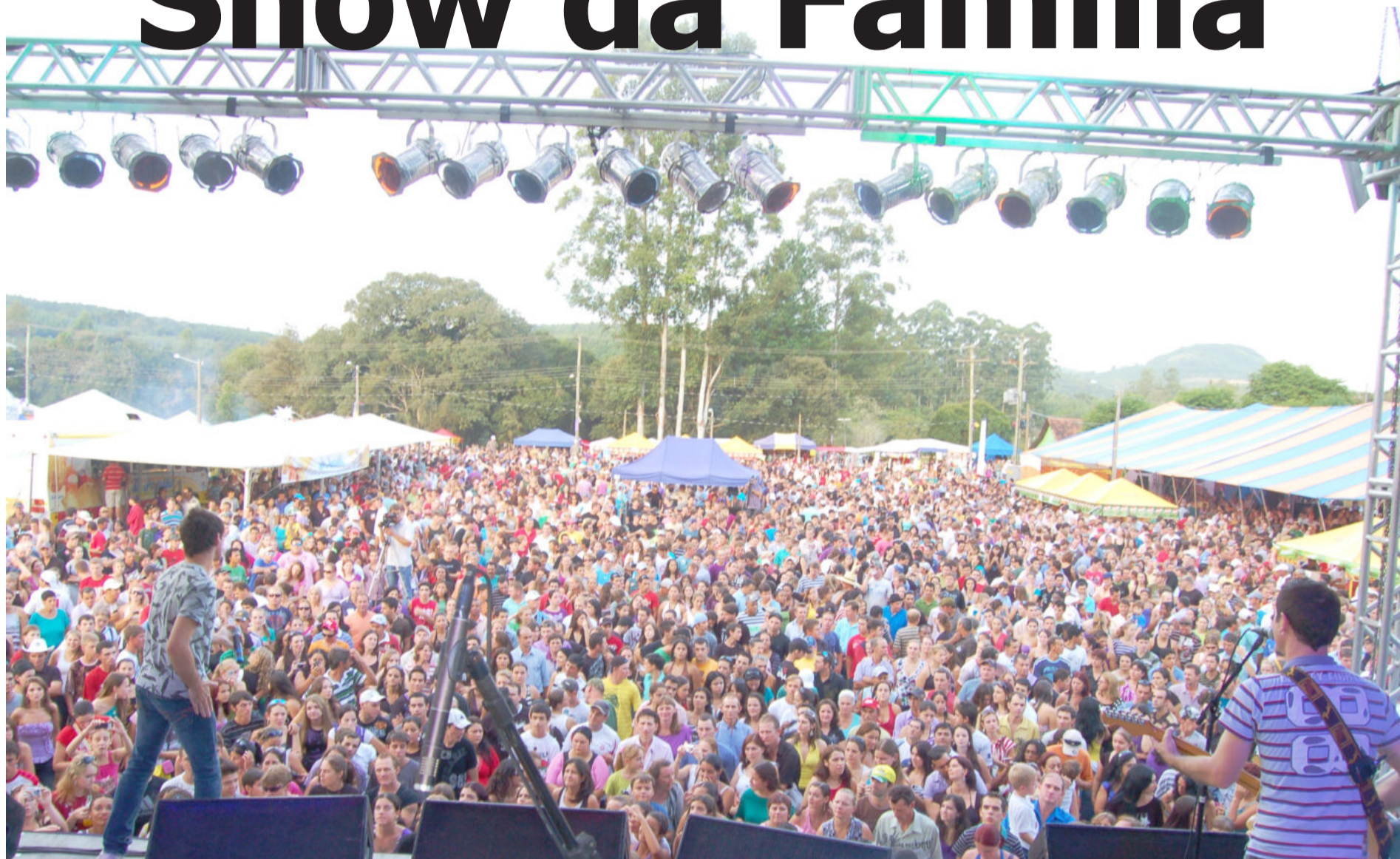
O Show da Família da Rádio Popular FM, no domingo, atraiu milhares de pessoas à 4ª PaveramaFest, encerrada ontem com grande sucesso. Caderno especial