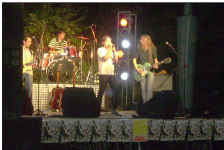
Evento valoriza bandas locais

A Secretaria de Educação e Cultura realizou no sábado, dia 17, a primeira edição do Rock Garibaldi 2010, na Praça Loureiro da Silva. Cerca de 500 pessoas prestigiaram o evento, que apresentou o trabalho das bandas Michel Top, Mutucas, Charlotte, Jay Back e DZ9. O objetivo é valorizar e apresentar à comunidade os talentos locais, além de favorecer a troca de informações e aperfeiçoamentos dos músicos.