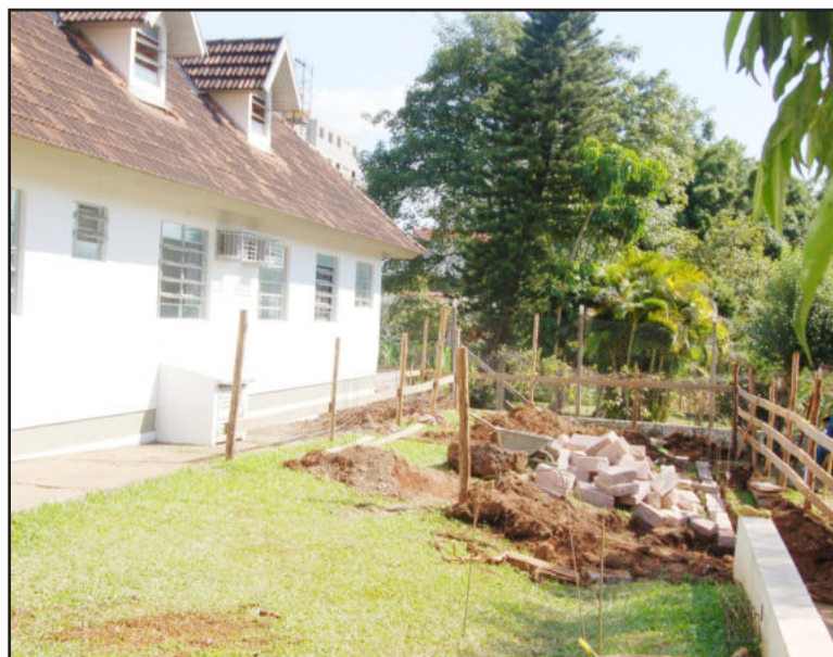
Obras de ampliação já começaram

A ampliação será de 86,90 metros quadrados, para implantar consultório médico com sala de exames e lavabo, corredor, sala de reuniões e atividades múltiplas, sanitário para deficiente físico, sala de expurgo, sala de esterilização, copa e área de serviço. Os recursos para a obra são oriundos de convênio entre o Município e o Ministério da Saúde, além de haver uma contrapartida de dinheiro da Prefeitura.