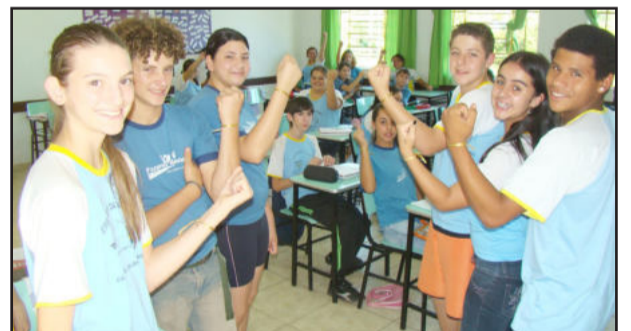
Alunos da oitava série com as fitas

A ideia da direção da Escola de Ensino Fundamental Edgar da Rosa Cardoso, juntamente com a coordenação pedagógica, está mobilizando todos os alunos da instituição. As "fitas do afeto" têm a cor dourada e o objetivo é selar os laços familiares, integrar escola e família e valorizar os princípios da relação entre pais e filhos. A mobilização de toda comunidade escolar visa alertar as crianças e jovens da escola dos perigosos efeitos que podem ser causados com o uso das "pulseiras do sexo".