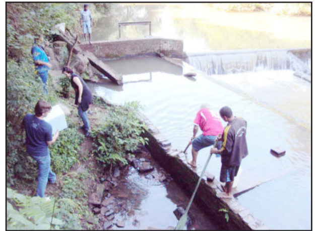
Autoridades e comunidade contribuíram para amenizar a mortandade de peixes no arroio

A solução encontrada pelo grupo foi romper parte da parede do tanque onde estavam os peixes aumentando a vazão de água no local, permitindo a passagem deles para o arroio.