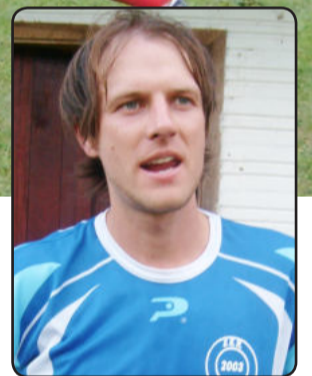
Beça: 2 gols e o melhor jogo