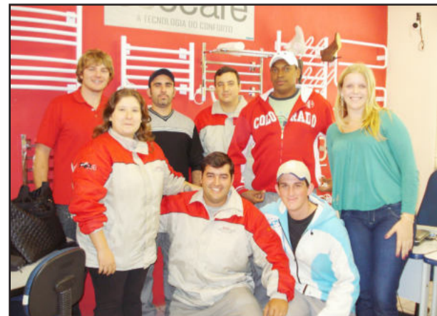
Equipe da Seccare aderiu à ação social