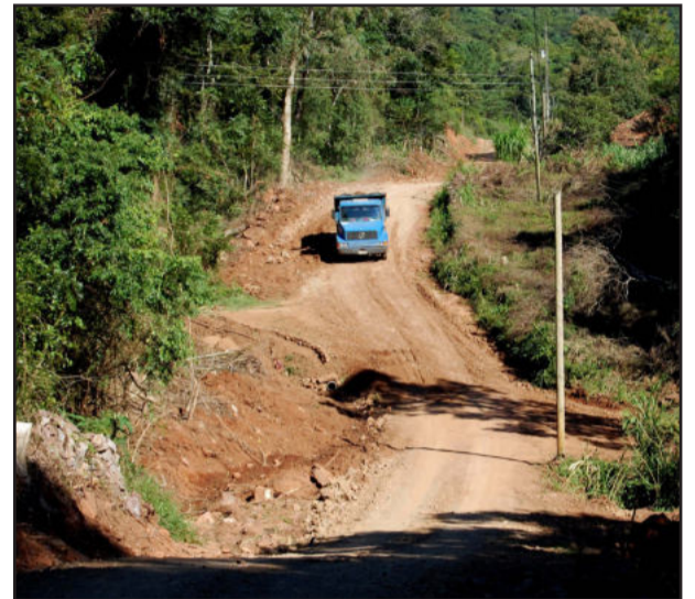
Estrada de acesso à Linha Herval