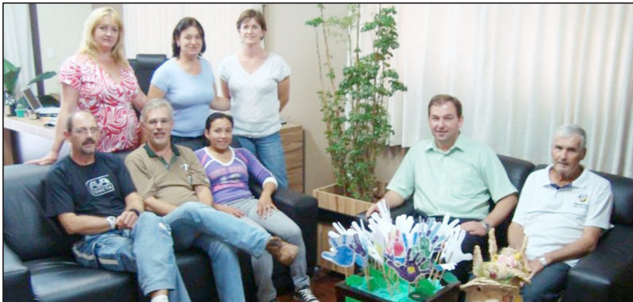
Alunos e instrutor do curso de Informática visitaram o prefeito

A Comissão de Jovens de Colinas e o STR de Colinas, em parceria com o Senar - Serviço Nacional de Aprendizagem Rural, realizaram na quinta, sexta e sábado (de 15 a 17 de abril) o curso Derivados de Leite. Desde segunda, de 13 a 16 de abril, acon-