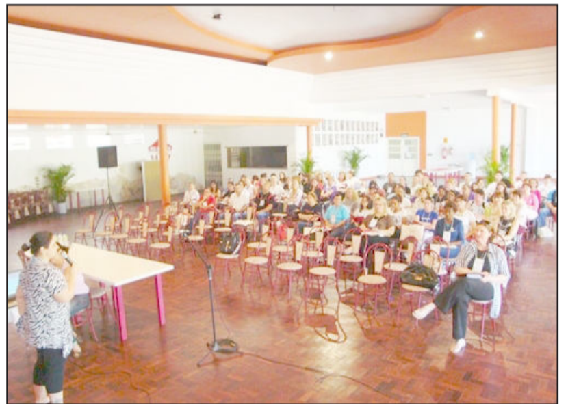
Capacitação ocorre nesta sexta-feira, dia 23