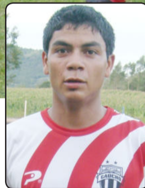
Dari: único gol do Atlético

Na partida de volta, no próximo domingo, o Juventude joga pelo empate para ser semifinalista do Municipal de Teutônia. O Atlético Gaúcho precisa vencer no tempo normal e na prorrogação para chegar à próxima fase sem depender de entrar como melhor perdedor.