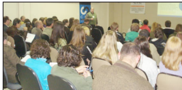
Palestra lotou auditório da CIC

No dia 6 de agosto a Câmara de Indústria e Comércio (CIC), em parceria com o Sebrae, promoveu a palestra gratuita "Vendas e negociação caminham juntas - como ser um vendedor de sucesso?". O evento lotou o auditório da entidade e reuniu 70 pessoas.