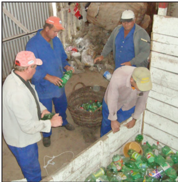
Separação do lixo para reciclagem