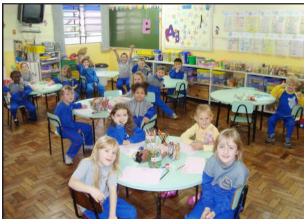
Poucas ausências no retorno às aulas

Na Escola Municipal de Ensino Fundamental Vila Schmidt são 200