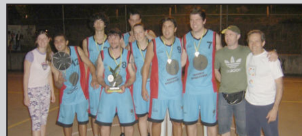
Equipe campeã - Aranhas Basketball

Na final, os Aranhas venceram os Veteranos por 27 x 11. A equipe garibaldense que conquistou a melhor colocação foi a Hip Hip Ballers, que após perder a semifinal por 13 x 12 acabou em 4º lugar. Em 3º ficou o Kinzybasquete. A entrega da premiação aconteceu por volta das 18h30min, e contou com a presença do prefeito Cirano Cisilotto.