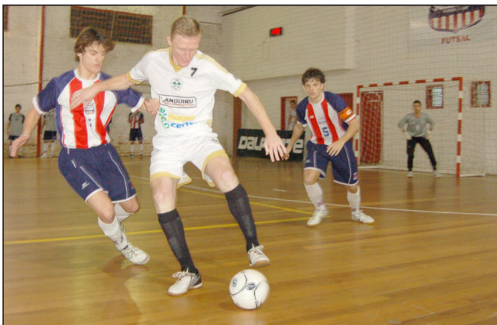
ASTF reencontrará o Porto Alegre FC nesta etapa

Porto Alegre, São Luiz Gonzaga e Guarany de Espumoso vêm aí