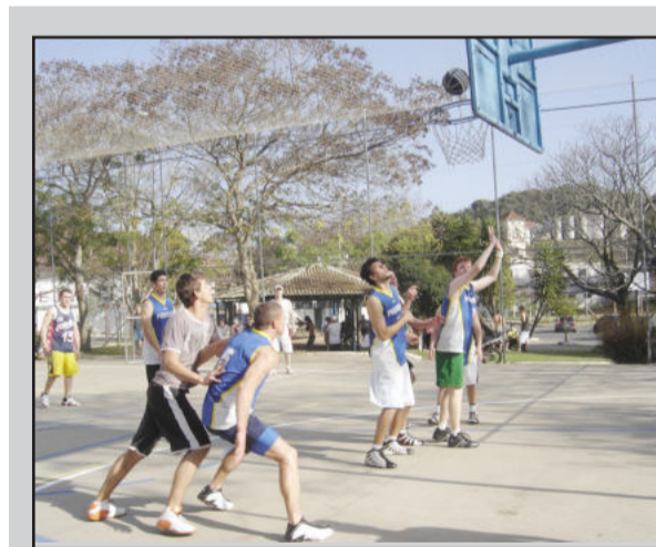
Veteranos x Kinzybasquete