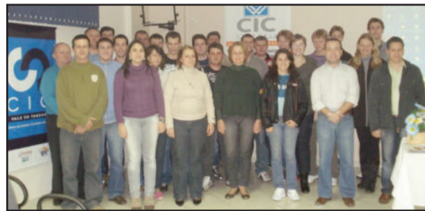
Participantes do curso

No período de 11 a 13 de agosto a Câmara de Indústria e Comércio (CIC) realizou o curso Gestão de Estoques, evento que qualificou 27 pessoas. Numa parceria com a Câmara de Dirigentes Lojistas (CDL) de Porto Alegre, a formação teve por objetivo desenvolver uma visão estratégica das funções do departamento de estoque e armazenagem, considerando o gerenciamento eficaz de recursos e sua importância para a redução dos custos da organização.