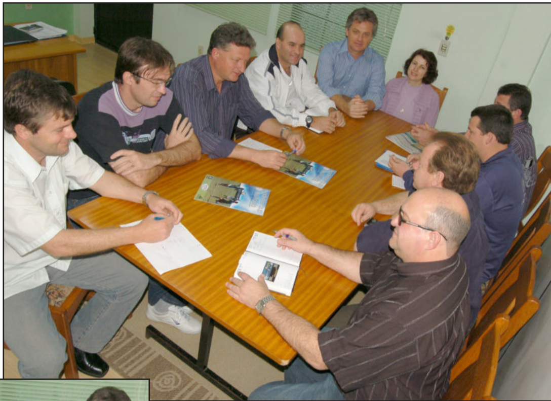
Grupo esteve reunido nesta semana para avaliar a edição de 2009 e projetar a competição do próximo ano, de 10 a 16 de janeiro

Em 2009, a 3ª Copa Adidas Teutônia foi disputada de 18 a 24 de janeiro, com a participação de 150 equipes, de 56 clubes, divididas em seis categorias. Participaram equipes de seis estados brasileiros (RS, SC, PR, SP, BA e PA) de quatro regiões do País e de três países (Brasil, Argentina e Paraguai). No total foram disputados 301 jogos, marcados 1.062 gols (média de 3,53) e envolveu 3.221 atletas.