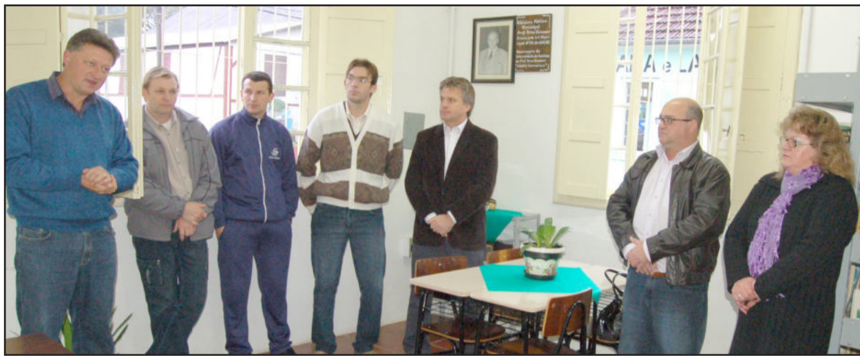
Reformulação foi elogiada pelo poder público