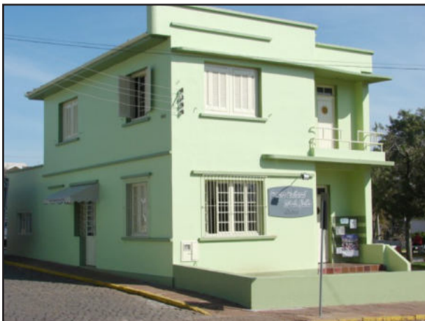
Prédio após a reforma