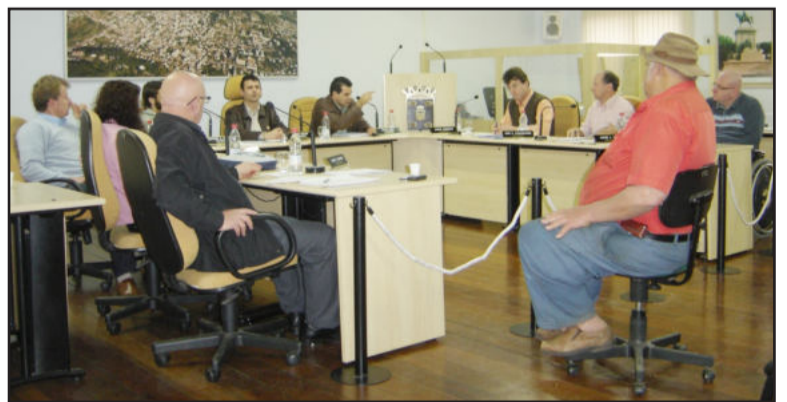
Denúncia foi apresentada aos vereadores

Questionado se outras pessoas que trabalham com a coleta e a reciclagem de resíduos estariam também pagando aluguel, Moreira não soube precisar se isso estaria acontecendo com os demais. Destacou que já buscou informações junto ao