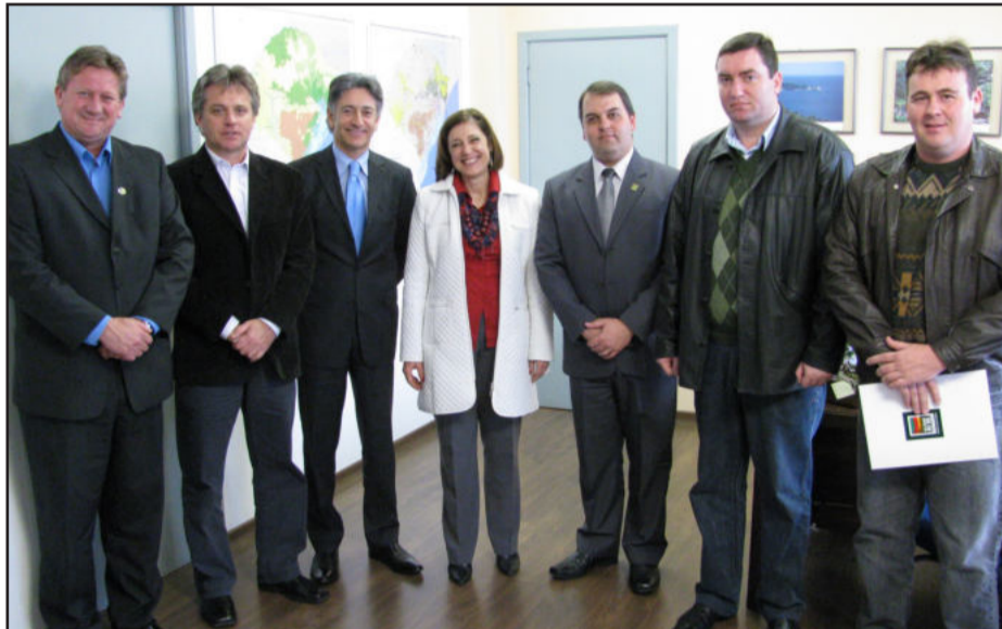
Comitiva de Teutônia na Secretaria de Meio Ambiente