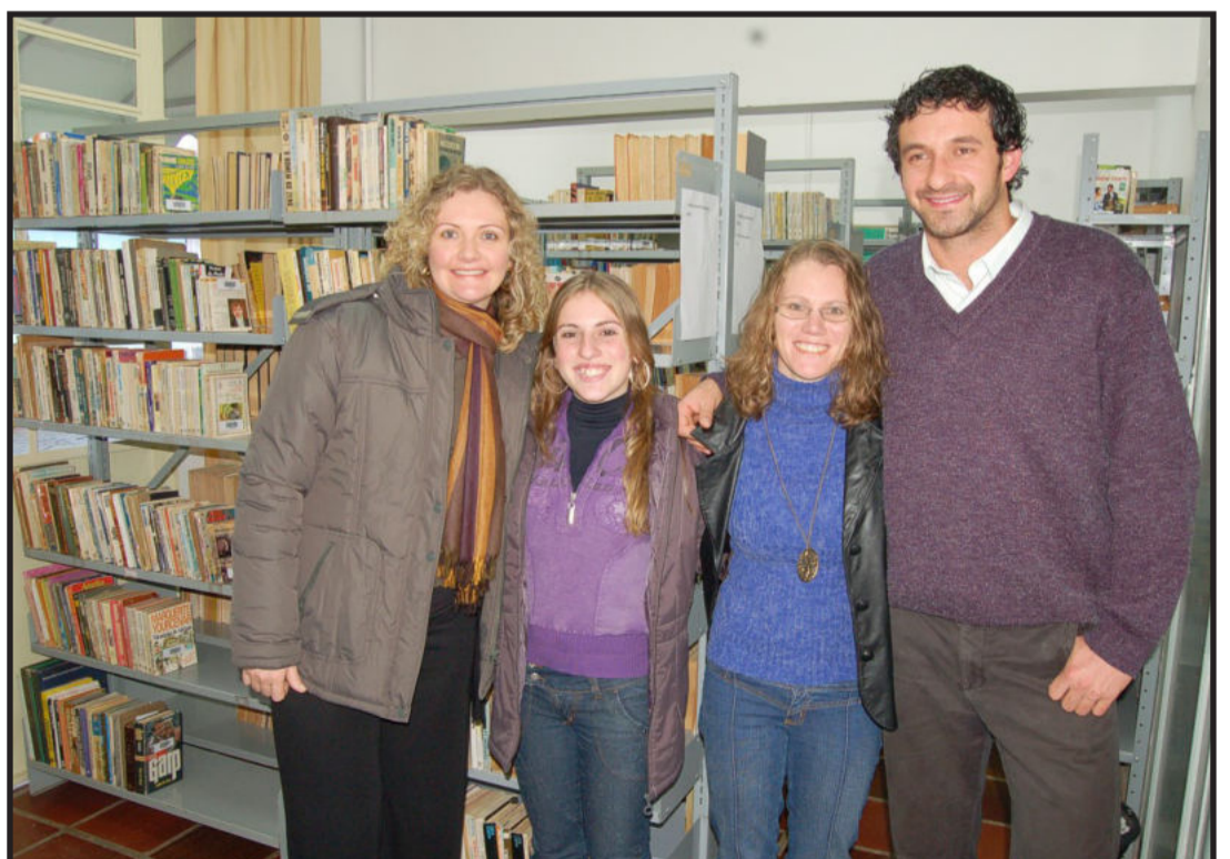
Equipe que informatizou a biblioteca da entidade. Página 2

Inaugurada reformulação do Centro Cultural 25 de Julho