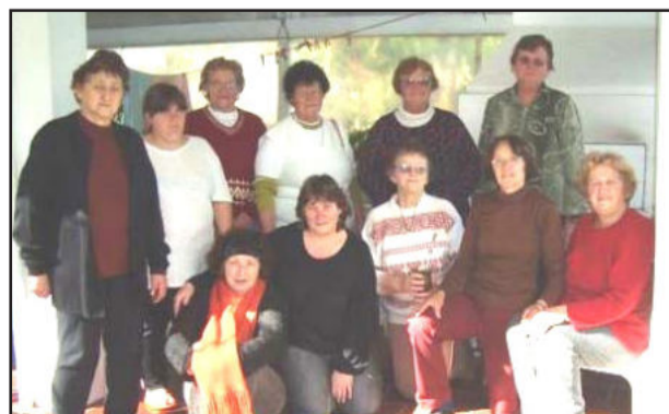
Reunião do Clube de Mães Imigrante

Os esclarecimentos e as orientações sobre os cuidados para o uso correto das plantas medicinais são realizados pela Emater/RS-Ascar de Imigrante, para que as pessoas possam identificar, colher, secar, preparar e usar de forma adequada as plantas, que ajudaram na vida do homem desde o início dos tempos.