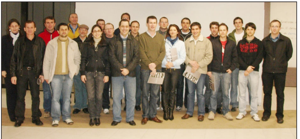
Participantes da visita da Apeme na Sazi em Farroupilha