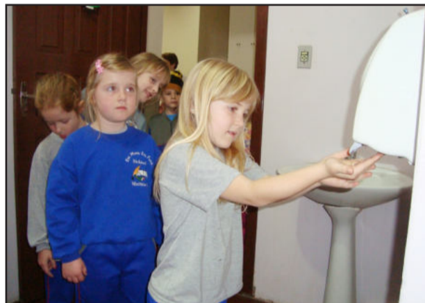
Procedimentos de higiene

Enquanto que na maioria dos municípios as aulas retornaram nesta segunda-feira, dia 17, em Westfália os alunos da rede municipal estão frequentando as escolas desde o dia 10. Na volta das férias de inverno, algumas precauções e orientações foram repassadas aos alunos, conscientizando-os sobre o vírus da gripe A. Além disso, os procedimentos mudaram. Os alunos regularmente utilizam álcool