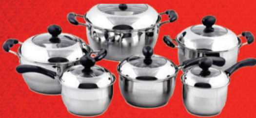
Conjunto de Panelas 6pçs Inox 346049