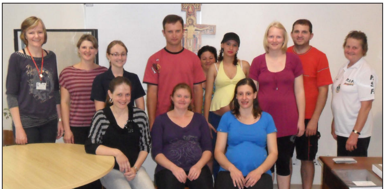
Futuras mães conheceram Centro Obstétrico

Francine, onde receberam informações sobre a rotina hospitalar, parto e pós-parto, e o nascimento do bebê. Conheceram demais ambientes, como a sala de pré-parto e parto, sala de admissão do recém-nascido, além dos quartos para acomodações das futuras mães e bebês.