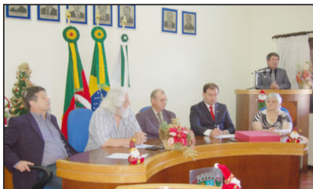
Sessão solene para concessão de títulos

Após a sessão, homenageados, autoridades e público em geral deslocaram-se até o início do asfalto que liga o centro de Colinas até a divisa com o Município de Roca Sales, logo na saída da cidade, onde ocorreu o desenlace da fita inaugural. Todos seguiram em carreta, conduzidos pelo caminhão que levou as autoridades e os músicos, até a Linha 31 de Outubro, onde foi realizado um almoço festivo para comemorar a finalização das obras. Além deste asfalto, o Município também concluiu neste ano o asfaltamento de 1,5 km que faltava para que Imigrante e Colinas estivessem interligados com asfalto.