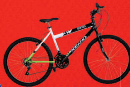
Bicicleta aro 26 346051

lojas Certel Sempre mais fácil de comprar