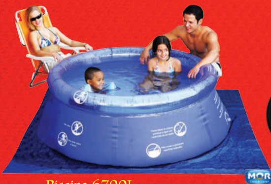
Piscina 6700L 327156