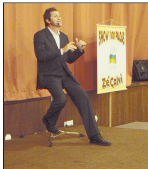
Zé Calvi no Show 100 Piadas