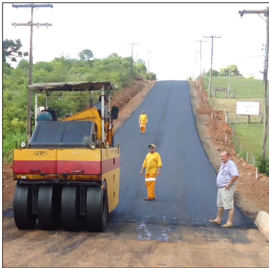
"Trans-Vale" será inaugurada nesta quinta-feira

Segundo o prefeito, após a solenidade de inauguração oficial da rodovia, as autoridades presentes e comunidade em geral estão convidadas a participar de uma carreta por todo percurso de 4,1 quilômetros pavimentados. Na sequência haverá uma confraternização entre os presentes no Bar do Clébio. "Será um momento de muita alegria para nosso Município que estará concretizando uma luta de muitos anos. Ainda temos outros motivos para comemorar o ano de 2010, como a recuperação VRS-835 e a conquista de mais uma ligação asfáltica com Teutônia e Fazenda Vilanova, através de Rota