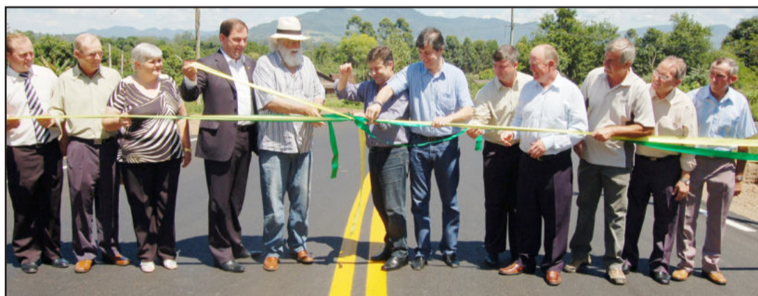
Inaugurada sábado, pavimentação vai até a divisa com Roca Sales. Página 9