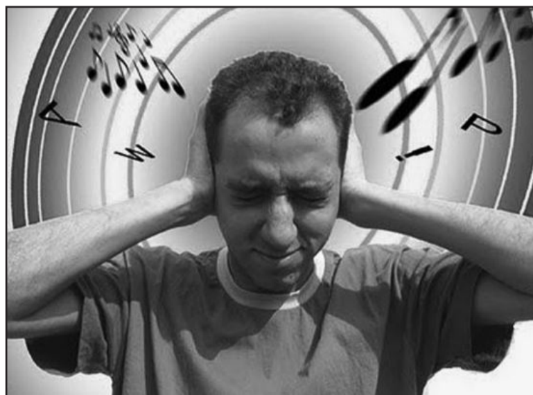
Som alto prejudica a audição

Segundo a BM, “como o elemento subjetivo da conduta é o dolo, o infrator precisa ter a vontade consciente de per-