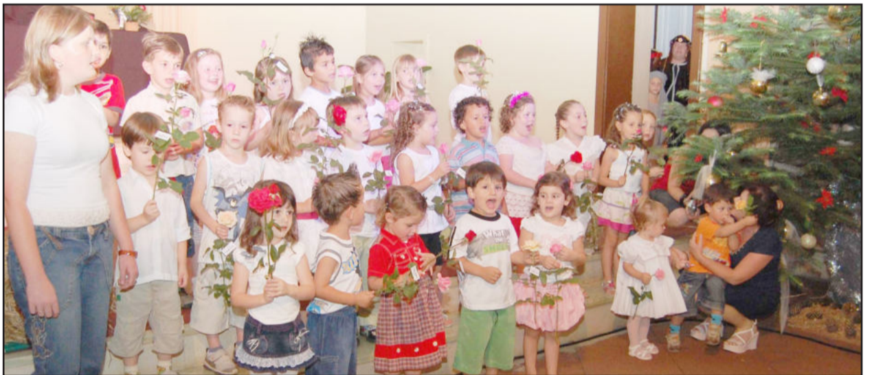
Os alunos cantores da Escola Pequeno Mundo