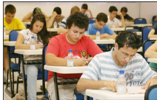
Provas foram aplicadas domingo

A Univates realizou neste domingo, dia 19, seu maior Vestibular de Verão dos últimos anos. O processo seletivo contou com mais de 2,2 mil candidatos para cerca de 40 cursos. A movimentação desde o início da manhã foi grande nos câmpus de Lajeado e de Encantado, especialmente das 8h às 13h, horário em que a prova foi aplicada. Os cursos mais concorridos desta edição foram Direito noturno, Arquitetura e Urbanismo e Biomedicina. Os candidatos, oriundos de cerca de 90 municípios do Rio Grande do Sul, escolheram, em sua maioria, o espanhol como língua estrangeira, seguido do inglês e, em menor proporção, do alemão.