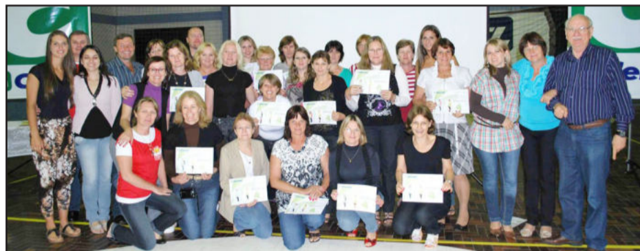
Participantes de Conventos, Lajeado