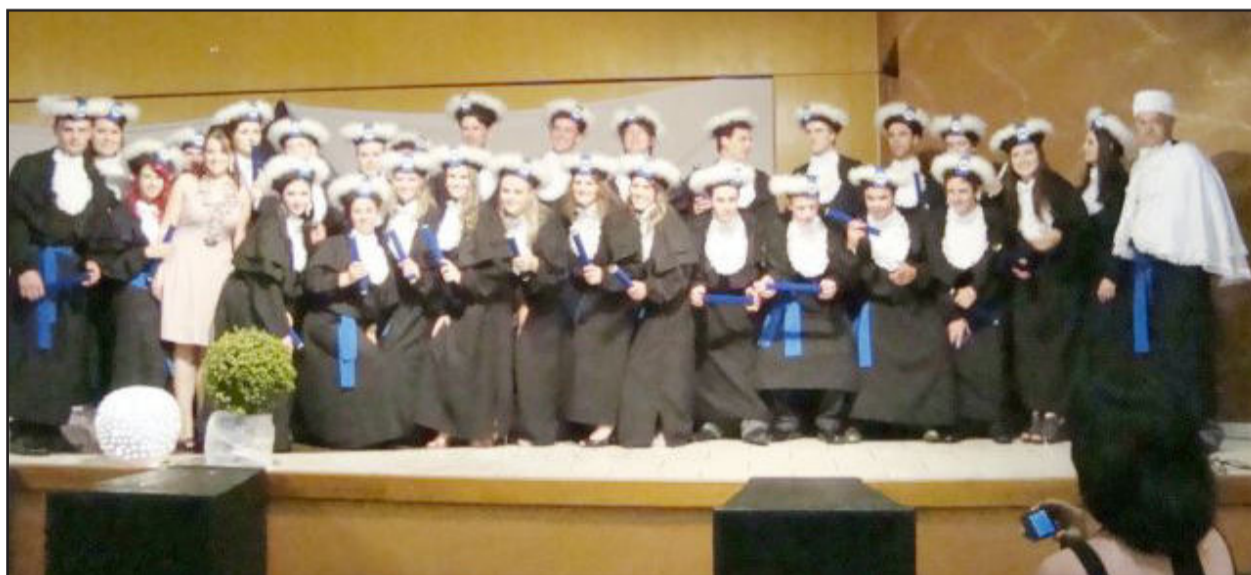
Formandos do curso de Administração

Foram momentos de emoção e comemoração, que completaram mais uma etapa na vida de cada aluno que, por sua vez, entraram para a história do Iceceg.