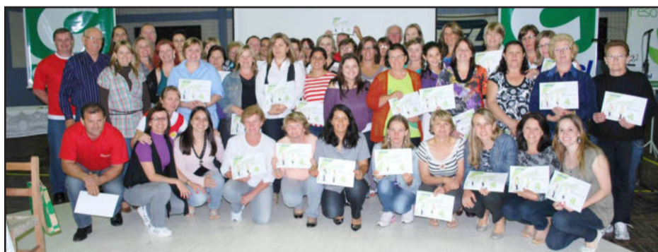
Participantes de Teutônia

A 16ª edição do Peso Leve iniciará no dia 28 de fevereiro e contemplará os municípios de Lajeado (Centro e Conventos), Arroio do Meio, Teutônia, e estão sendo finalizadas as tratativas para incluir também Pouso Novo. As inscrições podem ser feitas a partir de janeiro nas Lojas Certel dos respectivos municípios, sendo necessários grupos de, no mínimo, 50 pessoas para cada local.