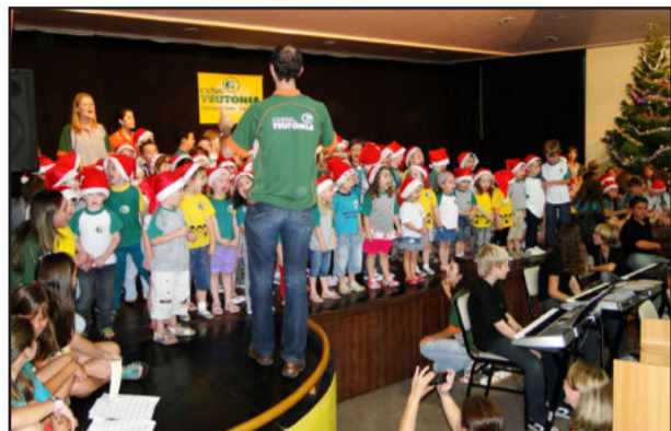
Talents musicais de diferentes idades conquistaram o público

Na quinta-feira, dia 16, o Colégio Teutônia realizou sua tradicional celebração natalina com a participação de alunos, professores e da comunidade escolar. O auditório central do educandário ficou lotado para assistir as apresentações artísticas. A Cantata Natalina, coordenada pela área de música da escola, emocionou a todos e envolveu alunos da Educação Infantil ao Ensino Médio, contagiando também o público, que acompanhou nas palmas.