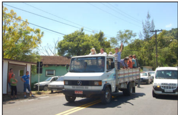
Carreata conduziu o público até a 31 de Outubro