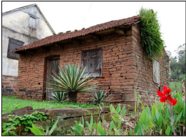
Casa de Pedra, em Imigrante

A construção do prédio é da Família Lagemann e até hoje continua original, feita com pedras de arenito (pedra grês). Como antigamente não existia geladeira, o local servia como casa de carnes, onde eram acondicionados produtos derivados do abate de suínos e bovinos.