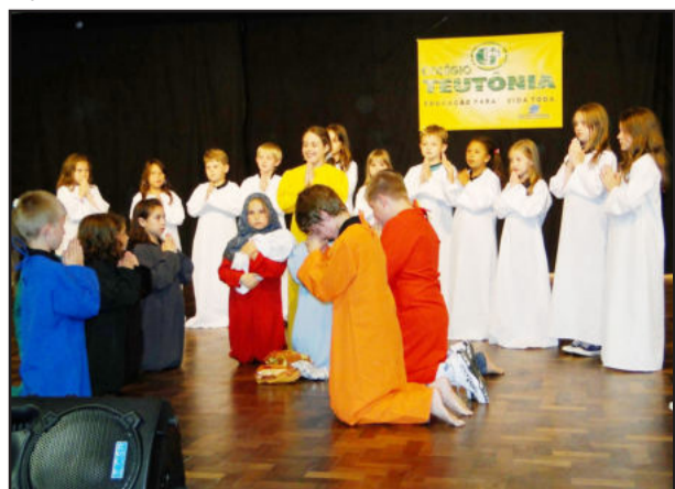
Nascimento do menino Jesus foi encenado pelos alunos do Turno Integral