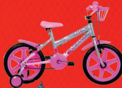
Bicicleta aro 16 346004/346006