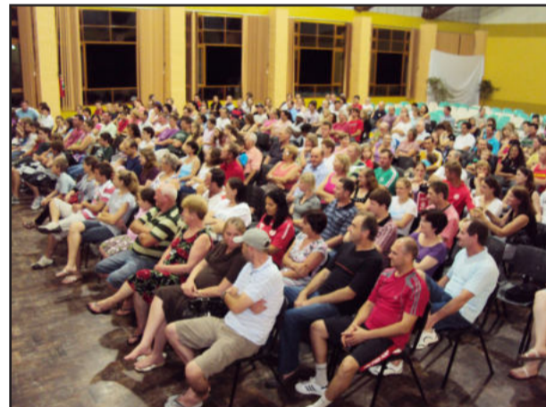
Público muito bom compareceu na noite de domingo

O ingresso para o evento era um quilo de alimento que foi doado para o Lar de Idosos Opa Haus, do Bairro Teutônia. A promoção foi de TBT Produções, com apoio da Rádio Popular FM e do jornal Folha Popular, patrocínio de Bremil e Baldo, por meio da Lei de Incentivo à Cultura.