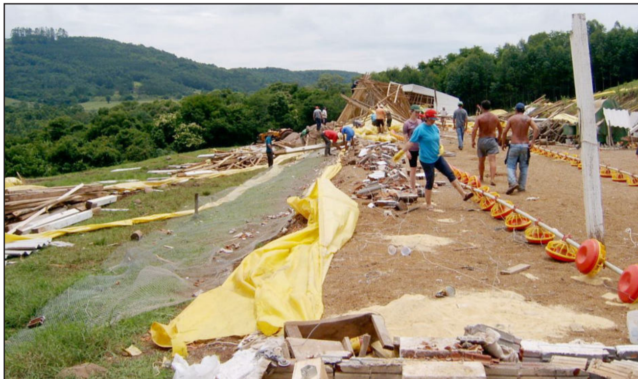
Vizinhos e funcionários da prefeitura auxiliaram na retirada dos escombros

Um temporal que atingiu alguns pontos do Estado, na tarde deste domingo, dia 19, provocou estragos também no interior de Teutônia. Um aviário, de propriedade de Luiz e Merice Strate, localizado em Boa Vista Fundos, foi totalmente destruído pela força dos ventos e o granizo, que caiu por volta das 16h45min.