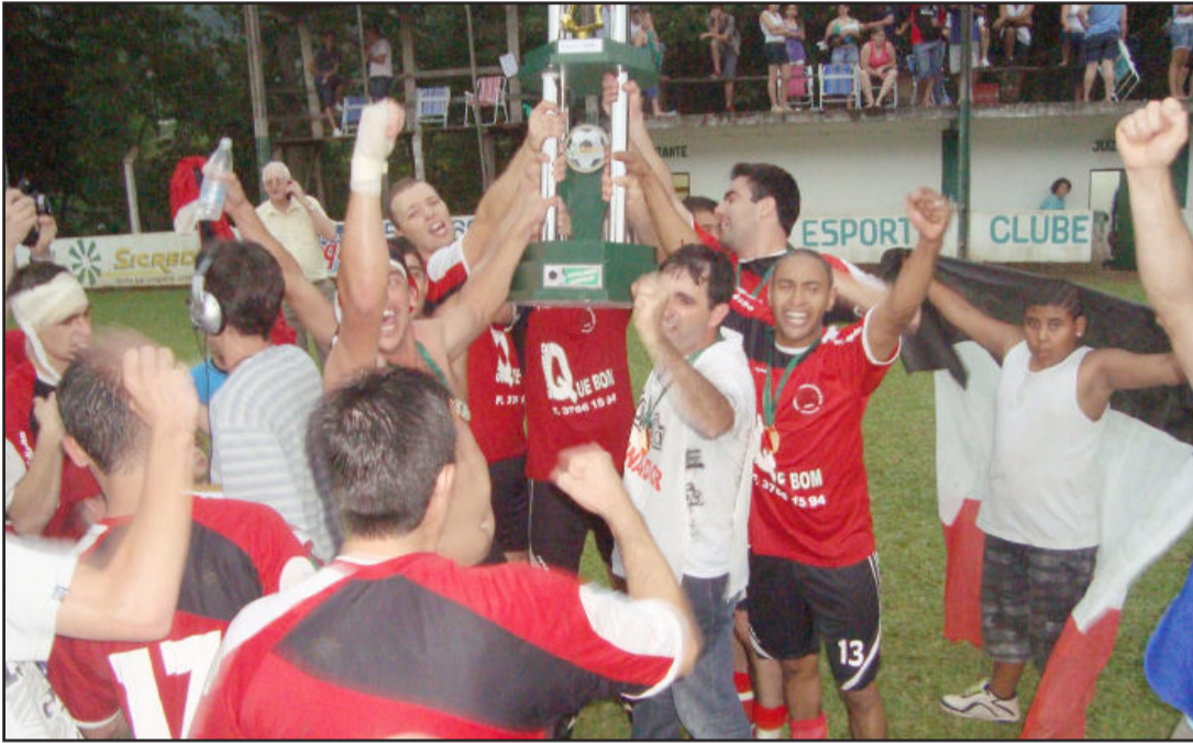
Com gol de empate aos 41 min do segundo tempo, a AECOSAJO conquistou o título regional sobre o 11 Amigos