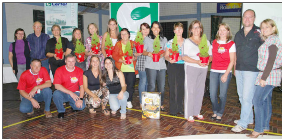
Participantes que emagreceram mais de dez quilos