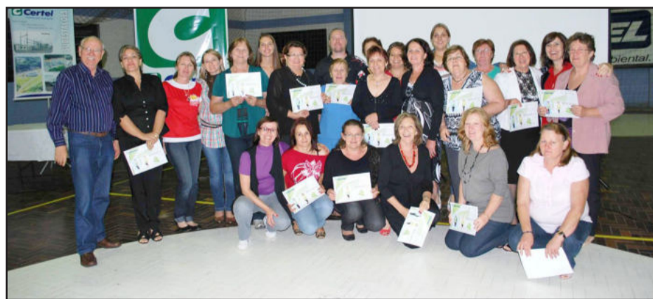
Participantes do Centro de Lajeado