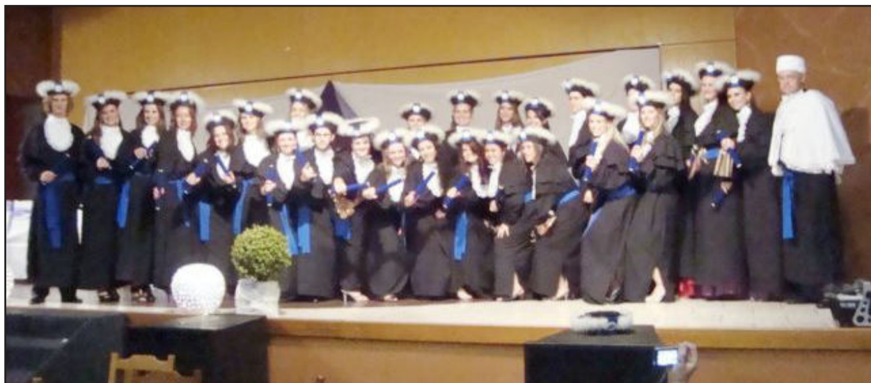
Formandos do curso de Contabilidade

E ncerraram-se, no sábado as formaturas de 2010 no Instituto de Educação Cenequista General Canabarro (Iceceg). Ao longo das últimas semanas, dezenas de alunos viveram a expectativa de concluir seus cursos.