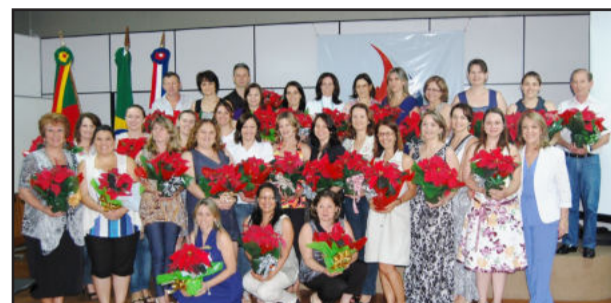
Carmen e Rejane com os novos diretores e vices

Nesta segunda-feira, dia 20, o governo de Lajeado empossou os novos diretores e vices eleitos em 17 escolas municipais de Ensino Fundamental para a gestão 2011/2013. A prefeita Carmen Regina Cardoso comentou que nesta época de final de ano, em que passamos por um clima de renovação, a posse dos novos diretores e vices se interliga com esta questão, de se preparar para a passagem de um novo ano, de novos e decisivos passos. "São pessoas que assumem hoje e que se dispuseram a acreditar na escola, na instituição que une forças para mais uma gestão. É um momento de esperança, onde se percebe que estímulos positivos correspondem a respostas positivas", disse Carmen afirmando que o governo de Lajeado reconhece o trabalho da educação e assegura que a valorização destes profissionais existe. "Ser professor, diretor e/ou vice é ser cúmplice do processo de formação de uma sociedade e destacamos aqui o nosso compromisso com a gestão de pessoas", observa a prefeita, complementando que ser líder é ser responsável e que todos devem deixar luz por onde passam.