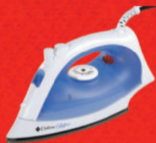
Ferro a Vapor 347298/347299