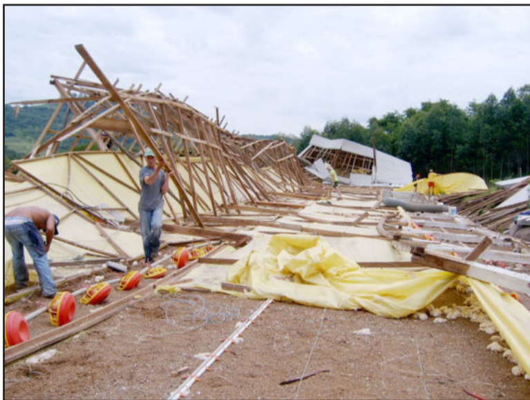
Ventos e granizo fizeram a estrutura desabar

Uma acidente, por volta de 1h30min da manhugada desta segunda-feira, dia 20, no quilômetro 27 da RS-128, a Via Láctea, em Teutônia, resultou numa vítima fatal. Segundo informações da Polícia Rodoviária Estadual de Teutônia,