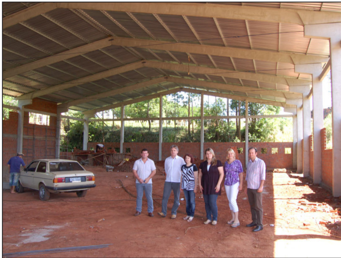
Prefeito e secretária de Educação em visita às obras do ginásio

E stão em ritmo acelerado as obras de construção da primeira etapa do ginásio de esportes para a Escola Municipal 24 de Maio, situada no Loteamento 8, no Bairro Canabarro. A obra representa um investimento superior a R$ 333,9 mil, somente com recursos próprios da Prefeitura de Teutônia, através da Secretaria Municipal de Educação. A empresa Grassi & Grassi Construtora Ltda, vencedora da licitação, já realiza a colocação das paredes externas do prédio, preenchendo os vãos entre os postes e vigas pré-moldados. O telhado também já está colocado.