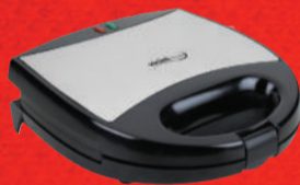
Sanducheira e Grill 338105 vicini