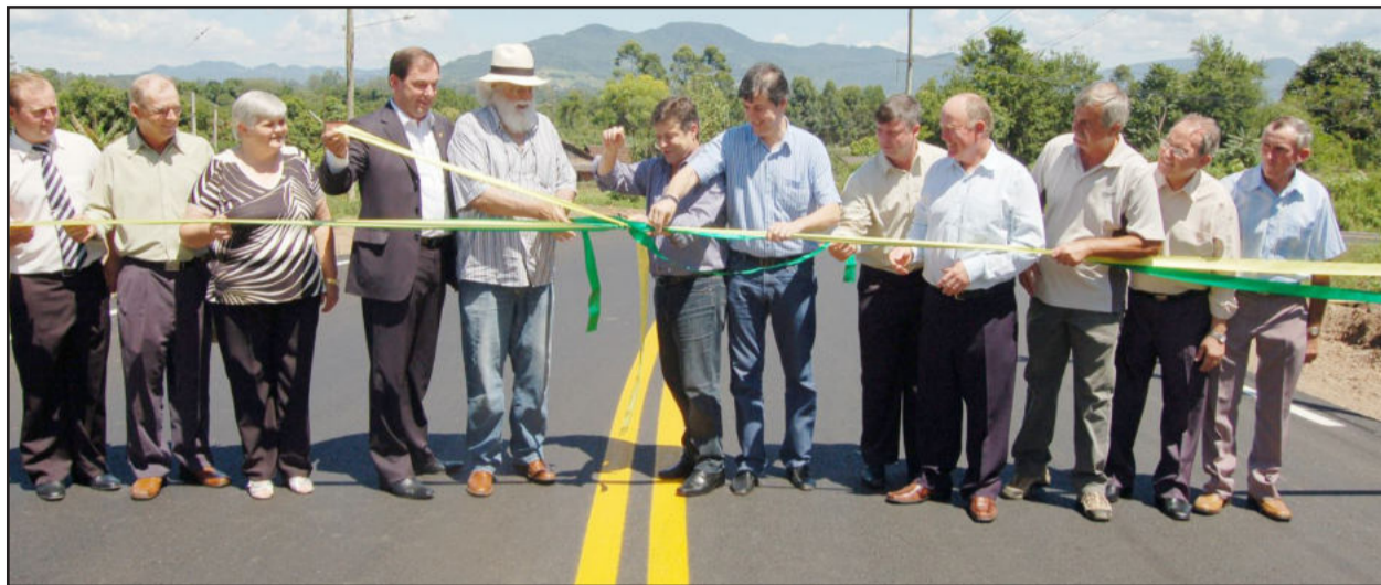
O desenlace da fita no início do novo asfalto