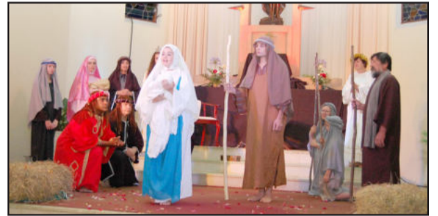
Grupo Façarte deu show de interpretação