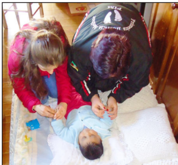
Amor e carinho são indispensáveis