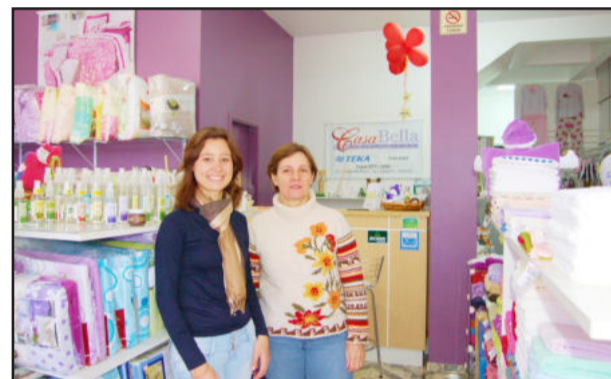
As proprietárias da loja Casa Bella

A loja Casa Bella festejou três anos de trabalho no dia 15 de agosto. Localizada atualmente na rua Guilherme Brust, em Languiru, a empresa trabalha com cama, mesa, banho e acessórios para o lar. Com tradição de oferecer artigos de qualidade e com muito bom gosto, oferece aos seus clientes grande variedade de produtos para ornamentar e tornar mais aconchegante seu lar, como cortinas, tapetes, aromas, edredons e muito mais. Além disso, trabalha com a linha banho, com toalhas, roupões e outros, linha bebê para preparar o enxoval e uma infinidade de outros produtos. Para festejar, no último sábado, dia 14, os clientes foram recebidos em clima de festa, com direito a balões, coquetel e muitas ofertas, que podem ser aproveitadas durante todo mês de agosto.