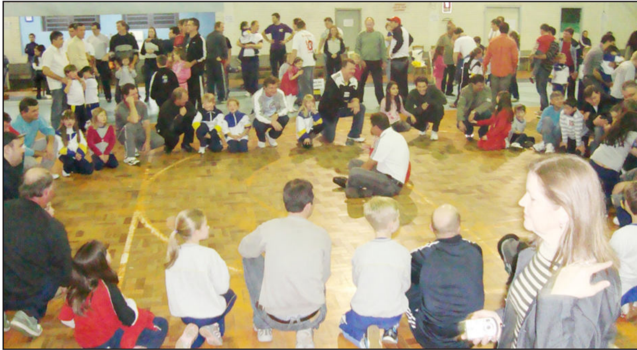
Evento integrou pais e alunos no Ieceg

Valorizar a família, fazendo com que ela participe e vivencie a rotina de seus filhos no Instituto de Educação Cenequista General Canabarro (Ieceg), sempre foi uma marca do educandário. Cada vez mais, pais, mães, avós, e todos os familiares mostram-se participativos e engajados nos projetos que o instituto sugere. Neste ano, em várias ocasiões o Ieceg esteve repleto dessas pessoas tão importantes para as nossas crianças.