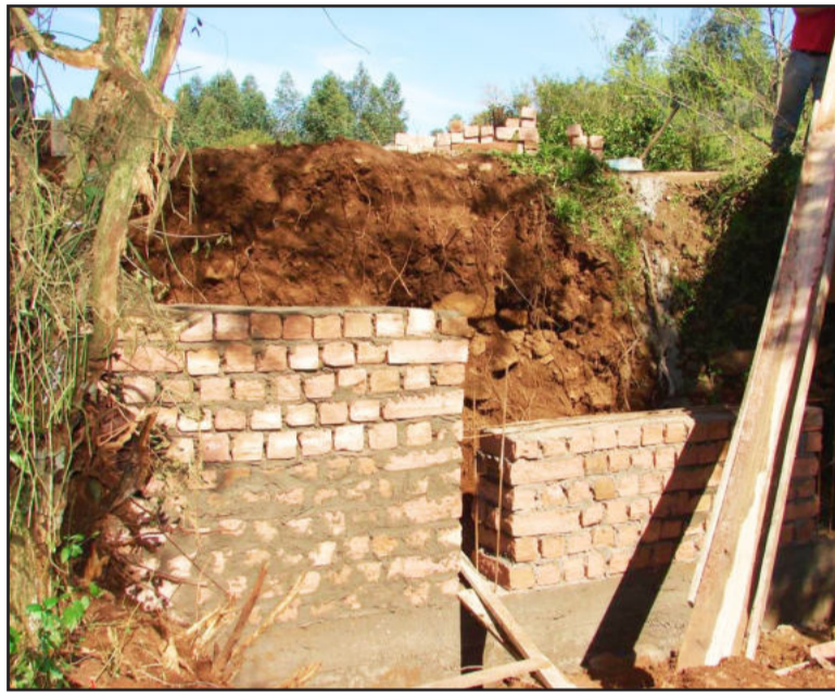
Melhorias darão mais segurança para quem transitar pelo local