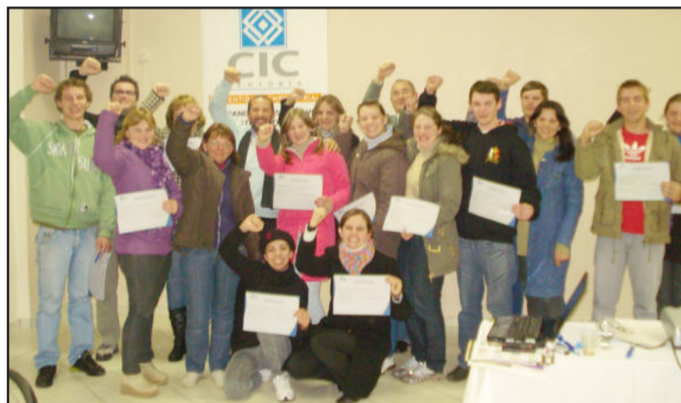
Encontros ocorreram no auditório da CIC