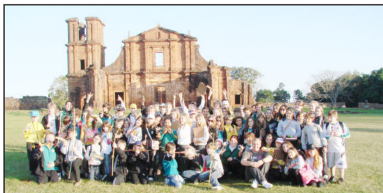
Alunos de quatro turmas conheceram as Ruínas de São Miguel Arcanjo

Pensando nisso, recentemente, as turmas do quarto ano, quinto ano, quinta série e sexta série do Colégio Teutônia realizaram viagem de estudos ao Noroeste do Estado, à cidade de São Miguel das Missões. Na ocasião as turmas puderam conhecer de perto e trabalhar a importância do patrimônio histórico, de um sítio arqueológico, dos indígenas e do trabalho dos jesuítas junto às Missões, em especial nas Ruínas de São Miguel Arcanjo, importante patrimônio histórico