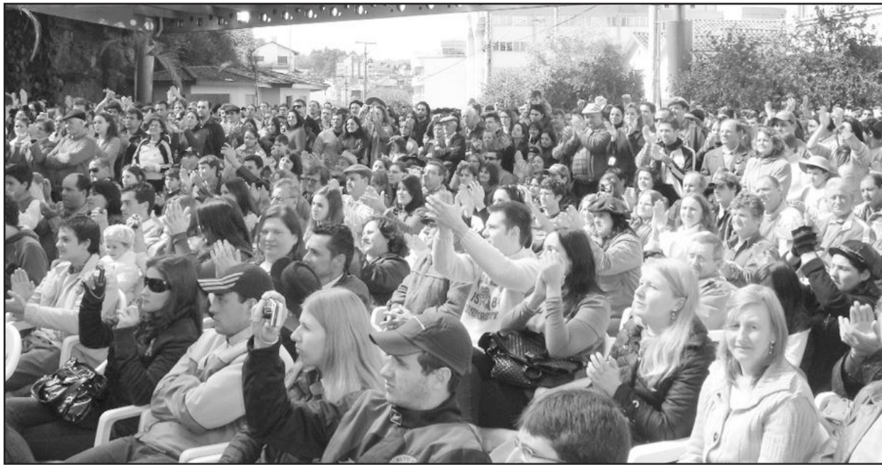
Primeira Mateada em Homenagem aos Pais em agosto de 2009