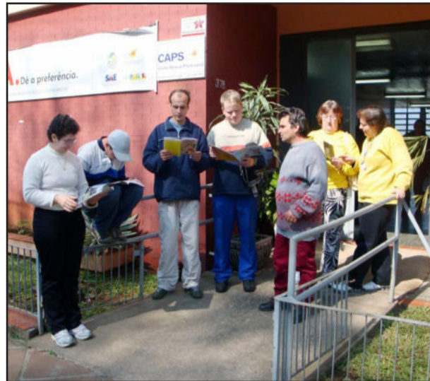
Usuários do Caps dedicam algum tempo do dia para a leitura