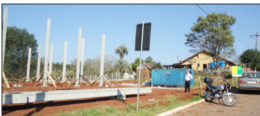
Comunidade da Cidade Baixa terá cancha coberta