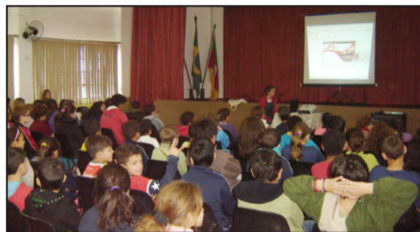
Alunos da escola Odilo Afonso Thomé também já assistiram ao Circuito Tela Verde