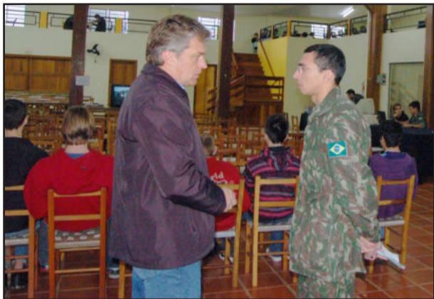
Inspeção de saúde dos jovens da classe de 1992

Um total de 199 jovens teutonienses se alistaram neste ano para prestação do serviço militar obrigatório em 2011, e todos passam pela inspeção de saúde nesta sexta-feira, dia 20, e segunda-feira, dia 23 de agosto, no pavilhão da Comunidade Evangélica Redentor, do Bairro Canabarro.