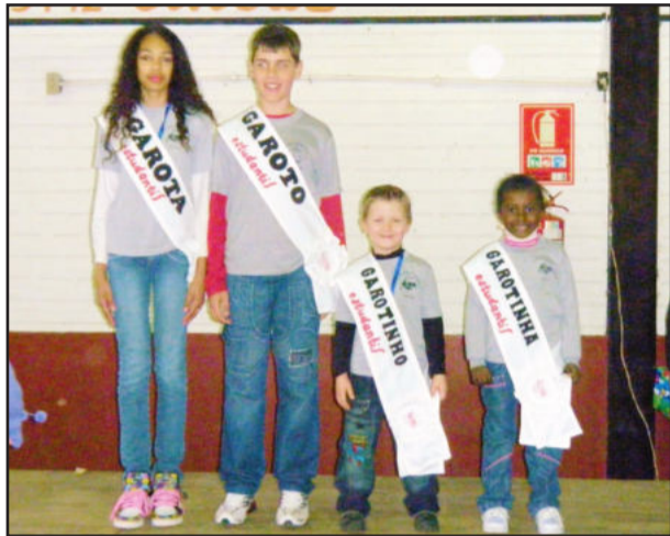
Garotas e Garotos Estudantis

A Escola Municipal de Ensino Fundamental Vila Schmidt, do Bairro Centro, de Westfália, comemorou 13 anos de atividades no dia 12 de agosto. Para comemorar a data e homenagear os pais pelo seu dia, o educandário oportunizou no sábado, dia 14, na sede do Flamengo, uma manhã especial para os estudantes e seus pais.