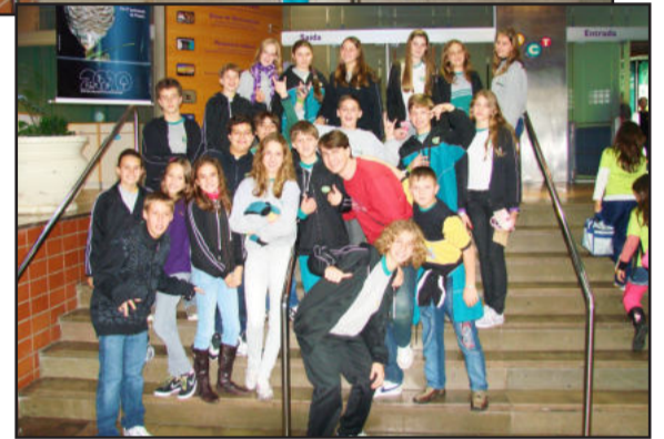
Alunos do Colégio Teutônia no Museu da PUC

Recentemente, as turmas do terceiro ano e da sétima série do Ensino Fundamental do Colégio Teutônia realizaram viagem de estudos ao Museu de Ciências Naturais da Pontifícia Universidade Católica (PUC), em Porto Alegre. O museu é rico em aprendizagens significativas e este foi um momento em que os alunos pesquisaram, leram, brincaram e interagiram com as diferentes formas de conhecimento.