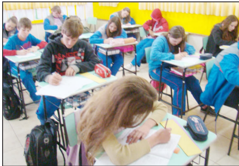
Alunos participaram de pesquisa