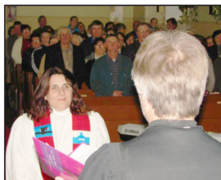
Pastora é natural de Candelária