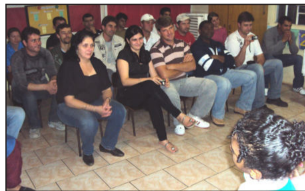
Pais visitam os filhos na escola

Além da presença paterna, houve também a participação das mães que vieram prestigiar este momento tão especial. A diretora da escola agradece a todos que participaram e que propiciaram aos alunos este momento especial de comemoração.