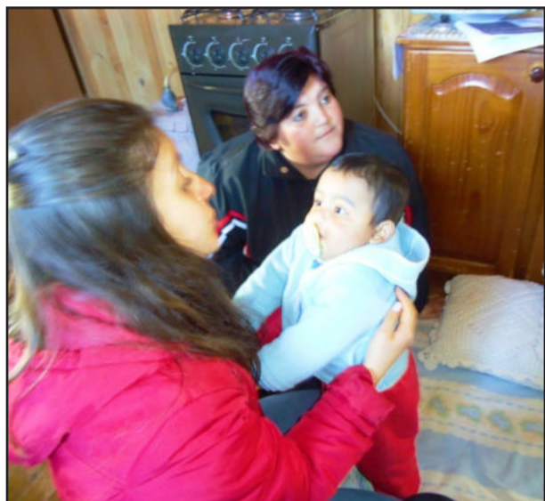
Trabalho do PIM beneficia crianças

O GTM de Colinas acredita que este tipo de integração, troca de vivências e conhecimentos é fundamental para o sucesso do programa, o qual visa estreitar vínculos entre crianças e familiares, tornando-os mais afetivos e desenvolvendo-os em todas as dimensões do crescimento.