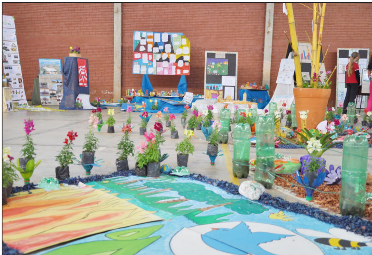
Mostra pedagógica encantou familiares na Escola Municipal Nova Viena