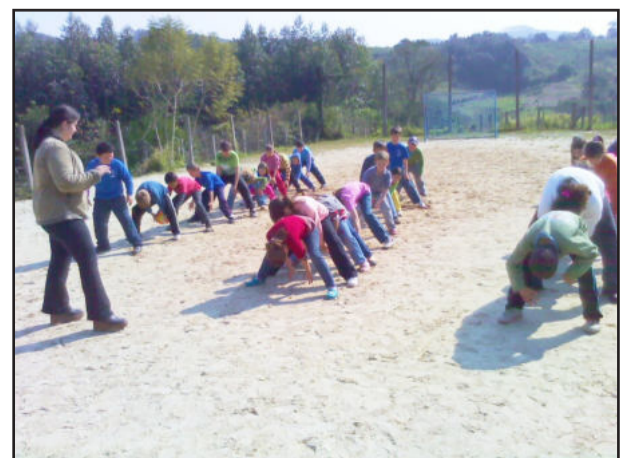
Atividades comemoraram do Dia do Estudante