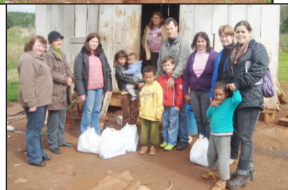
Famílias foram beneficiadas

Alunos, pais e representantes da Escola Municipal de Educação Infantil Casa da Criança e da Assistência Social de Paverama entregaram os cerca de 400 quilos de alimentos não-perecíveis à diversas famílias em situação de vulnerabilidade social. As doações foram recolhidas durante a primeira gincana em homenagem ao Dia dos Pais.