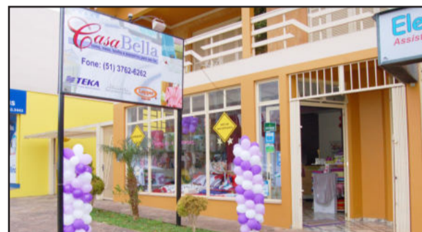
Loja localizada em Languiru, Teutônia