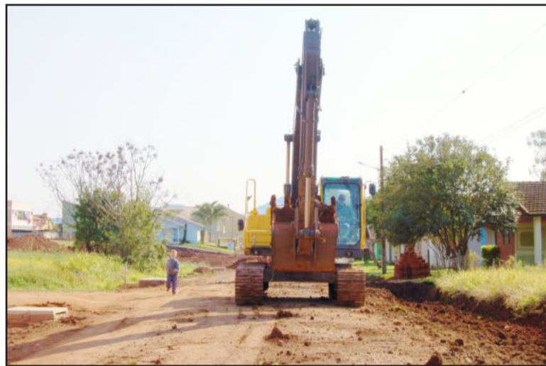
Rua está sendo preparada para o asfaltamento

O investimento total é de R$ 1.138.756,78. Deste total,