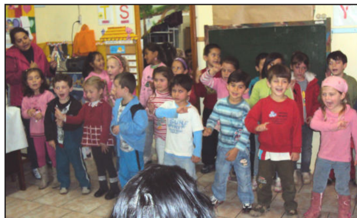
Alunos fazem apresentação para homenagear os pais