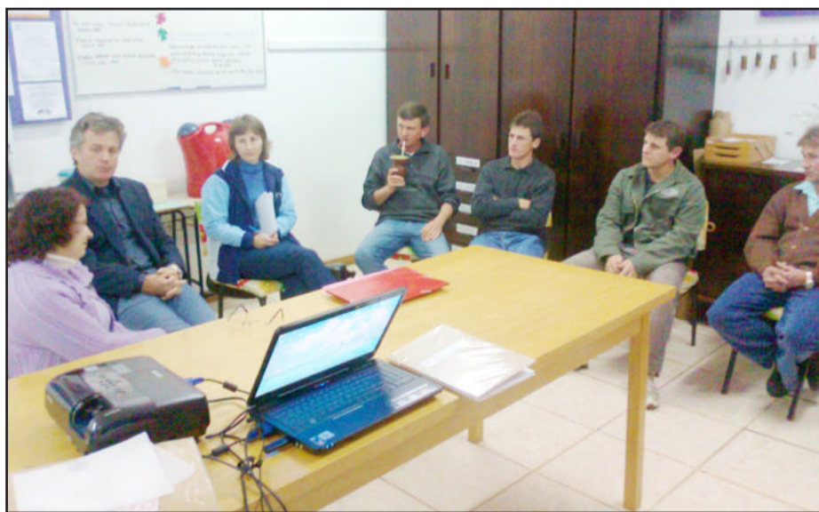
Em reunião com a comunidade, Administração projeta melhorias na Escola Alfredo Schneider