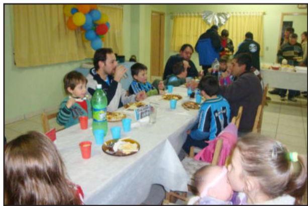
Pais em integração com os alunos