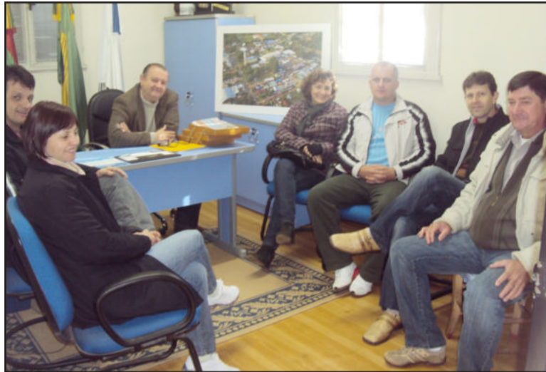
Membros da Administração Municipal da diretoria da CDL reunidos para planejamento da Campanha de incentivo ao comércio