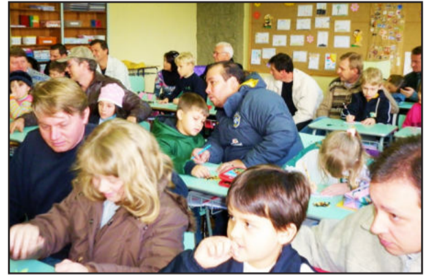
Pais participaram de atividades em sala de aula