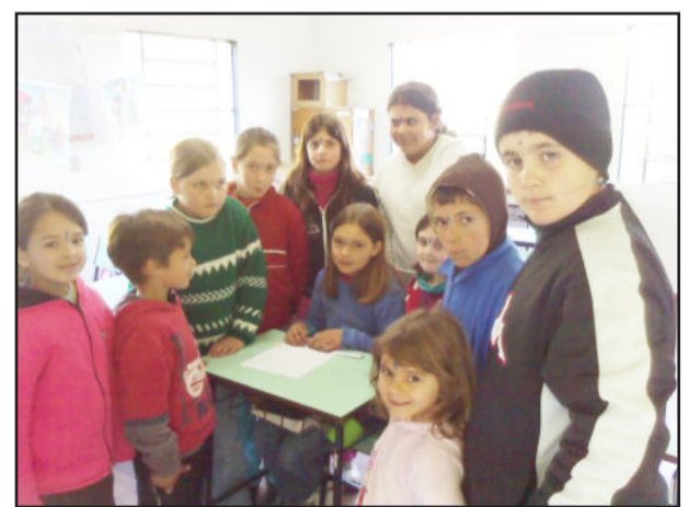
Gincana interna para os alunos

A Escola Municipal de Ensino Fundamental Professora Gonçalves Pinto Vilanova, da Cidade Baixa, por sua vez, realizou uma hora cívica em comemoração a data. Os professores leram mensagem e deram seus depoimentos em relação aos alunos. Na sequência, todos os estudantes da escola, divididos em três grupos, cantaram a música “É preciso saber viver”. Também foram confeccionados murais sobre o que é ser estudante, seus anseios e realizações.