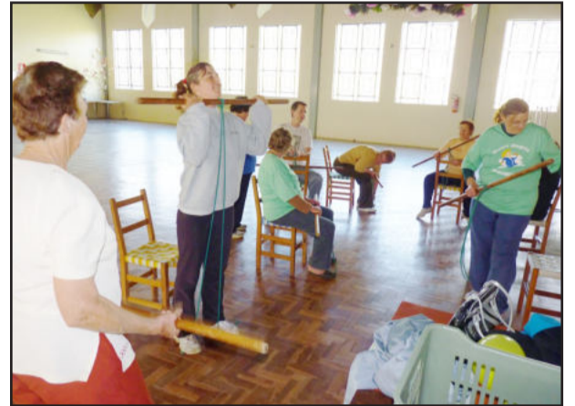
Grupo fez exercícios em Linha Frank

A localidade de Linha Frank conta com um grupo de atividades que se reúne semanalmente para se exercitar de maneira adequada, ou seja, sem forçar, mas ao mesmo tempo evitando que o corpo fique totalmente parado. A iniciativa é da Administração Municipal de Westfália, através do Departamento de Assistência Social.