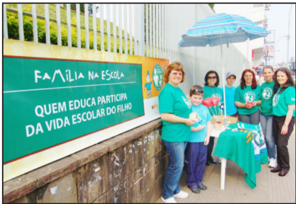
Alunos, pais, professores e funcionários de escolas unidos na ação Pedágio Educativo