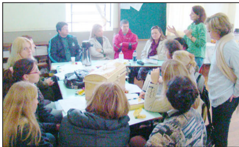
Professores realizaram atividades em grupo