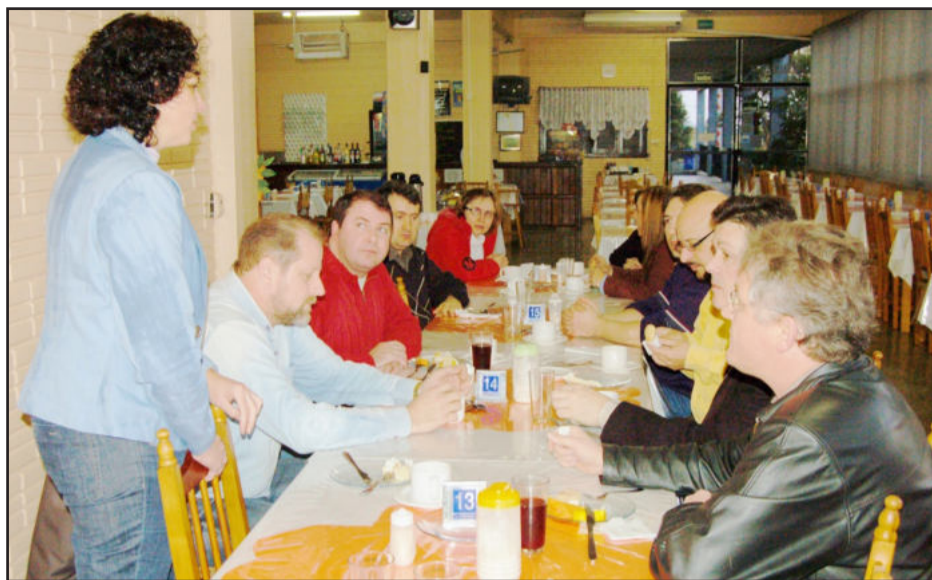
Café da manhã com médicos