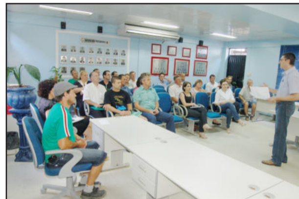
Reunião definiu a realização da campanha Teutônia Solidária

Teutoniense mostre ao Brasil o nosso espírito de solidariedade! Comunidade fará evento em favor das vítimas da catástrofe no Rio de Janeiro