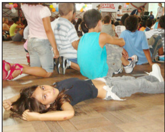
Crianças se jogam de corpo e alma no projeto Colônias de Férias

A edição 2011 do projeto movimentará cerca de 200 alunos com idade entre 06 e 14 anos, matriculados em escolas de Estrela. Os alunos participarão de atividades recreativas, educativas e esportivas, culminando com a visita ao Parque 5ª da Estância, em Viamão, no dia 10 de fevereiro.