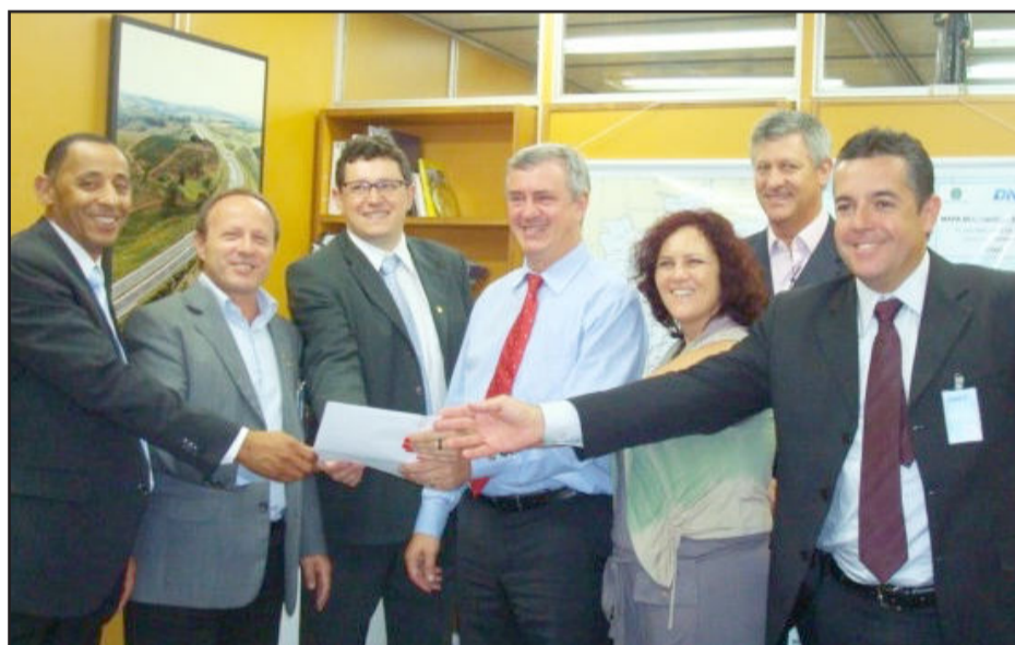
Caron (c) recebeu comitiva em Brasília para tratar de duplicar BR-386 em Lajeado