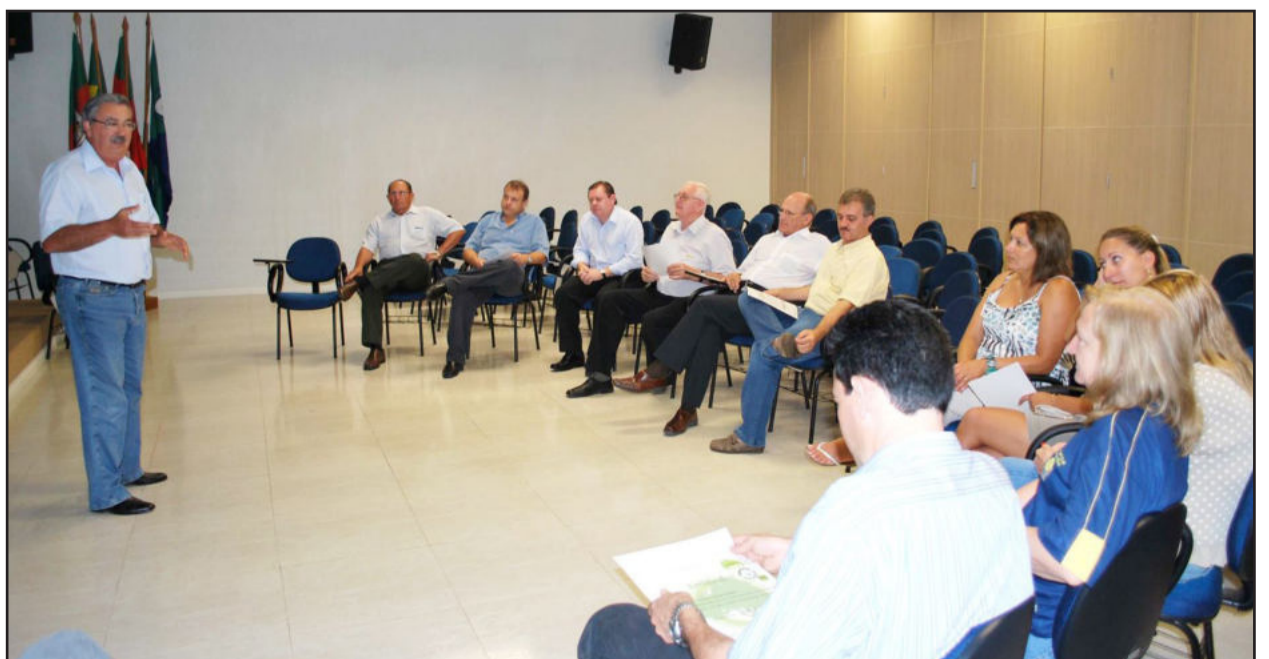
Hennemann diz que semente frutificará