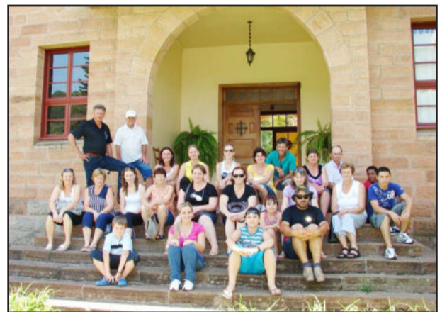
Convento São Boaventura, em Imigrante, integra o roteiro turístico