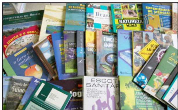
Novos livros acrescidos ao acervo da Sala Verde

Mais informações pelo telefone (51) 3981 1093, e-mail: salaverde@estrela-rs.com.br ou pelo blog: www.salaverdeestrela.blogspot.com, onde está a listagem dos livros.