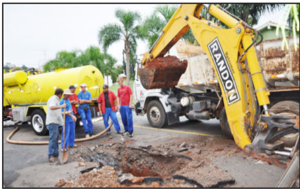
Servidores trocaram os três canos avariados que estavam ocasionando o vazamento

A Prefeitura de Lajeado realizou melhorias na Rua Felipe Craide, no Bairro São Cristóvão, nesta semana, onde trocou parte da canalização avariada que estava ocasionando vazamento de esgoto doméstico na via. O problema estava acontecendo nesta via, no trecho situado entre a Rua Coelho Neto e Avenida Senador Alberto Pasqualini, onde a Prefeitura havia realizado pavimentação para facilitar o acesso de portadores de deficiência e dificuldade de locomoção ao posto de saúde pela parte dos fun-