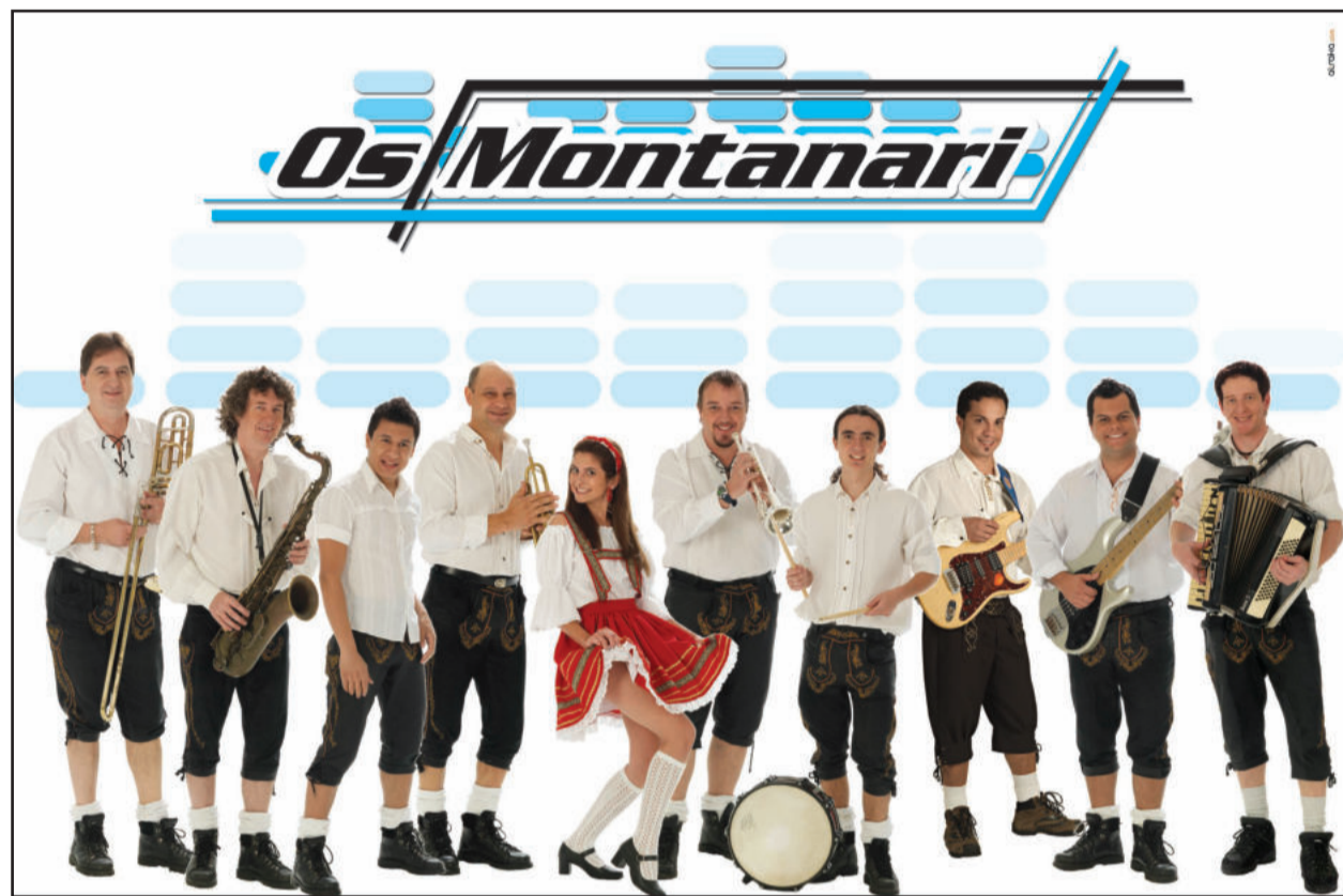
Os Montanari abrem o baile

C omeça hoje, na Sociedade de Assistência Social e Cultural Poço das Antas (Sascpa), aquele que é considerado o maior KerbFest do Estado. Para este ano a diretoria da entidade apostou em trazer devolta a orquestra Os Montanari, de Blumenau - Santa Catarina.