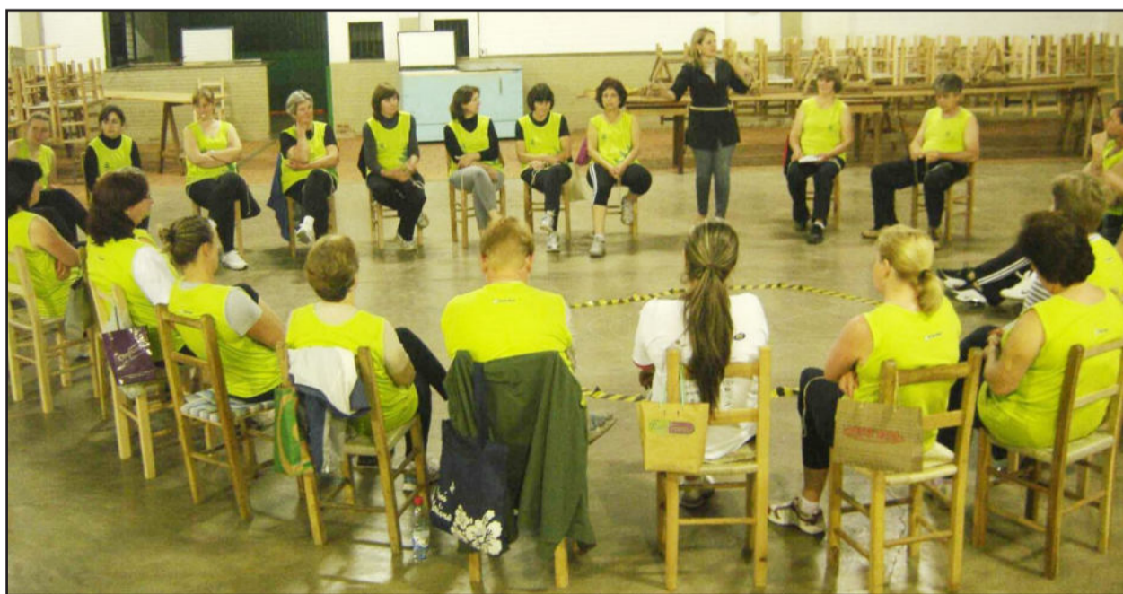
Psicóloga estimula a motivação dos grupos

> Teutônia: Quero prêmios o ano inteiro - Os consumidores que comprem em Teutônia já podem trocar as notas fiscais por cautelas para concorrer a prêmios em Teutônia. É a campanha "Teutônia: quero prêmios o ano inteiro". A cada R$ 50,00 em nota ou cupom fiscal você recebe uma cautela. Cada R$ 100,00 em produção primária também dá direito a uma cautela. As cautelas podem ser trocadas nas capatazias de Canabarro e Teutônia, Centro Cultural 25 de Julho em Languiru e sala 10 da Prefeitura, no setor de ICMS. Serão sorteados três televisores LCD 32 polegadas e uma motocicleta 125cc zero quilômetro. Os sorteios serão nos dias 28 de fevereiro, 29 de abril, 30 de junho e 31 de agosto. A promoção é da administração municipal de Teutônia com apoio do Programa de Educação Fiscal.