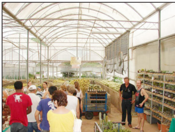
Cactário Horst de Imigrante também contempla o roteiro

nossos municípios vizinhos os quais também convido para outros conhecerem. Certamente, observamos muitas coisas positivas que também iremos avaliar, para quem sabe, também inserirmos em nossa Rota Germânica. Cada vez mais o turismo, em nossa região, vem se destacando e recebendo incrementos em sua infraestrutura e logística, o que de fato já é comprovado pelo grande número de turistas que recebemos nos últimos dois anos. A nossa região é rica em atrativos turísticos e culturais. Se continuarmos apostando e incrementando as ações turísticas, certamente um dia poderemos usufruir de uma estrutura semelhante a da Serra gaúcha”.