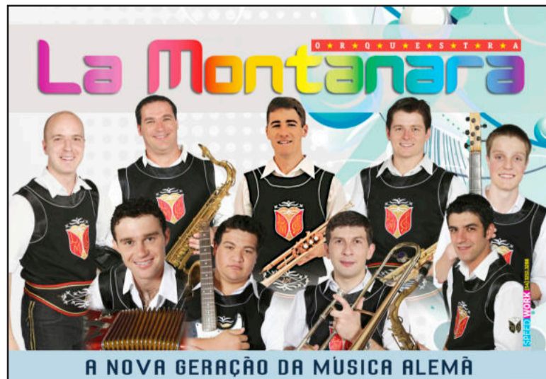
La Montanara toca hoje

A Paróquia São Pedro Apóstolo de Poço das Antas terá horários especiais para as missas que comemorarão os Kerbs da comunidade. Hoje a missa será realizada às 21h. Amanhã, domingo, a missa acontece às 8h30min. Ambas na igreja matriz.