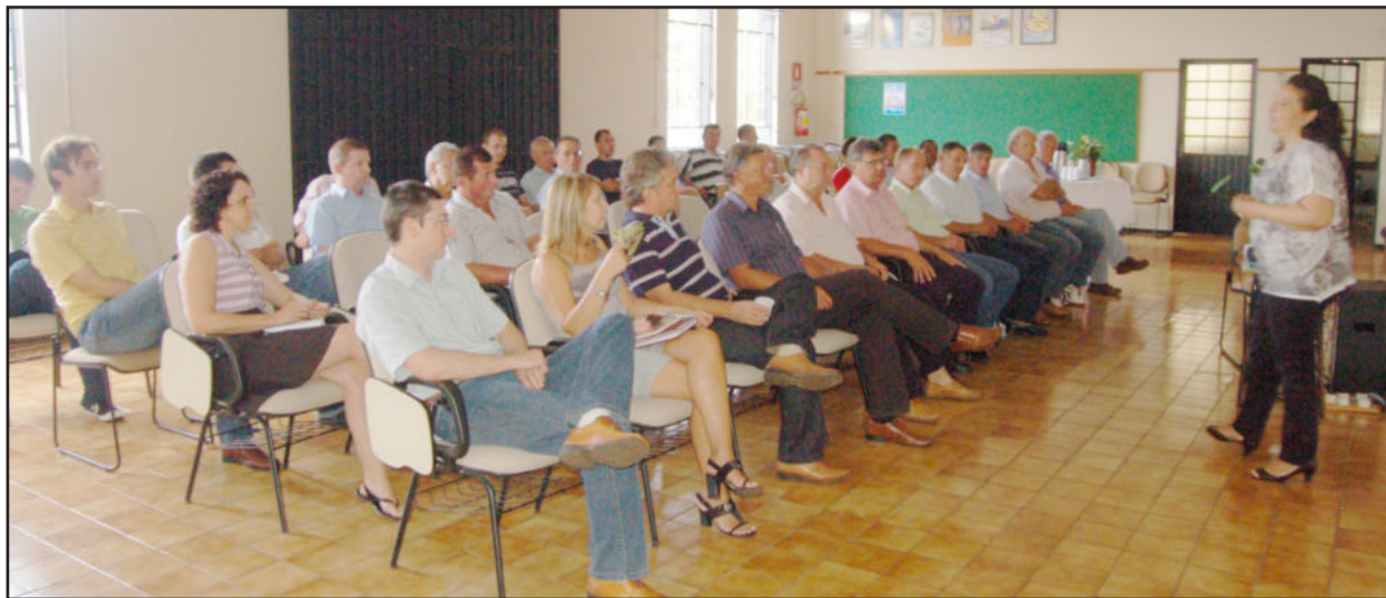
Apresentação do serviço Salvar Samu ocorreu nesta quinta para municípios da base de Teutônia

Veículo e profissionais devem entrar em ação na próxima semana