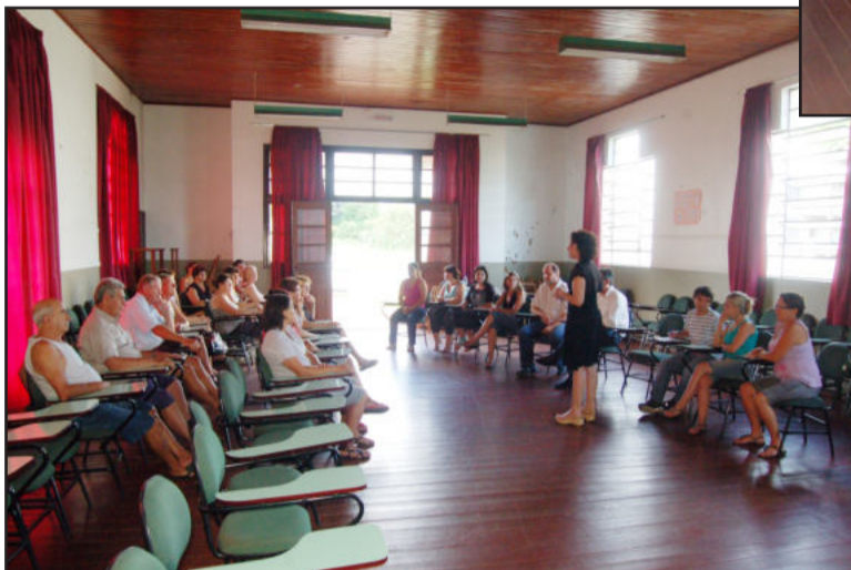
Em encontros com as comunidades, Secretaria de Saúde apresenta implantação do ESF para a população