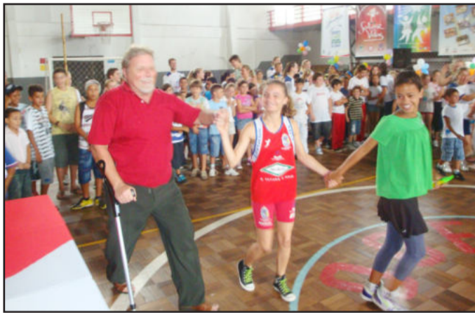
Prefeito Celso Brönstrup (e) entrou no embalo da alegria das crianças na abertura do projeto Colônia de Férias