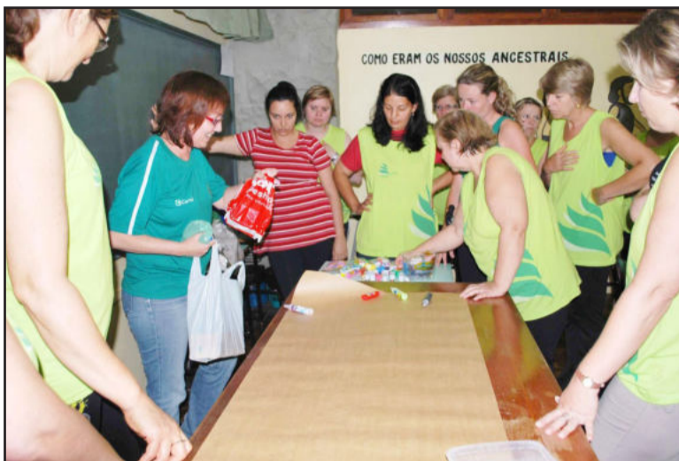
Trabalho com a assistente social

O Peso Leve tem equipe multidisciplinar formada por nutricionista, professores de educação física, psicóloga, assistente social e fisioterapeutas. Desde o segundo semestre de 2003, em quinze edições, 2.823 participantes já conseguiram emagrecer 11.163 quilos. Em 2009, a importância do programa foi reconhecida pela Organização das Cooperativas Brasileiras (OCB), Serviço Nacional de Aprendizagem do Cooperativismo (Sescoop) e revista Globo Rural, que concederam à Certel Energia o Prêmio Cooperativa do Ano.