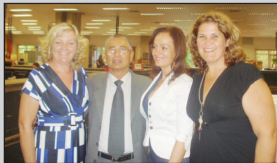
Encontro reuniu coordenadores da Educação