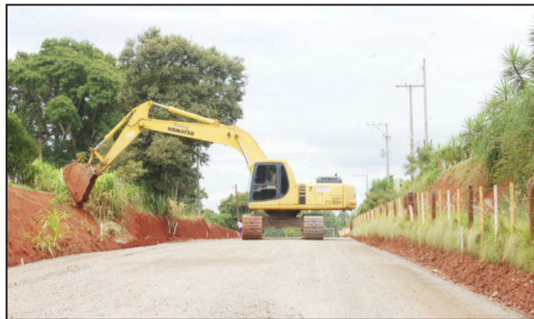
Obra em Posses avança em ritmo acelerado

A administração municipal de Teutônia já licitou mais uma obra estratégica e histórica, que é a pavimentação asfáltica da Estrada Geral de Posses, desde a ponte sobre o arroio até o entroncamento com a RS-128 (Via Láctea), área pertencente ao interior (zona rural) do Município. A empresa vencedora da licitação, Compasul, começou os trabalhos na segunda semana de janeiro e mantém ritmo intenso.