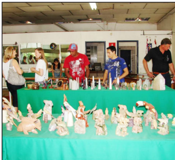
Grupo em visita a Coopedras, em Estrela