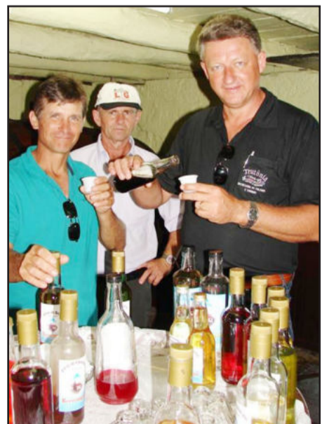
Degustação de licores junto ao Alambique Berwanger, em Estrela