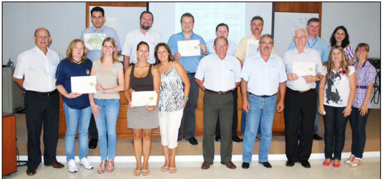
Empresários apostam na preservação ambiental