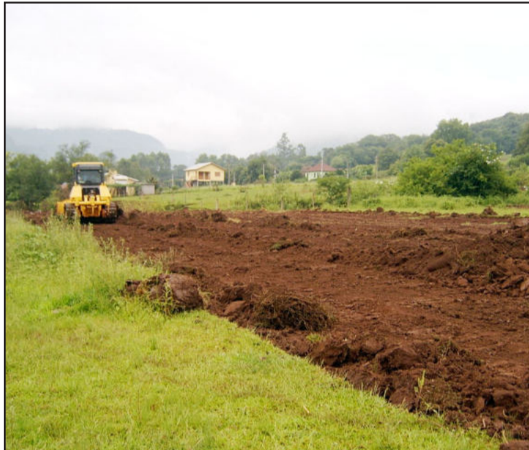
Avenida Enio Grave está sendo aberta para, durante a festa, receber estandes e estacionamento