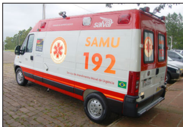
Ambulância Salvar Samu ficará junto aos Bombeiros de Teutônia

Servem de apoio aos serviços da Samu: a Brigada Militar, a Polícia Civil, os Bombeiros, a Polícia Federal, equipes de resgate, Defesa Civil e ambulâncias dos Municípios.