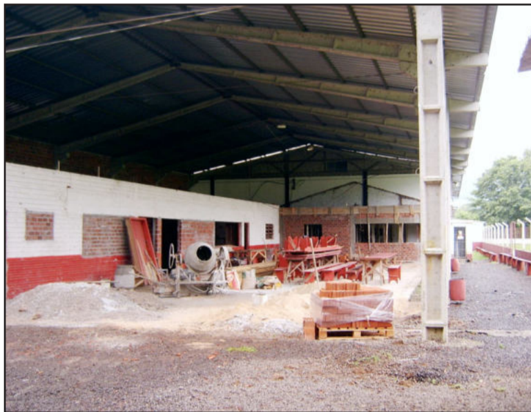
Ginásio do Flamengo está sendo ampliado

Durante o evento, explica Bagatini, boa parte da estrutura do Flamengo abrigará as exposições industriais, comerciais e agropecuárias, além de estacionamento. A cidade ainda deve receber uma limpeza e pintura especial, para receber bem os visitantes. Hoje, faltam 61 dias para a Westfália em Festa.