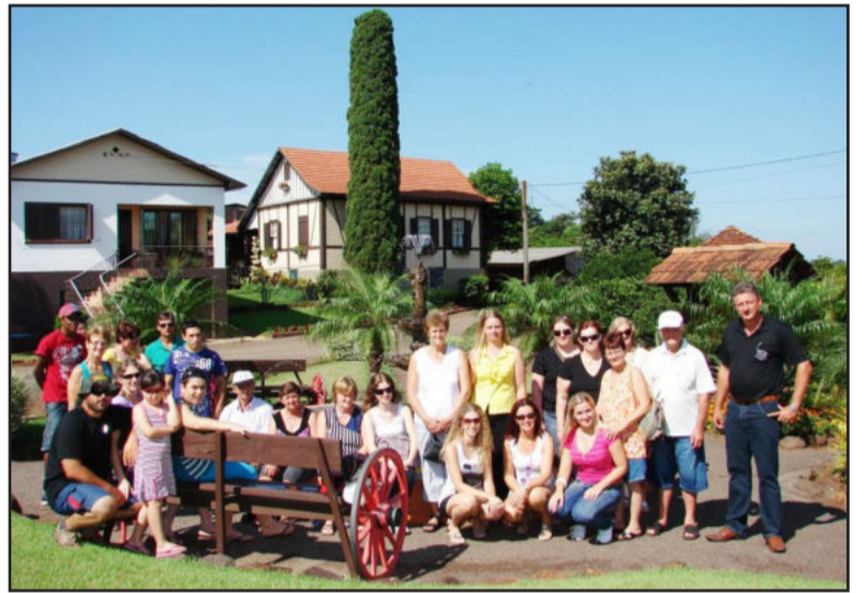
Comitiva teutoniense conheceu os atrativos da rota Delícias da Colônia