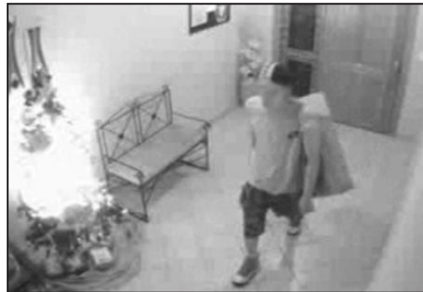
Homem entrou sem arrombar a porta

Um ladrão entra pela porta da frente como se estivesse chegando em casa. É isso que mostram as imagens do sistema de monitoramento de um prédio no Centro de Carlos Barbosa. No vídeo é possível ver que o ladrão abre a porta sem arrombá-la. De acordo com a Polícia, ele teria usado a chamada "chave micha".