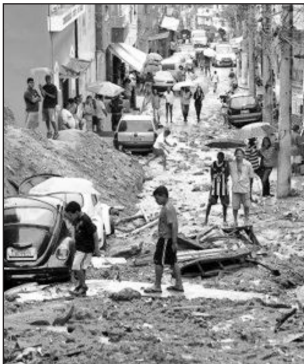
Chuvas causaram destruição

As doações continuam sendo recolhidas até a próxima semana. Em Garibaldi podem ser realizadas no Centro Administrativo Municipal e em Carlos Barbosa no salão paroquial ou na Igreja Adventista. A solidariedade de todos é muito importante.