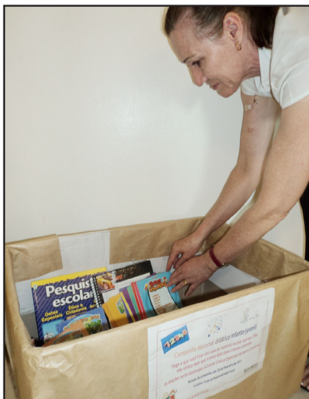
Material escolar está sendo arrecadado