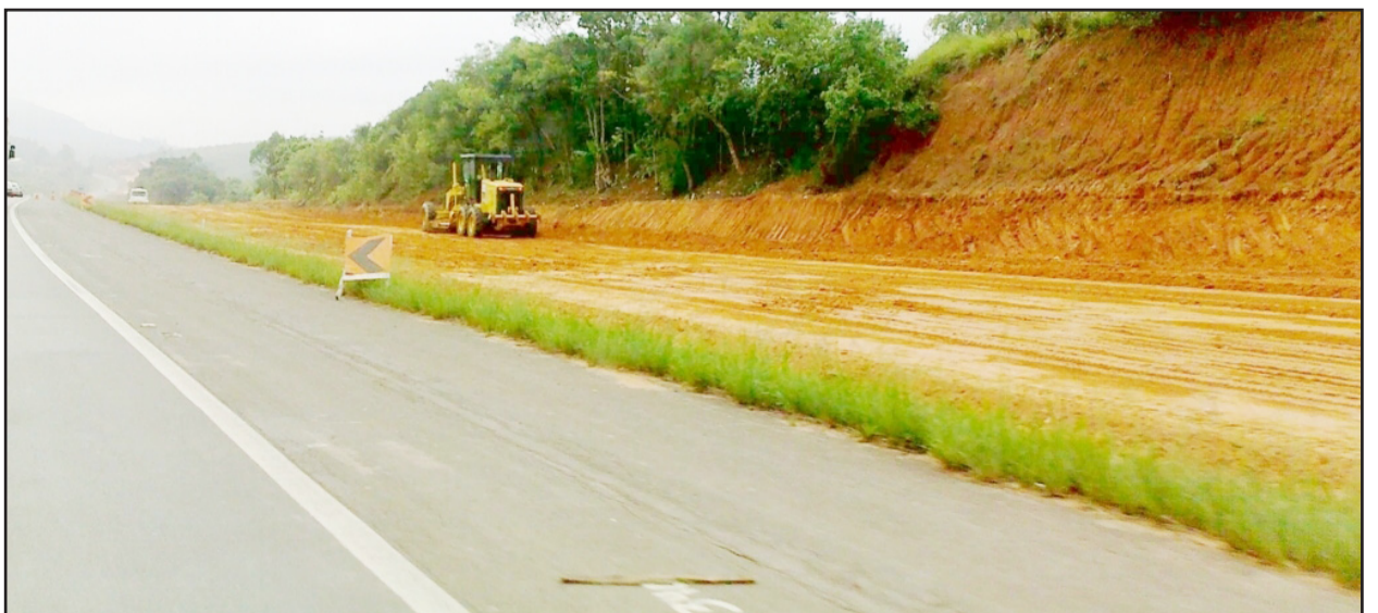
Máquinas trabalham em diferentes frentes na duplicação da BR-386