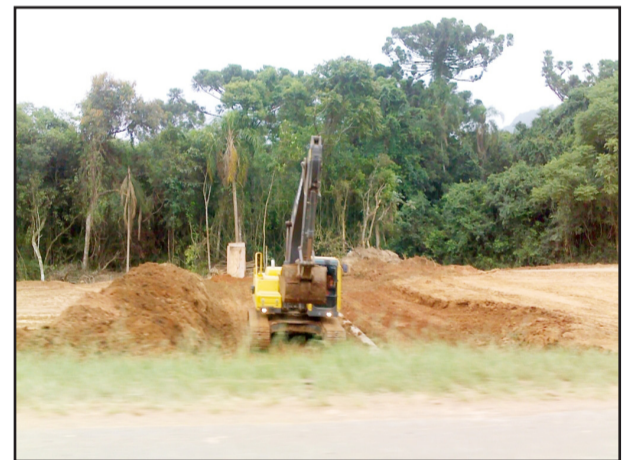
Máquinas trabalham na construção de galerias e canalização sob a futura duplicação