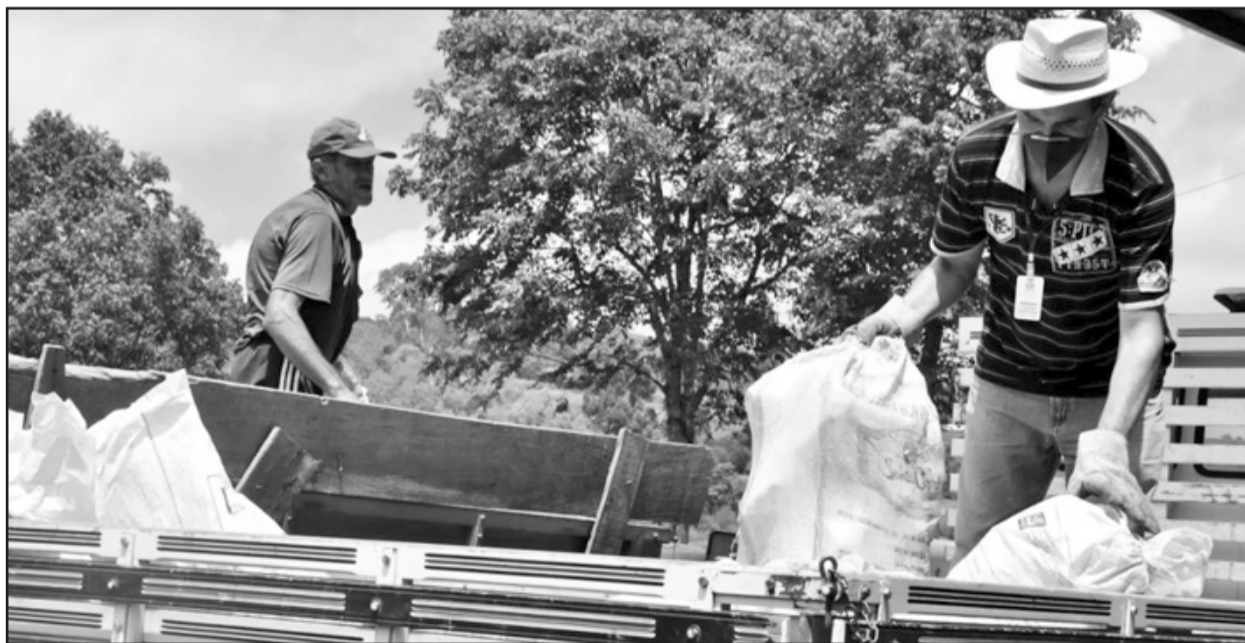
Coleta de embalagens de agrotóxicos visa destino correto

Ao todo, em seis dias de recolhimento feito diretamente nas localidades, foram entregues por 224 produtores, 6.557 embalagens de agrotóxicos tríplice lavadas além e 1.120 sacos de 1 quilo. A devolução das embalagens, devidamente higienizadas pela tríplice lavagem, na unidade de recebimento indicada pelo