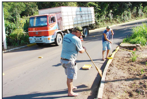
Trânsito na Rua Alfredo Drimeier é intenso durante todo o dia