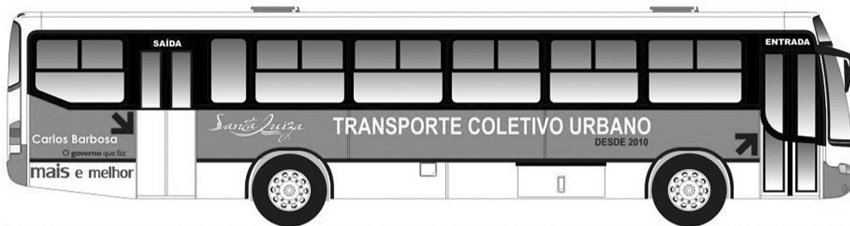
Modelo do ônibus que fará o transporte coletivo urbano

A partir do dia 17 de março, a população de Carlos Barbosa começa a viver uma nova realidade com o início de funcionamento do transporte coletivo urbano. Nesse dia estarão circulando dois ônibus para realizar o itinerário programado.