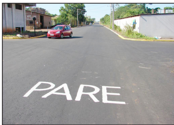
Reforço na sinalização da Rua 2 Leste é para alertar ainda mais os motoristas