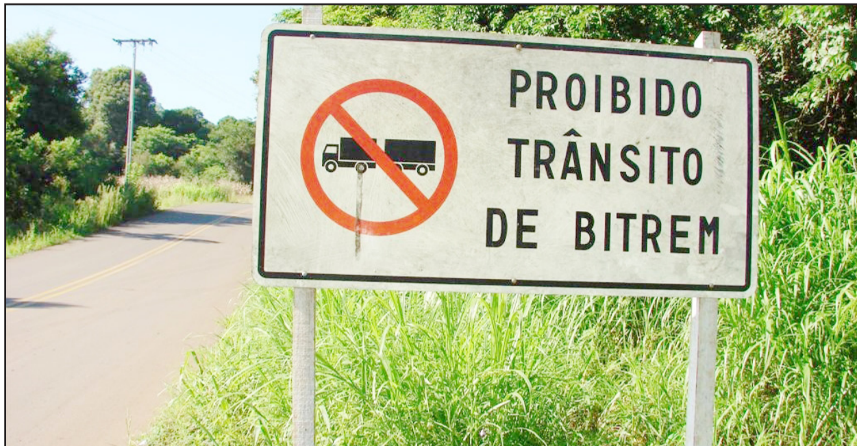
Muitos motoristas simplesmente ignoram a proibição da placa no início da Rua Alfredo Drimeier próximo à Rota do Sol

N os últimos dias, várias ruas do Município de Teutônia recebem melhorias na sinalização, com a colocação de tachões, pintura de cordões, repintura de letreiros na pista, pintura de lombadas físicas (quebra-molas), entre outros. O objetivo é proporcionar mais segurança a motoristas e pedestres que transitam pelos locais.