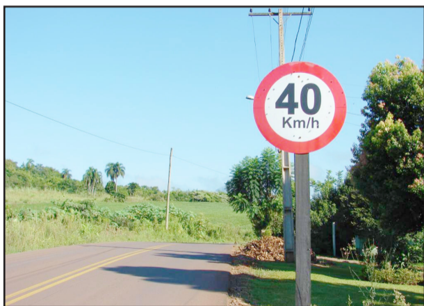
Limite de velocidade na extensão da Rua Alfredo Drimeier é de 40Km/h

O trânsito de bitrens, por exemplo, é proibido no asfalto entre o Bairro Teutônia e o trevo para a Linha Harmonia, porém a placa simplesmente é ignorada por vários motoristas, danificando o asfalto. O intenso tráfego no local já começa a causar avarias no asfalto. Atentos a isso, fiscalizações de rotina serão realizadas neste trajeto e em outros pontos do Município, cabendo aos infratores as penalidades cabíveis segundo a lei.