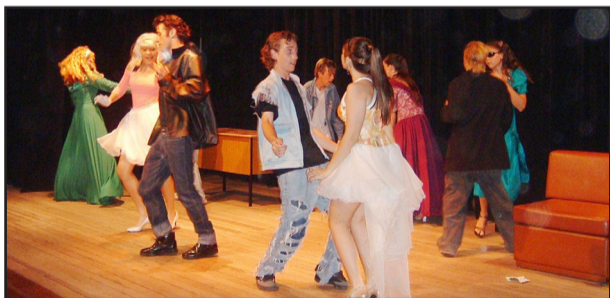
Oficinas de teatro iniciam em março