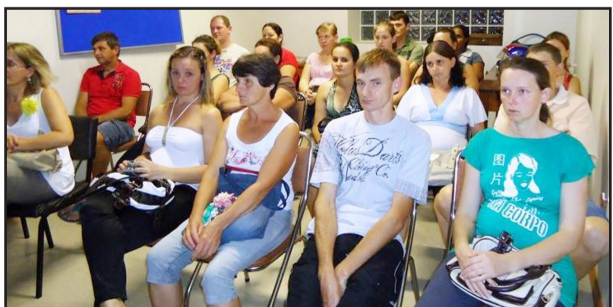
Gestantes em visita ao Hospital Estrela

Na ocasião, as gestantes, que recebem acompanhamento durante toda gestação em Colinas, puderam conhecer o hospital onde provavelmente darão à luz a seus filhos e, principalmente, receberam orientações referentes à gestação e ao parto.