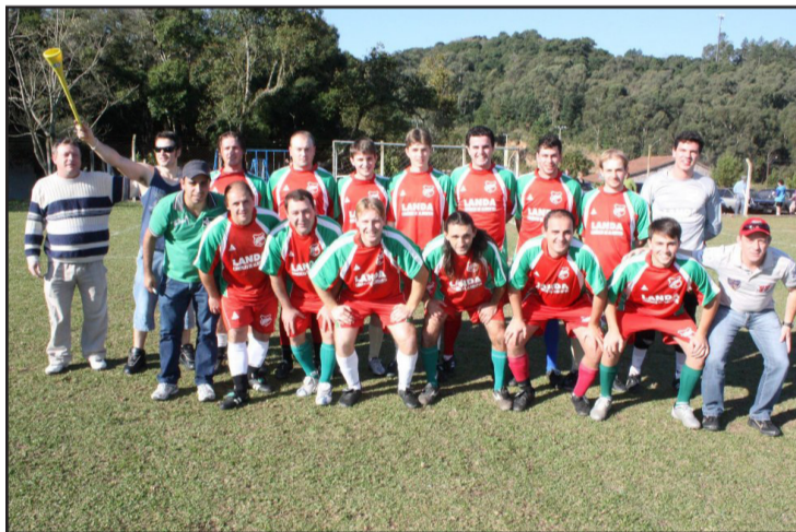
São Roque: equipe bicampeã (2009 e 2010)

No dia 10 de março, às 19h30min, na Sala de Reuniões do Centro Administrativo Municipal, haverá a reunião de instalação do campeonato. A atual bicampeã da competição, que teve início em 2009, é a equipe de São Roque.