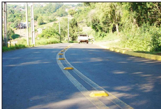
Tachões na pista da Rua Alfredo Drimeier auxiliam a evitar ultrapassagens no local