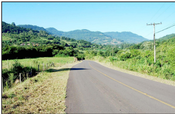
Roçadas deixaram rodovias limpas nas laterais

Outra atividade realizada em fevereiro pela Secretaria de Obras, e que inclusive, recebeu elogios de alguns vereadores na Tribuna da Câmara, foram as roçadas nas laterais das rodovias asfaltadas, nos sen-