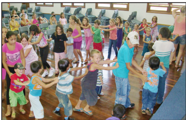
Evento teve brincadeiras com as crianças

Sem dúvida, os esforços dos colaboradores não foram em vão e trouxeram à sociedade um bem valioso, que são os valores como a bondade, a generosidade, a compaixão, e também a importância do conhecimento. Um simples gesto de generosidade pode desencadear uma grande mudança em uma localidade.