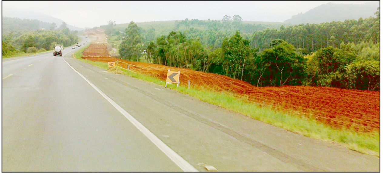
Obras da BR-386 avançam e já permitem imaginar como ficará a duplicação

O consórcio de empresas que venceu a licitação para executar a duplicação da BR-386, no trecho entre Tabaí e Estrela, trabalha sem parar. Nem mesmo sábado foi dia de folga e várias equipes, em diferentes pontos do trecho, trabalhavam com máquinas e equipamentos para evoluir.