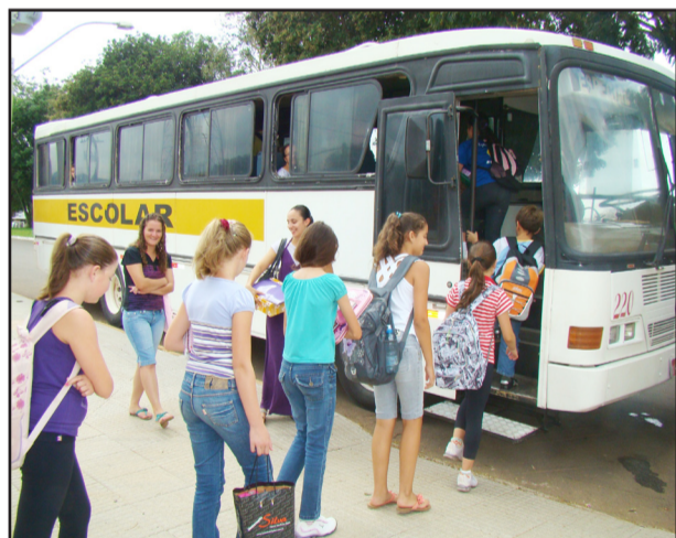
Alunos têm transporte escolar nos turnos manhã, tarde e noite

A administração municipal de Fazenda Vilanova realiza o transporte escolar dos alunos nos turnos manhã, tarde e noite, inclusive para a escola estadual.