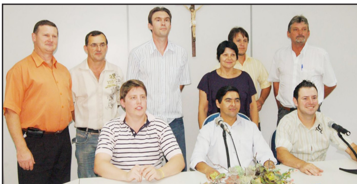
Câmara retoma trabalhos dia 24

Os vereadores de Teutônia voltarão às atividades ordinárias na noite desta quinta-feira, dia 24 de fevereiro, a partir das 18h30min, quando se realiza a primeira sessão ordinária do ano 2011. Com a mudança no Regimento Interno, aprovada em 2010, os edis recomeçam as sessões em fevereiro.