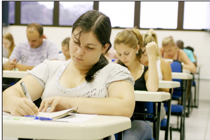
Processo seletivo foi composto de três propostas de redação

A segunda proposta exigia a elaboração de uma crônica, na qual o candidato deveria contar a sua visão sobre o índio no Brasil, tomando por base a presença indígena em textos históricos, textos literários, imagens em pinturas ou utilizando as suas experiências pessoais de contato com os povos indígenas. Já a terceira e última proposta solicitava um texto do tipo disserta-