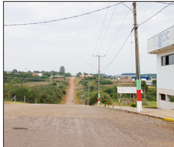
Avenida 1 Oeste antes da pavimentação

Barracão (incubadora) Industrial; o capeamento e construção de calçadas na Rua Carlos Arnt em Canabarro (Mobilidade urbana); a compra de uma carregadeira para reforçar o Parque de Máquinas; entre outros encaminhados e em via de tramitação”, citou Altmann.