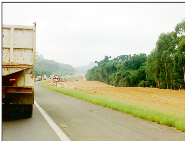
Em alguns trechos o trânsito é parado para a continuidade das obras

Outra obra que avança a “todo vapor” é a BR-448, a conhecida Rodovia do Parque, interligando a BR-386 (Tabaí-Canoas) até a BR-290 (Presidente Castelo Branco), próximo ao Bairro Humaitá, em Porto Alegre. Na última semana, a empreiteira trancou uma das pistas da BR-386 para instalar, sobre esta, a estrutura pré-moldada que sustentará o viaduto da futura Rodovia do Parque. A BR-448 pretende retirar, sem a necessidade de pedágio, 50 mil dos 120 mil veículos que transitam diariamente pela BR-116 entre Canoas e Porto Alegre. A previsão de entrega é para janeiro de 2012.