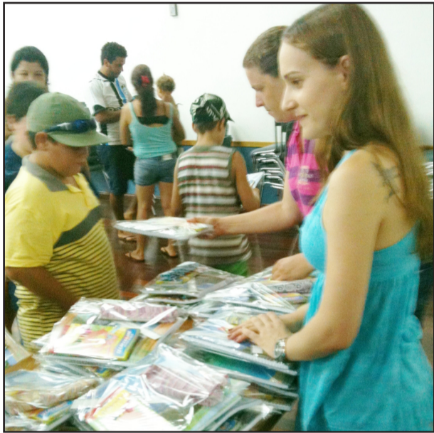
Material escolar foi entregue no sábado

No dia 18 de dezembro de 2010, a Comunidade Cristã de Canabarro, em parceria com a Atitude Modas, realizou um brechó beneficente, com roupas em bom estado, para arrecadar fundos para a compra de materiais escolares que seriam doados a crianças com menos condições financeiras da cidade de Teutônia. A igreja toda se mobilizou para arrecadação de roupas em ótimo estado, juntamente com o apoio de Carlos Campos, dono da loja Atitude Modas de Canabarro, que colaborou na disponibilização de peças de roupa e acessórios para que o brechó acontecesse com sucesso. Através da arrecadação de renda no brechó, foi possível adquirir um kit com um caderno, uma caixa com 12 lápis de cor, um estojo, um lápis, uma caneta, uma borracha e um apontador para cada criança. Foram também doadas réguas pela serigrafia El Shaddai.