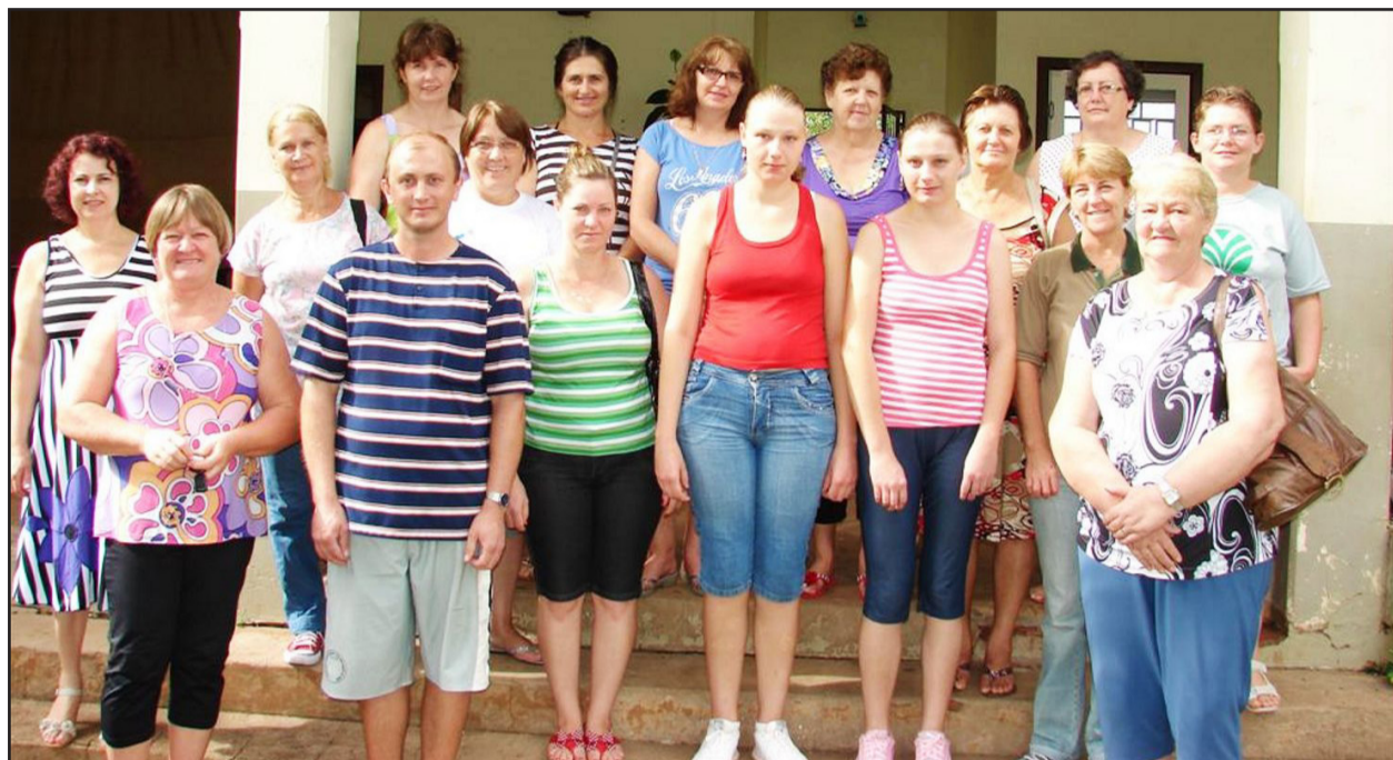
Curso de informática ocorre junto à Escola Municipal Dom Pedro I de Linha Clara