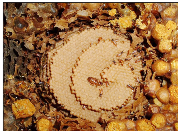
Colmeia de abelha sem ferrão