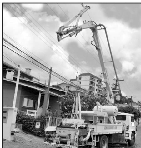
Equipamento encostou na rede elétrica e provocou o choque

Caso ela não estiver respirando, iniciar imediatamente uma técnica de respiração artificial (boca a boca). Se não tiver pulso, além de respiração boca a boca, realizar massagem cardíaca externa (dois socorristas) ou 15 compressões do coração seguidas de quatro insuflações de ar (um socorrista).