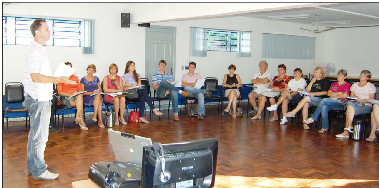
Professor Charles (e) conclamou para o trabalho em equipe

O ano letivo, em Imigrante, iniciou na quarta-feira de forma motivadora. A Administração Municipal, por intermédio da Secretaria Municipal de Educação, realizou uma programação especial para equipes diretivas, professores e funcionários de escolas municipais. Direção e professores da Escola Estadual 25 de Maio, também participaram do encontro realizado na Escola Santo Antônio, nos dias 16 e 17. As aulas iniciaram nesta segunda-feira, dia 21.