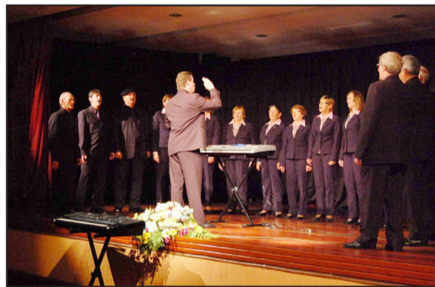
Coral Municipal de Imigrante