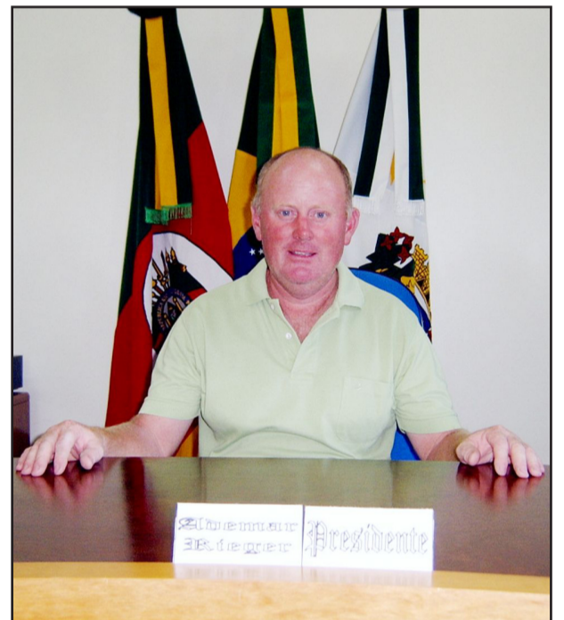
Vereador Ademar Rieger

continuar lutando por outra necessidade da comunidade, que é o fornecimento de energia elétrica. O problema já se estende há bastante tempo e vem deixando os moradores de Colinas horas sem poder contar com o serviço. "Os produtores são muito prejudicados. Tentamos de todas as formas resolver, mas não obtemos resposta da empresa responsável", complementou ele, ressaltando que não se trata de falta de iniciativa dos políticos da cidade.