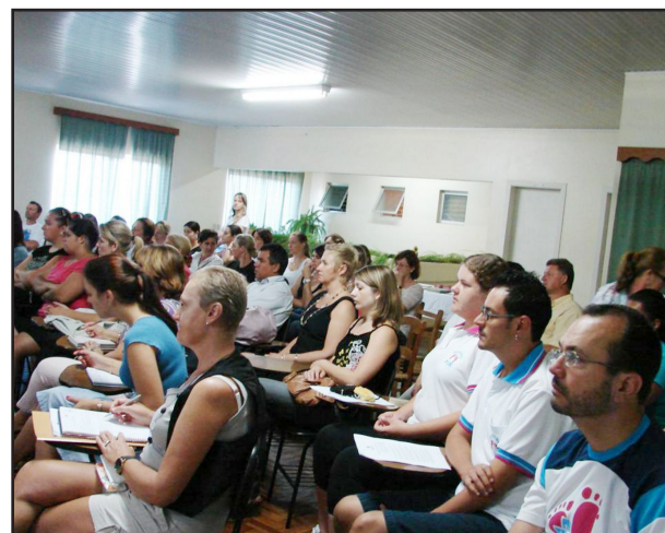
Palestra aconteceu junto à Sede do STR em Languiru