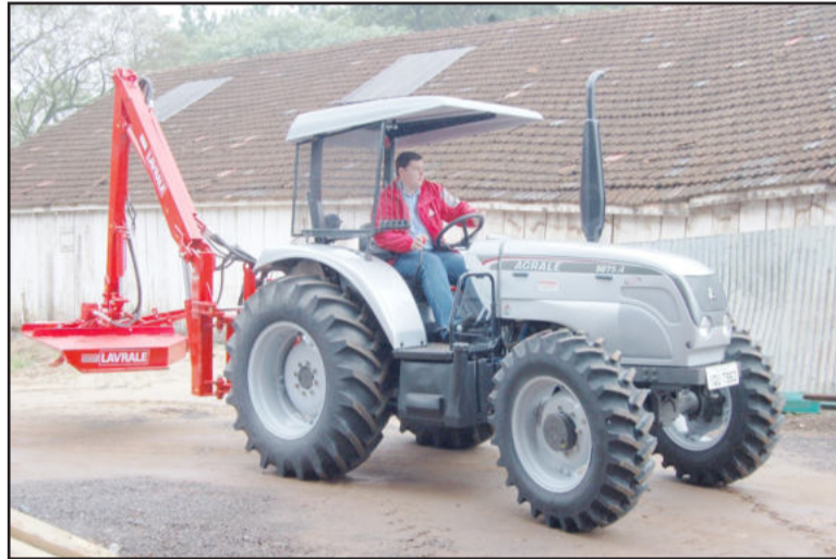
Trator com roçadeira hidráulica

A Prefeitura investiu, com recursos próprios, R$ 72 mil para a compra do trator agrícola da marca Agrale e mais R$ 37,5 mil na roçadeira hidráulica da marca Lavrale. No total, são R$ 109,5 mil para beneficiar toda a comunidade, com a valorização e o embelezamento das ruas e estradas.