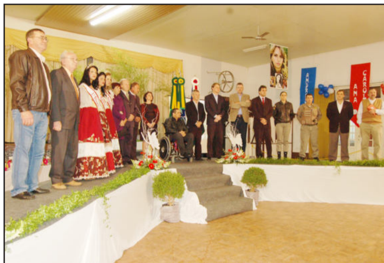
Abertura da Transcitrus Fest foi ontem à noite

Às 20h iniciou o processo de escolha das novas soberanas de Poço das Antas, onde 8 candidatas concorreram ao título. Elas passaram por um coquetel, com entrevista, no auditório da Prefeitura. Às 22h houve o desfile das candidatas, que propiciou aos jurados avaliar todos os quesitos