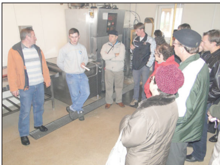
Explicações na fábrica de embutidos