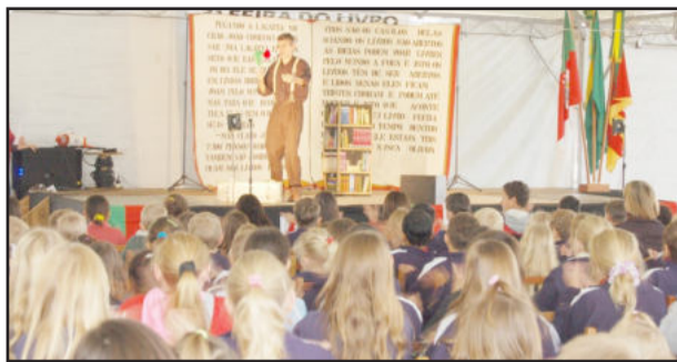
Autor Eric Chartiot deixou os estudantes fascinados e ficou encantado com interação