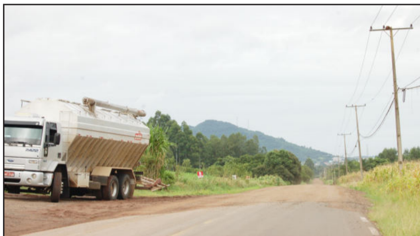
Trecho que falta ser pavimentado

O Daer vem desenvolvendo um programa que prevê atender em torno de 150 municípios, resolvendo problemas locais e municipais de construção e recuperação de vias e pontes, dentre outros. "Através deste projeto que fomos contemplados, o repasse é encaminhado diretamente aos municípios e a licitação se torna mais rápida, inclusive com um custo menor. Isso vem ao encontro das necessidades das cidades", comentou. Serão pavimentados cerca de 1.400 metros, no trecho entre Westfália e Teutônia. "Muita gente não entendeu porque fizemos o asfalto no Esperança, de Berlim Fundos, mas era a única comunidade do interior que não tinha acesso asfáltico, ao invés de fazer do Centro