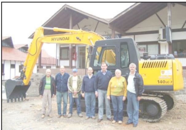
Entrega em frente ao Centro Administrativo para integrantes da Administração Municipal, secretários, presidente do Sindicato e membros do Conselho da Agricultura

Na ocasião também foram entregues equipamentos que passarão a integrar a patrulha agrícola, sendo uma pluma agrícola, um enleirador e uma grade niveladora nova com 28 discos, cuja aquisição foi decidida pelos agricultores dentro do Conselho Municipal de Desenvolvimento Rural De Colinas. Os recursos são oriundos da Consulta Popular do Governo do Estado e contrapartida do município, totalizando R$ 23.294,00.