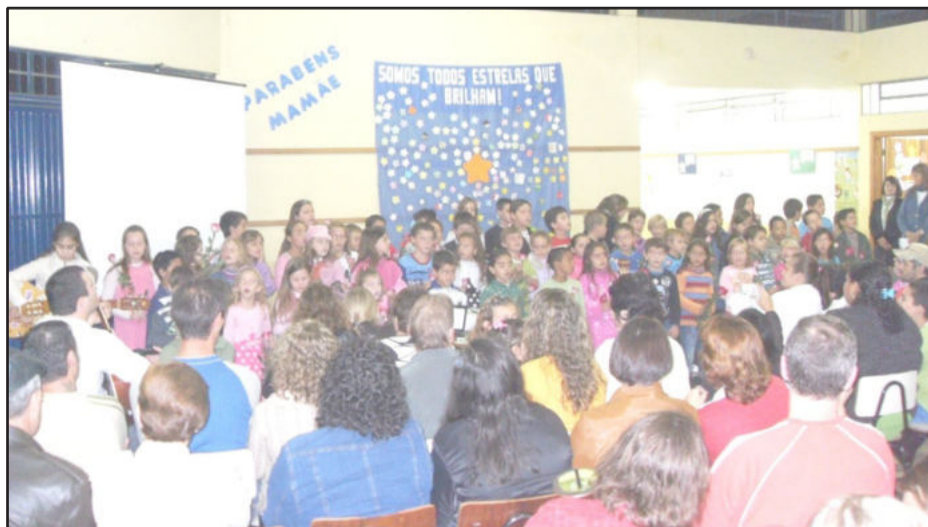
Bom público prestigiou as apresentações