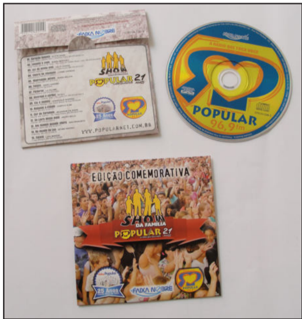
CD será lançado no Show da Família

O Show Da Família, da Rádio Popular FM, neste domingo, dia 23, na Transcitrus Fest, além de muitas atrações, também trará uma novidade. Na oportunidade, será lançado o CD comemorativo dos 21 anos da emissora. Um CD recheado com 15 músicas, que fazem sucesso na "Rádio que Toca Você" e são atrações que já participaram e ou que vão fazer parte do Show da Família nesta edição. Os ouvintes já poderão adquirir o produto no domingo.