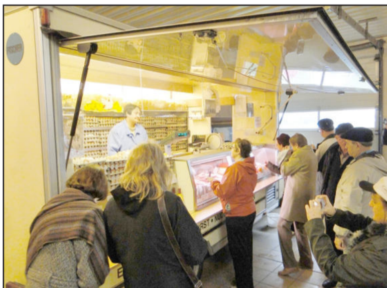
Trailer serve para vendas em casa e na cidade

renciado é o licor de ovo, vendido em garrafas.