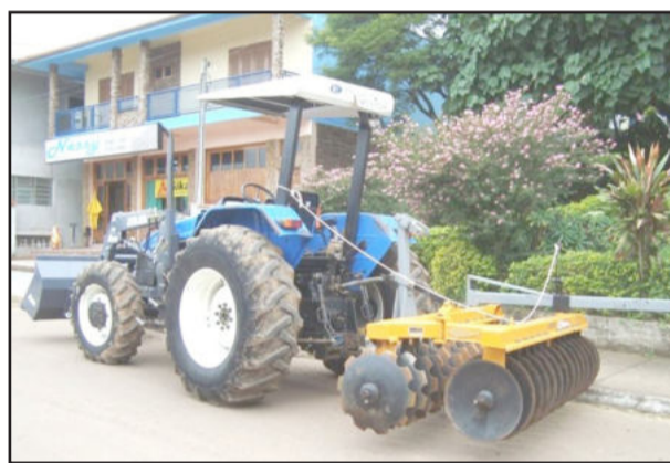
Várias máquinas novas em Colinas