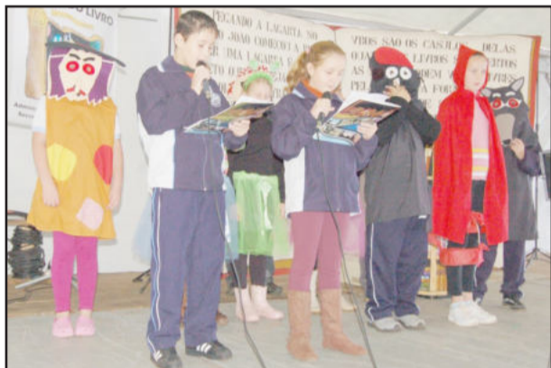
Alunos da Escola Alfredo Schneider trouxeram personagens infantis ao palco na abertura