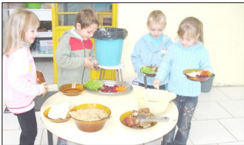
Alimentação saudável na infância

A Escola, ao oferecer ambientes diversificados e momentos desafiadores,