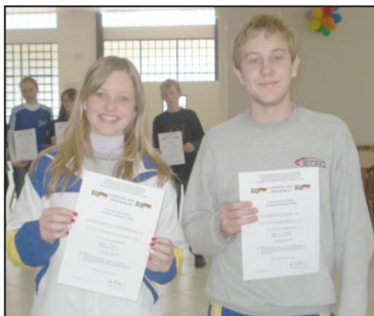
Alunos do Ieceg são destaques em alemão

O domínio de uma língua estrangeira já é uma grande conquista para quem busca um aperfeiçoamento no mercado de trabalho. Além de uma necessidade básica para quem almeja uma boa colocação em sua atividade profissional, também possibilita ao cidadão uma janela a mais, aberta para o mundo. O Instituto de Educação Cenequista General Canabarro (Ieceg) sempre foi destaque no ensino de línguas. Na língua alemã, o Ieceg foi reconhecido em setembro do ano passado como escola colaboradora da divulgação da língua e cultura alemã. A PASCH-Plakette, foi entregue ao Ieceg pelo cônsul da República Federal Alemã no Rio Grande do Sul.