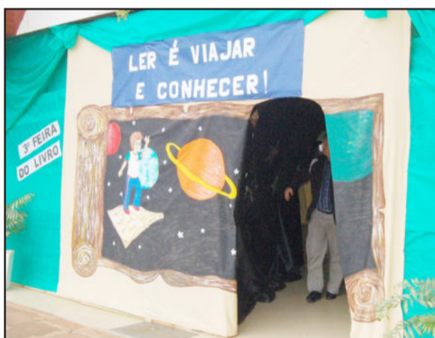
Espaço no Centro Cívico foi especialmente preparado para o evento