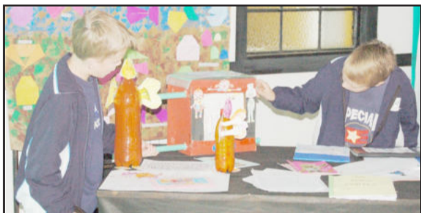
Mostra de trabalhos deixou estudantes curiosos