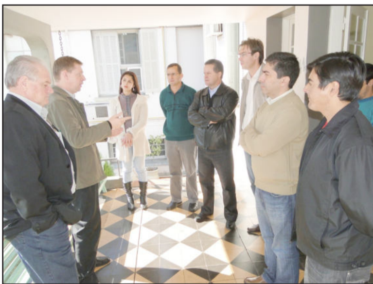
Grupo ouviu explicações sobre o hospital