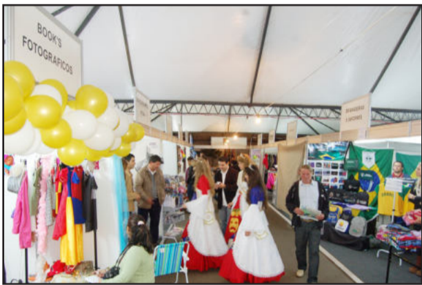
Visitação aos estandes está aberta