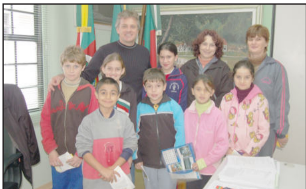
Alunos e professores com o prefeito

Um grupo de estudantes da Escola Especial Crisália, a Apae de Teutônia, visitaram o gabinete do prefeito de Teutônia na manhã desta quarta-feira, dia 19. Os alunos, acompanhados de professoras, fizeram um roteiro para conhecer o Centro Administrativo, dentro do cronograma de estudos, e tinham a curiosidade em saber onde trabalhava o chefe do Executivo. O prefeito Renato Airton Altmann recebeu-os no intervalo de suas audiências. Atualmente, a Apae atende cerca de 90 crianças com necessidades especiais.