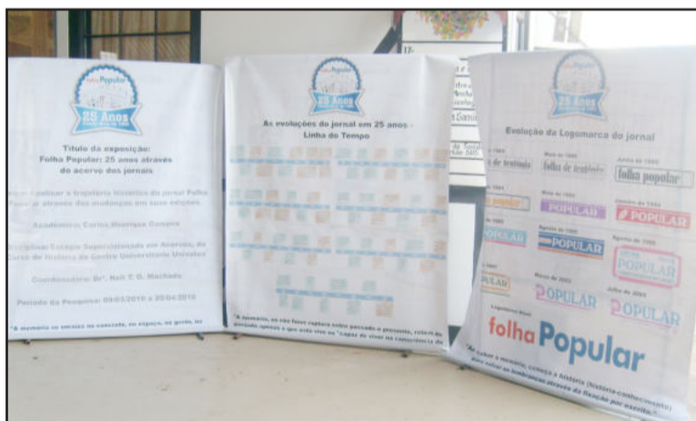
Exposição no 2º Feirão de Seminovos