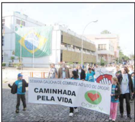
Caminhada pela Vida percorreu a Rua Júlio de Castilhos

Deverão ocorrer, nos próximos dias, as obras de construção de uma galeria pluvial na Rua Marechal Floriano Peixoto, na Barra do Forqueta. Com isso, será interditada a ponte de ferro, acesso antigo de Arroio do Meio a Lajeado. A via sofreu transformações em decorrência da enxurrada que fez vários estragos no Vale do Taquari em janeiro deste ano. A obra será executada com recursos pleiteados junto ao Daer, através de termo de transferência de recurso, proveniente do auxílio à enxurrada, no valor de R$ 90 mil.