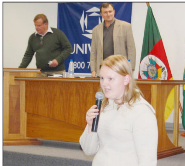
Júlia Engster disse que o evento foi de alto nível