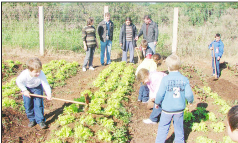
Hortas desenvolvem consciência agroecológica