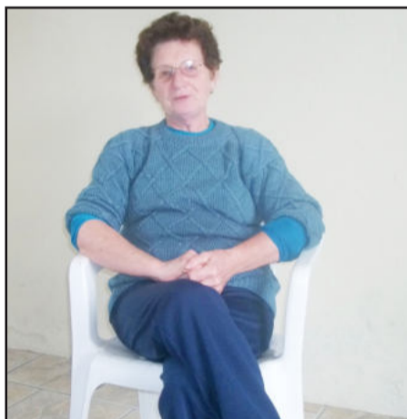
Voni convida idosos