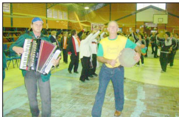
Bandinha animou a festa