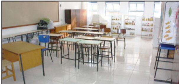
Novo piso no laboratório