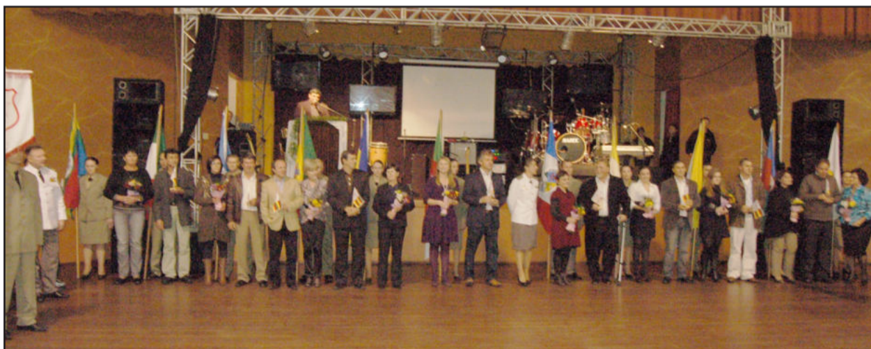
Bandeiras dos 11 Municípios foram apresentadas nas solenidades