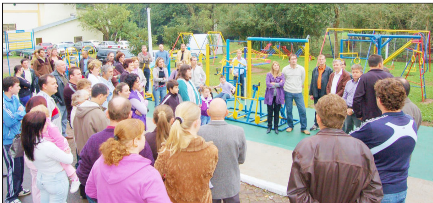
Inauguração da revitalização da praça do Bairro Boa Vista, no sábado