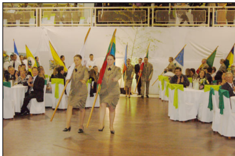
Bandeiras dos 11 Municípios foram apresentadas nas solenidades

Ainda houve sorteio de prêmios, apresentação da comenda para 2011 e animado baile pela Banda Ghermânia.