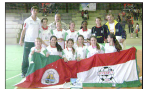
Sub-13 da Juventus levou o título da Copa Eletrosul de Futsal

No final da manhã de domingo, na chegada das equipes a Teutônia, houve muita festa, com direito a carreata pelos bairros teutonienses.