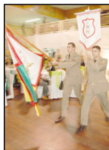
Soldados apresentam Flâmula e Escudo (d)