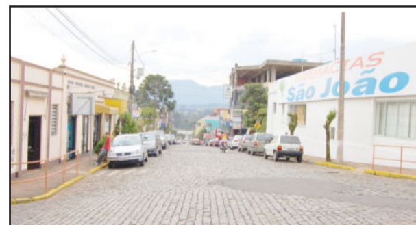
Rua 3 de Outubro em Languiru antes do capecimento asfáltico