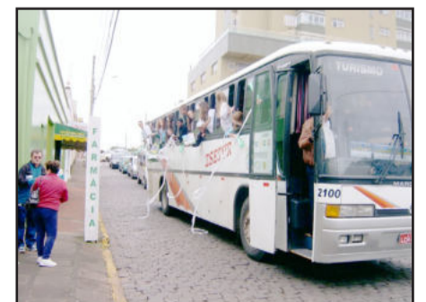
Carreata para comemorar as conquistas em Santa Catarina

Os integrantes da Juventus de Teutônia realizaram uma carreata pelo Município na manhã de domingo, dia 20, para comemorar a vitória das equipes femininas de Futsal Sub 13 e Sub 15. As meninas foram à cidade de Rio Negrinho, em Santa Catarina, para a disputa da final da Copa Eletrosul de Futsal 2010, com equipes de Santa Catarina, Paraná e Rio Grande do Sul.