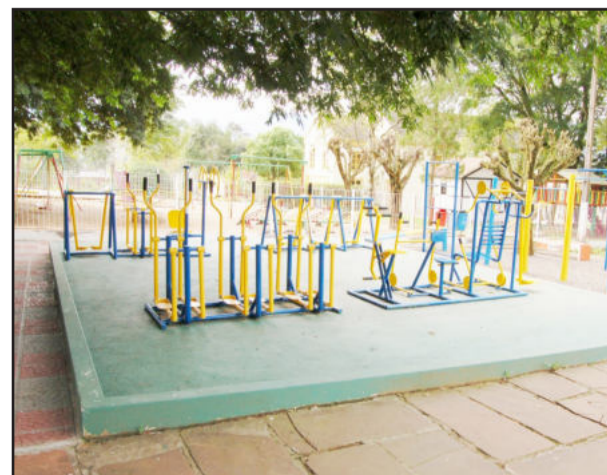
Implantação dos aparelhos de ginástica e melhorias no parque infantil na praça do Bairro Teutônia