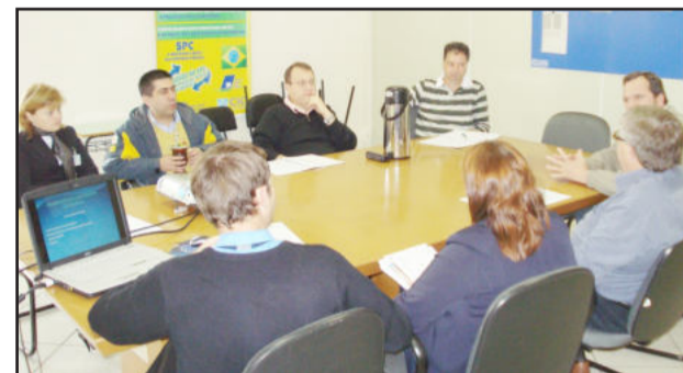
Reunião aconteceu no dia 15

No dia 15 de junho ocorreu a primeira reunião da diretoria da Indústria da Câmara de Indústria e Comércio (CIC) em 2010 após a posse dos novos integrantes da pasta, ocorrida no final do mês de março por ocasião da assembleia geral ordinária da entidade.