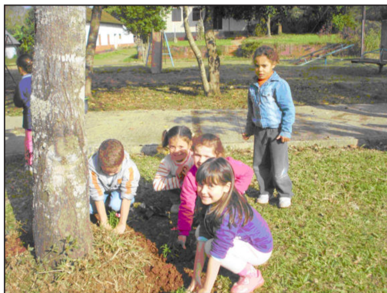
Semana do Meio Ambiente levada a sério nas escolas