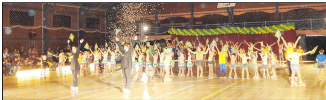
Show foi em Arroio do Meio