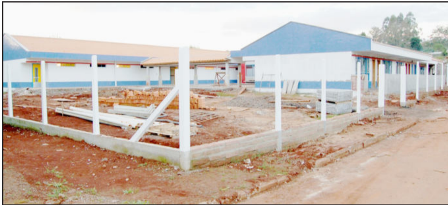
Obra da Creche Mundo Encantado

* Valor orçado e estimado pelo Setor de Engenharia. Obra em fase de licitação.