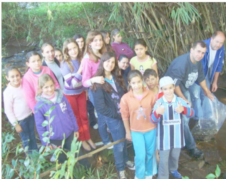
Mais de 500 filhotes de lambaris foram soltos no arroio