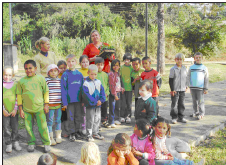
Alunos participaram ativamente da Semana do Meio Ambiente

> Escola Reinaldo Markus , de Fazenda São José, plantou horta escolar; confeccionou uma casinha com materiais reutilizados, como garrafas pet, com a finalidade de realizar a coleta seletiva e obter um depósito de materiais recicláveis.