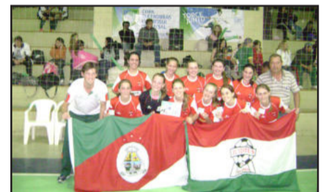
Sub-15 da Juventus levou o título da Copa Eletrosul de Futsal