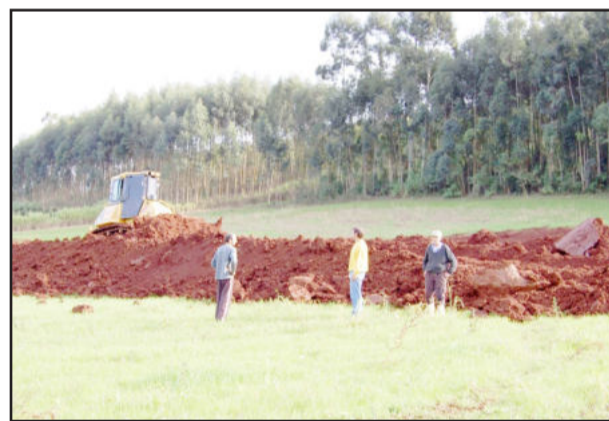
Serviço de terraplanagem na Linha Boa Vista 37