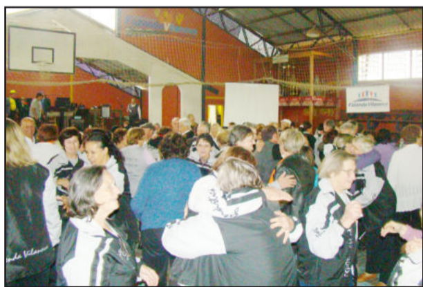
Confraternização foi o tema do encontro

O projeto de caminhadas e ginásticas orientadas promove encontros semanais com grupos de sete localidades, beneficiando mais de 200 pessoas, de todas as idades. São realizadas caminhadas, exercícios físicos orientados, alongamentos, ginástica laboral, palestras e atividades de integração e troca de experiências. Os interessados em integrar os grupos podem entrar em contato com a Secretaria da Educação. Informações pelo telefone 3613 1116, e-mail esporte@fazendavilanova@yahoo.com.br