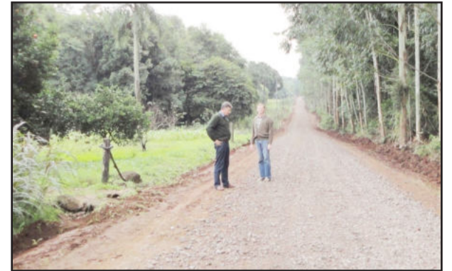
Colocação de material britado nas estradas

A administração de Teutônia está com cronograma traçado e efetua melhorias no interior do Município, nas estradas asfaltadas e nas estradas sem pavimentação. São obras importantes para que haja um bom escoamento da produção primária, responsável por cerca de 13% da economia do Município.