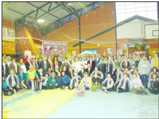
Grupo de Tramandaí

O 6º Encontro de Vivências reuniu mais de 200 pessoas no ginásio de Fazenda Vilanova, na semana passada. Os grupos de ginásticas e caminhadas orientadas do Projeto Esporte em Ação, da Secretaria Municipal da Educação, Cultura e Desporto, receberam a visita do Grupo Renascer de Tramandaí e, mesmo com chuva, a alegria e animação dos participantes foi contagiante.