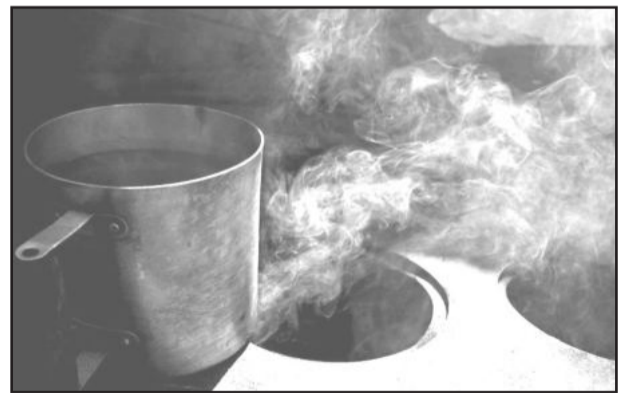
Fogão requer cuidados redobrados

Uma residência quase foi incendiada no Bairro Fátima, em Carlos Barbosa, durante o final de semana. O fato aconteceu na tarde de sábado, quando os Bombeiros Voluntários foram acionados e chegaram rapidamente para controlar o princípio de incêndio. O que poderia ter se transformado em um grave sinistro, foi ocasionado pela tentativa de secar as roupas no fogão a lenha.