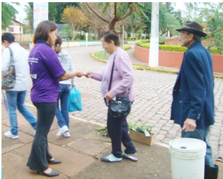
Jovens distribuíram panfletos educativos sobre a preservação da natureza