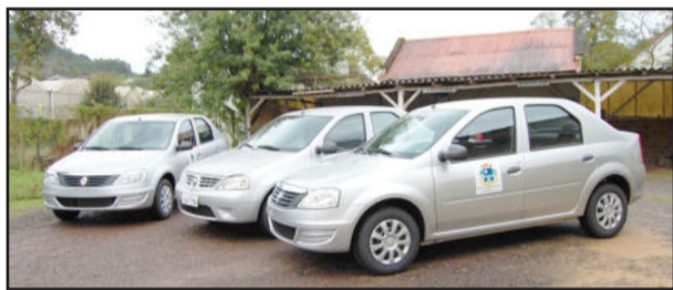
Veículos estão à disposição das secretarias

O investimento com recursos exclusivos do Município teve um total de R$ 75.250,00. O prefeito Paulo Gilberto Altmann comenta o processo de renovação da frota de veículos: "Decidimos substituir carros antigos por novos para dar mais suporte as atividades das secretarias. O objetivo da renovação da frota é garantir melhores condições de trabalho e torna-se uma ferramenta importante no atendimento à população", ressaltou Altmann.