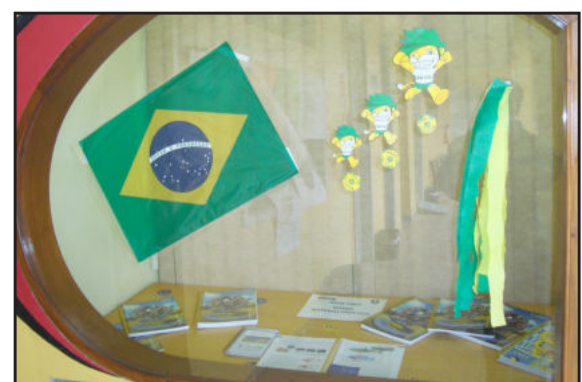
Trabalhos dos alunos expostos