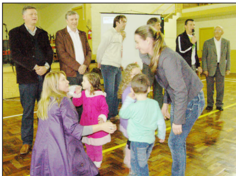
Primeiro-dama (e) agradeceu apoio à creche

Ação 3 - Lei de incentivo às empresas - A terceira ação foi lançada dia 27 de maio e beneficia o segmento empresarial. Foi a criação da Lei que dispõe sobre a Política de Incentivo ao Desenvolvimento Econômico e Social de Teutônia. A principal novidade está na devolução da cota parte do Imposto Sobre a Circulação de Mercadorias e Serviços (ICMS). A lei permite a devolução de 4,46% do total de retorno de ICMS gerado por qualquer empresa estabelecida em Teutônia, que agregou valor adicionado fiscal. A lei também prevê os casos de venda subsidiada, concessão de uso de imóveis, pagamento de aluguel de prédio destinado ao empreendimento, execução de serviços de terraplenagem e transporte de terras, isenção de tributos municipais (IPTU, ISSQN, ITBI e taxas), devolução de cota parte do ICMS, incentivo fiscal conforme plano de expansão, entre outros. A partir da lei, podem requerer benefícios, conforme a situação específica: indústrias, estabelecimentos comerciais, prestadores de serviços, agroindústrias e produtores rurais.