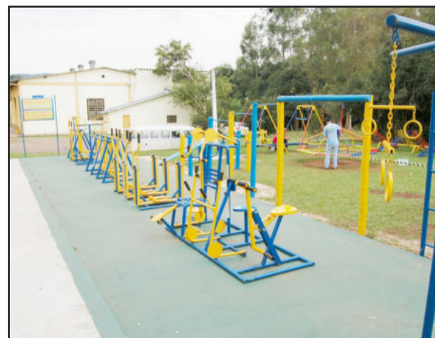
Melhorias nos brinquedos e implantação de aparelhos de ginástica no Bairro Boa Vista