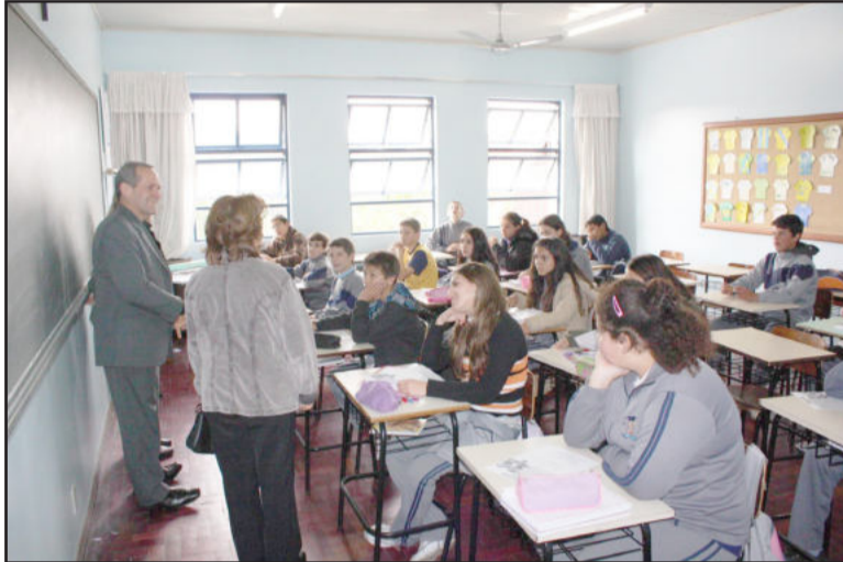
Prefeito em visita às salas de aula

O prefeito e a secretária visitaram as salas de aula e con-