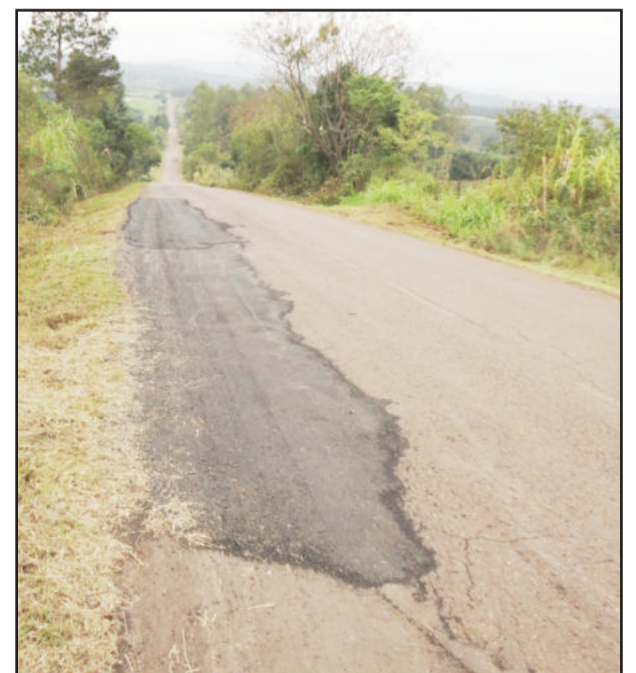
Recuperação de asfaltos

Pontes - Outra melhoria desenvolvida pela equipe da Secretaria de Obras foi a reforma de inúmeros pontilhões de madeira existentes no interior do Município.