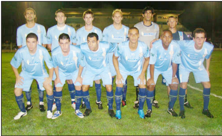
Alvi Azul vai para a elite em 2011