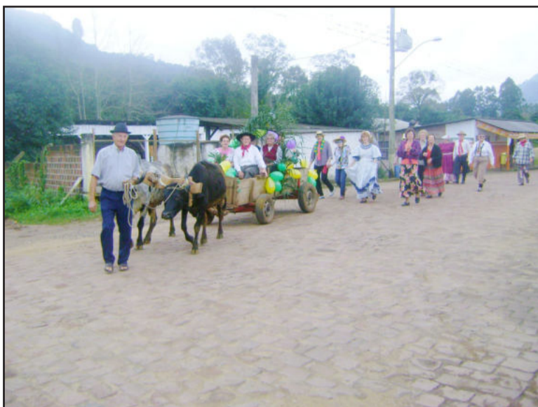
Terceira idade promoveu o desfile

A Prefeitura de Imigrante irá realizar, nesta