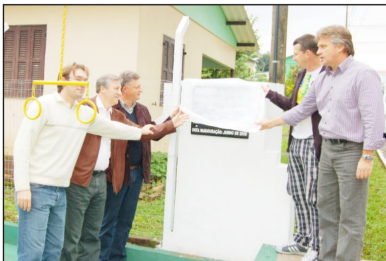
Autoridades inauguraram a obra

O parlamentar salientou a atuação da equipe da administração municipal, “pois vocês têm uma administração competente, com visão, que aplica bem o recurso público para o povo sair ganhando”. Molling parabenizou a cidade por ser a primeira colocada no Vale do Taquari