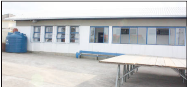
Novo telhado no prédio

versaram com as professoras e com os alunos. "Pedimos que vocês ajudem a preservar a escola, pois ela é um patrimônio de todos nós. Estamos trabalhando bastante para deixar um local onde vocês possam crescer e aprender da melhor maneira possível", destacou Cirano, ao conversar com os alunos da escola.