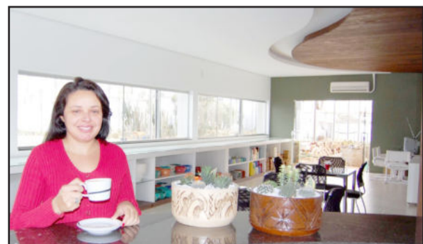
Cactário Horst oferece espaço especial com cafeteria