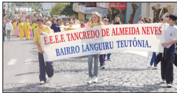
Participação da Escola Tancredo Neves