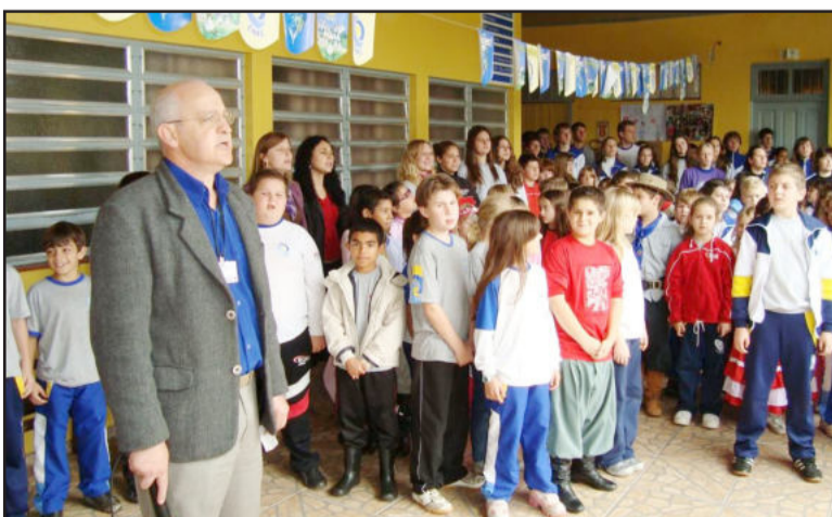
Forneck (e): defesa dos ideais farroupilhas