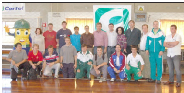
Circuito Certel foi aberto sábado