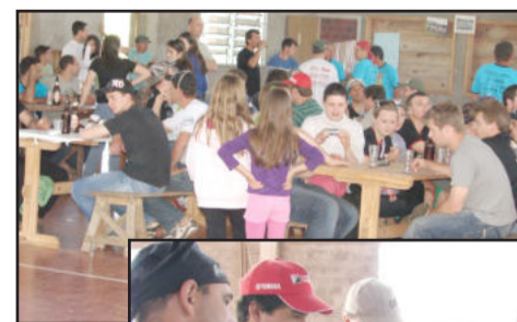
Almoço de confraternização