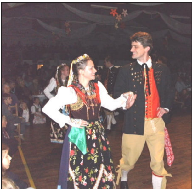
Descontração na apresentação dos grupos de danças

Tramita na Assembléia Legislativa do RS um Projeto de Lei que denomina no âmbito do Rio Grande do Sul o município de Colinas como “A Cidade-Jardim”. O autor deste projeto é o deputado Marquinho Lang (Democratas).