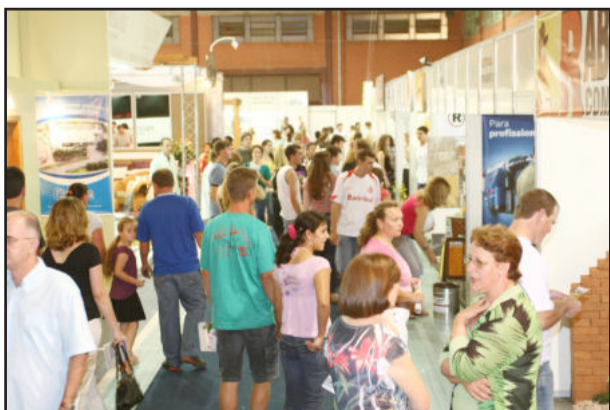
Feira espera 30 mil visitantes