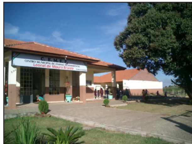
Sede do Cemef em Teutônia

Leia Revista Radar! Ligue 3762-2440 e peça seu exemplar.