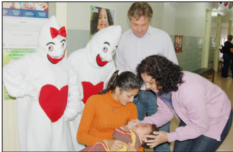
Vacinação foi prorrogada até 5 de outubro

No Rio Grande do Sul, a segunda etapa da vacinação apresenta, com os dados disponibilizados até esta segunda-feira, que 87,07% das crianças entre zero a quatro anos fo-