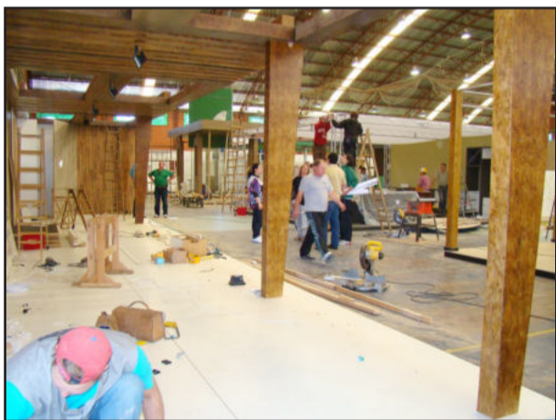
Montagem dos estandes ontem