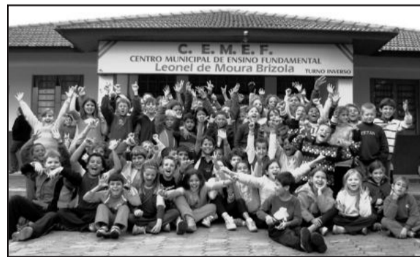
Crianças vibrando no Cemef

A Administração Municipal de Teutônia, através das Secretarias da Cultura, da Educação, Secretaria da Saúde, Habitação e Bem-Estar Social, da Orquestra Municipal e do Grupo Danças & Ritmos organizam e promovem este espetáculo. O evento tem o apoio de várias empresas e também da comunidade, através da compra de ingressos, que já está à venda no Cemef, na Secretaria Municipal de Cultura e com os alunos do Grupo Danças & Ritmos.