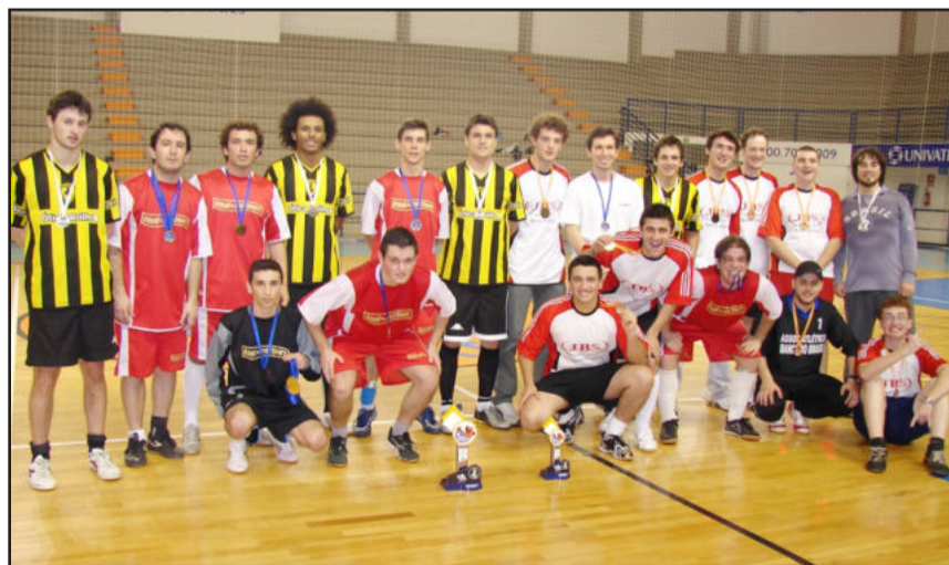
Equipes vencedoras receberam prêmios

Hoje, terça-feira, realizam-se as competições de voleibol masculino e feminino. Ontem ocorreu o jogo isolado entre as equipes "Carvalho" e "Ronaldo", que definiu o campeão no basquete masculino.