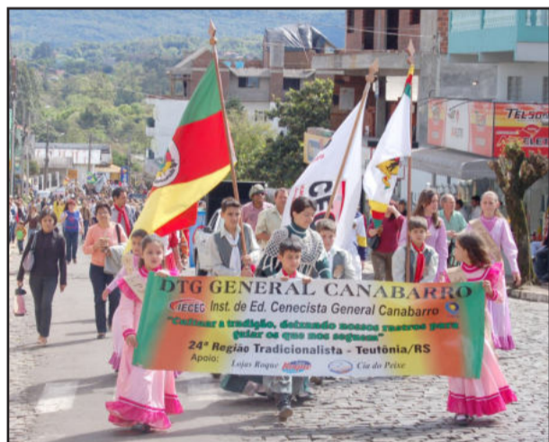
DTG General Canabarro do Iecieg