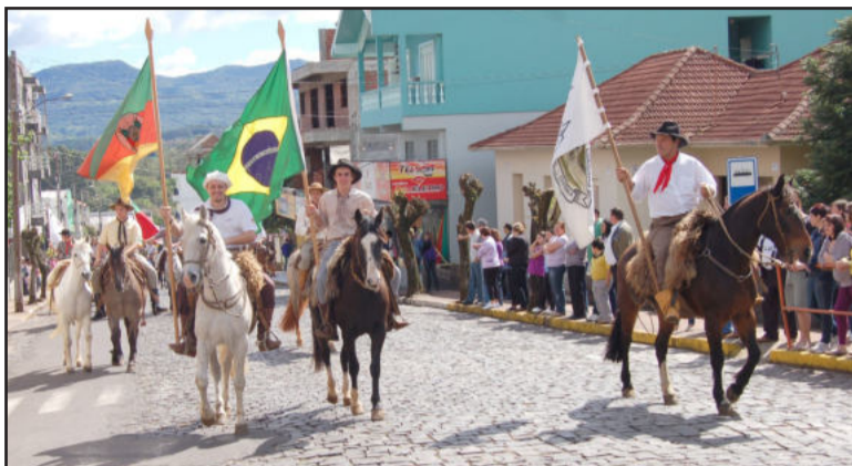
Mais de 140 cavalos de diversos piquetes participaram

No galpão do CTG Rincão das Coxilhas, ao meio-dia foi servido almoço para em torno de 300 pessoas. À tarde, várias atrações tradicionalistas movimentaram o público que prestigiou a programação.