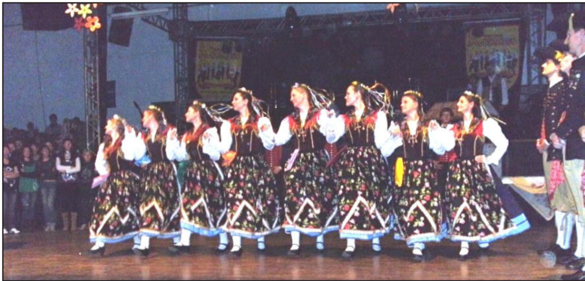
Grupo Morgenstern é o anfitrião da festa

A comunidade de Colinas recebeu visitantes das mais diversas regiões do Estado, inclusive do país vizinho Argentina. Todos vieram festejar a entrada da primavera, através da tradicional festa das flores – o Blumentanzfest. O evento, que está na 18ª edição, aconteceu no sábado, dia 19 de setembro, promovido pelo Centro Cultural Morgenstern e conta com o apoio da Administração Municipal de Colinas.