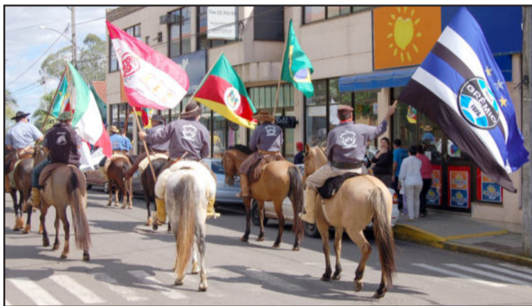
Clássico Gre-Nal também esteve no desfile