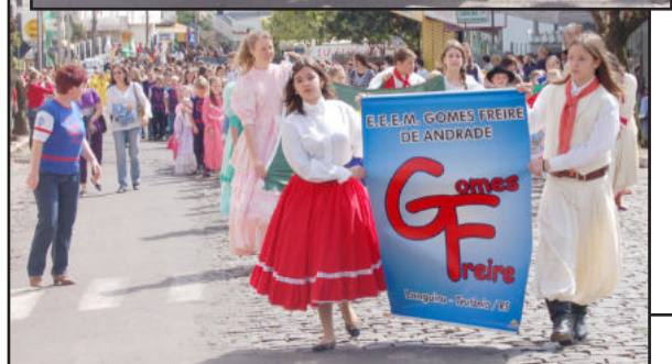
Escola Gomes Freire prestigiou o desfile