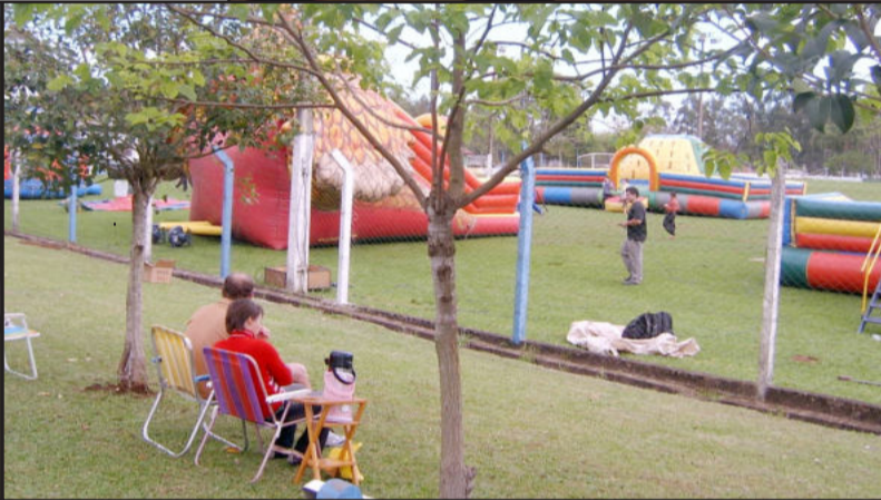
Evento teve várias atrações para diversão das crianças