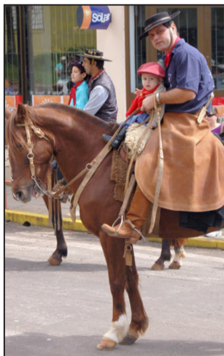
Tradicionalismo não tem idade