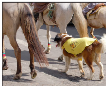
Os Desgarrados levaram seu mascote ao desfile