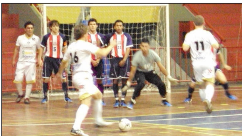
ASTF buscou um importante empate, mas precisará somar pontos em São Luiz