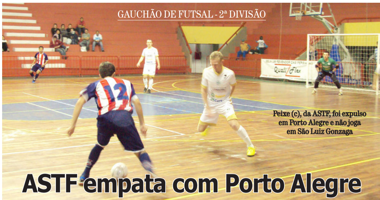
Peixe (c), da ASTF, foi expulso em Porto Alegre e não joga em São Luiz Gonzaga.