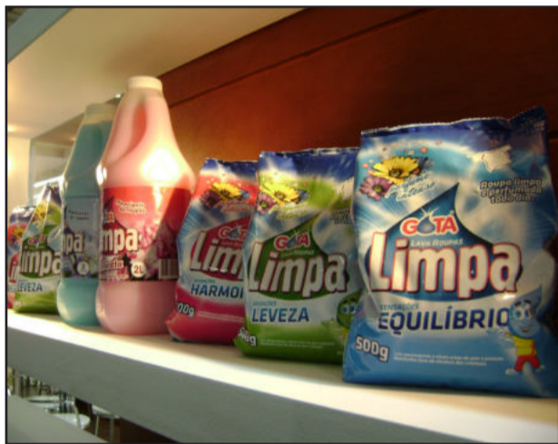
Novo produto será lançado no litoral