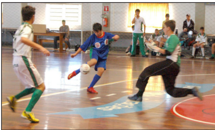
Competição iniciou sábado com bons jogos e muitos gols

deira, lembrou que muitas equipes não puderam estar presentes à abertura por causa da recuperação de aulas aos sábados pela manhã. Por isso, se dirigiram diretamente ao seu local de jogos. Elogiou a disciplina das edições anteriores “e que vocês atletas possam manter o padrão disciplinar neste ano”.