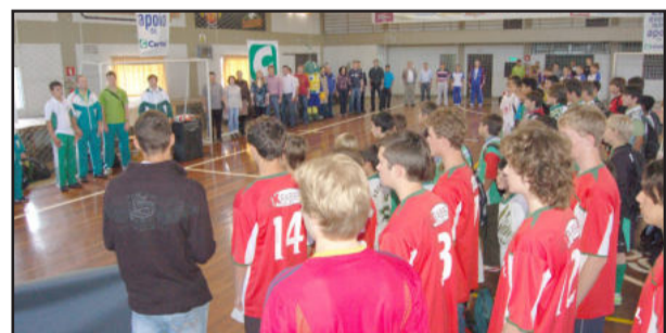
Certame deve movimentar 850 atletas