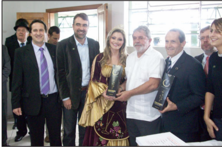
Entrega de convite ao presidente Lula