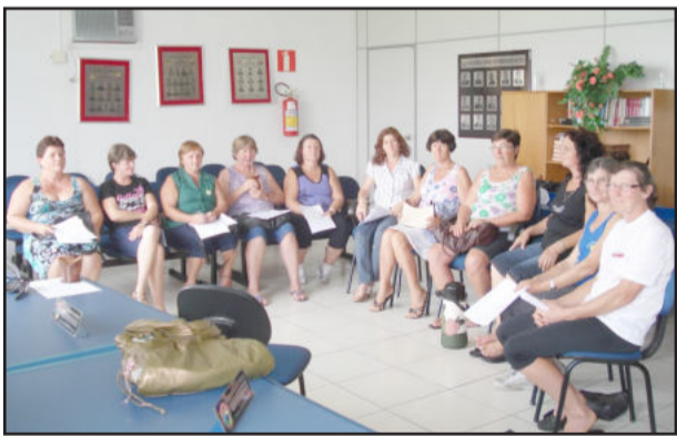
Reunião foi nesta quarta-feira

Promovido pela Emater, aconteceu nesta quarta-feira dia 20, o encontro das presidentes dos 12 grupos do lar e clubes de mães de Paverama. Tendo por local a Câmara de Vereadores, estiveram presentes representações de praticamente todos os grupos. O objetivo do encontro foi discutir assuntos comuns aos grupos, definir estratégias de trabalhos e encaminhamentos, bem como planejamento participativo de ações para 2010.