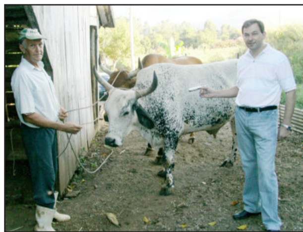
Prefeito acompanhou de perto a vacinação em 2009

O Rio Grande do Sul possui 296.896 propriedades com bovídeos jovens. Destas, 212.458 foram beneficiadas com vacina doada pelo Governo do Estado. Nesta última fase da campanha, foram disponibilizadas para doação 1.734.040 de doses para os produtores com até 50 cabeças enquadrados no Pronaf e de áreas urbanas com até 15 cabeças. As vacinas gratuitas foram retiradas por 81,34 % dos criadores, totalizando um rebanho de 1.546.869 animais vacinados com estas doações.