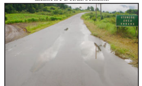
Água acumulada é uma armadilha