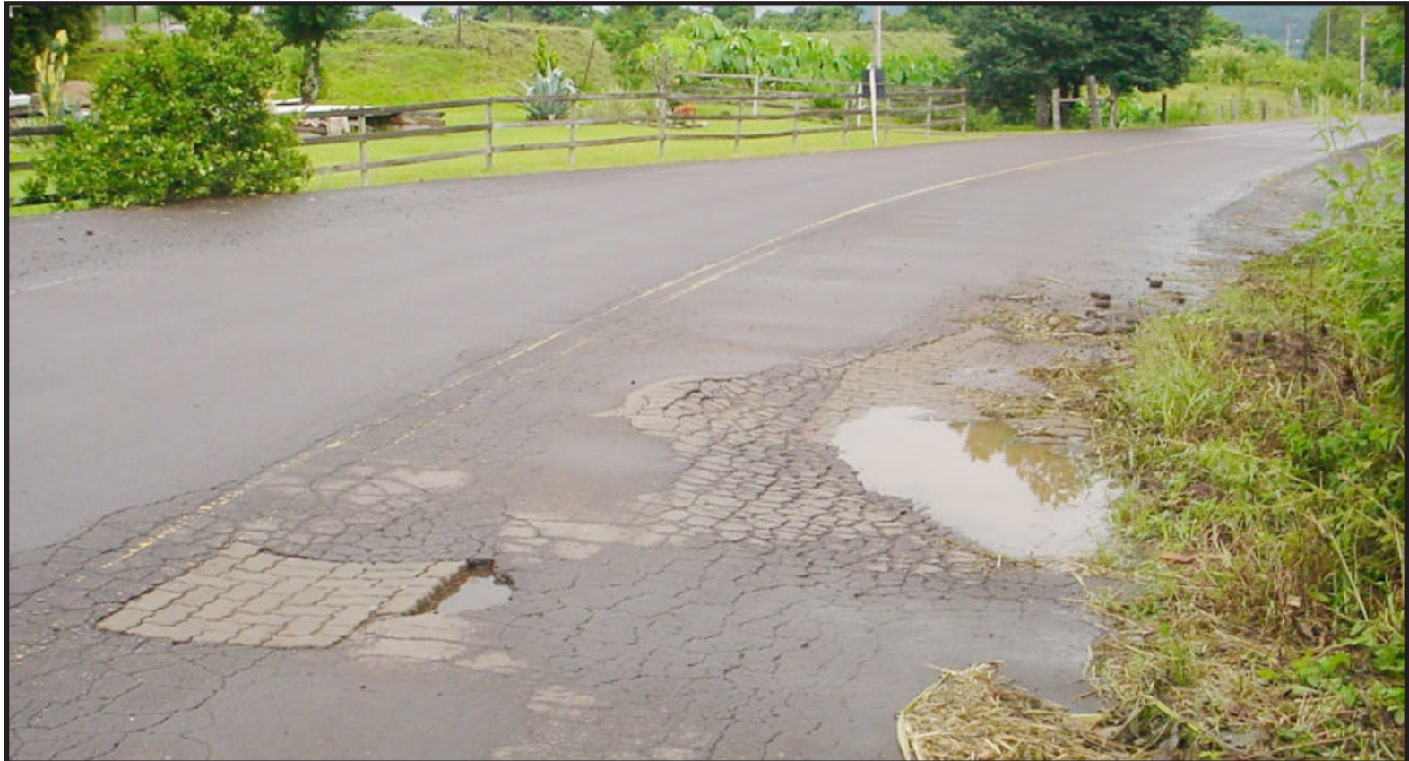
Pista danificada já provocou acidentes