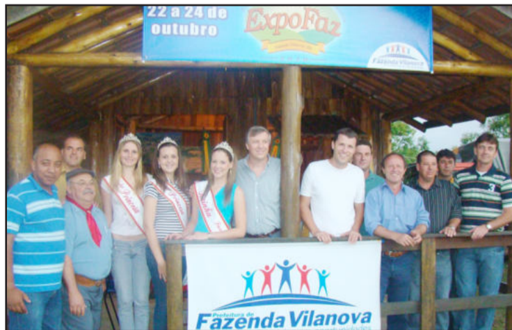
Administração divulga Expofaz 2010 no Rodeio Crioulo

A Expofaz 2010 acontece de 22 a 24 de outubro e contará com feira comercial, industrial e agropecuária. As atrações