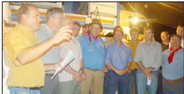
Jantar de confraternização da Granja Faria contou com presença de autoridades