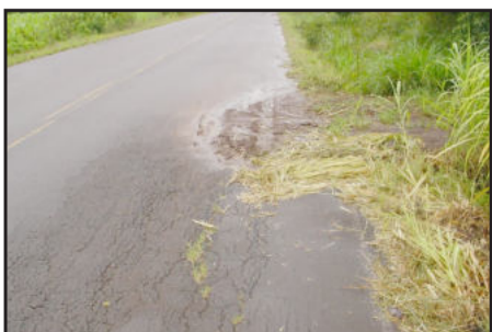
Barro invade pista da rodovia nos acessos

T rafegar pela RST 419, asfalto que liga os municípios de Poço das Antas e Teutônia, é uma aventura de alto risco. Os perigos são constantes para quem nela trafega.