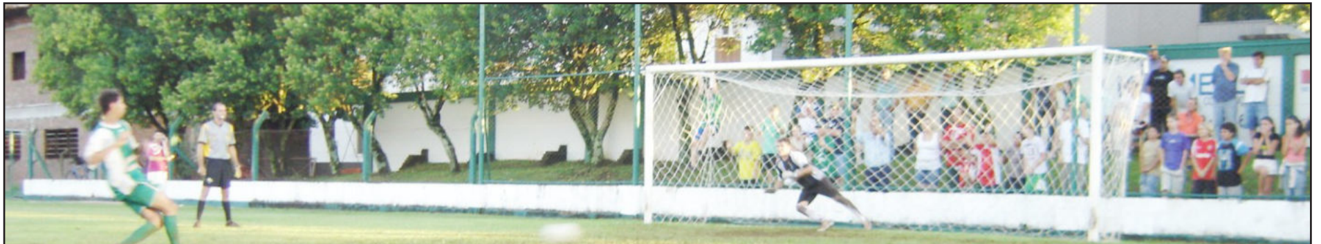
Supercopa dos Campeões - Assine / Liga Serrana