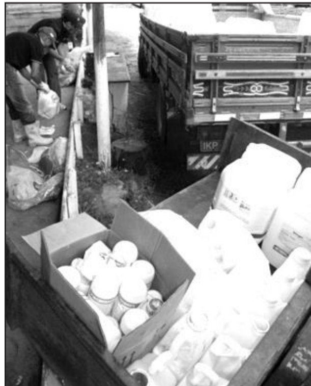
Coleta prossegue segunda e terça

Durante a próxima semana a equipe visitará o restante das comunidades. Haverá recolhimento na segunda-feira em Torino, Santa Clara, Torino Baixo e Santa Clara Baixa. Na terça-feira serão recolhidas as embalagens nas localidades de Paraguaçu, Santo Antonio do Forromeco, Montenegro (Forromeco), Santa Luiza e Cascata (em Santa Luiza) e São Luiz.