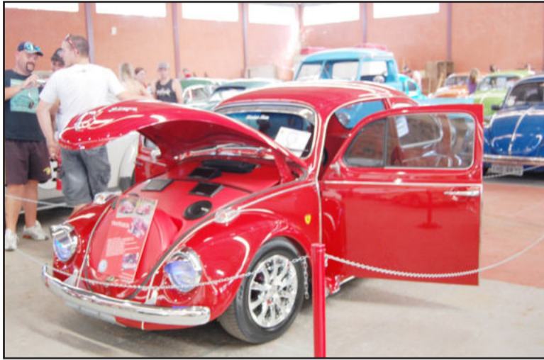
Exposição será no Parque do Imigrante