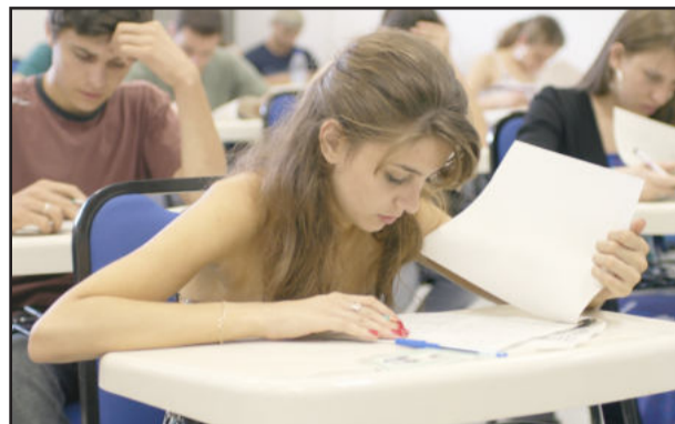
Prova única de redação será dia 7

Estarão abertas, de 25 de janeiro a 3 de fevereiro, as inscrições para o Vestibular Complementar da Univates, que será realizado no dia 7 de fevereiro, às 8h30min. A prova única de redação será aplicada nos campi de Lajeado e Encantado e os vestibulandos terão três horas para concluí-la. As inscrições podem ser feitas no site www.univates.br/vestibular ou na Univates de Encantado e de Lajeado. Mais informações pelo telefone 0800 707 0809.