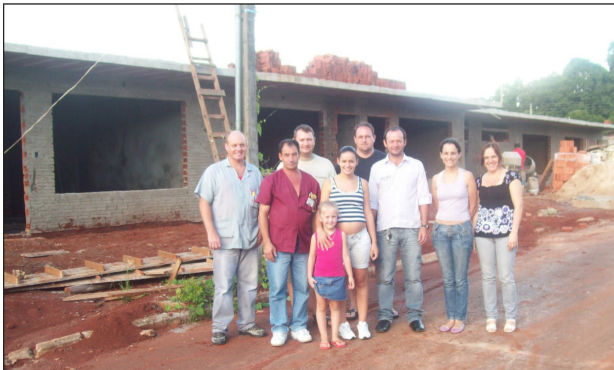
Membros da Associação visitando a obra

Na última quinta feira, dia 20 de janeiro, membros da Associação de Pais e Colaboradores Mundo Encantado, mantenedora da Escola de Educação Infantil Mundo Encantado, reuniram-se em reunião mensal para tratarem assuntos pertinentes e aproveitaram a ocasião para conhecer a estrutura do novo prédio o qual