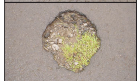
Buracos crescem em diâmetro a cada semana