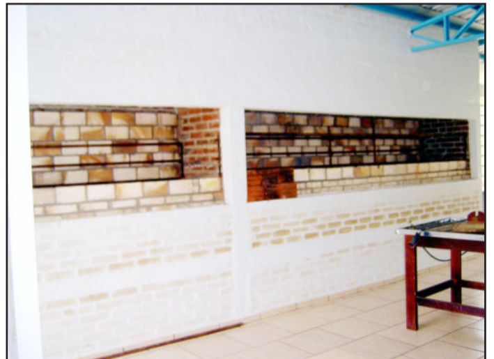
Churrasqueiras também foram incluídas