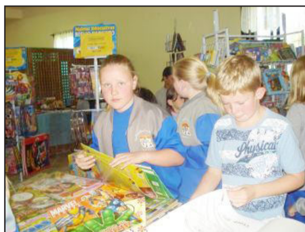
Alunos escolhendo livros