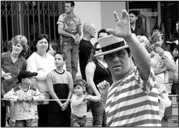
APAE de Garibaldi é atração a parte

A APAE de Garibaldi, mantenedora da Escola Especial Bem-Me-Quer, apresenta no próximo dia 29 de novembro, segunda-feira, seu tradicional espetáculo de teatro anual. A estréia de "Noite de Luz" será às 20 horas, no Ginásio Municipal de Esportes de Garibaldi. A entrada é franca.