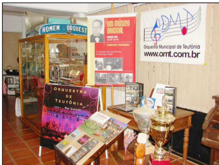
Exposição temática pode ser conferida junto ao Museu Henrique Uebel