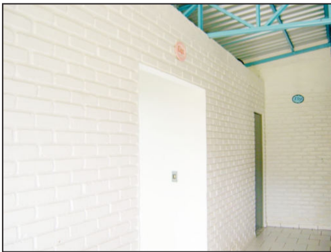
Banheiros também fazem parte das melhorias