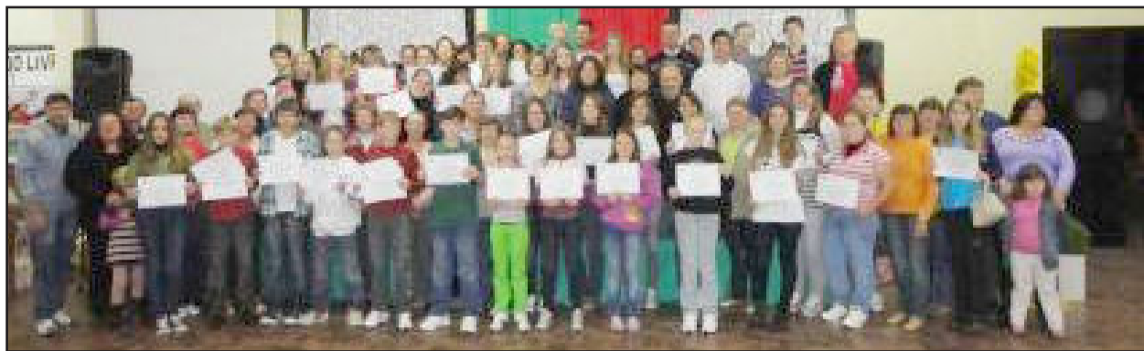
Alunos destaques, com seus pais