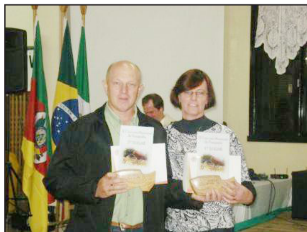
Marino (e): autor das fotos em primeiro e segundo lugares