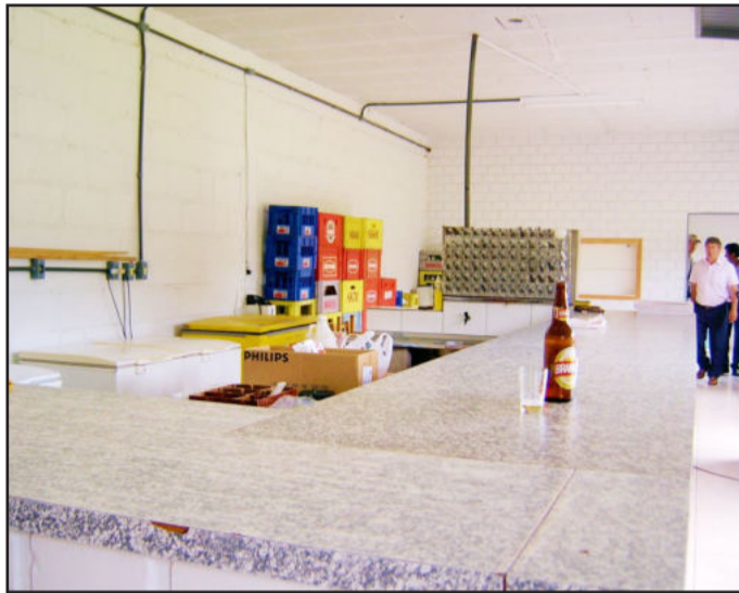
Cozinha e copa integram melhorias na parte inferior do ginásio

O novo espaço, além de servir para os dias de jogo, poderá receber ensaios de coral, reuniões e festas para cerca de 100 pessoas, com reservas antecipadas. Nos dias de jogos, as senhoras do Grupo Lar Rosa Branca ficarão responsáveis pela copa e dividirão os lucros com a Sociedade Esportiva Palmeiras.