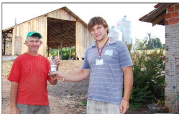
Magedanz (e) elogiou a programação