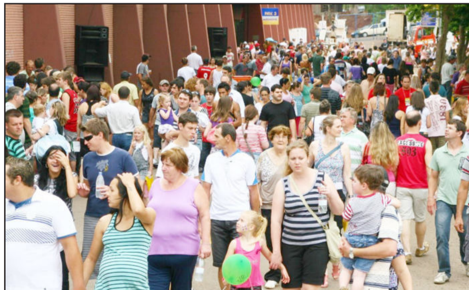
Segundo final de semana da Expovale teve ótimo público

Durante a semana a feira teve dias de participação especial. Na terça e na quarta-feira o parque foi aberto para estudantes de escolas de todo o Vale do Taquari e até mesmo da Serra. Mais de 3,9 mil crianças e adolescentes de 50 escolas lotaram o parque de diversões e boa parte dos pavilhões. Na quinta-feira foi a vez do público da melhor idade conhecer a multifeira e dançar ao som do Musical URPM. Cerca de 1,6 mil idosos participaram da integração. Também neste dia soberanas de 18 municípios se reuniram para encontro de confraternização.