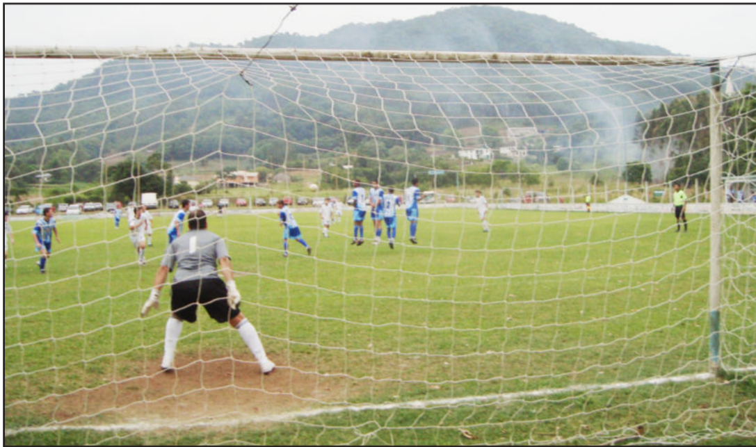
Poço das Antas ganhou do Taquariense no tempo normal, mas, na prorrogação, empate deu a vaga à equipe de Taquari

Jogos quentes e com três prorrogações definiram AECOSAJÓ, Taquariense, 11 Amigos e Guaíba na próxima fase