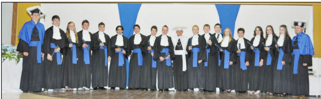
Novos técnicos em informática com o diretor do Icege e professores paraninfos

Os cursos técnicos do Instituto de Educação Cenecista General Canabarro (Icege) se preparam para as formaturas de final de ano. Estarão se despedindo do instituto turmas de Informática, Administração, Contabilidade e a primeira turma de Recursos Humanos. Mas antes da festa, eles passam pelos trabalhos de conclusão e suas apresentações.