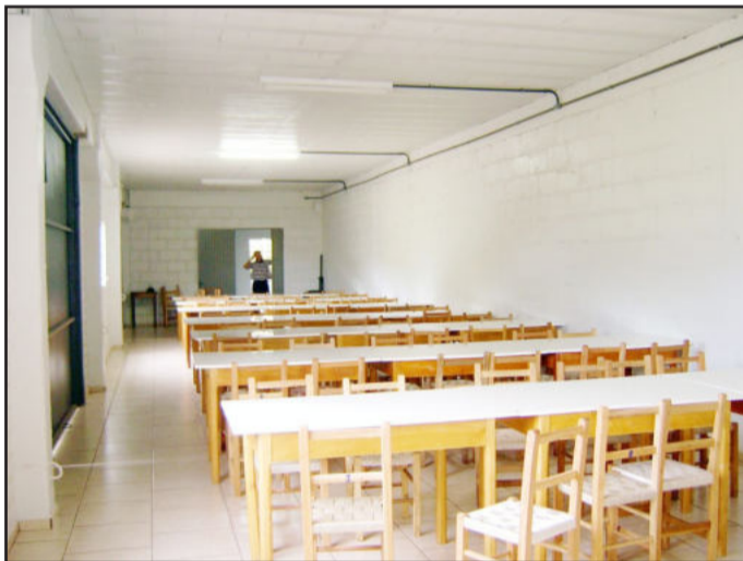
Parte inferior do ginásio com espaço para reuniões e festas