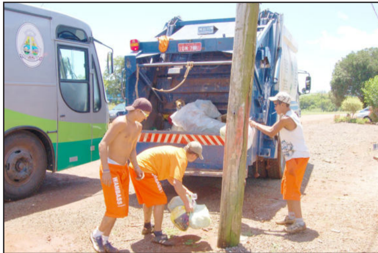
Coleta de lixo em Teutônia também é feita no interior, como em São Jacó

> Nos bairros Teutônia, Languiru, Alesgut e Boa Vista - o LIXO ORGÂNICO será recolhido nas terças-feiras e nos sábados. Nas quintas-feiras será recolhido o LIXO INORGÂNICO ou RECICLÁVEL ou SECO.