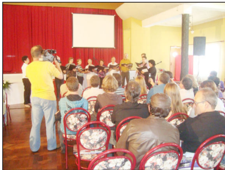
Grupo da Melhor Idade cantou Hino da Educação Fiscal em Teutônia