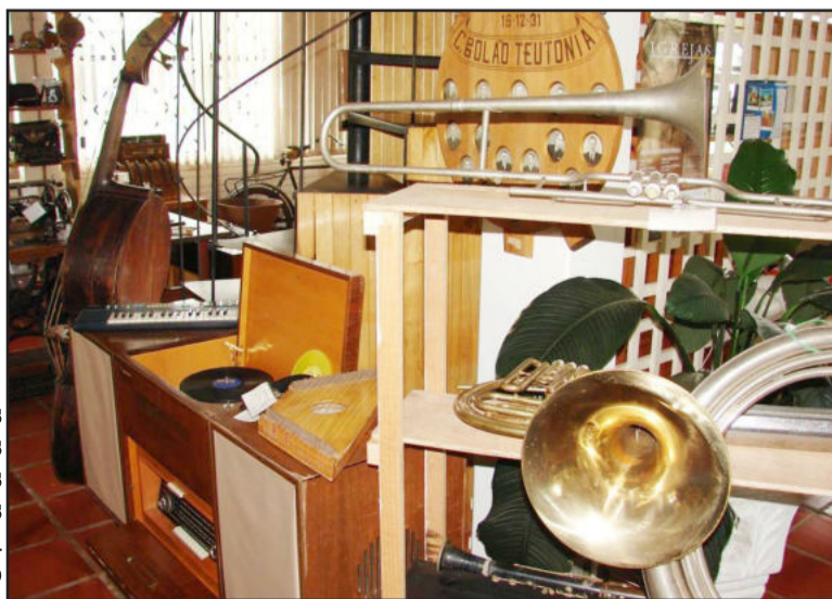
Instrumentos musicais de várias épocas estão em exposição