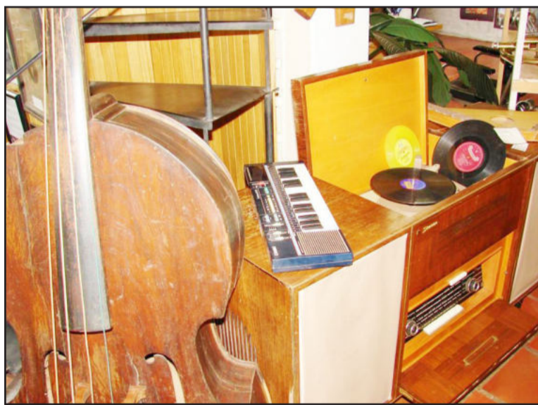
Exposição também retrata evolução dos equipamentos e instrumentos musicais