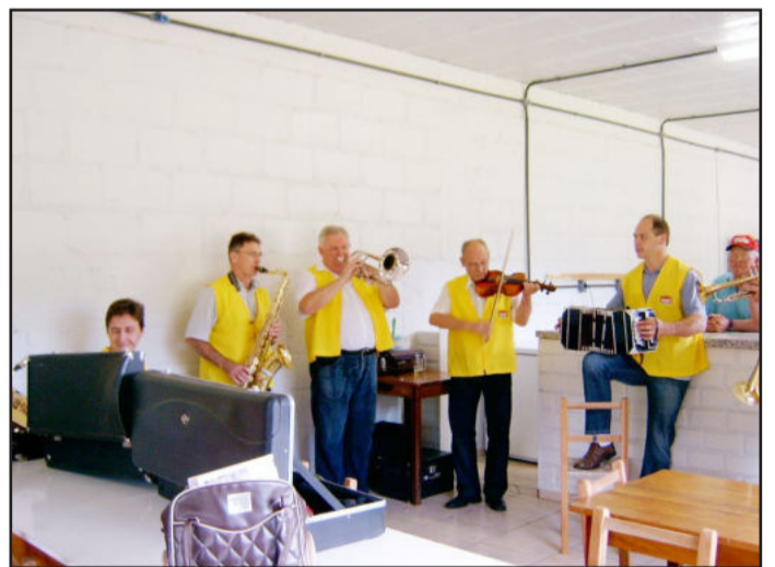
Bandinha MiMi animou almoço