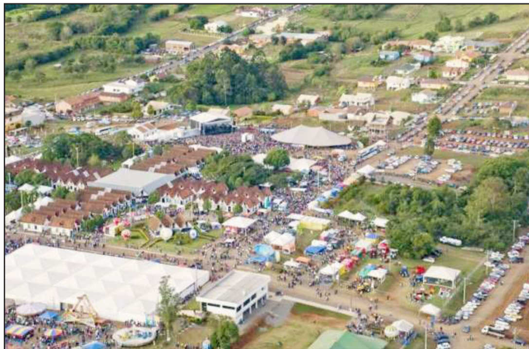
Festa de Maio 2011 será alusiva aos 30 anos de Teutônia

A Câmara de Indústria e Comércio (CIC) iniciou a comercialização dos estandes da exposição comercial e industrial da Festa de Maio 2011. A divulgação inicial ocorreu via mala direta enviada no início do mês de novembro aos associados da entidade.