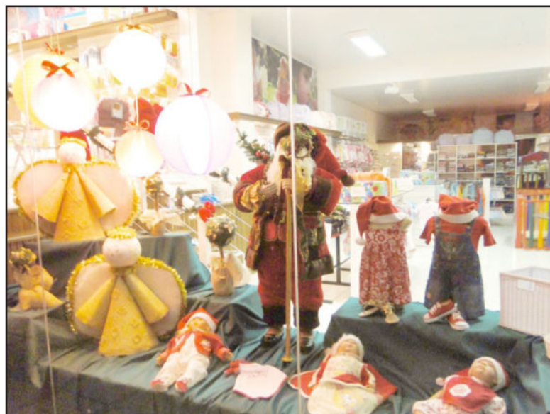
As três melhores vitrines serão premiadas

Serão premiadas as três melhores vitrines, que receberão troféus e cestas de Natal, além de divulgação especial nos jornais Folha Popular, O Informativo de Teutônia e boletim informativo mensal da CIC - Jornal Resumo. A divulgação dos resultados e entrega da premiação será no dia 29