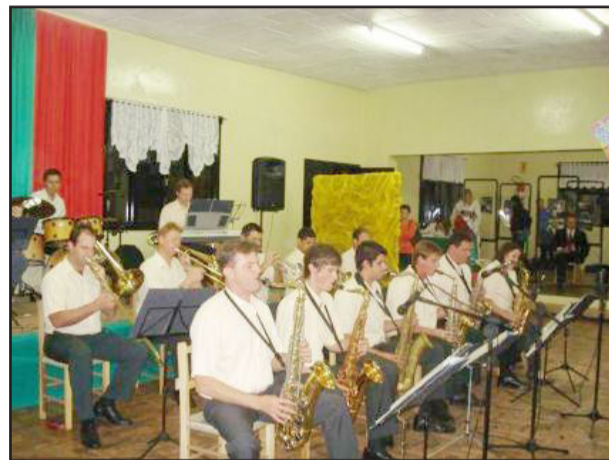
Orquestra Municipal de Westfália