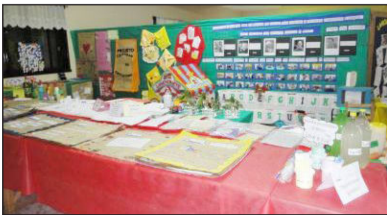
Exposição dos projetos do Programa A União faz a Vida

Encontro de orquestras marcou a abertura da feira. O público presente pode prestigiar as diferentes formações das orquestras, assim como seus estilos, que resultaram em apresentações bem ecléticas. A Orquestra de Poço das Antas foi a primeira a se apresentar, seguida pelo Grupo Instrumental de Barão, Orquestra de Nova Prata e, finalizando, Orquestra de Westfália.