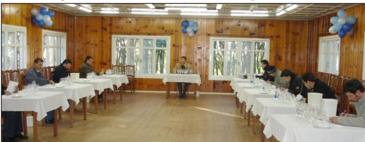
Estão inscritas 111 amostras para avaliação dos enólogos

Durante esta semana, uma equipe de enólogos da região está reunida, no Centro de Eventos Ferradura, degustando e avaliando as amostras inscritas na 7ª Seleção dos Melhores Vinhos e Espumantes de Garibaldi. As amostras concorrem a medalhas de ouro, prata e bronze. A divulgação dos resultados e entrega das medalhas ocorre em um jantar festivo no dia 28 de agosto, no Centro de Eventos Família Giovanaz. Para esta edição do evento, foram inscritas 111 amostras.