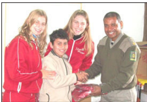
Corpo de Bombeiros entregando os fardamentos