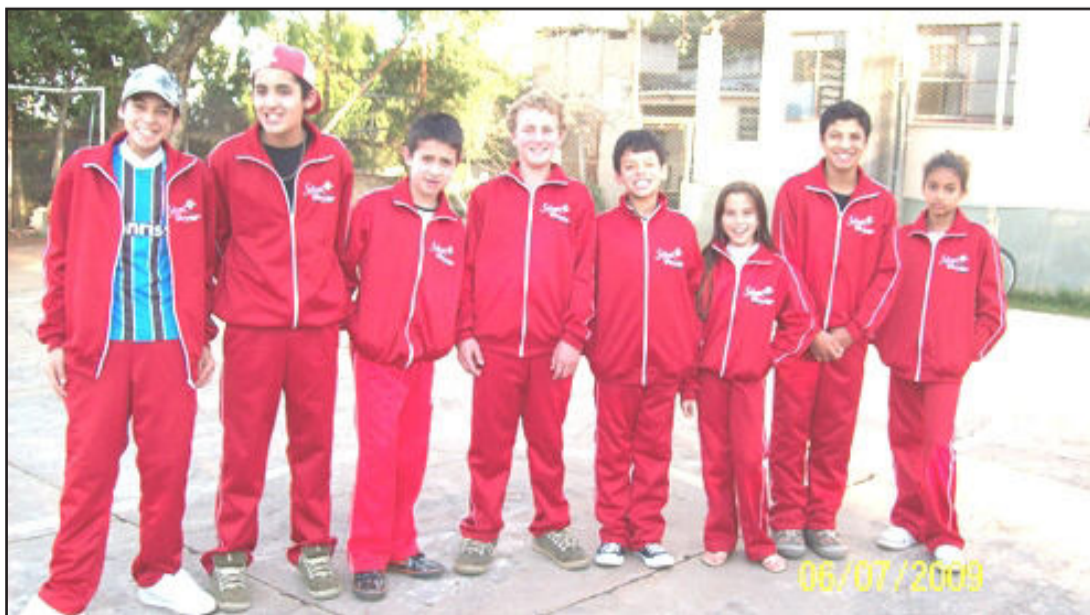
Uniformes foram doados pela Prefeitura e Univale