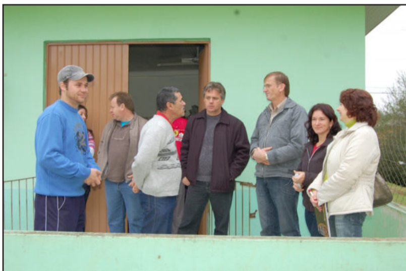
Administração conheceu estrutura e planos da creche

porém manter é o principal. A educação é muito mais do que um prédio", apontou.