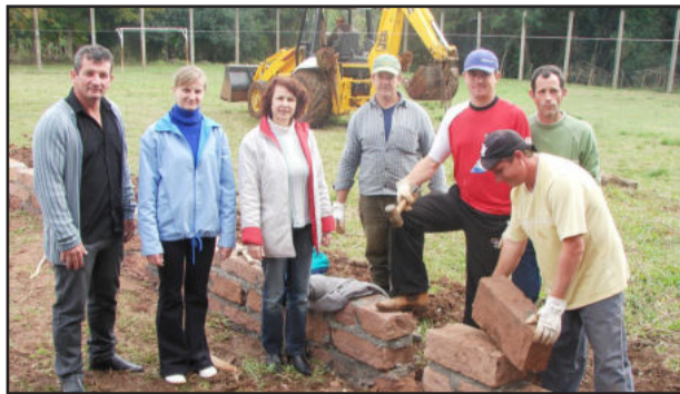
Visita à reconstrução do muro

Para que a aprendizagem das crianças e jovens seja sempre uma prioridade em Teutônia, a Secretaria Municipal de Educação não mede esforços para proporcionar, além de todo o subsídio pedagógico às escolas, uma infra-estrutura adequada para que os envolvidos na educação formal - alunos, professores, funcionários e equipe diretiva - possam desenvolver adequadamente suas atividades.