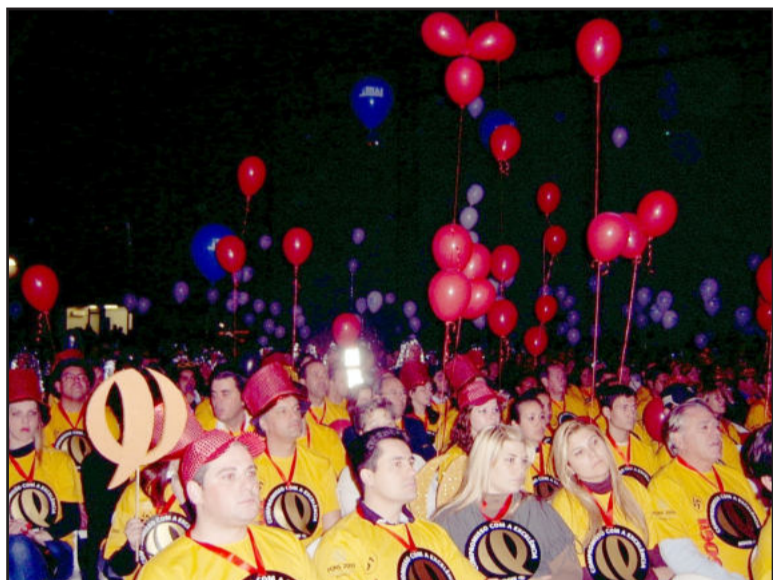
Torcidas das empresas lotaram o evento