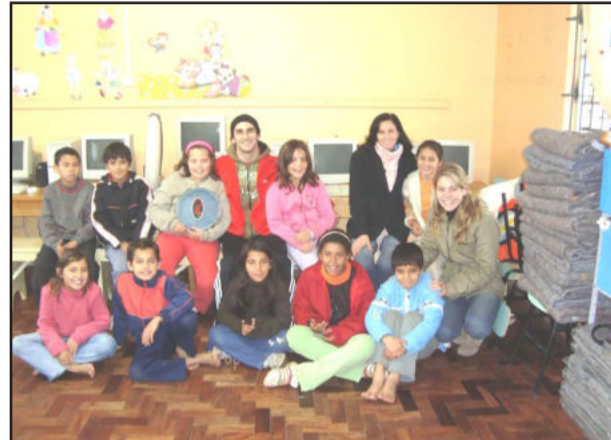
Aprendizes no Bairro Moinhos