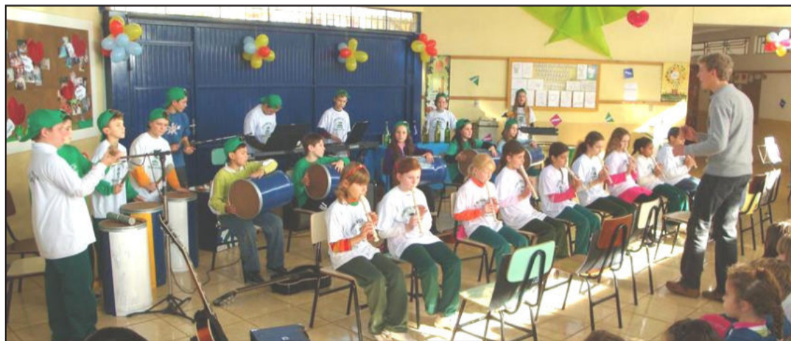
Coral infantil Emef Pedro Pretto, de Travesseiro, se apresentou em Estrela

Uma série de atividades marcou a culminância de um projeto desenvolvido pela Escola Municipal de Ensino Fundamental (Emef) Pinheiros, de Estrela. Trata-se do "Todos pela cultura, incentivando a leitura". Na tarde da última segunda-feira, dia 20, por exemplo, aconteceu a apresentação do Coral Infantil da Emef Pedro Pretto, de Travesseiro.