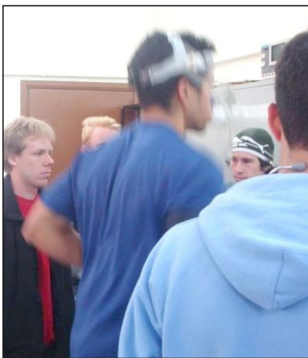
Teste na esteira com análise de gases

O preparador físico da ASTF destaca que a busca constante por novos conhecimentos é de extrema importância, assim como o aprendizado de novas técnicas de avaliação com equipamentos de alto nível, principalmente no Futebol e Futsal, "onde constantemente são publicados novos estudos, que com certeza servem de base para os profissionais realizarem treinamentos cada vez mais apropriados".