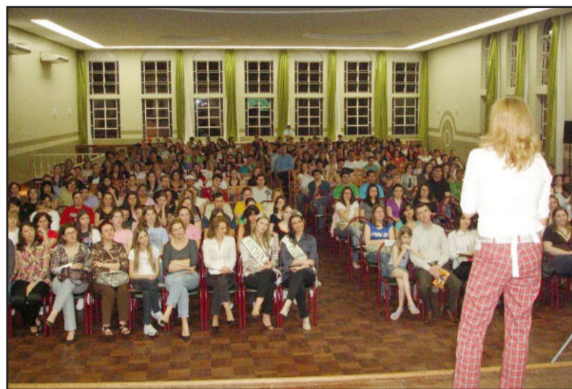
Em 2008, mais de 500 pessoas assistiram a palestra

O evento é dirigido para o jovem em fase final de estudos do Ensino Médio, para estudantes que estão ingressando no ensino de nível superior e para todos aqueles que, através da troca de conhecimento com o outro,