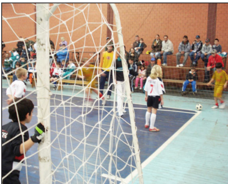
Disputas da semifinal movimentaram as quadras do Parque do Imigrante

Após a final, marcada para o próximo sábado, dia 25 de julho, serão premiados por categoria, o time com melhor disciplina, o maior goleador, o goleiro menos vazado e o craque da final. O campeonato também premiará com troféus e medalhas os colocados do 1º ao 3º lugar por categoria, e o 4º lugar com medalhas.