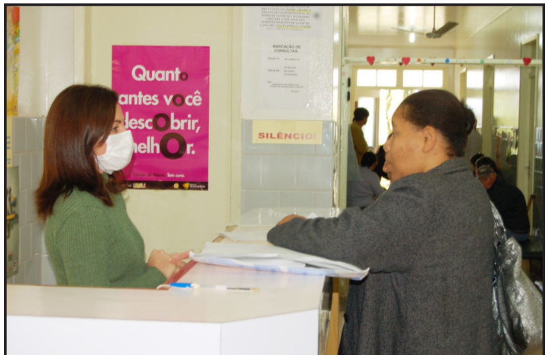
Em Teutônia, funcionários da Saúde estão usando máscaras desde ontem

Teutônia, Estrela e Lajeado orientam suas populações. Páginas 2, 11 e 13