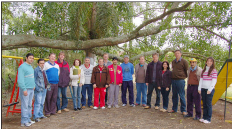
Parque de lazer da creche é privilegiado com sombra