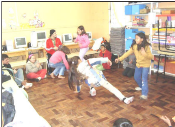
Crianças aprendem a arte da capoeira

cativa muito os alunos. “Eles adoram e esperam muito pela capoeira e por isso as aulas tornam-se momentos prazerosos e de muita aprendizagem, pois é nestes momentos em que ocorre a troca de conhecimentos, relacionamento e pensamentos relativos à vida de cada um”, lembra.