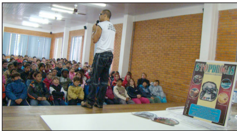
Palestra advertiu sobre os malefícios das drogas

O objetivo das abordagens é mostrar aos estudantes que o uso de drogas causa efeitos irreversíveis no ser humano. O