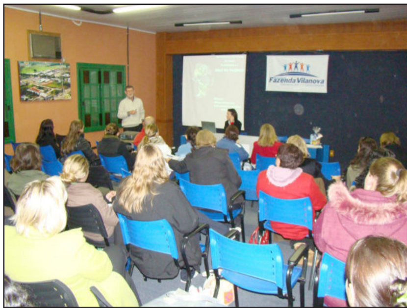
Professor da Univates proferiu a palestra