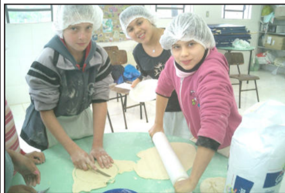
Crianças abrindo a massa do pastel

Como tudo o que diz respeito da Índia está na moda, resolvi passar para os meus alunos essas receitas. Na APAE, fizemos o famoso chai e o patê de cenoura. Essas duas receitas já coloquei nessa coluna para você. No CEMEF-Centro Mun.Ens.Fund. Leonel de M. Brizola, fizemos samosas e lassi. Na foto abaixo, as crianças preparando os pastéis. Nas próximas colunas, apresentarei a receita do pastel e a bebida lassi.