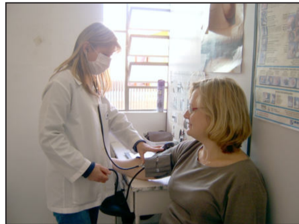
Funcionários da Saúde usam máscaras

> Se houver suspeitas de estar com a gripe A, não frequentar locais com grande circulação de pessoas (bancos,