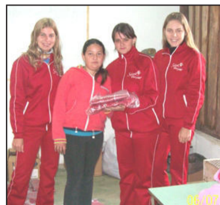
Jovens vestindo o uniforme