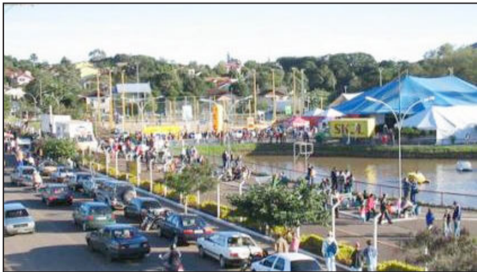
Parque Princesa do Vale, ponto turístico em Estrela

Durante muitos anos serviu como depósito de lixo. Segundo dados obtidos no setor de Engenharia na Prefeitura, na gestão do prefeito Günther Ricardo Wagner a administração transformou o local em área de lazer. O projeto inicial do parque foi feito em fevereiro de 1995, um rascunho de José Itamar Horn. Posteriormente, foi delineada a planta com perfeição para ser executada a obra em todos os seus detalhes, desde a primeira carga de terra até a ligação da última lâmpada de iluminação pública. O Parque foi inaugurado em 18 de maio de 1996.