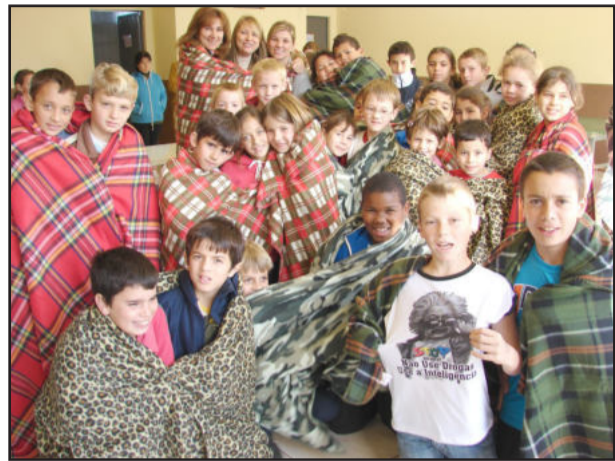
Alunos com os novos cobertores

Na manhã desta quarta-feira, dia 22, ocorreu a entrega das mantas e cobertores para o Centro Municipal de Educação Fundamental (Cemef) Leopoldo Klepker, que foram adquiridos com o resultado da promoção beneficente "Arraial na Capitão Schneider". Na ocasião foram vendidos pipoca, pinhão e quentão sem álcool. A direção do Cemef e as crianças ficaram muito