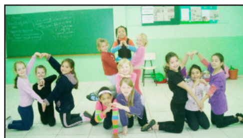
Alunas do Cemef fazem corações para o Município