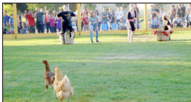
As mulheres também se empenharam