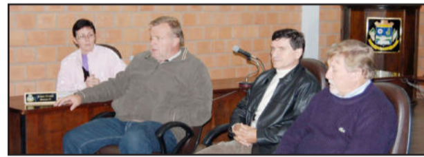
Explicação sobre o projeto