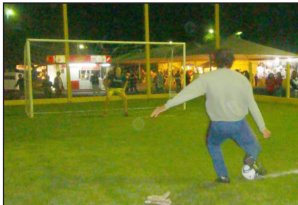
Torneio do Boi reuniu 170 duplas