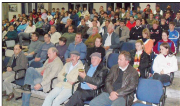
Plano Diretor foi discutido