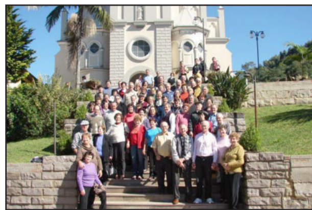
Grupo Amizade conheceu pontos turísticos

Integrar, fazer novos amigos e divulgar o Município são alguns dos lemas dos grupos da melhor idade de Teutônia. O Grupo Amizade, do Bairro Languiru, seguiu a proposta e fez uma grande integração com o Grupo Municipal da Melhor Idade da cidade de São Pedro da Serra. Na parte da manhã, visitaram vários pontos turísticos de Salvador do Sul e de São Pedro da Serra.