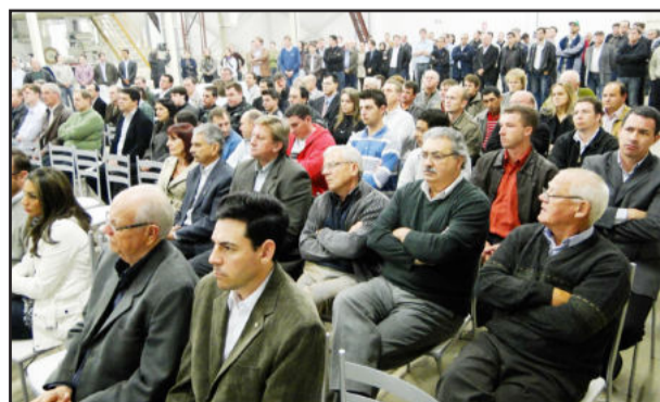
Numeroso público prestigiou a inauguração