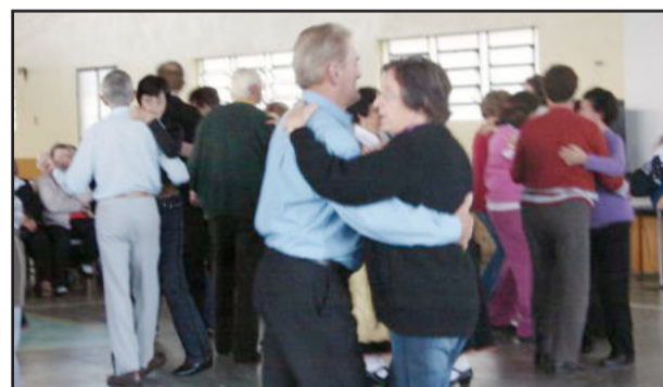
Muita animação no arrasta pé