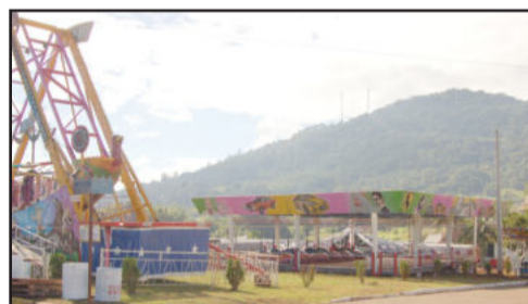
Parque infantil será atração para as crianças