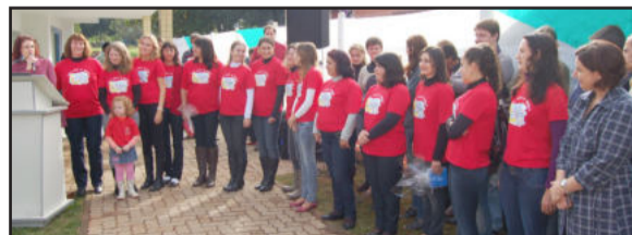
Inara apresentou a equipe de trabalho para a comunidade