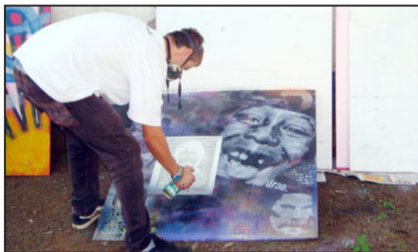
Grafite foi uma das artes apresentadas ao público