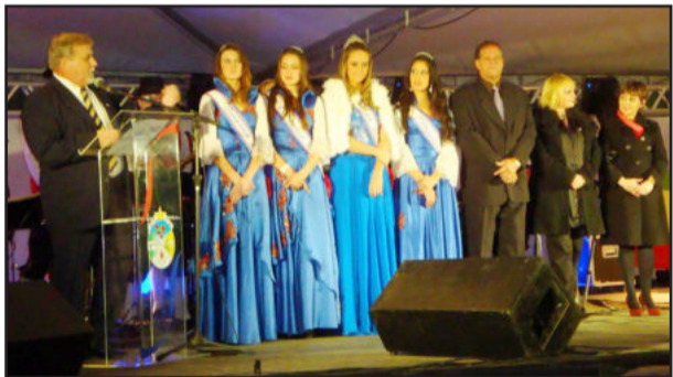
Prefeito (e) destacou conquistas nos 135 anos de Estrela

Finalizou dizendo que ama muito o Município e que luta por ele. “Amamos esta cidade, e quem ama cuida. Assim, Estrela será do tamanho do que nós, todos e todas, juntos, fizermos por ela. Por isso, reafirmo minha responsabilidade e meu compromisso do nosso Município continuar sendo o primeiro do Vale em desenvolvimento socioeconômico”.