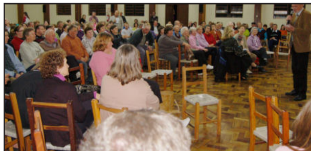
Participantes assistiram palestra do autor