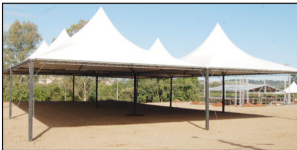
Palco alternativo terá área coberta para shows locais