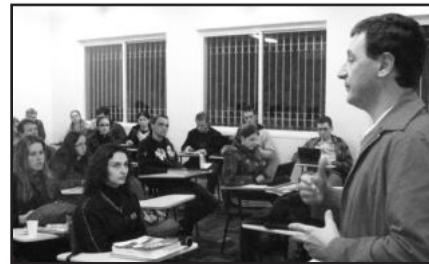
GTiC apresentou cenários e tendências da tecnologia para alunos da FISUL