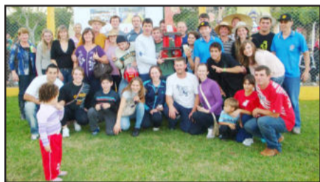
Equipe de Glória, campeã dos Jogos Germânicos 2011

Após cortar, um terceiro participante deveria pegar um machado e dividir ao meio uma madeira. Depois disso seguiram as provas de Pau de Sebo, Carinho de Mão, Cabo de Guerra, Aipim/Chopp (mulheres), Chopp/Rodobaca (homens), Charrete, Galinhas e a mais esperada da tarde, a prova do Javali, que consiste em uma dupla pegar dois javalis no menor tempo possível.