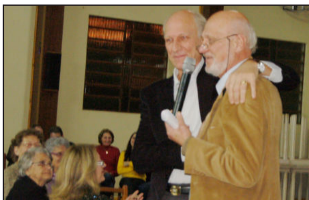
O agradecimento ao irmão