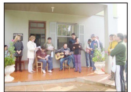
Oficinas de música proporcionam bem estar e resultam em apresentações