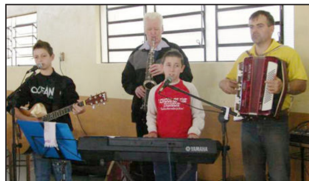
Centro Cultural 25 de Julho de São Pedro da Serra também revela talentos