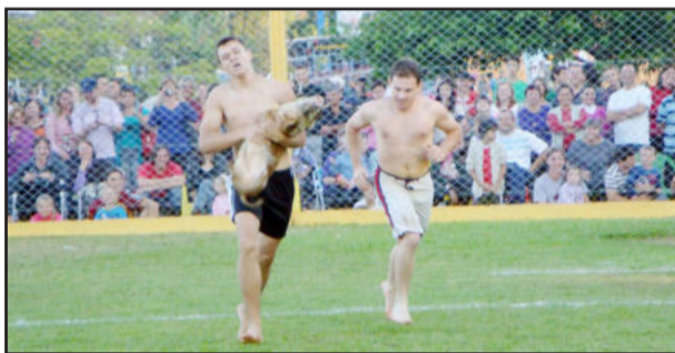
Uma das provas mais esperadas foi a captura do javali