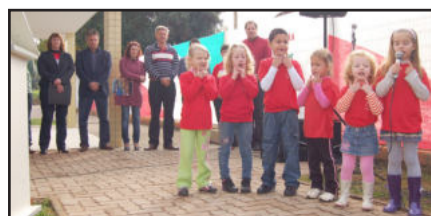
Alunos da EMEI 24 de Maio fizeram bonita apresentação