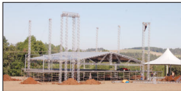
Palco principal está sendo montado para os shows