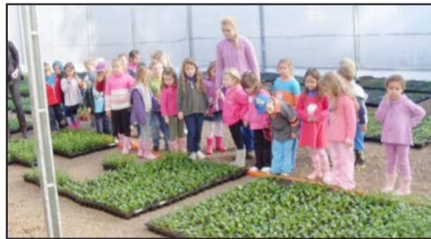
Crianças olharam as plantas de perto

As educadoras agradecem pela atenção e por oportunizar às crianças um passeio bem divertido e repleto de novas aprendizagens.