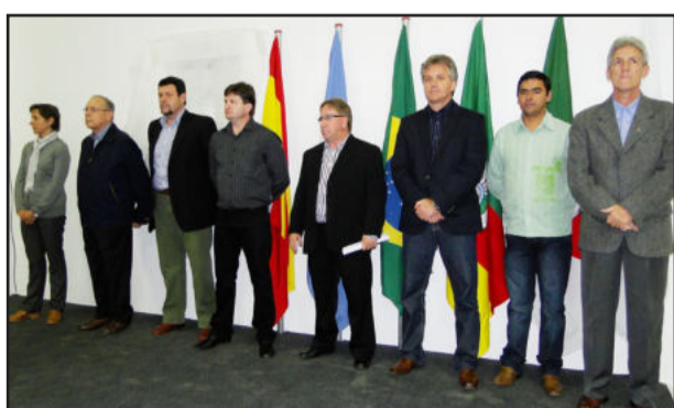
Autoridades que integraram o palanque oficial do evento