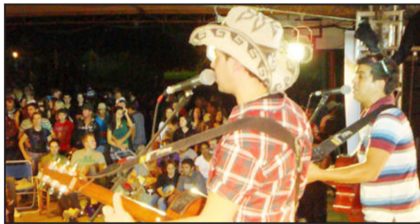
Cerca de cinco mil pessoas assistiram aos shows de encerramento do Maifest

faixas etária diversão, entretenimento, cultura e esporte. Atrações como o Cinema 3D, que divertiu as crianças e os adultos, uma novidade vinda do estado vizinho de Santa Catarina, deixaram boas lembranças na memória dos participantes. Exposição do Clube do Fusca, Dança de Rua, Grafite e competições, atrações tradicionais da festividade.