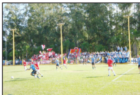
Torcidas gremistas e coloradas incentivaram os atletas durante as partidas