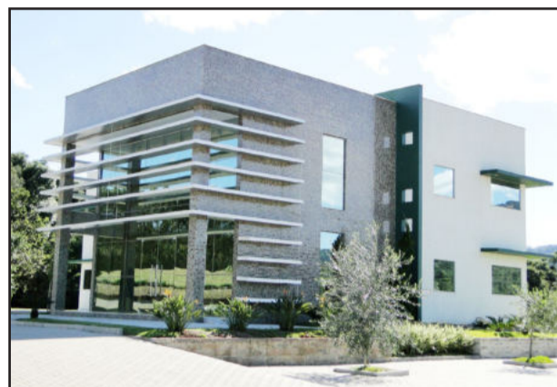
Área administrativa da Nutrifarma em Teutônia

Os acionistas são sócios da Nutrifarma e da Vetifarma, especializada em nutrição e saúde animal e líder de mercado na Argentina, contando com duas unidades fabris na cidade de La Plata.