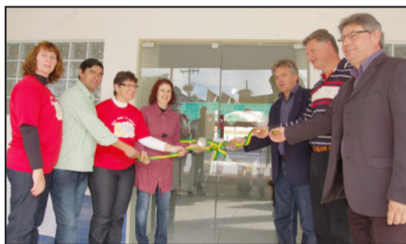
Inauguração é um marco na educação infantil de Teutônia