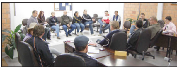
Lideranças se reuniram na Câmara de Vereadores