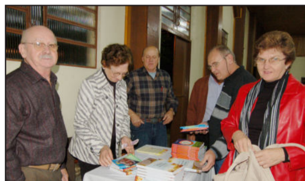
Comunidade aproveitou preço acessível para comprar todos os volumes do autor