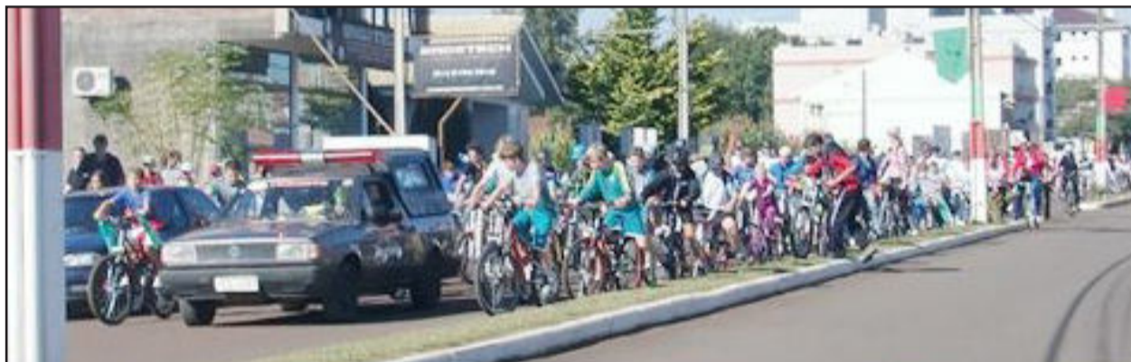
Ciclistas tomaram conta das ruas durante o passeio