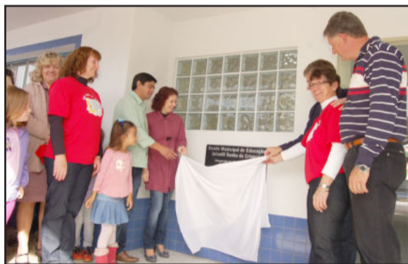
Momento importante para a história de Teutônia