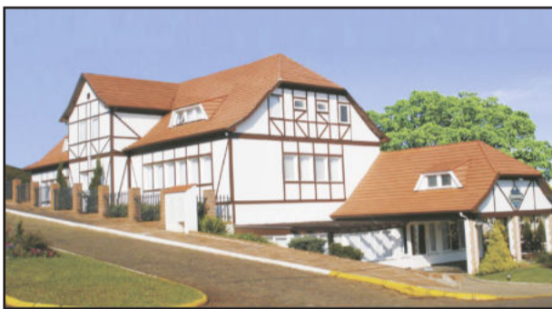
Baviera Park Hotel

A expectativa está inserida no nome Versare, cujo significado em latim é "voltar". Venha nos conhecer, e, o que é mais importante, volte sempre! A rede Versare tem como missão incentivar e gerar condições adequadas para que seus hotéis associados atuem de forma cooperada melhorando a competitividade e garantindo a fidelização dos clientes através de serviços de qualidade. Fidelidade não tem preço. Mas tem bônus. Os hóspedes que optarem pela Versare Rede de Hotéis ganham um bônus. É o Programa Versare de Fidelidade. Na hora de escolher um hotel para se hospedar nas suas viagens, pense em fidelidade com qualidade. Com o cartão do Programa de Fidelidade Versare, os gastos em estadias nos hotéis da Rede Versare geram um bônus, que poderá ser utilizado em qualquer hotel da rede.