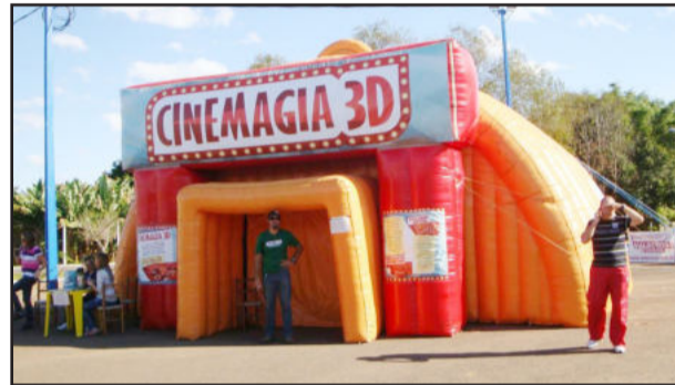
Cinema 3D tornou a experiência de assistir filmes diferente