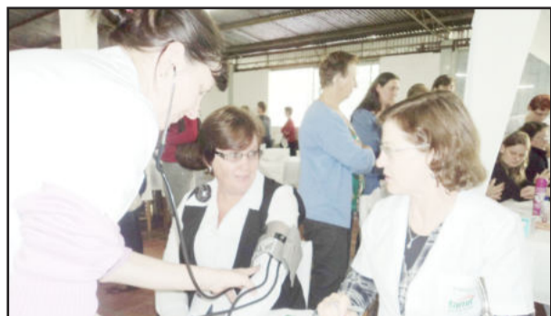
Associadas mediram a pressão na tenda da Famit