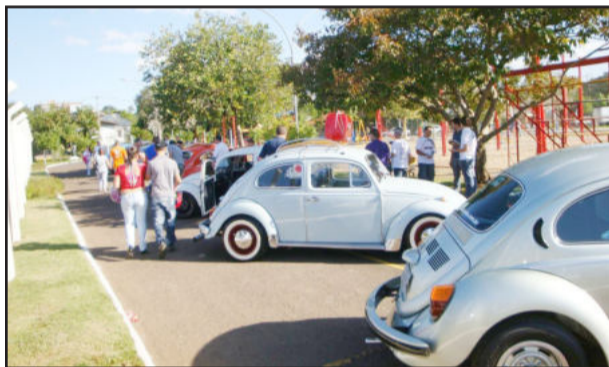
Exposição do Clube do Fusca levou relíquias ao Parcão