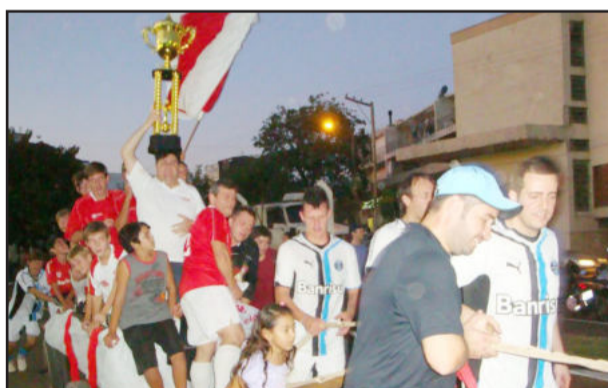
Gremistas tiveram que puxar a carroça cinco vezes