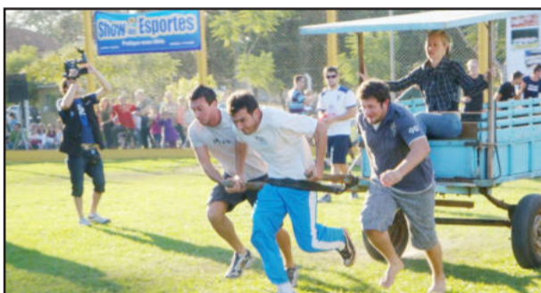
Provas desafiaram as equipes em rapidez, agilidade e força