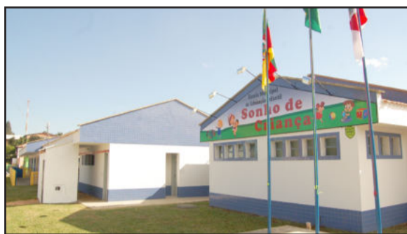
EMEI Sonho de Criança fica no Bairro Canabarro