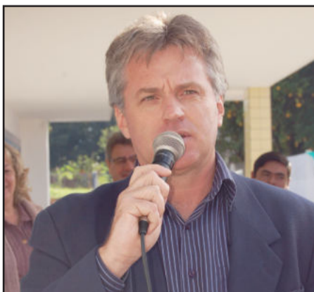
Prefeito de Teutônia, Renato Airton Altmann

A população de Teutônia recebeu um presente de aniversário diferente na manhã de sábado, dia 21 de maio, quando a Administração Municipal inaugurou mais uma importante obra. A Escola Municipal de Educação Infantil (EMEI) Sonho de Criança, situada na Rua Edmundo Carlos Bervig, no Bairro Canabarro, atenderá neste primeiro momento 70 crianças, que preencheram os pré-requisitos estabelecidos pelo decreto municipal e com aval das entidades representativas.