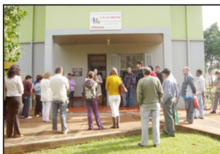
Dia Antimanicomial foi comemorado em Teutônia

"Saúde mental é a busca de uma melhor qualidade de vida apesar da existência de algum sofrimento ou transtorno. Não significa a ausência completa de qualquer tipo de sofrimento psíquico ou problemas emocionais. Dessa forma, saúde e doença são aspectos que podem estar presentes em um mesmo indivíduo. A saúde mental está relacionada a um somatório de fatores pessoais, biológicos, familiares e das relações sociais do indivíduo. Estar em boas condições de saúde mental significa estar de bom consigo mesmo e com os outros, aceitar as exigências da vida, saber lidar com as boas emoções e também com as desagradáveis, reconhecer seus limites e buscar ajuda quando necessário."