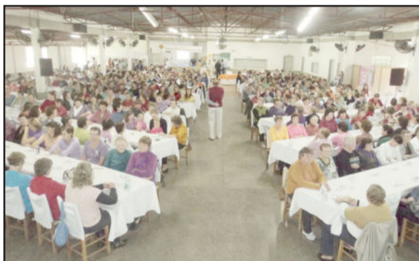
Associação da Languiru recebeu 500 associadas

No dia 19 de maio, realizou-se na Associação dos Funcionários da Languiru, o 7º Chá das Mães da Cooperativa Languiru. Procurando incentivar a integração e homenagear as associadas, o tradicional evento foi prestigiado por 500 produtoras rurais. Através da participação de parceiros, a cooperativa ofereceu atenção especial para esposas, filhas e noras de associados que residem na propriedade. Na tenda da Famit, as associadas podiam medir a pressão artificial ou usufruir de serviços de manicure. Já a Ervateira Ximango disponibilizou erva e água quente para as associadas tomarem chimarrão.