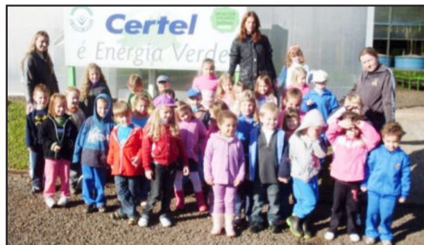
Turma visitou o viveiro da Certel