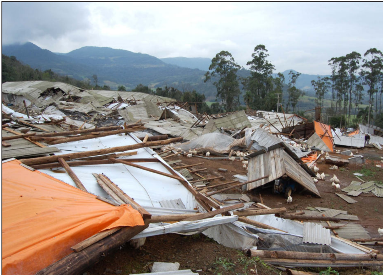
Na região alta três pavilhões foram destruídos