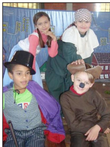
Alunos em cena no teatro

Com o objetivo de culminar a primeira etapa do projeto em 2010, foram apresentadas as seguintes peças: O Menino Narigudo, A Formiguinha e a Neve, O Macaco e a Velha, Um Assalto Inusitado, Pare, Olhe e Siga!. Estudantes das escolas municipais 24 de Maio, do Loteamento 8, e Teobaldo Closs, do Bairro Canabarro apreciaram o trabalho desenvolvido pelos colegas, que demonstraram muito talento e criatividade na montagem do espetáculo.