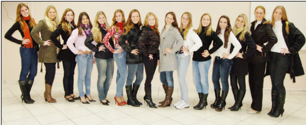
As 15 candidatas participam de testes neste sábado

As 15 candidatas que concorrem aos títulos de soberanas de Teutônia passam pela primeira avaliação hoje, no Centro Administrativo. A partir das 8h, elas participarão de um Curso de Maquiagem com uma equipe de profissionais que darão dicas de como se maquiagem.