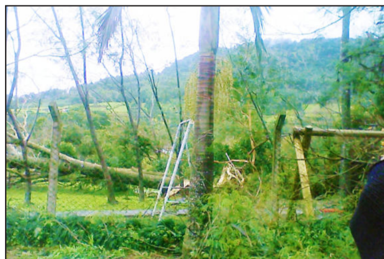
Árvores caíram no pátio da escola