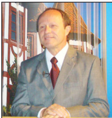
Cenci será condecorado em agosto

Foram analisados os seguintes critérios de avaliação: participação da comunidade nas definições do Plano Plurianual, Lei de Diretrizes Orçamentárias e do Orçamento anual (porcentagem do orçamento municipal definido por meio da participação popular); percentuais investidos em educação e