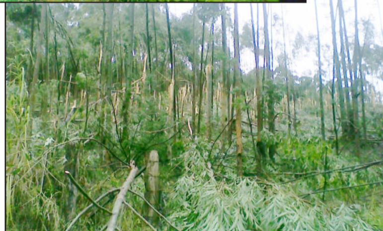
Granizo causou estragos em matos