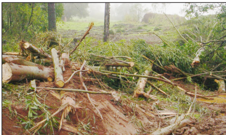
Árvores foram arrancadas pelo vento