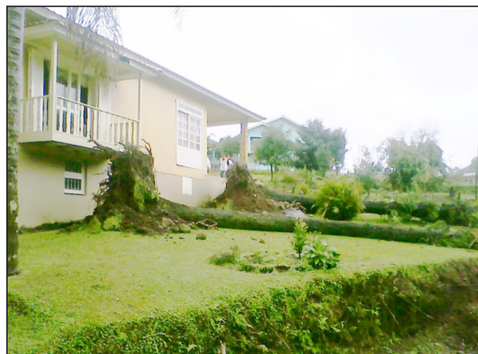
Vento arrancou árvores de frente de casa