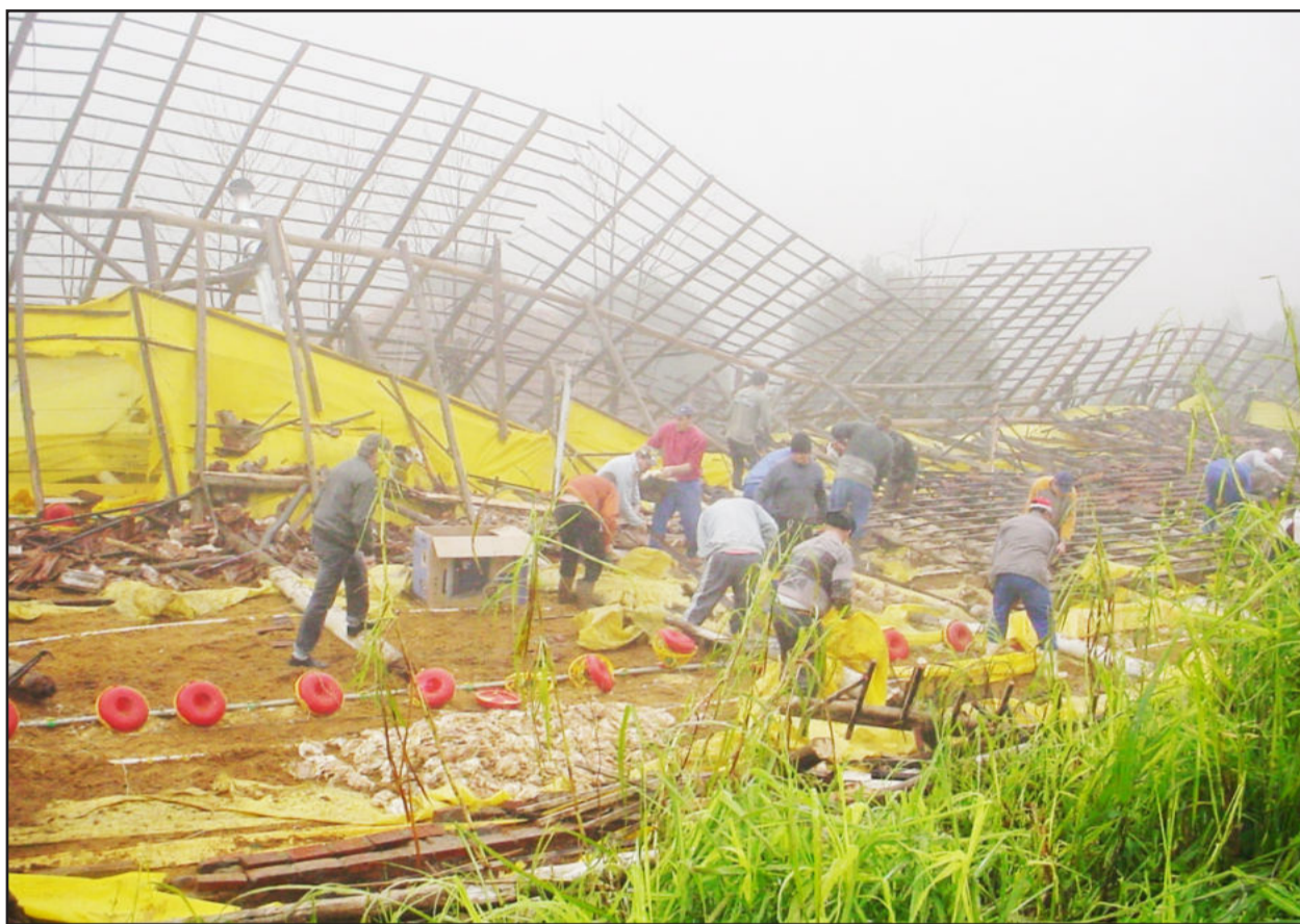
Aviário de Radavelli ficou completamente destruído