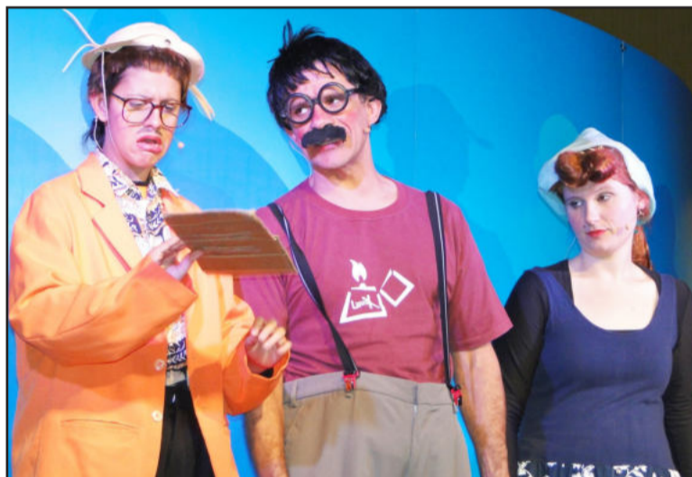
Situações do cotidiano foram apresentadas com muito bom humor

mão-de-obra teutoniense, com reflexos também na qualidade de vida da população, acrescentando que hoje o comércio representa 8,2% da economia de Teutônia.