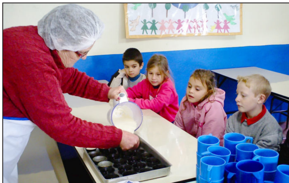
Oficina possibilitou integração entre gerações