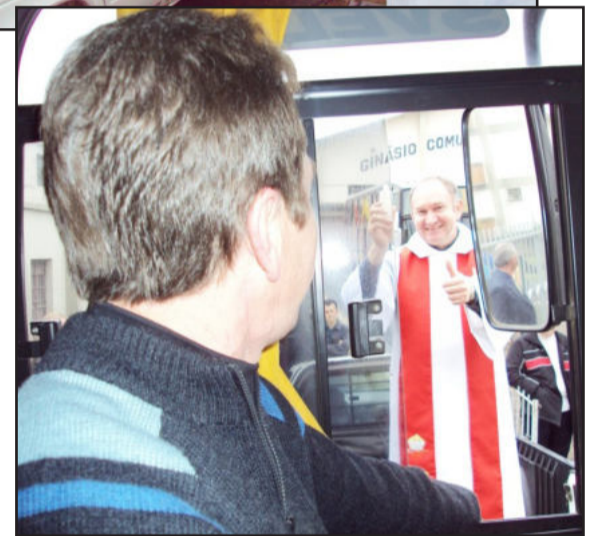
Padre abençoará veículos e motoristas