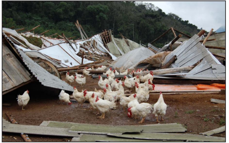
Galinhas poedeiras ficaram sem teto