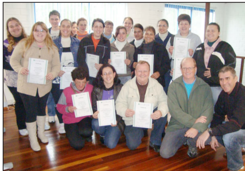
Formandos já estão trabalhando na indústria