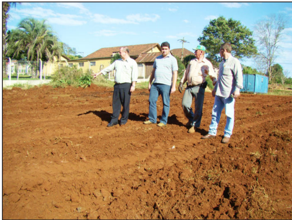
Prefeito, engenheiros e operador de máquina avaliam terraplanagem

A administração municipal iniciou a obra de uma cancha coberta em frente à Escola de Ensino Fundamental Professora Gonçalves Pinto Vilanova, na Cidade Baixa. O empreendimento servirá para prática esportiva de alunos da escola e moradores locais. O tamanho do pavilhão será de 40 por 25 metros e a quadra de 31 por 18 metros.