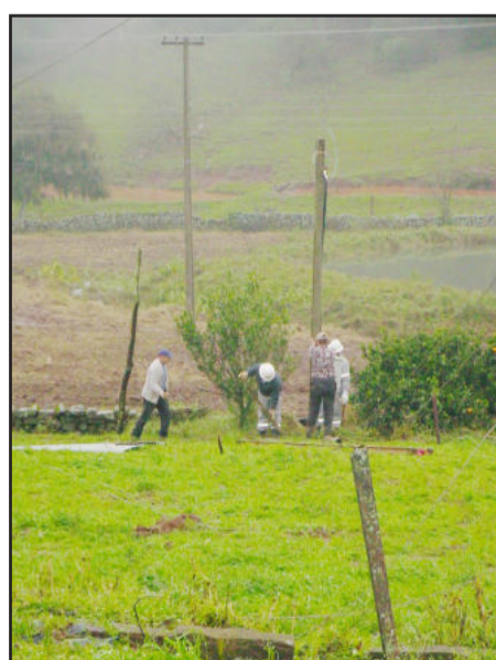
Rede elétrica danificada