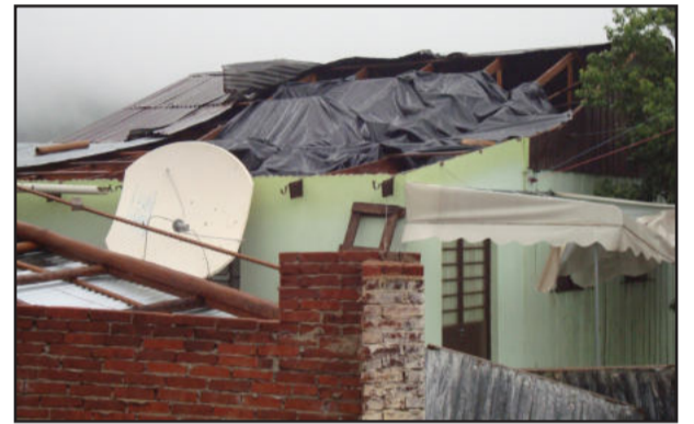
Casas destelhadas e parabólicas destruídas