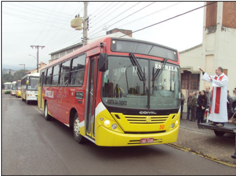
Procissão terá centenas de veículos