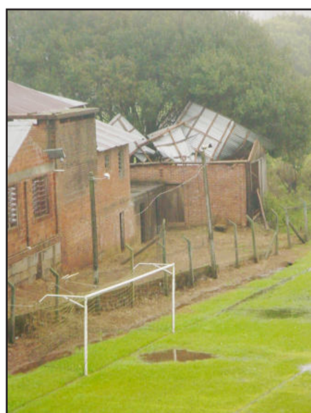
Prédio antigo do Palmeiras teve telhado arrancado