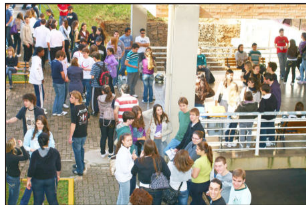
Alunos retornam para o segundo semestre

O semestre B/2010 da Univates inicia, para os mais de 11 mil alunos da instituição, na próxima segunda-feira, dia 26. Para receber os alunos, a Univates programa para o dia 13 de agosto o “Festival de Bandas Volume 3”, com o lançamento do CD “Festival de Bandas 2008/2009”. O evento inicia às 20h30min, junto com a Festa dos Bixos do DCE. As bandas que venceram a sexta e a sétima edições do Festival irão se apresentar e haverá a divulgação da oitava edição. Vale lembrar os acadêmicos das mudanças que passaram a vigor no semestre passado: a nota mínima para aprovação na Univates agora passou a ser 6,0 e o exame final foi abolido. Foram atribuídas e registradas três notas por semestre, com forma de obtenção das notas a critério do professor. Os horários das aulas também foram modificados: manhã, das 8h20min às 11h40min; tarde, das 13h30min às 16h50min; e noite, das 19h10min às 22h30min. Os turnos de aula aumentaram para 18, sendo 17 turnos presenciais e um turno de Trabalho Discente Efetivo (atividade não presencial). Visando ao oferecimento de novas vagas para veículos e motocicletas, a Univates programa a construção de novo estacionamento. As obras estão em andamento. O espaço terá aproximadamente 1,2 mil metros quadrados de área e espaço físico para 460 veículos e 89 motocicletas. Será localizado próximo ao Prédio 1 da instituição, onde atualmente encontram-se campo de futebol e estacionamento de