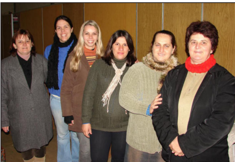
Integrantes da equipe do CRAS

procurando atender da melhor maneira possível essas pessoas que necessitam desse apoio, uma vez que conquistamos a confiança da comunidade. As roupas que não servirem podem ser trocadas no próximo mês", informou.