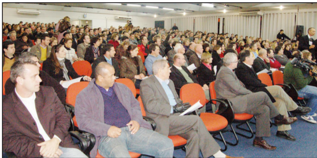
Cerca de 500 pessoas acompanham encontro com candidatos a governador em Lajeado

E m busca do voto consciente e atentos a todos os detalhes das propostas de governo, cerca de 500 pessoas participaram do Encontro com os Candidatos a Governador, na noite de terça-feira, dia 20 de julho. Tarso Genro (PT), Yeda Crusius (PSDB) e José Fogaça (PMDB) foram os convidados presentes ao auditório do prédio 7 da Univates, em Lajeado.