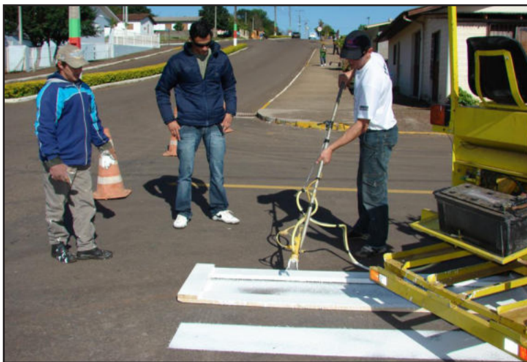
Novo equipamento de pintura permite economia de mão de obra, tempo e custos

A Rua Carlos Arnt, do Bairro Canabarro, recebeu a pintura da faixa central da via, com tinta branca no trecho em que a via tem sentido único. Também houve a pintura