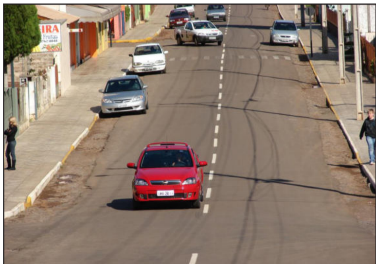
Pintura da faixa central da Rua Carlos Arnt foi realizada na semana passada

em outros pontos da zona urbana. No interior praticamente todas as comunidades já foram atendidas com a pintura das faixas centrais das estradas asfaltadas, faltando apenas atender a localidade da Linha Harmonia. "Caso o tempo colabore, esperamos finalizar o serviço nos próximos dias em todas as comunidades", explica Quadros.