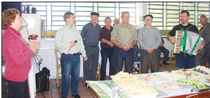
Cantos sempre fazem parte dos encontros mensais