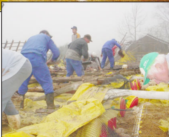
Voluntários ajudaram na separação de aves vivas e mortas

O temporal que afetou a localidade de Paissandu, em Westfália, no início da noite desta quarta-feira, dia 21, gerou muitos estragos e causou pânico entre os moradores. Ventos fortes, chuva de granizo e chuva forte deixaram um rastro de destruição. Muitas propriedades foram atingidas. Na manhã desta quinta-feira, a reportagem da Folha Popular foi conferir os estragos causados.