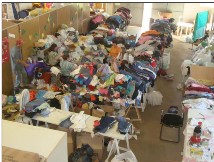
Cerca de 5,7 mil peças foram retiradas nos quatro primeiros dias junto ao CRAS