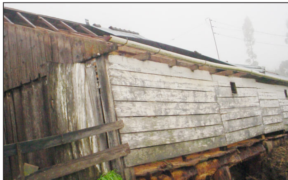
Galpão teve telhado arrancado