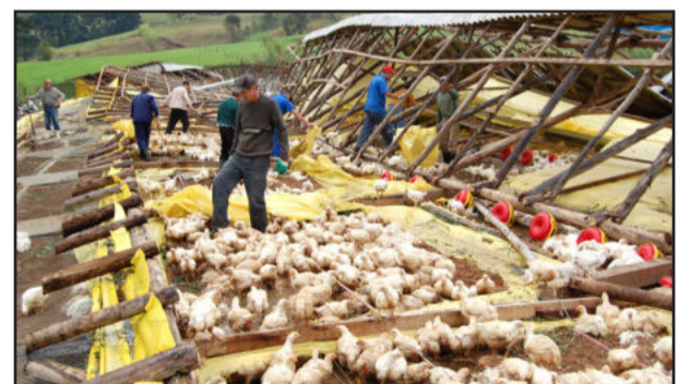
Comunidade e autoridades unidas na quinta-feira