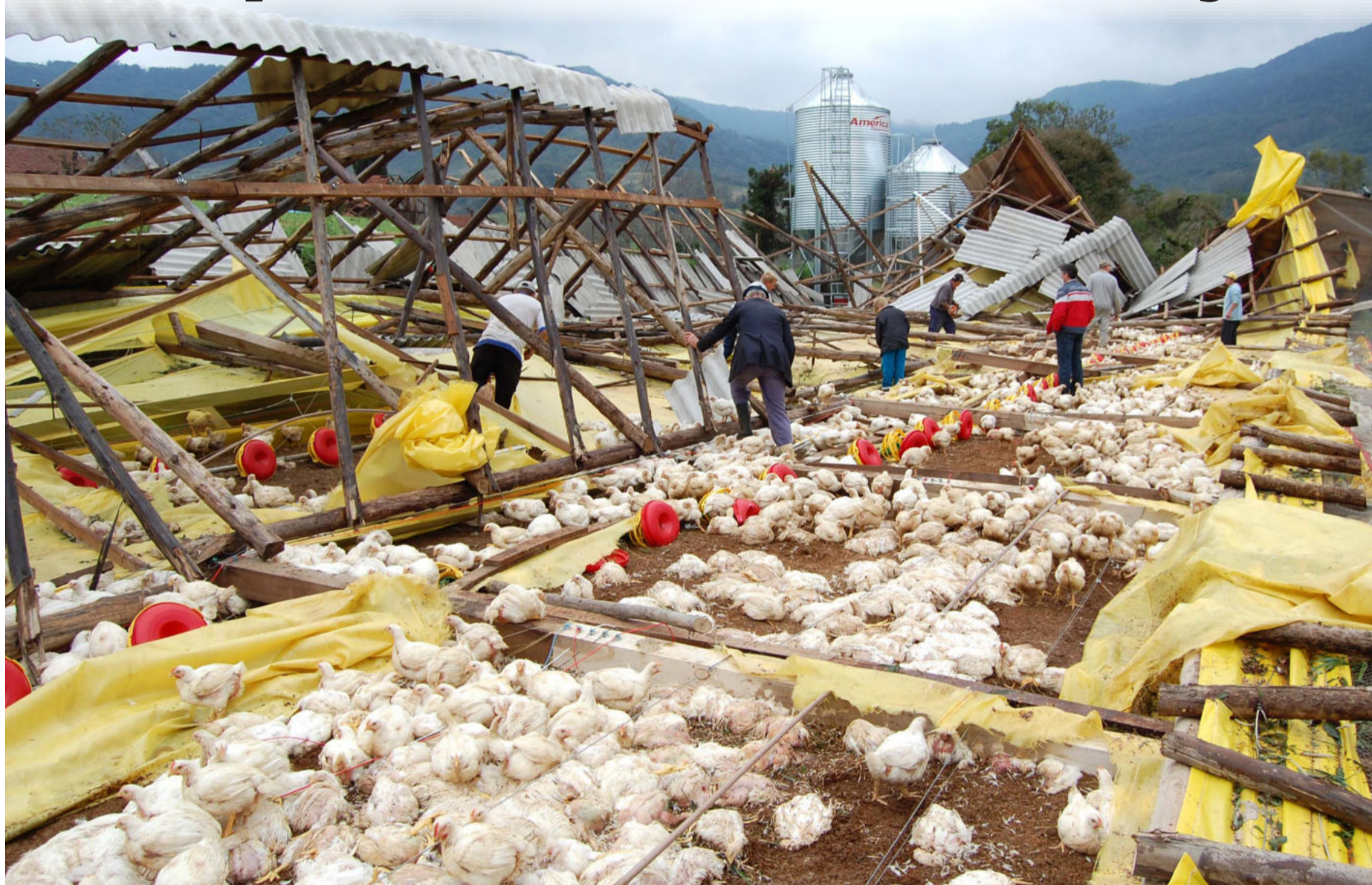
Ventos e chuva de granizo destruíram aviários em Imigrante (foto) e Westfália e provocaram estragos em Poço das Antas. Páginas 12, 13 e 15

As candidatas para soberanas da Fenachamp