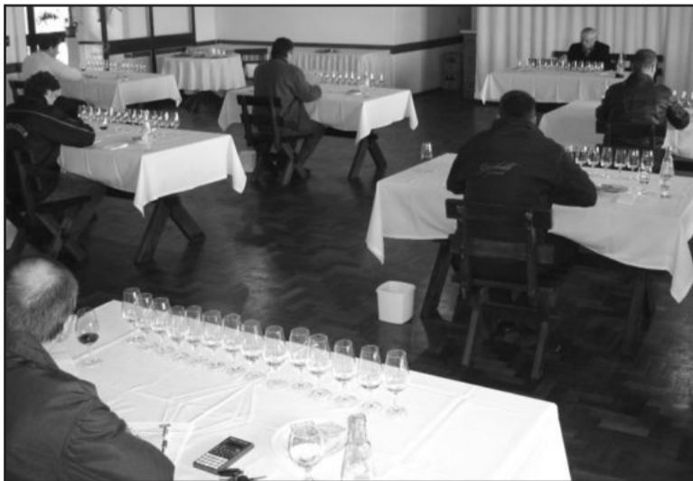
Avaliação encerra hoje

Outra mudança para a escolha é a inclusão de vinhos tintos finos engarrafados de qualquer safra e o suco de uva integral. Conforme Vaccaro, o vinho engarrafado foi uma indicação dos próprios associados, pois os produtos premiados poderão usar esta conquista com mais ênfase na divulgação, alavancando as vendas por conta da conquista. Quanto ao suco de uva, disse que Garibaldi já está bem avançada na produção de sucos e que a inclusão neste concurso é justamente para aumentar a competitividade e qualidade dos mesmos. A