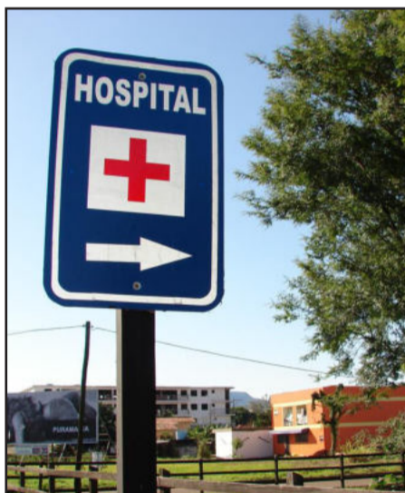
Colocação de placas indicam pontos do Município

> Matrículas para a EJA - As escolas municipais de Ensino Fundamental Teobaldo Closs, do Bairro Canabarro, e Leopoldo Klepker, do Bairro Alesgut, dispõem de vagas para alunos interessados em frequentar as turmas de Educação de Jovens e Adultos (EJA). As matrículas e rematrículas estão abertas até 2 de agosto, nas secretarias dos dois educandários, das 7h30min às 11h30mi e das 13h às 17h. Para efetuar a matrícula é necessários o histórico escolar, certidão de nascimento ou documento de identidade, comprovante de endereço, comprovante de vacinação, uma foto 3x4 recente, atestado de trabalho diurno, documento de um responsável no caso do aluno ser menor de idade, e se necessitar de transporte escolar mais uma foto. É necessário que o aluno tenha 15 anos de idade completos.