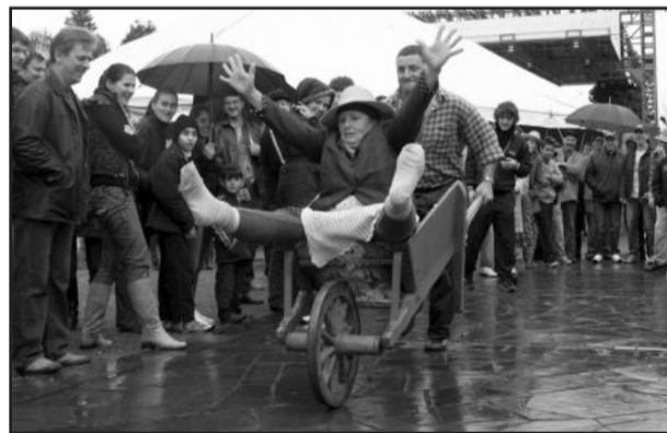
Provas despertaram curiosidade

As rotinas rurais tratadas de uma forma divertida animaram o público no domingo, no Parque da Estação, durante a Primeira Olimpíada Colonial. Cerca de 50 pessoas participaram das provas de Bisca, Revezamento de Salame, Corrida de Carriola, Arremesso de Queijo, Produção de Bigoli, Transporte de Leite e Subida no Pau de Sebo.