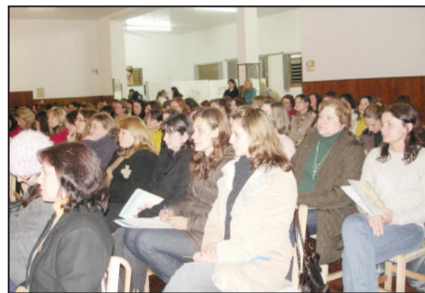
Curso segue hoje e amanhã

A Secretaria Municipal de Educação e Cultura promove mais uma etapa do Curso de Atualização para Profissionais da Educação. Os trabalhos serão retomados na sexta-feira e sábado, dias 25 e 26, nas escolas Santo Antônio e Pedro Cattani. A capacitação, que busca qualificar o ensino oferecido em Garibaldi, teve sua abertura no dia 11, no salão Santo Antônio, no bairro Champagne. Já no dia 12, os educadores participaram das oficinas, oferecidas nos turnos da manhã e tarde.