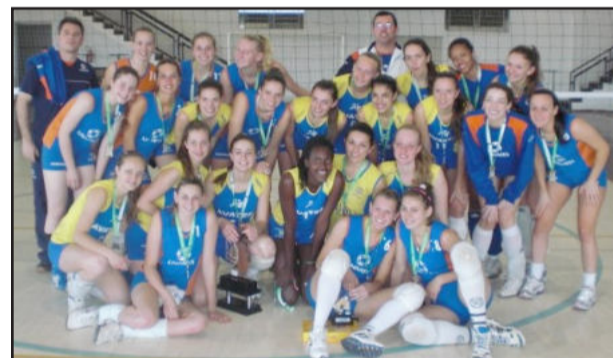
Mês de setembro foi de comemorações para as diversas categorias da Avates

Já no domingo, a equipe mirim, que também foi campeã do Troféu Lajeado neste mês, vai até Novo Hamburgo participar de um torneio e continuar sua preparação para a próxima etapa do Campeonato Estadual da categoria, no qual já disputou três partidas e segue invicta.