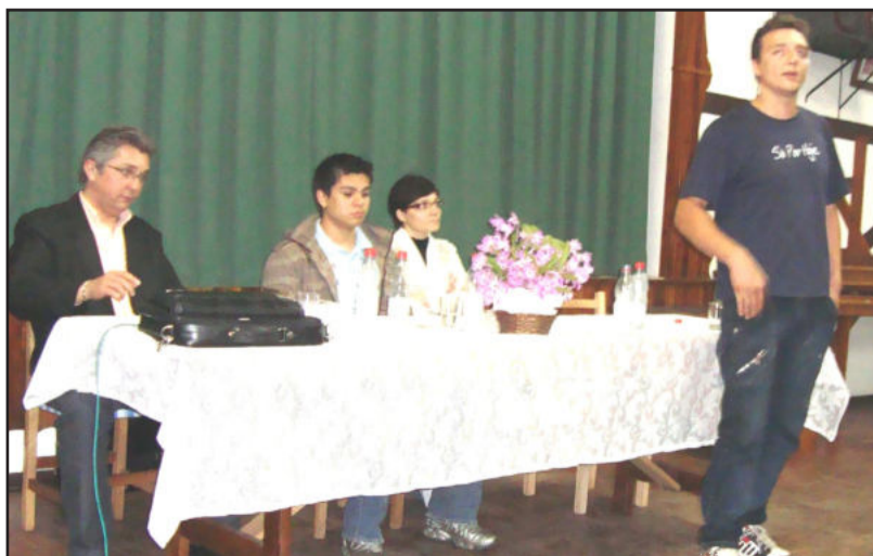
Experiências apresentadas emocionaram o público

A diretoria da Oase agradece ao apoio no geral de toda a comunidade, assim como, ao coralzinho da Escola 25 de Maio que abrilhantou o programa, a diretoria da Comunidade Evangélica, que cedeu o local, e ainda, àquelas pessoas voluntárias, que trabalharam e apoiaram, tornando a programação um sucesso.