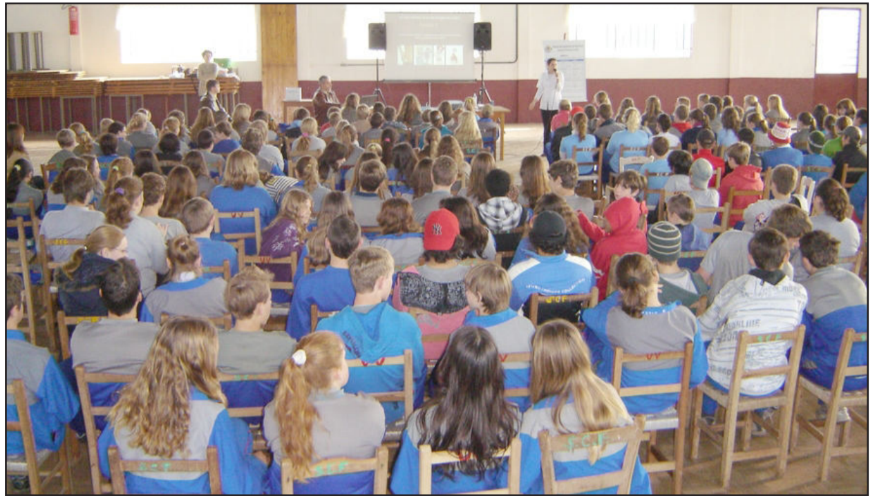
Mais de 250 jovens de duas escolas assistiram às palestras

No dia 15 deste mês, a Secretaria da Saúde de Westfália organizou grupo de jovens com palestras para alunos de quinta à oitava séries do Ensino Fundamental das escolas municipais Vila Schmidt e Olavo Bilac e com os alunos do Ensino Médio Escola Estadual Westfália nas dependências da Sociedade Esportiva Fluminense, nos turnos manhã, tarde e noite com a participação de 256 estudantes. As