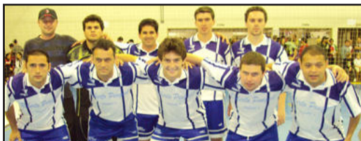
Grenal, equipe do força livre

A abertura será com um jogo de veteranos entre Juma Liguigás/Amigos do Benini e Lojas Vargas, colocando em quadra estrelas do futsal. Depois, tem uma partida do Feminino, quando Transportes Majuel/1 metro e 60 enfrenta a Academia Mega Sports. Mais um jogo de veterano dá sequência à rodada, entre Bolamar e Viracopos. Para fechar, jogo pela Chave C do força livre, entre Bebe Tudo e Glicose Roca Sales.