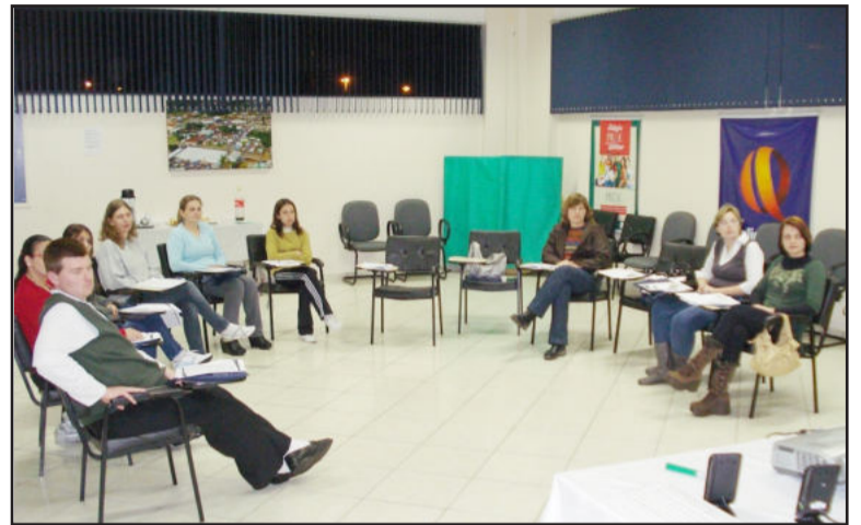
Curso contou com a participação de dez pessoas

A Câmara de Indústria e Comércio (CIC), em parceria com a Câmara de Dirigentes Lojistas (CDL) de Porto Alegre, promoveu o curso Recepção e Atendimento. O evento, realizado de 15 a 17 desse mês, contou com a participação de dez pessoas e teve por objetivo desenvolver com qualidade as atividades de recepção, considerando as condutas e a comunicação adequadas à função, a apresentação pessoal e a qualidade no atendimento. O conteúdo programático destacou postura profissional, uso adequado da voz, qualidade no atendimento, imagem do recepcionista, comunicação e relações públicas e formas de atendimento.