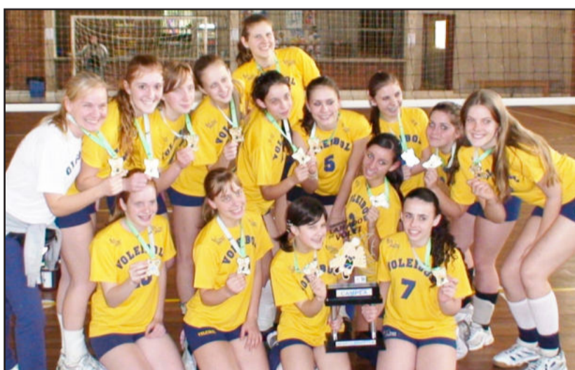
Equipe Dom Alberto foi campeã pela categoria Infantil Série Prata

Foram destinados troféus e medalhas às equipes colocadas do 1º