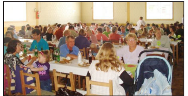
Comunidade prestigiou a promoção

A comunidade do Bairro Boa Vista se mobilizou e participou, no sábado, dia 19, da galinhada beneficente em prol da Creche Infantil Boa Vista. Com o apoio do Gabinete da Primeira-Dama, que tem como propósito executar o voluntariado e através deste auxiliar entidades e/ou pessoas, mobilizou-se diretoria e funcionários da creche para realizar o evento, que teve amplo sucesso pela adesão dos moradores.