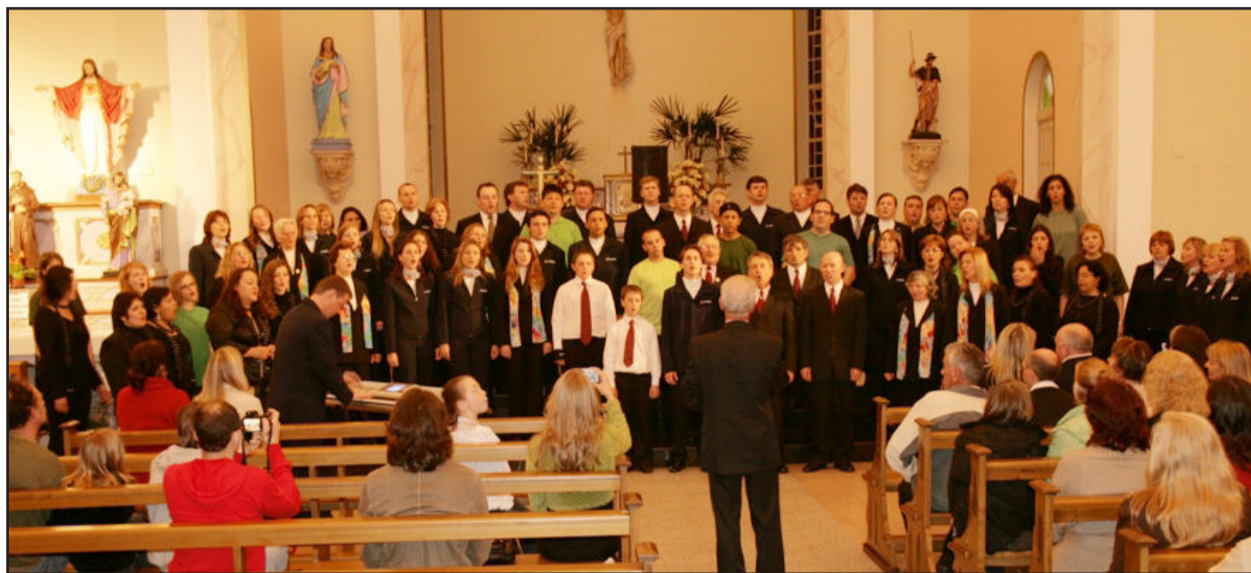
Corais se apresentaram na Igreja Matriz

Com participação de quatro coros de Carlos Barbosa, Teutônia, Caxias do Sul e Novo Hamburgo, aconteceu na noite de sexta-feira, dia 18, na Igreja Matriz, o I Festival de Coros. O evento faz parte da programação em homenagem aos 50 anos de emancipação de Carlos Barbosa, com apoio da Prefeitura e Proarte.