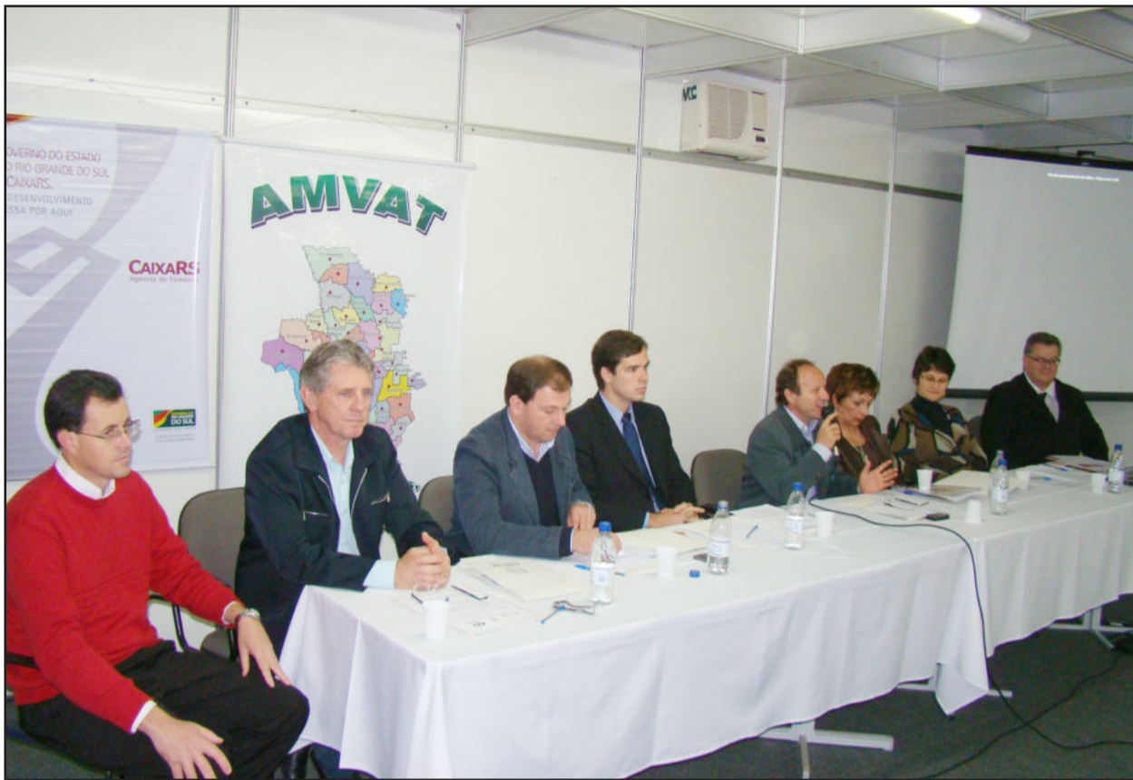
Encontro reuniu prefeitos e lideranças empresariais