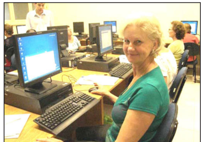
Curso terá 24 vagas para aprender informática

As inscrições podem ser feitas na Casa da Cidadania, anexa a Secretaria Municipal da Saúde e Assistência Social, ou através do telefone 3981-1052.