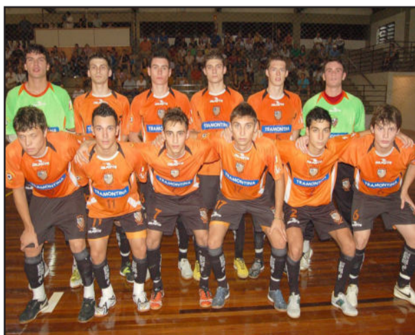
Equipe Juvenil precisa vencer em casa

No sábado, três jogos foram disputados na cidade de São Marcos, pela Copa Nordeste, entre a ACBF e a AMSM. Pela