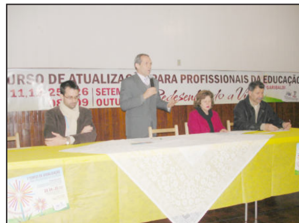
Prefeito (em pé) na abertura do curso