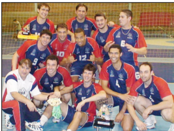
Colégio Cristo Redentor Ulbra foi campeão na categoria Adulto Masculino

ser, disse que a competição atingiu seu objetivo, incentivando a prática do voleibol e, simultaneamente, proporcionando momentos de integração entre os atletas.