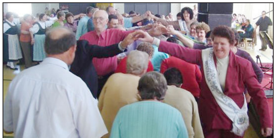
Encontro da integração de idosos de 2008

Nesta quinta-feira, dia 24, no ginásio de esportes do Juventude, de Linha Berlin, ocorre extensa programação em comemoração a Semana Municipal da Pessoa Idosa. A programação começa às 9h30min com a recepção dos convidados; 10h abertura oficial, seguida de momento de espiritualidade com o pastor, apresentações artísticas, nomeação do rei e rainha dos idosos do Município e baile com animação do Contato Show.