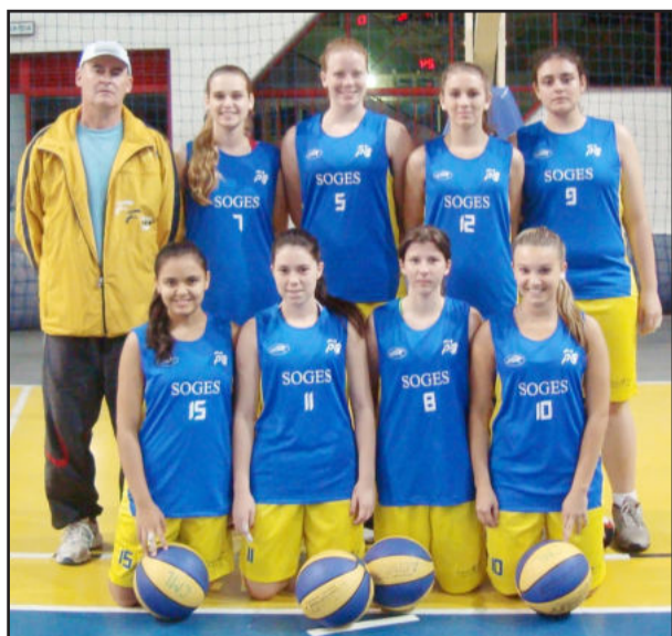
Equipe massacrou o adversário