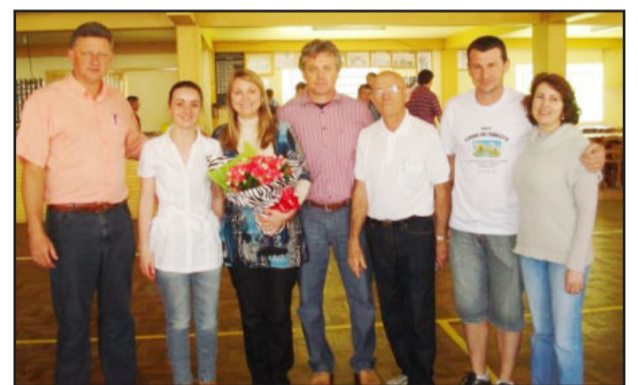
Representantes da administração municipal

Como o Gabinete da Primeira-Dama busca trabalhar em rede, foram envolvidos as secretarias de Saúde, de Educação, de Obras e de Administração e o Departamento de Compras, enfim, parceiros que se mobilizaram para tornar o evento um grande sucesso, com mais de 250 cartões vendidos. A renda do almoço será revertida em brinquedos e equipamentos para a creche.