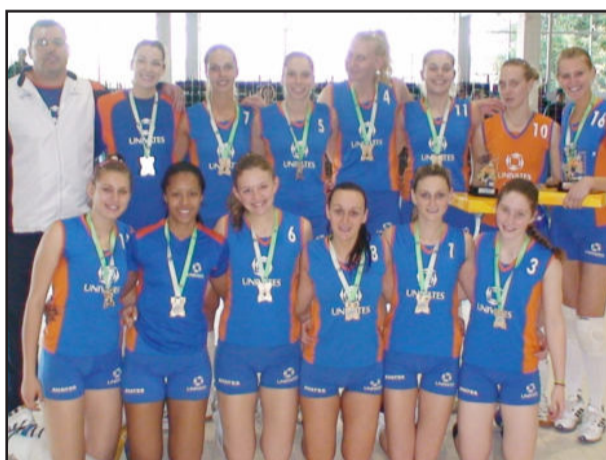
Equipe da Univates/Avates sagrou-se campeã na categoria Adulto Feminino