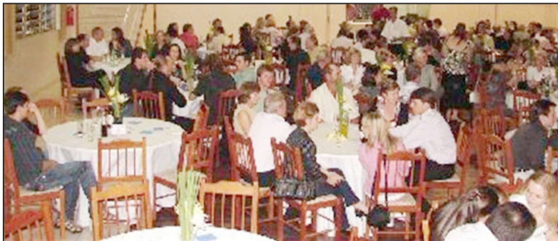
Evento terá jantar e baile

Neste sábado, dia 26, às 20h, o Instituto de Educação Cenequista General Canabarro (Iceceg) realizará o 4º Jantar-Baile, junto à Associação Pró-Desenvolvimento de Languiru,