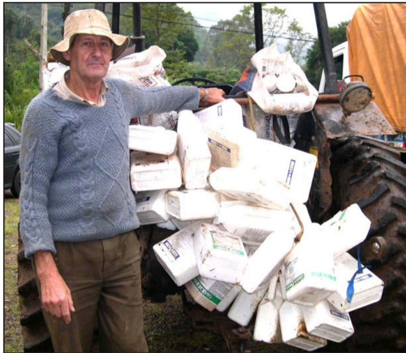
Scheffler faz a tríplice lavagem das embalagens

Ambiente - Protege o meio ambiente e reduz os riscos de contaminação, além de facilitar o encaminhamento para os pontos de coleta e viabilizar a reciclagem do material.