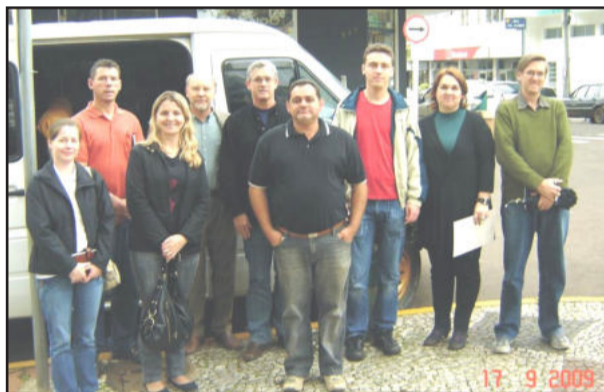
Integrantes do Conselho que visitaram a propriedade