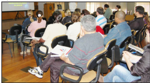
Curso tem encontros semanais