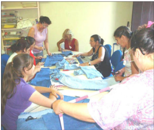
Patchwork é uma das oficinas oferecidas

As inscrições ocorrem no CRAS, na Casa de Cidadania, e são gratuitas, incluindo material para a realização dos trabalhos. Mais informações 3981-1052.