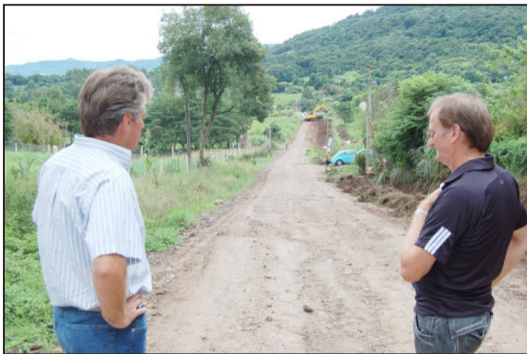
Prefeito (e) e secretário verificam início da obra

A obra é fruto de um convênio entre a Prefeitura de Teutônia e o Departamento Autônomo de Estradas de Rodagem (Daer), órgão ligado ao governo do Estado. O convênio foi celebrado no dia 21 de dezembro de 2009, em solenidade realizada nos Jardins do Palácio Piratini, em Porto Alegre, com a presença da governadora Yeda Crusius e do diretor-geral do Daer, engenheiro Vicente Paulo Mattos de Britto Pereira.