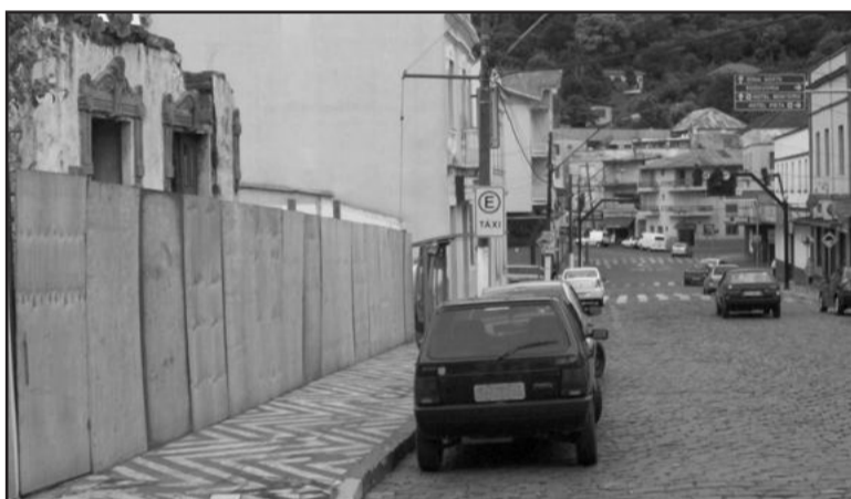
Passeio público liberado para pedestres e local de ponto de táxi é questionado

questões relativas ao Serviço de Atendimento Móvel de Urgência (Samu) para Garibaldi. Na ocasião foi confirmado envio de uma ambulância básica para nossa cidade. Sua manutenção será custeada com 50% de recursos federais, 25% com recursos do Estado e 25% com recursos do Município”, revelou.