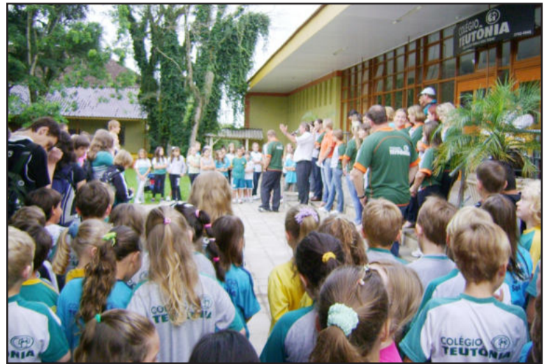
Alunos foram recebidos no pátio da escola

O Colégio Teutônia ainda conta com algumas vagas para os cursos técnicos, com possibilidade de ingresso nas turmas durante o ano letivo, pois a matrícula é por componente curricular. Mais informações podem ser obtidas na secretaria da escola, pelo telefone (51) 3762-4040 ou pelos e-mails areatecnica@colegioteutonia.com.br e marcio@colegioteutonia.com.br.