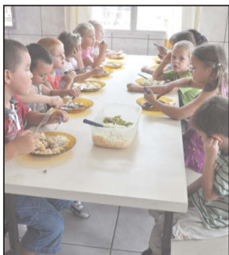
Crianças que ficam no Turno Integral recebem almoço