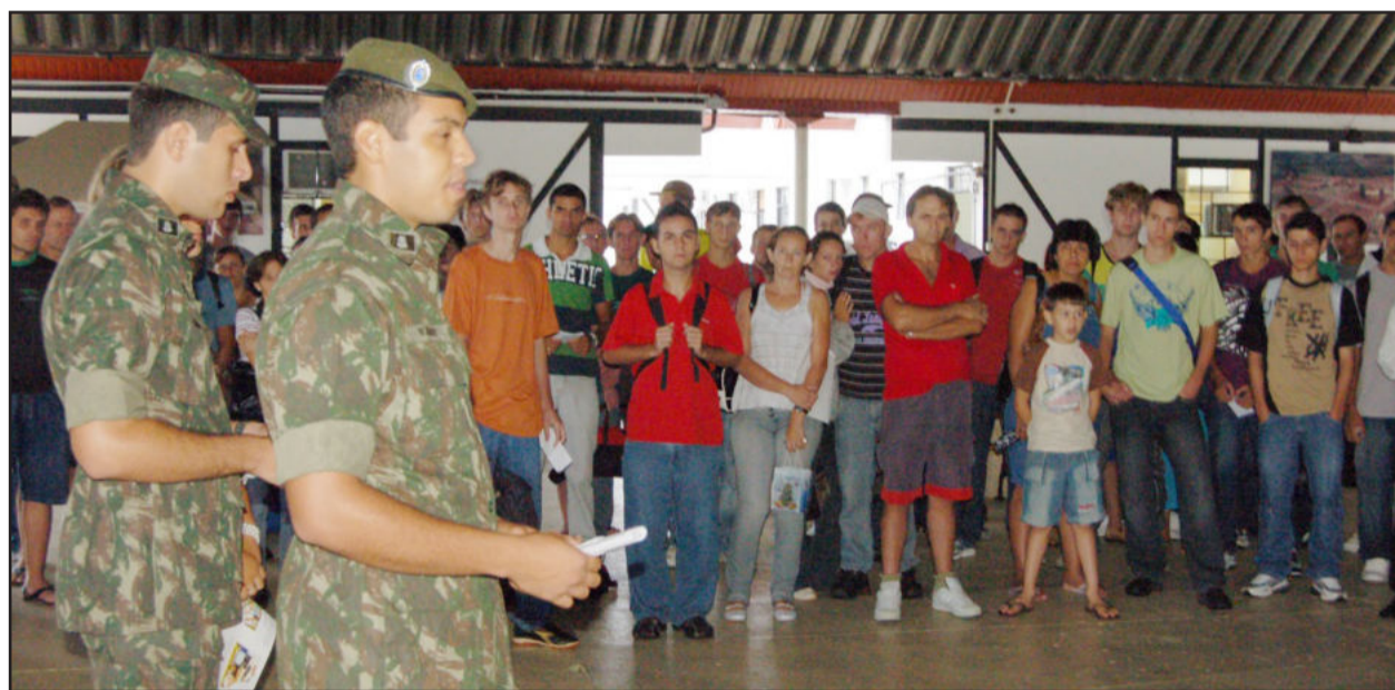
Embarque foi nesta quarta-feira

Na manhã desta quarta-feira, dia 24, os 76 jovens teutonienses da classe de 1991 selecionados em Teutônia embarcaram em dois homens com destino à cidade de São Gabriel, em uma viagem de 6 horas. Lá, os recrutas prestarão o serviço militar no 6º Batalhão de Engenharia e Combate (BEC).