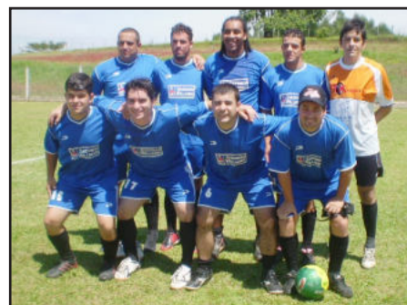
Taquari foi campeão do torneio