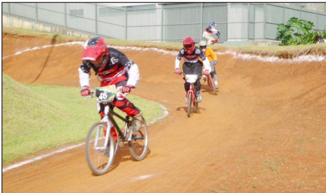
Competição ocorre no próximo domingo, dia 28

A segunda etapa do Campeonato Gaúcho será em Santa Cruz do Sul, no dia 14 de março.