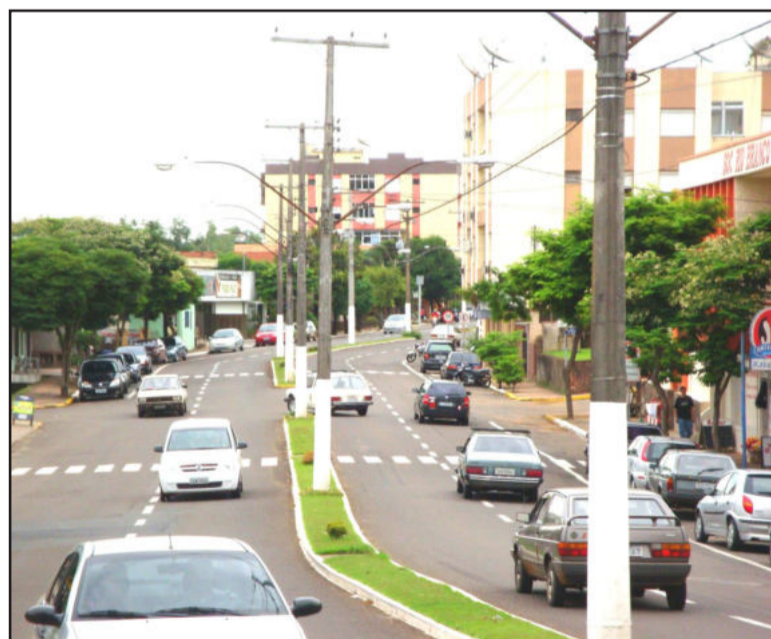
Avenida Rio Branco é o principal acesso à cidade de Estrela

A Prefeitura de Estrela está investindo na ampliação da segurança do trânsito. Além de reforço nas sinalizações vertical e horizontal do Centro e dos bairros, está sendo encaminhado processo licitatório visando a aquisição e instalação de mais um conjunto de semáforos na cidade.