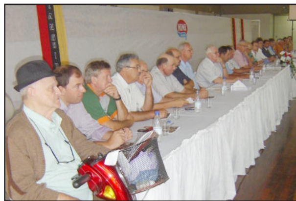
Mesa oficial e convidados

A Cooperativa Languiru também tem previstos inves-