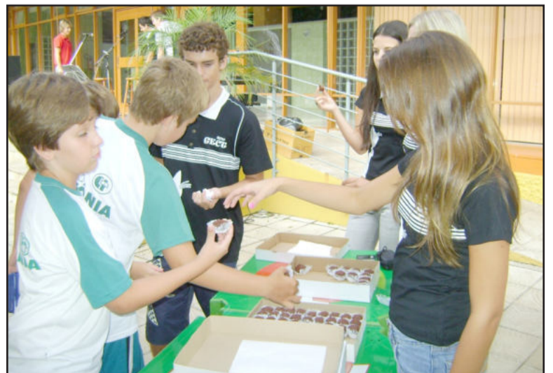
Gect organizou recreio prolongado, com lanche e música ao vivo