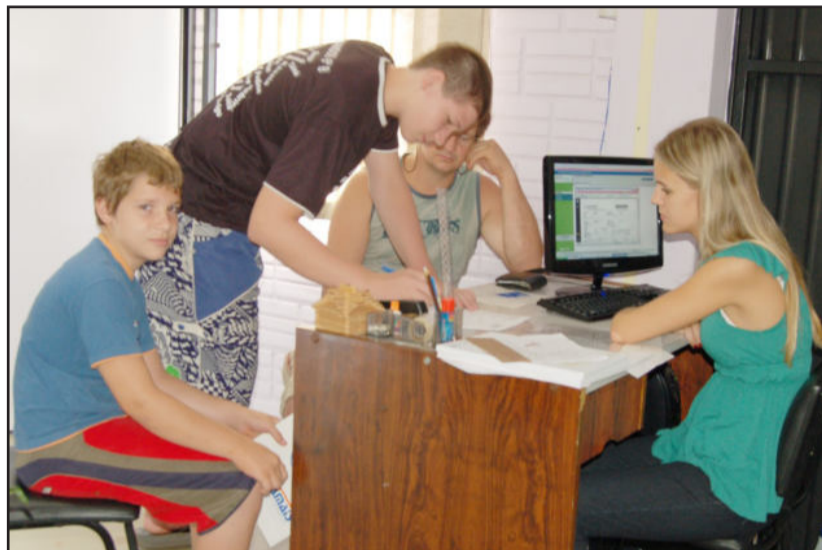
Serviço foi retomado nesta segunda-feira

O atendimento é oferecido em quatro dias da semana: segundas, terças, quartas e sextas-feiras. Às quintas-feiras não há o serviço, pois é o dia para laudos da assistência social e a servidora atende os serviços do programa Bolsa Família. A equipe também pede a compreensão de todos caso o sistema de informática tranque antes ou durante o processo, pois está interligado em todo o Brasil e não depende da funcionária nem da Prefeitura.