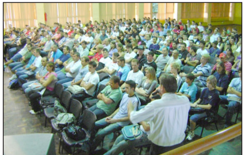
Alunos dos cursos técnicos participaram de atividades no auditório central