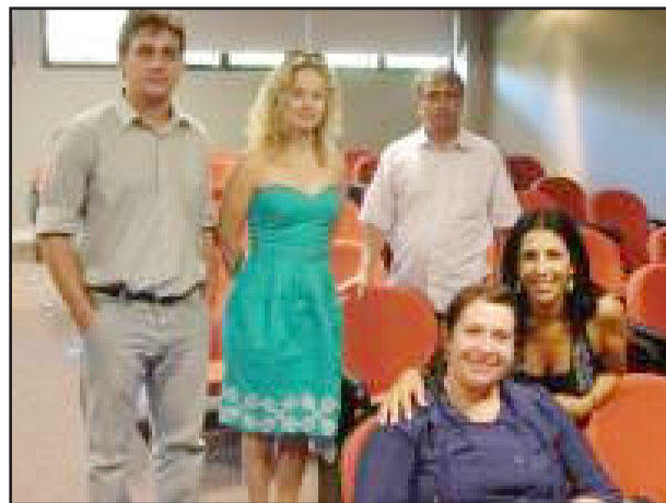
Professores da UFSM na Univates