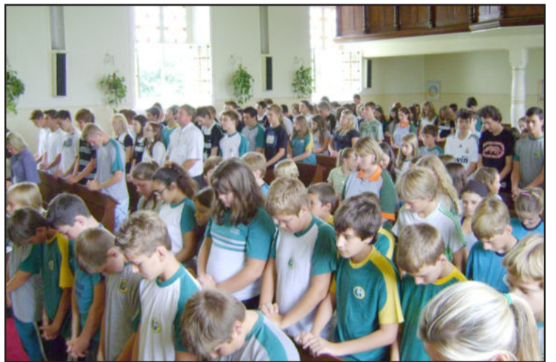
Turmas participaram do tradicional culto na igreja evangélica do Bairro Teutônia