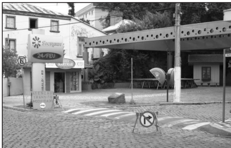
Rua Presidente Vargas teve sentido invertido na esquina com a Buarque de Macedo, junto à Praça das Rosas