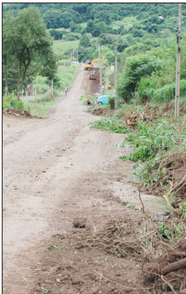
Início com limpeza das valetas