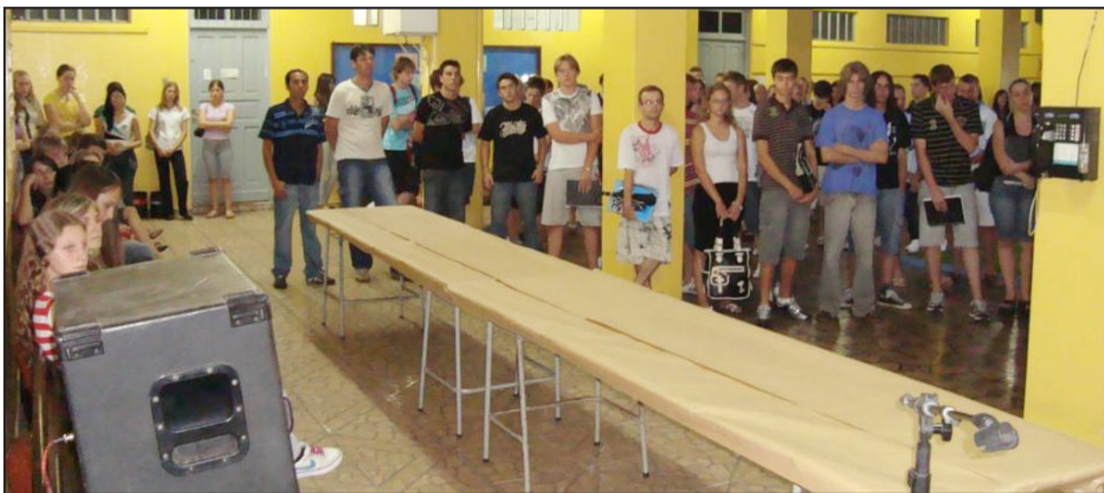
Alunos receberam as boas-vindas com música e lanche

A noite desta terça-feira, dia 23, foi marcada por reencontros nas turmas dos cursos técnicos do Instituto de Educação Cenequista General Canabarro (Icecg). Os alunos foram recepcionados com música ao vivo e lanche coletivo.