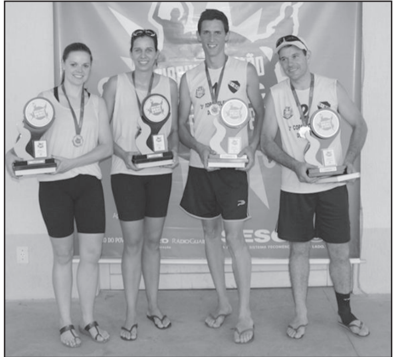
Campeões do Vôlei de duplas têm vaga no Estadual em Torres