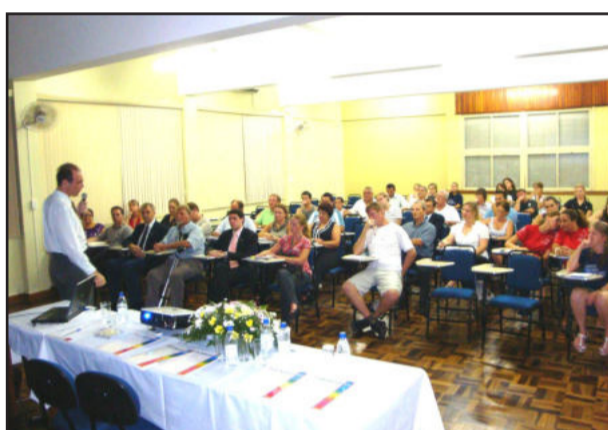
Aula inaugural reuniu alunos dos cursos de Secretariado, Gestão de Turismo e Agronegócio