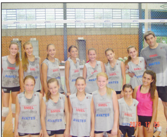
Primeiro dia já teve trabalho para as atletas

Para este ano estão previstas, somadas as três categorias trabalhadas na base, a participação em cinco competições internacionais, sete nacionais, nove estaduais e várias outras preparatórias de nível regional e escolar. A abertura do período competitivo será definida no dia 15 de março, quando ocorre a reunião na Federação Gaúcha de Voleibol, e são definidas as datas e locais das competições oficiais do primeiro semestre.