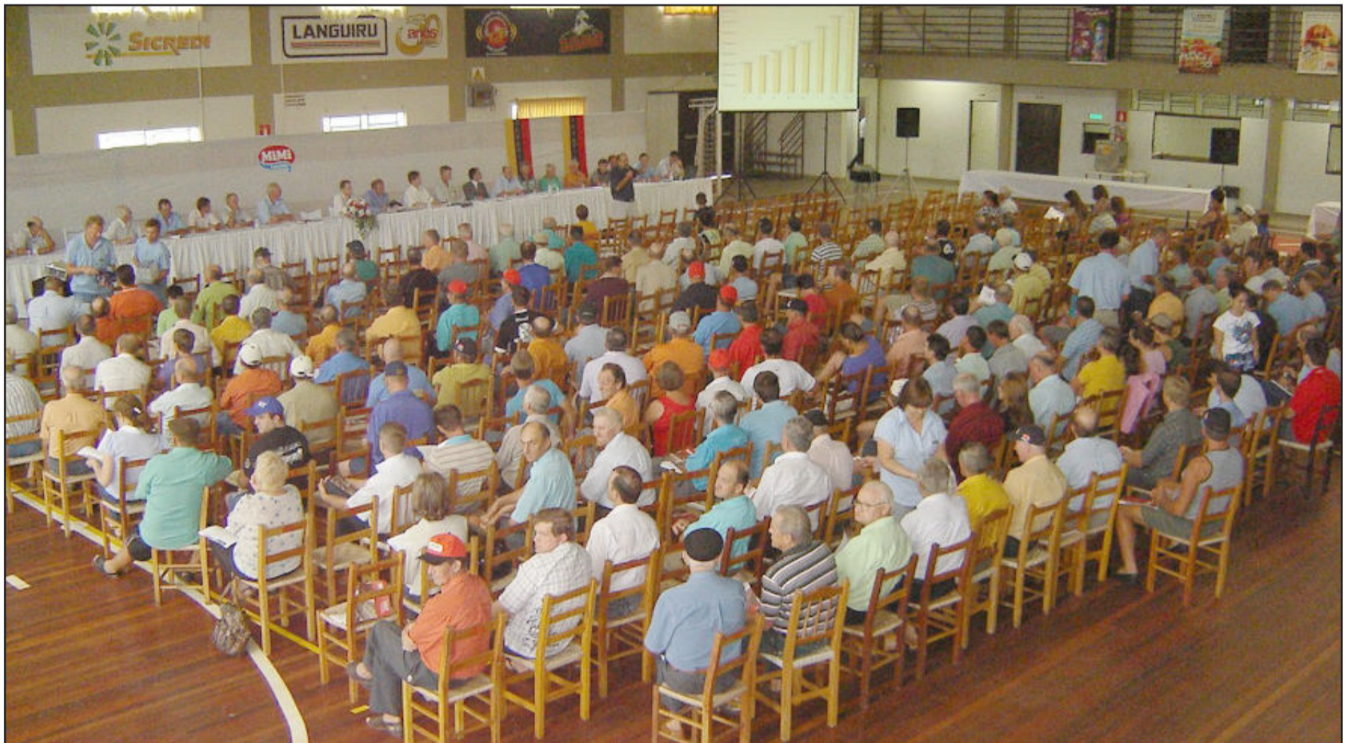
Reunidos em assembleia, ontem, os associados da Cooperativa Languiru aprovaram a prestação de contas de 2009 e autorizaram investimentos de 21,4 milhões para 2010, dos quais R$ 11 milhões são para a implantação da primeira etapa do Frigorífico de Suínos em Poço das Antas. Página 7