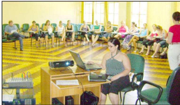
Palestras integraram programação do seminário

Conforme prevê o Projeto de Formação Continuada do Colégio Teutônia, ao longo do ano os professores ainda irão participar de diversos cursos, como na área da neurociência e sobre inclusão, além de participarem de encontros de professores da Rede Sinodal de Educação.