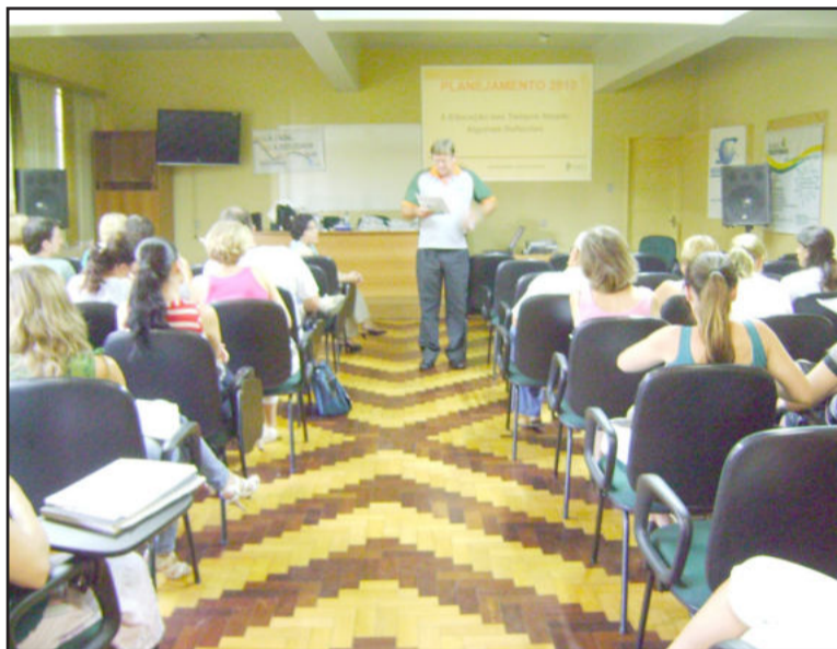
Reuniões de planejamento iniciaram no dia 10 de fevereiro