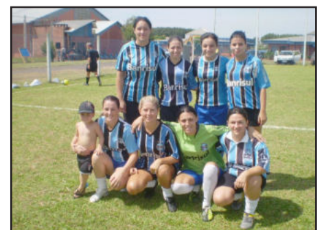
Gremistas venceram o Gre-nal feminino