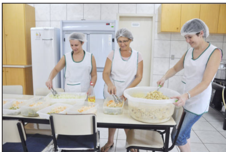
Serventes preparam o lanche e o almoço para os pequenos