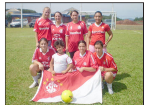
Equipe colorada no Gre-nal feminino

tis foi outra atração que contou com duplas de todas as idades na disputa. O Torneio do Coroa também movimentou a comunidade, com participação de mais de 20 equipes de futsal, no ginásio de esportes. A organização do Verão Vilanova foi da Administração Municipal, através do Departamento de Esporte e Cultura da Secretaria Municipal da Educação.