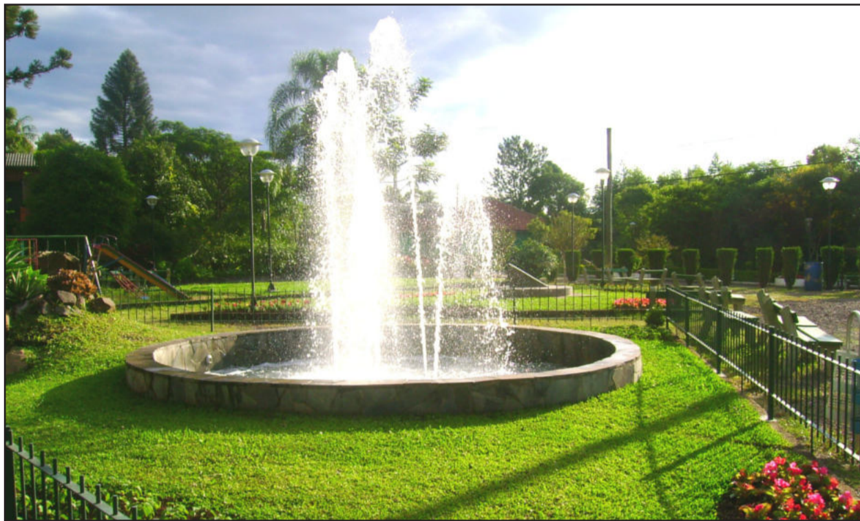
Chafariz numa das praças da cidade

A Assembleia Legislativa aprovou por unanimidade o Projeto de Lei de autoria do deputado Marquinho Lang (Democratas) que oficializa a denominação de “A Cidade-Jardim” ao Município de Colinas no âmbito do Estado do Rio Grande do Sul, na tarde desta terça-feira, dia 23.