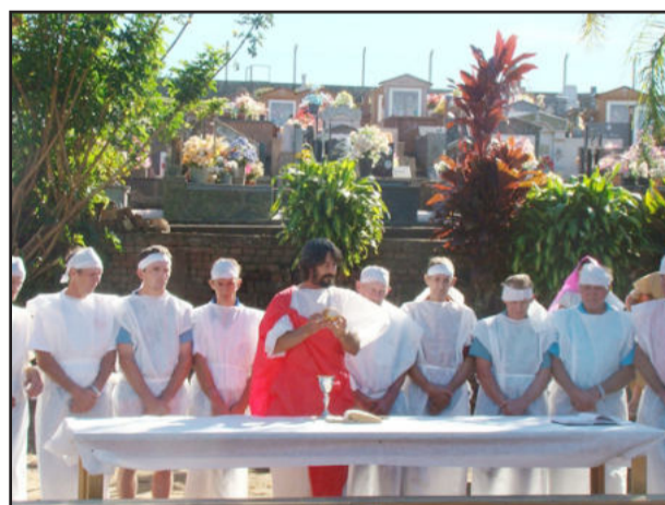
Atores encenam a Paixão de Cristo