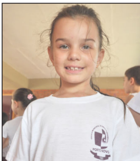
Vitória gostou da surpresa que a escola fez