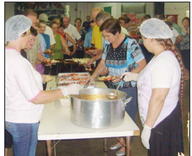
Almoço produzido pela equipe de colaboradores da Prefeitura recebeu elogios dos participantes