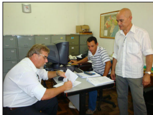
Assinatura do convênio para a aquisição de 40.720 quilos de sementes de milho

De acordo com dados informados pelos próprios produtores à Secretaria Municipal de Agricultura, a produtividade do milho em forma de grãos da safra 2009/2010 foi de 115 sacas por hectare, em média. Já em termos de silagem, a produtividade foi de 35 a 40 toneladas por