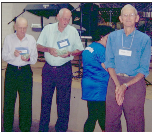
Participantes com mais idade