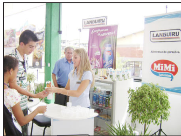
Degustação de produtos da Languiru

Com um histórico de participações em eventos, entre os dias 15 e 19 de março, a Cooperativa Languiru divulgou os seus produtos na 11ª Expodireto Cotrijal - Feira Internacional de Agronegócio. Através de um espaço concedido à Languiru no prédio do Mundo Cooperativo Gaúcho (inaugurado na ocasião), a empresa expôs os produtos da marca MiMi, como iogurtes, bebidas lácteas, achocolatado, entre outros. A linha de embutidos composta de mortadelas e fiambre e a linha de cortes de aves, também ganharam destaque no espaço da Languiru. No estande da Languiru, vendedores e supervisores de comercialização, tiravam dúvidas dos visitantes sobre os produtos da cooperativa. Gestor do prédio, o Sistema Ocergs/Sescoop-RS promo-