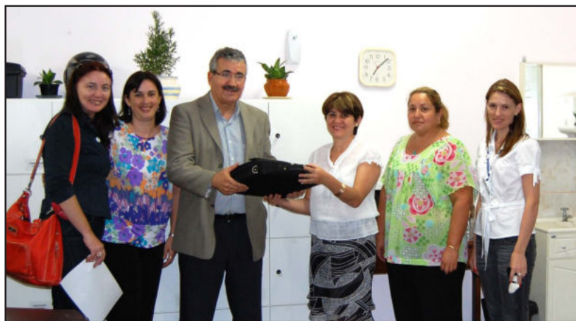
Entrega do notebook

onde o aluno busca o conhecimento pela resolução de problemas, tendo sempre em vista no processo de formação do técnico, o saber e o fazer comprometido com o saber ser.