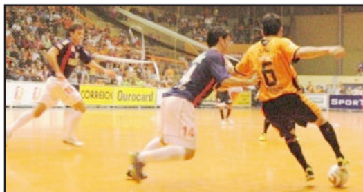
Equipe laranja volta a reencontrar a sua torcida antes da estreia da Liga Nacional

O início da Liga Futsal 2010 está previsto para a segunda-feira, dia 5 de abril, com uma rodada de abertura com clássicos regionais. A ACBF também se prepara para as demais competições da temporada, que serão o Campeonato Gaúcho, Taça Brasil e Sul-Americano de Futsal.