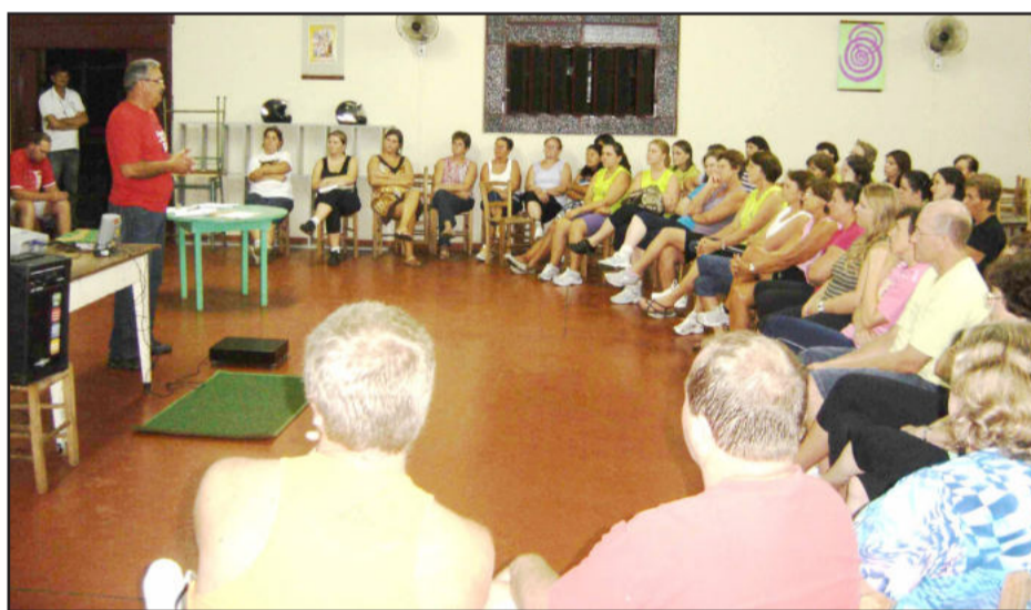
Em Arroio do Meio, encontros ocorrem no Centro Cultural