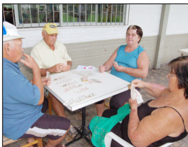
Canastra e outros jogos de mesa descontraíram os idosos