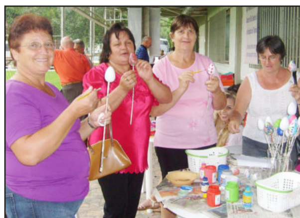
Oficina para pintar ovos de Páscoa também esteve à disposição