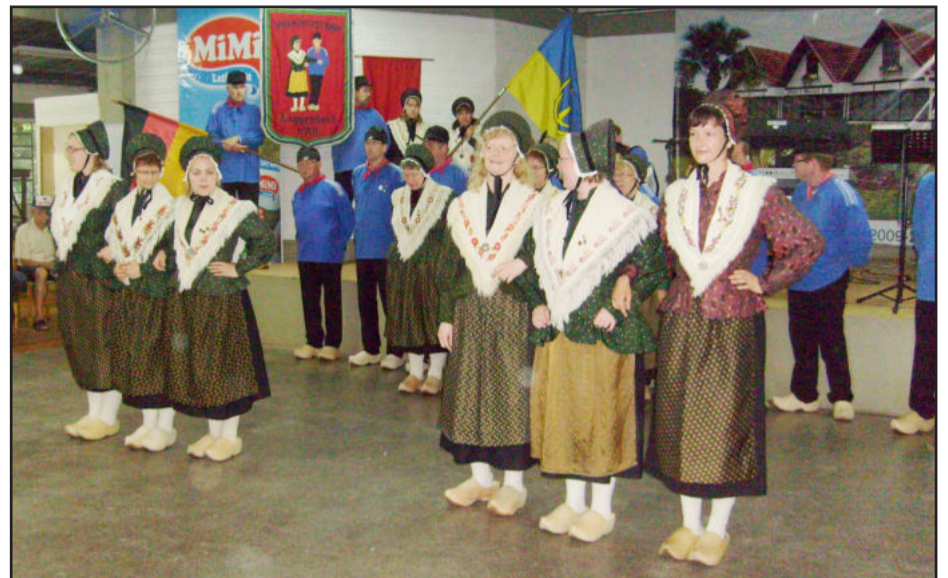
Grupo Volkstanzgruppe KAB Laggenbeck, da Alemanha, fez apresentações e interagiu com o público

Quanto à vacinação contra a Gripe A (H1N1), o profissional da saúde destaca que o governo brasileiro investiu pesado (cerca de R$ 1 bilhão) para adquirir 113 milhões de doses para eliminar o problema. “É recomendada para todos os idosos com doenças como fumante com enfizema, problemas do coração, nos rins. O importante é que todos consultem seu médico para ver se precisam ou não receber a vacina”, aconselhou. “É uma vacina segura, testada, aprovada e muito usada em outros países”, complementou.