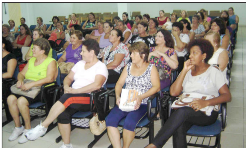
Participantes de Lajeado em busca de uma melhor qualidade de vida