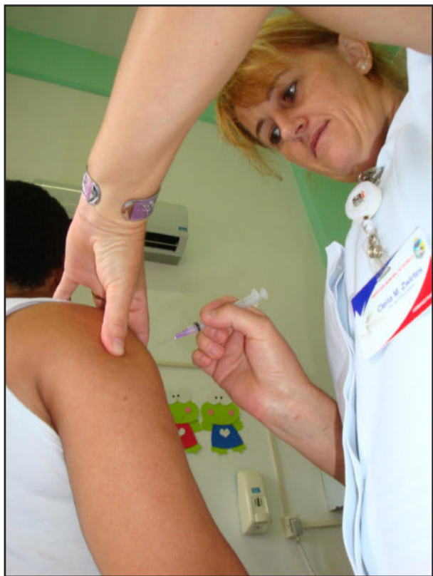
Aplicação das doses da vacina H1N1 nos postos de saúde em Estrela

A Prefeitura, por meio da Secretaria Municipal da Saúde e Assistência Social, começou nesta segunda-feira, dia 23, a aplicar a dose da vacina contra a Gripe A (H1N1). O primeiro público a ser vacinado são as gestantes, os doentes crônicos e as crianças de 6 meses a 2 anos incompletos (1 ano 11 meses e 29 dias).