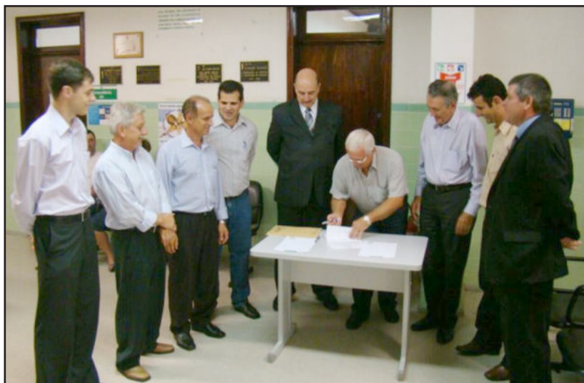
Visita serviu para liberação de verbas do Estado

Já o secretário Terra, após algumas manifestações e balanços apresentados, anunciou que nesta quinta-feira, dia 25, a governadora Yeda Crusius assinará recursos na ordem de R$ 70 milhões aos hospitais e, dentre esses, R$ 300 mil serão destinados ao Hospital São Pedro. Outro recurso que será destinado, na ordem de R$ 160 mil, é para investir na construção de uma nova uni-