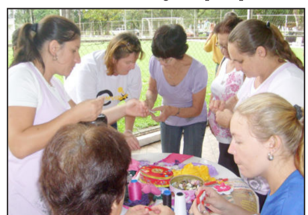
Oficinas de trabalhos manuais, como o fuxico, foram atração