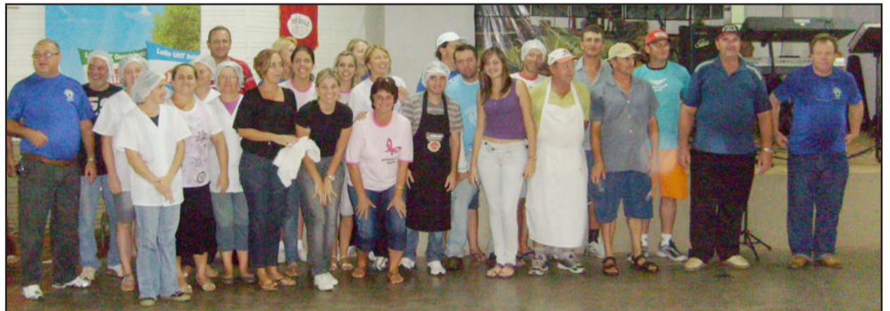
Equipe que trabalhou na retaguarda garantiu refeição e atendimento aos idosos