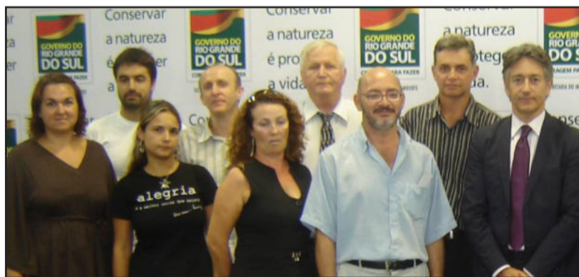
Representantes dos municípios contemplados com o secretário

Estrela foi o único município do Vale do Taquari a receber a premiação. Concorreram 50 municípios e destes somente 24 foram aprovados.