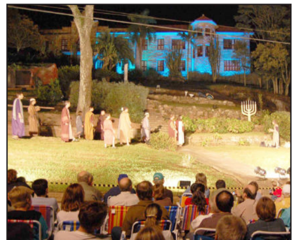
O cenário é uma das atrações da encenação

Os ensaios foram realizados desde o início do ano, sempre aos sábados pela tarde, em frente ao conhecido Seminário, que apresenta um belo cenário natural como pano de fundo. A 5ª Paixão de Cristo tem a direção de Emilio Speck. Cerca de 50 atores e figurantes fazem parte da peça, a participação especial do Grupo de Teatro Façarte, além de um grande elenco da comunidade.