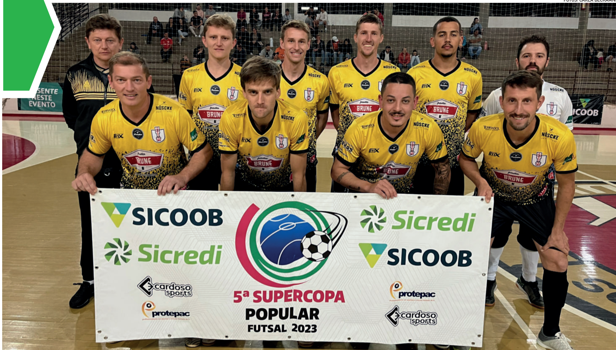
Seleção de Westfália teve três vitórias e um empate na primeira fase