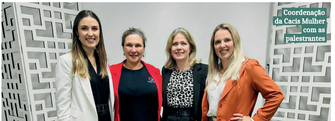
Coordenação da Cacis Mulher com as palestrantes

A Cacis Mulher realiza encontros mensais, tendo como finalidade o desenvolvimento e o aprimoramento das participantes, contribuindo para o desenvolvimento de seus negócios. O grupo tem mais de 30 participantes e as membras precisam ser associadas da entidade, ser sócia ou gestora de empresa ou empreendimento associado à Cacis, e estar em dia com as obrigações estatutárias.