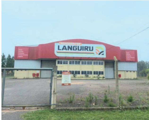
Prédio da Languiru em Venâncio Aires será vendido para ressarcir incentivo público