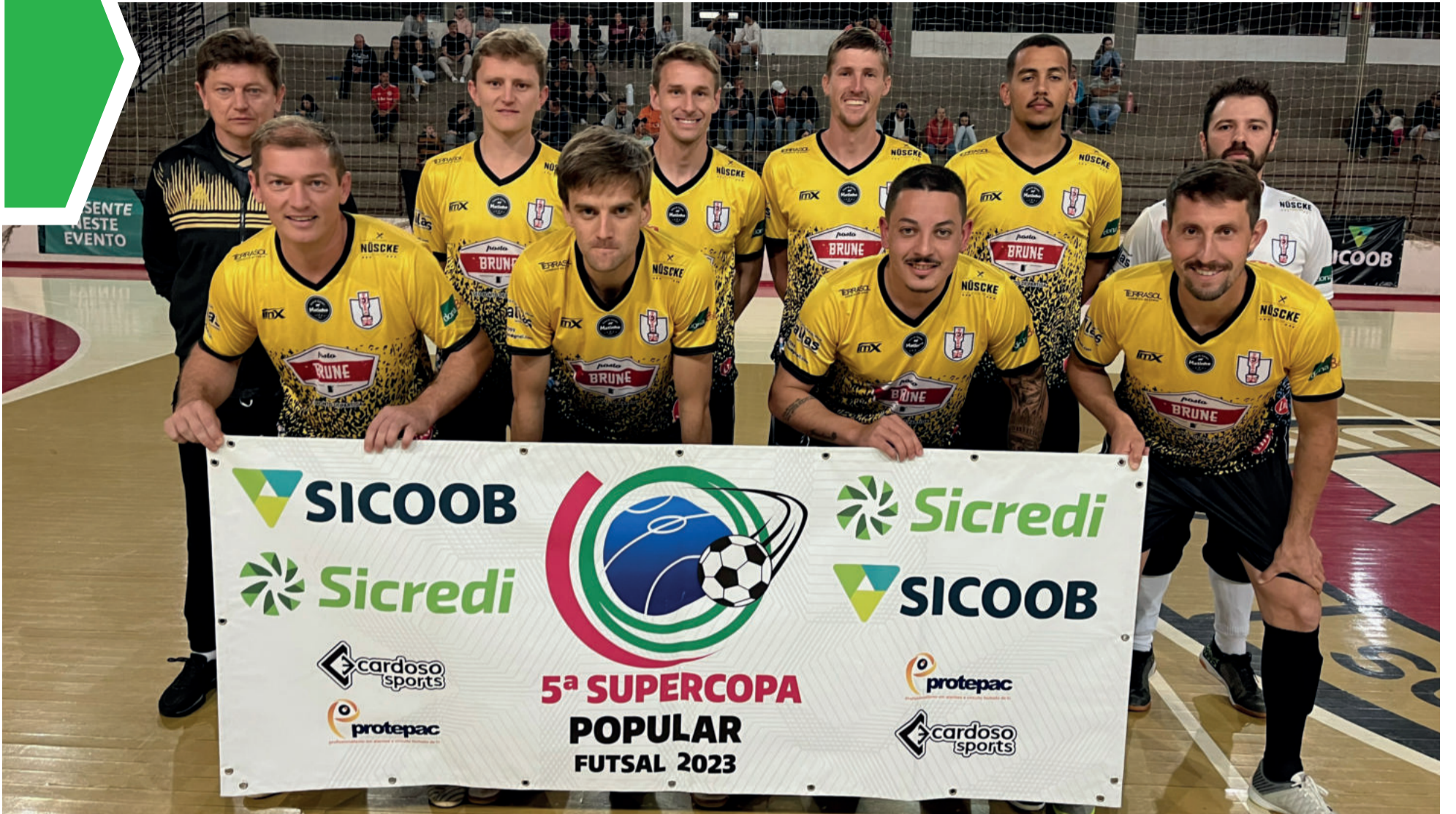
Seleção de Westfália teve três vitórias e um empate na primeira fase