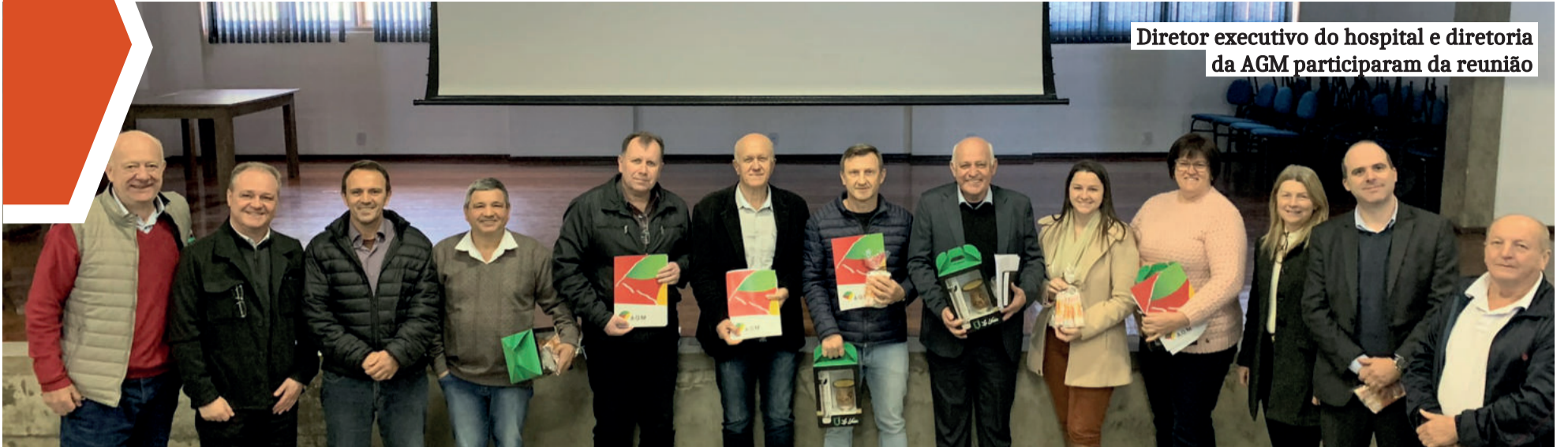
Diretor executivo do hospital e diretoria da AGM participaram da reunião