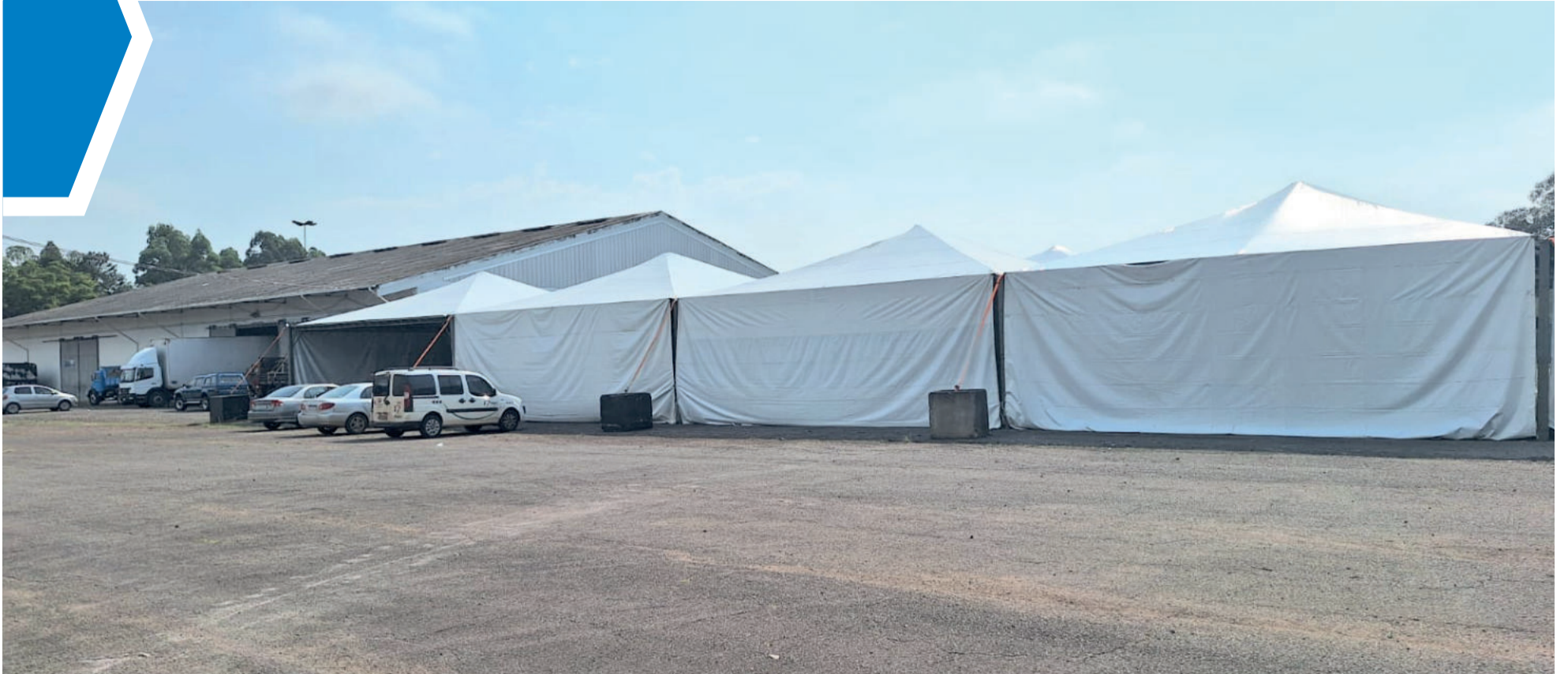
Espaço no Porto vem sendo preparado durante toda a semana