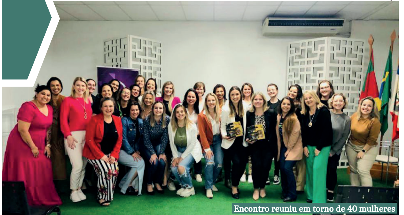
Encontro reuniu em torno de 40 mulheres