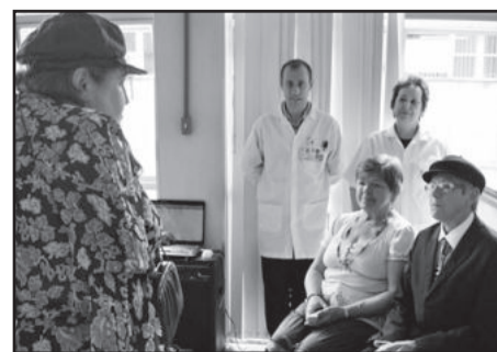
Barbosenses participaram da Semana do Doador de Sangue

Doar é um ato de solidariedade e para que se concretize, a Secretaria Municipal da Saúde viabiliza as doações com viagens mensais ao HEMOCs. A próxima doação será no dia 21 de dezembro e os interessados podem entrar em contato com o Centro Municipal de Saúde Dr Helmo Sebastião Diello pelo telefone 54 3461-8900.