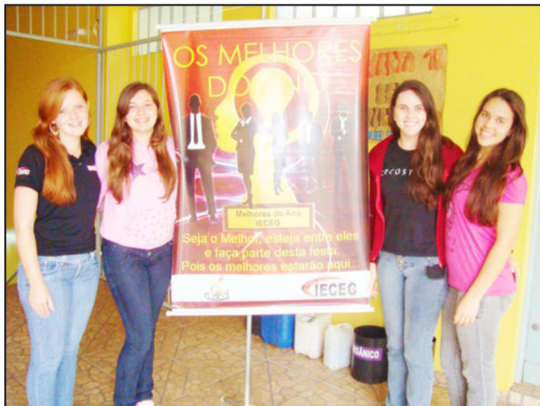
Prêmios serão entregues hoje a noite

Os troféus de "Melhores do Ano" serão entregues pa-