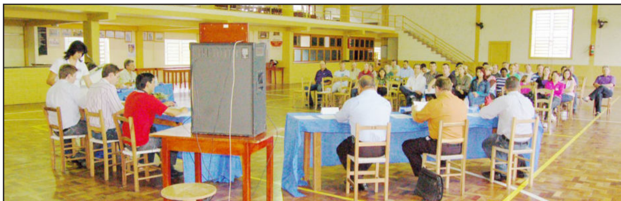
Sessão ordinária do Legislativo de Teutônia no Bairro Boa Vista

Aprovado, ainda, o PL 150/2010, que cria empregos públicos, que passam a fazer parte do quadro da Prefeitura de Teutônia. São dois cargos de telefonista para regularizar a situação funcional de duas servidoras que foram reintegradas ao serviço público por decisão judicial em 28 de março de 2008, e como não houve recurso, a decisão tornou-se definitiva em 16 de junho de 2008.