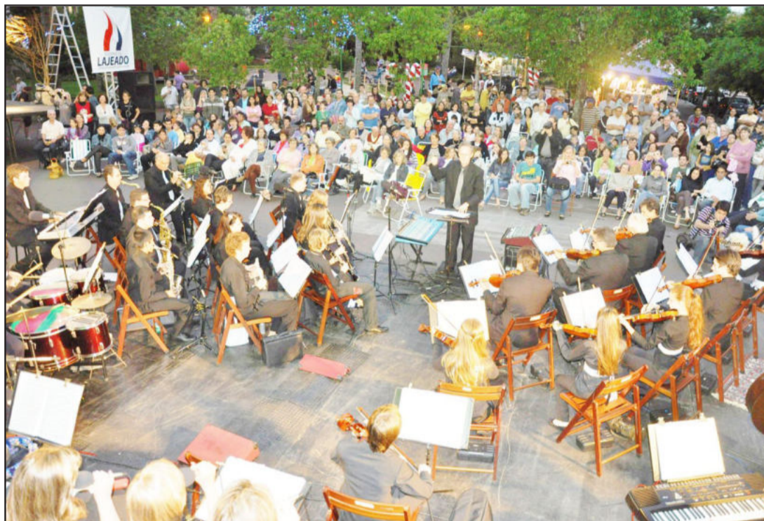
Show da Oclaje abrilhanta todos os anos a programação do Lajeado Brilha

Quatro eventos promovidos e apoiados pelo governo de Lajeado movimentam a cidade neste final de semana. Neste sábado, dia 27, às 9h, terá a formatura de 750 alunos do Proerd - Projeto Educacional de Resistência às Drogas e à Violência, no ginásio do Colégio Alberto Torres. À tarde, terá o encerramento das atividades da Semana Cultural Afro em Lajeado, promovida pelo Centro de Cultura Afro-Brasileira do Município, a partir do meio-dia, no Parque Histórico, com roda de pagode pelo grupo Beijo Molhado às 14h. Já no domingo, dia 28, terá grande Show de Esportes Radicais sobre Rodas, na Rua Santos Filho, no Parque Professor Theobaldo Dick, a partir das 15h. E, também no domingo, abrindo as atividades culturais do Lajeado Brilha 2010, terá show da Orquestra de Concertos de Lajeado - Oclaje, às 20h, no Salão da Paróquia São Cristóvão.