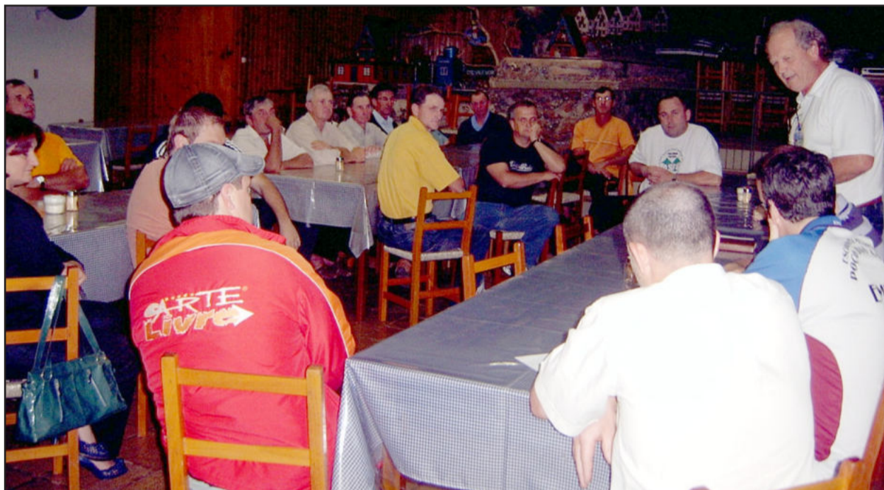
Transcitrus Fest foi um marco comemorado por Poço das Antas

A comissão organizadora da 1ª Transcitrus Fest realizou na noite desta quinta-feira, dia 25, um encontro de confraternização com alguns colaboradores do evento. A reunião ocorreu no Restaurante do Tino, em Poço das Antas, seguido de jantar. Com o principal intuito de apresentar os resultados positivos, fazer avaliações e dividir as experiências, o momento foi marcado por muita música e alegria. A festa em comemoração aos 22 anos de emancipação político-administrativa de Poço das Antas e os 21 anos da Rádio Popular FM, com o Show da Família, ocorreu nos dias 21, 22 e 23 de maio deste ano.