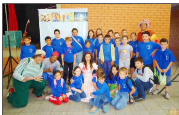
Grupo teatral Salada Mista com as crianças da escola

Os estudantes, componentes dos grupos de atividades físicas da terceira idade e integrantes do grupo de PCDs (pessoas com deficiências), de Paverama, divertiram-se com as apresentações da peça teatral Salada Mista, do Grupo Luz & Cena. O teatro com tema “Alimentação Saudável” passou, de forma criativa e divertida, a mensagem de como a alimentação adequada é importante para manter a saúde e viver melhor. Mais de 700 alunos e cerca de 100 pessoas da comunidade assistiram ao espetáculo, realizado no ginásio da Comunidade Católica.