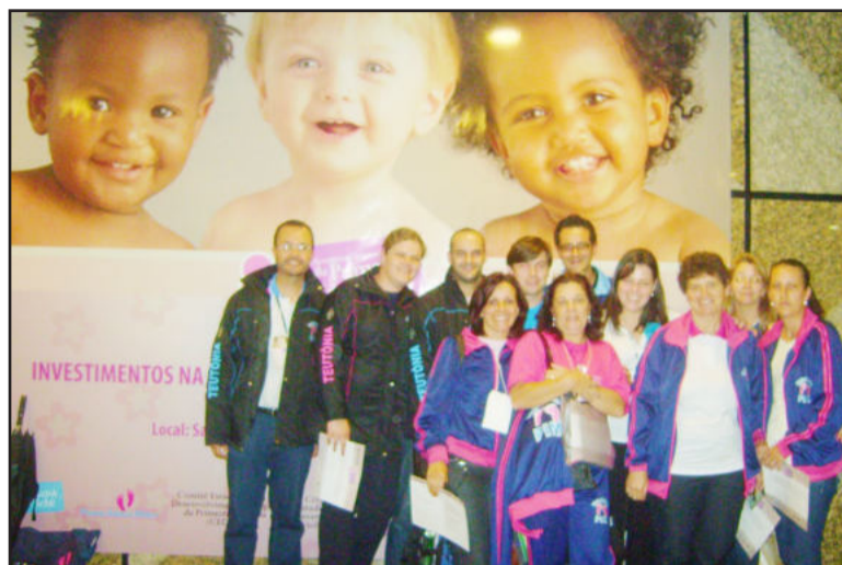
Visitadores, monitor, coordenação e GTM de Teutônia participaram do Seminário Internacional da Primeira Infância

No início da tarde teve painéis destacando os projetos de investimentos na Primeira Infância, com apresentações da Fundação Maria Cecília Souto Vidigal (São Paulo), da Associação Brasileira pelo Direito de Brincar (São Paulo) e da Fundação Van Leer (Holanda). Ainda na tarde de terça foram reletadas as experiências gaúchas com o PIM, des-