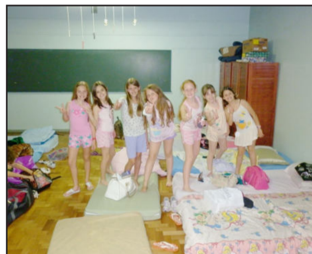
Noite teve muita animação

No retorno ao Colégio Teutônia, os alunos participaram de passeio de lanterna pelo pátio da escola e cinema na sala de aula, com contação de histórias e hora de dormir. No sábado pela manhã a hora de acordar foi logo cedo, às 7h30min, com higiene e organização dos pertences.