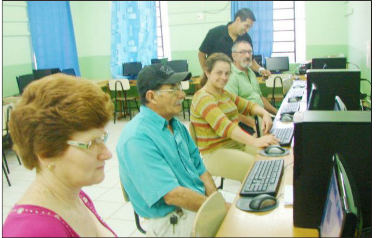
Curso de informática para pais iniciou na Escola 24 de Maio

No sábado passado, dia 20, iniciou o curso de informática básico gratuito para pais na Escola Municipal de Ensino Fundamental 24 de Maio, no Loteamento 8, no Bairro Canabarro. O objetivo é disponibilizar para pais interessados o contato com a informática, além de poderem estar no ambiente em que seus filhos estudam, ampliando assim os laços entre família e escola. As inscrições ainda estão abertas e podem ser efetuadas na própria escola ou na Secretaria Municipal de Educação.