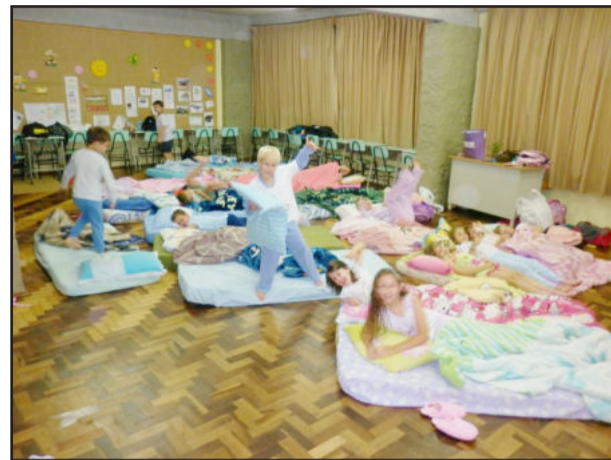
Noite do Pijama: crianças pernoveram no colégio

No dia 19, o Colégio Teutônia realizou mais uma edição da sua tradicional Noite do Pijama. A programação, que iniciou às 18h, envolveu as turmas do primeiro ao quinto ano do Ensino Fundamental.