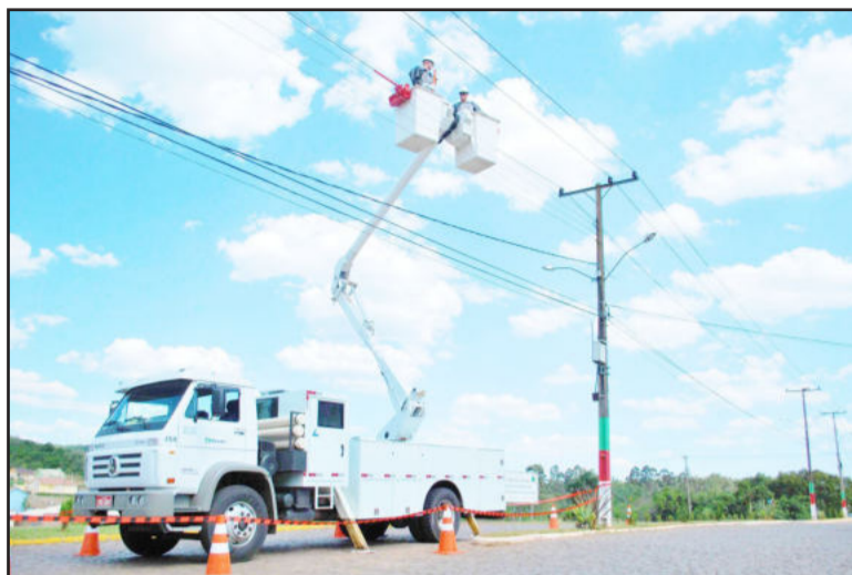
Novo caminhão foi adquirido em setembro

Para diminuir ainda mais a incidência de desligamentos, a cooperativa adquiriu em setembro deste ano seu segundo caminhão de linha viva, num inves-