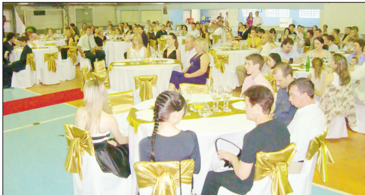
Evento será no Ginásio Ernani Julio Sippel

O Iceceg convida aos pais, familiares, colegas e professores para que compareçam a fim de valorizar e reconhecer os méritos dos premiados, nesta grande noite de comemoração ao ano que entra na sua reta final.