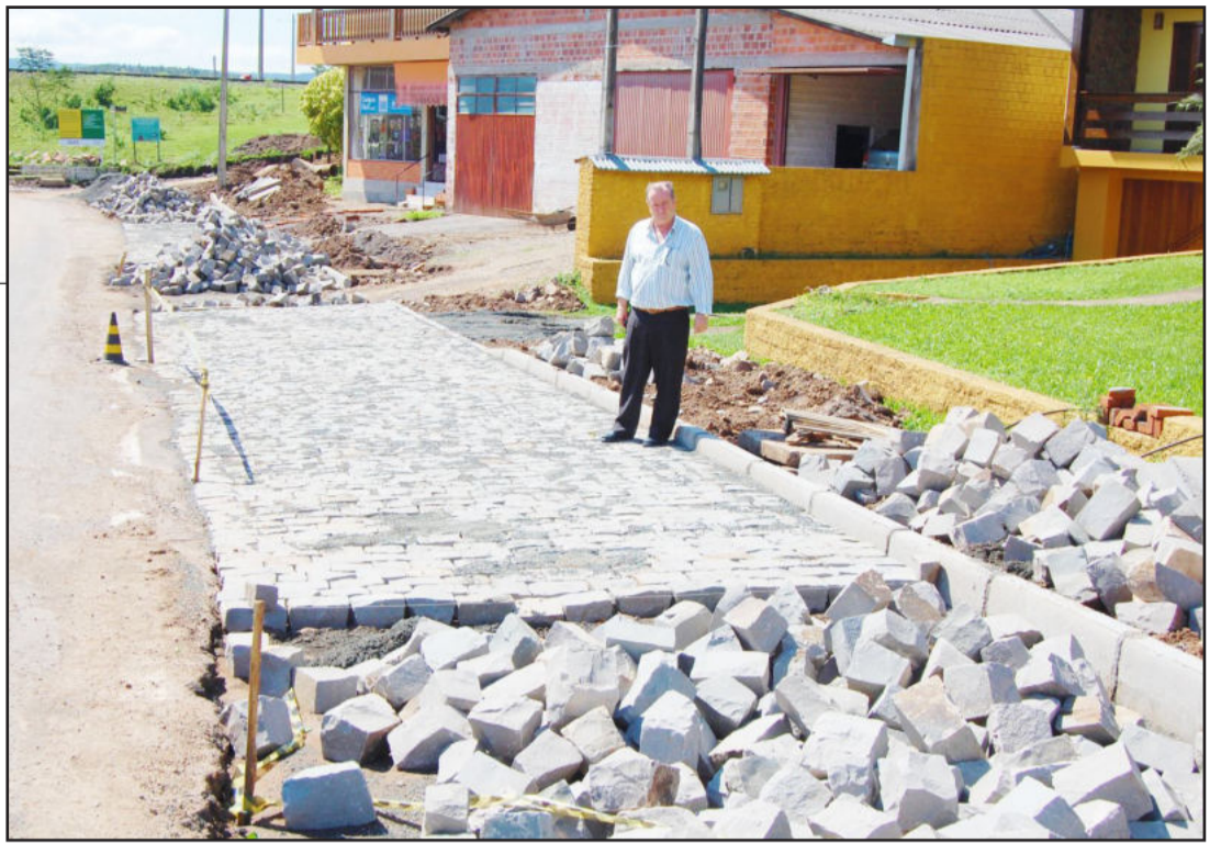
Acostamento da VRS-835 também recebeu pavimentação

BRF 76 anos Alimentando uma história de sucesso