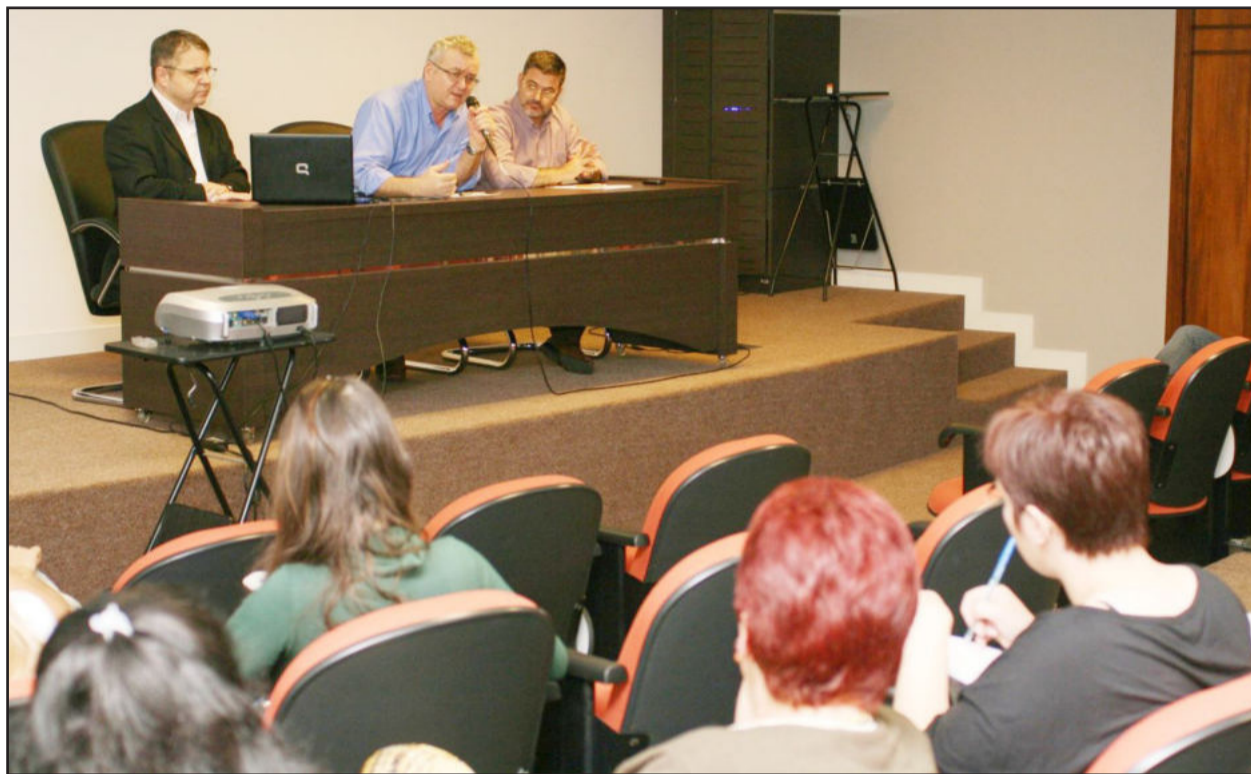
Reitoria apresentou resultados à imprensa regional

Foram divulgados os resultados do Exame Nacional de Desempenho dos Estudantes (Enade) 2009, confirmando o excelente desempenho que a Univates vem obtendo nos cenários estadual e nacional quando o assunto é educação superior. Dos 13 cursos avaliados, dez receberam conceitos 4 e 5, considerados muito bom e excelente, e três tiveram conceito 3, o que é considerado uma nota boa de acordo com a escala avaliativa do Ministério da Educação (MEC), que vai de 1 a 5. Os resultados obtidos pela Univates garantem a renovação automática do reconhecimento dos cursos.