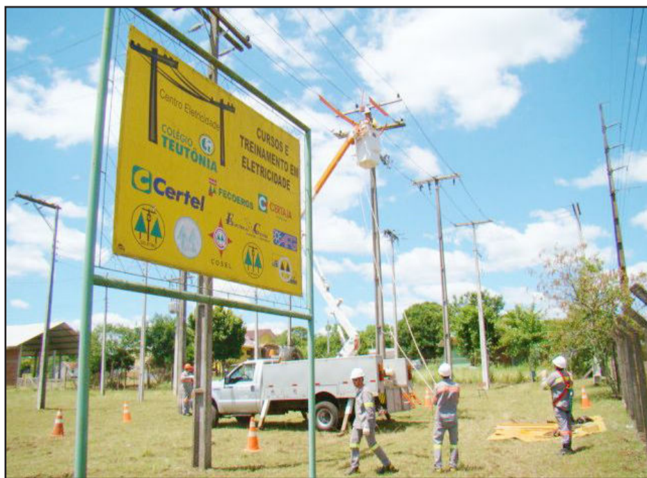
Formação teve teoria e prática desenvolvidas no Centro de Treinamento da escola e na rede de distribuição da Certel

A qualificação contou com a participação de seis profissionais, que estão devidamente preparados para atuar em rede energizada, serviço diferenciado que possibilita manutenção de rede sem a necessidade de desligamen-