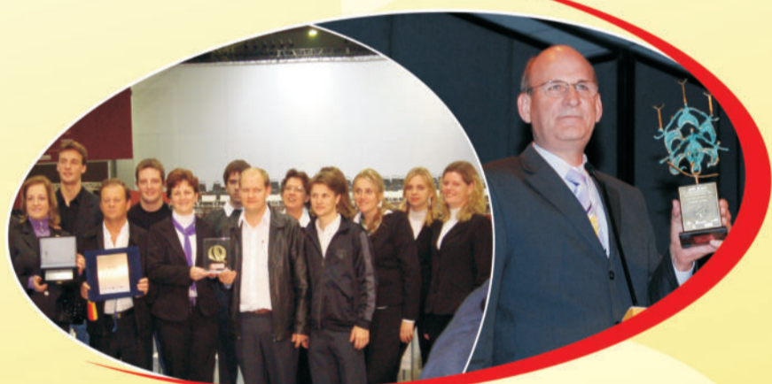
Premiações e Conquistas

O reconhecimento pelos trabalhos em busca da melhoria contínua, veio em 2008 pela conquista do Prêmio MPE Brasil/RS, em 2009 pelo Prêmio MPE Brasil e pela Medalha de Bronze do PGQP, destacando a preocupação e o compromisso com os clientes