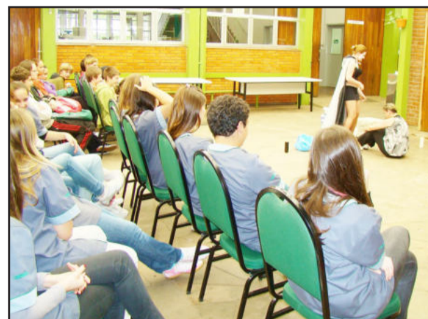
Grupo teatral se apresentou aos alunos do Senai

Cerca de 300 alunos, professores e funcionários do Senai de Lajeado puderam prestigiar, nesta sexta-feira, dia 26, a apresentação da esquete "Quando a vela se apaga", encenada pelo Grupo Teatral Amanhã, do Município de Fazenda Vilanova. Oito atores revelaram, para os estudantes dos turnos manhã e tarde, a realidade dos usuários de drogas ilícitas e suas consequências, que podem chegar à morte.