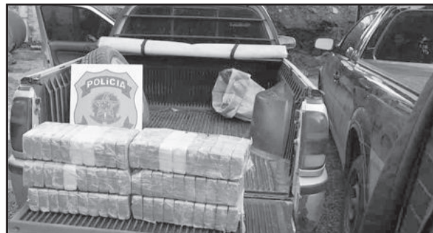
Em julho, Polícia Federal apreendeu 61 quilos de droga jogados de uma aeronave paraguaia