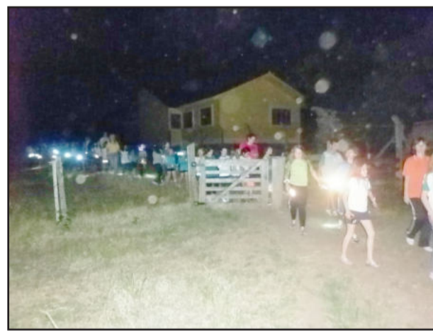
Passeio de lanterna integrou programação