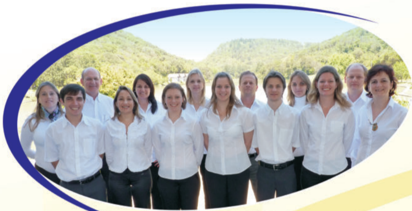
Equipe de colaboradores

A equipe é formada por 13 colaboradores comprometidos com a busca de resultados, atendimento e satisfação dos clientes.