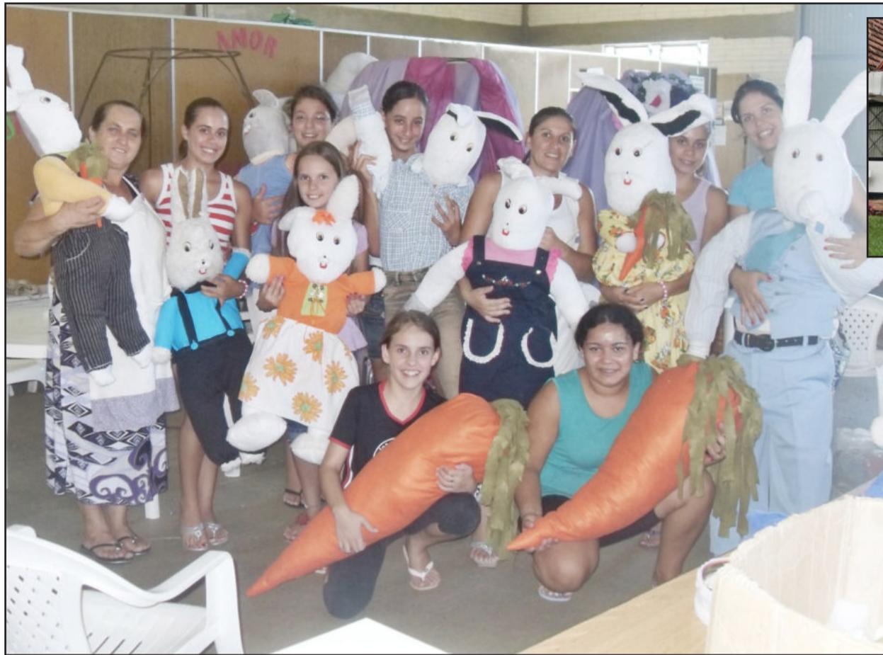
Confeção de enfeites para a Páscoa no CRAS

Voluntárias e oficineiras do CRAS produzem ornamentação que enfeita a cidade