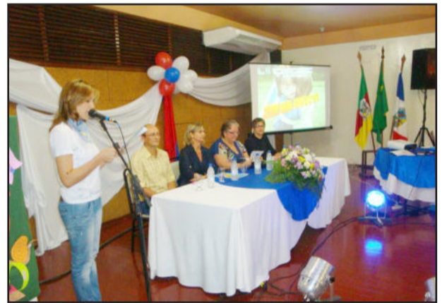
Mesa oficial na abertura do evento