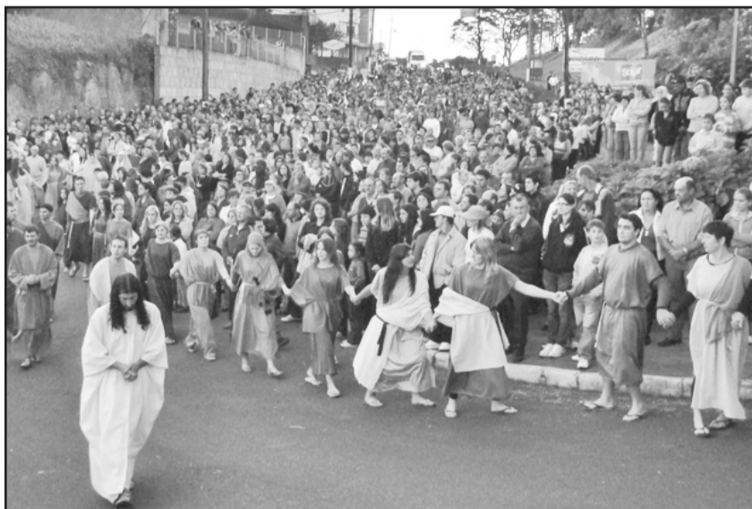
Encenação envolve comunidade

Os papéis são ocupados por atores locais, reunindo aproximadamente 450 pessoas. Os figurinos são disponibilizados pela Secretaria de Turismo e os cenários representam 12 narrativas bíblicas, desde a Ressurreição de Lázaro,