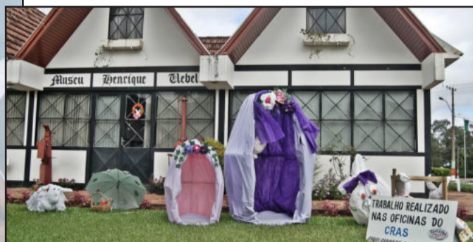
Enfeites para a Páscoa no Centro Administrativo