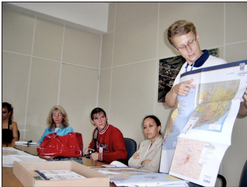
Apresentação do material para as escolas

Os interessados em participar ainda podem se inscrever pela internet até o dia 4 de abril, na página da Fundação Cesgranrio