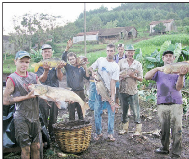
Várias espécies de carpas serão comercializadas

A tradicional feira do peixe vivo será realizada na próxima quinta-feira, dia 1º, na Praça 13 de Abril, a partir das 8h. Diversos produtores do interior do Município irão comercializar carpas das espécies capim, prateada, húngara e cabeça grande ao valor de R$ 5,00 por quilo. Os interessados devem trazer embalagem para levar os peixes. Mais informações sobre a feira do peixe vivo pelo telefone 3761 1102, com o coordenador de Agricultura e Meio Ambiente, Mauro Adelar Scheuermann.