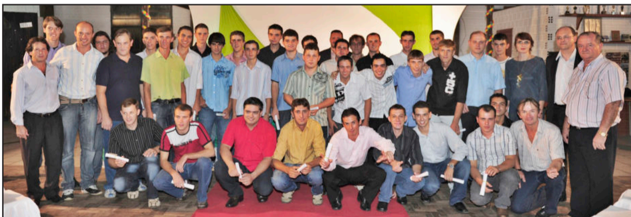
Formandos confraternizaram com administração municipal e Senai

Uma parceria entre a administração municipal de Paverama e o Serviço Nacional de Aprendizagem Industrial (Senai) possibilitou a formação de 35 pessoas em Mecânica Industrial Básica. A solenidade de formatura ocorreu no dia 19, no CTG Estância do Siqueira, com presença de autoridades e familiares. O curso, com 150 horas de duração, foi ministrado pelos técnicos do Centro Profissional Senai Lajeado e os alunos, divididos em duas turmas, freqüentaram as aulas na Escola Municipal Gonçalves Pinto Vilanova.