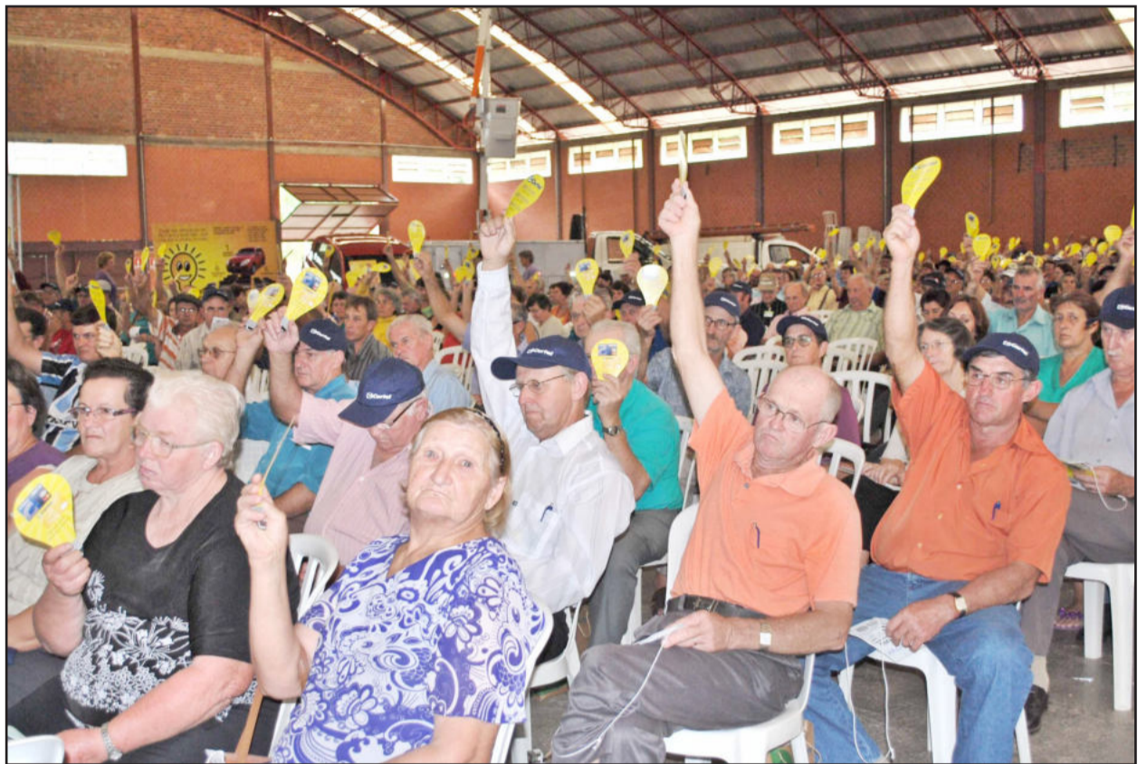
Associados aprovaram contas das duas cooperativas