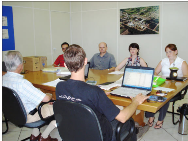
Reunião ocorreu no início do mês de março

A ordem do dia destaca leitura do edital de convocação da assembleia, conferência do credenciamento dos votantes e do quorum da assembleia, leitura e aprovação da ata