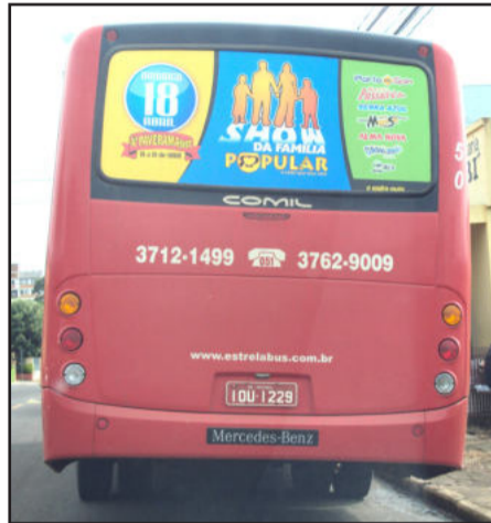
Divulgação da PaveramaFest também nos ônibus da Auto Viação Estrela