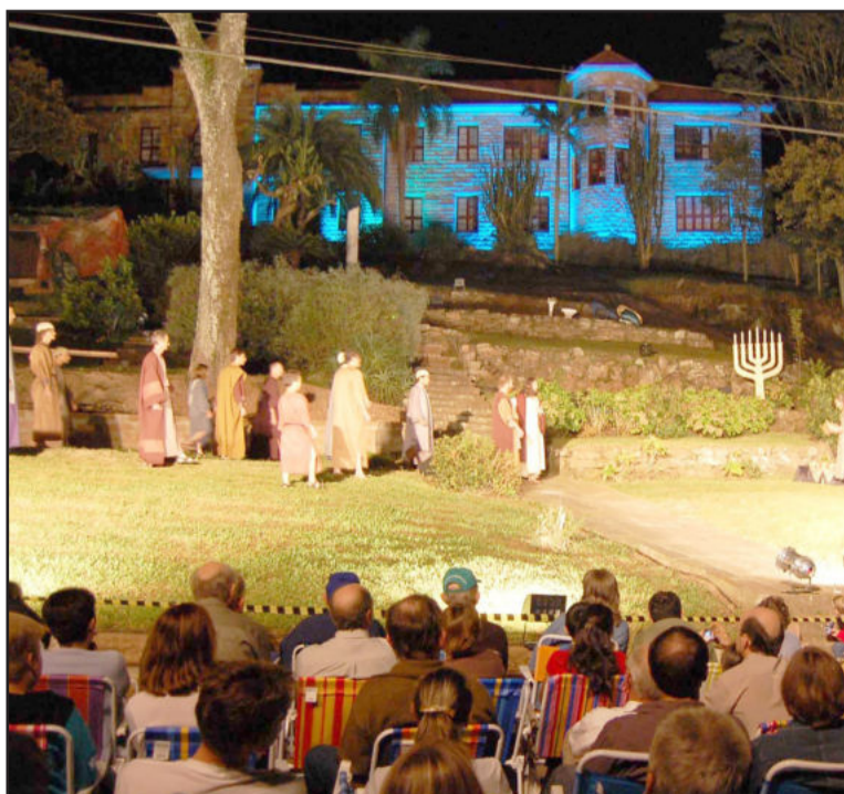
O cenário é uma das atrações da encenação