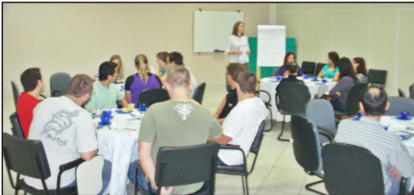
Café da manhã reuniu 32 pessoas no auditório da CIC

A Certificação Digital trata-se de um documento eletrônico que possibilita comprovar a identidade de uma pessoa, uma empresa ou um site, para assegurar as transações on-line e a troca eletrônica de documentos, mensagens e dados, com presunção de validade jurídica. A assinatura digital, efetivada mediante utilização de certificado digital válido, é obrigatória des-