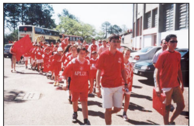
Crianças visitarão o estádio do Internacional