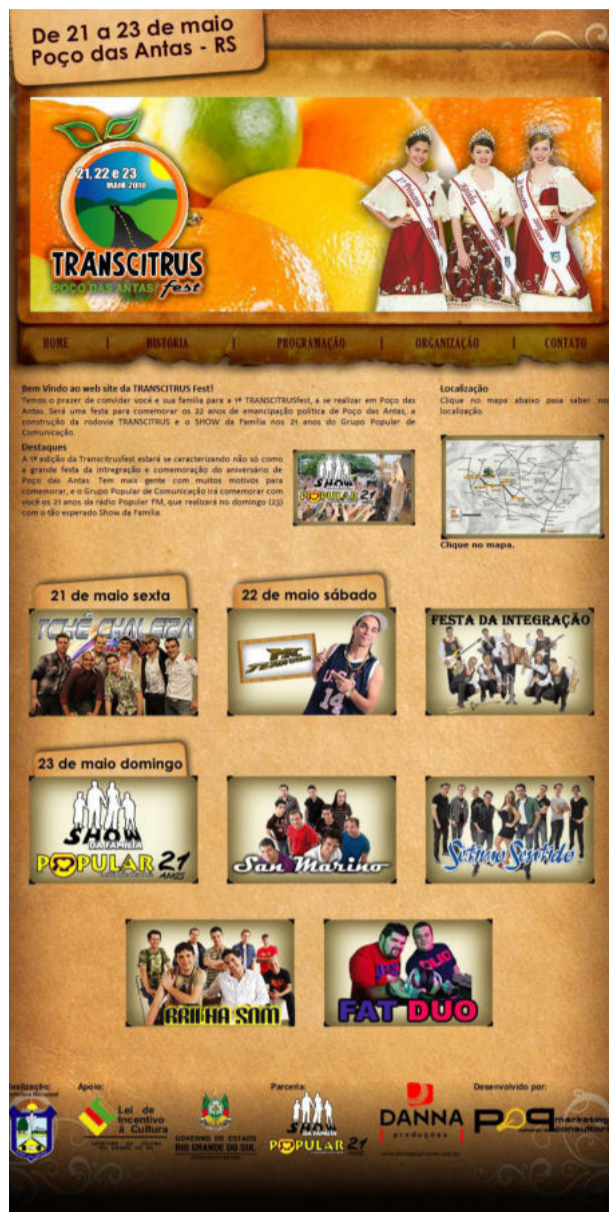
Página da Transcitrus Fest na internet