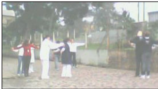
Dia começou com atividade diferente no Posto de Saúde

Em Poço das Antas, a comunidade também foi mobilizada no dia do desafio, ontem. No poder público, o trabalho começou com os 15 minutos de atividade diferenciada. De frente à Prefeitura Municipal, servidores das diversas secretarias, prefeito e vice realizaram atividade de alongamento e ginástica. A seguir, foi a vez dos colaboradores do Posto de Saúde de Poço das Antas, que também participaram da integração de frente ao prédio onde trabalham. Poço das Antas, com 2.98 habitantes, concorre contra Santa Ana, em El Salvador, que possui cinco mil habitantes.