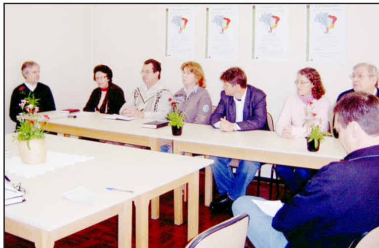
Equipe envolvida na Ação Sinodal 2010