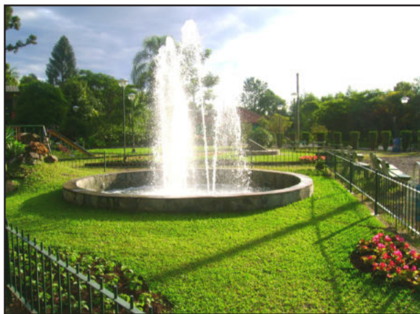
Município tem muitos pontos com belo ajardinamento o concurso integra uma política pública de fortalecimento das questões ambientais e de integração das cidades.