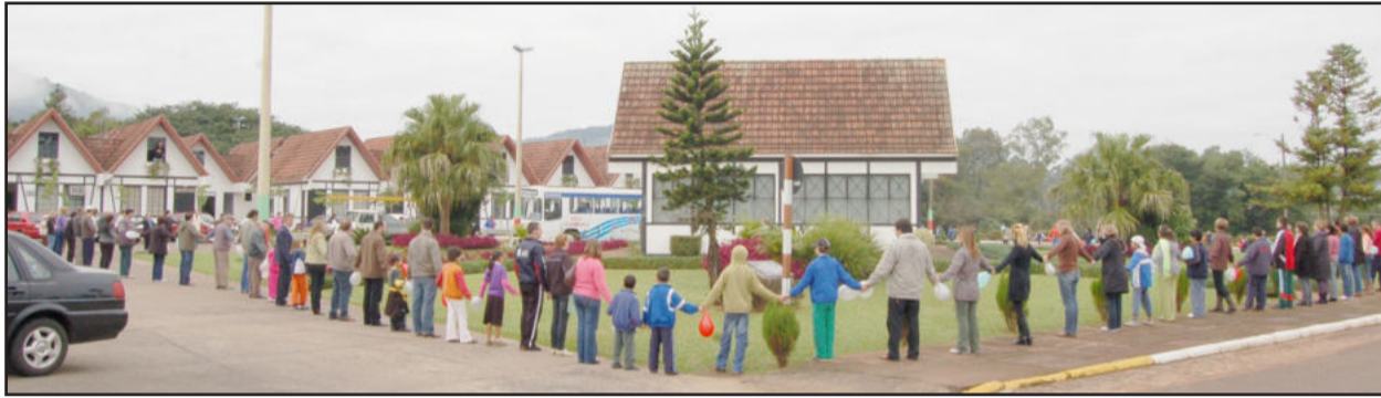
Servidores, estudantes e idosos deram um abraço simbólico ao Centro Administrativo

F uncionários de empresas, estudantes das redes públicas e privadas e a Prefeitura de Teutônia se mobilizaram ontem para participarem do Dia do Desafio. Apesar do fechamento dos dados ocorrer por volta das 20 horas, a coordenação no Município já apresentou no início da tarde o resultado extraoficial, contabilizando o engajamento de 10.737 pessoas do total de 27.215 habitantes, perfazendo 39,45% da população teutoniense envolvida na programação. Os dados finais e oficiais devem ser disponibilizados no fim do dia no site do Sesc de São Paulo.