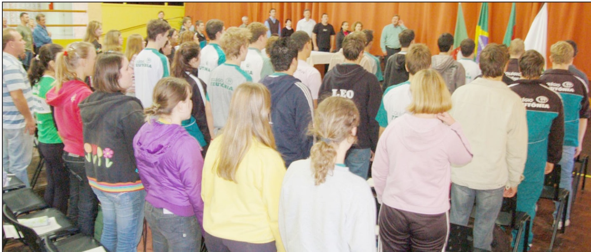
O uso de agrotóxicos e as alternativas foram a tônica dos debates realizados no Colégio Teutônia, nesta terça-feira, numa promoção da administração municipal. Página 9