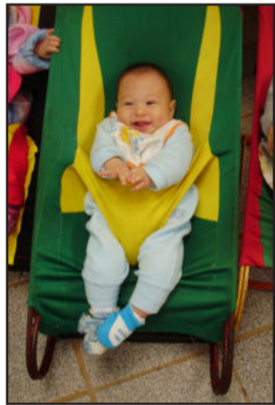
Bebês também presentes

A Escola de Educação Infantil Cirandinha, realizou no dia 26 de maio, às 15h15min, na cobertura da escola, uma atividade relacionada ao dia do Desafio. A ação mobilizou a todas as crianças e funcionárias da escola, as quais participaram com dedicação e alegria de tudo que foi planejado. Inclusive os bebês