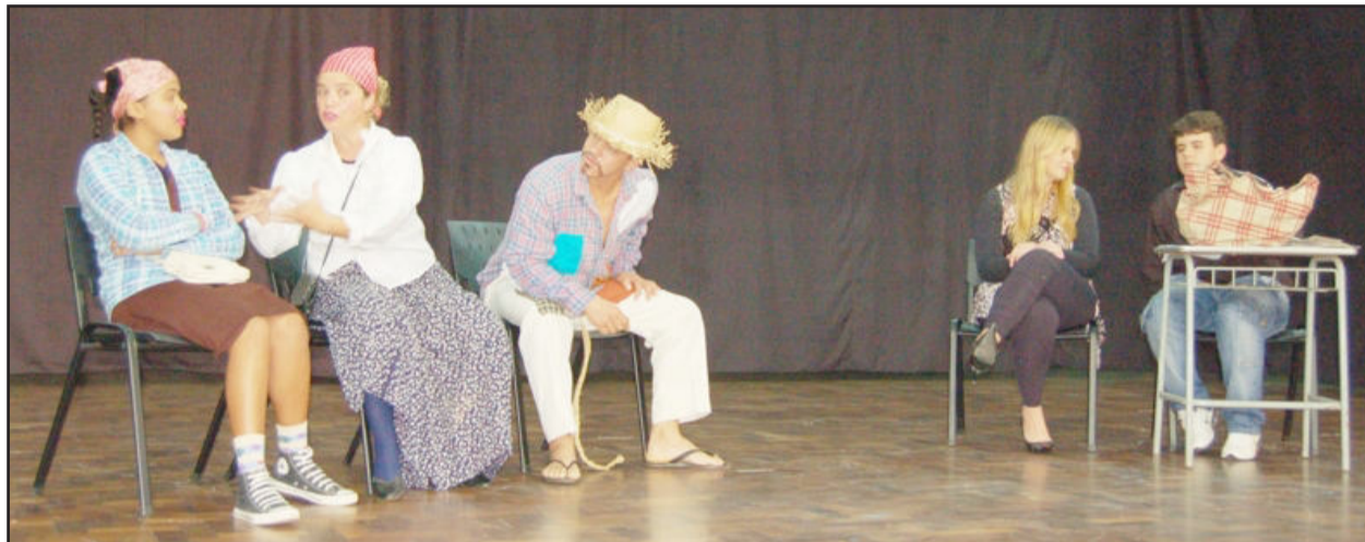
Grupo Teatro Amanhã refletiu o uso racional de agrotóxicos

Uso de agrotóxicos e as alternativas foram a tônica dos debates realizados