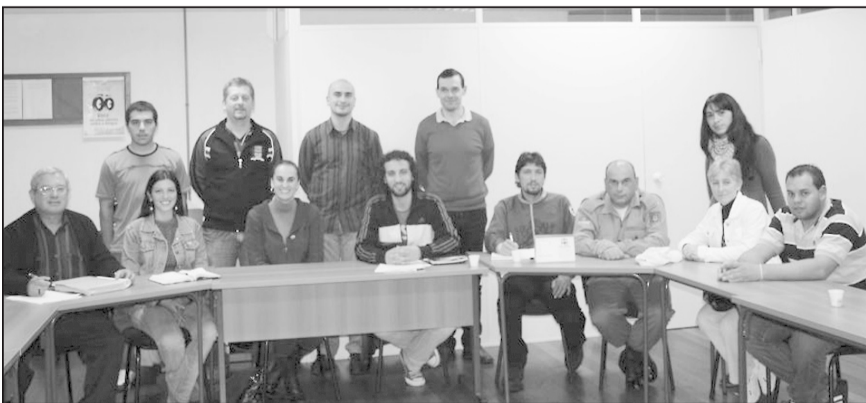
Integrantes do Conselho Municipal Anti-Drogas

Na noite desta segunda-feira, dia 24, foi instituído, de forma inédita em Carlos Barbosa, o Conselho Municipal Antidrogas (Comad). O Conselho foi criado tendo a finalidade dedicar-se à causa anti-drogas, competindo a ele integrar, estimular e coordenar a participação de todos os segmentos sociais do Município, de modo a assegurar a máxima eficácia das ações a serem desenvolvidas no âmbito da redução e da prevenção da demanda de drogas. O Comad tem o desafio de formular e executar a