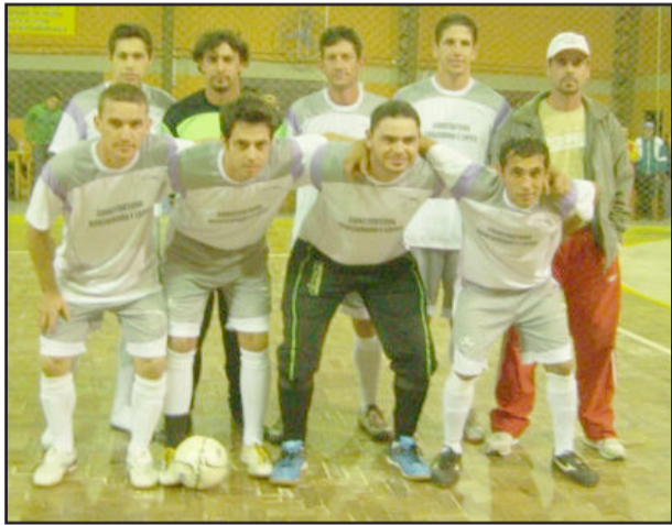
Baixada do Sapo