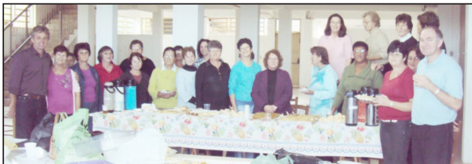
Integrantes do coral com o prefeito de Teutônia

O grupo que forma o Coral Esperança surgiu com o propósito de levar conforto para familiares enlutados, cantando em velórios e sepultamentos. Alguns anos após, os can-