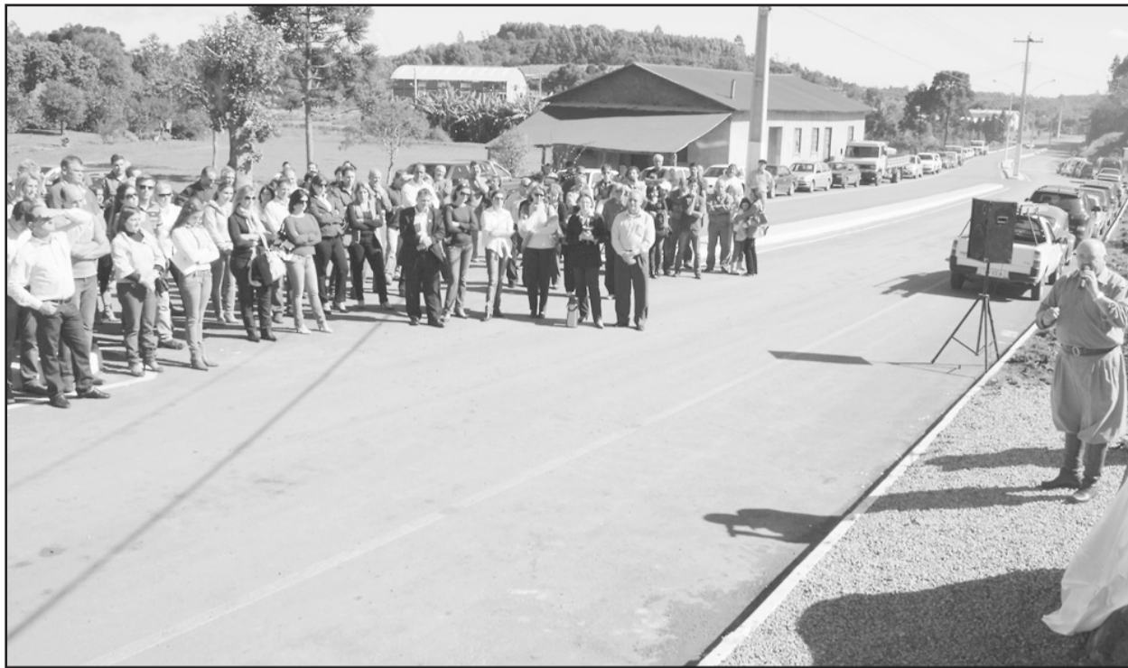
Comunidade de Cinco da Boa Vista recebe oficialmente asfalto

A comunidade do Quinto Distrito, em Carlos Barbosa, recebeu oficialmente da administração a obra de pavimentação asfáltica nas comunidades de Cinco da Boa Vista e Cinco Baixo no último sábado. O ato reuniu um grande número de moradores das comunidades beneficiadas com a obra, além de autoridades do Município.