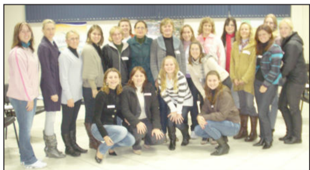
Formação ocorreu no início do mês de maio

No início do mês de maio a Câmara de Indústria e Comércio (CIC), em parceria com a Câmara de Dirigentes Lojistas (CDL) de Porto Alegre, promoveu o curso Recrutamento e Seleção. A formação teve a participação de 19 pessoas e objetivou desenvolver e aprimorar conhecimentos para qualificar os processos de recrutamento e seleção, visando contratações que agreguem resultados para a empresa.