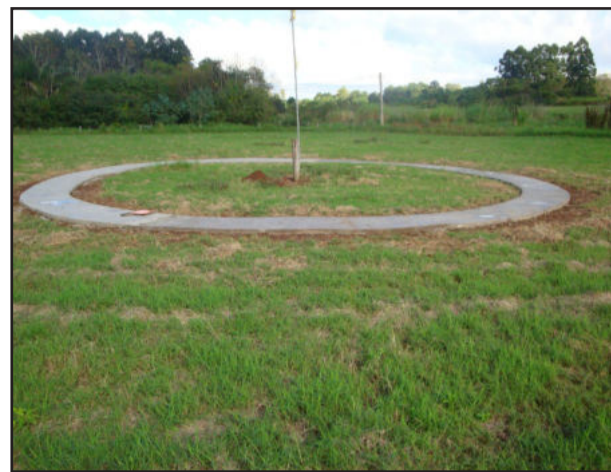
Local que receberá a biruta

Portanto, conforme Hepp, o investimento total será de R$ 55.199,08. As obras junto ao aeródromo regional estão sendo executadas por empresa vencedora do processo licitatório promovido pela Prefeitura.