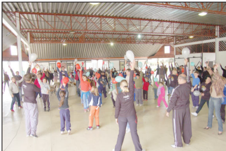
Alongamentos e exercícios marcaram momento no Centro Cívico da Prefeitura

No inverno de 1983, quando a temperatura em uma pequena cidade do Canadá chegava a 20 graus negativos, o prefeito sugeriu que, às 15 horas, todos apagassem as luzes, saíssem de casa e caminhassem por 15 minutos ao redor do