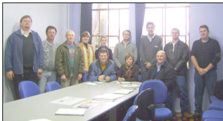
Colégio Teutônia reuniu representantes de empresas e instituições parceiras para tratar do evento

O evento será realizado no Auditório Central do Colégio Teutônia e o programa preliminar conta com a participação do pesquisador da Embrapa Passo Fundo, Renato Serena Fontanelli, e do engenheiro agrônomo Valmir Dartora. Durante a programação serão apresentados painéis de produtores com foco na viabilidade e sustentabilidade da atividade leiteira em