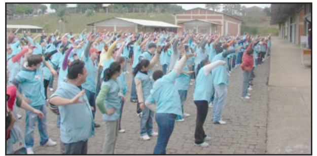
Empresas como a Piccadilly pararam a produção por 20 minutos e aderiram à iniciativa

Com iniciativa em 1983 no Canadá, e adesão do Sesc São Paulo em 1995, o Dia do Desafio acontece anualmente na última quarta-feira do mês de maio e incentiva a prática regular de atividades físicas em benefício da saúde. No Brasil, o número de cidades e pessoas participantes cresce a cada ano. Em 2009 foram 405 cidades engajadas e mais de 4,1 milhões de pessoas se exercitando.