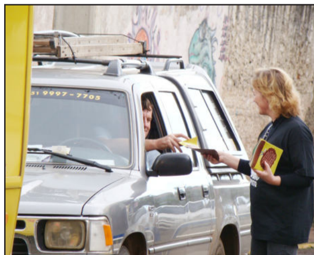
Folderes informativos foram distribuídos para a população

As ações de protesto e conscientização ocorreram simultaneamente em várias cidades do Vale do Taquari, do Estado e até em outras capitais. As atividades locais tiveram o envolvimento das seguintes entidades: Câmara da Indústria, Comércio e Serviços do Vale do Taquari - CIC Vale do Taquari; Associação Comercial e Industrial de Lajeado - ACIL; Câmara de Dirigentes Lojistas de Lajeado - CDL Lajeado; Sindicato do Comércio Varejista do Vale do Taquari - Sindilojas Vale do Taquari; Associação Comercial e Industrial de Estrela - ACIE; Câmara de Dirigentes Lojistas de Estrela - CDL Estrela; Associação Comercial, Industrial e Serviços de Arroio do Meio - Acisam; Câmara de Dirigentes Lojistas de Arroio do Meio - CDL Arroio do Meio; Associação Comercial, Industrial e Agropastoril de Bom Retiro do Sul - Aciab; Associação Comercial e Industrial de Encantado - ACIE; Câmara de Dirigentes Lojistas de Encantado - CDL Encantado; Câmara da Indústria, Comércio e Serviços de Teutônia - CIC Teutônia; Associação Comercial, Industrial, Agropecuária e Serviços de Roca Sales - ACI Roca Sales; Sindicato dos Contadores e Técnicos em Contabilidade do Vale do Taquari - Sincovat; Associação das Empresas de Serviços Contábeis do Vale do Taquari - Aescon; Sindicato dos Salões de Barbeiros Cabeleireiros Institutos de Beleza do Vale do Taquari - Sindicabes, entre outras.