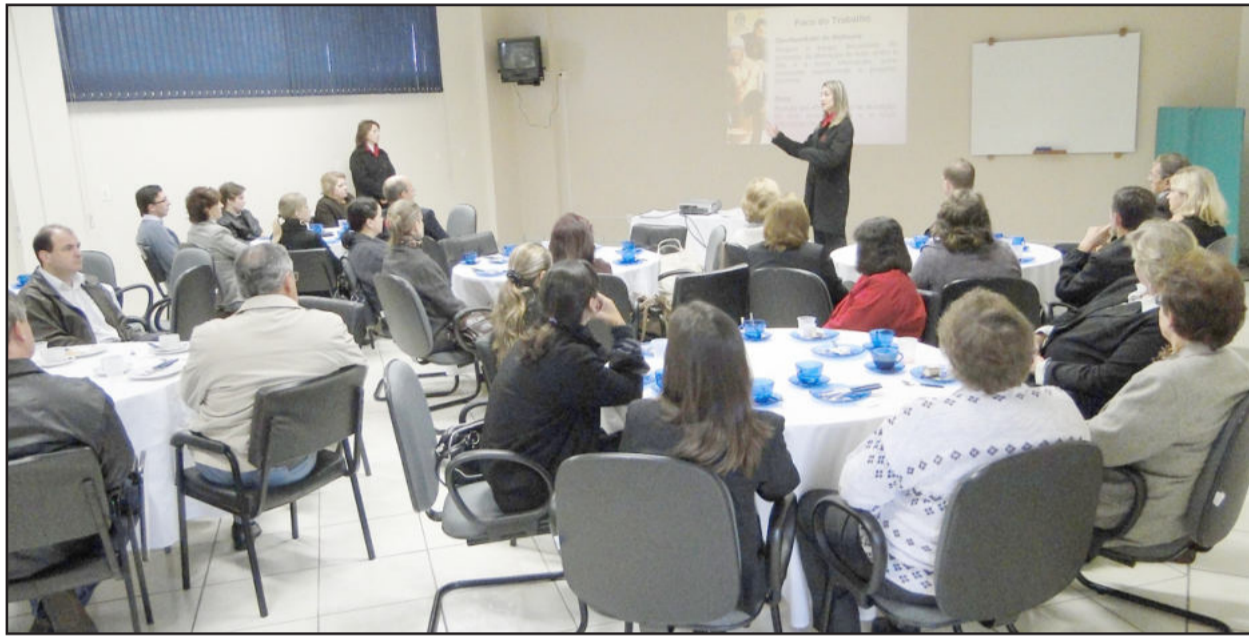
Evento contou com a participação de 46 pessoas

No dia 20 de maio a Câmara de Indústria e Comércio (CIC), o Sub-Comitê da Qualidade de Teutônia e o Comitê da Qualidade Vale do Taquari promoveram o 7o Café da Manhã “Qualificando a Gestão”. O evento, realizado no auditório da CIC, contou com a participação de 46 pessoas que puderam conhecer um pouco mais sobre o Hospital Beneficente Santa Teresinha (HBST), de Encantado, única instituição de saúde do Rio Grande do Sul a ser reconhecida pelo PGQP em 2009.