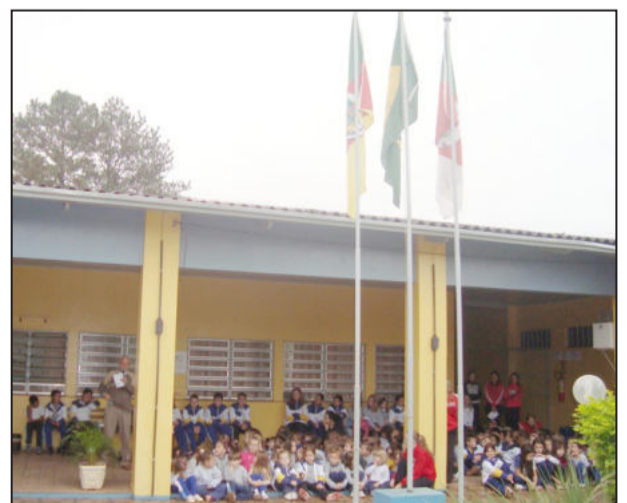
Bandeiras hasteadas no Icecg