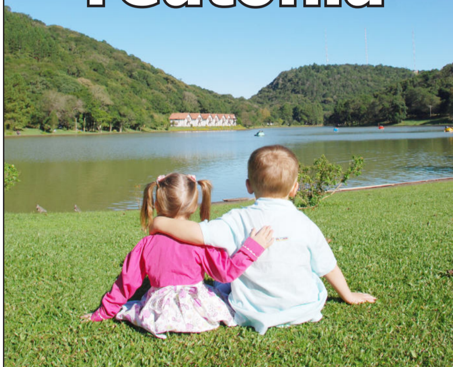
A foto "É fascinante estar aqui", de Pauline Klein, é a vencedora do 2º Concurso Fotográfico de Teutônia. Página 7