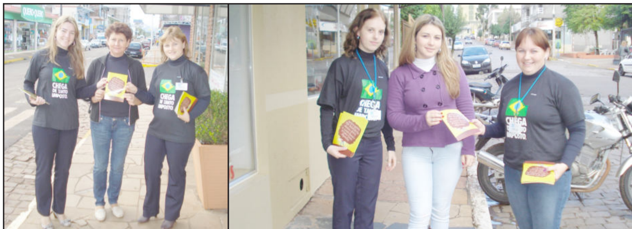
Colaboradores da CIC distribuíram material informativo nos bairros Languiru e Canabarro

O dia 25 de maio é reconhecido como o Dia da Liberdade de Impostos, visto que a partir desta data, anualmente, os brasileiros “param de pagar impostos” e começam a trabalhar para si próprios. Ou seja, desde o início do ano até este dia os brasileiros trabalham para cumprir com os pagamentos de impostos aos governos municipal, estadual e federal na aquisição de produtos e serviços.