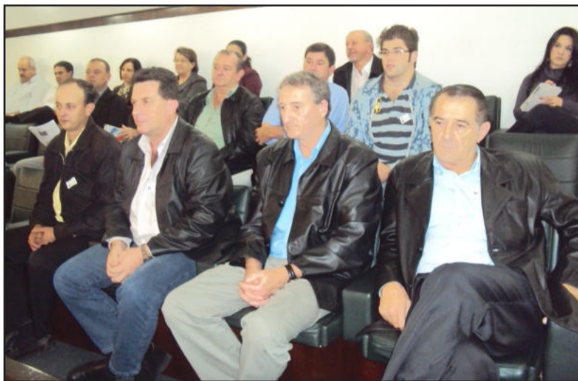
Comitiva de Paverama na audiência pública sobre a Corsan

O diretor-presidente da Corsan, Luiz Zaffalon, integrou a mesa dietora e destacou que os alguns dos maiores municípios do Estado têm apresentado certa resistência à renovação de contratos com a companhia devido aos investimentos no saneamento. Porém ele frisou que na questão do fornecimento de água não há maiores problemas. "Estamos encaminhando diversos projetos que resultarão em importantes obras de tratamento de esgoto em grandes e pequenas cidades do Estado", disse. Ele afirmou