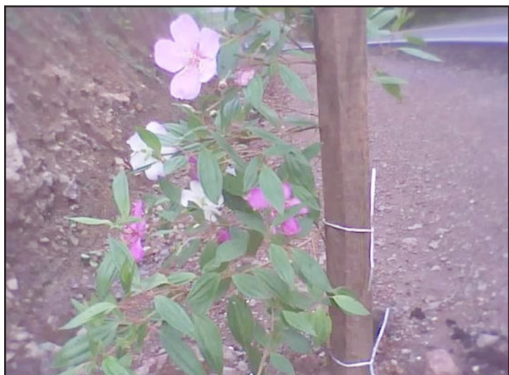
Pés pequenos já florescem às margens da rodovia

No trecho em que trabalhavam, os dois plantaram aproximadamente 500 mudas da árvore "guarisbeira tricolor", que produz flores que colorem em 3 etapas diferentes, produzindo um colorido especial, branco, rosa e azulado. Outras 500 mudas devem ser plantadas e replantadas no trecho da Linha 31 de Outubro, que já recebeu mudas no inverno passado, mas algumas morreram e agora estes espaços serão preenchidos, para embelezar de forma uniforme as margens da rodovia.