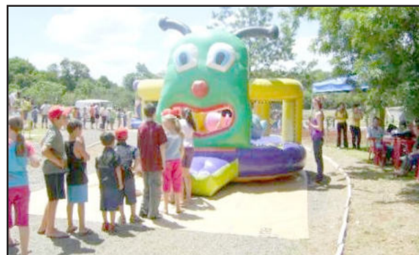
Comunidade Alerta será em Matutu

Uma extensa programação está prevista para realização do 2º Comunidade Alerta 2010 de Fazenda Vilanova, neste sábado, dia 29. Seguindo o cronograma de interiorização do evento, a comunidade de Matutu será contemplada com as atrações artísticas, esportivas e recreativas. O local será o ginásio da Escola Municipal de Turno Integral José Victor Mairesse, com início às 13h30. A organização é da Secretaria Municipal da Educação, Cultura e Esporte, através dos departamentos de Esporte e Cultura.