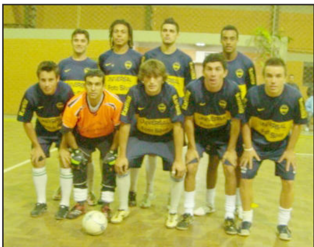
Transportes Majuel/Dillin Informática, Força Livre

O ginásio de esportes da Comunidade Católica de Paverama apresentou três bons jogos na noite desta terça-feira, dia 25 de maio. Os confrontos acirrados e emocionantes comprovam que a Copa de Futsal 25 anos Folha Popular e Taça Neko Calçados está empolgante. Para amanhã, dia 28, mais quatro jogos movimentam o certame. Confira os resultados, a tabela de classificação e os próximos jogos.