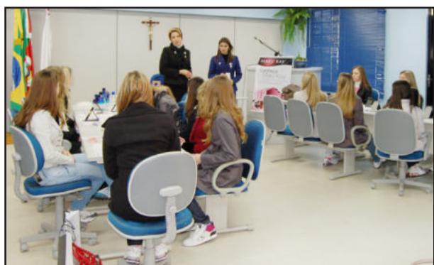
Candidatas receberam dicas de maquiagem