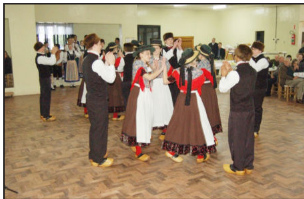
Westfälische Tanzgruppe de Westfália