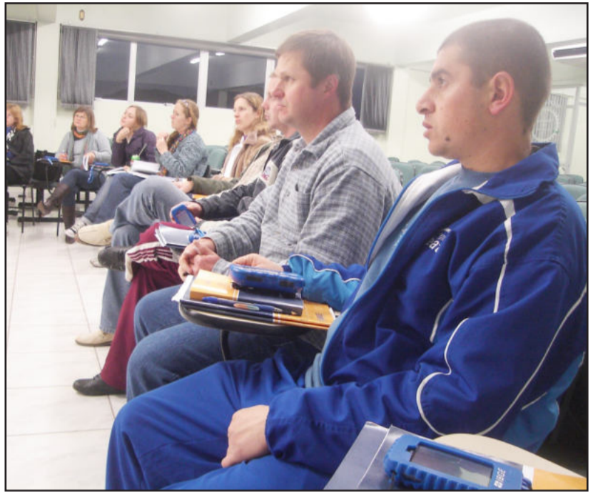
Recenseadores foram capacitados

Os treinandos estudaram os principais conceitos (morador, domicílio, entre outros) e os quesitos dos questionários (educação, deficiência, nupcialidade, fecundidade, religião, trabalho, rendimento, entre outros). Além disso, tiveram acesso ao material de trabalho que será utilizado durante o censo, inclusive com o computador de mão (PDA). Durante o treinamento, os recenseadores dispuseram de vídeos, slides, leituras dinâmicas do Manual do Recenseador, explicações feitas pelos instrutores e simulações realizadas no PDA.