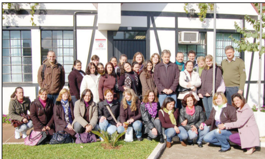
Visitadores e monitores do PIM, em fase de capacitação, são recebidos pelo prefeito e vice

Na sexta-feira, dia 23, os participantes desta capacitação de 60 horas, iniciada em 16 de julho, fizeram uma visita pelo Centro Administrativo para conhecer um pouco mais sobre Teutônia. No gabinete do Executivo, foram recebidos pelo prefeito Renato Airton Altmann e pelo secretário de Cultura e Turismo, Ariberto Magedanz.