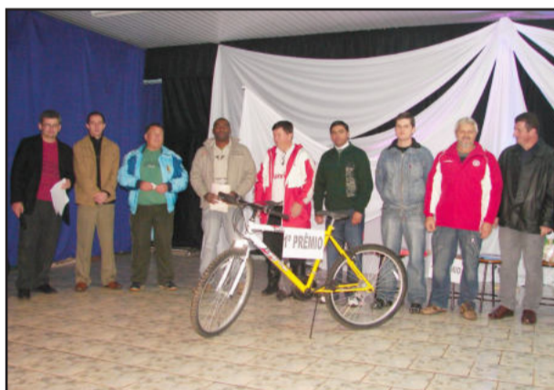
Ação Entre Amigos: colaboradores e sorteados