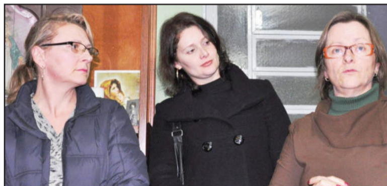
Assistentes sociais que prestam serviços aos abrigados