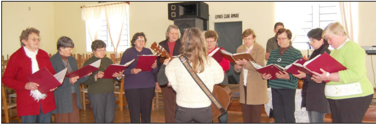
Coral da anfitriã Oase Ana, da Seca Baixa