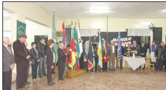
Momento cívico ocorreu antes do almoço