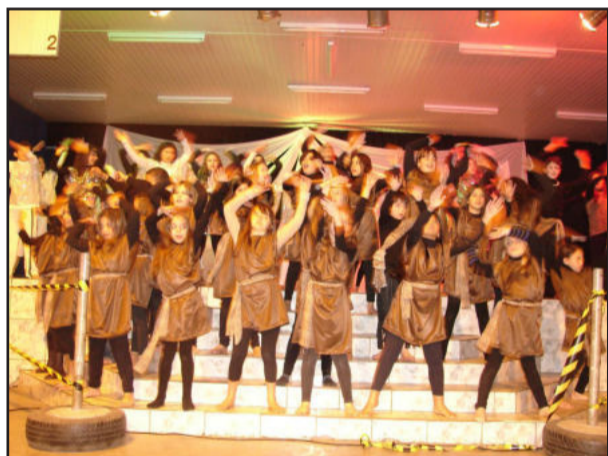
Noite de Talentos: Grupo de Danças Argos

Atacantes - Robinho (Santos), Neymar (Santos), Alexandre Pato (Milan), André (Santos) e Diego Tardelli (Atlético-MG).