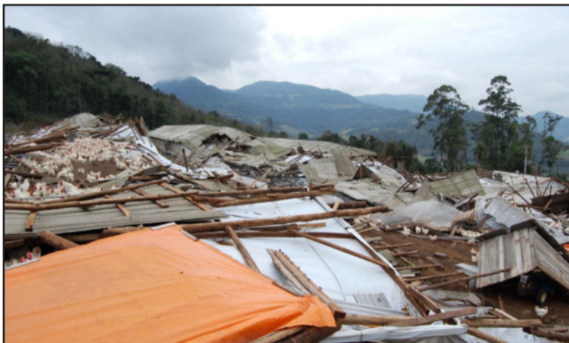
Vendaval destruiu tudo por onde passou em Imigrante

Segundo informações do meteorologista Eugênio Hackbart, "esse tipo de vento é classificado como micro-explosões, oportunidade em que ocorre um vento descendente, o qual se desprende da base da nuvem e atinge o solo com grande intensidade. Diferente dos tornados, as micro-explosões provocam uma rajada de vento muito forte".