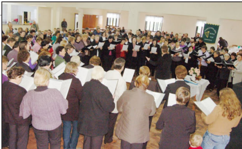
Canto do grande coral é característico no encontro que acontece anualmente

A reunião dos presidentes e regentes dos corais, que costumava ser realizada no dia do evento, ficou marcada para o dia 21 de agosto, às 11 horas, no Juventude da Linha Berlim, na comunidade que sediará o evento de 2011.