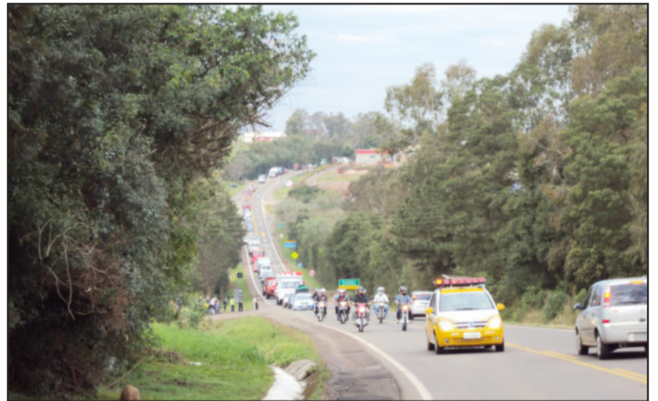
Trecho da Via Láctea, marcado por muitos acidentes, esteve na rota da procissão de fé