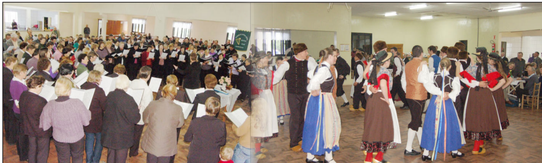
No sábado, em Westfália, canto coral e danças típicas lembraram a colonização alemã. Em Imigrante, corais também mantêm tradição. Páginas 3 e 9