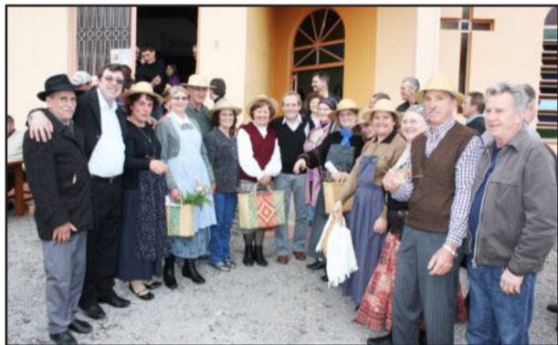
Grupo encenou a chegada dos primeiro imigrantes

Na parte da tarde, foi realizada a cerimônia de entrega do Prêmio Agricultor do Ano. Em 2010, a premiação sofreu modificações com relação às edições anteriores. Desta vez, um casal de agricultores de cada comunidade do interior recebeu um troféu, simbolizando o trabalho e a luta das famílias garibaldenses na agricultura familiar.