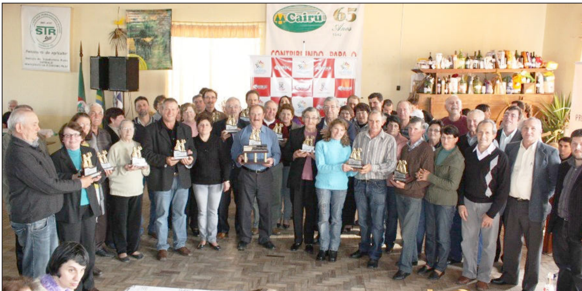
Em 2010, premiação contemplou um casal de cada comunidade do interior do município. No total foram 17 agraciados

Ao final da premiação, também foi entregue um troféu maior à comunidade de São Jorge, pelo fato dela ter sediado a edição de 2010 da Festa do Agricultor. Este troféu ficará na comunidade até julho do ano que vem, quando será entregue a comunidade que sediar a Festa do Agricultor 2011.