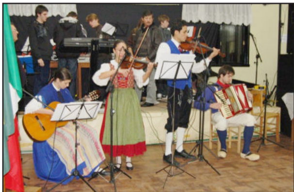
Grupo instrumental deu o ritmo para o grupo de danças

Além do grupo local, dois grupos foram convidados: Tanz mit unz, de Porto Alegre, e Immer Freunde, de Canoas. Eles são acompanhados por um grupo instrumental, composto de vários instrumentos, como violino, violão e gaita. O auge da apresentação foi a integração de todos os grupos, apresentando dança típica de forma integrada, sem ensaio. O representante dos grupos visitantes afirmou que “assim como os corais realizaram uma integração através da linguagem do canto, da nota musical, os grupos de dança conseguiram se entender e estabelecer um diálogo intermunicipal através da língua da dança com música instrumental”.