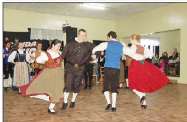
Grupos de Porto Alegre e Canoas em sua apresentação