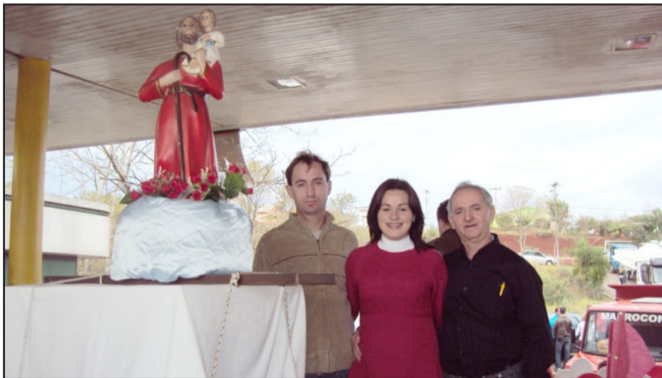
Família Haupenthal - Madrocon - conduziu o Padroeiro dos Motoristas