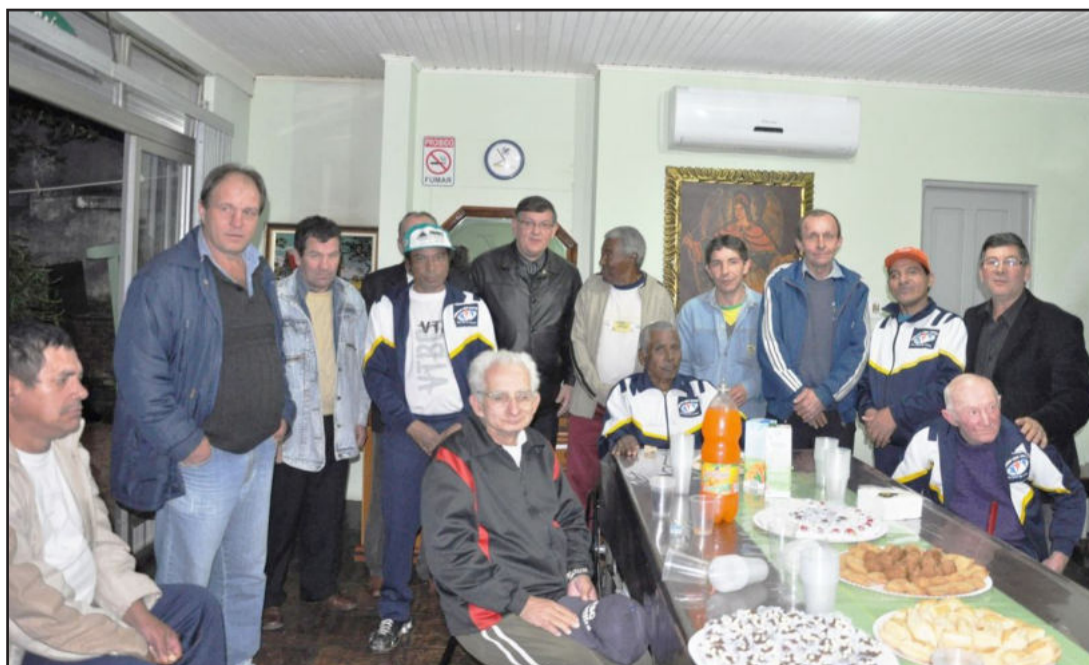
Noite foi de festa e integração com os abrigados do São Chico