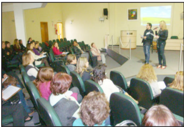
Gestores reunidos para troca de experiências

Assistentes sociais e demais profissionais envolvidos com as políticas de Assistência Social dos municípios da região compareceram em grande número para discutir as pautas da reunião.