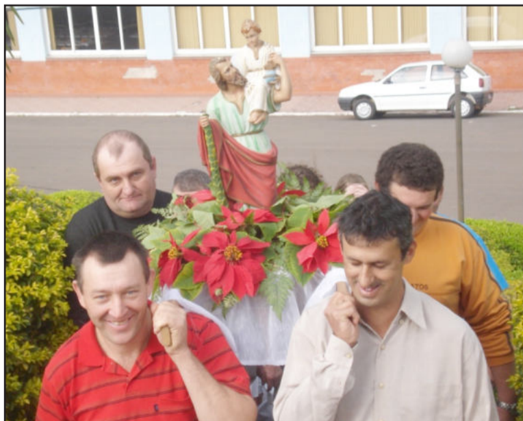
Fieis carregaram padroeiro