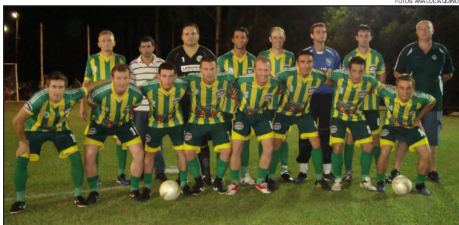
Posto da Dani/Imob. Líder/Trans. Tomasi