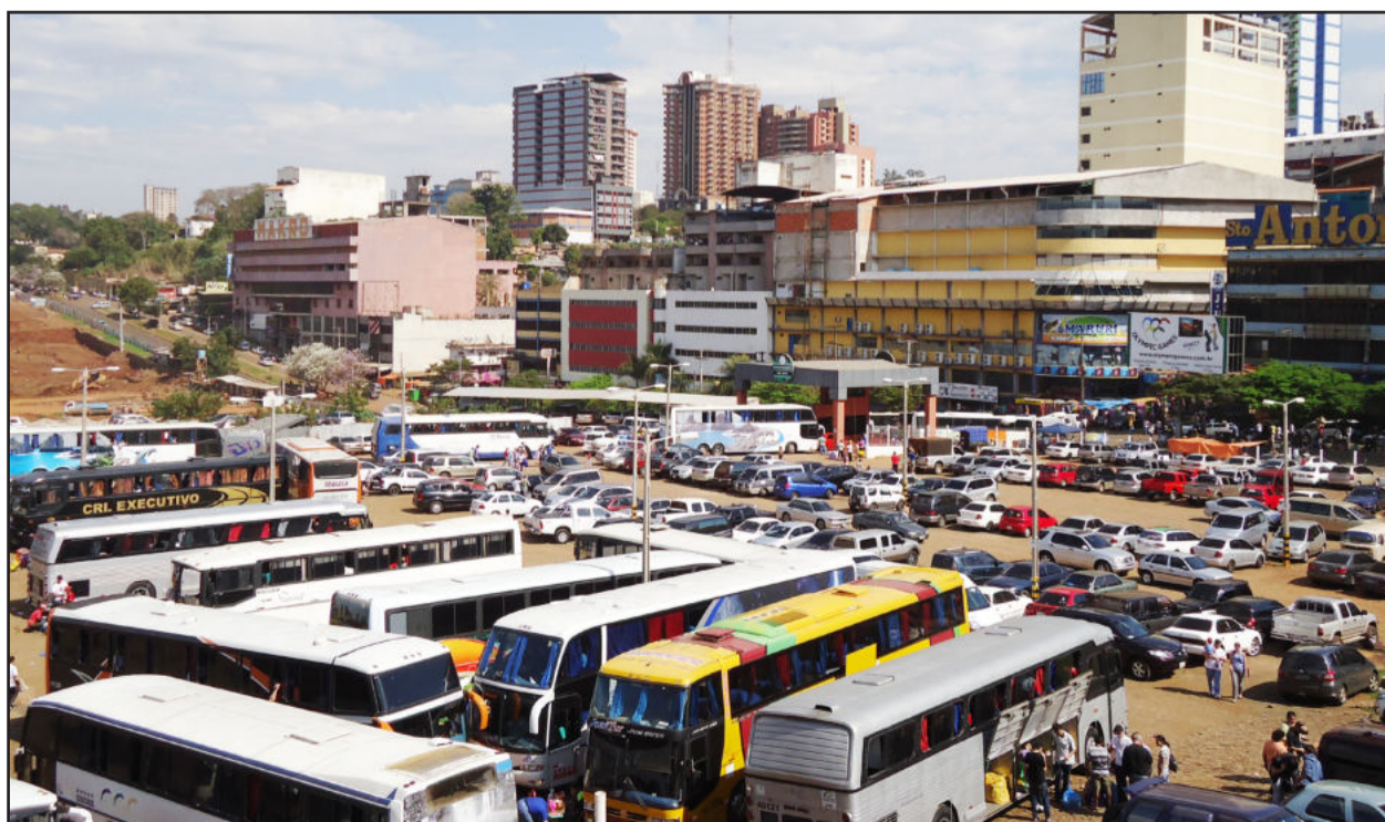
Fretamento de ônibus de turismo são frequentes

Saiba mais sobre a nova lei e o RTU no site da Receita Federal ( www.receita.fazenda.gov.br ).