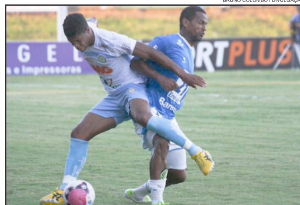
Lajeadense estreia fora e Novo Hamburgo, finalista do 1º turno, joga domingo em casa