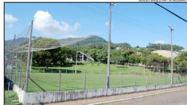
Complexo Esportivo possui campo de futebol e ginásio