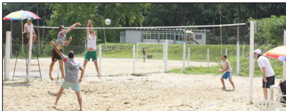
Torneio Masculino foi realizado no domingo