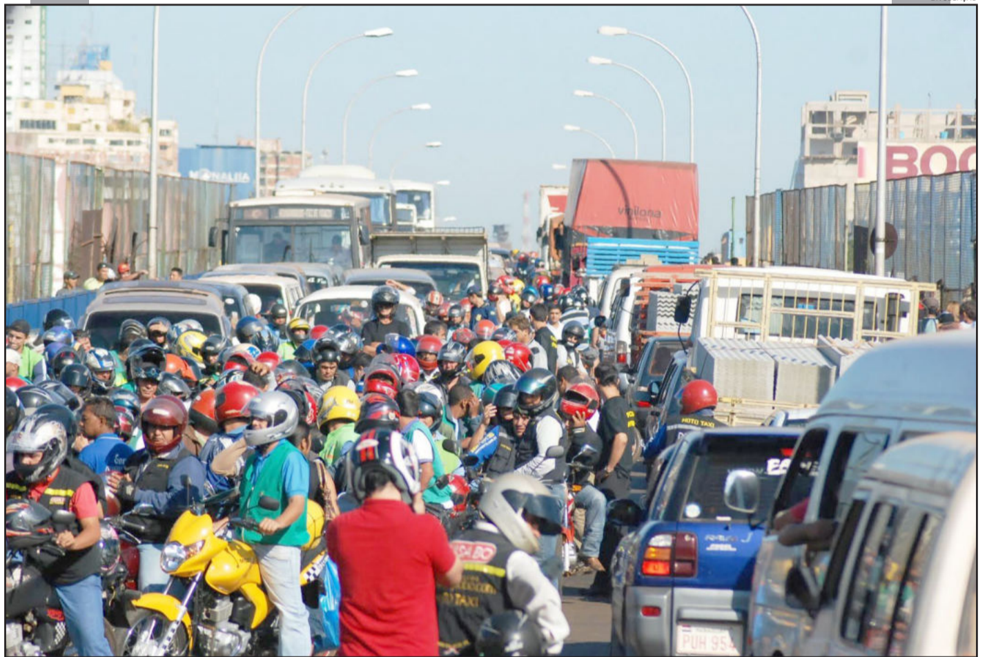
A difícil rotina de longas viagens para compras no lado de lá da Ponte da Amizade. Páginas 4 e 5