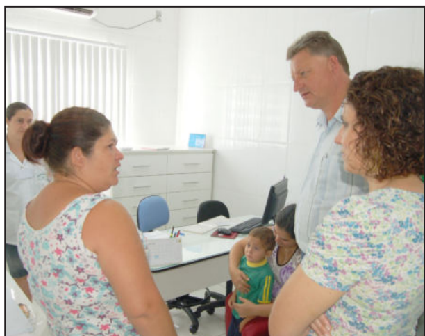
Sinara (e) elogiou publicamente o atendimento da equipe

O posto tem 206,71 m 2 e está instalado na Rua 16 de Abril, nº 184, nas imediações da Escola Municipal 24 de Maio. A estrutura contempla sala de espera, recepção, sala de reuniões e atividades múltiplas, sanitários com acesso a deficientes físicos, farmácia com guichê, sala de vacina, sala de triagem, salas de procedimentos, consultório médico, consultório de enfermagem, consultório dentário, área de serviço, corredor, sala de utilidades, rampas de acesso e varandas cobertas.