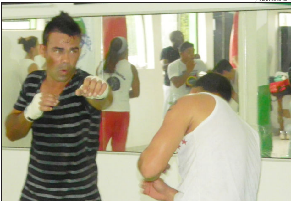
Evento realizado em Teutônia, no sábado, reuniu mestres e amantes da capoeira para avaliar sua inserção no MMA. Página 8