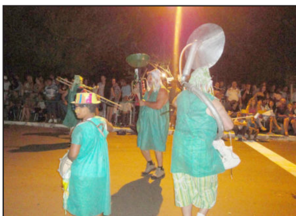
Blocos dos Palhaços animou o público