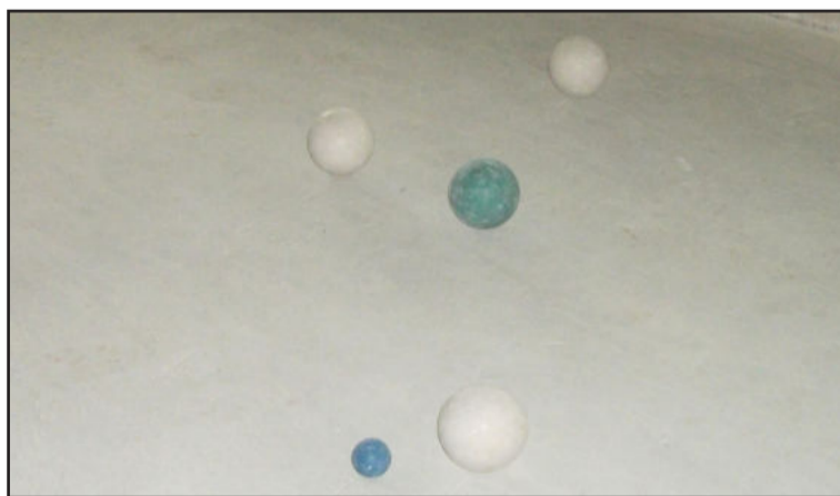
Municipal de Bocha de Teutônia começou disputado