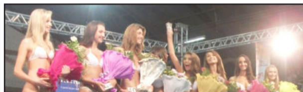
Oito garotas foram escolhidas na Região dos Vales