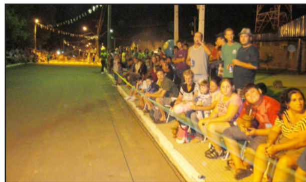
Público se concentrou ao longo da avenida para prestigiar os desfiles