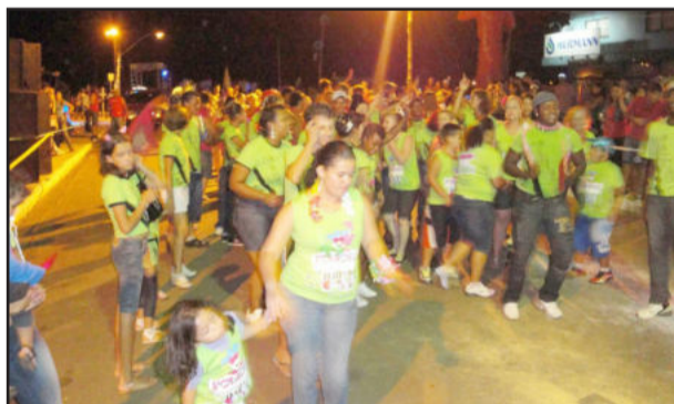
Os dois blocos locais, Foliões da Fazenda e Foragidos da Vila, também participaram do desfile