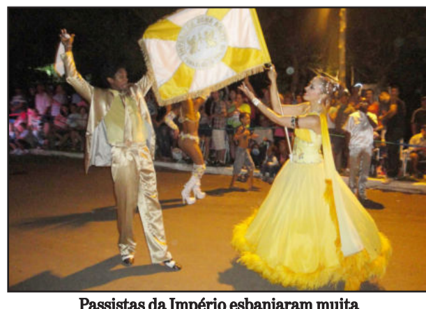
Passistas da Império esbanjaram muita qualidade técnica e simpatia