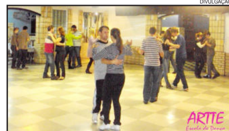
Nível 2 do curso será em quintas e sextas, em Estrela e Lajeado

Em Estrela, na Soges, as aulas serão nas quintas-feiras, das 20 às 21h30min, com início nesta quinta-feira, dia 1º de março. Em Lajeado, aulas na Academia Stágio - 19h30min às 21h, com início na sexta-feira, dia 2 de março. Para se inscrever é necessário enviar confirmação dos nomes através do e-mail dancarte@yahoo.com.br ou pelo telefone 8129-1977.