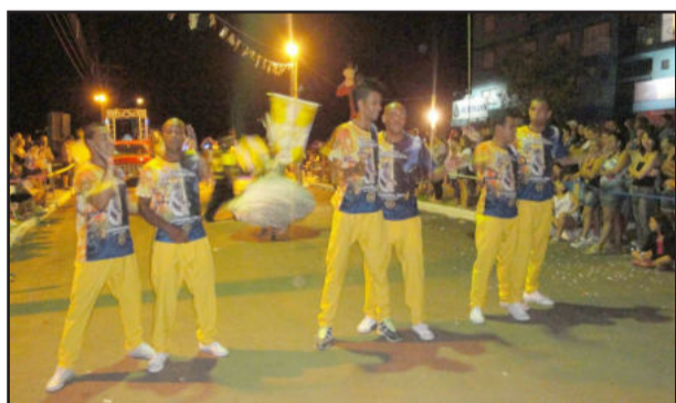
Império da Zona Norte foi a grande atração do Carnaval de Fazenda Vilanova