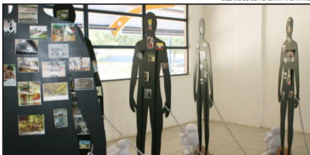
A exposição é composta por silhuetas humanas que carregam em sua dimensão imagens reais de diferentes épocas.