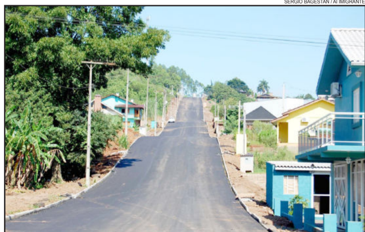
Pavimentação concluída na Rua Pastor Henrich Brackmeier