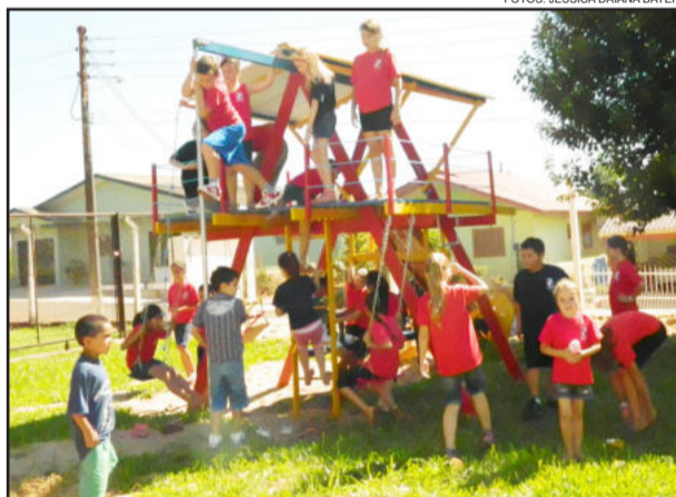
Alunos aproveitam o novo brinquedo da escola