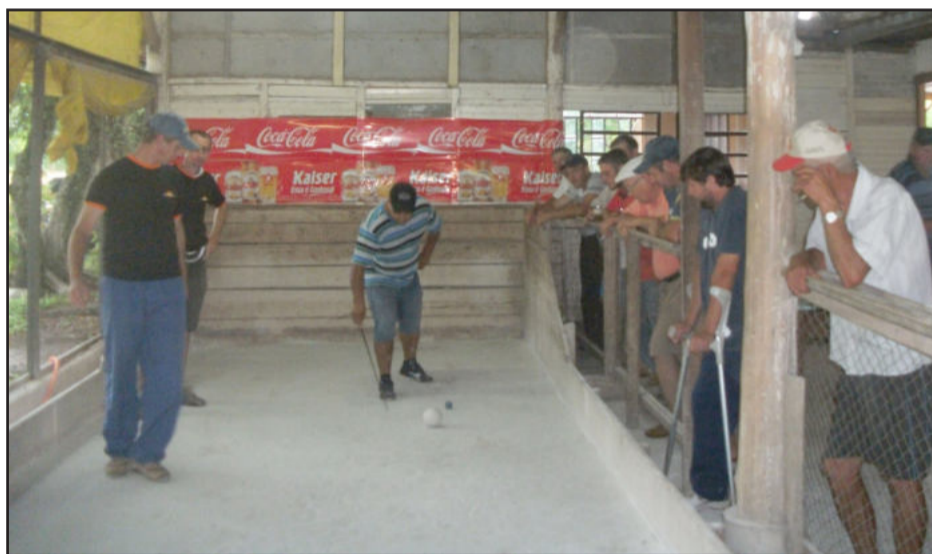
Na cancha do Bar do Brune, na Cuba, os visitantes do Canabarrense venceram