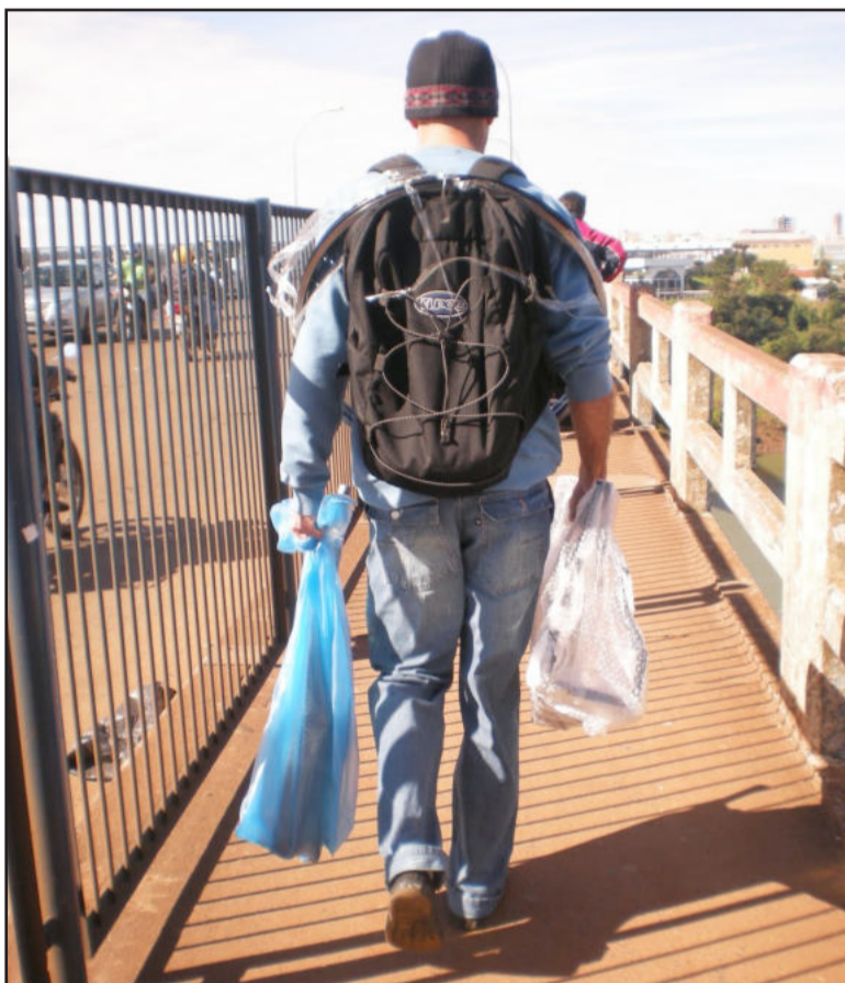
Profissão de sacoleiro teve lei específica aprovada em fevereiro deste ano

história tem planos e metas: até os 40 anos de idade e, depois disso, somente para passeio.