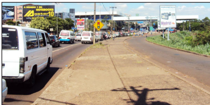
Ponte da Amizade costuma ser bastante movimentada