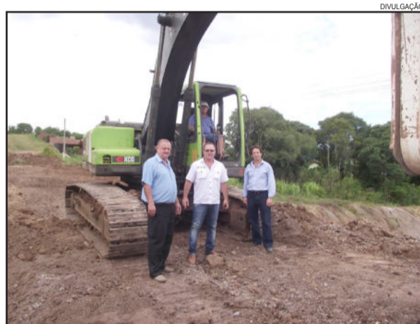
Escavadeira cedida pelo Estado presta serviços em Paverama

A máquina foi cedida pela Secretaria de Obras, Irrigação e Desenvolvimento Urbano, através do Termo de Responsabilidade pelo Uso do Bem Móvel, na qual foi acertado um prazo de em até 30 dias de serviços, na qual o Estado entra com a máquina e o município de Paverama com o operador e o combustível.