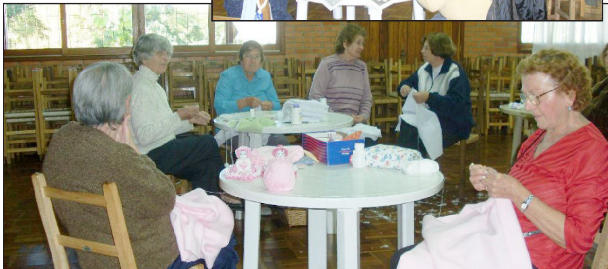
Atividades serão retomadas no mês de março