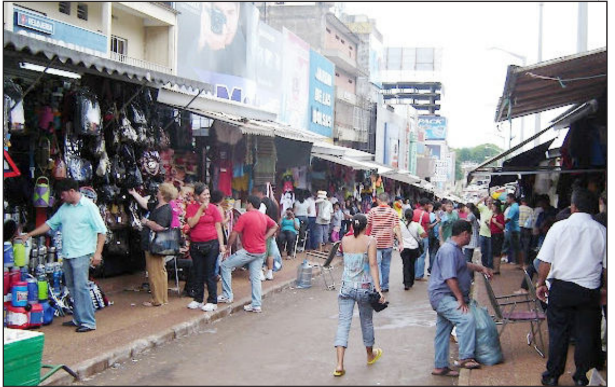
Do lado de lá da ponte, em Ciudad del Este, preços convidativos contrastam com a estrutura do comércio e da cidade

Comprar e revender. Pensando no "sacoleiro", poderíamos resumir a profissão nesses dois verbos. Porém, a vida dessas pessoas é muito mais complexa, com muitas dificuldades e a necessidade de uma série de precauções.