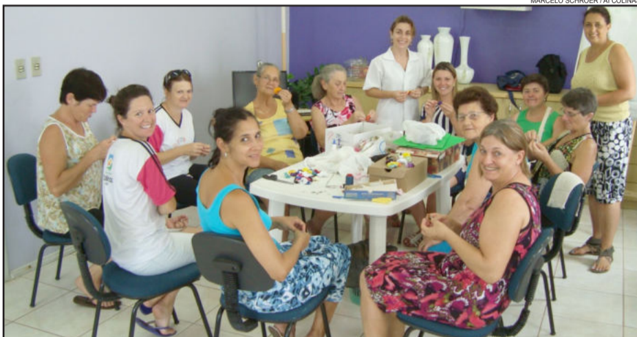
Grupo Acorda pra Vida prepara evento para março

O Grupo Terapêutico "Acorda pra Vida" de Colinas esteve reunido no dia 16 de fevereiro no auditório do Posto de Saúde. O primeiro encontro do ano constituiu da construção da Árvore dos Sonhos para 2012 e de artes manuais nos preparativos para o dia da Mulher, que ocorrerá em março em Colinas.