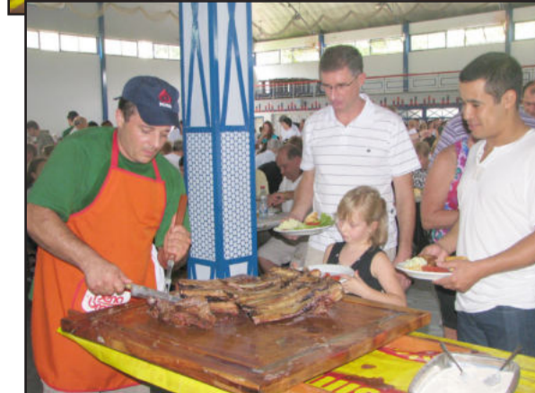
Costelão é um evento tradicional e que mexe com a comunidade