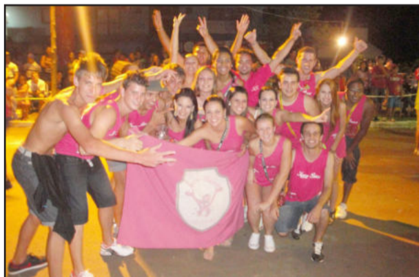
Bloco Kaxa Baxa, de Teutônia, foi uma das atrações deste ano