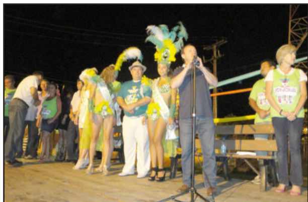
Autoridades prestigiaram a retomada do Carnaval de Fazenda Vilanova