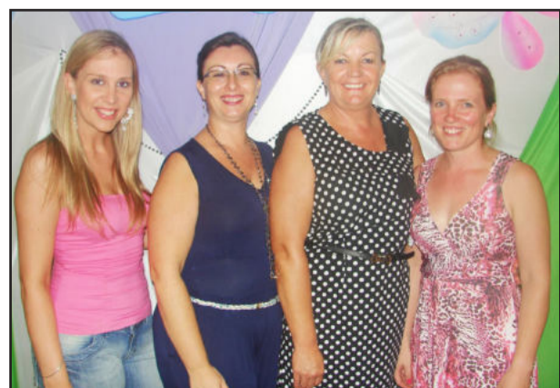
Atual diretoria da Associação dos Professores Municipais de Teutônia