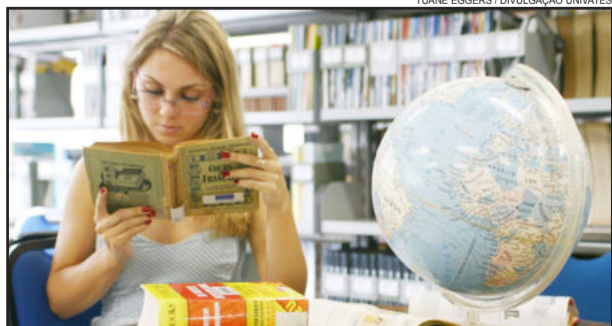
Intercâmbio da Univates oportuniza os alunos a estudarem no exterior