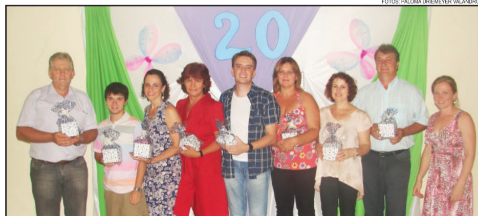
Ex-presidentes da Associação dos Professores Municipais de Teutônia foram homenageados