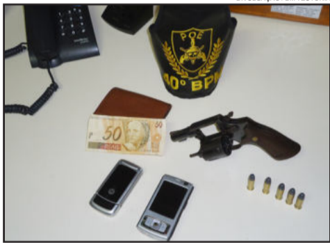
Material apreendido pela BM com o jovem em Canabarro