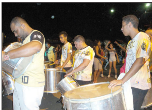
Bateria da Império surpreendeu por sua técnica