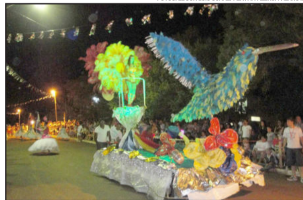
Carros alegóricos integraram as alas da Inhandava