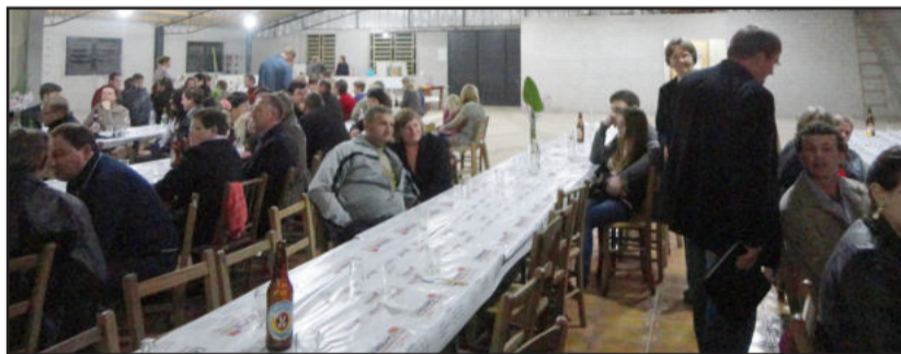
Salão de Linha Ano Bom recebeu ampliação para eventos sociais