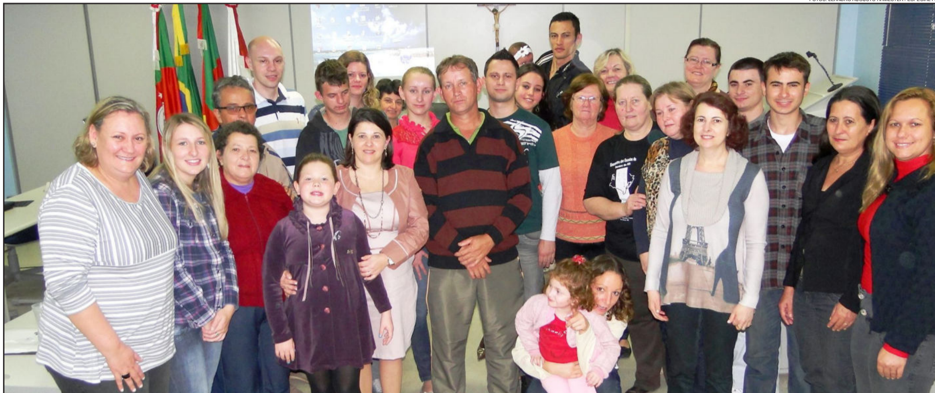
Alguns dos participantes do encontro realizado na manhã de sábado, dia 25 de agosto