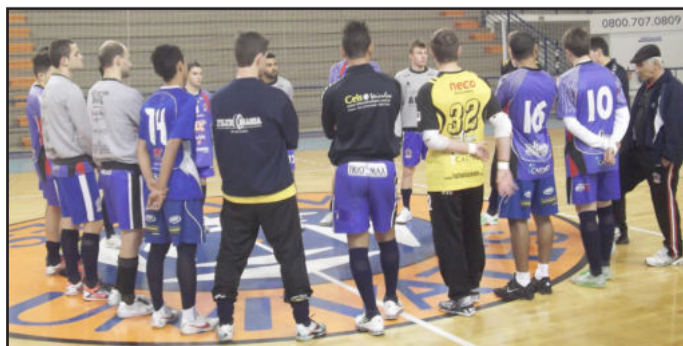
Depois de quase um mês sem jogos oficiais a Alaf volta a quadra para enfrentar a AGSL de São Luiz Gonzaga

Já no dia 8 de setembro o time de Lajeado tem outra difícil missão, jogar contra o Bento Gonçalves, em Bento, que ocupa a terceira posição com 33 pontos ganhos.