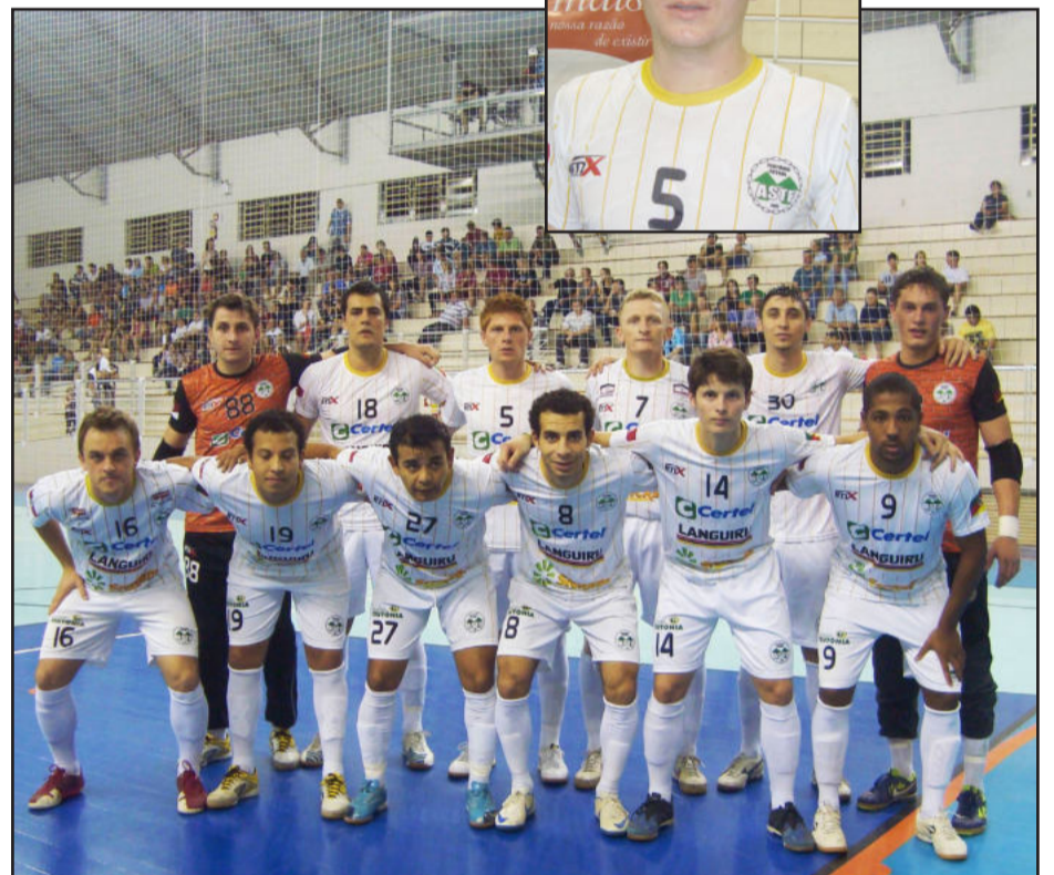
ASTF conquistou importante resultado diante do líder Milan de Lagoa Vermelha