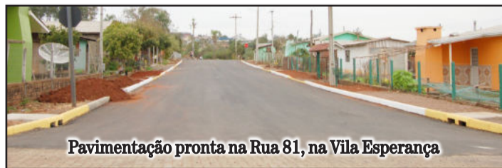
Pavimentação pronta na Rua 81, na Vila Esperança