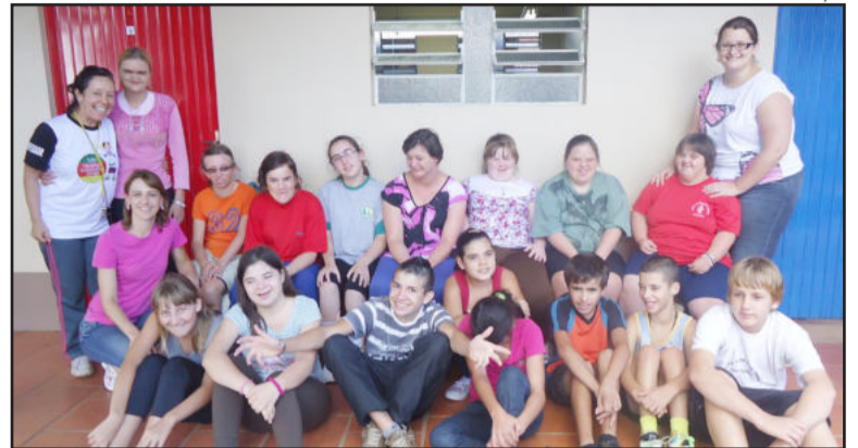
Galera especial da APAE convida para o Conexões 9