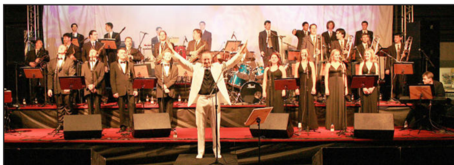
Orquestra de Teutônia