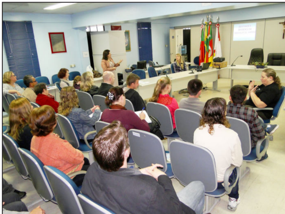
1º Encontro Municipal de Surdos ocorreu na Câmara de Vereadores de Teutônia

também faz leitura labial. Tudo isso contribui, e muito, para que ele entenda o que os outros dizem e se faça ser entendido. “Os resultados que obtemos na vida dependem muito da vontade do que queremos. Além disso, humildade, caráter, personalidade e se dar bem com as pessoas é fundamental. Mesmo assim, ainda há muito para ser feito. Sem a audição, os surdos precisam visualizar as coisas para aceitá-las e compreendê-las, principalmente em se tratando de uma sociedade ouvinte onde as mudanças ocorrem de uma maneira muito rápida. Mas devemos estar preparados para isso”, afirmou.