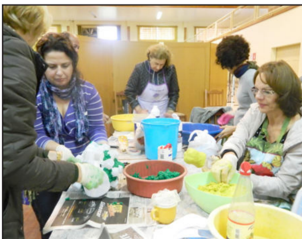
Oficina de papel machê reuniu 15 mulheres