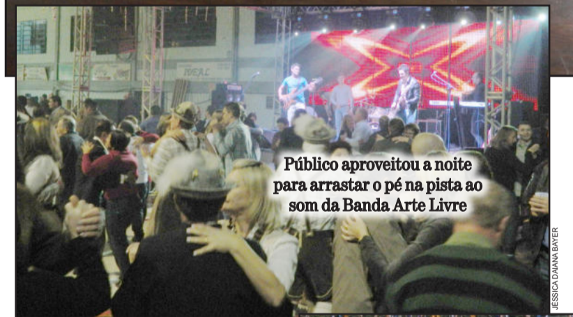
Público aproveitou a noite para arrastar o pé na pista ao som da Banda Arte Livre