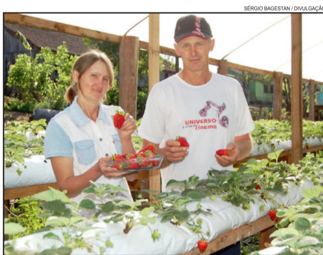
Casal Prediger faz a colheita com muito orgulho. Página 8

Cultivo de morango pelo sistema semi-hidropônico anima produtor de Imigrante