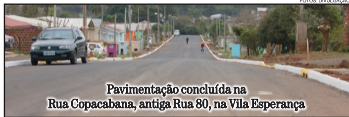
Pavimentação concluída na Rua Copacabana, antiga Rua 80, na Vila Esperança