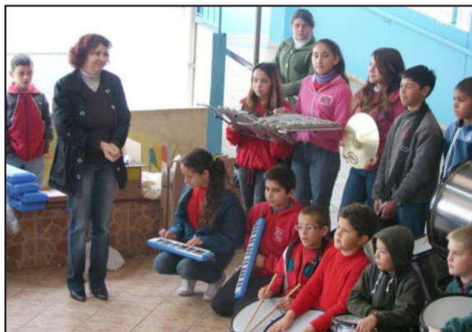
Alunos da EMEF 24 de maio tem a oportunidade de participar do projeto desde a metade de agosto