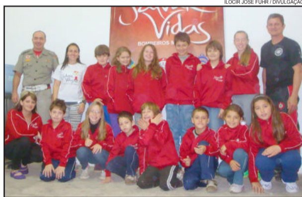
Bombeiros Mirins, turma da manhã, recebem uniformes

social da realidade onde estão inseridos."