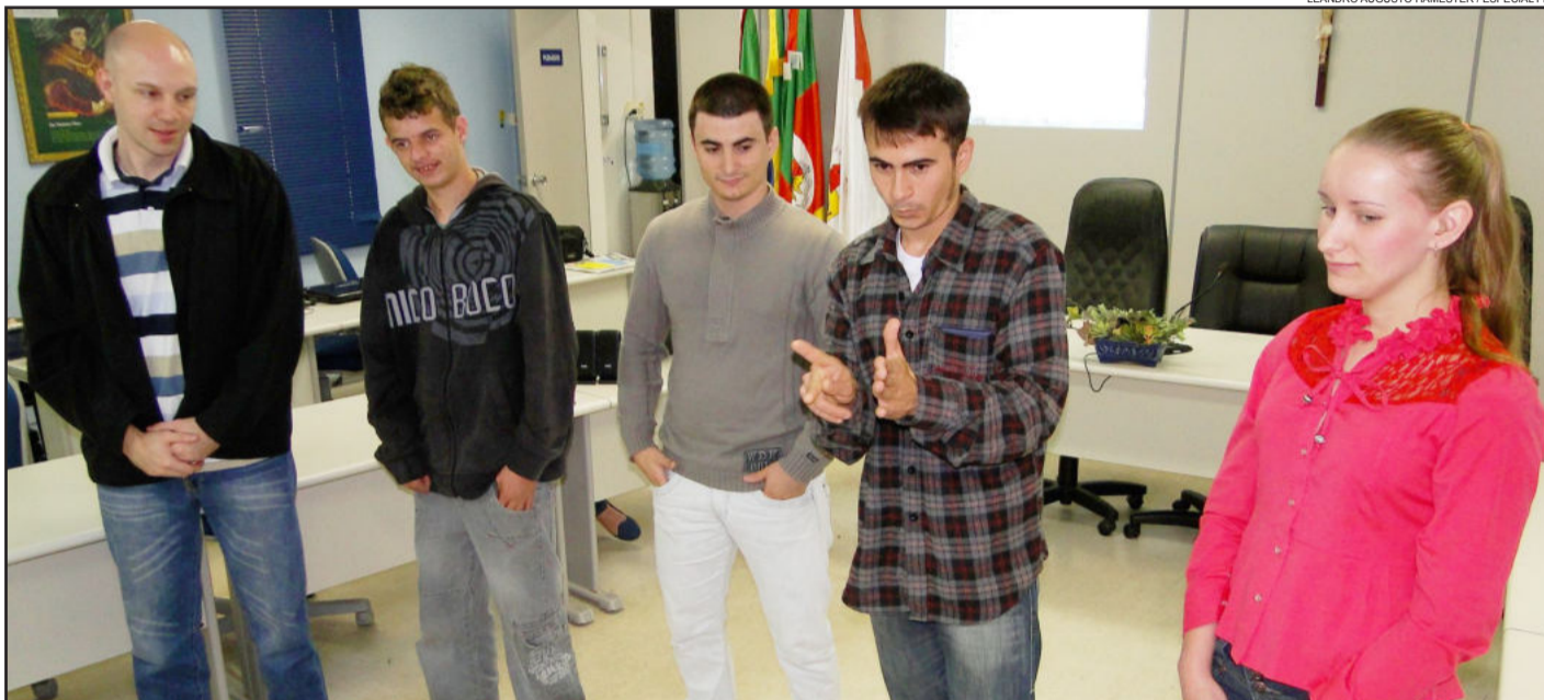
Teutonienses surdos se apresentaram aos presentes (foto) com auxílio de uma intérprete. Mobilização local pretende criar Associação de Surdos de Teutônia. Páginas 10 e 11