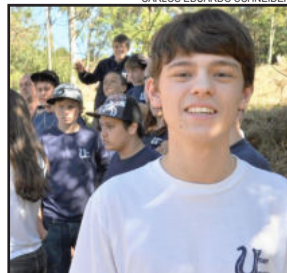
Praça atenderá pedido de 95% dos pais consultados