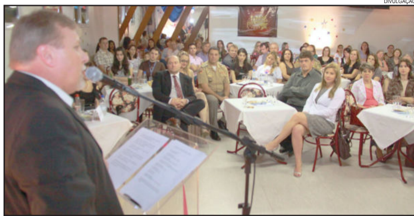
Lançamento ocorreu na Soges