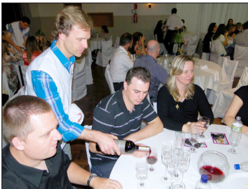
Noite para degustação de sucos, vinhos e espumantes