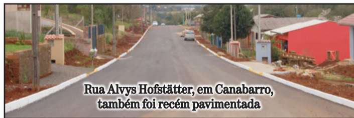
Rua Alvys Hofstätter, em Canabarro, também foi recém pavimentada

A empresa contratada pela Administração Municipal de Teutônia concluiu as obras de pavimentação asfáltica de três ruas em zonas residenciais do Município. As máquinas aproveitaram o tempo bom e trabalharam em ritmo acelerado nas ruas Alvys Hoffstätter (Bairro Canabarro), Copacabana e 81 (Vila Esperança).