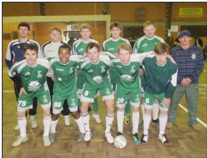
Morro do Alemão conquistou uma boa vitória na 10ª rodada