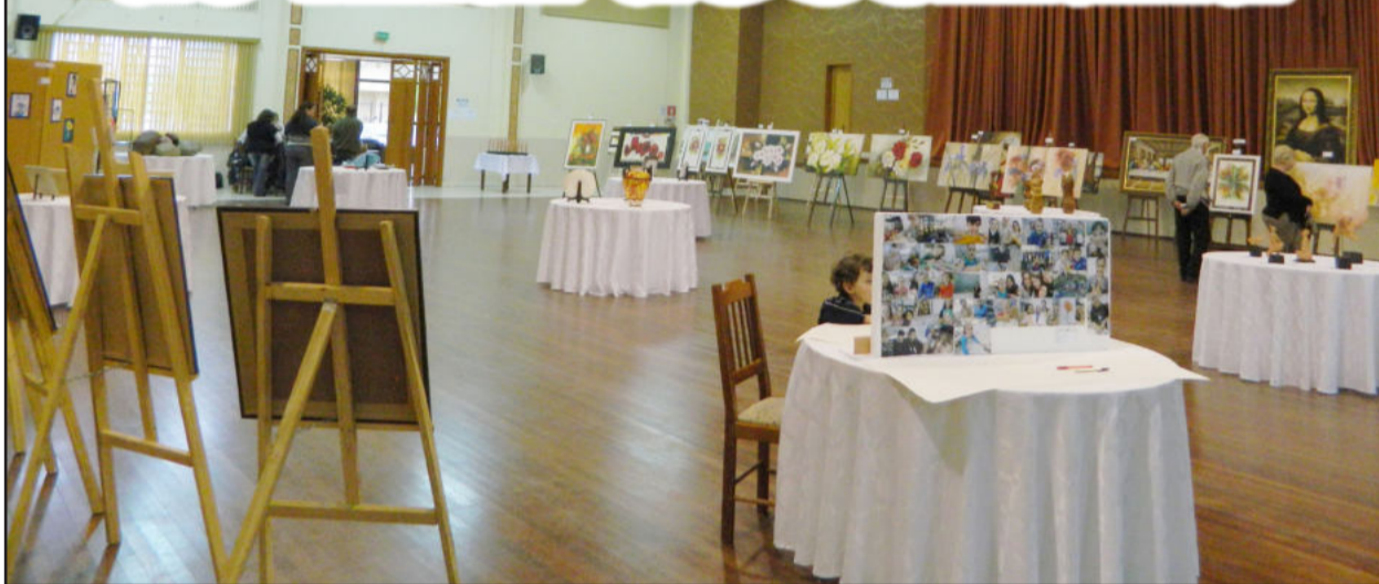
Salão de artes estava aberto de sexta a domingo