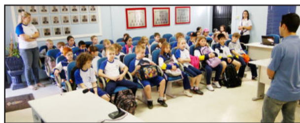
Alunos conheceram um pouco mais sobre o trabalho do Poder Legislativo Municipal e dos vereadores