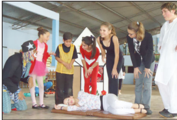
Teatro A Casinha Mágica

Apoiadores - Administração Municipal de Teutônia, Centro Cultural 25 de Julho, Grupo Danças & Ritmos, CEMEF Leonel de Moura Brizola, ARCA-Associação Regional Cultural e Artística, Orquestra Municipal de Teutônia, Escola de Ballet Karen Ibias - Porto Alegre, Grupo Oxósse de Capoeira do CEMEF - Academia Modelo, APAE Teutônia, Ginástica Artística e Dança da SMEL Escrela, Ginásio da Comunidade Católica de Canabarro, Lojas Casarão Verde, Gráfica El Shaddai, Gráfica Dallas, Dentista Cleiton F. Bauer, Arte Produções, Foto Silva, Certel, Poolseg Seguradora, Supermercado Link, Escolas de Teutônia, Centro de Yôga Teutônia, Grupo Popular de Comunicação, Rádio Germânia, Jornal O In-