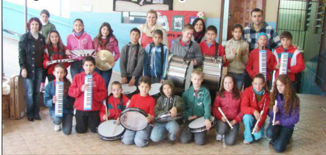
Projeto Dó-Ré-Mi ampliou atuação e atende alunos da EMEF 24 de Maio, no Loteamento 8

Desde a metade de agosto, os alunos da Escola Municipal 24 de Maio, do Loteamento 8, Bairro Canabarro, têm a oportunidade de participar do projeto "Dó Ré Mi - Tocando e Transformando", desenvolvido pela Administração Municipal, através da Secretaria Municipal de Educação. O projeto oferece instrumentos musicais para que os estudantes possam desenvolver sua habilidade musical com a orientação de um professor nas aulas de música e em atividades extraclasse.