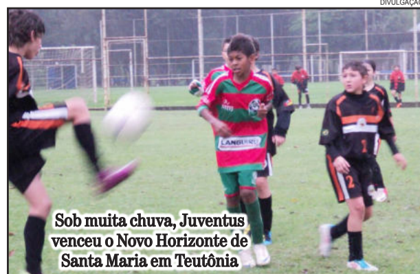
Sob muita chuva, Juventus venceu o Novo Horizonte de Santa Maria em Teutônia

Gauchão Suligafi - Já pelo Gauchão Suligafi, as categorias 97 e 99 da AERC Juventus tiveram compromissos neste sábado, dia 25 de agosto, diante da equipe da Sapucaense, em Sapucaia do Sul. A categoria 97 perdeu pelo escore de 4 a 3, enquanto a Juventus 99 venceu pelo placar de 3 a 0.