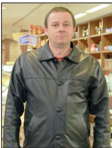
Gerente ressalta que caso algumas lojas da rede precise se adaptar a lei, custos não serão repassados para os clientes

sará qualquer investimento de melhoria para o cliente, mesmo se tiver que contratar mais funcionários. "Para a nossa rede, tudo que puder ser feito pelo bem-estar do cliente é importante. O cliente não aceita aumentos, ele simplesmente troca de supermercado", avalia o gerente.