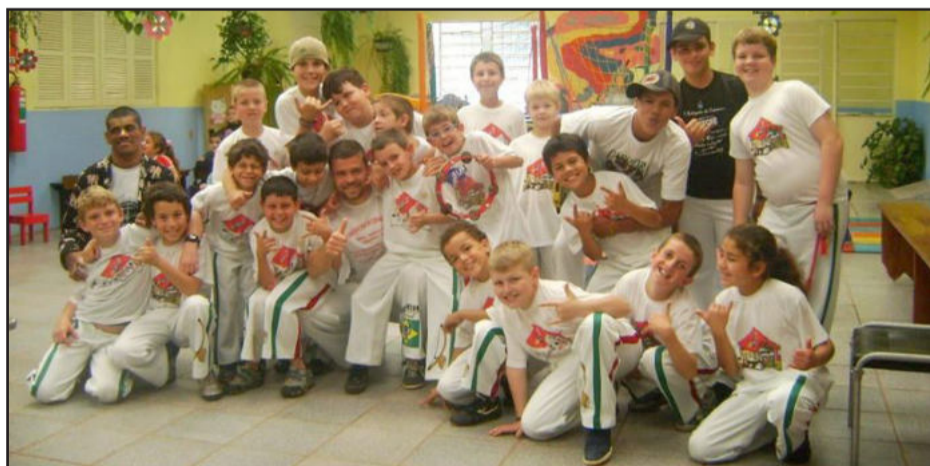
Grupo Oxósse Capoeira CEMEF

Motor: esquema corporal, coordenação motora associada ao equilíbrio e flexibilidade.