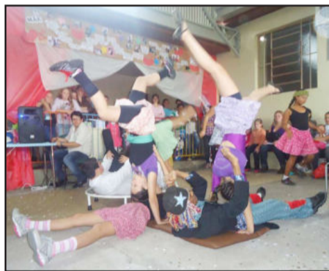
Cristal e seus Bonecos