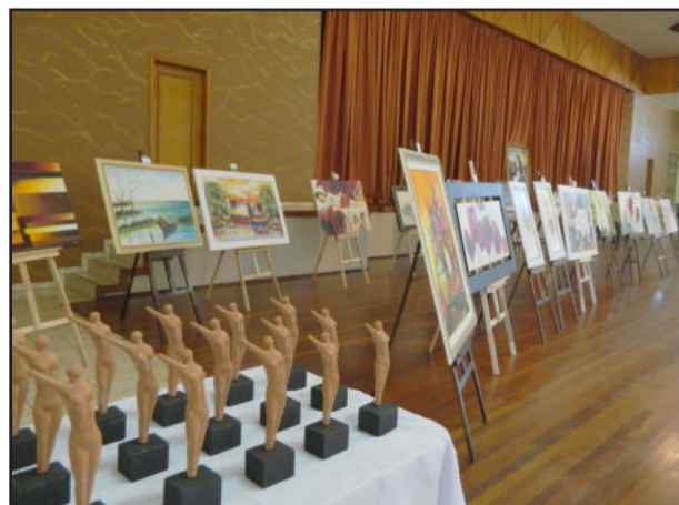
Obras de artistas locais puderam ser apreciadas na 2ª Mostra de Artes Visuais