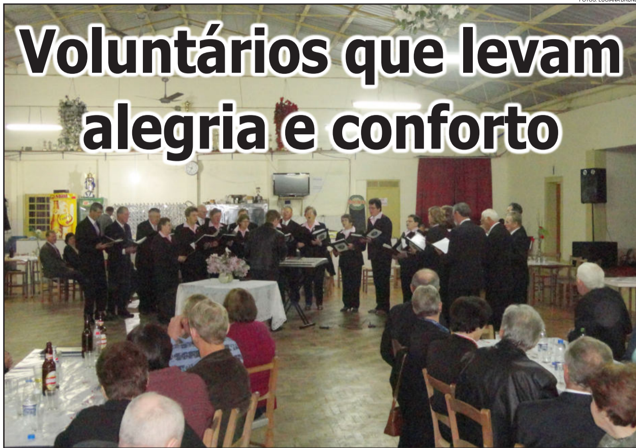
Coral Misto 7 de Setembro, de Linha Ano Bom - Colinas, comemorou no sábado, dia 25, seus 108 anos de atividades

Há 108 anos, incansavelmente, um grupo de voluntários se reúne na Linha Ano Bom, Colinas. Mudaram-se as cartas do baralho, mas o trabalho segue com o mesmo objetivo e prazer. Além de ser uma opção de lazer, o prazer de servir aos outros está no coração de cada participante. Nos momentos felizes, lá estão eles, dedicados, levando sua mensagem de alegria em encontros, festas e bailes. Quando o momento é de dor e perda, lá também estão, sempre, para prestar seu conforto com uma mensagem de fé.