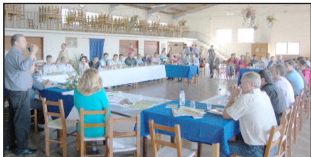
Reunião da Avat na PaveramaFest