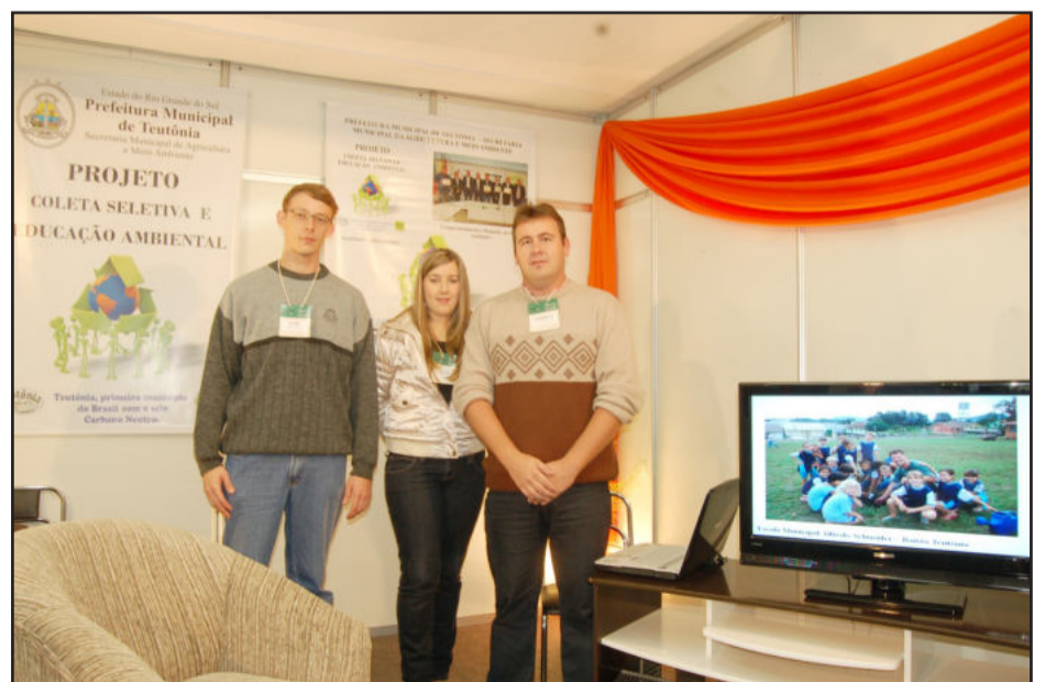
Equipes de Meio Ambiente e da Certel divulgam ações