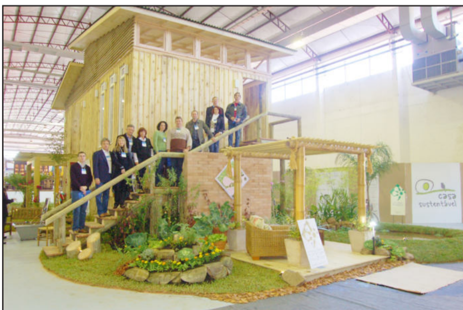
Casa Sustentável é uma das atrações do evento