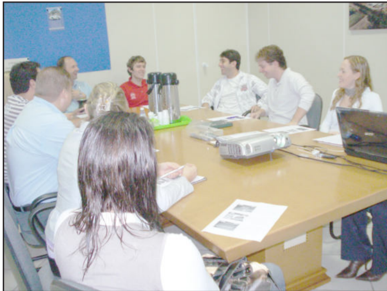
Primeira reunião da nova Diretoria de Comércio

Outro assunto que esteve em pauta foi o projeto Diretor Participante, o qual prevê a participação de diretores da CIC em treinamentos e cursos promovidos pela entidade. Além