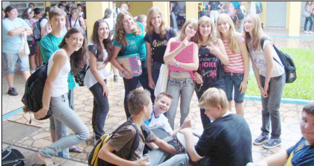
Alunos têm convívio sadio no Ieceg

Na permanente atenção em também trabalhar o cotidiano em pauta na imprensa e do convívio dos jovens estudantes, o Instituto de Educação Cenequista General Canabarro (Ieceg) estará realizando, ao longo do mês de maio, em todas as turmas da Educação Básica, o projeto “Bullyng não é brincadeira”. As atividades serão desenvolvidas sob diferentes enfoques e através de diversas metodologias, de acordo com a faixa etária de cada turma. O marco inicial será a palestra desta quinta-feira, dia 29 de abril, no pavilhão da Comunidade Evangélica Redentor, com a psiquiatra Micheli Valent Czekster, destinada aos pais e professores do Ieceg, pilares importantes no combate e prevenção às práticas de bullying.