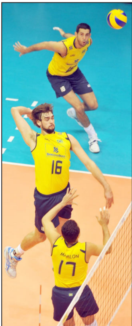
Lucão (c) foi campeão da Liga Mundial 2010

Principais títulos: Bicampeão da Liga Mundial de Vôlei, Tricampeão da Superliga Nacional de Vôlei pelo Cimed