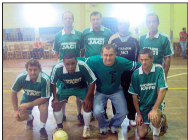
São Jacó levou o título no Máster

Jogos de Volta das finais (07/08) - Em Linha Geraldo, Geraldo x Novo Paraíso (3º lugar); Em Linha Lenz, Lenz "A" x Arroio do Ouro (final).