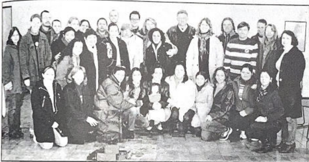
Capacitação preparou visitadores e monitores para o trabalho

N a manhã desta terça-feira, dia 27, encerrou a capacitação de 60 horas para os candidatos aprovados no concurso público de Teutônia para os cargos de visitador e monitor do programa Primeira Infância Melhor (PIM). Tendo por local o auditório do Sinodo Vale do Taquari, os participantes apresentaram trabalhos desenvolvidos a partir dos conhecimentos aprendidos e estão prontos para retomar o programa no Município.