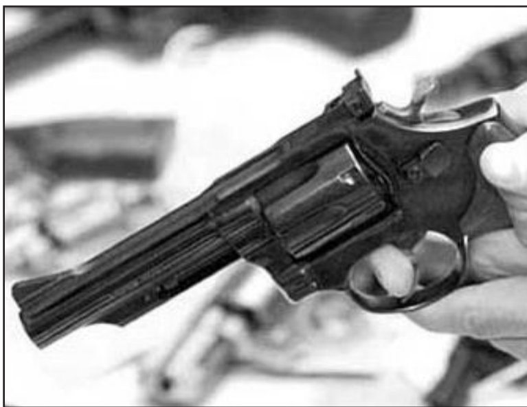
Família ficou sob a mira de armas

Na fuga, os assaltantes colocaram tudo em outra caminhonete, pertencente à vítima. O veículo foi localizada em São Sebastião de Castro, em um barranco da estrada, na manhã de terça-feira, dia 27.