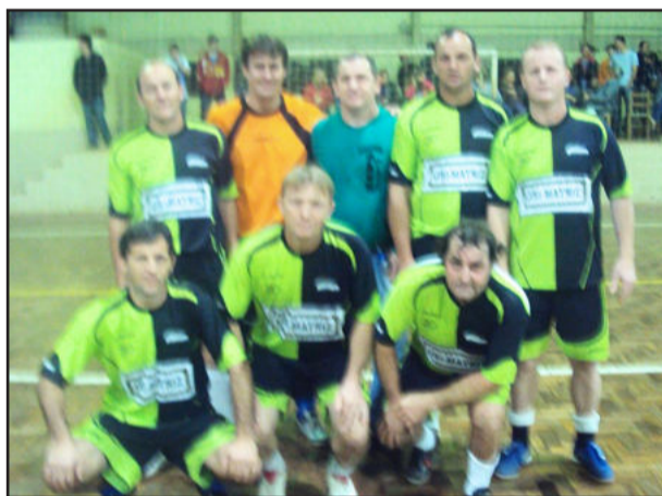
São Jacó também faturou o Sênior