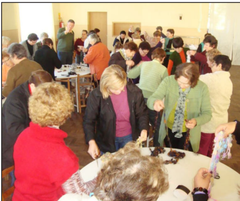
Várias são as atividades propostas durante os encontros

A Secretaria de Cultura convida os presidentes, secretários e tesoureiros dos 15 grupos da Melhor Idade do Município para uma importante reunião. Será na próxima terça-feira, dia 3 de agosto, às 9h, junto ao Sínodo Vale do Taquari, no Bairro Centro Administrativo. É de suma importância a presença de todos. Mais esclarecimentos podem ser obtidos junto à Secretaria de Cultura pelo telefone (51) 3762-1263.