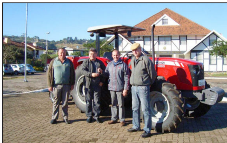
Prefeito, vice e secretários com o novo trator