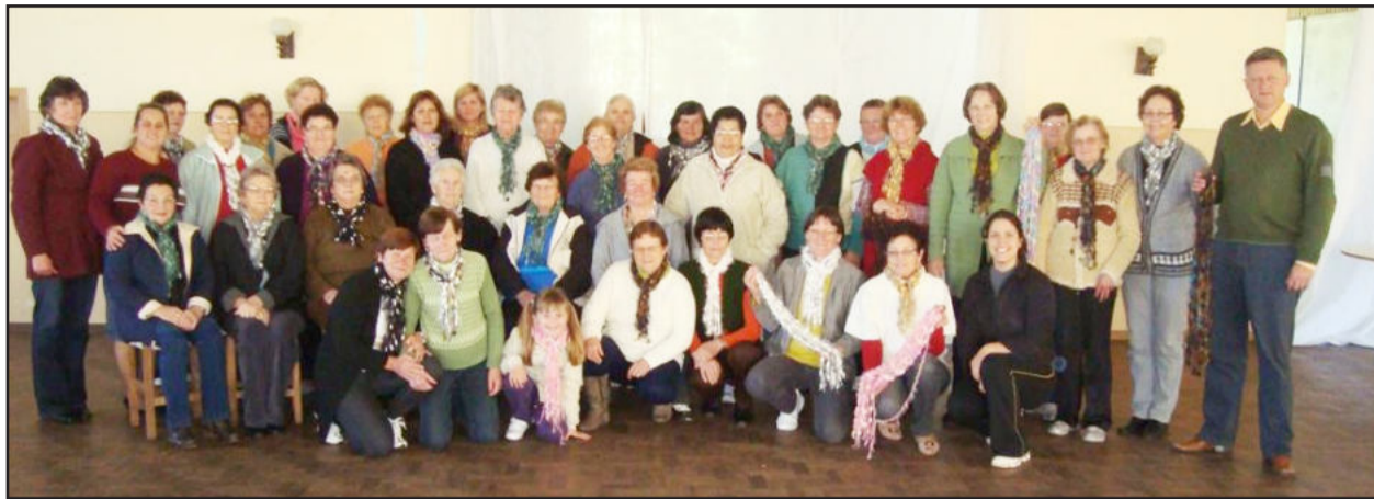
Atividades nesta segunda-feira aconteceram no Grupo Bem Me Quer do Bairro Teutônia

A administração municipal traz outra inovação para a comunidade teutoniense, através de uma parceria entre o Centro de Referência de Assistência Social (CRAS) e o Departamento da Terceira Idade. Ambos iniciaram uma parceria com atividades junto aos grupos da Melhor Idade do Município para realizar oficinas itinerantes.