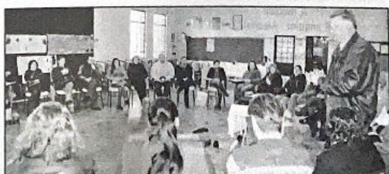
Magedanz (d) salienta importância desses profissionais