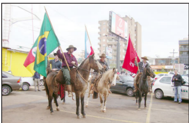
Cavaleiros conduziram as bandeiras até a empresa