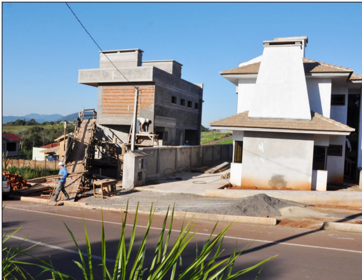
Lajeado já teve 619 projetos de novas obras particulares aprovados em 2010

A inobservância da norma vigente para construção da calçada de passeio junto às novas obras, o que impede a liberação do Habite-se, é outro fato comum registrado pela equipe da secretaria. “Desde o 2009, a Seplan tem exigido o projeto das calçadas acompanhando os projetos arquitetônicos das novas construções e temos notado que na execução das calçadas os executores da obra - sejam empresários, empreiteiros ou pe-