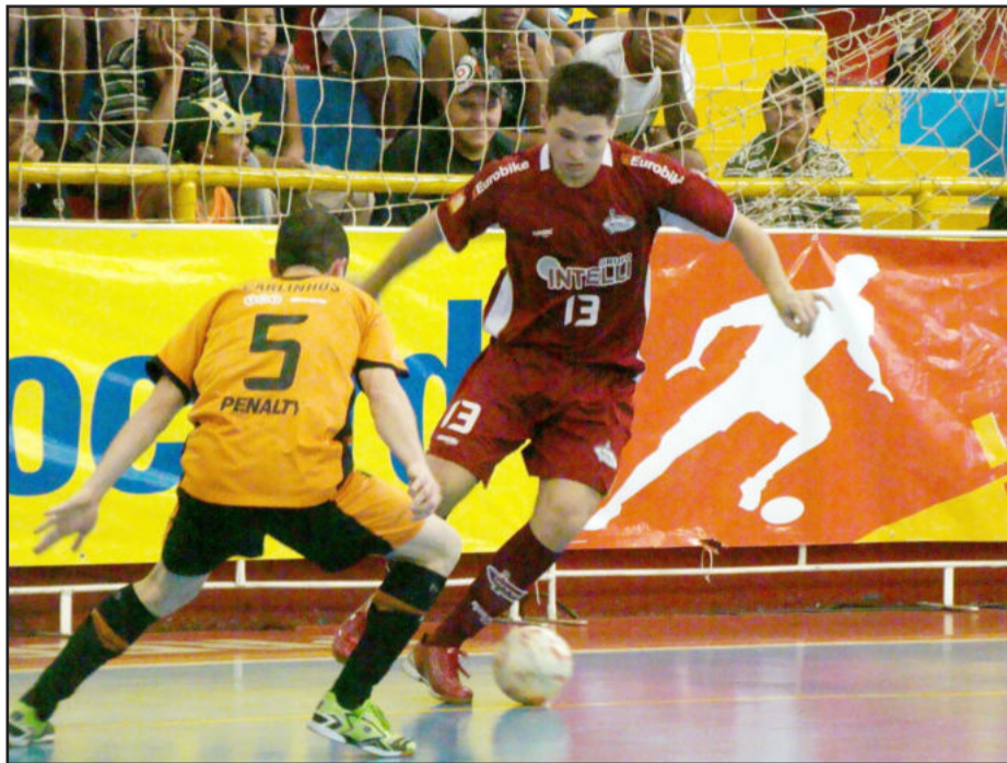
Depois de perder para a Intelli (foto) no sábado, ACBF se recuperou com vitória sobre o Minas

Com o resultado, a laranja mecânica está na oitava colocação na tabela de classificação. Foram 32 pontos marcados em 18 jogos, com uma campanha de nove vitórias,