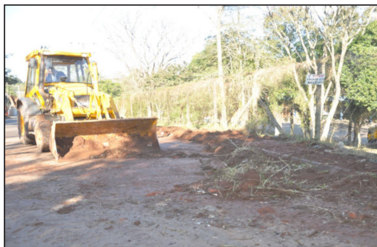
Apesar da proibição, lixo é jogado na rua