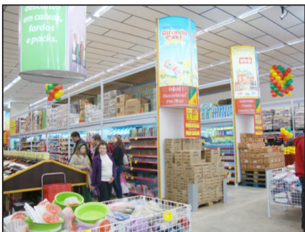
Prédio moderno oferece espaço para toda infra-estrutura