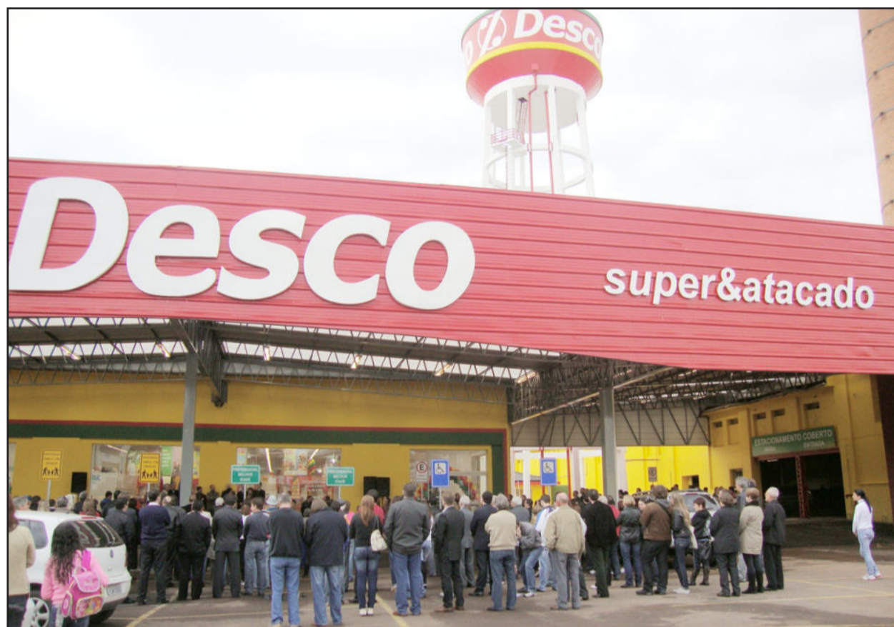
Empresa tem sede na Avenida Senador Alberto Pasqualini, na entrada de Lajeado

A Rede Imecc inaugurou, ontem, quarta-feira, o Desco Super & Atacado, na cidade de Lajeado. Às 9 horas ocorreu um cerimonial de inauguração, ocasião em que o novo projeto foi apresentado à comunidade regional. Cavaleiros conduziram as bandeiras oficiais até o local da cerimônia, em frente ao prédio inaugurado, fazendo alusão ao tradicionalismo do povo gaúcho. As cores usadas no layout da empresa também homenageiam o Estado, com o uso do amarelo, verde e vermelho da bandeira.