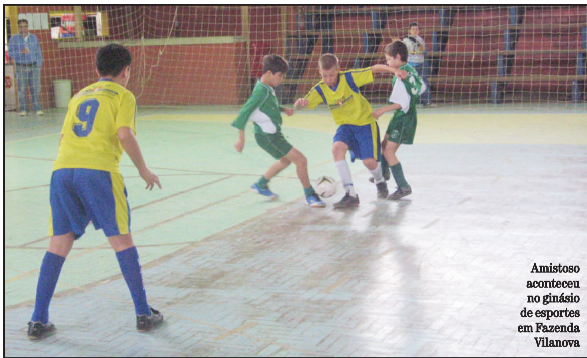
Amistoso aconteceu no ginásio de esportes em Fazenda Vilanova

Depois dos treinamentos do primeiro semestre, visando melhorar fatores técnicos, táticos e disciplinares, a Escolinha de Futsal do Projeto Esporte em Ação de Fazenda Vilanova iniciou o segundo semestre de 2010 com força total. Tendo como objetivo trabalhar mais o senso de competitividade de forma educativa, os alunos das 9 categorias participarão de diversos encontros amistosos e competições em toda região.