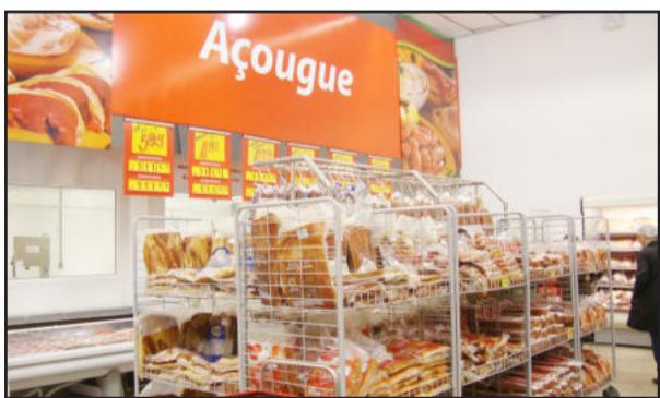
Setores específicos e bem organizados