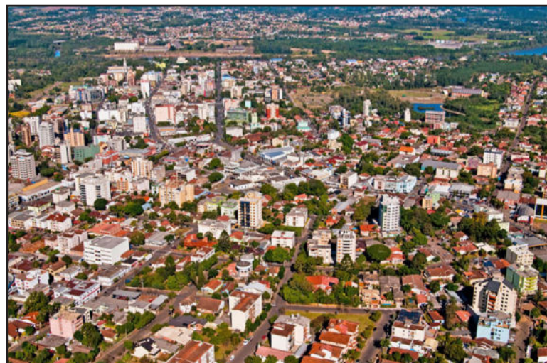
Lajeado é a maior cidade do Vale do Taquari

uma consulta na Seplan para ver a viabilidade do tipo de construção ou empreendimento que a pessoa deseja fazer no local. “Também é bastante comum o caso de pessoas só descobrem que o imóvel pretendido não possui Habite-se quando na agência bancária buscam por financiamento - que neste caso isto não é concedido, gerando situações constrangedoras que poderiam ser evitadas se antes a pessoa tivesse consultado a Seplan acerca da situação do imóvel pretendido”, alerta Fluck.