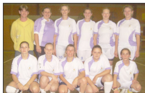
Morro da Alemoa joga semifinal

No Feminino, a Frutas Marmentini já está na decisão e aguarda o seu adversário, que sairá do jogo semifinal entre Academia Mega Sports e Morro da Alemoa, amanhã à noite. Após as três partidas estarão definidas todas as finais da competição regional de futsal, que projeta as finais para o dia 06 de agosto.