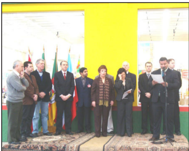
Cerimonial de inauguração ocorreu defronte ao prédio