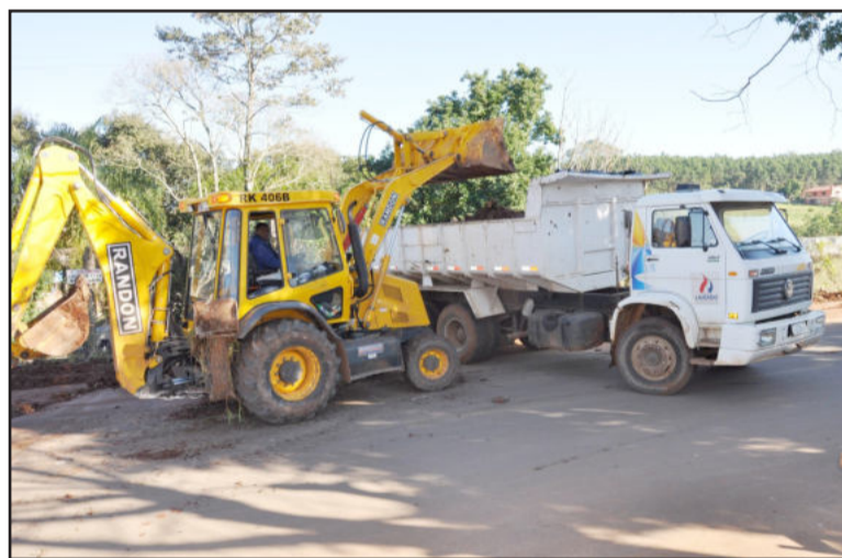
Máquina carregou 10 caminhões com lixo