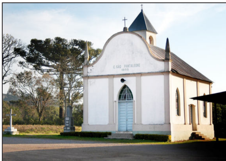
Igreja de São Pantaleão data de 1899

Tombada pelo Município no ano de 2007, a Capela de São Pantaleão destaca-se pela construção e também pelas imagens, sendo utilizada ainda hoje pela comunidade para as celebrações religiosas. A mobilização pela restauração está sendo feita numa parce-