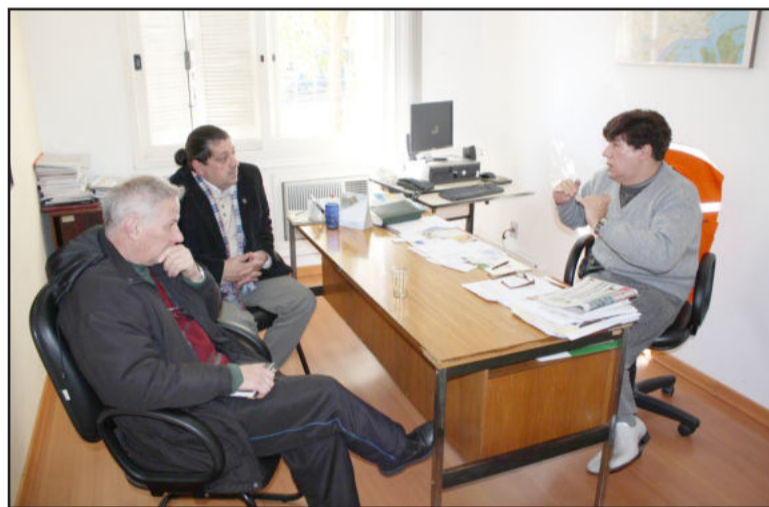
Brugalli e Gusso com Pinheiro (d)

Garibaldi deverá implantar em breve uma estação meteorológica. Por isso, dúvidas como o monitoramento da estação, a transmissão de dados on line e o alerta sobre possíveis mudanças climatológicas foram discutidas no encontro.