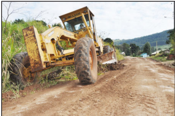
Valetas foram reabertas pela equipe da Sosur

Ainda nesta semana, conforme Lopes, a Avenida Benjamin Constant, na extensão do Bairro Montanha até a divisa com o Município de Santa Clara do Sul, deverá receber as melhorias. Para a próxima semana, estima que os serviços serão feitos na Rua 1º de Maio, em São Bento, e, segundo o cronograma, os próximos bairros a terem suas estradas recuperadas serão Universitário, Campestre e Olarias.