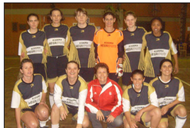
Mega Sports também busca vaga na final