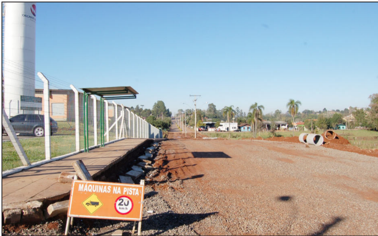
Preparação da cancha para pavimentação de frente a calçados Beira Rio

A empresa Conpasul, contratada pela administração municipal de Teutônia, iniciou há alguns dias a preparação da cancha para pavimentar mais uma rua no Município. A empresa venceu a licitação para asfaltar os 1.731 metros quadrados da Avenida Otterno Schaeffer, no Bairro Canabarro, na quadra entre as ruas Salgado Filho e Arnaldo Krug, defronte à indústria de calçados Beira Rio.