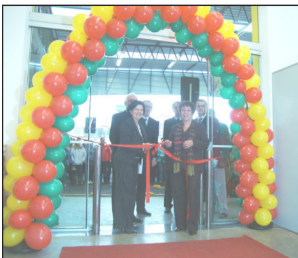
Autoridades e diretores na abertura das portas ao público