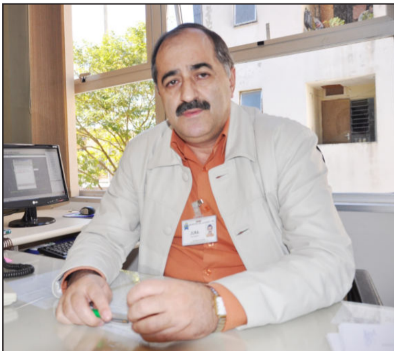
Rodrigues afirma que Prefeitura sempre valoriza sugestões