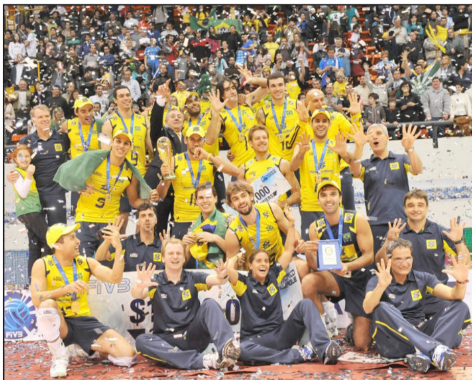
Brasil nove vezes campeão da Liga Mundial de Vôlei Masculino

Sobre a final de domingo, “a gente já estava esperando o tie-break, porém conseguimos bloquear algumas bolas