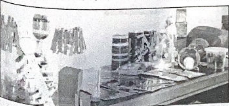
Durante a capacitação, os participantes fizeram brinquedos lúdicos reaproveitando materiais

Durante a capacitação, um dos pontos-chaves foi estimular a criatividade e ensinar mecanismos para repassar conhecimentos às famílias. Destaque para o reaproveitamento de materiais descartáveis para a fabricação de brinquedos lúdicos, que servem para estimular as crianças conforme a faixa etária. Caixas, garrafas pet, tampas, papelão e latas são transformados em ferramentas de diversão e ensinamento, com a ajuda de tinta, fios, grampos, papéis coloridos, grãos e bolinhas de gude é fácil criar brinquedos simples, baratos e super instrutivos.