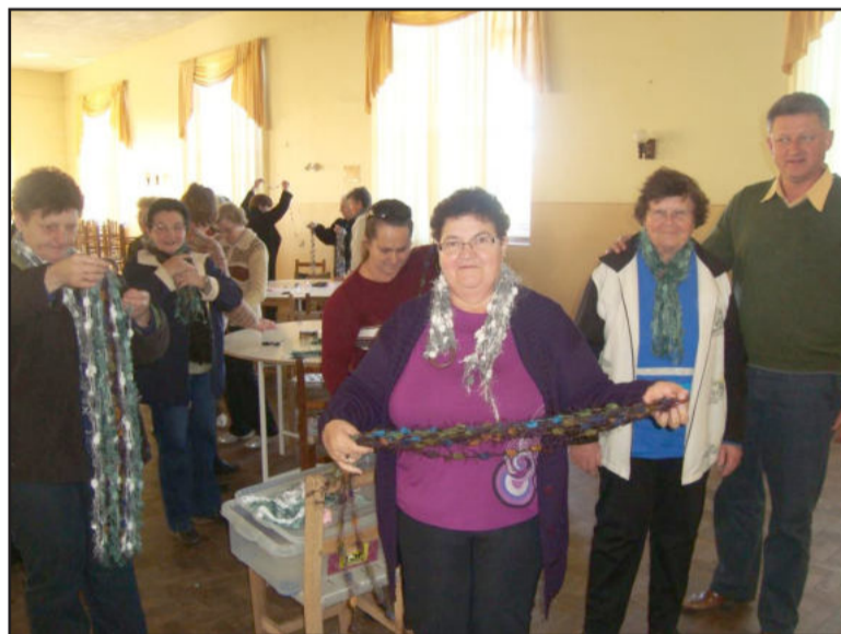
Atividades continuam sendo bem aceitas pelos grupos visitados