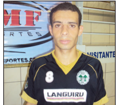
Capitão Peixe também marcou duas vezes