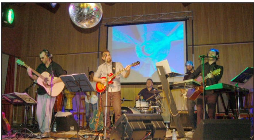
Banda local que animou o evento