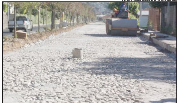
Obra Buarque Alfândega