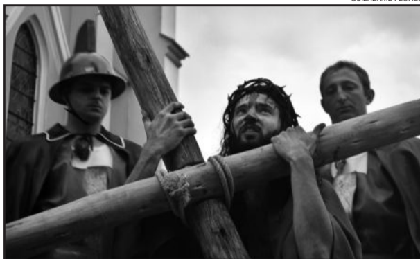
Encenações de Páscoa em Garibaldi em 2011