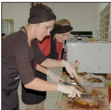
Dedicação no preparo dos pratos