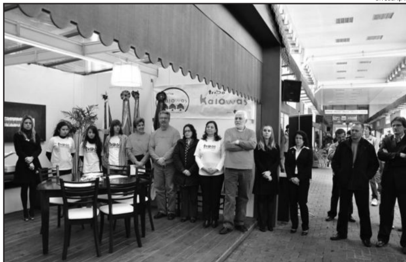
Instalação da Parceiros Voluntários em Carlos Barbosa aconteceu na Feira de Compras da ACI em 2011

Partindo da crença de que toda pessoa é solidária e um voluntário em potencial, a Parceiros Voluntários está presente no Rio Grande do Sul, multiplicando, através de milhares de voluntários, seus conceitos e seus conhecimentos em benefício das comunidades onde atua.