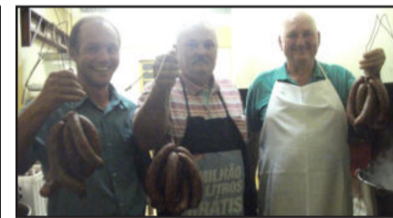
Linguíça, o prato principal do cardápio