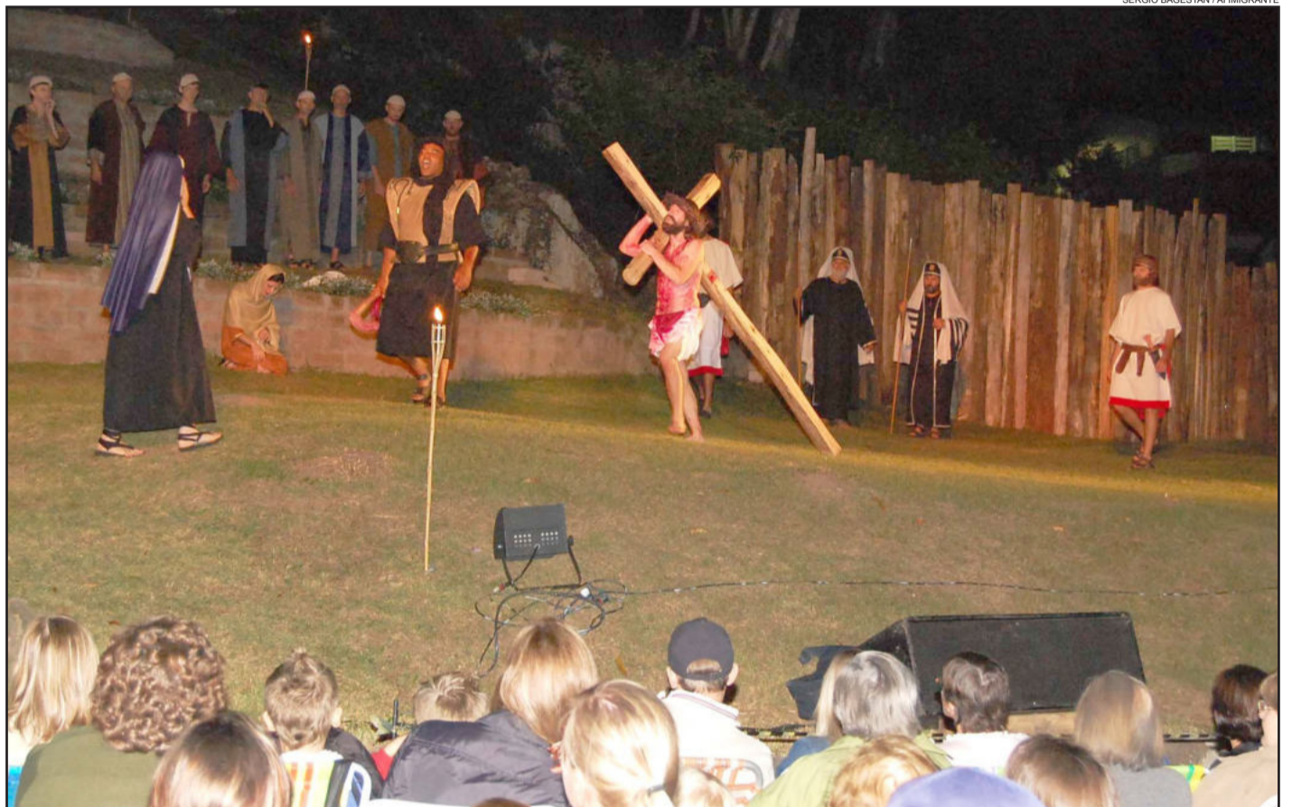
Paixão de Cristo foi encenada em Daltro Filho - Imigrante no sábado, dia 31 de março, e reuniu grande número de pessoas. Página 10