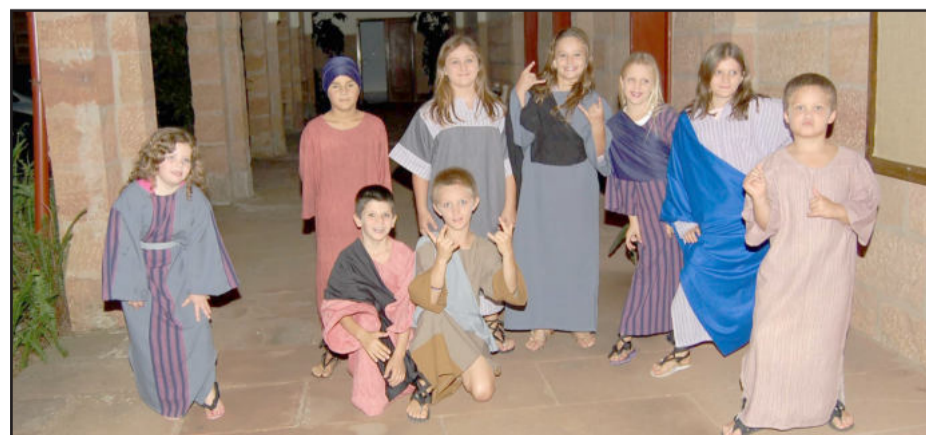
Jovens, figurantes e futuros atores