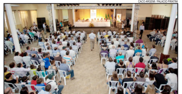
Encontros para o Desenvolvimento foi no Clube Alvi Negro