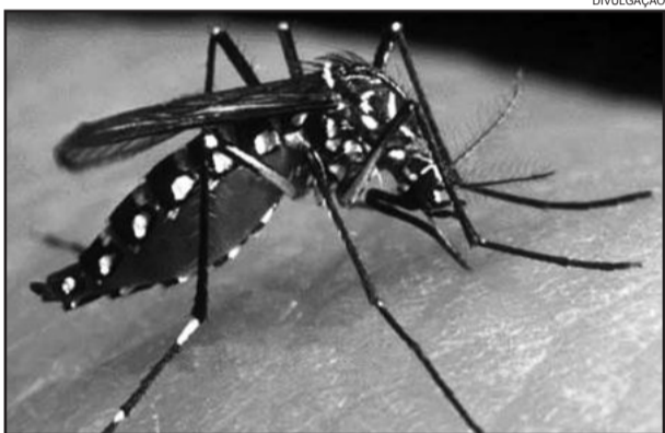
Chegou a vez de Carlos Barbosa ficar em alerta sobre foco de aedes aegypti

Atualmente, a equipe vistoria periodicamente 42 armadilhas espalhadas pelo município, além de promover ações específicas no Combate a Dengue. Carlos Barbosa é o único município do seu entorno que ainda não havia apresentado focos do mosquito. Mesmo com focos encontrados em todos os municípios, até o momento não foi registrado na região nenhum caso da doença.