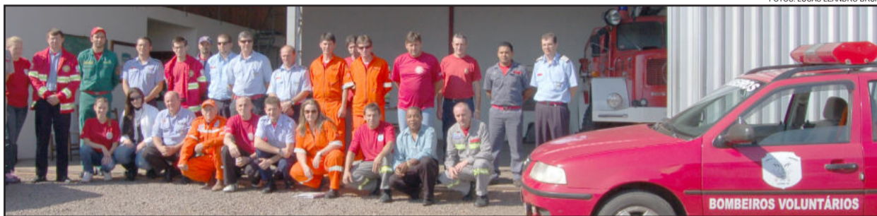
Bombeiros voluntários de 34 cidades se reuniram em Teutônia

A Associação dos Bombeiros Voluntários do Rio Grande do Sul (Voluntersul) realizou no sábado pela manhã, dia 31 de março, seu encontro trimestral em Teutônia. Os grupos foram recepcionados na sede dos Bombeiros de Teutônia, com café da manhã e, após, no auditório da CIC, realizaram assembleia interna.