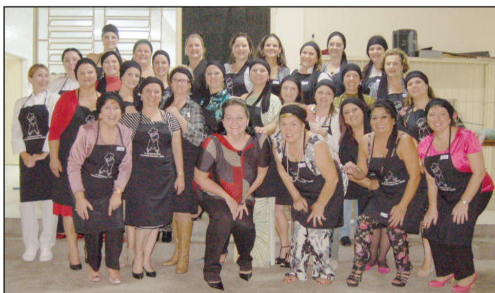
As chefs que prepararam os pratos especiais