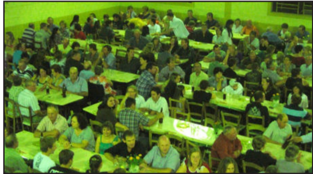
Cerca de 350 pessoas participaram do evento deste ano