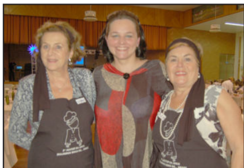
Líderes da Arca