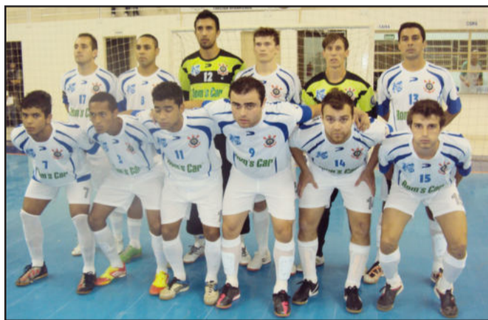
Corinthians de Alvorada