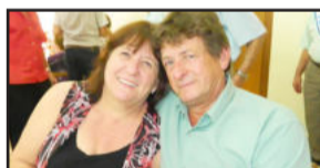
Helena, de Teutônia e Acenio, de Colinas, aprovaram o baile