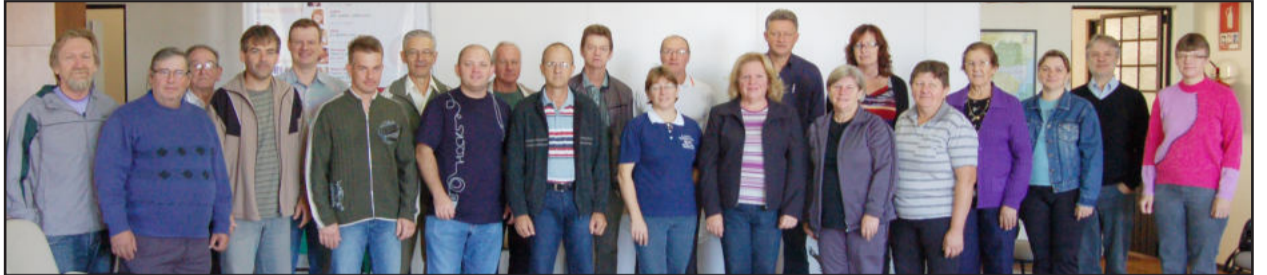
Curso terá primeiro módulo iniciando dia 16 de abril

O Sínodo Vale do Taquari, a Liga de Cantores do Alto Taquari e a Administração Municipal de Teutônia, através da Secretaria de Cultura e Turismo, em parceria com o Instituto Federal de Educação, Ciência e Tecnologia do RS, promoverão Curso de Estudos Musicais. O primeiro módulo terá início no próximo dia 16 de abril, com aulas nas segundas e quartas-feiras, das 9 às 11h30min da manhã. A programação é destinada para regentes, coristas e interessados em aperfeiçoar o seu conhecimento sobre canto coral e música.