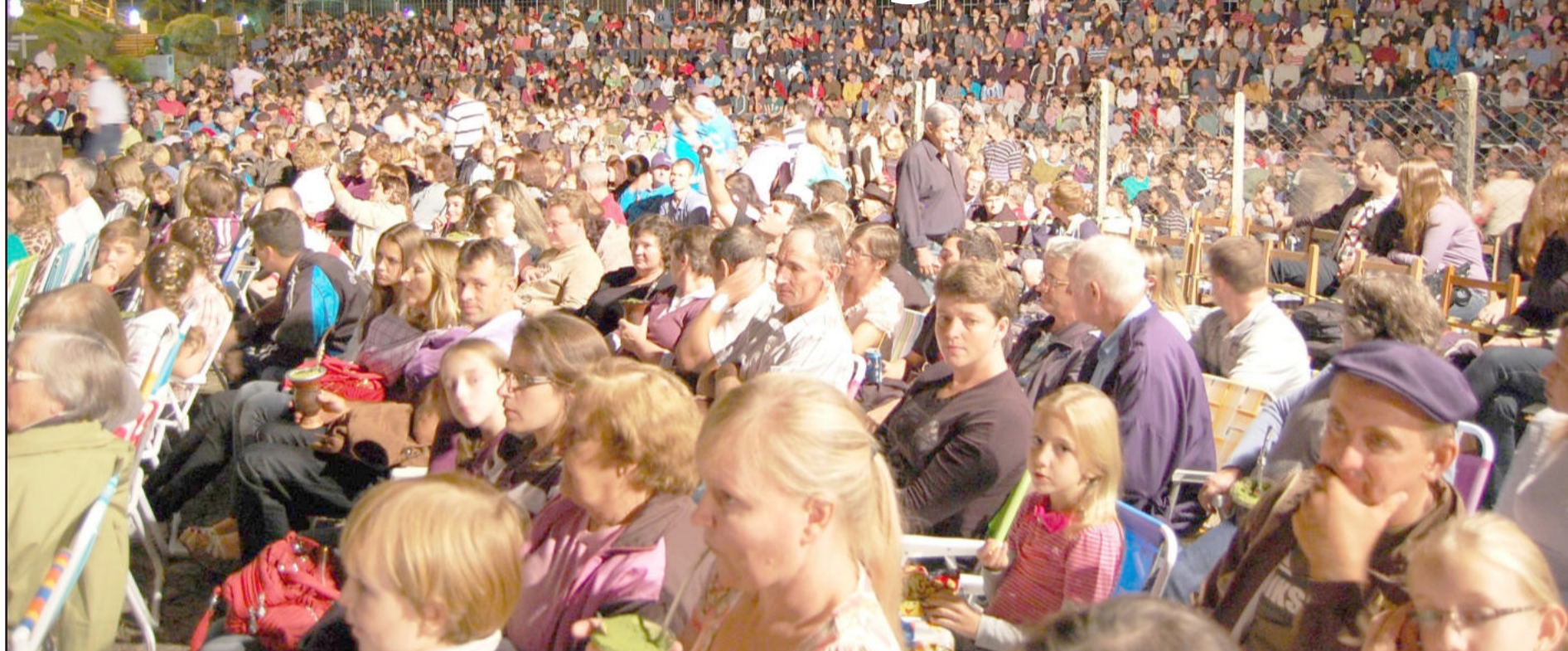
Público: ocupou espaços e lotou arquibancadas

C onsagrado como um dos maiores eventos ao ar livre, a sétima edição da Paixão de Cristo, realizada no sábado pela noite, dia 31 março, em Imigrante, foi assistida por um público estimado em mais de cinco mil pessoas. A beleza e a grandiosidade do espetáculo, realizado em frente ao Convento Franciscano São Boaventura (Seminário), no Bairro Daltro Filho, atraiu numerosa plateia, oriunda de diversas cidades da região e do estado. A peça impressionou e emocionou os espectadores. A Paixão de Cristo é uma das mais importantes datas do cristianismo, tornando-se o ponto alto da Semana Santa junto com a Páscoa.