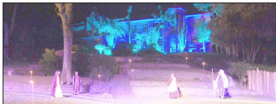
Espectáculo: grandioso, com atores locais e um cenário especial