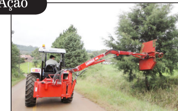
Trator com roçadeira hidráulica em operação