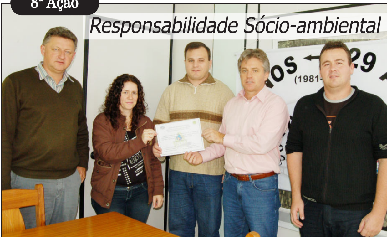
Filial 07 da Picadilly é a primeira empresa a receber a certificação municipal

Aoitava ação do programa Teutônia 29 Anos, 29 Ações foi desencadeada no fim da manhã desta quinta-feira, dia 1º de julho, quando a Administração Municipal entregou o Certificado de Responsabilidade Sócio-Ambiental para a primeira empresa. O prêmio inédito em Teutônia foi conferido à filial 07 da Picadilly, situada no Bairro Boa Vista, por sua ação complementar em prol do meio ambiente.