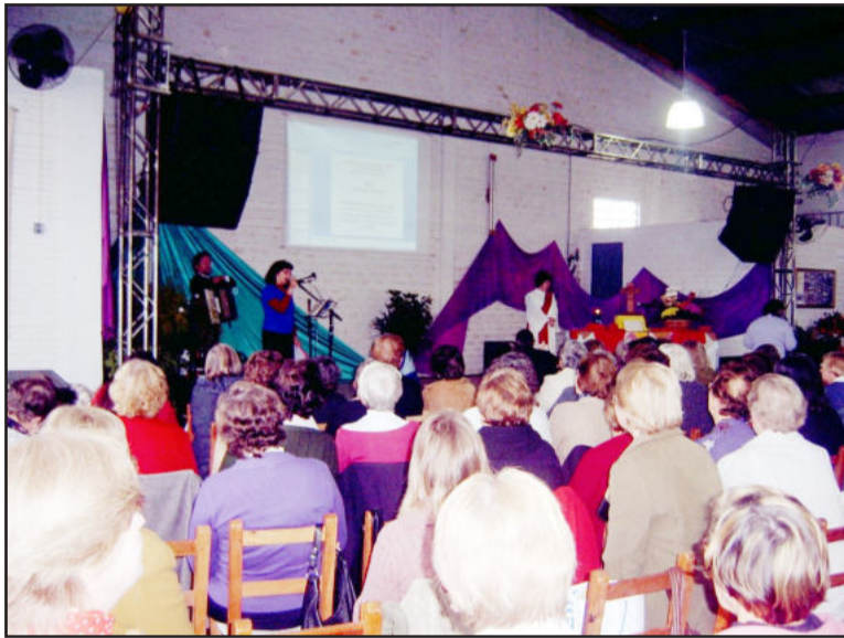
49 grupos de Oases participaram