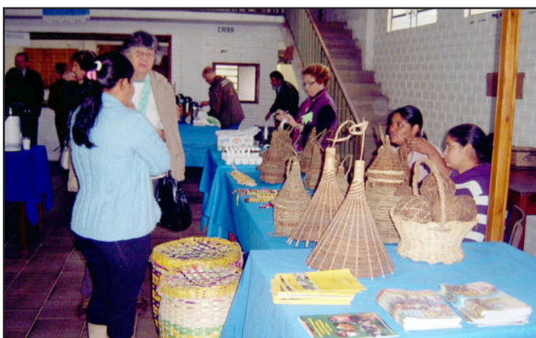
Feira de artesanato