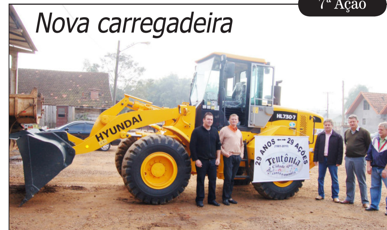
Administração Municipal recebeu nova carregadeira para o parque de máquinas

Na manhã desta quinta-feira, dia 01 de julho, a Administração Municipal de Teutônia realizou a sexta ação do programa Teutônia 29 Anos, 29 Ações, ao receber uma nova carregadeira para continuar com o projeto de renovação dos equipamentos do Município. A máquina é da marca Hyundai, tem cabine fechada com ar con-