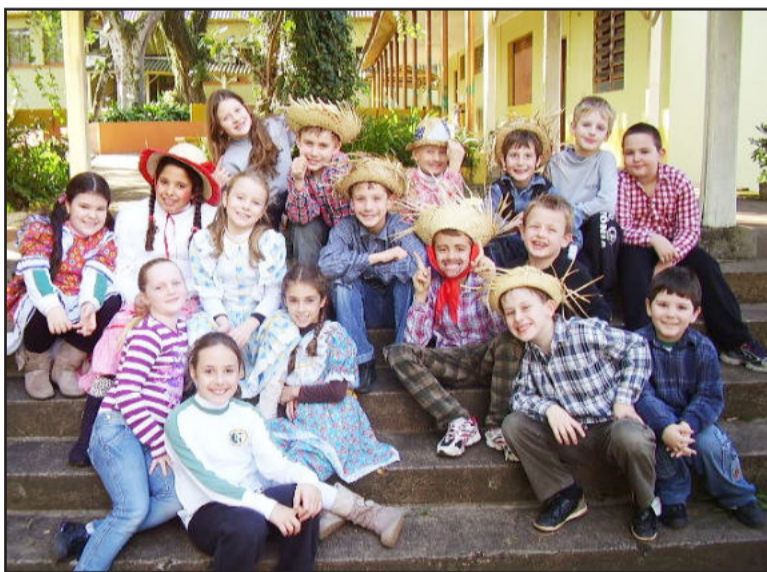
Maioria dos alunos prestigiou programação junina tipicamente trajada

“Observamos em todos esses momentos o quanto as crianças curtem e gostam destas datas comemorativas. A grande maioria veio vestida de caipira e participou de tudo com muita alegria, disposição e animação”, destacam as professoras.