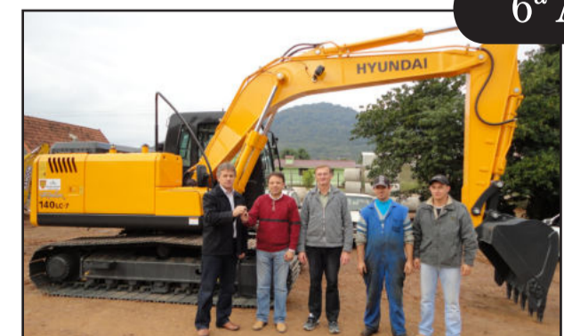
Nova escavadeira hidráulica