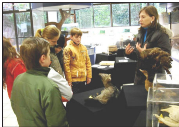
Alunos do Navegar na Univates