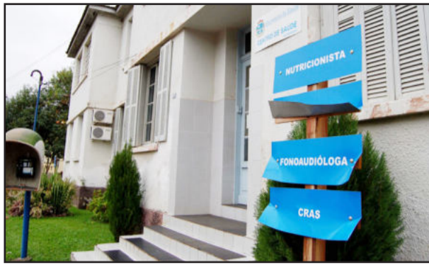
Placas em frente ao Centro de Saúde foram depredadas