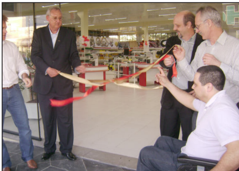
Abertura da fita inaugural

Para o presidente, o momento é importante porque a inauguração do Agrocenter Languiru amplia a linha de produtos da área de ferragens, ferramentas e máquinas da cooperativa. "Somos a terceira maior cooperativa agropecuária do Rio Grande do Sul e estamos crescendo com resultado. Isso queremos dividir com o produtor associado", alegrou-se. Bayer disse que o Agrocenter