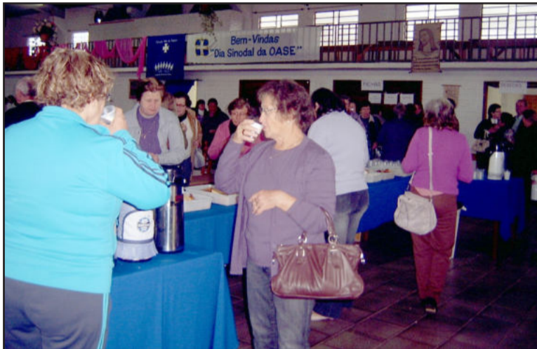
Café da manhã na recepção aos grupos