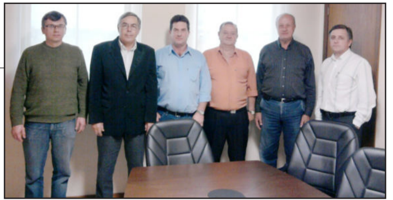
Prefeito, vereador e engenheiros visitaram diretores da Coesul em Porto Alegre