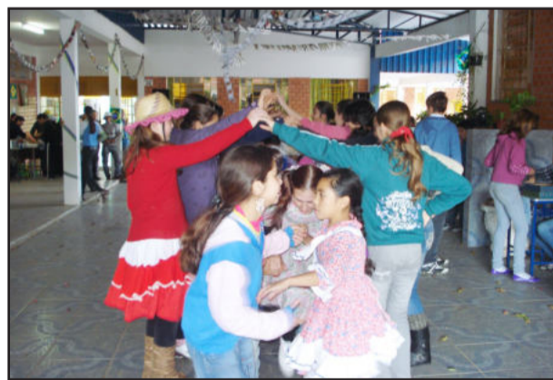
Festa teve danças dos alunos