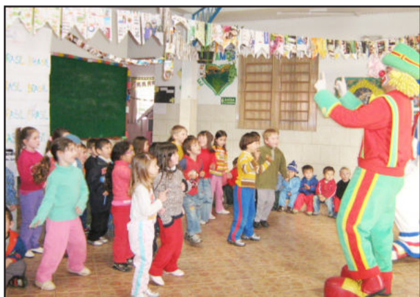
Palhaços animaram as crianças