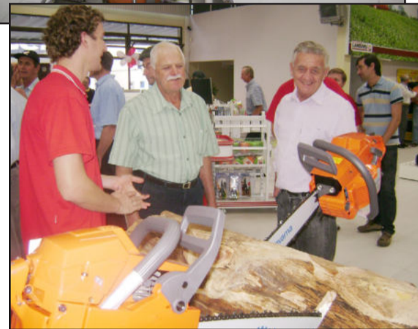
Produtores conferindo produtos da loja

seu trabalho. A Sicredi está à disposição para financiar esses implementos e equipamentos", declarou.