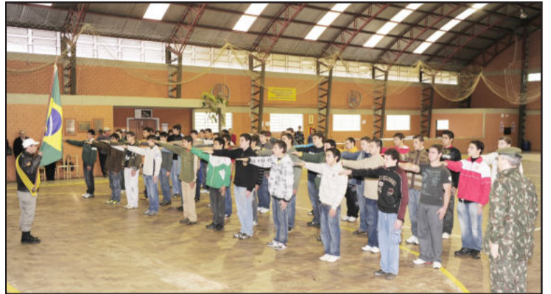
Compromisso foi prestado por 46 jovens