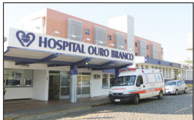
Hospital Ouro Branco