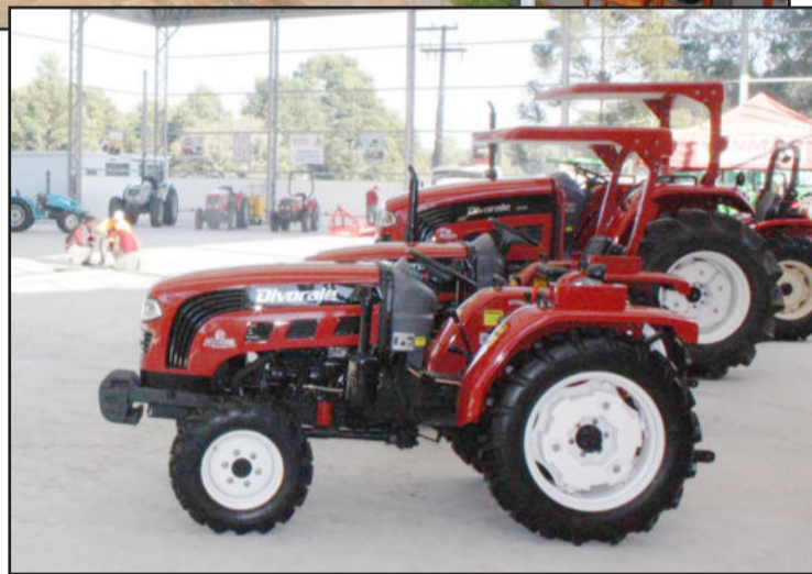
Mostra de equipamentos e máquinas agrícolas