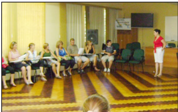
Encontros no Colégio Teutônia

O Colégio Teutônia busca, constantemente, o aprimoramento do seu quadro docente com o intuito de qualificar cada vez mais seu fazer pedagógico. Em função disso, ao longo do primeiro semestre deste ano, os professores do educandário participaram de formação continuada com o objetivo de proporcionar reflexões sobre a pessoa do docente como profissional da educação e o aluno como um ser bio-psico-social.