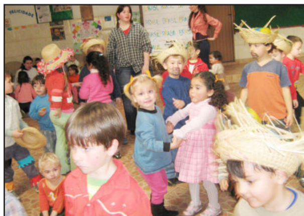
O clima de São João tomou conta