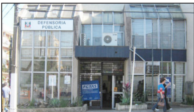
Prédio da Defensoria esta localizado na esquina da Rua Júlio de Castilhos com a Rua Júlio May

A Defensoria Pública tem como finalidade prestar assistência e orientação jurídica integral a gratuita para pessoas que comprovarem insuficiência de recursos financeiros. A Defensoria Pública Estadual atende a todas áreas afetas à Justiça Estadual, ou seja, cível, família, crime, infância e juventude, violência doméstica, juizado especial, defendendo os interesses dos menores, idosos e consumidores, e execução criminal, com atendimento aos detentos no Presídio Estadual de Lajeado. Para buscar atendimento da Defensoria Pública a pessoa tem que comprovar a sua hipossuficiência econômica, ou seja, tem que ter renda familiar máxima de três salários-mínimos nacionais ou cinco salários-mínimos nacionais quando as ações envolvam o interesse de menores ou idosos. O Atendimento na Defensoria Pública se dá por prévio agendamento através do telefone (51) 3748-3107. O atendimento ao público é sempre pela manhã. Nas tardes, o expediente é interno. A Defensoria Pública está localizada na Rua Júlio de Castilhos, número 478, sobreloja, Bairro Centro, no prédio da antiga Caixa Econômica Estadual. A instituição atende todos os municípios que formam a Comarca de Lajeado (Lajeado, Cruzeiro do Sul, Santa Clara do Sul, Progresso, Marques de Souza e Canudos do Vale).