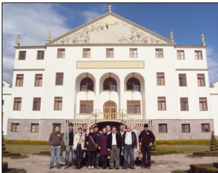
Visita ocorreu no final do mês de junho

No dia 24 de junho a Câmara de Indústria e Comércio (CIC) promoveu visita técnica à Vinícola Salton, na Serra gaúcha. A empresa possui 99 anos de história e é reconhecida como uma das principais vinícolas do país, líder na comercialização de espumantes há quatro anos consecutivos e com inovações constantes na sua linha de produtos. O evento contou com a participação de 12 pessoas, que acompanharam apresentação de case da empresa, visitaram o parque fabril, tiveram a oportunidade de degustar vinhos, sucos e espumantes e conheceram a loja de vinhos.