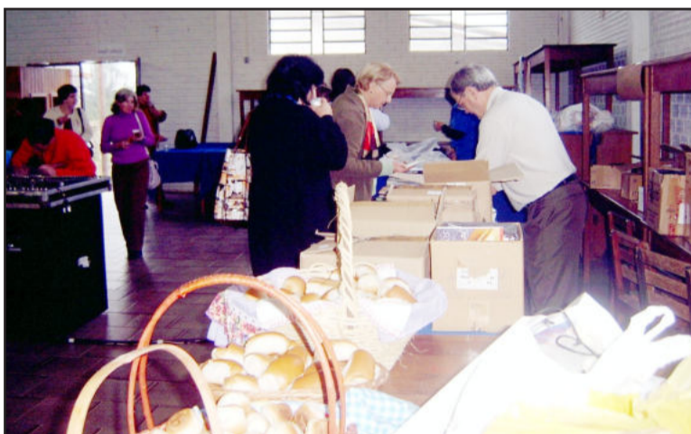
Venda de livros