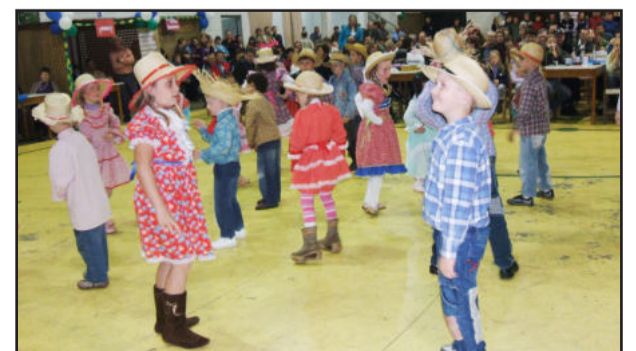
Festa teve muita animação