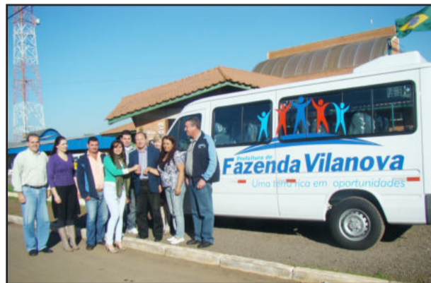
Entrega do novo veículo

Com objetivo de oferecer maior conforto e agilidade no transporte aos pacientes que são encaminhados ao atendimento médico em hospitais de Porto Alegre e outros centros especializados de saúde, a administração municipal adquiriu uma caminhonete Sprinter. O veículo, da montadora Mercedes Benz, possui capacidade para transportar 16 pessoas, está equipado com ar condicionado, direção hidráulica e outros acessórios, que oferecem maior comodidade aos usuários.