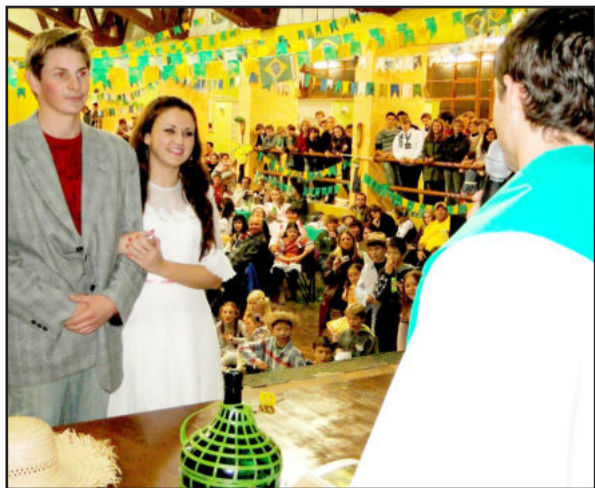
Casamento na roça marcou apresentação do terceiro ano do Ensino Médio