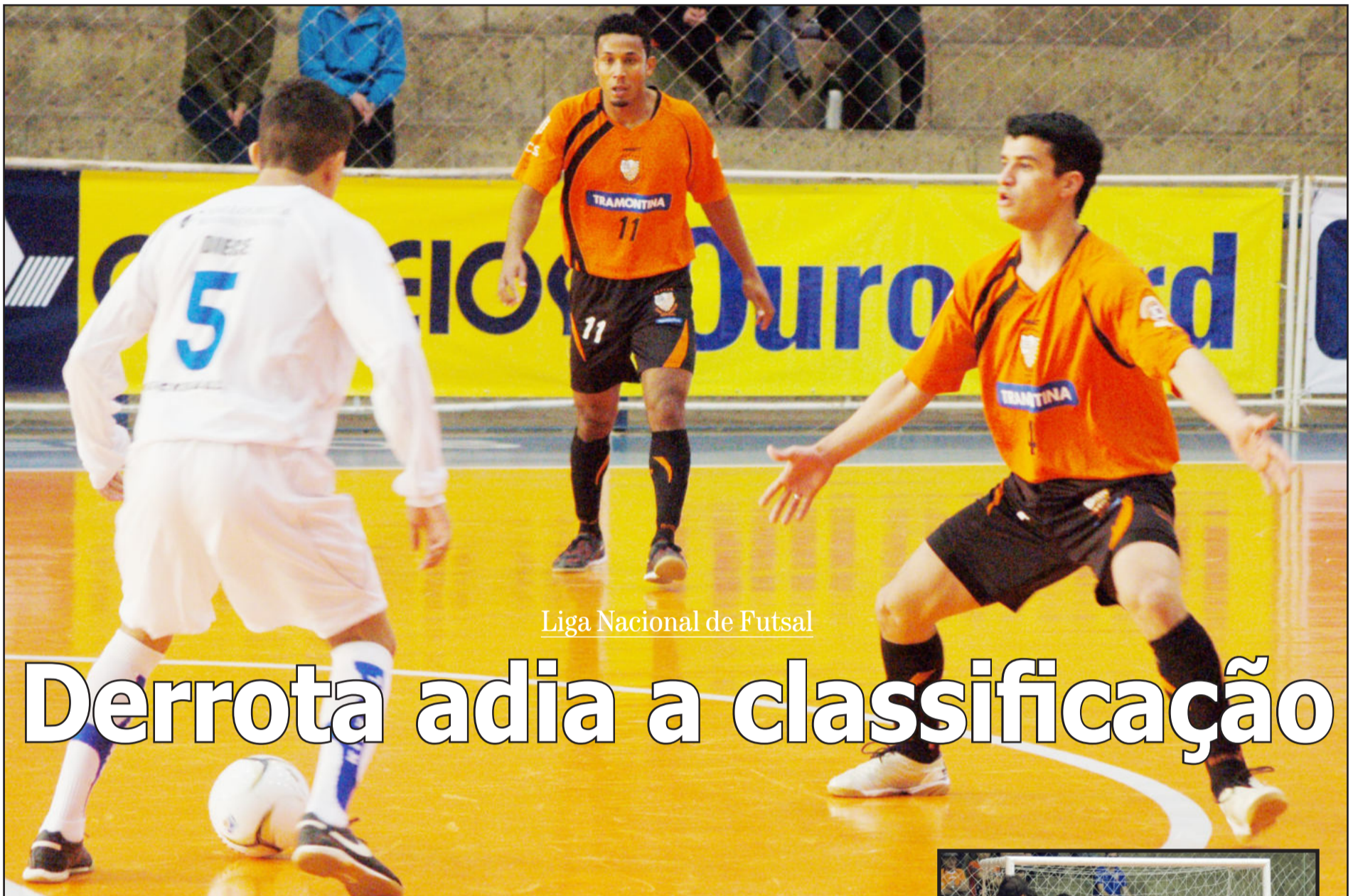
Liga Nacional de Futsal