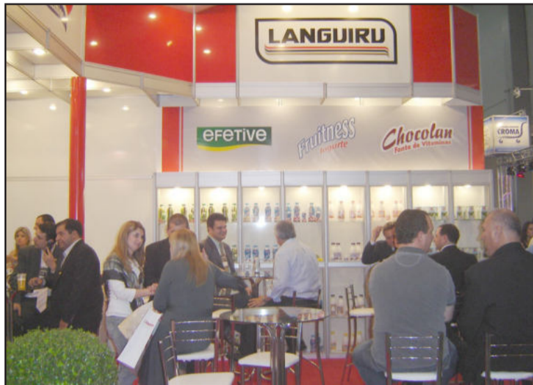
Visitação de clientes no estande da Languiru

Destacar os benefícios do leite UHT em sachet, foi outra estratégia da Languiru nesta feira, que é considerada a maior do gênero no Cone Sul. Lançado na Expoagas do ano passado em nível regional, em pouco tempo a demanda do produto se estendeu para a região metropolitana. Devido ao sucesso alcançado pelo leite UHT em sachet que até então só vinha na versão integral, em seguida foi lançada a versão desnatada. Com os investimentos que serão realizados na Indústria de Laticínios visando duplicar o envase do leite UHT em sachet, a Languiru já projeta a comercialização pa-