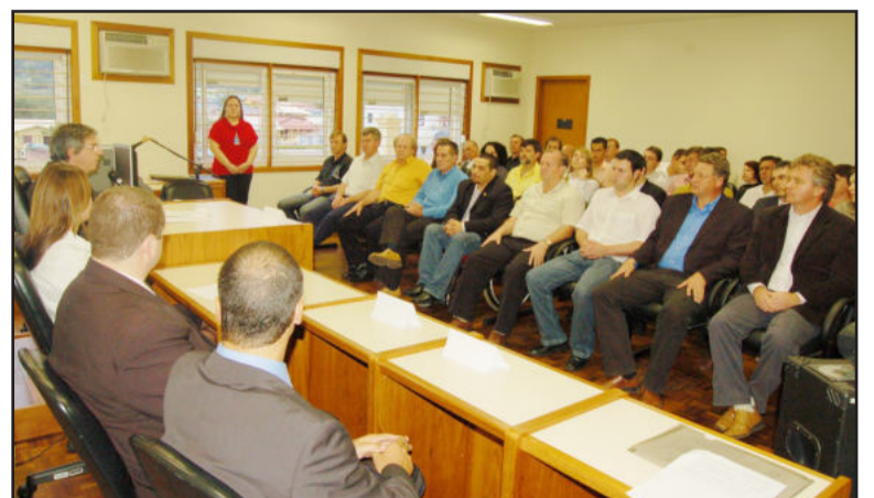
Inauguração foi no fim da tarde de terça-feira