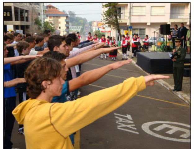
Jovens dispensados do Serviço Militar prestam juramento

Adiante à abertura da Semana da Pátria, ocorreu a cerimônia de Juramento à Bandeira, com a presença de 90 jovens, dispensados do Serviço Militar.