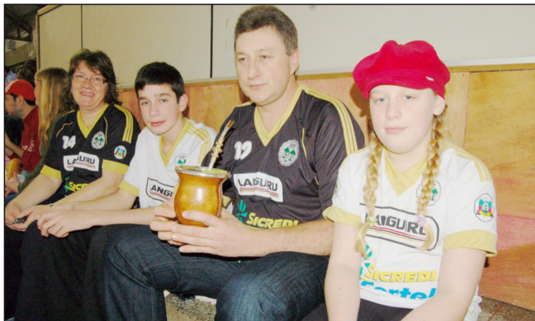
Família Bellinaso assiste a todos jogos da ASTF em casa e vem uniformizada com as cores da equipe

A diretoria da ASTF informa que o torcedor interessado em obter a camiseta ou a baby look oficial da equipe pode adquiri-la na Loja Bolamar, que fica na Rua 25 de Julho, no Bairro Languiru. No jogo diante de São Marcos, no início deste mês, a Bolamar esteve no ginásio fazendo a divulgação do produto.