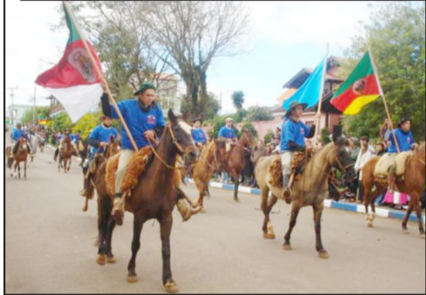
Desfile conta com diversas entidades

No Município de Paverama é tradicional a realização do desfile cívico de 7 de setembro, momento onde educação, cultura, tradição, esporte e lazer se integram através de suas entidades representativas pelas ruas da cidade. Reconhecido em toda a região, o desfile deste ano será mantido, tendo em vista que medidas preventivas contra a gripe A foram tomadas anteriormente e, também, por tratar-se de um evento a céu aberto.