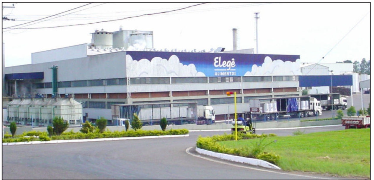
Empresas, com a Elegê, garantem bons índices para o Município

Em 2009, volume exportado foi muito superior ao do ano passado