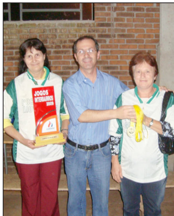
Kayser entregando os troféus ao 1º lugar ao time de Igrejinha

A Sejel lembra que nesta quinta-feira, dia 03, encerra o prazo das inscrições para as modalidades de Futsal Sub 16 (1994) e Futsal Veteranos (1974) dos Jogos Interbairros de Lajeado. As partidas estão marcadas para ocorrer nos dias 8 e 15 de setembro no Centro Esportivo Municipal Mário Lampert, no Bairro São Cristóvão, a partir das 19h15min. Já as inscrições das equipes para a modalidade Minifutebol Livre estarão abertas no período de 3 a 15 de setembro e também deverão ser efetuadas na sede da Sejel (Rua Bento Gonçalves, 524).