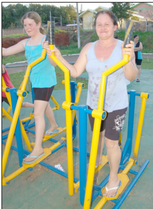
Eni (d) elogia o parque