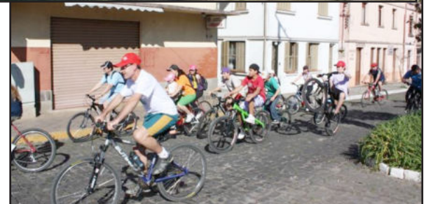
Passeio na cidade e interior