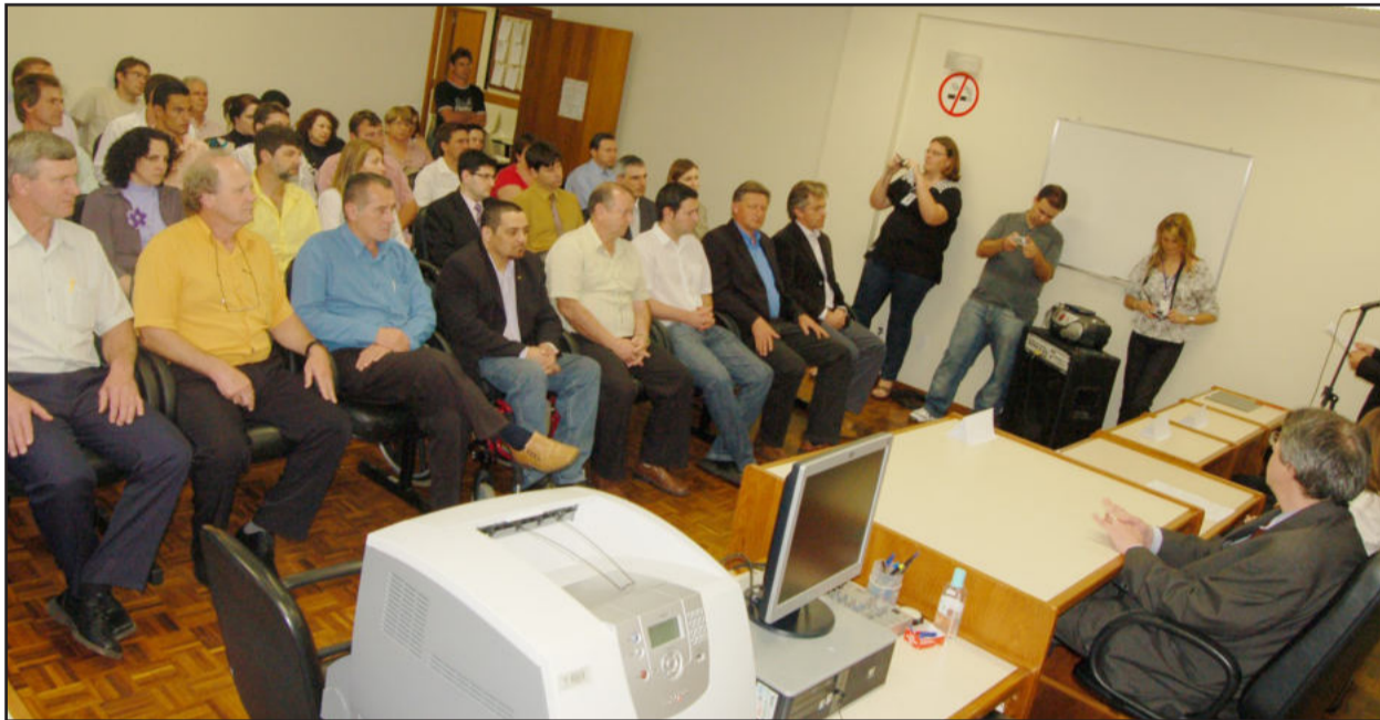
Lideranças políticas dos cinco municípios prestigiaram a solenidade

No fim da tarde desta terça-feira, dia 1º de setembro, o Tribunal Regional Eleitoral (TRE/RS) instalou oficialmente a 125ª Zona Eleitoral em Teutônia, que também atenderá as cidades de Paverama, Westfália, Poço das Antas e Imigrante. O ato de abertura foi realizado às 17 horas, na sala de audiências do Fórum de Teutônia.