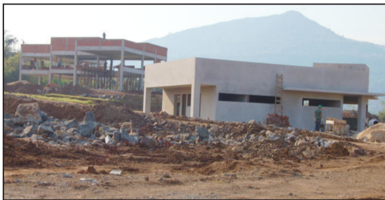
Unidade pode entrar em operação ainda em 2009

trifarma possui uma Unidade Industrial no Brasil, localizada em Taió (SC), implantada no ano 2000, e uma Unidade Industrial no Distrito Industrial de La Plata, Província de Buenos Aires, na Argentina. Além da implantação da Unidade Industrial no Rio Grande do Sul, em Teutônia, a empresa está instalando outra Unidade Industrial no Município de Maripá (PR).