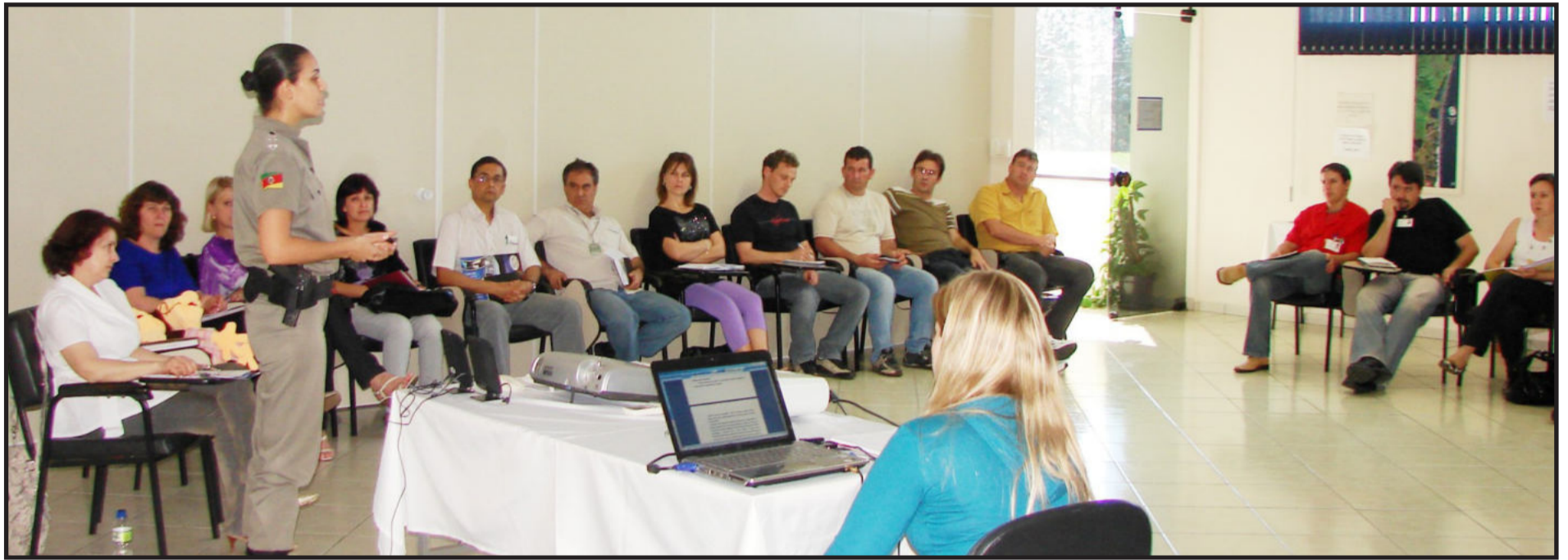
Projeto, que reúne órgãos públicos e entidades da sociedade, visa reduzir a violência e a criminalidade no trânsito. Página 8