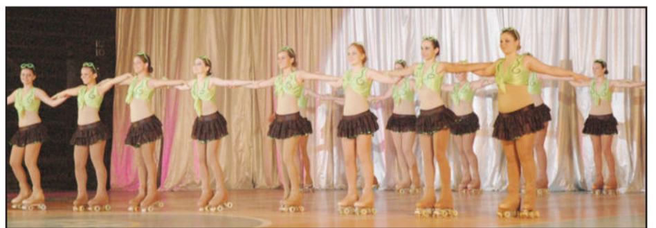
Grupo ensaia para o Mundial de Patinação na Alemanha

O grupo - A Cia de Patinação Sobre Rodas de Lajeado iniciou seus treinamentos em equipe competitiva de shows em 2005, quando participou do Campeonato Brasileiro em