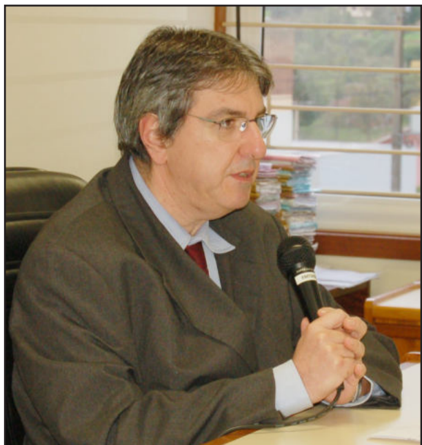
Presidente em exercício do TRE, Luiz Felipe Silveira Difini

Reforçou que um tribunal eleitoral não atua somente em ano eleitoral, mas no intervalo destes - como é o caso em 2009 -, a Justiça Eleitoral julga o rescaldo das eleições do ano anterior e se prepara para o próximo pleito. “As realocações de zonas eleitorais não são possíveis em ano eleitoral”, argumentou.