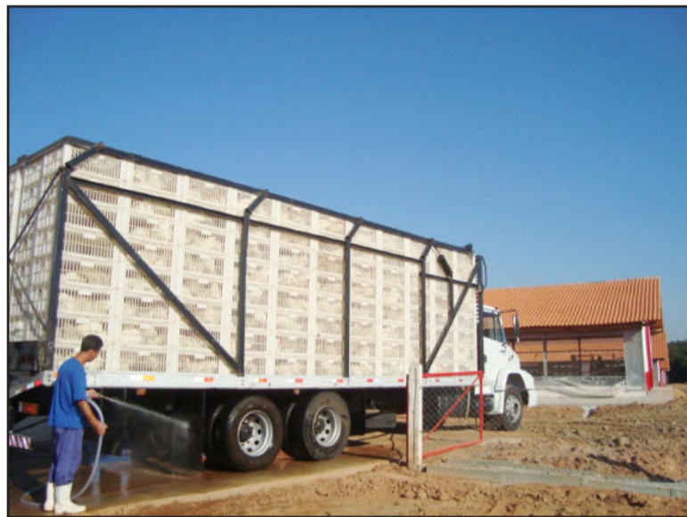
Caminhão passa por barreira sanitária para acessar a propriedade

A chegada de dois caminhões, contendo 3,2 mil galos, nesta segunda-feira, dia 31 de agosto, deu início a uma nova era na produção primária de Fazenda Vilanova. Estes machos formam o primeiro lote de aves da Granja Faria. Na próxima semana chegam 31 mil galinhas para completar o alojamento do primeiro núcleo de quatro aviários do empreendimento localizado na comunidade de Alto Pinheiral, no interior do Município. A propriedade irá produzir ovos férteis para as Empresas Perdigão, para criação de frangos de corte. "Estamos vivendo importante momento da história do Município onde uma nova atividade agrícola está se difundindo para ser um dos carros chefes de nossa economia", comemorou o prefeito ao acompanhar a chegada dos caminhões na sede da granja.