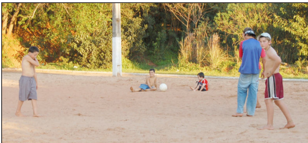
Quadras de areia são usadas para futebol entre grupos de amigos