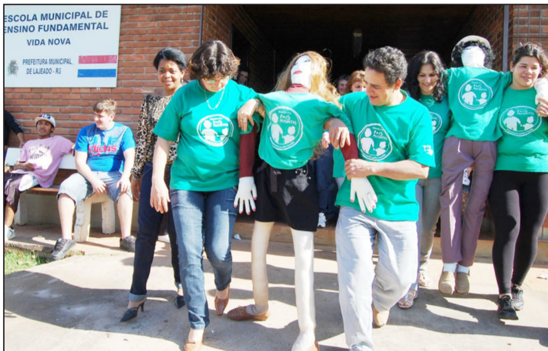
Famílias criaram mascotes simbolizando o Pais Presentes da Escola Vida Nova

A Escola Municipal de Ensino Fundamental Vida Nova de Conventos, de Lajeado, foi uma das cinco selecionadas no Rio Grande do Sul pela Rede Globo para integrar a produção de um vídeo destinado à divulgar o Projeto Amigos da Escola, da Fundação Roberto Marinho. As gravações vão acontecer na próxima quinta-feira, dia 04 de novembro, das 8h30min às 11h30min, quando a escola promove o 4º Dia Temático da ação "Minha Escola Minha Comunidade", vinculado ao Programa Pais Presentes da Secretaria de Educação (Sed) de Lajeado, que tem por foco estimular o envolvimento das