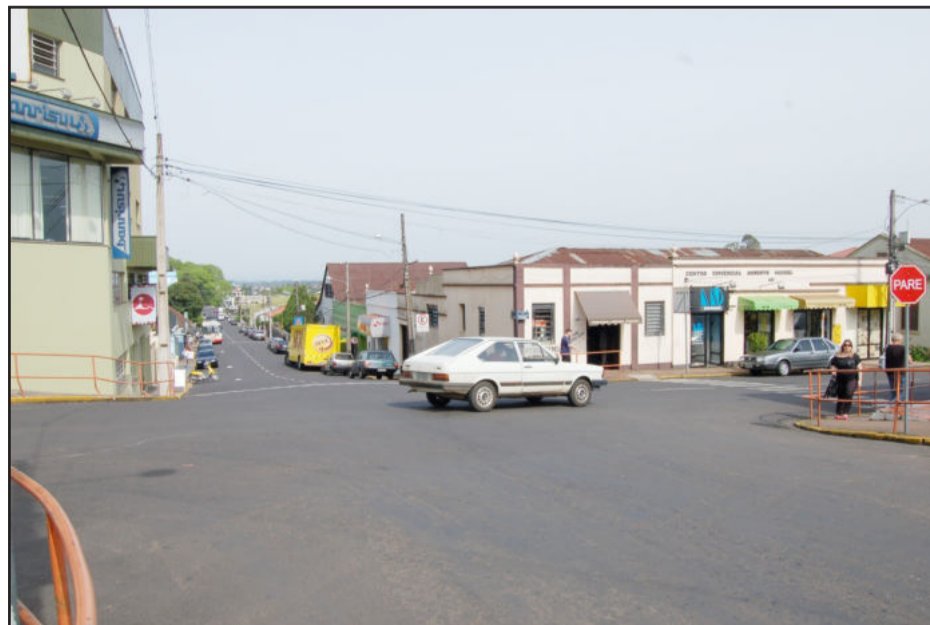
Motoristas devem ter atenção para o entroncamento das ruas Major Bandeira e 3 de Outubro