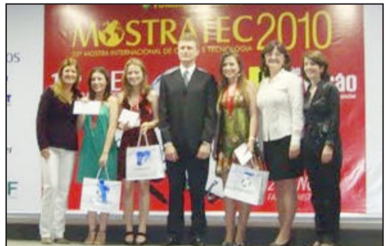
Premiação foi entregue durante a Mostratec