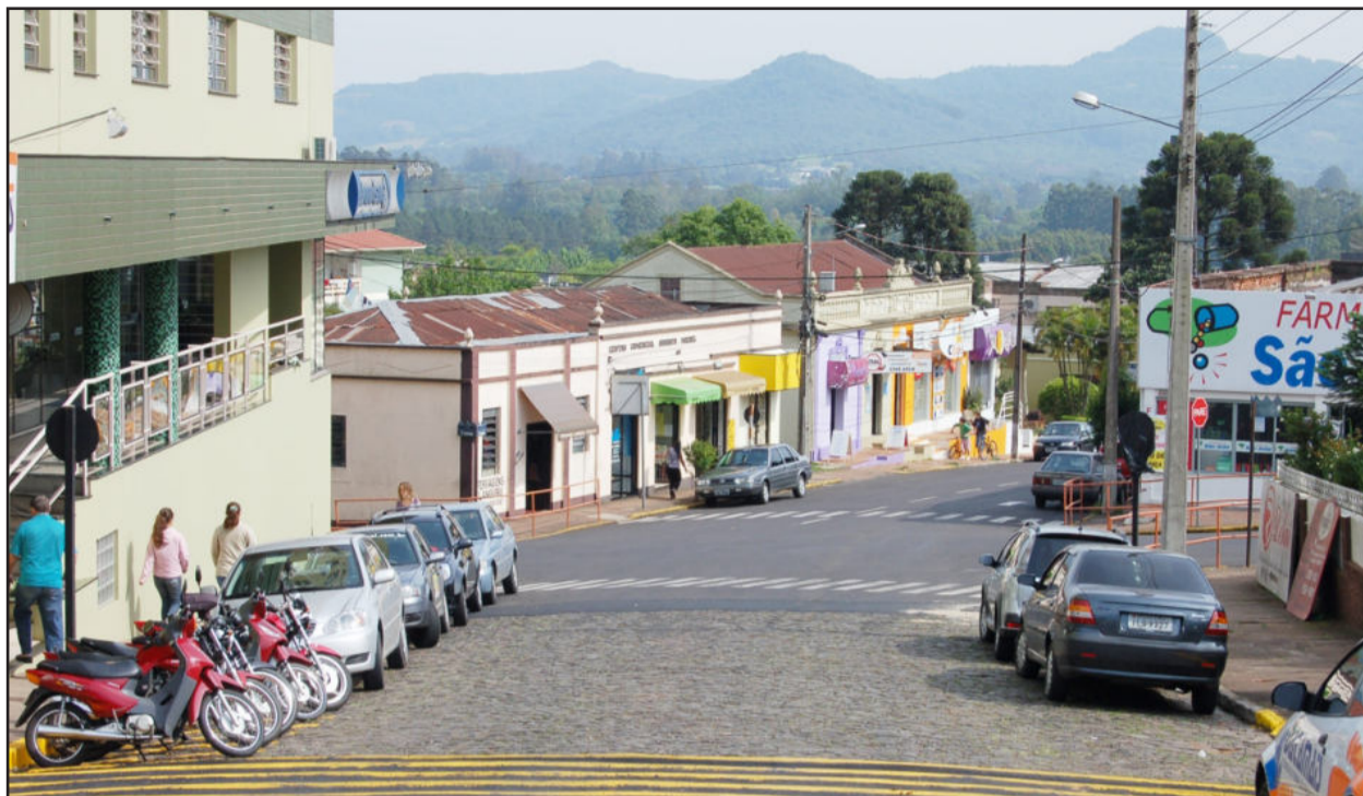
A partir do dia 3, motoristas que trafegam na Rua 3 de Outubro devem parar ao chegar na Major Bandeira

* Rua Pedro Schneider - Será mão única a partir da Rua Arthur Pilz (Floricultura/Agrocenter), subindo o