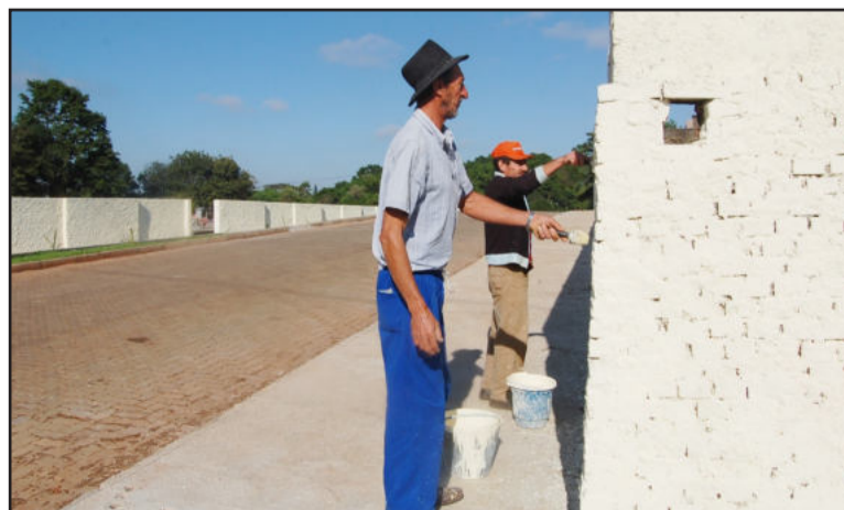
Muros dos cemitérios municipais foram lavados e pintados