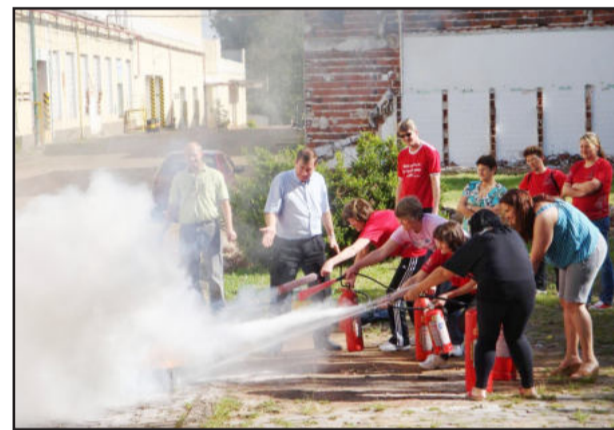
Treinamento prático de combate a incêndio

O treinamento realizado na terça-feira é o primeiro promovido pelo Município, de acordo com a Resolução Técnica, sendo o objetivo do Setor da Segurança do Trabalho, habilitar os servidores a utilizar os Equipamentos de Proteção e Combate a Incêndio.