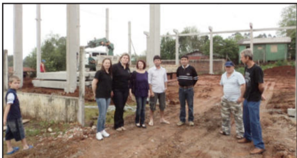
Construção do ginásio da escola foi apresentada

Quinto prêmio - Uma bola e uma pendrive: Germano N. Strate.