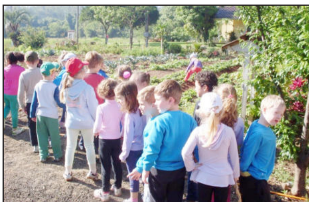
Visitando a horta da família