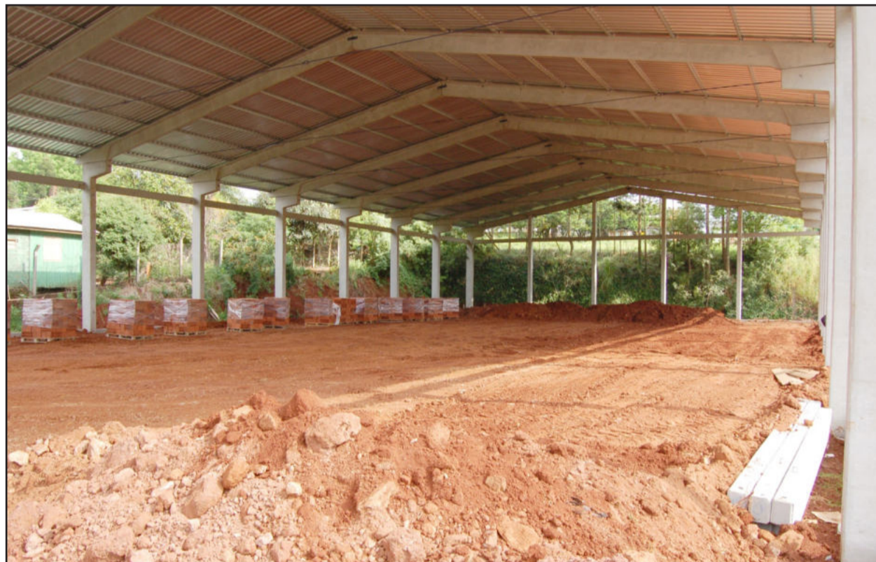
Ginásio beneficiará alunos da Escola 24 de Maio e a comunidade do Loteamento 8

Primeira etapa da obra é consolidada com recursos próprios da Prefeitura