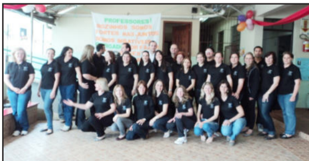
Equipe de professores se mobilizou na organização do evento