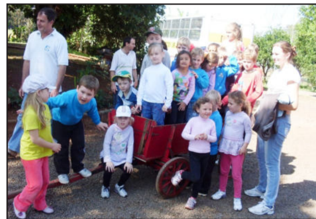
Toda turma reunida na atividade