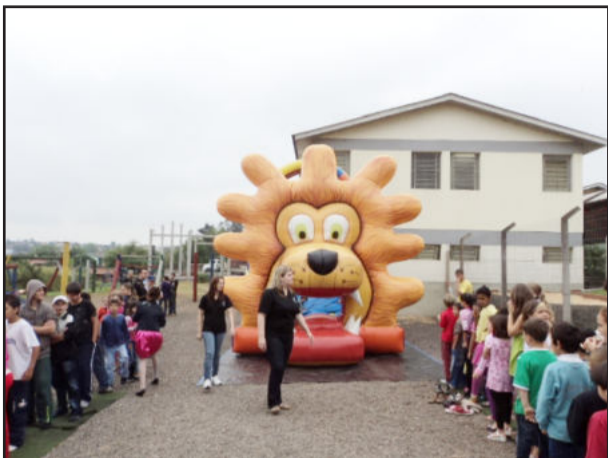
Crianças se divertiram com os brinquedos

A Escola Municipal de Ensino Fundamental 24 de Maio, do Loteamento 8 - Bairro Canabarro, realizou a Festa das Crianças nas dependências do educandário no dia 16 deste mês. Com o objetivo de confraternizar junto aos pais e alunos, a direção não mediu esforços para que o evento fosse um sucesso.