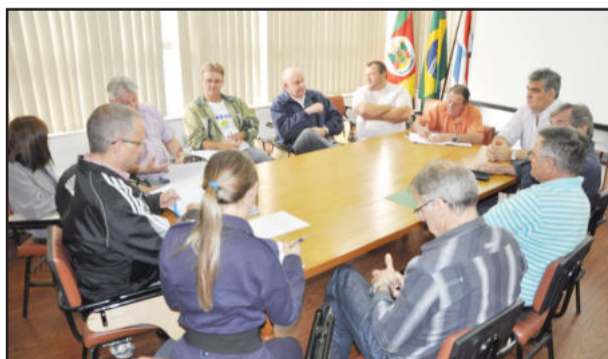
Comtran decidiu pela criação de vagas específicas para "motoboys"