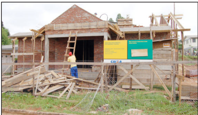
Obra é realizada com emenda do senador Paulo Paim e recursos próprios