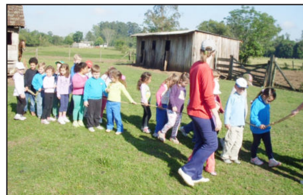
Passeio organizado na propriedade