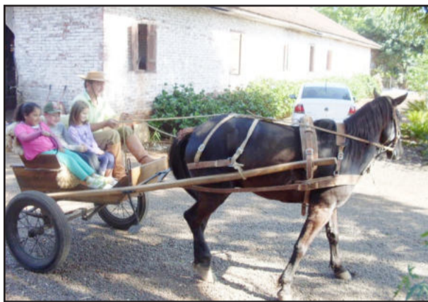
O divertido passeio de charrete