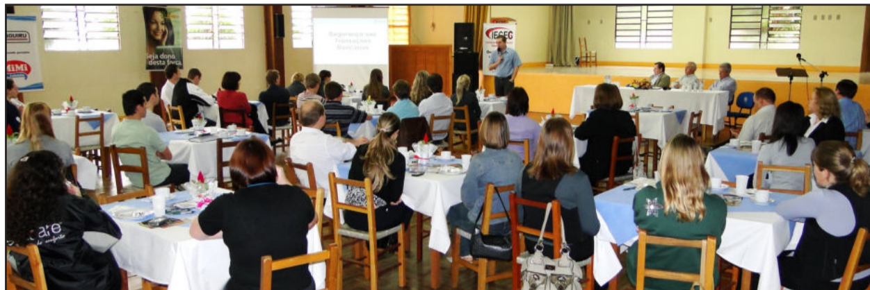
Palestra ocorreu no pavilhão da Comunidade Evangélica Redentor, no Bairro Canabarro

A Câmara de Indústria e Comércio (CIC) de Teutônia, o Instituto de Educação Cenequista General Canabarro (Iteceg) e a Sicredi Ouro Branco promoveram, no dia 22, Café da Manhã Empresarial com o tema "Segurança nas Transações Bancárias". O evento, que contou com a participação de 45 pessoas, integrou o 1º Fórum Tecnológico de Teutônia e a 19ª Feicog.