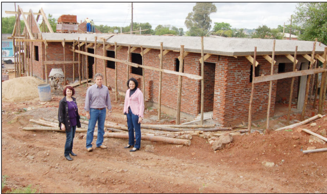
Prefeito e secretárias acompanharam andamento da obra

Obra conta com emenda do senador Paulo Paim (PT) e recursos próprios da Prefeitura