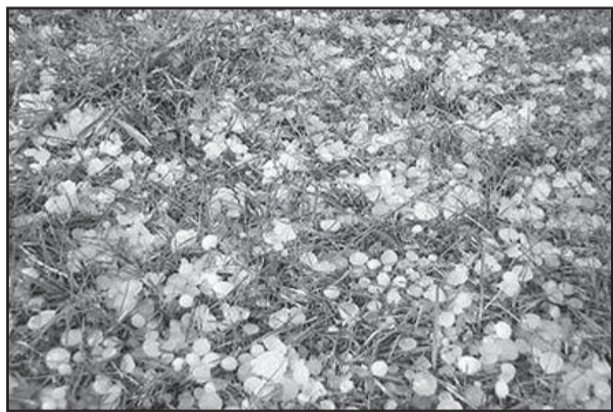
Temporal castigou o Estado e causou estragos na Serra

Pelo menos três cidades da Serra registraram queda de granizo na tarde deste domingo, dia 28: Garibaldi, Farroupilha e Coronel Pilar. Em Garibaldi, os bombeiros atenderam a um chamado, de uma casa que teve parte do telhado danificado. Algumas pedras chegaram a acumular no chão na área central.