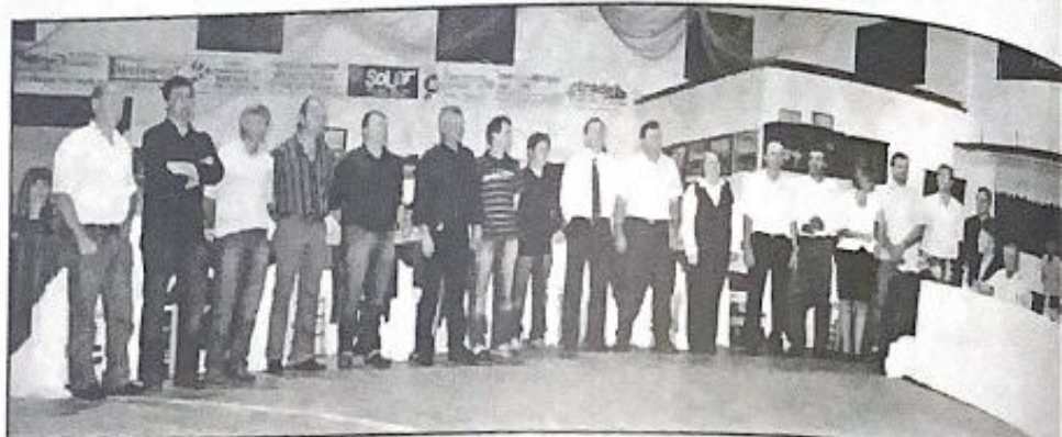
Comissão organizadora da Westfália em Festa