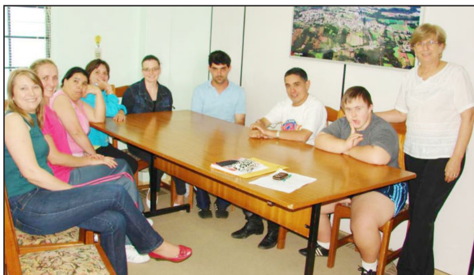
Encontrão com a primeira-dama (e)

Para a primeira-dama Eliane Altmann, “através de momentos como este os alunos terão a oportunidade de superar o medo do desconhecido tanto quanto ao lugar quanto a pessoas, estimular o relacionamento afetivo entre mãe e