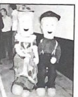
Mascotes de Westfália