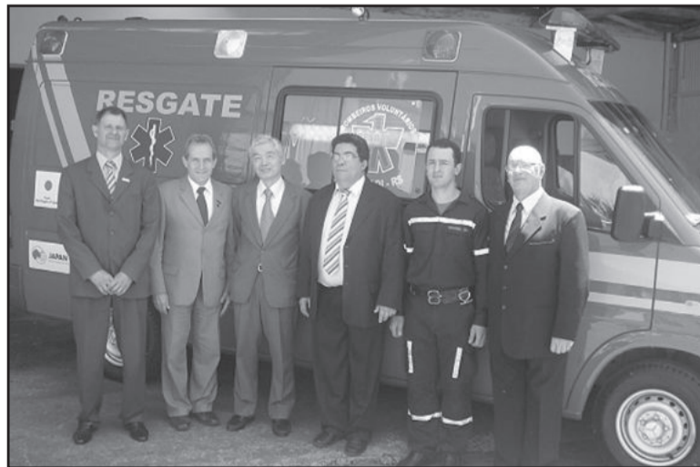
Ambulância foi entregue no sábado

Em junho deste ano o cônsul visitou Garibaldi para conhecer a estrutura da Corporação e voltou em se-