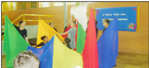
Apresentações foram prestigiadas

Buscando a qualificação para um futuro melhor, em breve, a Escola Pedro Rosa oferecerá Curso Técnico em Recursos Humanos.