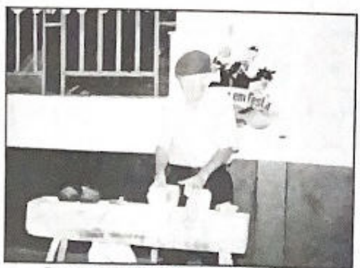
Demonstração da confecção do sapato de pau