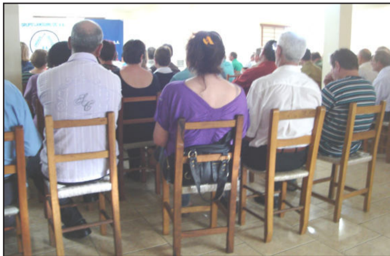
Evento teve reunião antes do baile

"Para mim se transformou numa reformulação da vida, através da experiência que colhi de outras pessoas que já participavam. Participo do AA há 17 anos. O respeito das pessoas é muito maior agora, principalmente da família. Isso porque a família também muda um pouco junto. Ela adoece com o alcoólatra. Assim como a pessoa que entra em