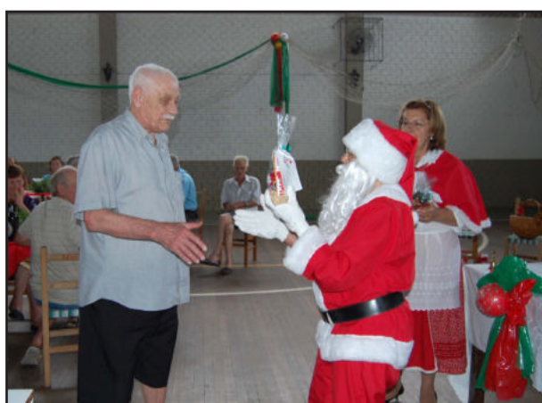
Festa de Natal do Idoso de Imigrante será no dia 8

Imigrante possui 3.100 habitantes, dos quais, 25% são idosos com mais de 60 anos. "Não formamos uma cidade de idosos, e sim uma comunidade que ostenta muita qualidade de vida", comenta o secretário municipal da Saúde, Celso Kaplan, um dos coordenadores da programação natalina. Todos os idosos do Município estão convidados a participar da Festa de Natal. Será disponibilizado transporte coletivo.