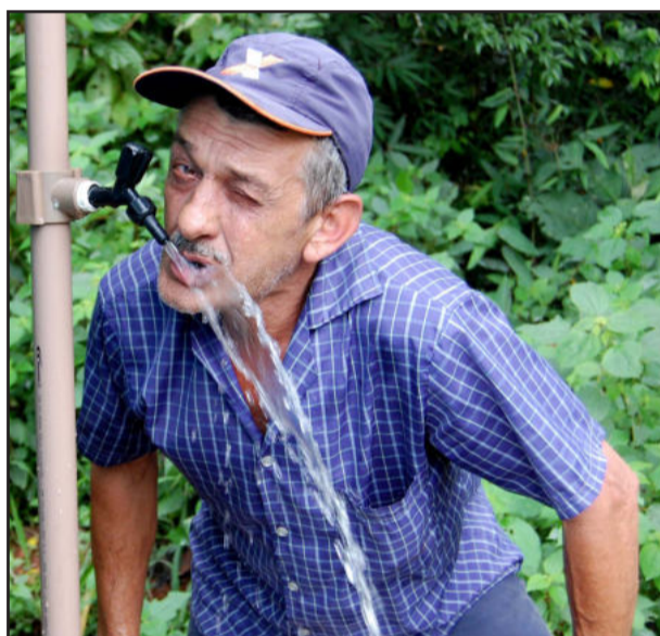
Lagemann comemora água limpa na torneira