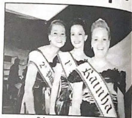
Soberanas da Westfália em Festa

A característica da região de celebrar sua cultura foi