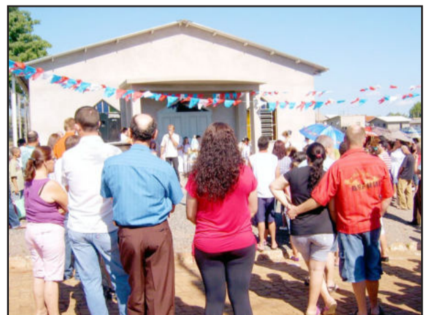
Comunidade presente à inauguração