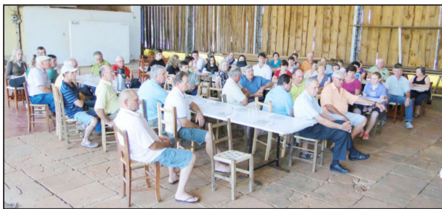
Encontro foi realizado no sábado

O Clube Amigos da Terra Regional Teutônia realizou, no sábado, dia 27, a sua assembleia geral ordinária referente ao ano 2010. O encontro teve por local as dependências da Comunidade Cristo, em Linha São Jacó, Teutônia.