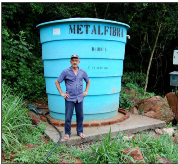
Presidente da Associação junto a um reservatório de água

Com relação à distribuição de água, cada residência vai possuir o seu hidrômetro (medidor de vazão) que marca o consumo em metros cúbicos. O tratamento da água também será feito com cloro, por ser uma exigência legal do Ministério da Saúde.