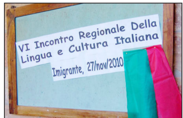
Logomarca do Encontro realizado em Imigrante