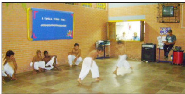
Grupo de Teutônia apresentou a capoeira