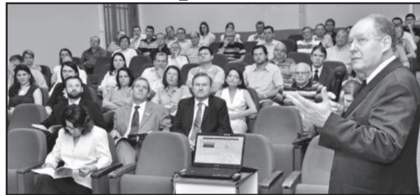
Balanço Econômico foi apresentado no sábado

Neste ano foram pesquisadas 162 empresas, dos setores industrial, comercial e de serviços, divididos por vinte e um segmentos. As indústrias respondem por 87,7% do faturamento, contra 7,4% do comércio e 4,8% de servi-