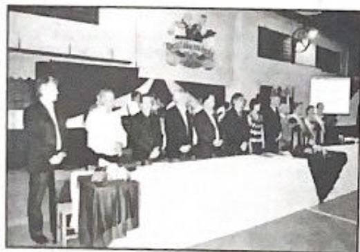
Autoridades participaram da cerimônia

A comunidade também pode prestigiar a confecção do sapato de pau, um dos principais símbolos da cidade, e um coquetel de integração.