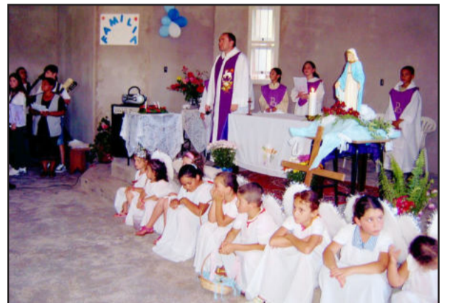
Crianças se apresentaram