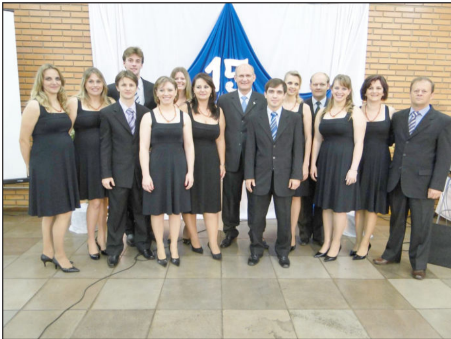
Equipe da Poolseg Corretora de Seguros

A Poolseg ainda foi homenageada, com placas alusivas à data, por uma série de corretoras e companhias seguradoras com as quais mantém parcerias comerciais. A Poolseg, por sua vez, também homenageou, com troféus, as empresas, pessoas e entidades que durante estes 15 têm sido clientes assíduos, sempre renovando seus seguros com essa corretora.