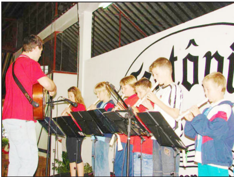
Alunos do Grupo de Flautas da Escola Leopoldo Klepker

Na próxima segunda-feira, dia 6 de dezembro, será a