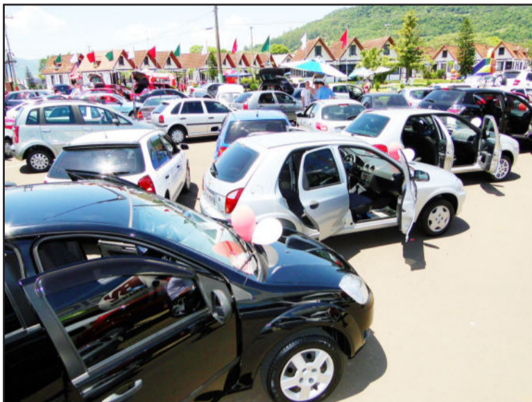
Feirão foi realizado no sábado e domingo

“A avaliação do 3º Feirão de Seminovos de Teutônia é muito positiva e o empenho das revendas na comercialização de seus veículos teve resultados. Durante o final de semana foram feitos negócios que chegaram a cerca de R$ 1,2 milhões e, certamente, esse número cresce na medida em que negócios prospectados pelas revendas durante o evento serão concretizados nos próximos dias. O Feirão