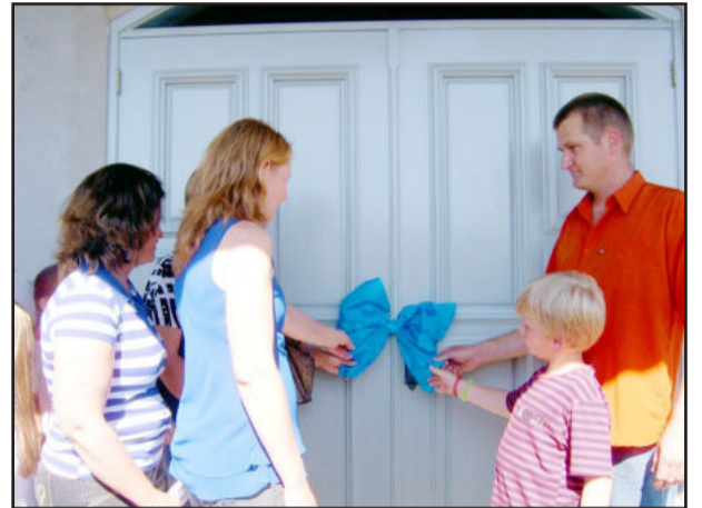
Abertura oficial da porta da capela

Centenas de fiéis de diversas comunidades acompanharam a inauguração da capela da Comunidade Católica Nossa Senhora das Graças, do Loteamento 8, no Bairro Canabarro, no sábado, dia 27. A celebração iniciou como procissão, que partiu do Escola Municipal 24 de Maio e seguiu até o novo templo. Para angariar fundos, foi feito um leilão para decidir quem abriria as portas da igreja. Após, houve a celebração da missa e apresentações artísticas das crianças.