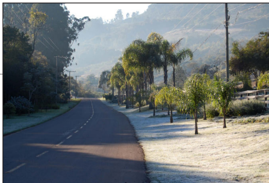
Paisagem "gelada" em Imigrante

O frio, que trouxe muitos aspectos negativos, como indisposição para algumas pessoas, doenças de inverno para outras e perdas na agricultura, propiciou também alguns pontos positivos, como a possibilidade de admirar belas paisagens da natureza.