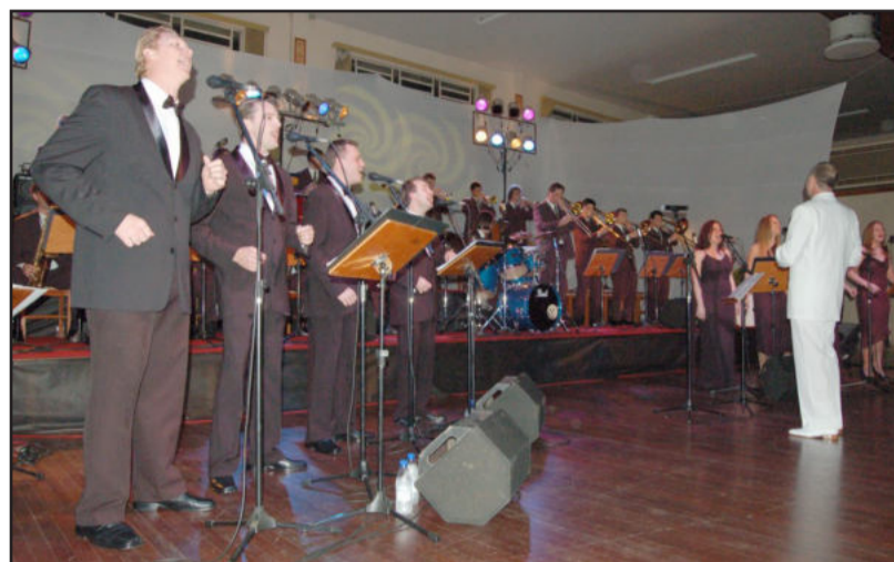
Apresentação para gravação começa às 20h

A proposta musical desse álbum é contar através de diferentes formações a história musical vivida pela Orquestra. Na abertura o grupo interpretará três temas musicais (somente instrumental), pois, em seu início, a Orquestra era formada só por instrumentistas de sopros e percussão.