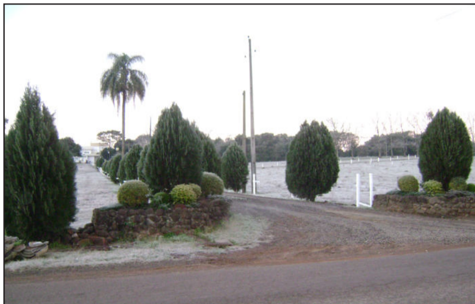
Bonita paisagem em Teutônia

"Ficar sentado ao lado de um fogão à lenha comendo pinhão na chapa, sem esquecer do chimarrão. As sopas também são uma excelente opção em se tratando de comidas."