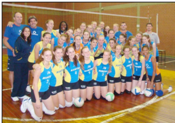
Equipes da Avates foram destaque nas várias competições que disputaram

As equipes da Avates, parceiras do Colégio Martin Luther e da Univates, são apoiadas pela Prefeitura Municipal de Estrela, SMEL, Cooperativa Languiru, Metalúrgica Hassmann, Academia Corpus, Cia Corpo, Comissaria Ultramar, Clínica de Fisioterapia Espaço Saúde e Academia Corpo e Alma.