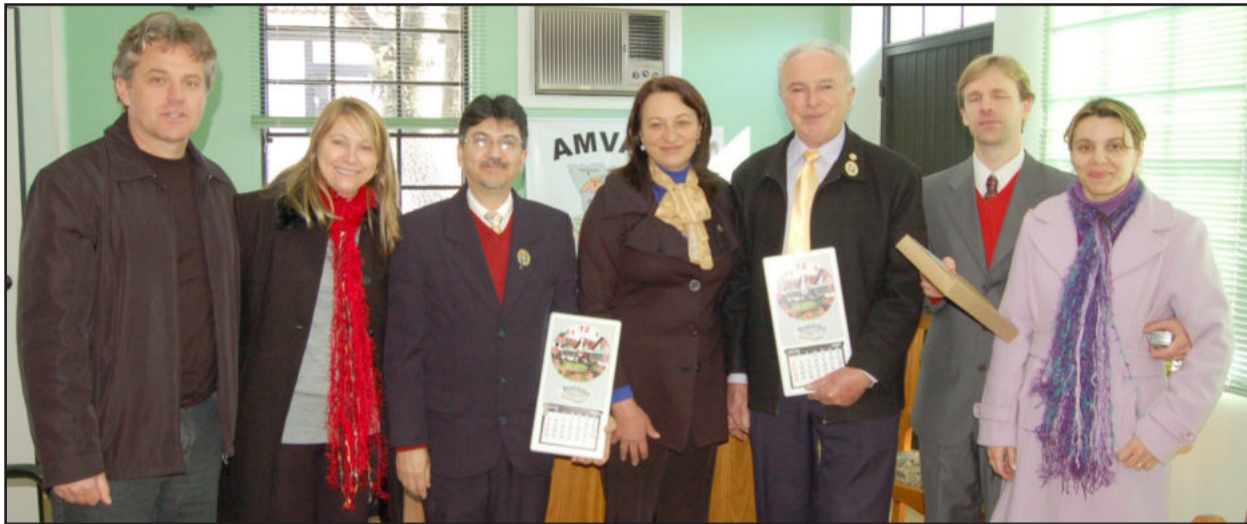
Município entregou lembrança aos visitantes