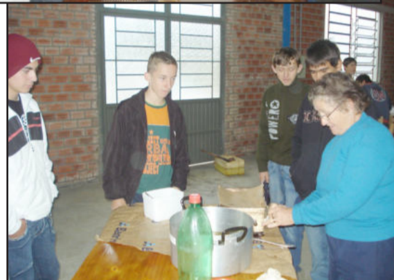
Comunidade colaborou para o aprendizado dos jovens