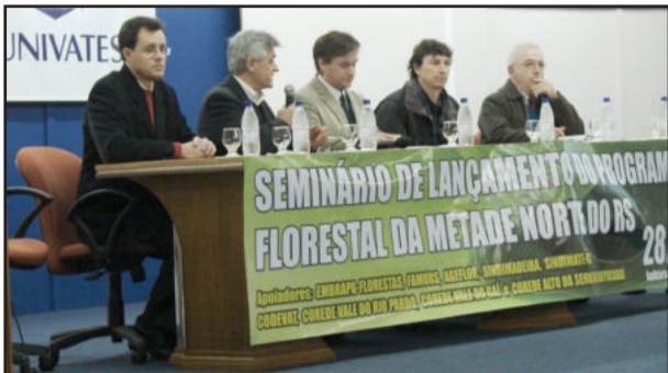
Lançamento foi terça na Univates

Na tarde desta terça-feira, dia 28, aconteceu na Univates o Seminário do Programa Florestal da Metade Norte, voltado para os 64 municípios que integram a região administrativa da Emater de Estrela. O objetivo foi criar o Comitê Regional Florestal, que realizará o diagnóstico florestal para a região, e ordenar a cadeia produtiva.