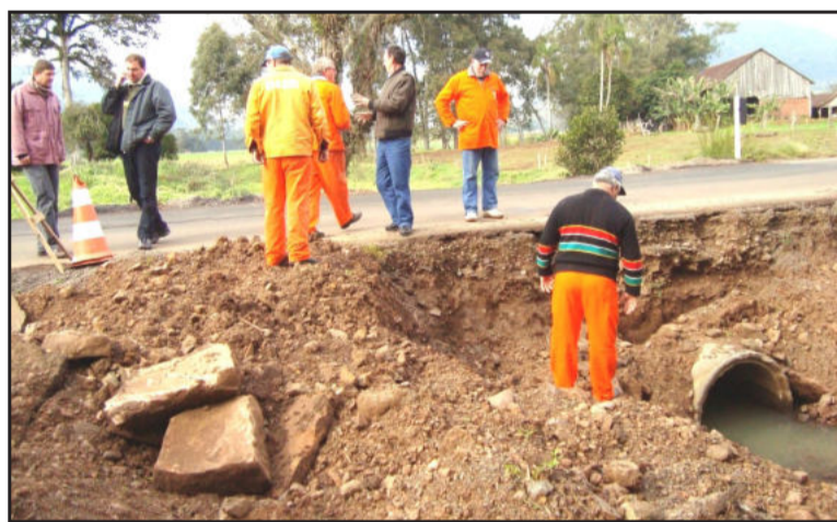
Trabalhadores do Daer atuando em Colinas