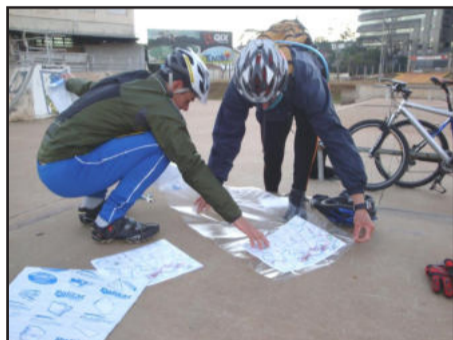
Equipes preparavam mapa antes da largada

prova desde o início da manhã, enfatizou a importância que eventos como esse têm para Estrela, tanto para o turismo e economia. "São centenas de pessoas de todos os lugares do país, que durante dois dias conhecem as belezas do nosso município, e trazem retorno econômico, consumindo em restaurantes e comércios. Além de apresentar uma nova modalidade de esporte", lembra.