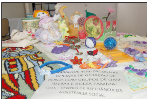
Mostra de trabalhos das oficinas

Projeto de Lei Nº 048/2009 - Autoriza a assinatura de convênio com a Sociedade Beneficência e Caridade de Lajeado.