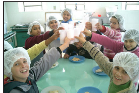
Gastronomia vegetariana no CEMEF. Crianças felizes fazendo um brinde com Lassi.

Observação: As receitas só estarão prontas quando a cozinha estiver limpa, organizada e as louças guardadas.