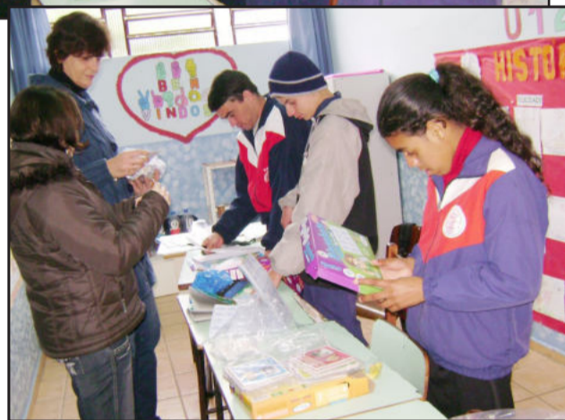
Jogos para alunos surdos