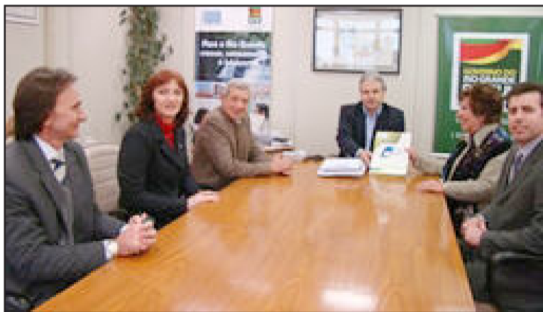
Alba (c) recebeu comitiva de Lajeado

O Natal Brilhante é um projeto enquadrado na Lei