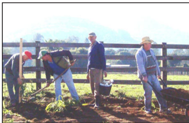
Moradores realizaram mutirão