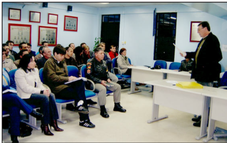
Sanders explicou os propósitos do Consepro

"Estamos enfrentando a pior crise de todos os tempos".