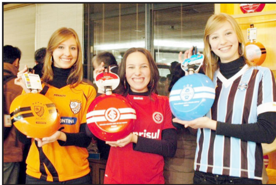
Tramontina lança frigideiras com os escudos da ACBF, Internacional e Grêmio