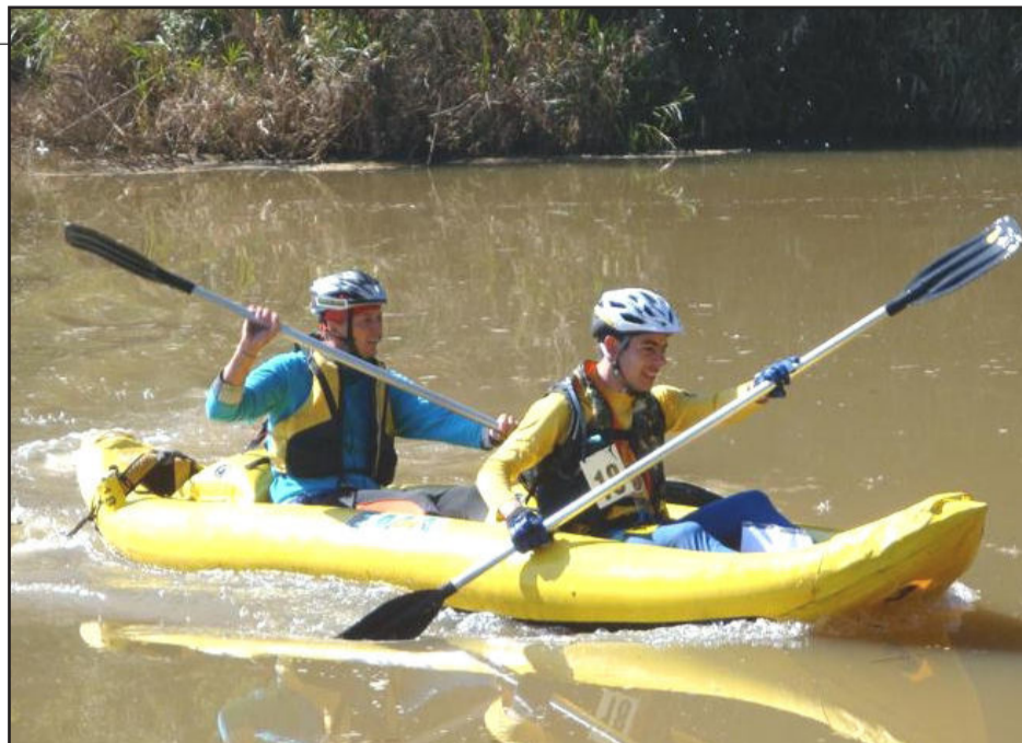
Provas na água fizeram parte do Desafio Estrela Aventura