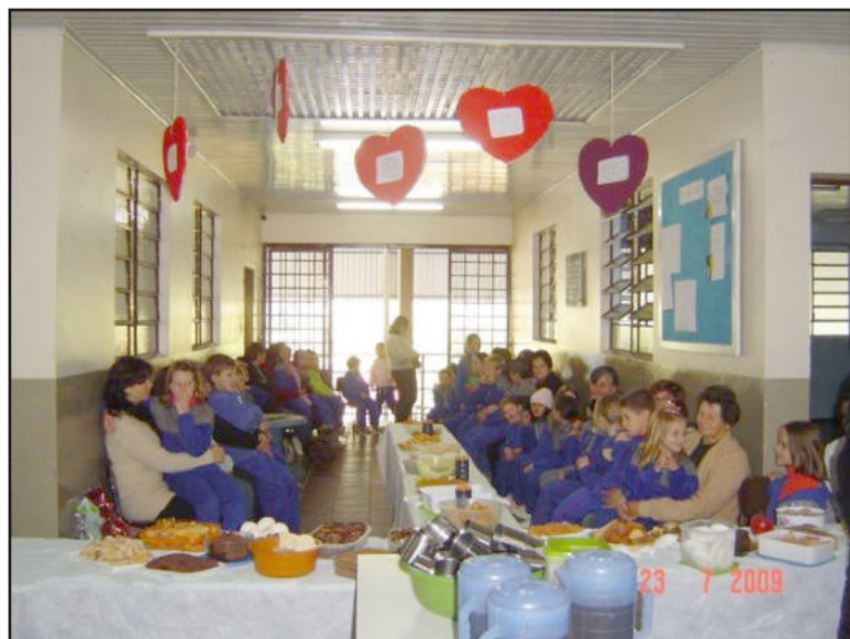
Alunos prestaram homenagem aos avós

A quinta-feira, dia 23, foi especial para muitos vovôs e vovós. Apesar da tarde fria, os avós puderam se esquentar com as belas homenagens de seus netos, emocionando a todos. Cada turma de alunos da Educação Infantil e Séries Iniciais do Ensino Fundamental apresentou uma homenagem para o Dia dos Avós, que transcorreu no domingo, dia 26, organizada pelos professores. Após as homenagens, cada aluno brincou com os avós numa gincana coordenada pelos professores. Em seguida, todos confraternizaram com lanche e chá, onde tiveram também a oportunidade de conhecer as salas de aula dos netos. Finalizando, cada avô e avó recebeu um mimo de seu neto, oferecido pela escola. Este dia, conforme relato de alguns avós, realmente foi inesquecível. São momentos fortes e marcantes na vida de uma pessoa.