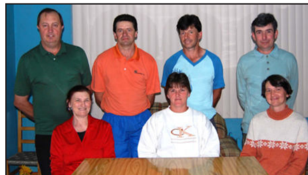
Festeiros convidam para o evento