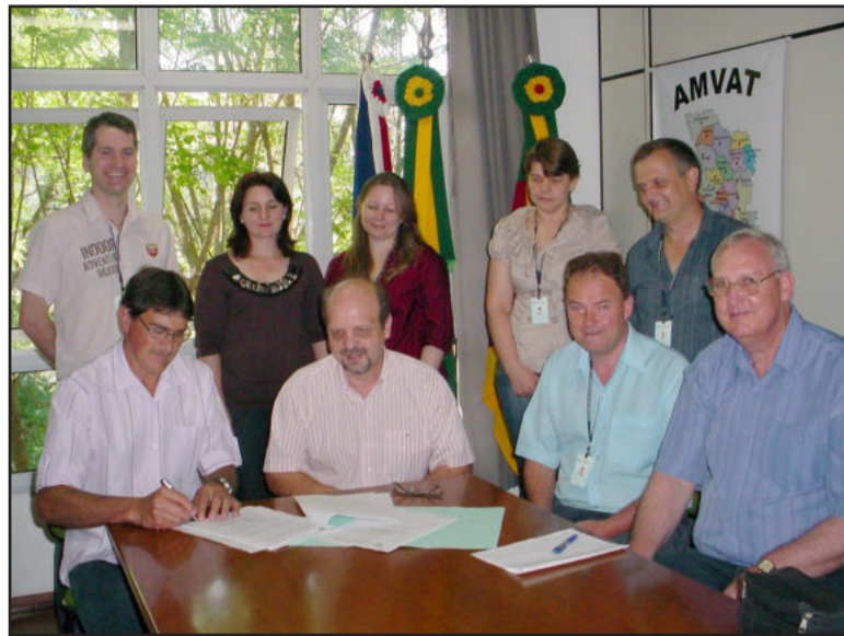
Assinatura do contrato foi ontem