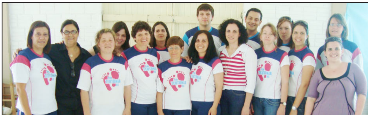
Equipe do PIM de Teutônia desenvolve trabalho diferenciado

A coordenação estadual do programa Primeira Infância Melhor (PIM) esteve em Teutônia nesta semana para documentar em imagens o trabalho desenvolvido pelo Grupo Técnico Municipal (GTM) do PIM em Teutônia. O objetivo é apresentar este vídeo durante o Seminário Internacional da Primeira Infância, programado para os dias 24 e 25 de novembro.