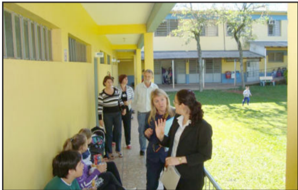
Comissão da 3ª CRE avaliou estrutura física do Ieceg

Além das inovações no curso Técnico em Informática, o Ieceg também oferecerá o curso Técnico em Recursos Humanos, já aprovado, disponibilizando desta forma um total de seis cursos técnicos à comunidade.