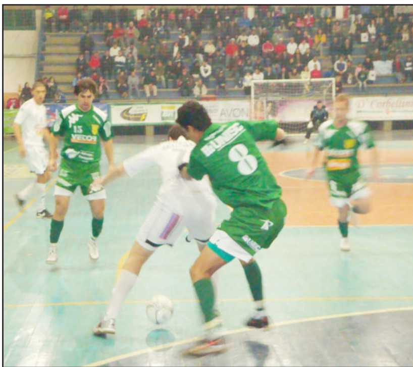
Jogo volta a se repetir, agora valendo vaga na semifinal

Retrospecto - É amplamente favorável à ASSOEVA. Em seis jogos oficiais até aqui, ocorreu apenas um empate em Venâncio Aires no primeiro turno. Nas demais cinco partidas (qua-