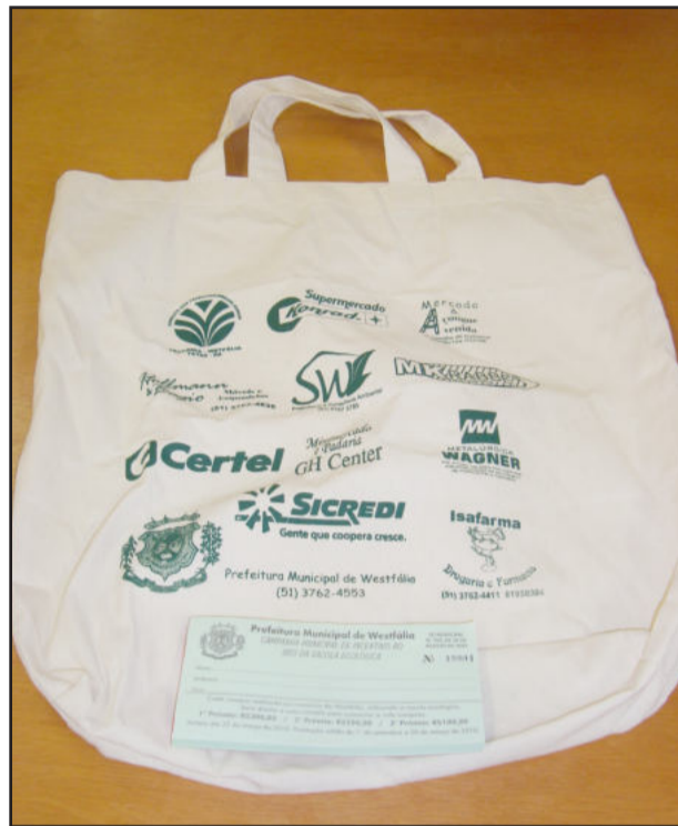
Sacola de tecido é recomendada

O Município está fazendo uma campanha para incentivar o uso da sacola ecológica. Através dessa campanha vai ocorrer premiação aos munícipes que usarem as mesmas para fazer suas compras. Quando o consumidor realizar uma compra no comércio de Westfália e usar a sacola ecológica para levar a mercadoria, não necessitando da sacola de plástico, receberá uma cautela e estará concorrendo a três vale-compras. A premiação é a seguinte: primeiro prêmio, um vale-compras de R$ 300,00; segundo-prêmio, um vale-compras de R$ 200,00; e o terceiro prêmio, um vale-compras de R$ 100,00.