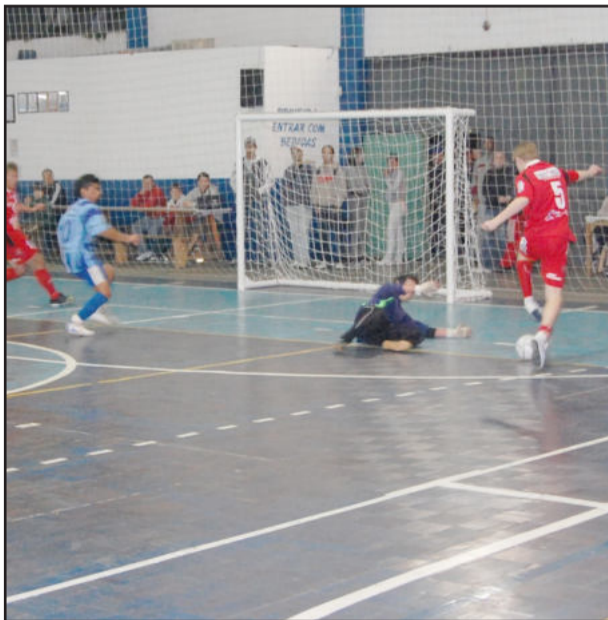
Cafusal 2009 de Lajeado tem rodada na próxima terça-feira, dia 03

A realização do Cafusal 2009 é da Prefeitura de Lajeado, sendo organizado pela Sejel com apoio da loja DMF Esportes, STR Lajeado, Valecross e da Folha Popular.