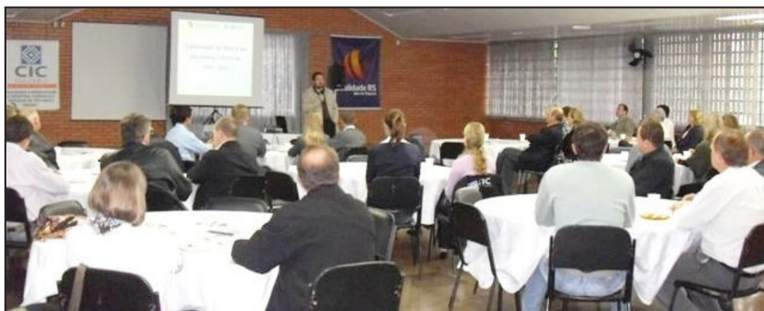
Cerca de 50 pessoas estavam no evento

No dia 15 deste mês, o Subcomitê da Qualidade de Teutônia e a Câmara de Indústria e Comércio promoveram o Café da Manhã Qualificando a Gestão. O evento, realizado no Centro Social do Sesi, teve apresentação do case da empresa Tecnoindustrial, que desenvolve, desde 1983, novas tecnologias no ramo metal-mecânico, visando projetar, fabricar, implantar e otimizar equipamentos e processos produtivos.