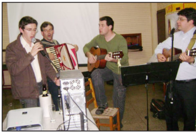
Professores revelaram talentos no dia 16