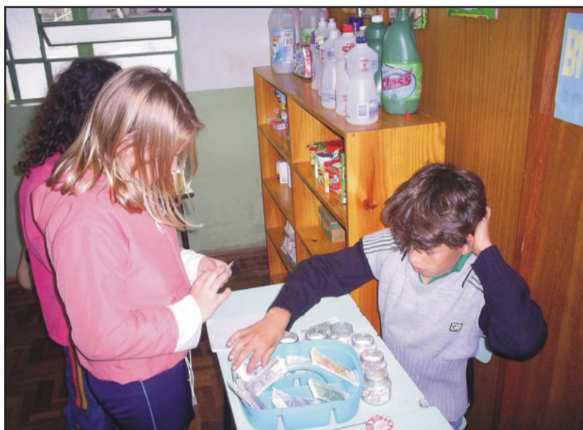
Alunos aprendem de forma lúdica o valor do dinheiro e sua relação comercial

O Projeto ainda está em andamento, sendo assim alguns alunos são responsáveis pelo “mercadinho” (caixa e vendedor), enquanto outros têm “empregos” como manicure, escritor, desenhista, carteiro, entre outros. Os “empregados” recebem “cheques” no