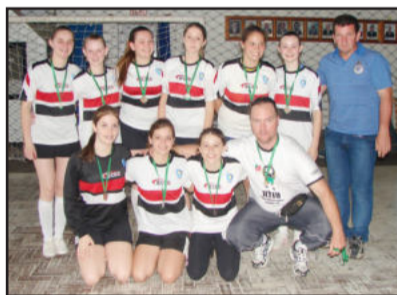
Ieceg campeão Infantil Feminino