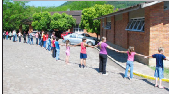
Abraço ao Centro Administrativo