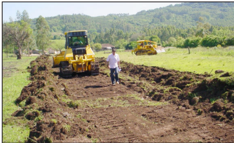
Máquinas começaram a trabalhar logo após a assinatura do contrato

Todos foram conferir o início dos trabalhos. Inclusive alguns moradores próximos também vieram acompanhar o começo dos trabalhos das máquinas.