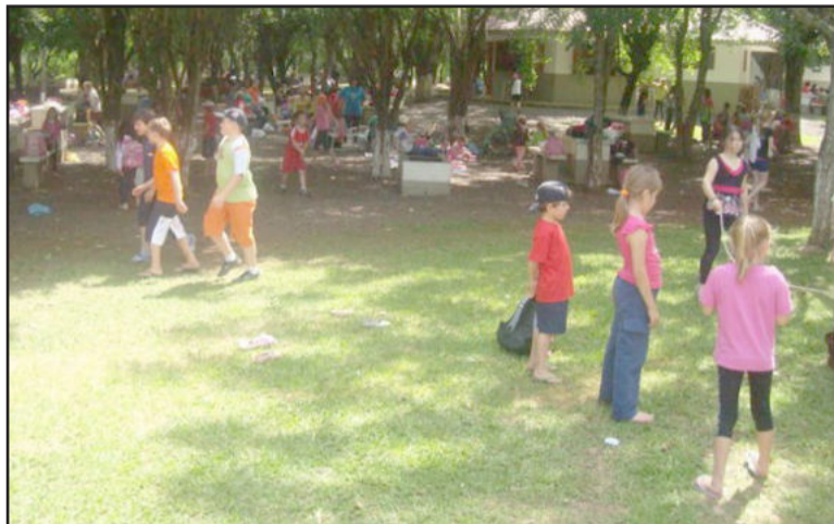
Crianças realizaram piquenique no dia 14

Ainda no 16 deste mês, a equipe gestora do educandário promoveu uma noite com diversas surpresas, no Restaurante Paladar. Este momento especial para professores e funcionárias da escola rendeu muitos sorrisos, abraços e homenagens, através de uma apresentação aos presentes. Enalteciam-se as qualidades de todos os profissionais da escola, através de mensagens, fotos e muita música. "São momentos ímpares, que fortalecem os laços de união, relacionamento e valorização do grupo", destaca a direção da escola.