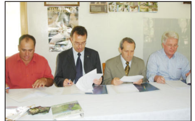
Momento da assinatura do convênio

A Associação dos Vinicultores de Garibaldi (Aviga) e representantes da cidade de Conegliano, da Itália, assinaram Carta de Intenções visando o intercâmbio e a troca de experiências entre o setor vinícola das duas cidades. O encontro ocorreu na residência da família Vaccaro, que integra o roteiro turístico Estrada do Sabor, e fez parte de uma série de atividades que a comitiva de italianos realizou no Município. A cidade de Conegliano possui um tratado de cooperação (Gemelaggio) com Garibaldi, o que as torna cidades-irmãs.