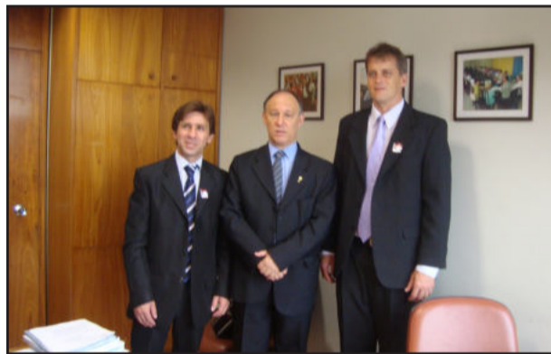
Os vereadores visitando em Brasília