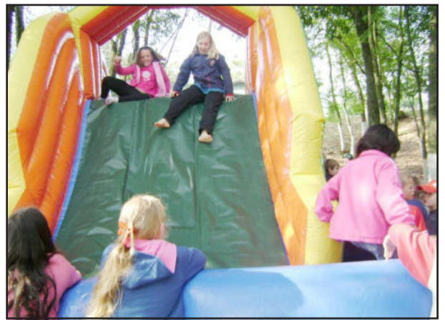
Dia 10 foi o momento de brincar bastante na área verde