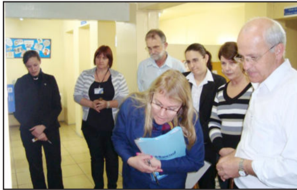
Todas as repartições do instituto foram conferidas