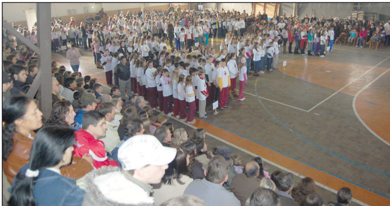
Proerd já formou em julho cerca de 500 jovens lajeadenses