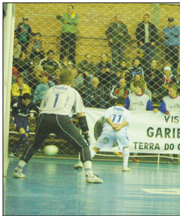
Equipe joga a primeira partida em casa, hoje

A Associação Garibaldense de Esportes e Lazer (AGEL) começa a decidir uma vaga na semifinal do Gauchão de Futsal da 1ª Divisão na noite de hoje. A partir das 20h30min, joga no ginásio Municipal de Esportes de Garibaldi diante do Atlântico de Erechim, em partida válida pelas quartas-de-final do certame. Uma vitória será um resultado importante para a AGEL reverter a vantagem do Atlântico.