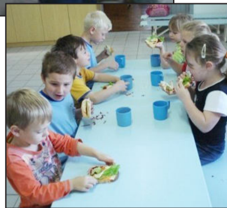
Crianças degustando alimento saudável