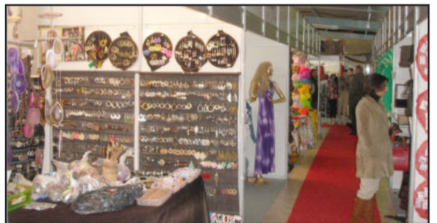
Feira teve variedade de opções

Feira Comercial da Fenachamp teve bom público