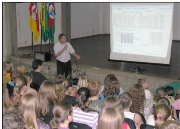
Prefeito apresentou balanço

No dia 23 deste mês, Poço das Antas realizou uma mobilização denominada de "Em Defesa dos Municípios Brasileiros", os quais estão passando por uma crise financeira considerável. A intenção foi de chamar a atenção da sociedade para as grandes dificuldades que os municípios enfrentam, recebendo cada vez mais obrigações federais e menos recursos para subsidiar suas obrigações.