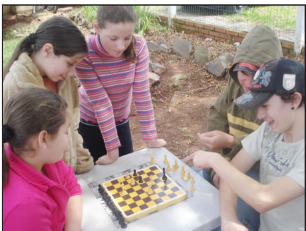
Alunos aprendem e se divertem com o jogo de xadrez