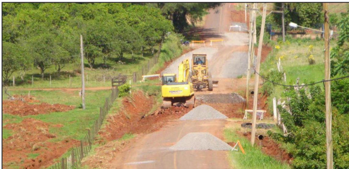
Obra de recuperação deve ficar pronta até o dia 10 de novembro

Na próxima semana será licitado aproximadamente 15 toneladas de manta asfáltica para aplicar no trecho, devendo estar pronta toda a melhoria até o dia 10 de novembro, se o tempo permanecer estável.