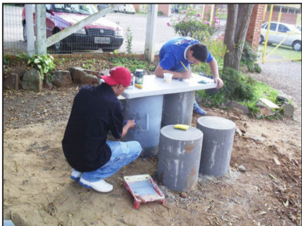
Alunos ajudaram na construção das mesas de xadrez