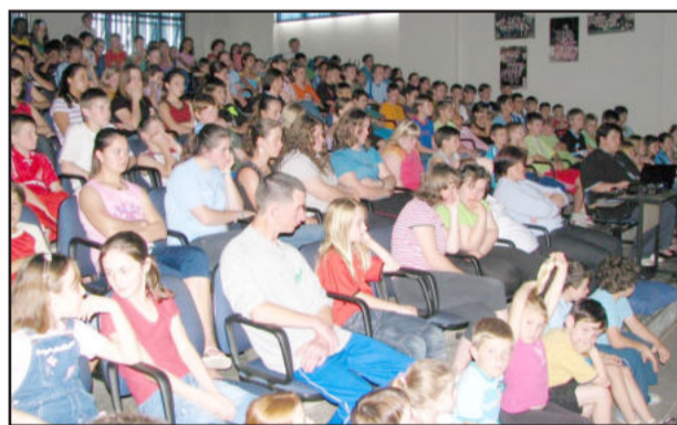
Participação de alunos e professores