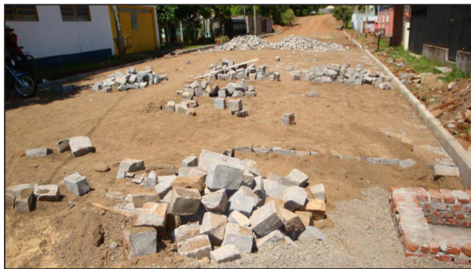
Rua João Antônio Gerhardt está recebendo calçamento com paralelepípedos

A rua João Antônio Gerhardt, no bairro das Indústrias, está recebendo pavimentação com paralelepípedos de basalto. De acordo com Gerson Hepp, engenheiro da Prefeitura, a melhoria compreende uma área total de 2.100,79m 2 e a forma de execução é mista. São 1.516,20m 2 no regime comunitário e a área restante está sendo pavimentada sob forma de contribuição de melhoria.