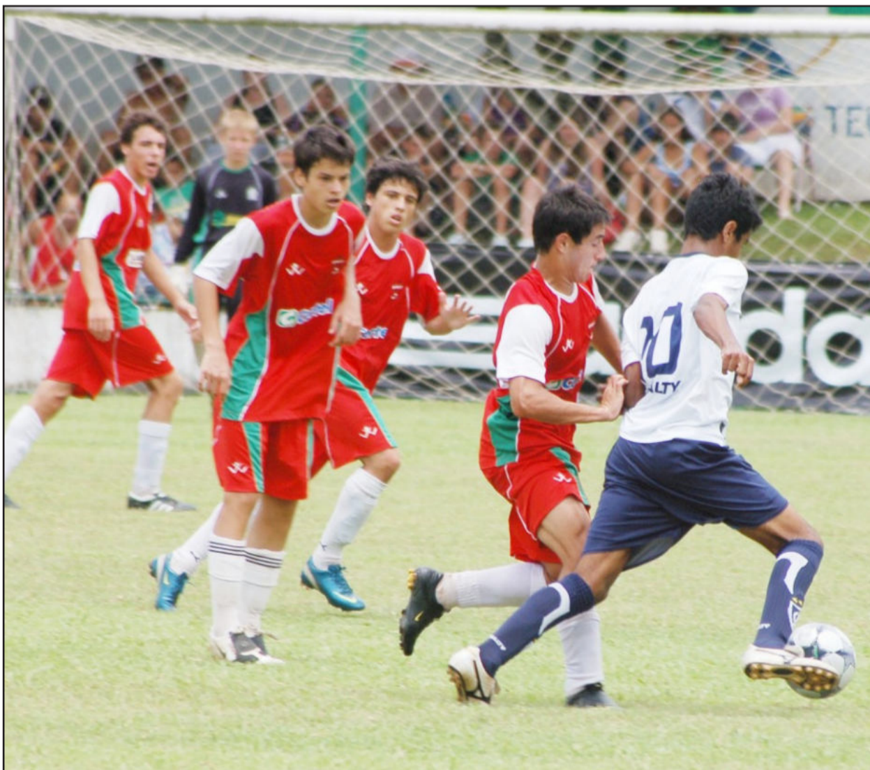
Clube do Remo (branco), de Belém do Pará, foi campeão na sub-16 em 2010