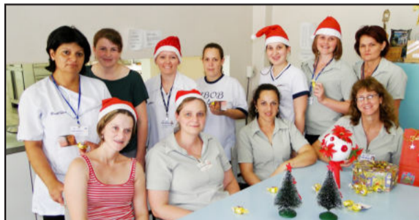
Integrantes do GTH entregaram bombons e cartões de Natal aos pacientes

Além da atividade realizada pelo próprio hospital, inúmeras entidades organizam anualmente visitas especiais aos pacientes do HOB, como a Ordem Auxiliadora de Senhoras Evangélicas (Oase), corais e até grupos instrumentais, como do Colégio Teutônia, que levam um pouco mais de alegria e conforto aos pacientes e seus familiares que por hora utilizam os serviços do hospital.