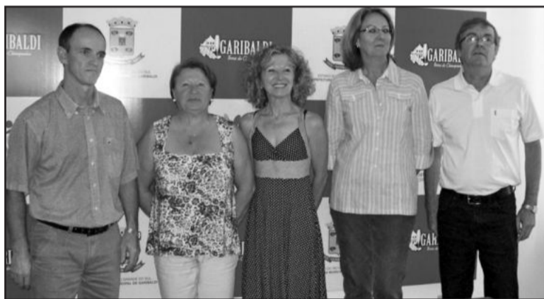
Novos conselheiros tutelares de Garibaldi

O evento contou com a presença de autoridades e secretários municipais. No decorrer da cerimônia o Conselho Municipal dos Direitos da Criança e do Adolescente (Comdica), juntamente com o Executivo, prestou homenagem aos conselheiros que estavam despedindo-se e entregaram a cada um deles uma singela lembrança.