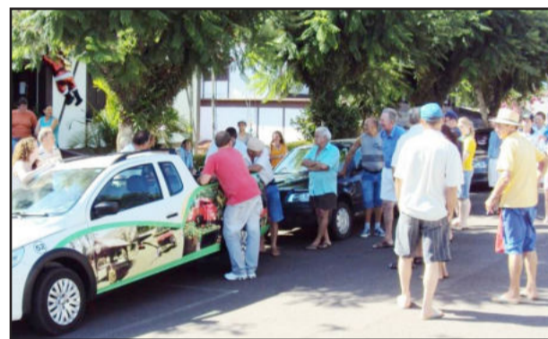
Sorteio foi realizado na caçamba da caminhonete da Prefeitura diante de bom público