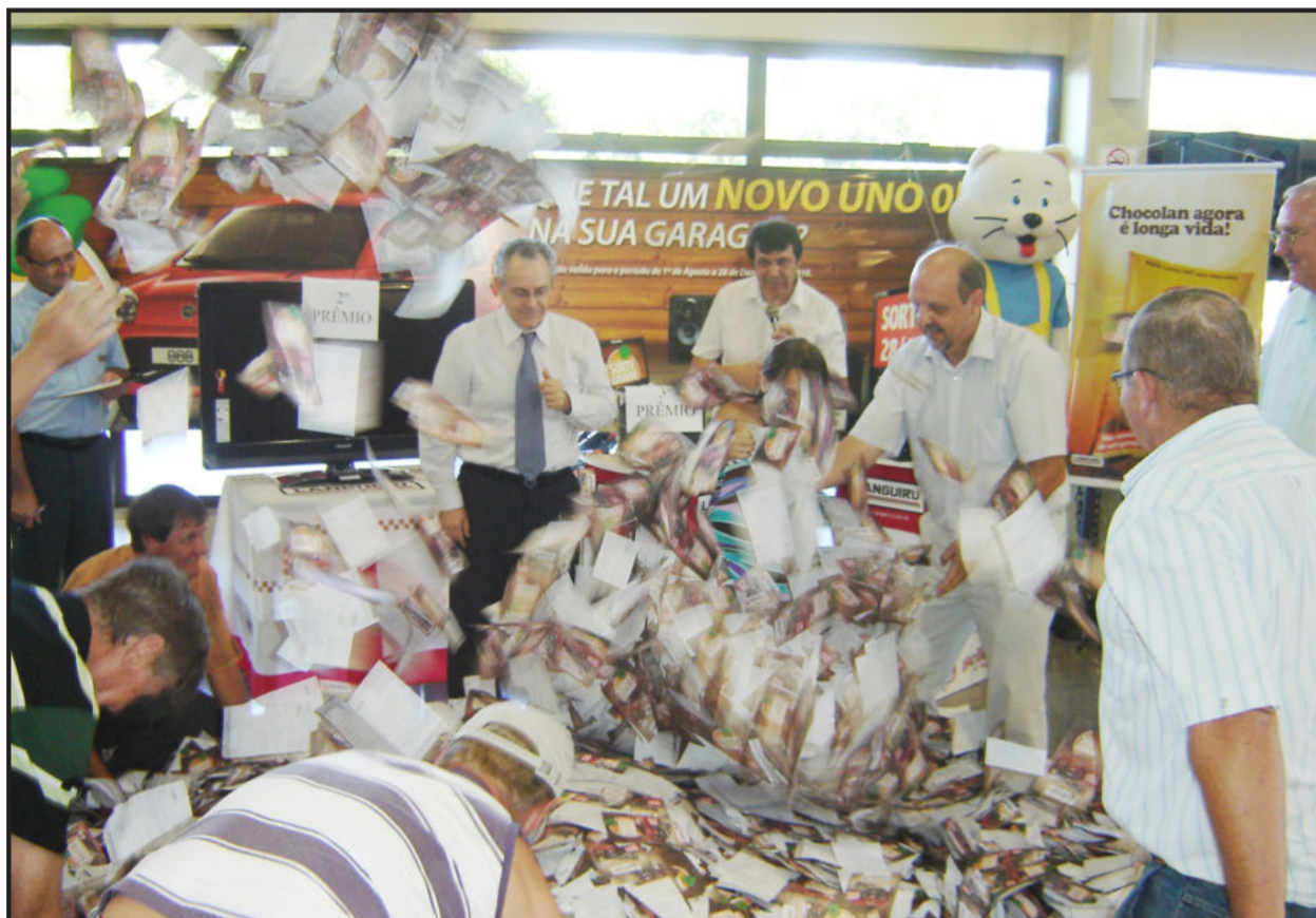
Mais de 570 mil cautelas concorreram aos prêmios

Os artigos assinados são de inteira responsabilidade de seus autores e não traduzem necessariamente a opinião do jornal nem a do editor.