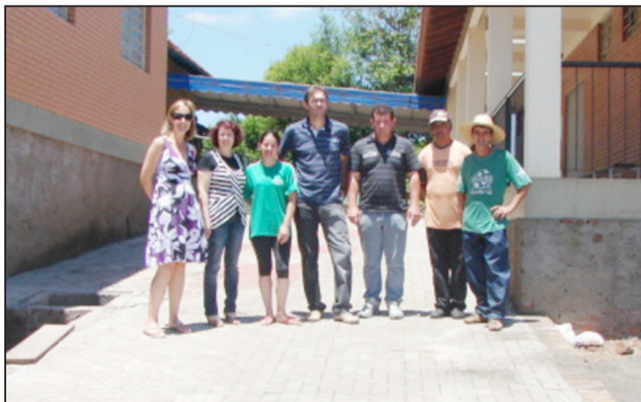
Na Escola Alfredo Schneider está em andamento a pavimentação interna no pátio