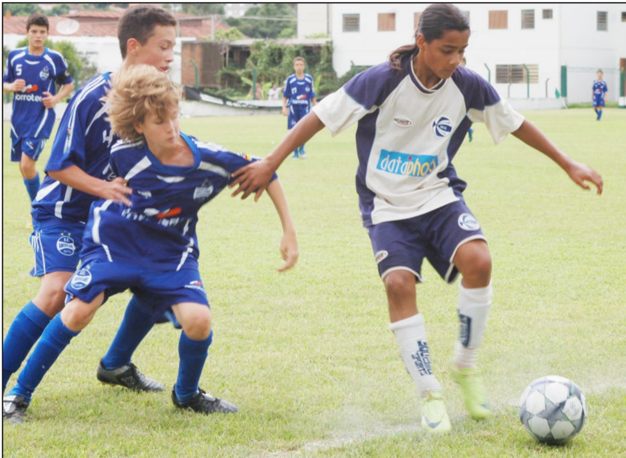
Garotada mostra habilidade e muita disposição nos jogos da Copa Teutônia Adidas

Entre os grandes clubes do futebol, o Grêmio Portoalegrense confirmou 2 categorias e o SC Internacional de Porto Alegre ainda não confirmou presença. Além de Santa Cruz, Guarani-VA e Lajeadense, há equipes: do Porto Alegre FC, do São José de Porto Alegre, do Cruzeiro de Porto Alegre, do Rio Grande, do Farroupilha de Pelotas, do Novo Hamburgo, do Aimoré de São Leopoldo e Ferroviária de Curitiba/PR.