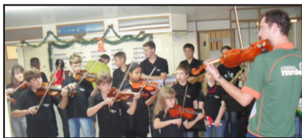
Músicos do Colégio Teutônia animaram ambiente hospitalar