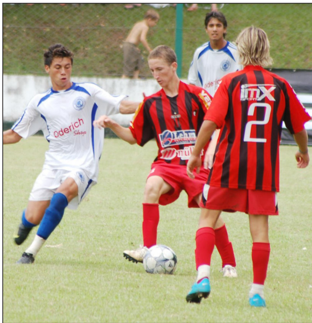
Partidas são disputadas em campos de clubes amadores de Teutônia

De 09 a 15 de janeiro, Teutônia recebe os craques do futuro