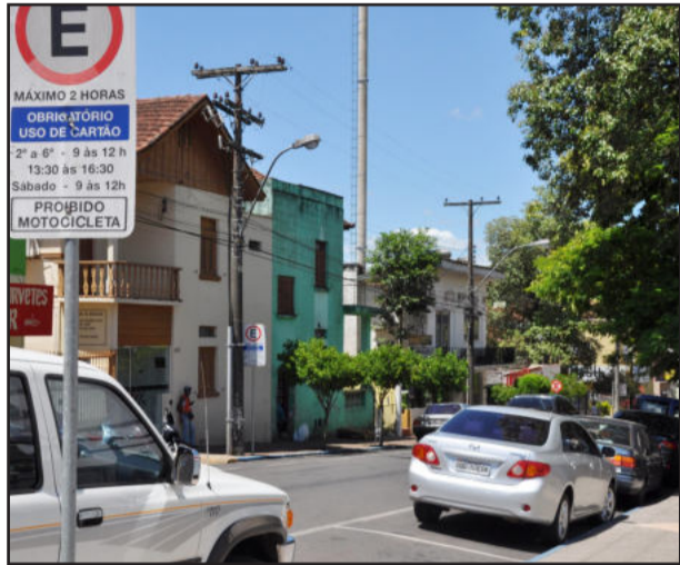
Quem não pagar no ato e não estacionar no espaço demarcado será autuado

Já estão vigorando em Lajeado as inovações nas regras do estacionamento rotativo pago, que recentemente foram aprovadas, por unanimidade, pela Câmara de Vereadores, e sancionadas esta semana pelo Poder Executivo. A principal regra nova diz respeito à observância dos espaços delimitados na pista demarcada na área azul para estacionar cada veículo. Caso contrário, o responsável pelo veículo estará sujeito ao pagamento de dois ou mais boxes - que será cobrado no ato pelo operador da União das Associações de Moradores de Bairros de Lajeado (Uambla) - instituição responsável pelo sistema do Estacionamento Rotativo na cidade.