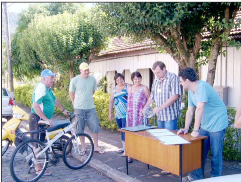
Sorteio final testemunhado pela comunidade

branca) os números e respectivos prêmios sorteados foram: 1º prêmio (R$ 1.100,00) - número 62.829; 2º prêmio (R$ 800,00) - 62.696; 3º prêmio (R$ 600,00) - 58.046; três prêmios de R$ 500,00 cada para os números 59.801, 05.194 e 50.194; três prêmios de R$ 400,00 para os números 13.940, 20.627, 22.560; mais cinco prêmios de R$ 200,00 cada para 65.110, 34.261, 49.135, 57.978 e 07.576.