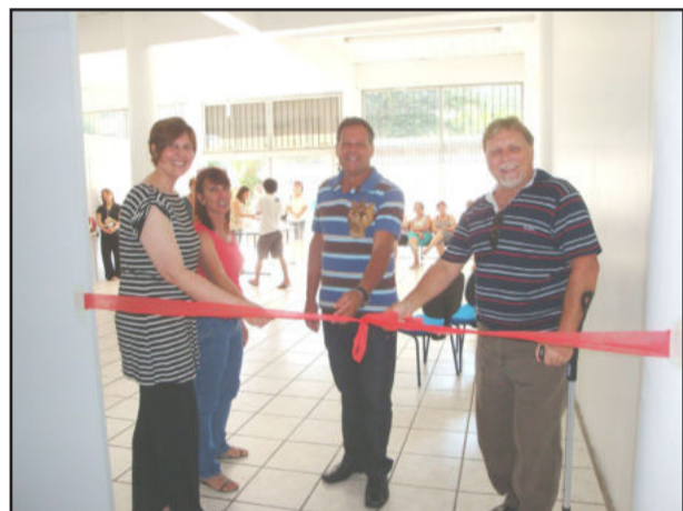
Desenlace da fita marcou a inauguração