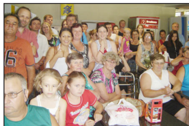
Clientes acompanharam o sorteio realizado no Supermercado Languiru