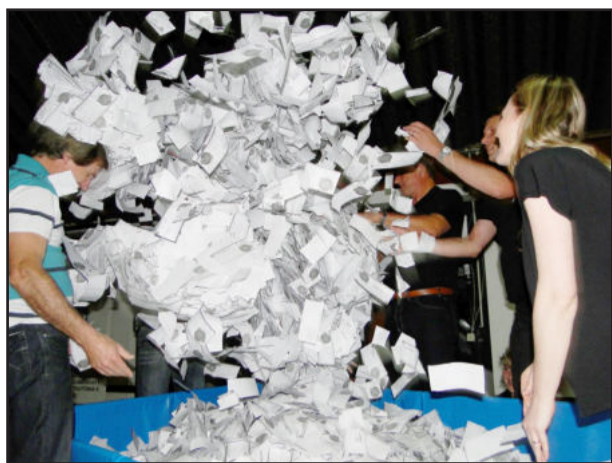
Sorteio contou com a participação de 572 mil cautelas, distribuídas por 171 empresas

A Campanha Nota Fiscal dá Prêmios - Natal de Prêmios Teutônia, promoção da administração municipal de Teutônia com apoio e realização da Câmara de Indústria e Comércio (CIC), foi encerrada na noite desta quarta-feira, dia 29. Na oportunidade ocorreu o sorteio do automóvel Celta zero quilômetro, de uma viagem de quatro dias para Natal/RN, com direito a um acompanhante, de um televisor LCD 32 polegadas e de quatro vale-compras no valor de R$ 200,00 cada.