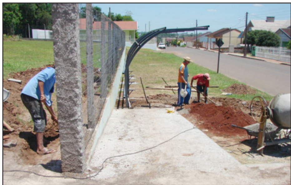
Colocação de abrigo na parada de ônibus defronte à Escola Alfredo Schneider

> Antibióticos - A farmacêutica da Prefeitura de Teutônia informa que os medicamentos antibióticos que fazem parte da lista da Farmácia Básica do Município somente serão entregues nos postos de Saúde com a apresentação de receituário controlado em duas vias. Conforme determina a nova resolução da Agência Nacional de Vigilância Sanitária (Anvisa), os medicamentos dessa classe terapêutica terão um controle mais rigoroso, de modo que a primeira via da receita será retida na farmácia e a segunda via ficará com o paciente. É necessária a apresentação da carteira de identidade da pessoa que está retirando o medicamento.