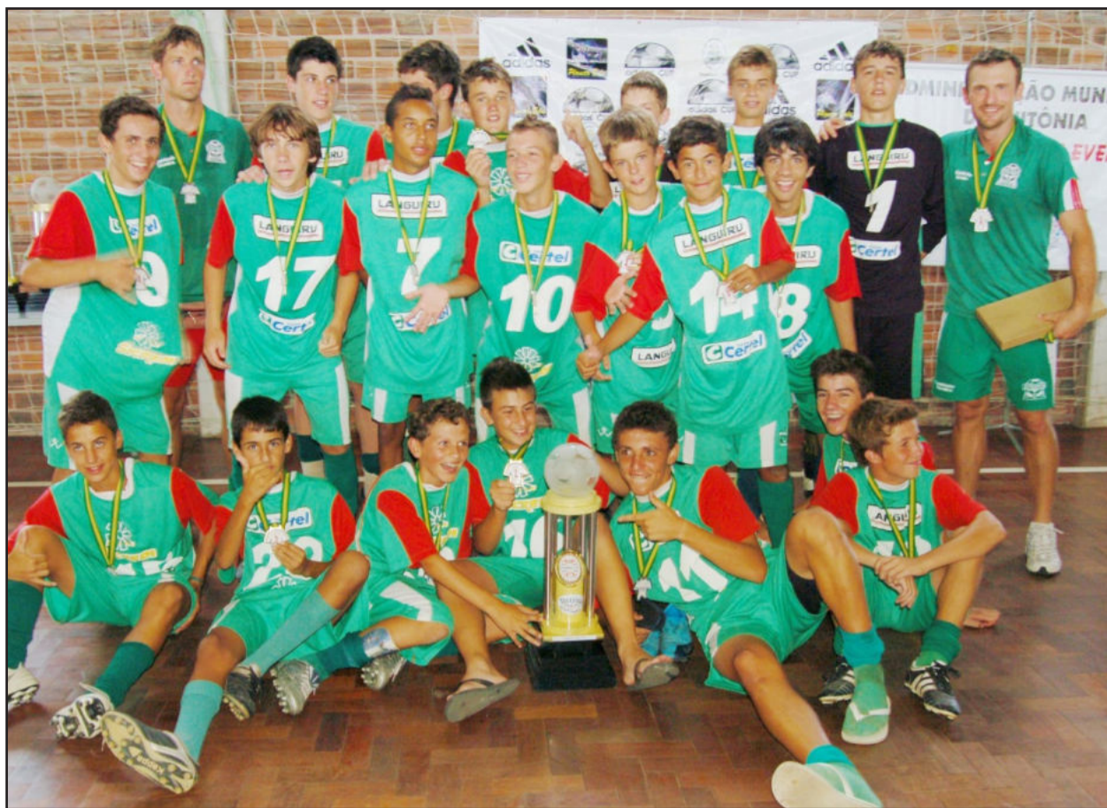
Na edição de 2010, Juventus de Teutônia foi campeão na categoria sub-15 anos