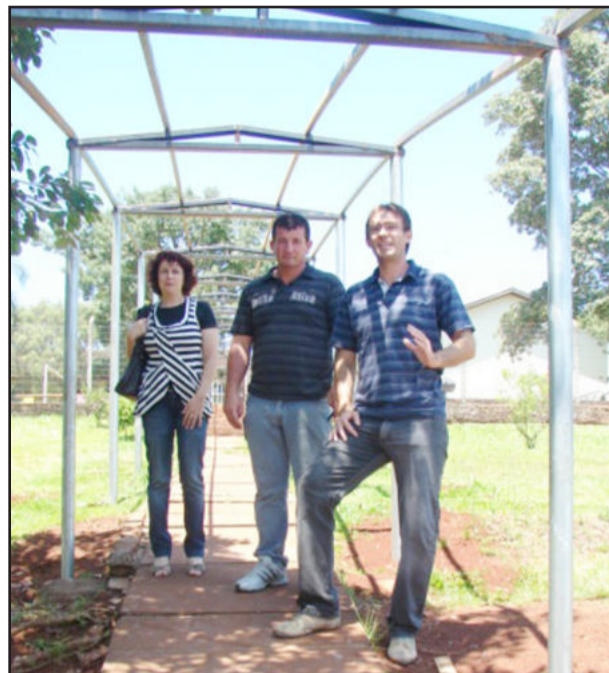
Na Escola Guilherme Sommer é construída uma cobertura para interligar os prédios