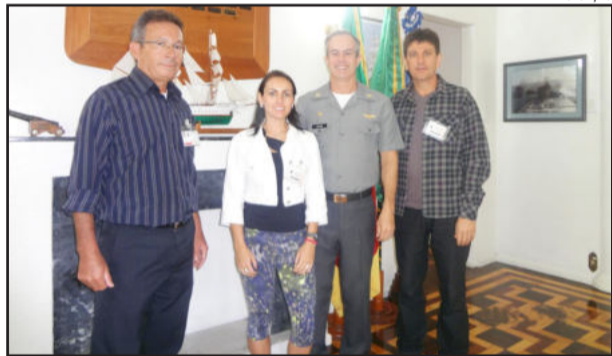
Capitania dos Portos recepcionou equipe de Estrela