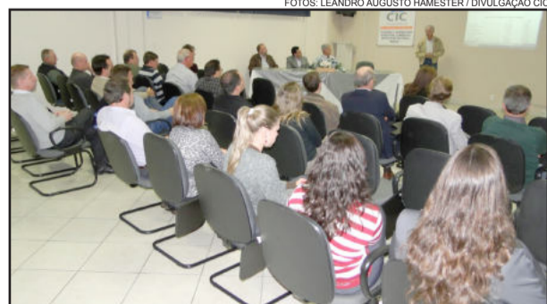
Associados aprovaram prestação de contas da entidade