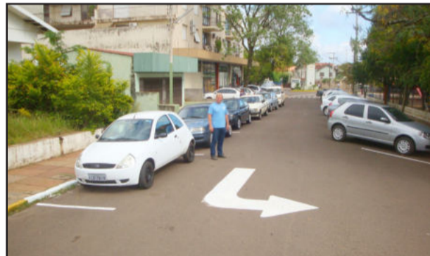
Estacionamento para carros na rua Geraldo Pereira