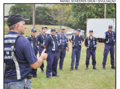
Fiscais estão recebendo treinamento para posteriormente aplicarem em situações reais

serão 30 agentes de trânsito, dando maior segurança aos cidadãos.