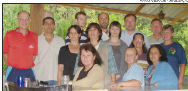
Grupo se prepara para receber bem os turistas

O próximo módulo do curso, "Roteiro, Trilhas e Caminhadas", acontecerá nos dias 2, 3 e 4 de maio. Aulas práticas e teóricas com implantação de uma trilha ecológica. Mais informações junto ao STR de Colinas.