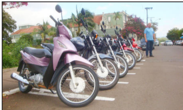
Estacionamento para motocicletas na rua Geraldo Pereira