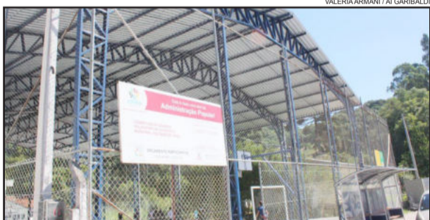
Cobertura da Quadra