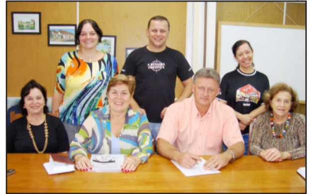
Reunião definiu atividades da 8ª Teutoart