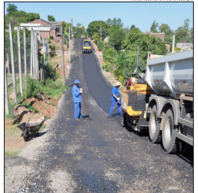
Sosur concluiu pavimentação asfáltica de três vias no Bairro Santo Antônio

Nesta semana foram iniciadas mais quatro obras de pavimentação, sendo duas no Bairro Morro 25 e outras duas no Bairro das Nações, todas com recursos provenientes do Programa Pimes, da Caixa Econômica Federal. Com um investimento de pouco mais de R$ 200 mil, a Rua Maria Francisca dos Santos, no Morro 25, receberá asfalto em seus 453 metros de extensão. Na mesma localidade, a Rua da Divisa será asfaltada desde a pavimentação já existente até a Rua Bernardino Pinto. Serão 380 metros de extensão com um investimento de R$ 198.477,19.