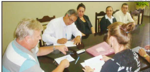
Assinatura da escritura aconteceu no Salão Nobre da Prefeitura