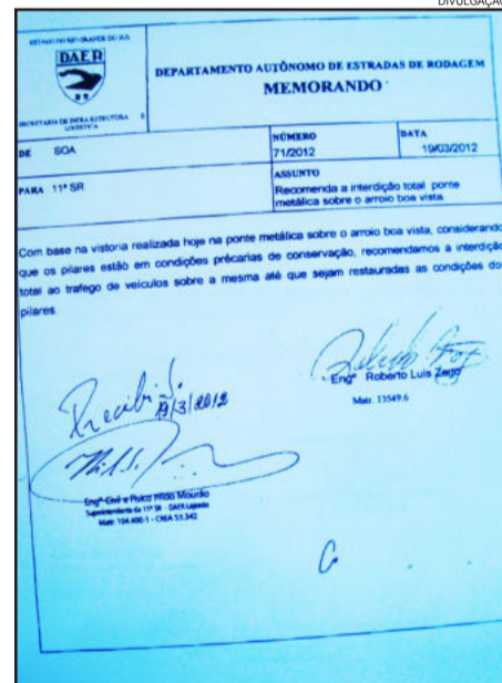
Laudo de vistoria