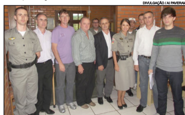
Reunião normatizou uso da câmera, que ficará sob responsabilidade da Brigada Militar

A câmera de videomonitoramento foi doada à Brigada Militar através de uma parceria entre Prefeitura, Banco do Brasil, Consepro e comércio local.