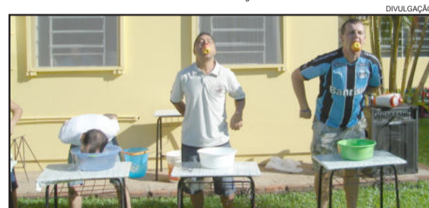
Brincadeiras, como tirar a maçã da água, divertiram o pessoal

"A gincana estava muito divertida, porque todos participaram e interagiram, ampliando os laços entre família e escola", relatam as funcionárias da instituição.