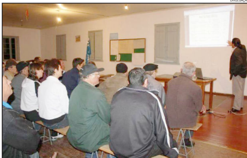
Reunião do orçamento participativo

As reuniões do Orçamento Participativo serão retomadas na segunda-feira, dia 02 de abril, no salão comunitário do bairro Bela Vista II.