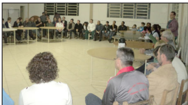
Em reunião nesta semana, partidos da situação definiram coligação