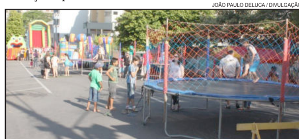
Rua do Lazer era realizada no Centro, e agora será ao lado da Associação dos Motoristas

Junto à Rua do Lazer, o PELC Vida Saudável promoverá também um Aulão de Ginástica, com início previsto para as 15 horas. Na oportunidade, as professoras do PELC ministrarão uma aula de ginástica a todas as pessoas que tiverem interesse. O PELC Vida Saudável é um programa do Ministério do Esporte implantado pela Prefeitura de Garibaldi com o objetivo de oferecer ginástica, lazer e recreação às pessoas com mais de 45 anos.