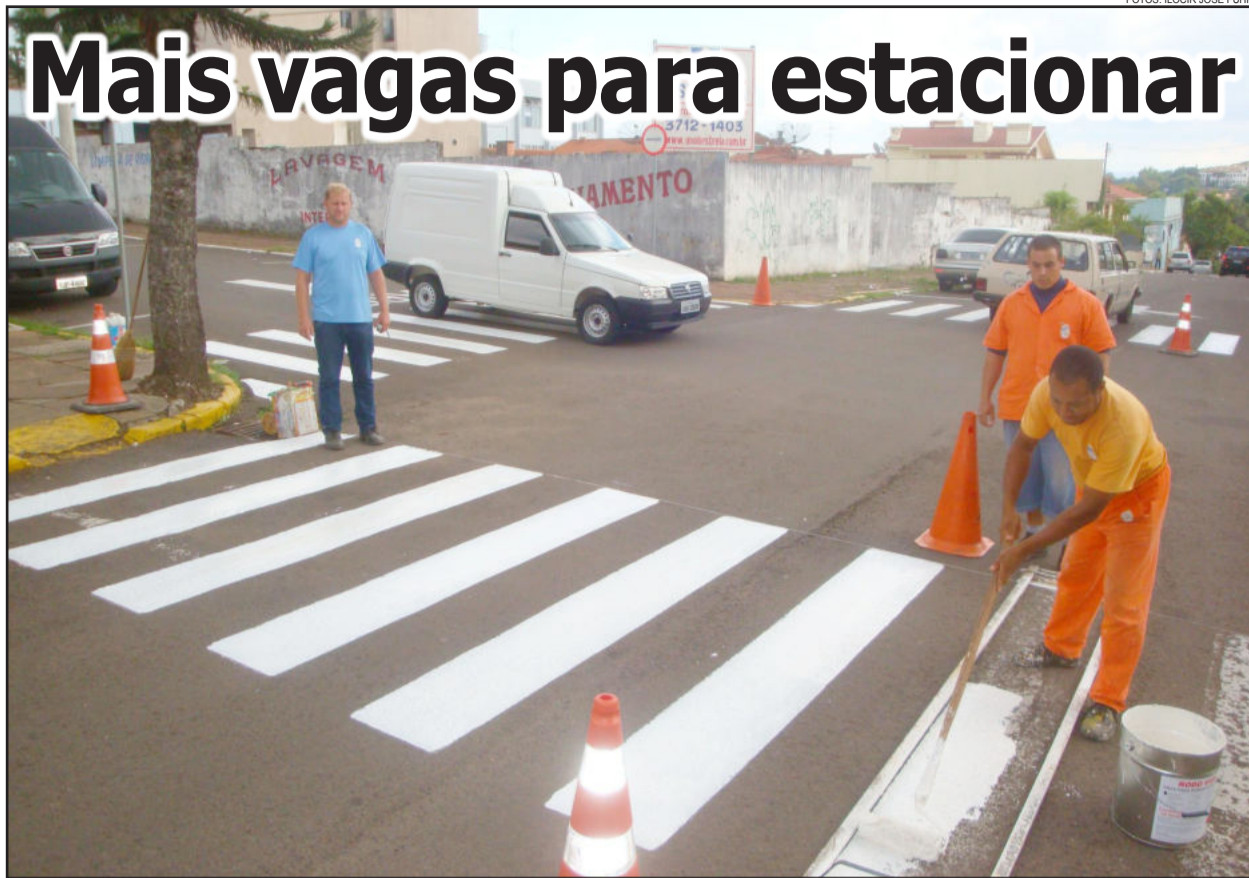
Pintura das faixas de segurança no Centro da cidade

A Prefeitura de Estrela, por meio do Departamento de Trânsito Municipal (Detram), está trabalhando na revitalização da pintura das faixas de segurança. Esta semana, a sinalização horizontal está abrangendo vias públicas do Centro da cidade.