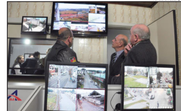
Sala de Monitoramento das câmeras em Carlos Barbosa