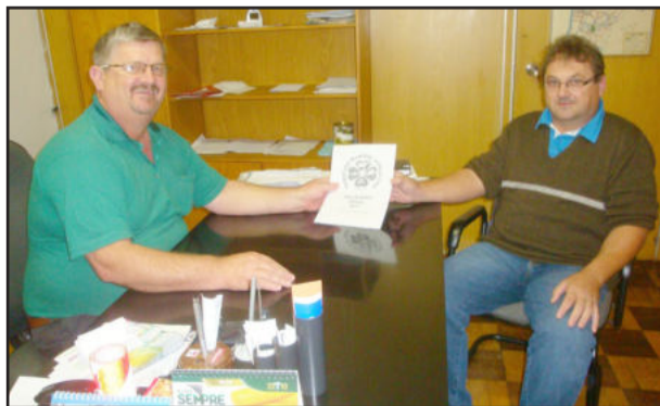
Scheeren (e) e Beuren