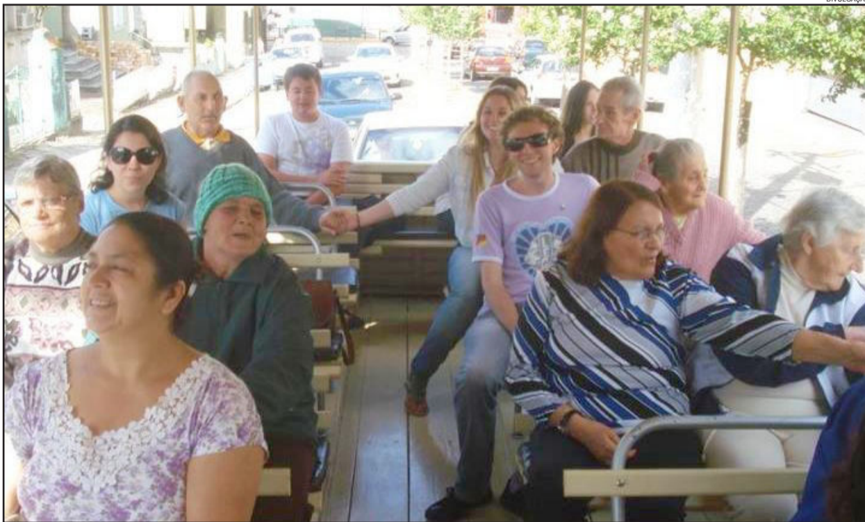
LEO Clube Garibaldi com os idosos da Casa de Repouso Arco Íris

No último sábado, dia 24 de março, o LEO Clube Garibaldi realizou a visita do carinho na Casa de Repouso Arco Íris. A atividade, que fez parte da programação do mês da mulher da APEME, foi muito emocionante. Os companheiros LEO levaram os idosos para um passeio de tim-tim pe-