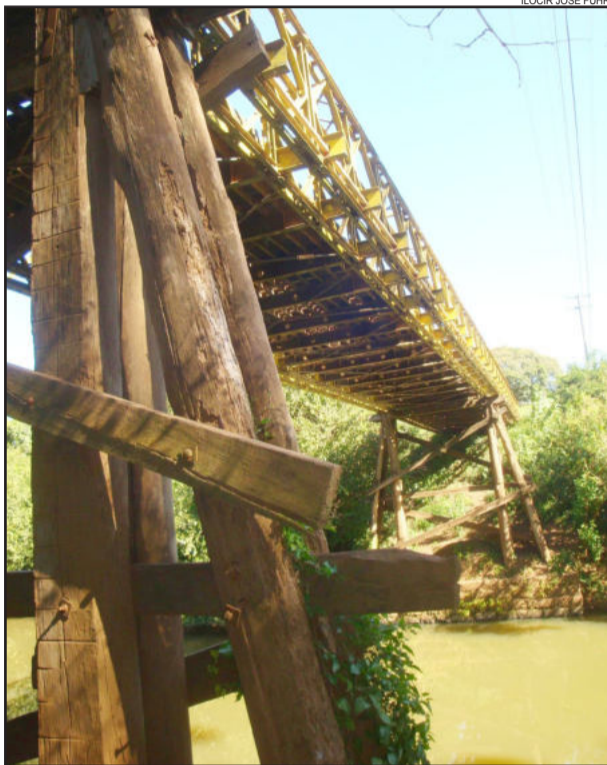
Ponte metálica sobre o arroio Boa Vista