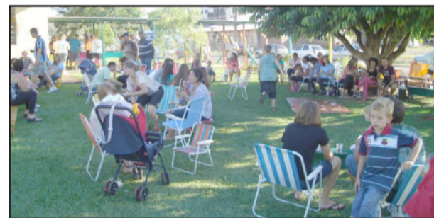
Integração entre pais, alunos, professores e funcionários marcou a gincana da Escola Girassol