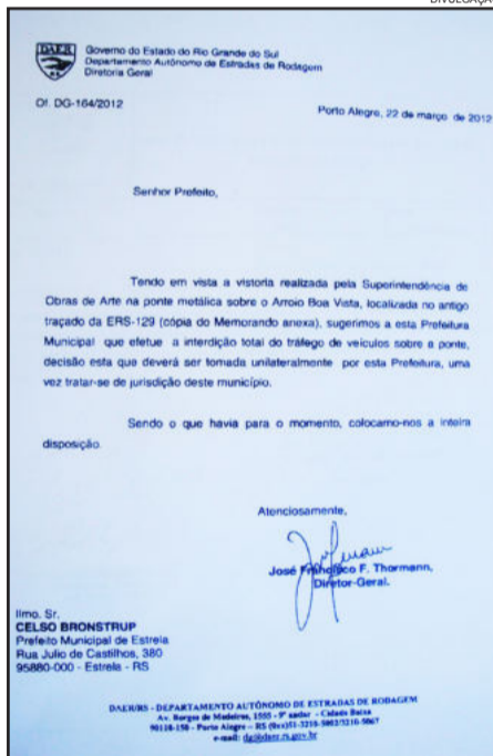
Ofício enviado pelo Daer