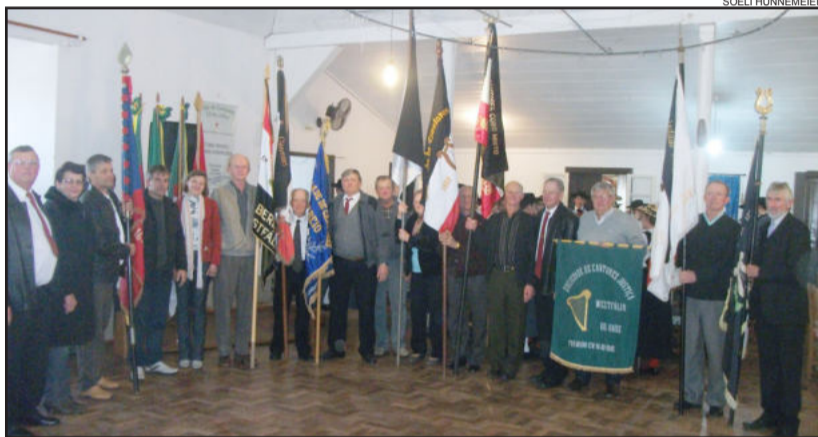
Hora cívica lembrou o legado do canto coral deixado pelos colonizadores