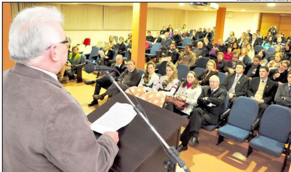
Grande público prestigiou o lançamento do novo roteiro turístico

Projeto promove turismo vivencial e leva visitantes a experiências diferenciadas