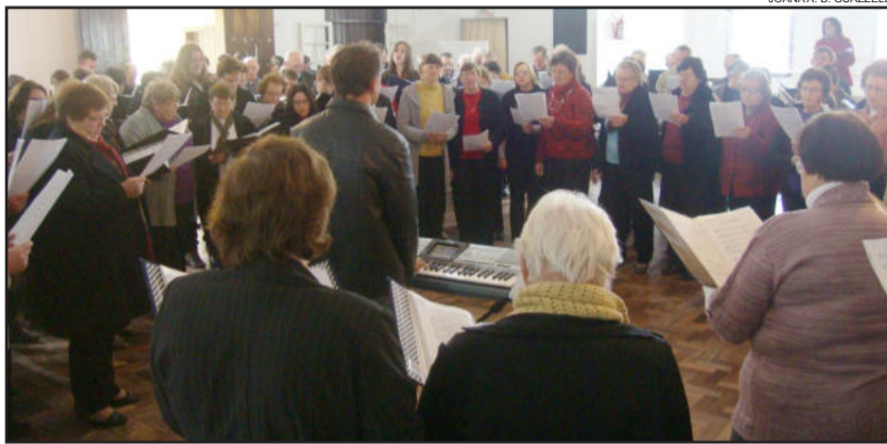
Coros se apresentaram em grande grupo e individualmente

Cantores 25 de Julho é realizado anualmente, com a participação dos coros filiados e sempre um destes é o anfitrião do evento. O objetivo é celebrar a passagem do Dia do Colono, como uma homenagem aos antepassados que deixaram a cultura do canto coral como legado.