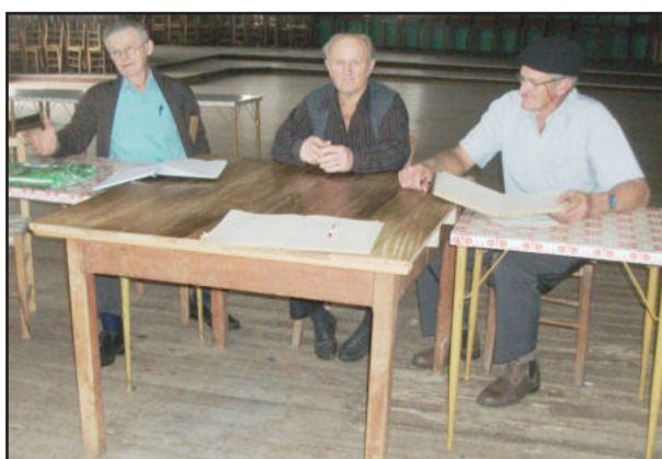
Catarinense realizou Festa Anual neste domingo, com assembleia