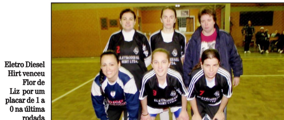
Eletro Diesel Hirt venceu Flor de Liz por um placar de 1 a 0 na última rodada