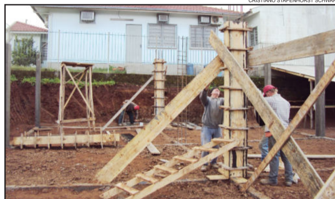
CRISTIANO STAPENHORST SCHWARZ