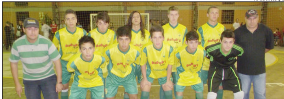
Aldeia São José, categoria Sub-18, enfrenta Guaíba na próxima sexta-feira