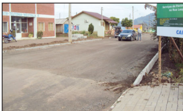
Asfalto na Rua Leopoldo Grave