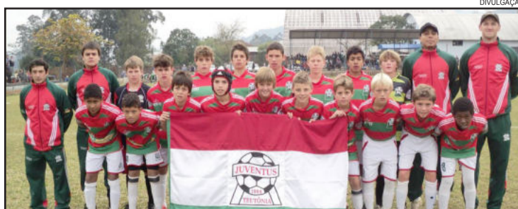
Juventus "B" 99/00 foi o campeão da categoria

A direção e coordenação da AERC Juventus parabeniza todas as categorias que trouxeram um título de cam- peão e dois vices para a instituição Juventus, e igualmente cumprimenta a todos os alunos que souberam mais uma vez vestir com orgulho a camisa da Juventus.