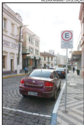
Vagas para Idosos