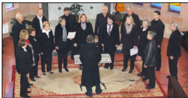
Coral Municipal elogiado com a canção "Ameno"