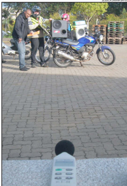
Aferição de som dos veículos da 125ª ZE ocorreu nesta segunda-feira, dia 30

Somente poderão participar da campanha de som nas ruas os veículos devidamente registrados, com os condutores identificados. A medida vale para os municípios de Teutônia, Westfália, Imigrante, Paverama e Poço das Antas. Carros com som exagerado ou veículos não cadastrados que estiverem circulando com som de campanha podem ser multados e recolhidos pela Brigada Militar, conforme determinado pela juíza eleitoral.