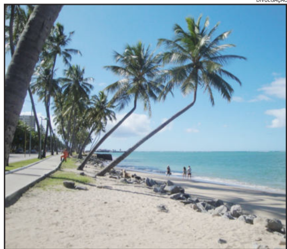
Praia Ponta Verde, em Maceió