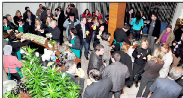
Lançamento do Projeto Trilhas e Trilhos