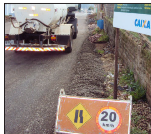
Asfalto na Rua Reinoldo Dahmer