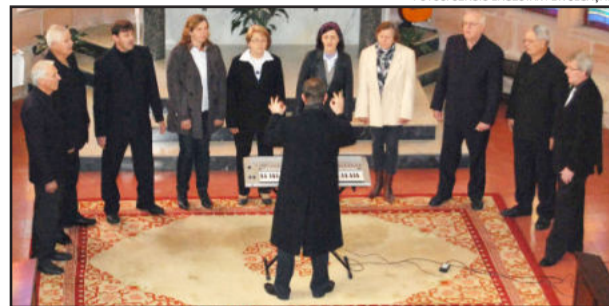
Coral Vozes de Imigrante

Os coralistas que participaram do tradicional Encontro Municipal de Corais de Imigrante foram unânimes em afirmar que o deste ano foi um dos mais qualificados.