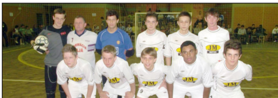
Em outro confronto da Sub-18, Renegados/F. Jajá enfrenta Bel Verde NW