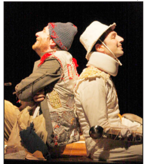
Teatro será na Soges

R$20,00 para público geral (50% desconto para estudantes, idosos, clientes Unimed e Sócios da Soges)