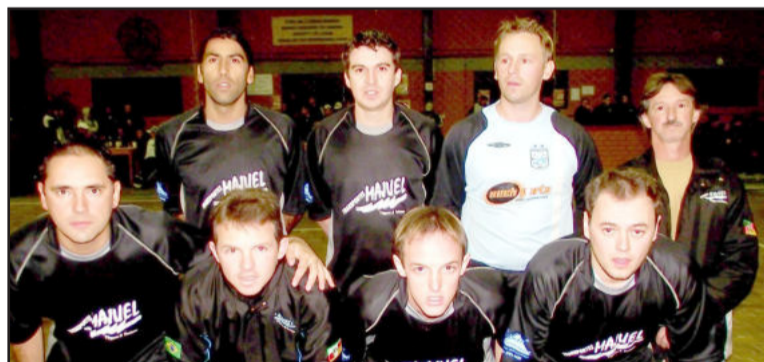
Trans MAJUEL joga contra o Inter-SM na próxima rodada pelo Força Livre