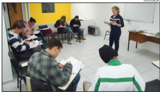
Aulas de alemão do Centro Cultural 25 de Julho aperfeiçoam o idioma

Aprender alemão ou aprimorar o seu conhecimento neste idioma é muito importante. Após um primeiro semestre de muito aprendizado, as aulas de alemão promovidas pelo Centro Cultural 25 de Julho, de Languiru, reiniciam suas atividades com novos grupos neste segundo semestre de 2012.