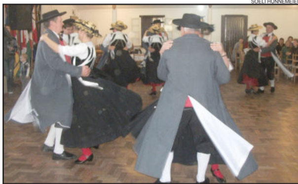
Grupo de danças fez apresentação