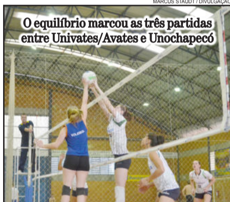
O equilíbrio marcou as três partidas entre Univates/Avates e Unochapecó

Hora: 18:00 - Local: Complexo Esportivo Univates - Lajeado