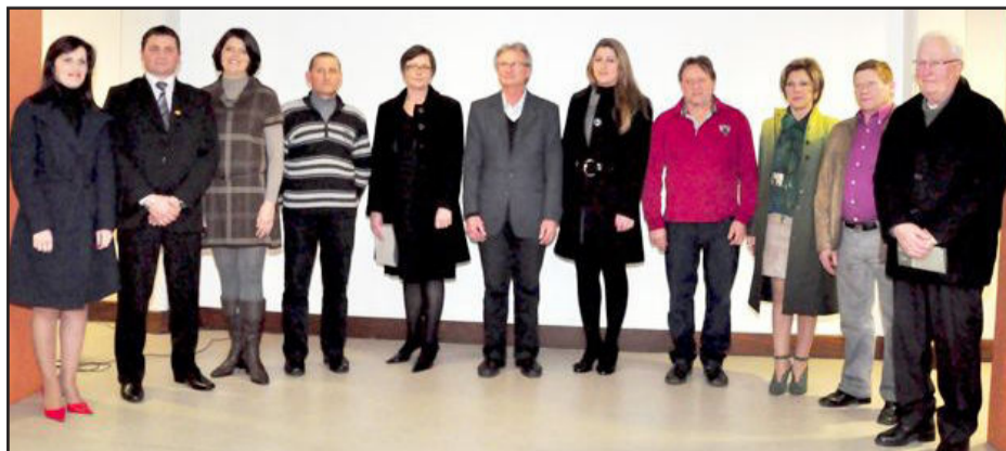
Integrantes dos roteiros