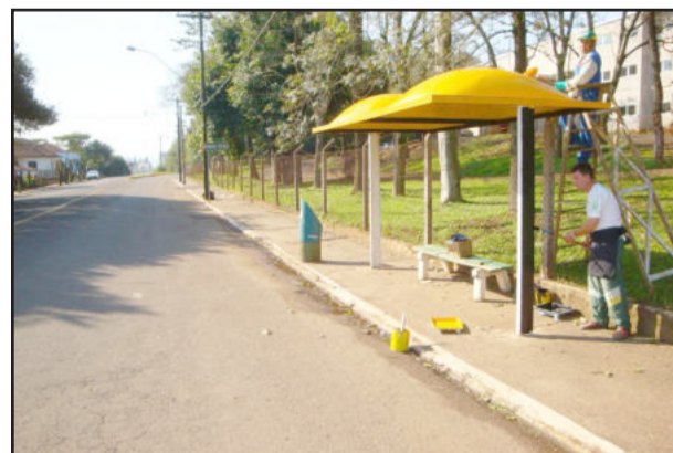
Locais recebem lavagem, pintura e substituição de assento