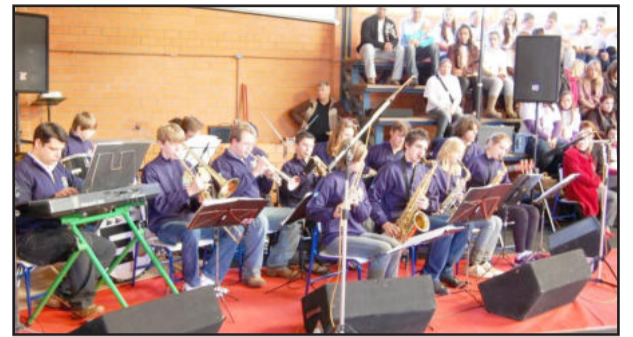
Alunos realizando apresentação musical

No dia 14 de julho, o Grupo de Prática de Conjunto das