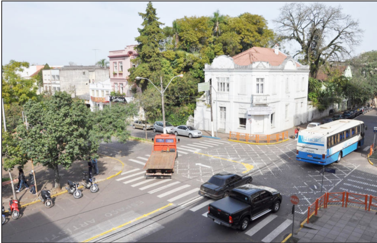
Júlio de Castilhos passou a ter dois sentidos em frente à Praça da Matriz