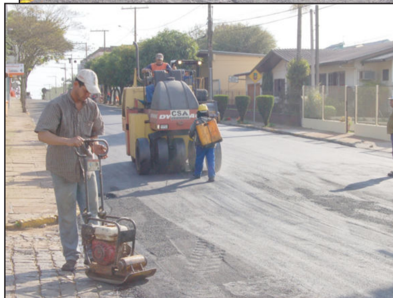
Capeamento asfáltico das ruas de Languiru