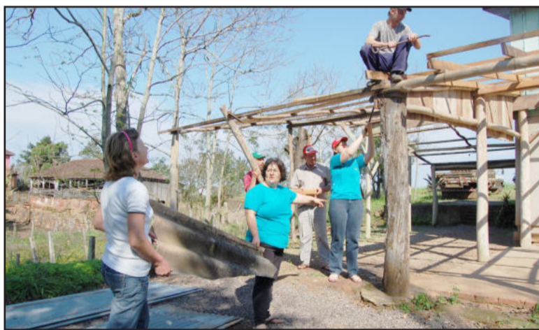
Comunidade fez mutirão auxiliando na reconstrução da antiga sede