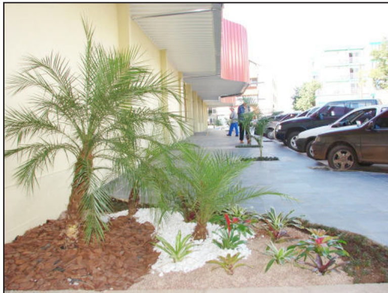
Jardinagem e espaço para circulação de pessoas