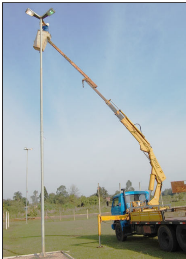
Luminárias foram consertadas