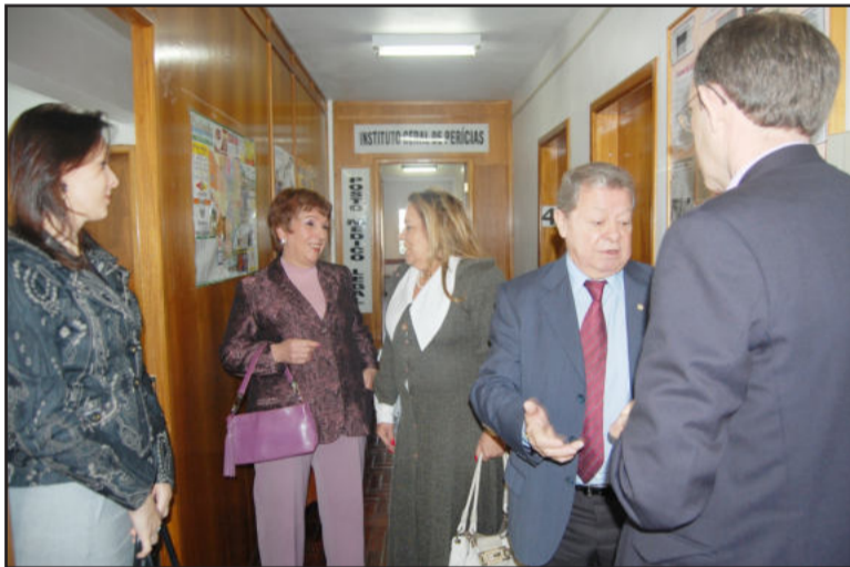
Após solenidade, grupo conheceu as instalações da Delegacia