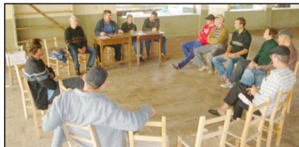
Penúltimo encontro do ano reuniu moradores da localidade da Linha Figueira