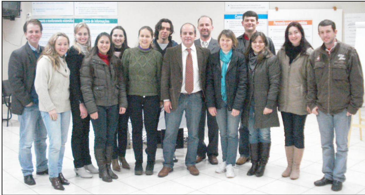
Formação contou com a participação de 13 pessoas

No mês de julho, de 19 a 24, a Câmara de Indústria e Comércio (CIC) de Teutônia, em parceria com o Sebrae/RS, promoveu a terceira edição do Seminário Empretec em Teutônia. A formação contou com a participação de 13 pessoas e focou valores como espírito de liderança, iniciativa, criatividade e capacidade de motivação como fundamentais para o sucesso em qualquer setor.