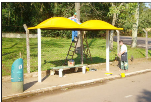
Trabalhadores da Secretaria atuando na reforma

pontos que recebem melhorias. Destes, 10 devem ser substituídos por uma estrutura totalmente nova. O valor total do investimento é de R$ 60 mil.