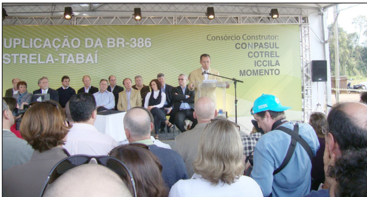
Ministro dos Transportes (ao microfone) prestigiou a solenidade em Estrela

Visando a Copa do Mundo de 2014, o prefeito de Porto Alegre, José Fortunati, também aproveitou para assinar, junto ao ministro das Cidades, Márcio Fortes, financiamentos de recursos para 10 obras de mobilidade urbana e na área de saneamento básico, no valor de R$ 480 milhões. “Queremos aproveitar para transformar a cidade de Porto Alegre, não somente para atender os turistas durante este grande evento, mas deixando um grande legado para os seus cidadãos. Recursos estes que vão marcar vida da nossa cidade. E, assim, seremos uma das melhores cidades-sede de 2014, com geração de renda e emprego. Mas o evento não será somente de Porto Alegre, mas de todo o Rio Grande do Sul”, ressaltou Fortunati. Os municípios de Novo Hamburgo, Bento Gonçalves e São Leopoldo também assinaram convênios para programas de habitação e saneamento.