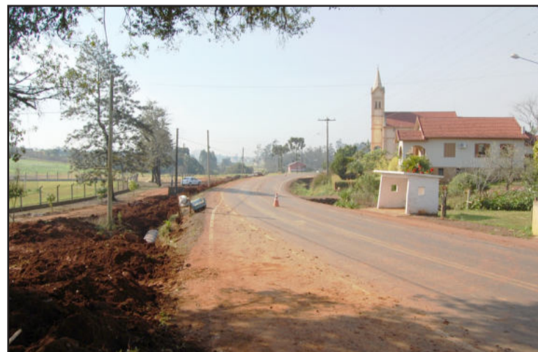
Obra visa segurança de pedestres