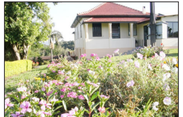
Jardim do interior de Colinas

Colinas ostenta o título Cidade Jardim, honraria esta conferida pela Lei Estadual nº 13.390, de 11 de março de 2010. Além desta importante distinção, através de um concurso em nível estadual, promovido pelo Governo do Estado do Rio Grande do Sul e a FAMURS - Federação das Associações dos Municípios do Rio Grande do Sul, Colinas foi escolhida no ano de 2010 como a