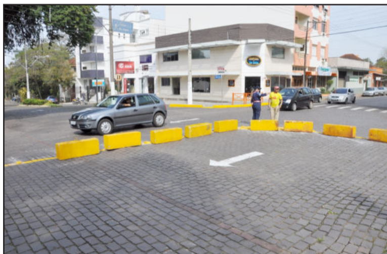
Marechal Deodoro tem preferência no cruzamento com a Júlio de Castilhos