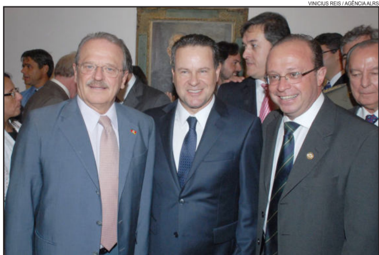
Gov. Tarso Genro, Dep. Alexandre Postal e Dep. Adão Villaverde

Lembremos do exemplo do Reino Unido. Em todo o transcorrer da 2ª Guerra Mundial, seu Primeiro-Ministro Churchill comparecia regularmente à Câmara dos Comuns para explicar o conflito, seus planos e a execução orçamentária do Governo. Isto é democracia. Isto é o Estado de Direito", enfatizou Postal. O discurso completo de Postal pode ser conferido na internet, no espaço de notícias do site da Assembleia Legislativa.