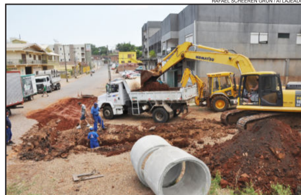
Canalização pluvial da Rua Donga Menezes evitará alagamentos em dias de enchurradas