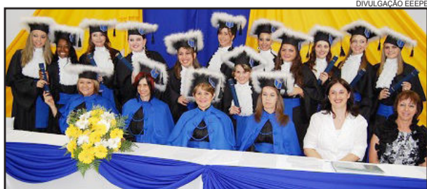
Formandos do Técnico em Secretariado