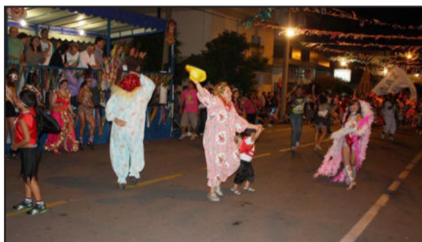
Bloco Taz Tehuco, no desfile de 2011

A programação inicia às 21h, com o desfile de quatro blocos carnavalescos de Garibaldi pela Avenida Presidente Vargas, na seguinte ordem: Juventude Acumulada; Taz Tehuco; KGB Máfia; e Os Kakedo. A concentração dos blocos acontece na rua Jacob Ely, e a chegada, na Praça Loureiro da Silva. Após, na Praça, acontece show com a banda Tri Legal.