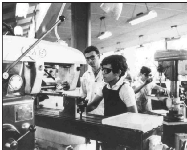
Senai - A atenção do professor no trabalho do aluno - Foto Senai Anchieta, na década de 50

Surgiu, assim, há 70 anos, o Senai. Já na ocasião, estava claro que sem educação profissional não haveria futuro industrial para o País. No entanto, desde sua criação, muita coisa mudou. Da escola formadora de mão de obra especializada a organização passou a ser um pólo nacional de geração e difusão de conhecimento e poderoso