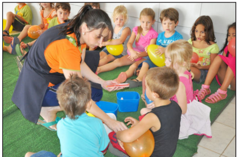
Pequenos prestaram atenção à história contada pela professora

mesmo os mascotes. "Um dos escolhidos foi um pintinho, que só parava de piar quando as crianças estavam por perto", divertiu-se ela, completando que as turmas também adotaram peixes e codornas.