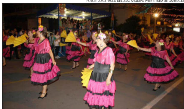
Bloco Juventude Acumulada, no desfile de 2011