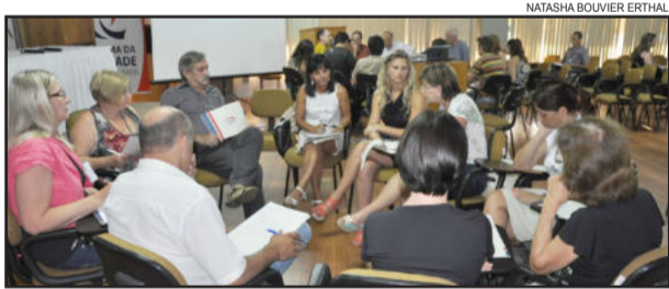
Cada Eixo Temático teve a oportunidade de criar até 25 propostas