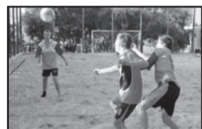
Finais do Campeonato de Futebol de Areia acontecem hoje

A grande final do Campeonato de Futebol de Areia acontece hoje, a partir das 13 horas, no Areião do Centro de