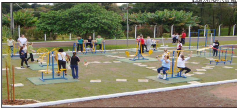
Ginástica Municipal retorna na segunda-feira

A ginástica tem como objetivo proporcionar aos participantes uma orientação para o melhor desenvolvimento e aproveitamento do exercício praticado, contribuindo, dessa maneira, para uma melhor qualidade de vida.