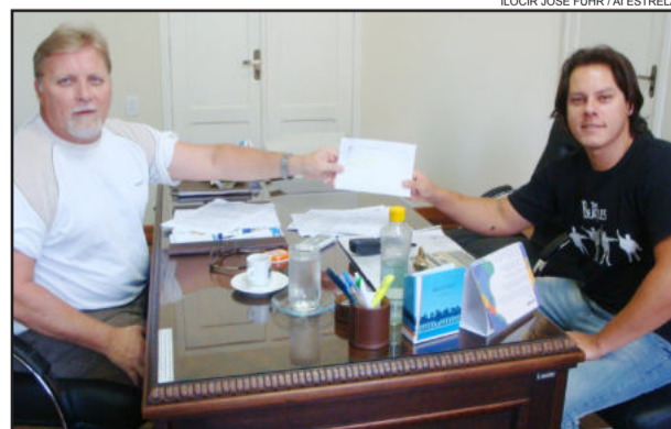
Prefeito Celso Brönstrup (e) e Marcelo Fortes (d)

O objetivo da concessão do auxílio é custear a manutenção das atividades do Núcleo Cultural, como a realização de cursos de música instrumental, eventos culturais, oficinas de artes cênicas, artes plásticas, coral municipal, escola de danças, idiomas e outras atividades desenvolvidas junto ao Centro de Cultura e Turismo Bertholdo Gausmann.