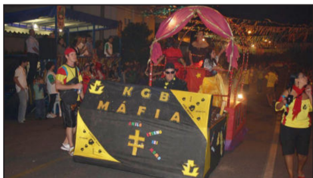
Bloco KGB Máfia, no desfile de 2011

A Prefeitura de Garibaldi, através da Secretaria Municipal de Turismo, está organizando mais uma edição do Carnaval de Rua. A folia em 2012 acontece no sábado, dia 18 de fevereiro, na Avenida Presidente Vargas e na Praça Loureiro da Silva, com show e desfile de blocos.