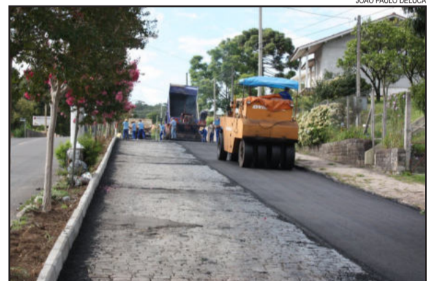
Asfalto avança pela Buarque de Macedo

A previsão de conclusão da obra de reconstrução da Buarque de Macedo é para o mês de março. O investimento da Prefeitura é de R$ 2,5 milhões, somente com recursos próprios do Município.