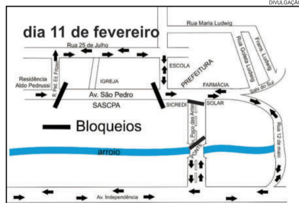
Trânsito mudará no Centro de Poço das Antas

No dia 06 de março realiza-se o Encontro das Mulheres em homenagem ao dia da Mulher com uma programação especial para elas no auditório da Prefeitura Municipal com recepção às 13h30min.