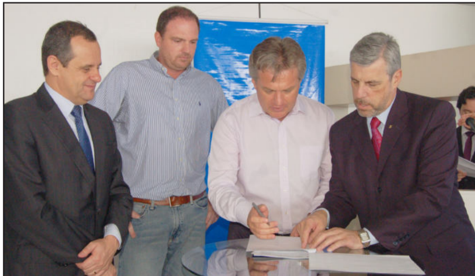
No dia 26 de janeiro, Teutônia e Caixa firmaram parceria para a construção de 128 casas no Loteamento Morada do Sol

Num exemplo de uma família que pagará R$ 50,00 por mês, ao final dos 120 meses pagará R$ 6 mil. Se a casa custa R$ 45 mil, o governo federal arca com os outros R$ 39 mil, que serão a fundo perdido, ou seja, não serão cobradas nem da família nem do Município.