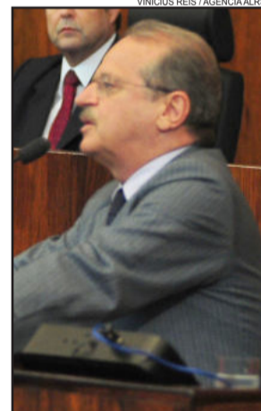
Tarso Genro falou aos deputados na abertura dos trabalhos legislativos deste ano

O movimento de captação junto ao mercado financeiro global feito pelo