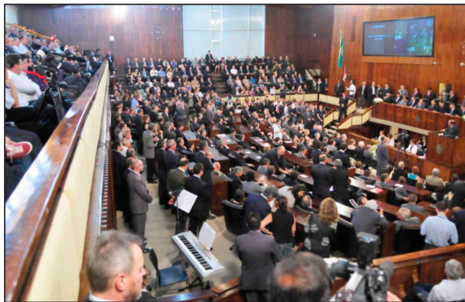
Plenário 20 de Setembro, do Palácio Farroupilha, esteve lotado na sessão de posse de Postal

Ele agradeceu a todas as bancadas da Assembleia, em especial, a do Partido dos Trabalhadores, sua sigla. Também agradeceu aos servidores da AL, e a sua equipe, pelo trabalho que desenvolveram ao longo de 2011. “A principal conquista foi recolocar o papel deste Parlamento numa condição que outrora ele já ocupou, ou seja, de estar no centro das grandes questões, dos grandes debates, e imprimir, do ponto de vista da relação com os outros Poderes, com a sociedade, com os mais variados setores da socieda-