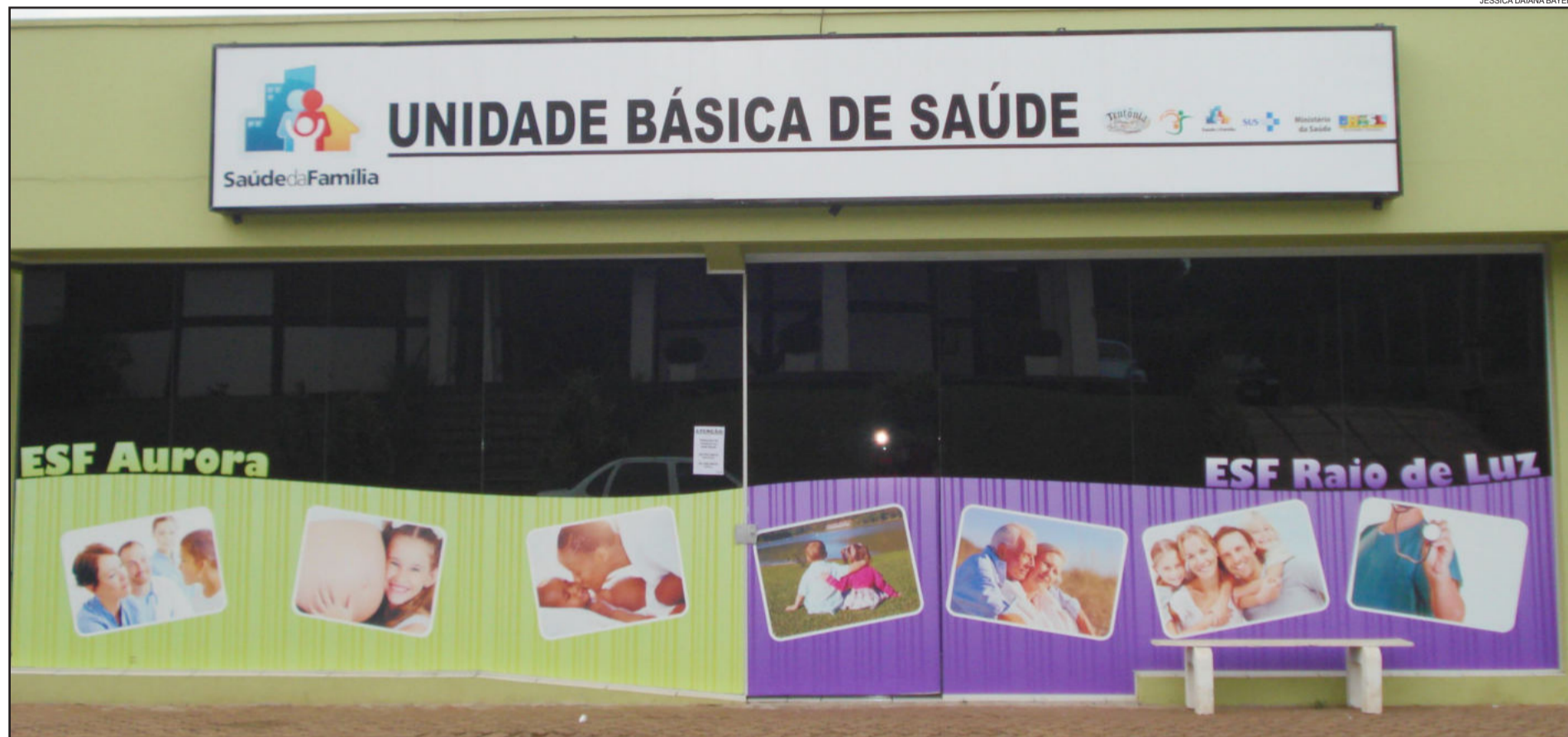
ESF's Aurora e Raio de Luz funcionam em Canabarro e atendem cerca de 6 mil pessoas

E m funcionamento há 1 ano, a duas primeiras equipes de Estratégia de Saúde da Família (ESF) de Teutônia foram muito elogiadas pelo público que utiliza o serviço. A implantação ocorreu no dia 26 de janeiro de 2011, e após completar 1 ano de atendimento a população aprova a mudança.