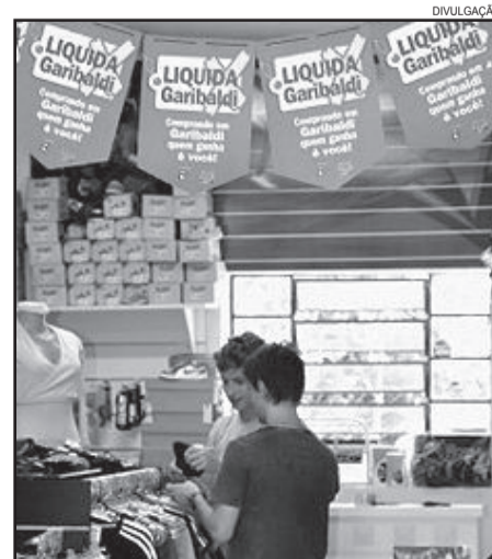
Liquida Garibaldi segue até 15 de fevereiro para aquecer o comércio