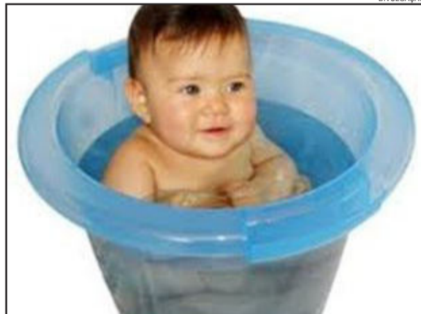
Ofurô é recomendado para bebês de 1 mês a 6 meses

Mulheres interessadas em aprender a utilizar devem se inscrever até o dia 11 de fevereiro, no Posto de Saúde de Colinas. Após, será agendada uma data para realização da atividade e esclarecimentos com a fisioterapeuta Cris.