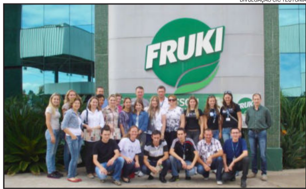
Curso foi encerrado com visita técnica à empresa lajeadense

Já no dia 27 ocorreu visita técnica à empresa Fruki, de Lajeado, oportunizando aos participantes a formação teórica e a possibilidade de observar in loco como as principais ferramentas de gestão da qualidade são implantadas na indústria.