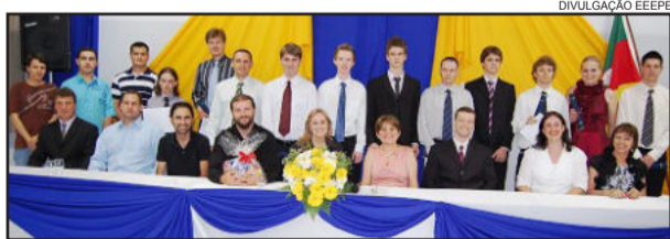
Formandos do Técnico em Informática

Os alunos de ambos os cursos são oriundos dos municípios de Estrela, Bom Retiro do Sul, Lajeado, Teutônia e Fazenda Vilanova. Os novos técnicos já atuam como profissionais em órgãos públicos e privados de nossa região.