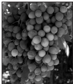
Ibravin projeta quebra de 20% na safra de uva no Rio Grande do Sul