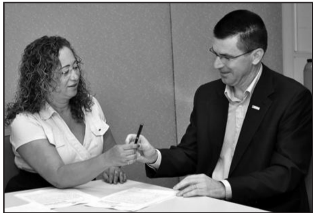
Presidente da Atuaserra assina convênio para sinalização turística na Serra Gaúcha