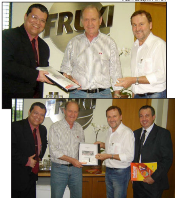
Município de Garibaldi candidatou-se a receber a nova indústria da Bebidas Fruki