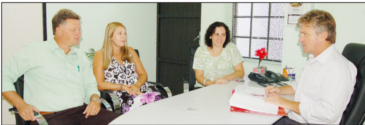
Altmann (d) deu início ao processo de licitação para o Posto de Saúde do Loteamento 8 e 9

Prevista a construção de unidade nova no Loteamento 8 e 9, e a ampliação do posto de Languiru