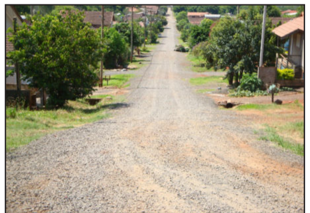
Rua receberá camada asfáltica

A obra exigirá um investimento de R$157.182,00. Desse total, R$124.903,90 serão utilizados na aquisição dos materiais e os demais R$32.278,10 serão investidos nos serviços de mão-de-obra. Do total da obra, R$ 98.200,00 são provenientes do governo federal, do Orçamento Geral da União (OGU). Já os demais R$ 58.982,00, dizem respeito à contrapartida do Município.