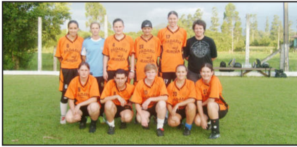
Arroio do Meio/Padaria Aurora