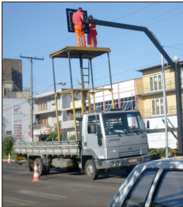
Instalação de semáforos

Depois de alterar o sentido de algumas ruas no Centro de Lajeado, percebe-se a necessidade de fazer as demais alterações, indispensáveis para o trânsito fluir normalmente. Em algumas ruas, o controle do tráfego ainda está por conta dos fiscais de trânsito, devido à falta de sinaleiras, como no caso da Avenida Senador Alberto Pasqualini, onde estão sendo colocados os semáforos que ainda faltam.