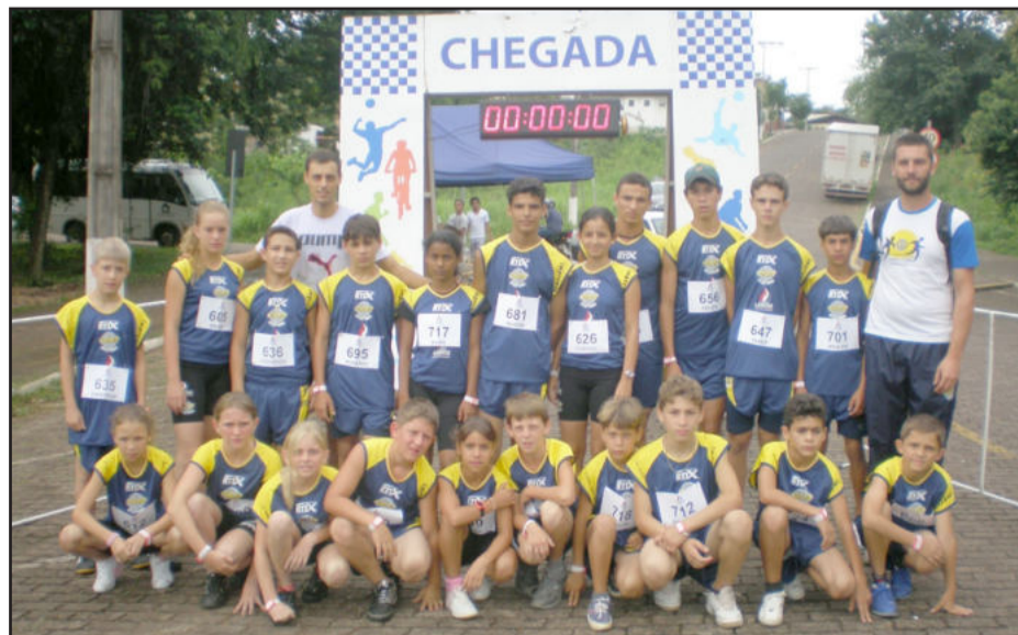
Atletas competiram na Rústica de Natal em Lajeado

Em 2009, a Associação de Atletismo dos Vales esteve também presente na Rústica de Natal de Lajeado. A Associação conta com a parceria da Prefeitura de Lajeado, Prefeitura de Cruzeiro e o Colégio Evangélico Alberto Torres.