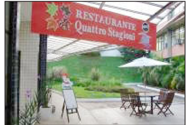
Restaurante abriu segunda-feira

Na noite da segunda-feira, dia 1º de março, foi inaugurado o Restaurante Quatro Estagioni, que se encontra no prédio 9 da Univates. Reformulado e agora com novos proprietários, o estabelecimento atende de segunda a sábado. Ao meio-dia as opções são buffet por kilo, buffet livre e prato econômico (que inclui refrigerante). Para a janta há ala minuta com carne bovina, frango ou peixe, além de porções variadas (batata frita, polenta, aipim frito, iscas de peixe, frango à passarinha, frios etc.) e a opção "monte seu prato".