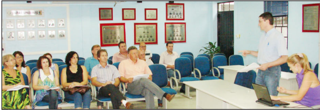
Prestação de contas é exigida pela Lei de Responsabilidade Fiscal

A administração municipal realizou na semana passada a audiência pública de prestação de contas do terceiro quadrimestre e de todo o exercício de 2009, uma exigência da Lei de Responsabilidade Fiscal, com o demonstrativo do cumprimento das metas fiscais estabelecidas na Lei de Diretrizes Orçamentárias (LDO) e na Lei Orçamentária Anual (LOA) para o exercício. No encontro, a Secretaria da Fazenda apresentou o balanço financeiro geral, que mostrou a eficiência na gestão dos recursos, principalmente face aos efeitos da crise mundial, à expectativa de reduções nos repasses do Estado e da União, bem como a dívida assumida