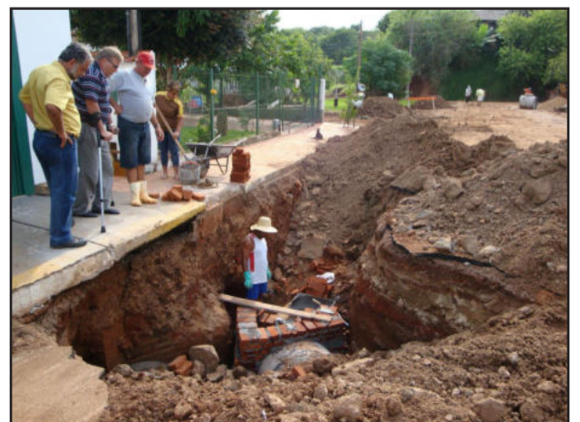
Obras de drenagem sanaram problemas de inundação em residências