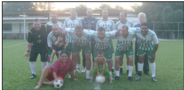
Amigos do Baixinho e do Jajá