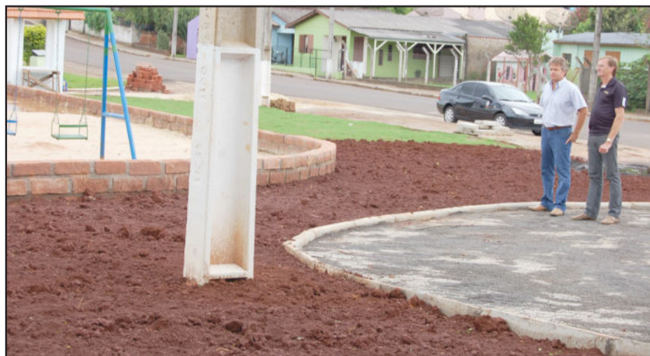
Revitalização do Parque Poliesportivo é uma obra importante no segmento de lazer

A primeira etapa da revitalização do Parque Poliesportivo