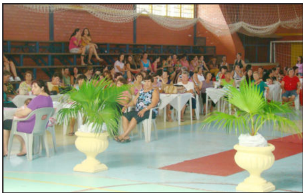
Evento será neste sábado

O 2º Encontro "Só para elas" vai comemorar a data especial do Dia Internacional da Mulher, será realizado neste sábado, dia 6 de março, no ginásio de esportes da cidade, com início às 14h. A programação do evento já está definida e contará com diversas surpresas para as mulheres presentes. Entre as atrações previstas estão o "Cantinho da Saúde", sorteio de brindes, coquetel e um show surpresa.