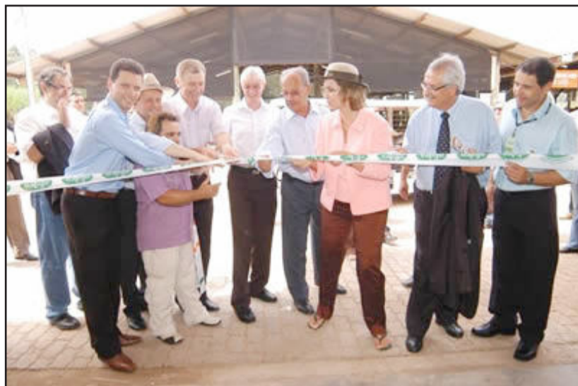
Abertura oficial foi ontem de manhã

Giovani Cherini, presidente da Assembleia Legislativa, colocou que está encantado com o crescimento e desenvolvimento do Vale do Rio Pardo e que a feira é uma mostra disso. Salientou o trabalho válido e de base da Afubra em prol dos mais de 100 mil fumicultores. Cherini defendeu a necessidade de o Estado crescer