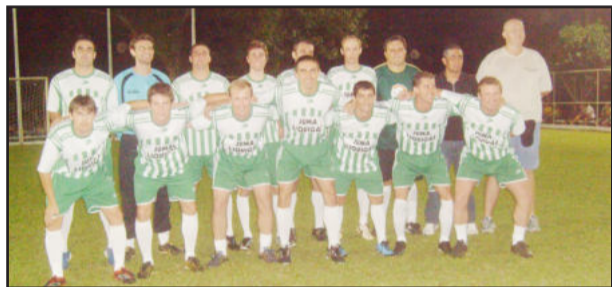
Juma Liquigás/Telsoni/Construtora Selbrack