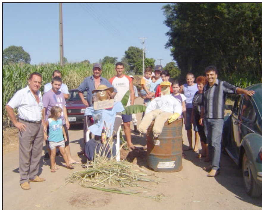
Moradores bloquearam a estrada

Moradores de Posses interromperam a estrada geral, na divisa entre os municípios de Fazenda Vilanova e Paverama, na tarde desta segunda-feira. Os moradores estariam insatisfeitos com o estado de conservação da via. Segundo eles, a administração de Fazenda Vilanova estaria demonstrando descaso com situação. Alegam que faz tempo que estariam esperando pela recuperação da estrada. Insatisfeitos, interromperam a via e confeccionaram o boneco "Zé buraco". À tarde, foi preciso que a Brigada Militar do Município intervisse e liberasse a estrada. Os moradores somente concordaram mediante a promessa do secretário de Obras de a que mesma receberia a atenção necessária a partir de hoje, quinta-feira, dia 4.