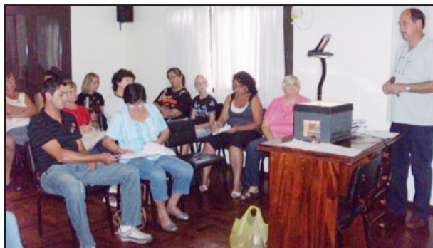
Reunião ocorreu na semana passada

Foi posto em discussão o receio de iniciar esse negócio, mas chegou-se a um consenso de que é preciso tirar essas ideias do papel e botá-las em prática. Para o recolhimento dos produtos, que são na maioria cultivados no interior,