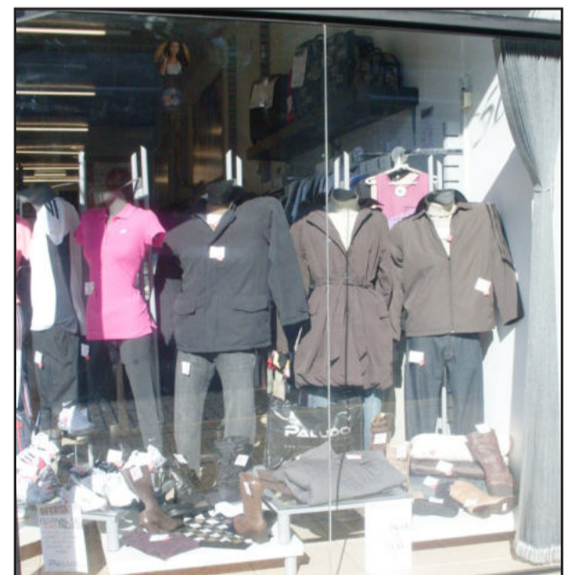
Roupas de inverno nas vitrines