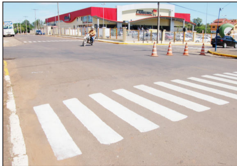
Pintura de faixas de segurança defronte ao Supermercado Languiru

O Departamento de Trânsito projeta melhorias em outras ruas e travessias de grande fluxo no Município.