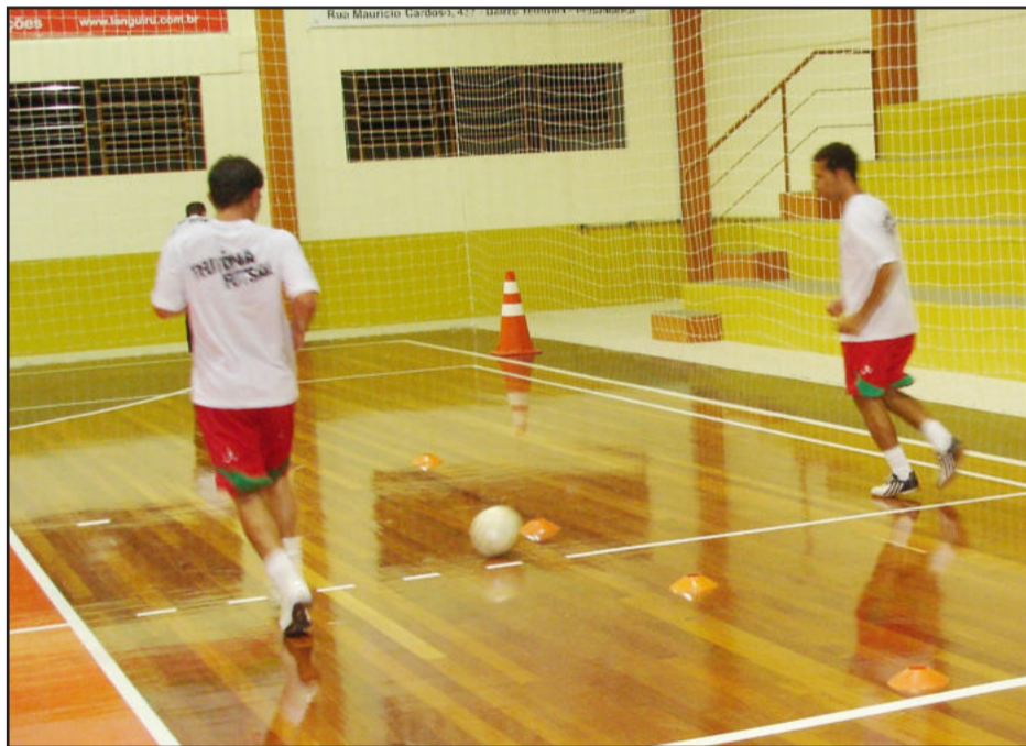
Atletas fizeram trabalhos intensivos no complexo esportivo do Colégio Teutônia