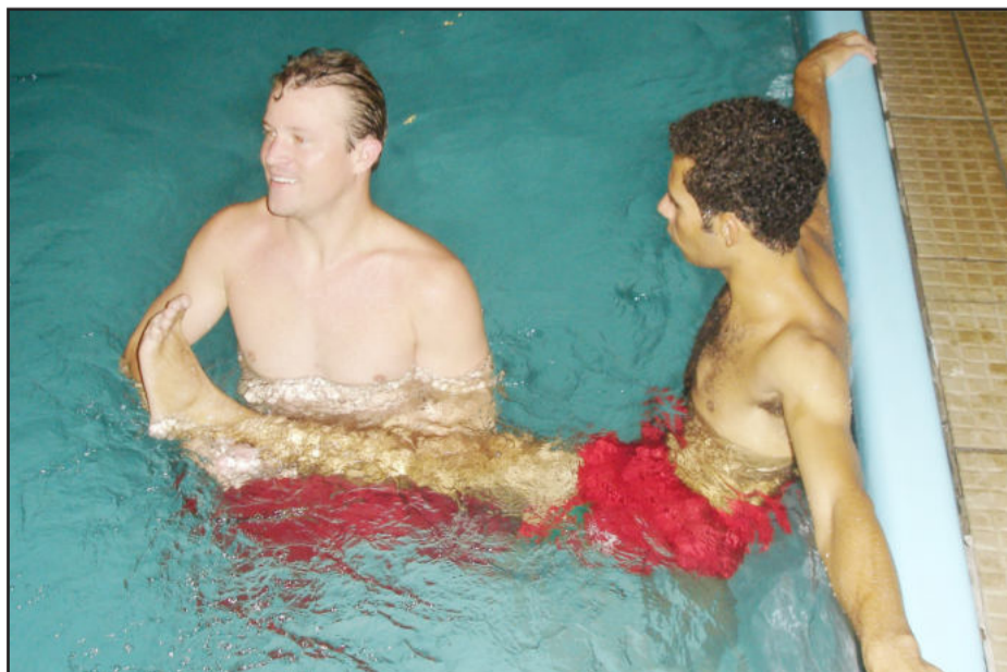
Atletas fizeram trabalho de relaxamento muscular na piscina