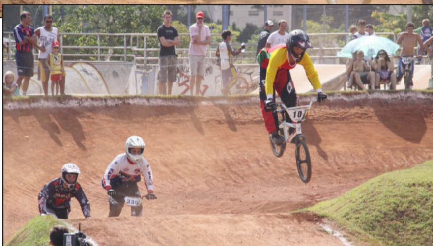
Primeira etapa revelou grande melhora no nível dos atletas

Estrela sediou no último domingo, dia 28 de fevereiro, a abertura do Campeonato Gaúcho de Biccicross, com a realização da primeira etapa, que ocorreu na pista de Biccicross, junto ao Parque Princesa do Vale. A competição teve o apoio da Prefeitura de Estrela por meio da Secretaria Municipal de Esportes e Lazer (Smel), promovido pela Federação Gaúcha de Biccicross.