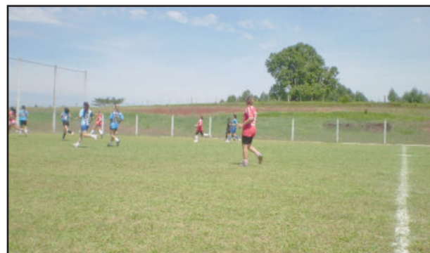
Campo do parque municipal será o palco dos jogos