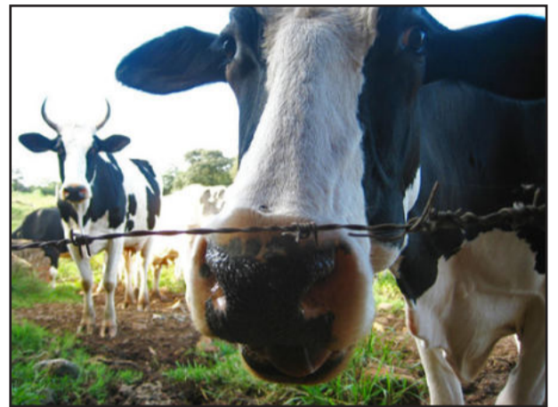
Foto campeã do 8º Concurso Fotográfico, "Tá olhando o quê"

De acordo com o regulamento do concurso não serão aceitas fotografias que já tenham participado de outros concursos, bem como as que já tenham sido publicadas ou exibidas em público. Também não serão aceitas fotografias, que apresentem interferência eletrônica. As fotos devem