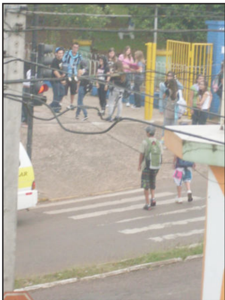
Pedestre ignora o sinal vermelho da sinaleira e atravessa a rua, em Lajeado.

Devido ao grande número de veículos que circulam pela cidade de Lajeado durante o dia, às vezes é muito difícil encontrar um estacionamento para o carro, como no caso da foto onde o motorista estacionou seu veículo metade na faixa amarela, que é proibida, e metade na faixa azul.