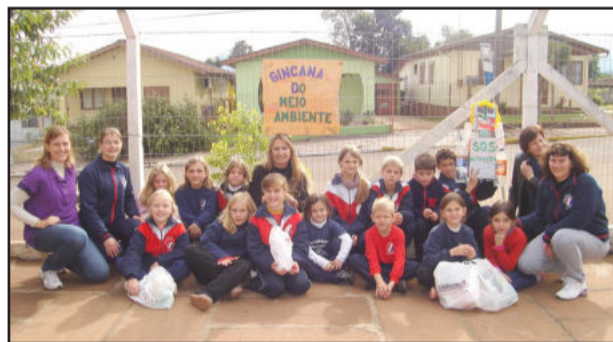
Equipe Marrom venceu a gincana