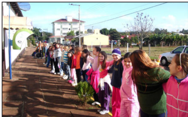
Alunos abraçaram a Escola Tancredo Neves

O Programa Escola Aberta para a Cidadania, da 3ª Coordenadoria Regional de Educação, é uma ação da Secretaria da Educação, no Plano de Prevenção à Violência do Estado. As três escolas que participam do Programa Escola Aberta da 3ª CRE contribuíram com a Semana Estadual de Prevenção à Violência, realizando no sábado, dia 27 de junho, uma Jornada de Prevenção à Violência e Promoção da Paz.