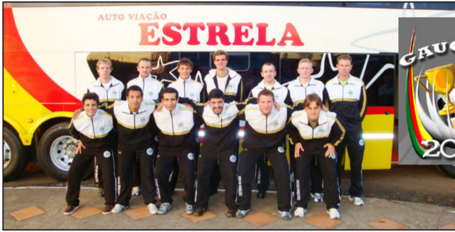
Delegação viaja com ônibus da Auto Viação Estrela