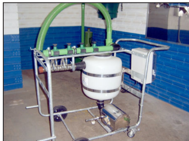
Unidade final móvel