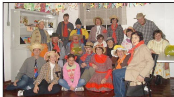
Festa junina realizada no Cras

Foi realizada, na quarta-feira da semana passada, no Centro de Referência de Assistência Social (Cras) a festa junina do Grupo Amigos Unidos. Cada integrante do grupo foi responsável em trazer uma comida típica junina e, para a surpresa da festa, teve pipoca, rapadura, pinhão, bolo, quentão sem álcool, suco de laranja e também a batata-doce. Logo na chegada quem não estava caracterizado passou por um momento de preparação para a festa. Em seguida, iniciou a brincadeira do balão, a qual tomou con-