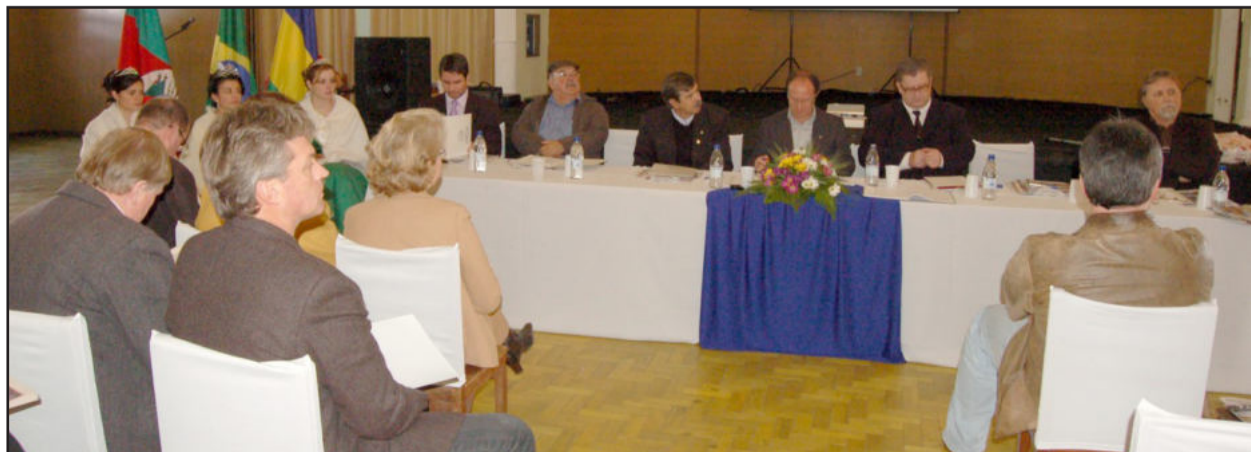
Assembleia da amvat foi realizada no Clube Alvi Negro em Taquari

Outros posicionamentos fortes surgiram no encontro de ontem, porém os aprofundamentos devem ocorrer em uma reunião previamente agendada para esta finalidade.