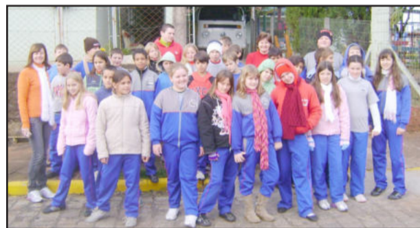
Alunos da escola Vila Schmidt