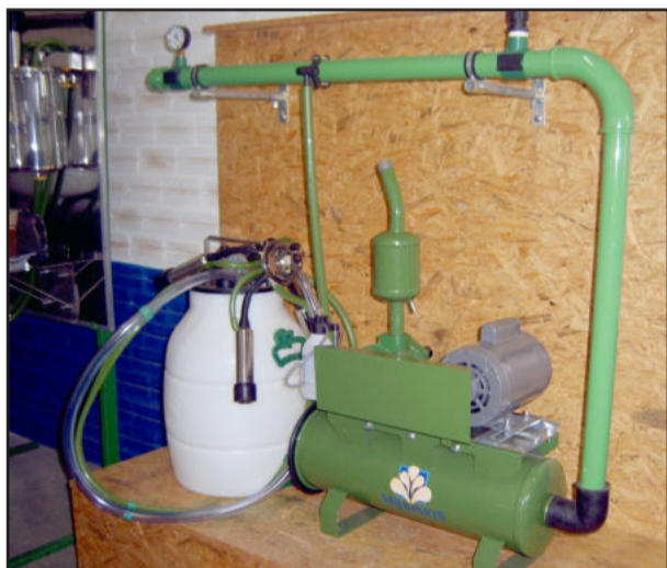
Ordenhadeira MP 330