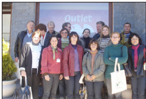
Grupo defronte a Dakota

Nesta terça-feira, dia 30, a Câmara de Indústria e Comércio (CIC) realizou mais uma de suas tradicionais visitas técnicas. No roteiro, 14 empresários e demais interessados conheceram a empresa SEIBT, que atua em todo segmento de transformação de plásticos, com mais de 50 modelos diferentes de moinhos, além de aglomerados, destroçadores, extrusoras de reciclagem, picotadores, exaustores, silos e projetos personalizados, e a matriz da Dakota SA, sediada em Nova Petrópolis, fundada em 1976 e uma das maiores fabricantes de calçados femininos em couro.