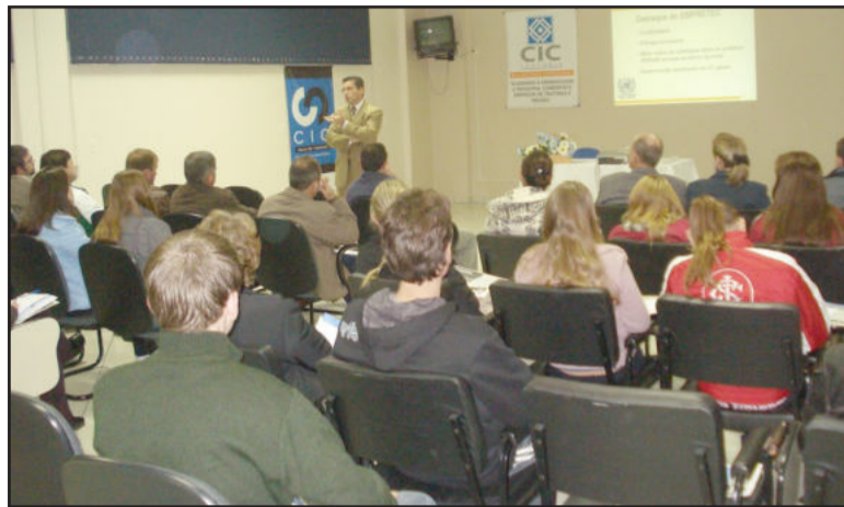
Palestra de apresentação do Seminário Empretec

A principal diferença do Seminário Empretec em relação a outros programas de capacitação é justamente a sua estruturação a partir das características fundamentais do empreendedor, contatadas por meio de estudo efetuado junto a empresários de vá-