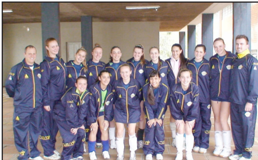
Equipe juvenil do Vôlei Lajeado volta à quadra

Após a conquista da Copa RS Infante-Juvenil no mês de junho, as equipes do Vôlei Lajeado voltam às quadras neste fim-de-semana novamente em jogos decisivos.