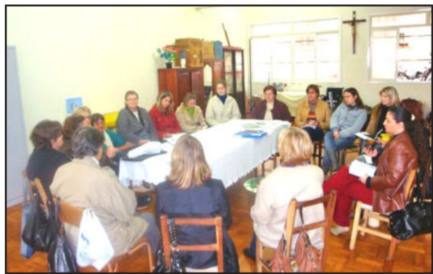
Comissão organizadora em reunião

O Conselho Municipal de Assistência Social reuniu-se na Comunidade Católica de Estrela, no dia 25 de junho, para elaborar a organização da Conferência Municipal de Estrela, que ocorre no dia 5 de agosto, no Salão da Oase, da Comunidade Evangélica. Este evento terá como tema Participação e Controle Social no SUAS. A Conferência está sendo organizada pela Apae, Liga Feminina de Combate ao Câncer, Comunidade Evangélica,