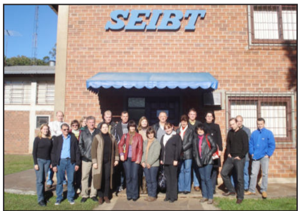
Grupo defronte a SEIBT

Nesta terça-feira, dia 30, a Câmara de Indústria e Comércio (CIC) realizou mais uma de suas tradicionais visitas técnicas. No roteiro, 14 empresários e demais interessados conheceram a empresa SEIBT, que atua em todo segmento de transformação de plásticos, com mais de 50 modelos diferentes de moinhos, além de aglomerados, destroçadores, extrusoras de reciclagem, picotadores, exaustores, silos e projetos personalizados, e a matriz da Dakota SA, sediada em Nova Petrópolis, fundada em 1976 e uma das maiores fabricantes de calçados femininos em couro.