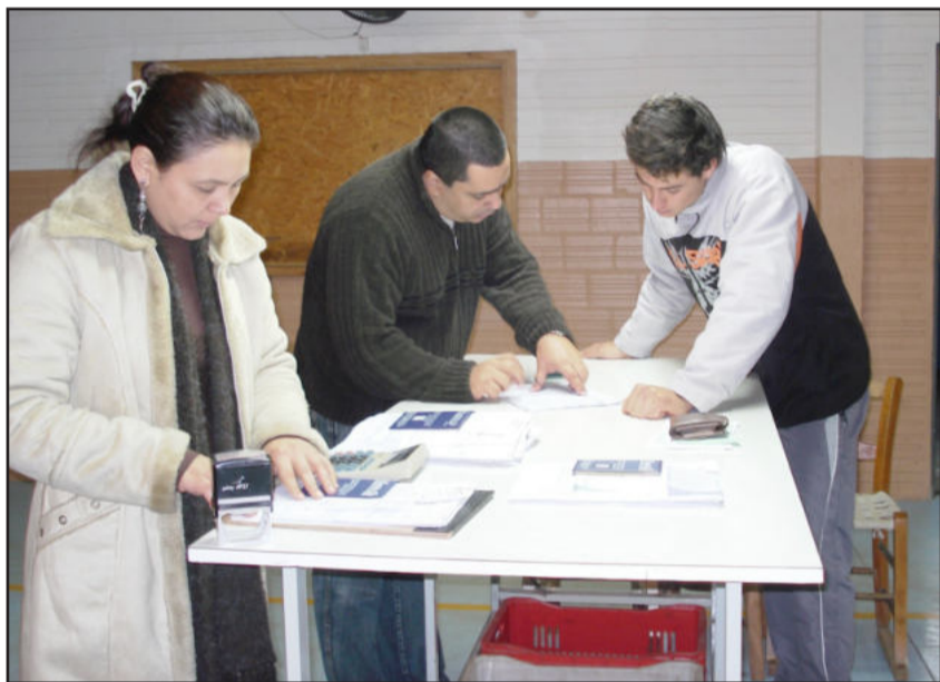
Sintracave assegurou direitos trabalhistas para funcionários da Working

Na quinta-feira, dirigentes do Sintracave estiveram no prédio da empresa para regularizar as rescisórias trabalhistas. Houve acerto no sentido de que todos os trabalhadores fossem contemplados com seus direitos, inclusive uma mulher grávida e trabalhadores com estabilidade foram devidamente indenizados.