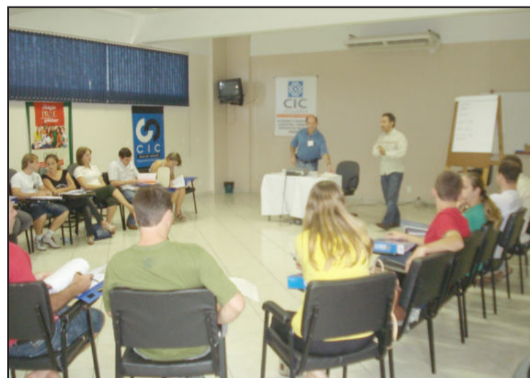
Primeira turma teve a participação de 24 pessoas, representantes de 12 empresas

De março a junho a Câmara de Indústria e Comércio (CIC) e o Sebrae promoveram a Oficina Gerencial de Finanças e Marketing, programação que contou com a participação de 12 empresas em sete encontros, cada um com um assunto específico. Entre os temas abordados estiveram integração e estrutura organizacional, controles operacionais, custos, formação de preço de venda, plano de marketing, demonstrativo de resultados gerenciais, ponto de equilíbrio, fluxo de caixa, capital de giro e plano de vendas. Além de apresentados o conceito e a ferramenta, os consultores que ministraram o curso visitam as empresas participantes do evento. Devido à grande procura, CIC e Sebrae terão nova turma com encontros nos dias 8 e 23 de setembro, 6 e 20 de outubro, 3 e 17 de novembro e 1º de dezembro. Mais informações e inscrições pelo telefone (51) 3762 1233.