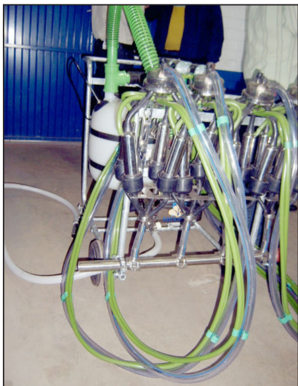
Produtos têm alta resistência