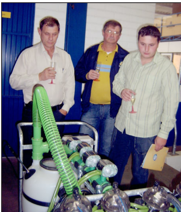
Clientes conferem nova máquina

Todos os produtos expostos foram demonstrados aos visitantes e já estão à disposição para venda. Interessados podem contatar a Agroway pelo telefone (51) 3762 3338 ou visitar a empresa na rodovia RS 128, Via Láctea, nº 4370, em Teutônia.