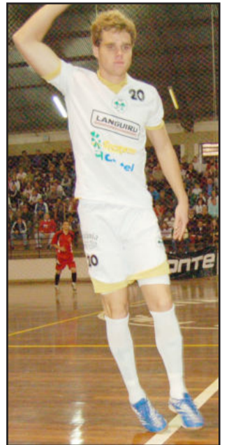
Karoki é opção para jogar como goleiro-linha