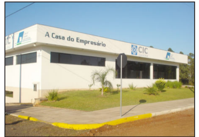
CIC completa 10 anos

No dia 18 de junho a diretoria executiva da Câmara de Indústria e Comércio (CIC) esteve reunida para tratar de diversos assuntos, entre eles a organização de um jantar-baile em comemoração aos 10 anos de fundação da entidade, a serem comemorados no próximo dia 1º de dezembro. O evento está agendado para o dia 19 de setembro, tendo por local a Associação Pró-Desenvolvimento de Languiru. A comissão organizadora está sendo formada e terá a participação dos diretores da CIC. A sugestão do jantar-baile partiu da diretoria do Comércio da entidade, que no dia 26 de junho esteve reunida para tratar do orçamento do evento.