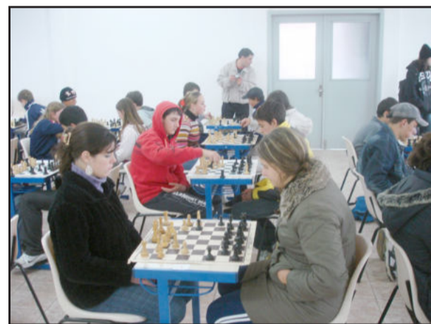
Xadrez também integrou as disputas