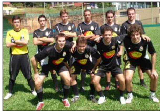
Galáticos lidera a 3ª Divisão

* Classificação: Boka Bier 24; Galera's HC 18; Afibinho 16; Alambique II 15; Só Pela Ceva/Sport 13; LDU/Peugeot 12; Ton'Área e Xernobyl/Sicredi 11; Als Faloa 10; Babilônia 7; Falcons 5; Os Kururus NC 4.