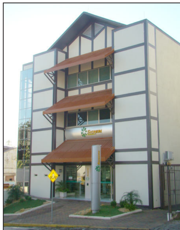
Sede da Sicredi Ouro Branco em Teutônia

Com sede estabelecida no Município de Teutônia, a cooperativa vem reforçando - através do crescimento seu quadro social e do incremento constante de seus resultados - a credibilidade conquistada perante seus 30.491 associados. Tudo isso é reforçado pelo fato de que todos os