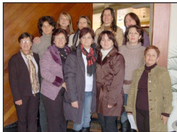
Primeiras-damas também reunidas

Ainda apresentou um preliminar de um programa que está sendo gestado no governo. É um novo formato para o Pimes, com possibilidade de utilização em mais áreas além da pavimentação, novas faixas de financiamento, carências, juros e prazos. "Estamos estudando e vamos tentar implantar ainda neste ano", projeta Althaus.