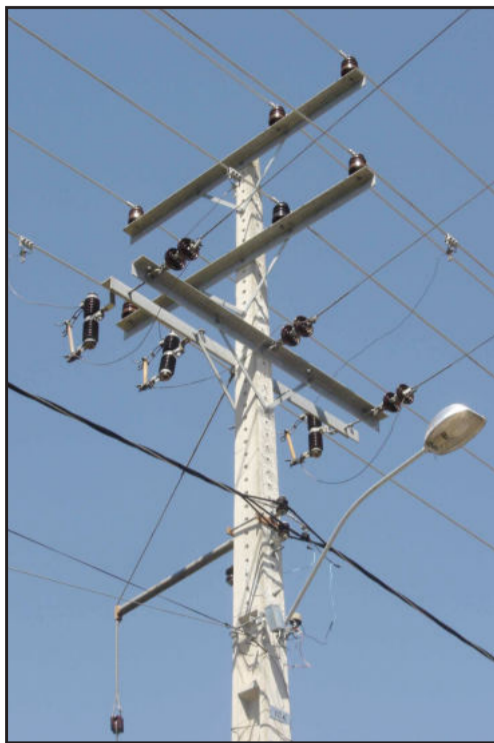
Postes de concreto são mais fortes contra o vento