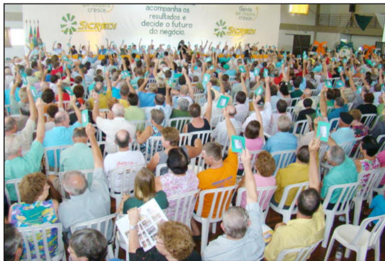
Cooperativa: associado é dono e decide na assembléa

recursos captados pela cooperativa são reaplicados junto às comunidades a que ela atende.