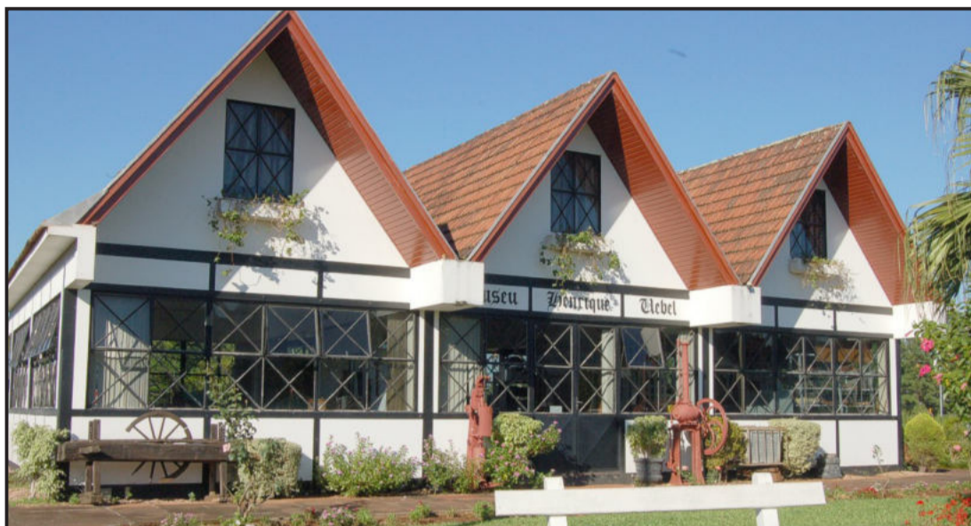
Museu Henrique Uebel

Neste mês de julho, o Museu Henrique Uebel desenvolve mais uma temática de exposições, com o objetivo de resgatar a história e a realidade de determinadas épocas, através do destaque a alguns objetos e peças existentes. A Secretaria Municipal de Cultura, Turismo, Esporte e Lazer enfatiza que algumas peças valorizaram os antepassados, para que as novas gerações conheçam um pouco de suas raízes.