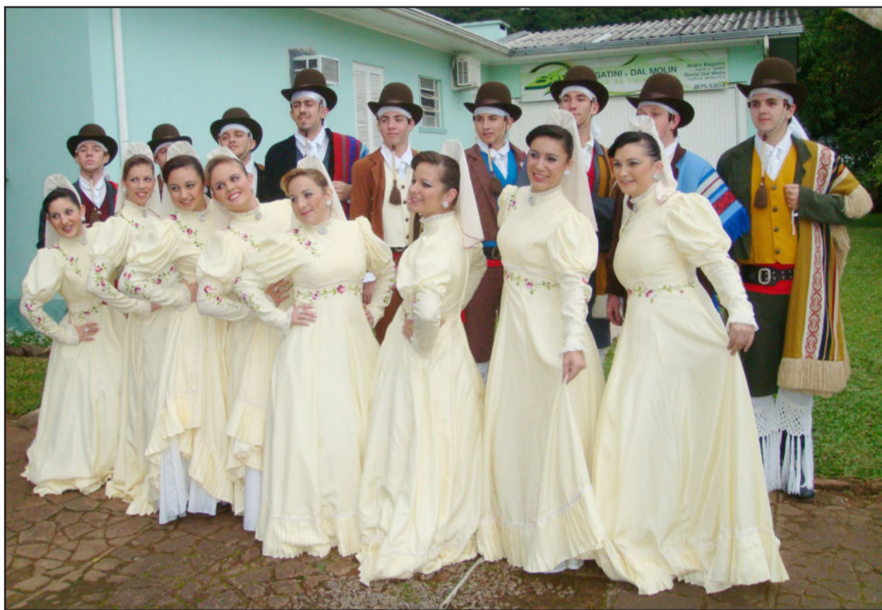
Grupo Adulto do CTG Porteira dos Pampas