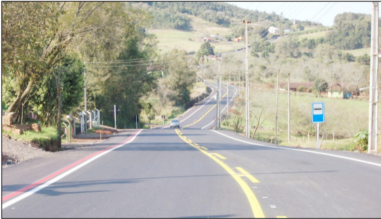
Promessa cumprida: Estrada Velha está pronta para a inauguração