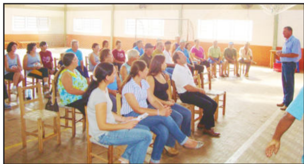
Bate Papos Comunitários são uma conversa da administração municipal com a comunidade.

A administração municipal de Fazenda Vilanova organizou as datas para o mês de setembro em que serão realizados os Bate Papos Comunitários. Estes eventos são uma iniciativa da Prefeitura, para que a população fique sabendo quais investimentos estão sendo realizados e no que as secretarias do Município estão trabalhando. Além disso, também é a oportunidade de a Prefeitura ouvir a comunidade, para saber quais melhorias ela acha que ainda são necessárias em Fazenda Vilanova. Sejam na área da Saúde, da Educação, de Obras, da Assistência Social, ou onde os moradores sentirem que ainda falta algum investimento.