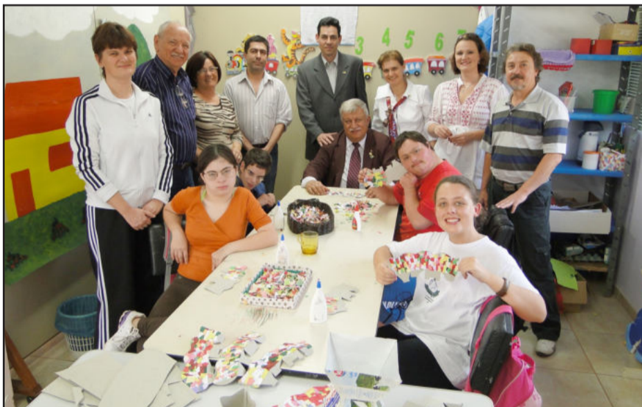
Comitiva em visita à Apae