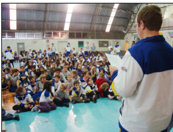
Alunos do Ieceg acompanham atentos à reflexão sobre a Pátria