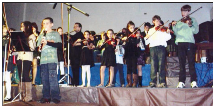
Estudantes com variados instrumentos musicais

Shore; Romeu e Julieta de 1968, música Romeu e Julieta de Nino Rota; Vencidos pela Justiça de 1934, música: Blue Moon de Richard Rodgers e Lorenz Hart; Jurassic Park "O Parque dos Dinossauros" de 1993, música: Jurassic Park Theme de John Williams; A Pantera Cor-de-Rosa de 1964, música: The pink Panter Theme de Henry Mancini; A Família Addams de 1991, música: the Addams Family Theme de Vic Mizzy; A dama de Vermelho de 1984, música: I just called to say i love you de Stevie Wonder; Crepúsculo de 2008, música Iris de John Zeznik; Top Gun Ases Indomáveis de 1986, música: Top Gun Anthem de Steve Stevens; Titanic de 1997, música: My heart will go on de James horner e Will Jennings; Embalos de sábado a noite de 1977, música: Staying alive dos Bee Gees; Rocky, O Lutador de 1976, música: Gonna fly now de Bill Conti e Carol Connors.