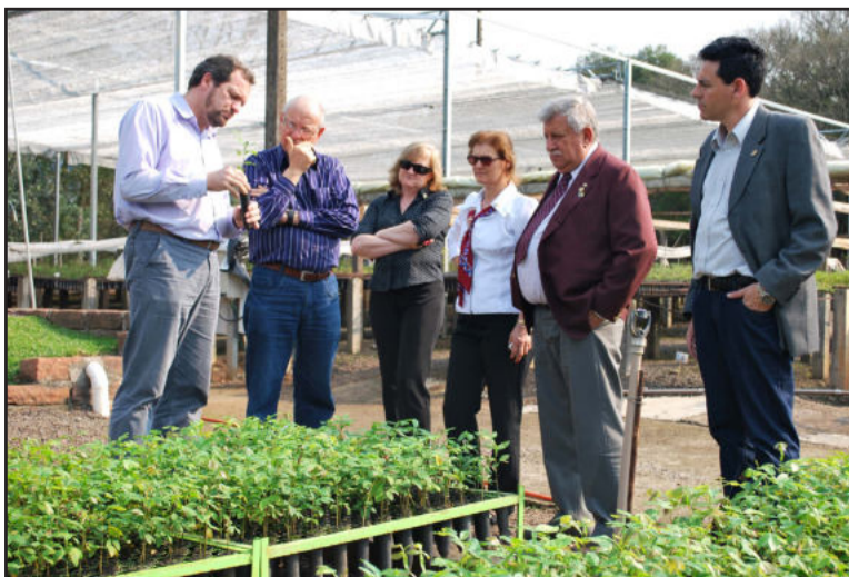
Visita ao viveiro de plantas da Certel