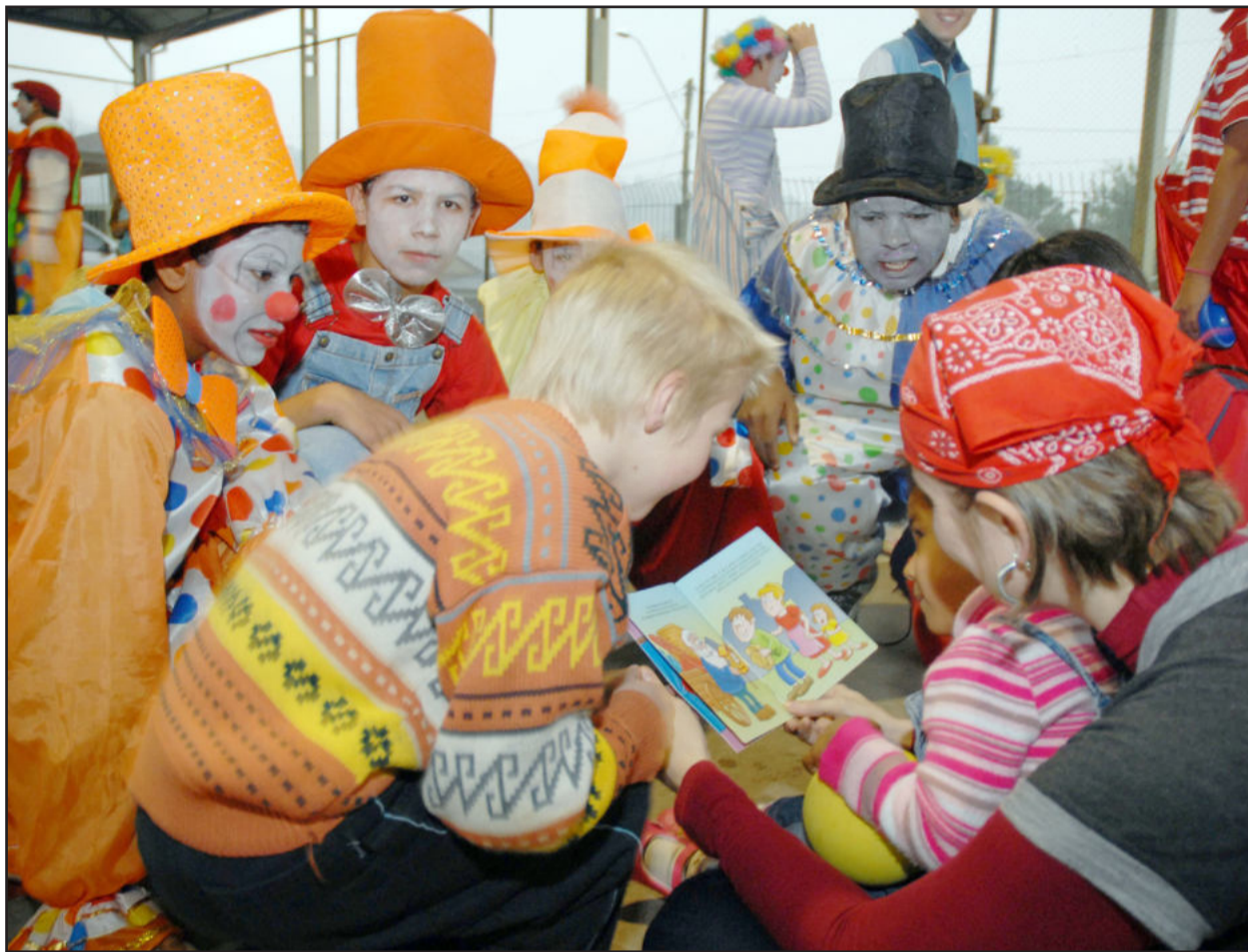
Voluntários desenvolveram ação recreativa em Santa Cruz do Sul