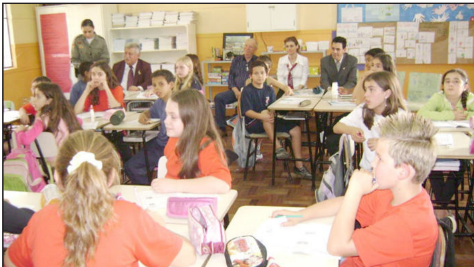
Visita na Escola Leopoldo Klepker

à Violência e Drogas (Covide) e ao Proerd. Além disso, a entidade planeja a neutralização da emissão do gás carbônico do clube, por meio do Projeto Harmonia Ambiental da Certel, e obtenção do selo “Carbono Neutro”; firmou parceria com a Câmara de Indústria e Comércio (CIC) de Teutônia para o projeto “Revive Boa Vista”, que contará com atividades de cunho ambiental e está em fase de planejamento; realiza a quinta edição do “Aluno Nota 10” nas escolas do Município que trabalham com alunos de nível médio; e firmou parcerias com outras entidades locais na busca de melhorias para a comunidade.