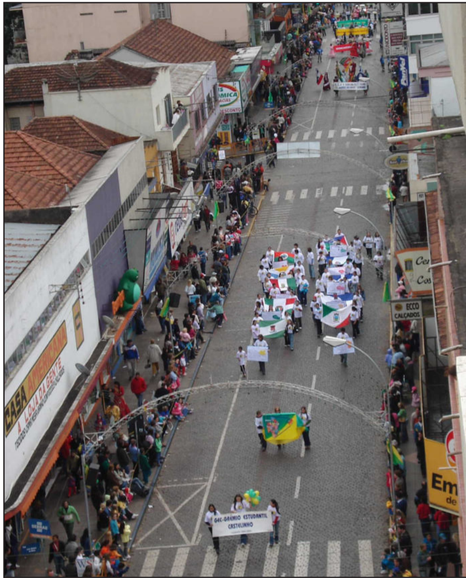
Desfile será na Rua Júlio de Castilhos

As muitas alas, apresentarão à comunidade um verdadeiro espetáculo em criatividade e beleza, iniciando pela Escola Especial Bem-me-Quer, da Apae, precedido por grupo da Brigada Militar que conduzirá as bandeiras. Depois das escolas desfila um pelotão da Marinha do Brasil, com 33 militares, sendo dois oficiais e 31 praças da tripulação do navio Corveta Imperiais Marinheiros, ancorado em Porto Alegre. A seguir, desfila um pelotão formado por mais de 100 jovens lajeadenses que prestam Serviço Militar no 9º Regimento de Cavalaria Blindado de São Gabriel, encerrando a presença do Exército com dois carros tanques de guerra - veículos blindados do Exército. Por último, desfilam a Brigada Militar e o Corpo de Bombeiros.