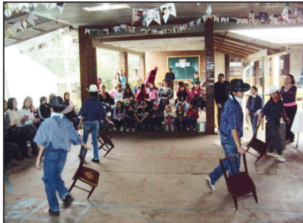
Alunos realizaram apresentações