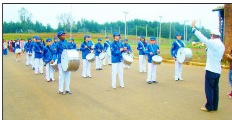
Banda Marcial abriu a Semana da Pátria.