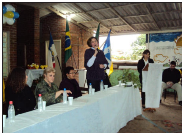
Cerimônia ocorreu na Escola 20 de Maio

Lajeado e Estrela figuram entre os 50 municípios com altos indicadores de violência: Lajeado em 15º e Estrela em 49º.