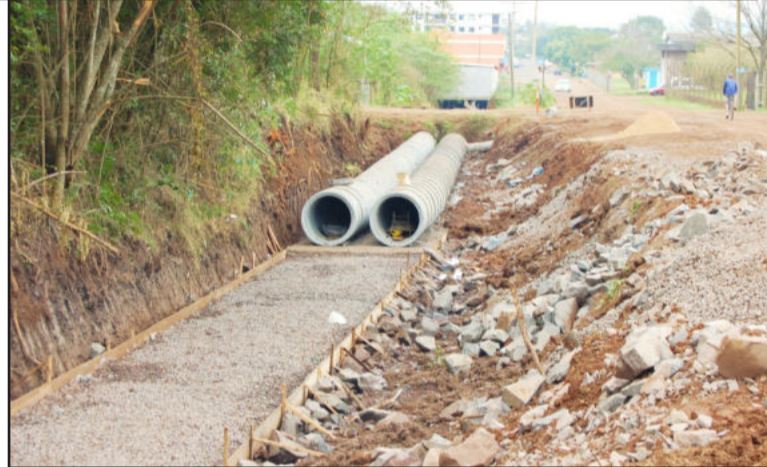
Obras na galeria às margens da Rua 2 Leste, em Languiru