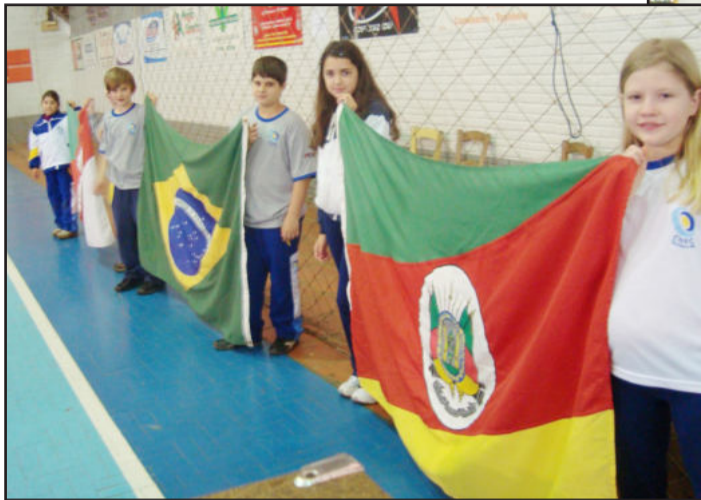
Alunos do Ieceg valorizaram os símbolos da Pátria e demonstram civismo