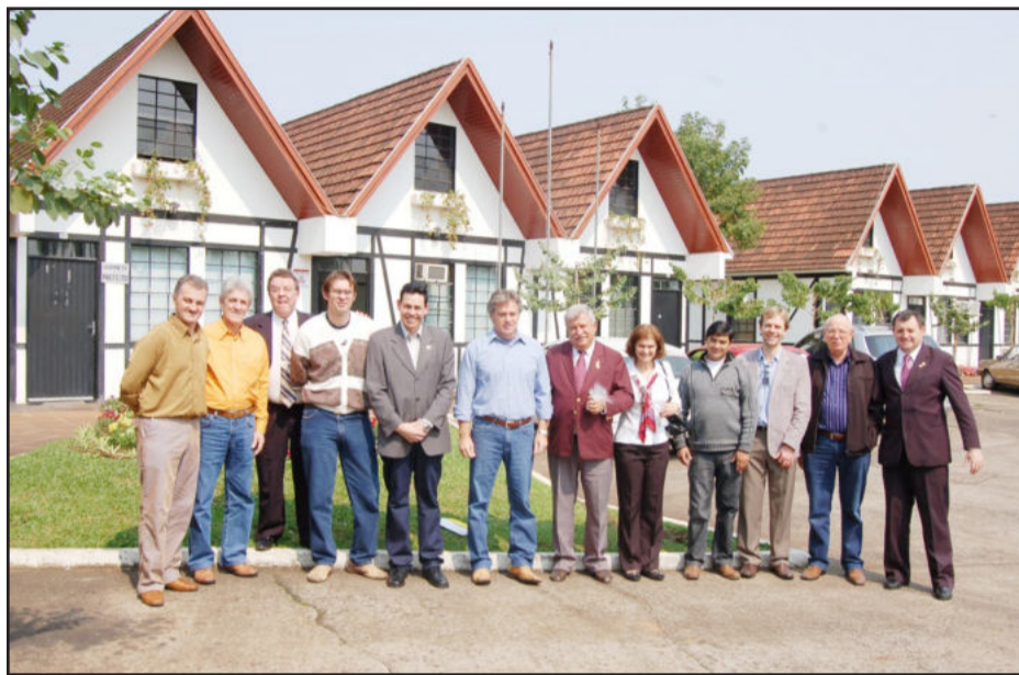
Visita à administração municipal

Os valores doados pelo Rotary em 2009 foram utilizados pela Apae na implantação da Oficina de Material Reciclado, com investimento de R$ 4 mil, além de R$ 6 mil para equipamentos de fisioterapia e