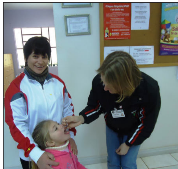
Crianças recebendo a dose da vacina