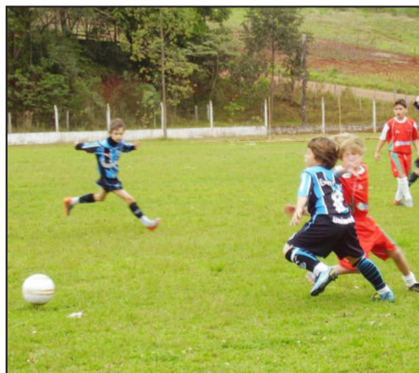
Na categoria 2000, o tricolor da capital também goleou