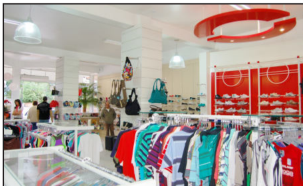
A loja na Capitão Schneider