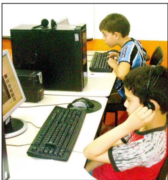
Alunos utilizam o Telecentro para fazer pesquisas pela internet ou realizar tarefas de aula

As inscrições deverão ser realizadas somente via internet, até o dia 21 de outubro, pelo site www.objetivas.com.br . As provas escritas serão aplicadas no dia 13 de novembro. Edital na íntegra no Site www.imigrante-rs.com.br (clique no link Licitações/Concursos, Editais para concurso público).