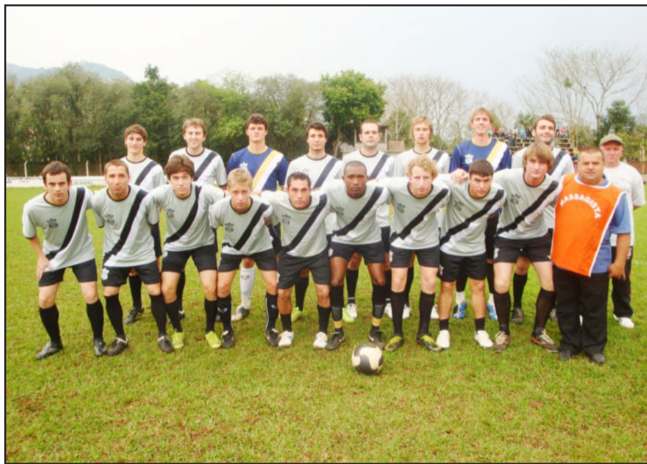
Terceira vitória seguida deixou ECAS entre os primeiros

Em Imigrante, o ECAS venceu a terceira partida consecutiva, agora diante do União Santo André, o que fez o Tiradentes disparar na liderança. O ECAS vem de um ótimo aproveitamento e já está entre os primeiros colocados, disputando vaga à fase