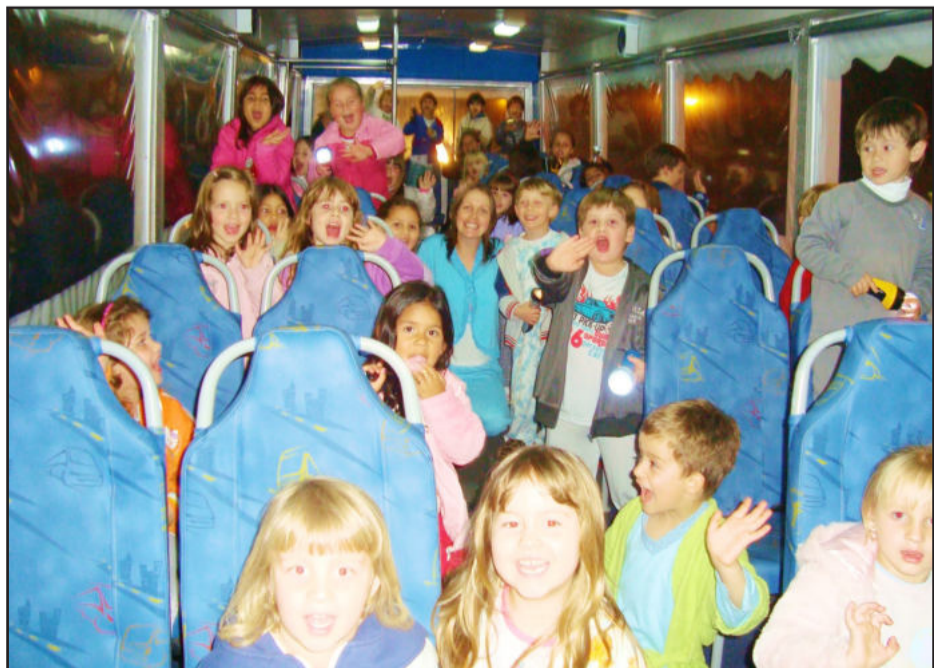
Passeio no Turismóvel para conhecer a cidade