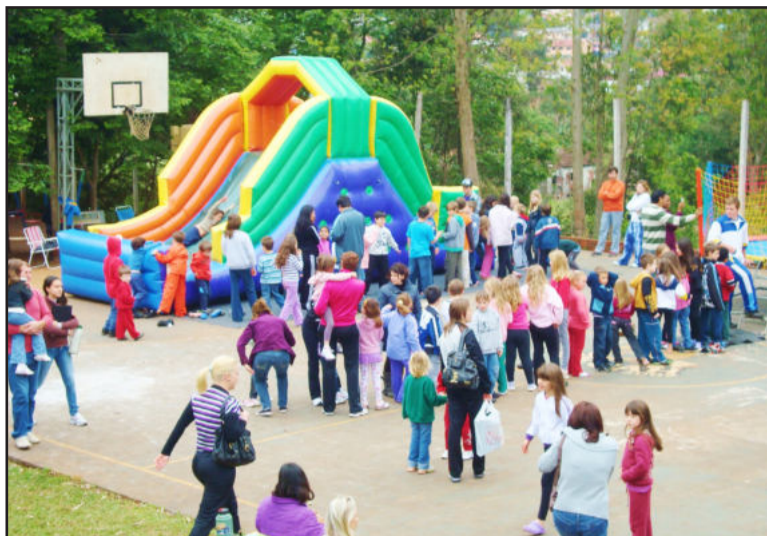
Muita diversão com os brinquedos infláveis

Os pais, além de acompanhar os filhos, também aproveitaram o momento de integração e cevaram um gostoso chimarrão. Enquanto uns brincavam, a equipe do Ieceg assava os galetos, para que tudo ficasse pronto a partir das 11h, momento em que o meio galetto e a porção de massa começaram a ser entregues.