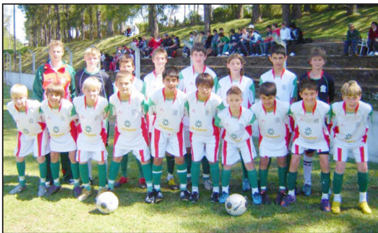
Juventus 97 garantiu vaga na próxima fase do Gauchão