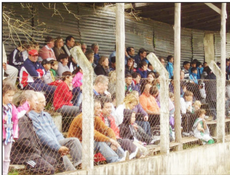
Torcedor prestigiou Juventus e Grêmio, no Canabarrense

No domingo, dia 3, a bola voltou a rolar. A Juventus 95 e 97 voltou a campo para, desta vez, encarar o Avenida de Agudo, junto à sede da Elegê, em Languiru. Na categoria 95, derrota de 3 a 0, e na 97, vitória por 1 a 0, com gol de Miguel Zirbes. Com a derrota, a categoria 95 viu suas chances de classificação à próxima fase ficarem bastante remotas, enquanto a 97 confirmou uma das vagas na fase seguinte do Gauchão 2010.