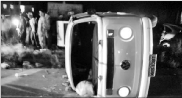
Acidente deixou cinco pessoas feridas