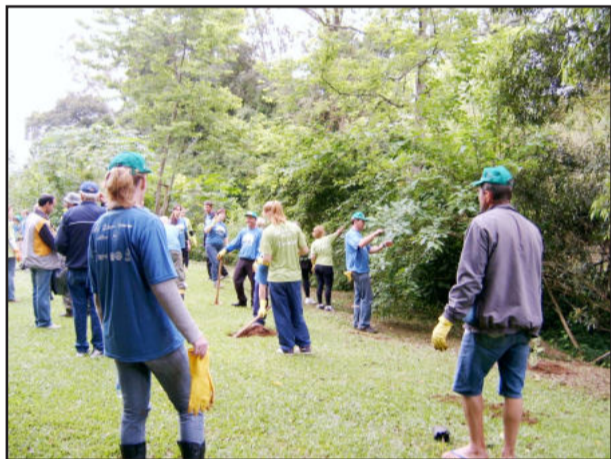
Plantio de mudas e limpeza na Associação da Languiru