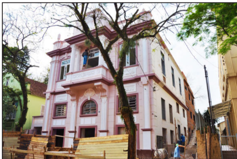
Prédio histórico para Secretaria de Educação ganha parte nova nos fundos

De acordo com o Inventário do Patrimônio Cultural do Rio Grande do Sul, este prédio teve como proprietários iniciais a família Schneider e ao longo do tempo já abrigou o Registro de Imóveis de Lajeado, bem como a sede do Banco Popular do Lajeado Ltda (SPAR und DARLEHNSKASSE von LAGEADO) - fundado em 1906, e depois adquirido pelo