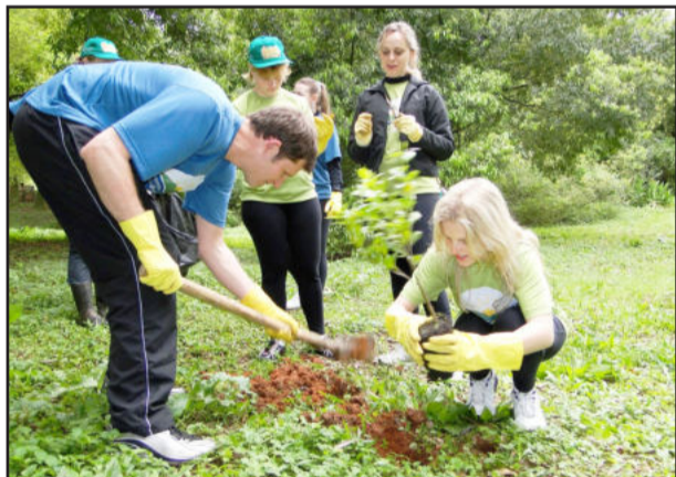
Equipes plantaram cerca de 500 mudas de árvores nativas