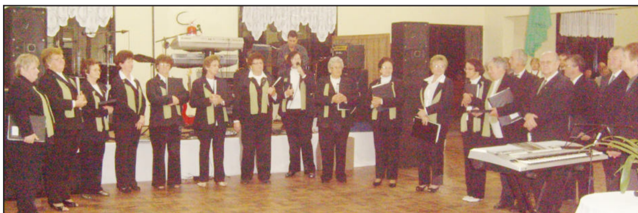
Coro Misto Justiça de Westfália