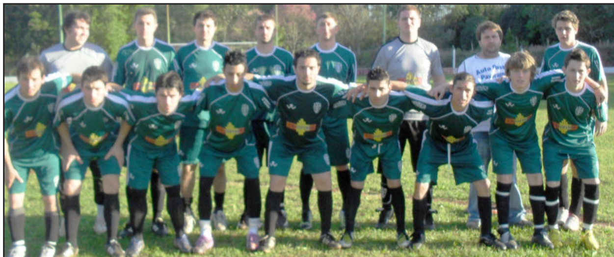
Com a primeira vitória em casa, Guaíba voltou a liderar

Nos Aspirantes, o Guaíba também saiu vitorioso da partida frente ao Atlético Gaúcho, mas o placar foi de 2 a 1.