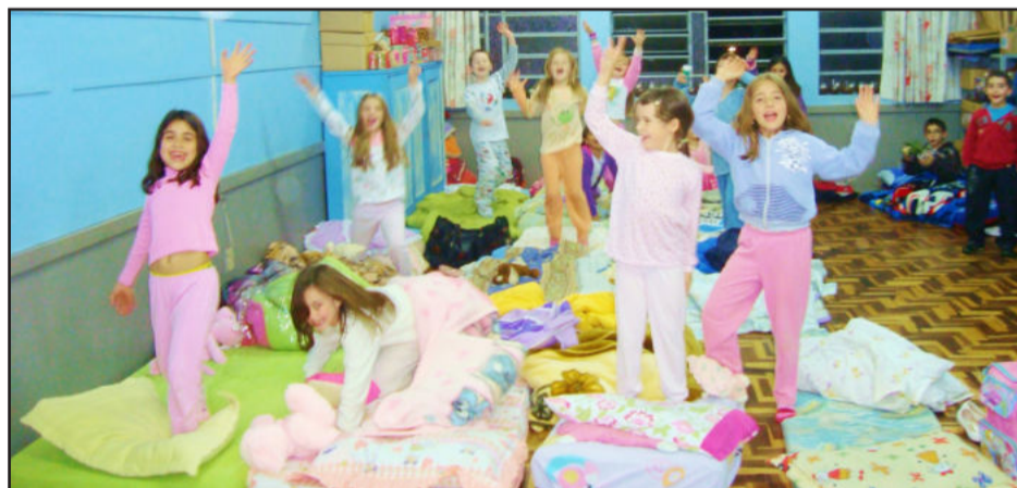
Noite do Pijama foi muito aguardada

O Ieceg esteve repleto de pessoas, que circularam pelo pátio ao longo da manhã. Mas, é claro que a atividade foi mesmo para as crianças, antecipando o seu dia, lembrado em 12 de outubro. O evento foi um sucesso. O número de pessoas envolvidas demonstra que a comunidade está engajada com a escola, afim de torná-la cada vez melhor e proporcionar aos filhos um ensino de excelente qualidade. A união de esforços da direção, professores e colaboradores fez com que todo o evento fosse coroado de êxito.