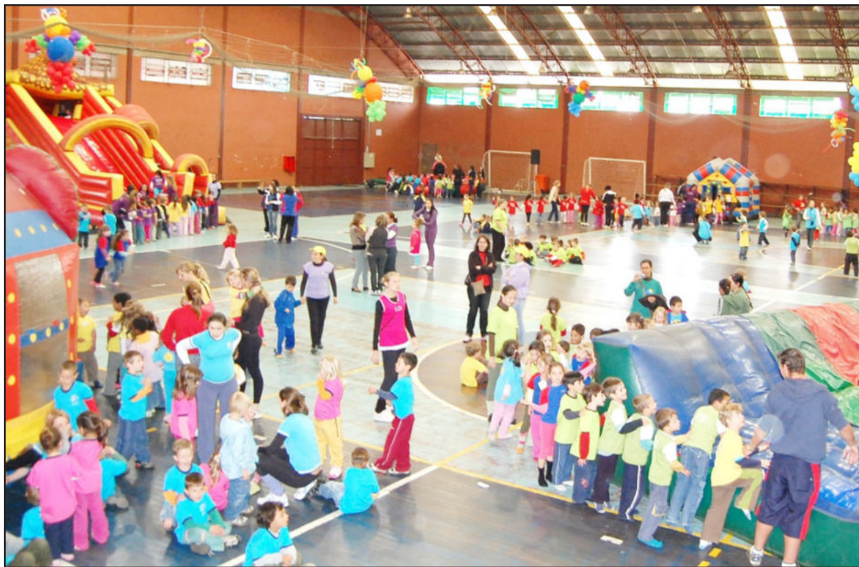
Criança no Parque é tradicional evento da Sed para marcar o Dia da Criança