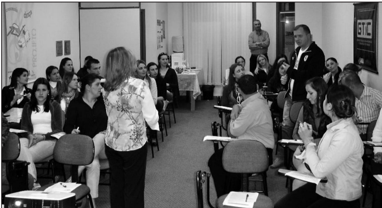
Palestra Atendimento - Capacitações mobilizam empreendedores na Apeme

Uma parceria entre a Apeme - Associação de Pequenas e Médias Empresas - e o Sebrae promove cursos, palestras e oficinas em Garibaldi. Todos os meses, um grande número de empresários e colaboradores participa dos eventos providos na sede da entidade.