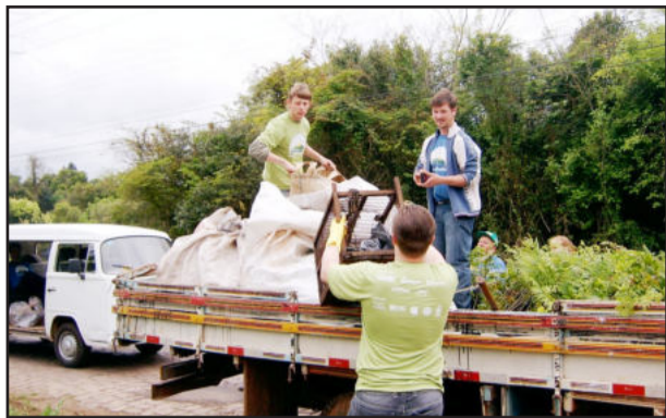
Plantio de mudas e limpeza na Várzea