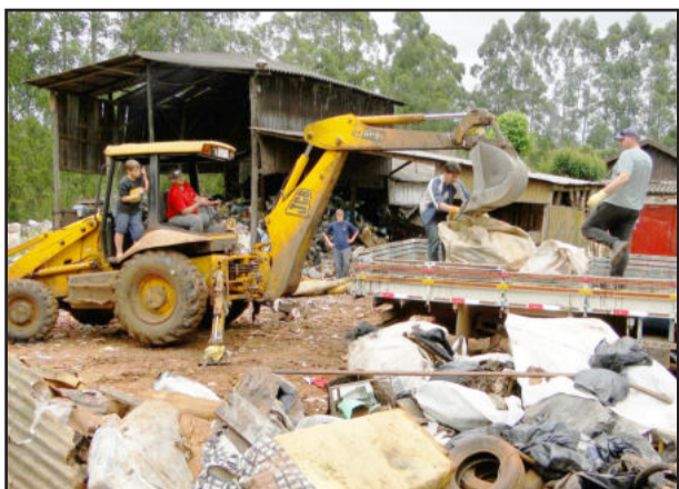
Lixo recolhido foi encaminhado ao Aterro Sanitário de Teutônia, onde será devidamente separado para o destino final correto