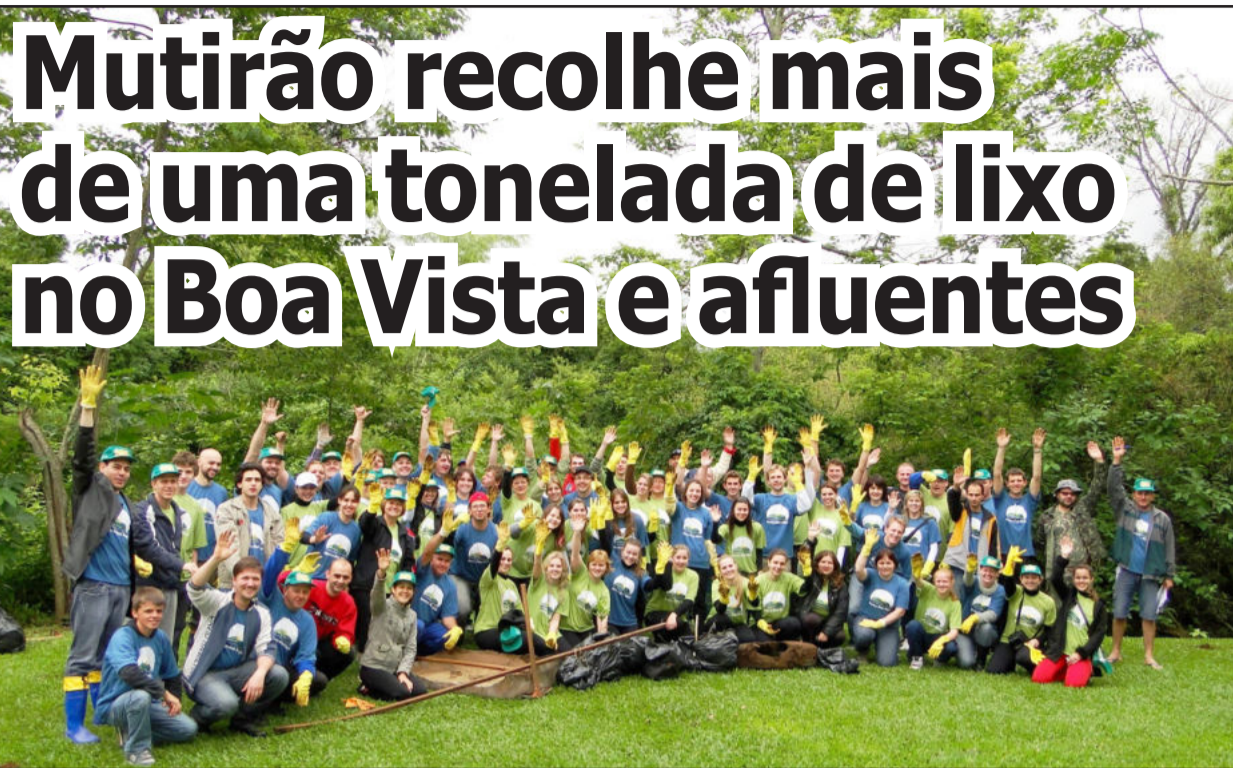
Aproximadamente 70 voluntários participaram da ação no sábado, dia 2 de outubro