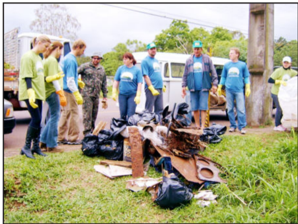
Plantio de mudas e limpeza no acesso para a Vila Cuba