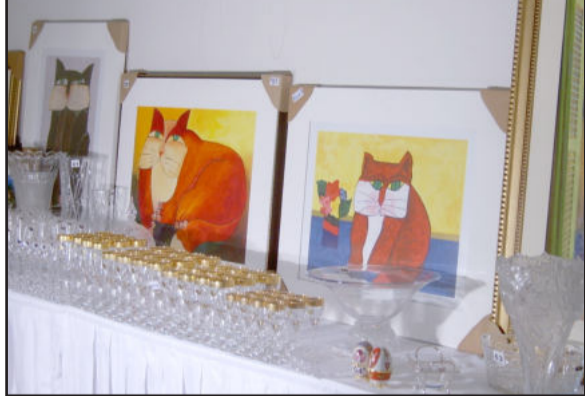
Objetos colocados em leilão