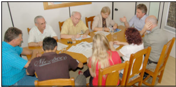
Conselho do Trânsito e administração analisam as reformulações

A administração municipal de Teutônia e o Conselho Municipal de Trânsito estiveram reunidos, na manhã desta quinta-feira, dia 3, com o representante da empresa responsável pelo estudo de reformulação no transporte coletivo da cidade. O encontro foi realizado na sala de reuniões do gabinete do Executivo, e teve como objetivo apresentar o projeto para uma primeira análise dos conselheiros. Sugestões e alternativas foram apontadas, e estas deverão ser adaptadas para