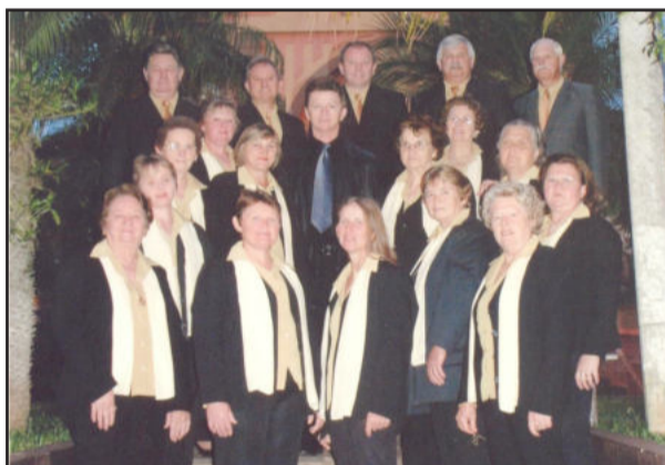
Coral Municipal de Colinas