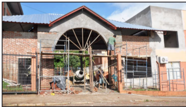
Novo pórtico muda visual da escola