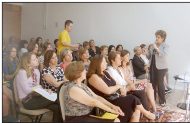
Participantes do leilão

A tradicional Bublitz Galeria de Arte, de Porto Alegre, realizou na noite desta segunda-feira, dia 30, um grande leilão de porcelanas, cristais, pratarias, pinturas e tapetes orientais. O leilão ocorreu no salão de eventos do Baviera Park Hotel, no Centro Administrativo, em Teutônia. O evento, que foi beneficente ao grupo Anjos da Liberdade, contou com a presença de diversas pessoas da região. Durante o leilão também foi oferecido jantar aos convidados.