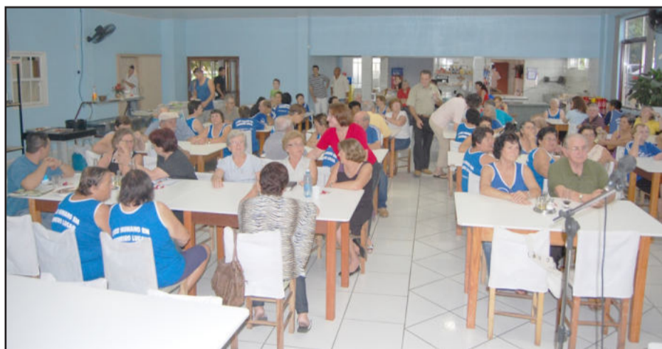
Encontros encerraram com almoço

O secretário de Esportes explicou os horários de funcio-