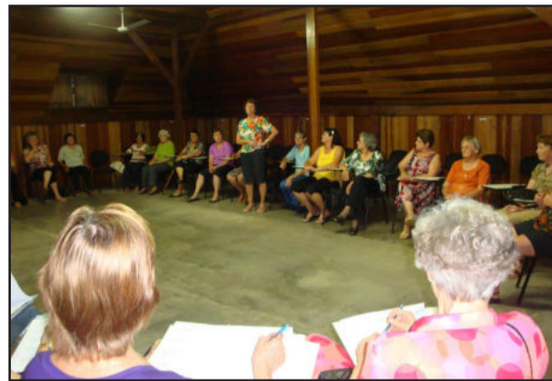
Candidatas se apresentaram aos jurados

Na tarde desta quinta-feira, dia 3, as candidatas à Rainha da Terceira Idade tiveram o primeiro contato com os jurados. Elas se apresentaram, falando um pouco sobre os grupos de idosos que representam. O encontro aconteceu nas dependências do Centro de Cultura e Turismo Bertholdo Gausmann.