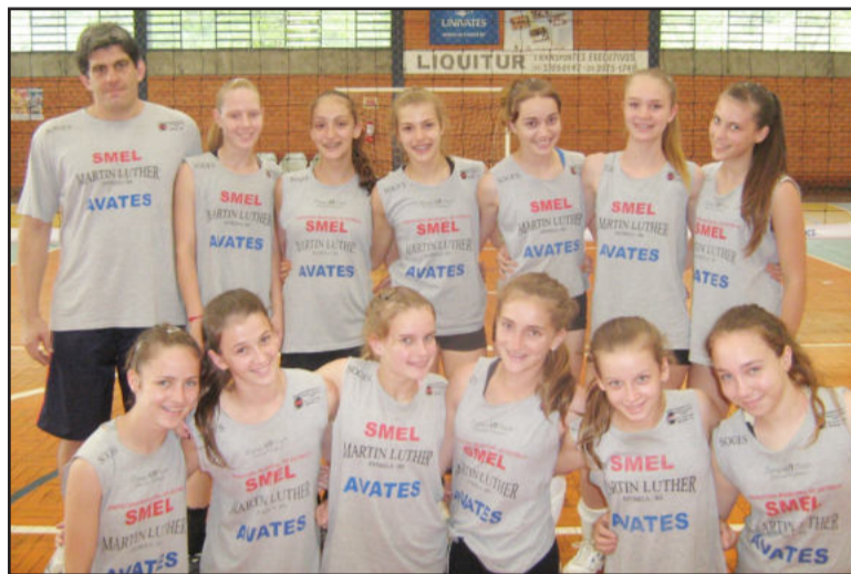
Equipe Mirim treina intensamente para disputar a grande final do Estadual

Após ter conquistado o bicampeonato estadual na categoria infantil, a equipe da categoria infante-juvenil também entrava em quadra para repetir a façanha do segundo título