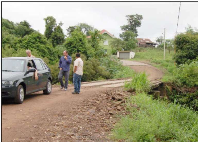
Ponte atual é coberta pela água do Arroio Boa Vista em caso de enchentes e suporta pouca carga