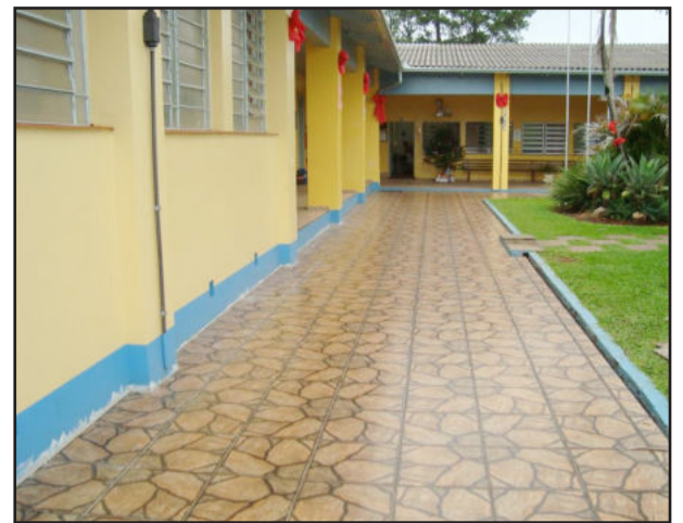
Obra foi concluída ontem

Aqueles que visitaram o Instituto de Educação Cenequista General Canabarro (Ieceg) nesta semana perceberam que o mesmo passa por melhorias em sua infraestrutura. Logo na chegada pode-se observar material de construção e fitas de isolamento, que indicam que o educandário passa por obras.