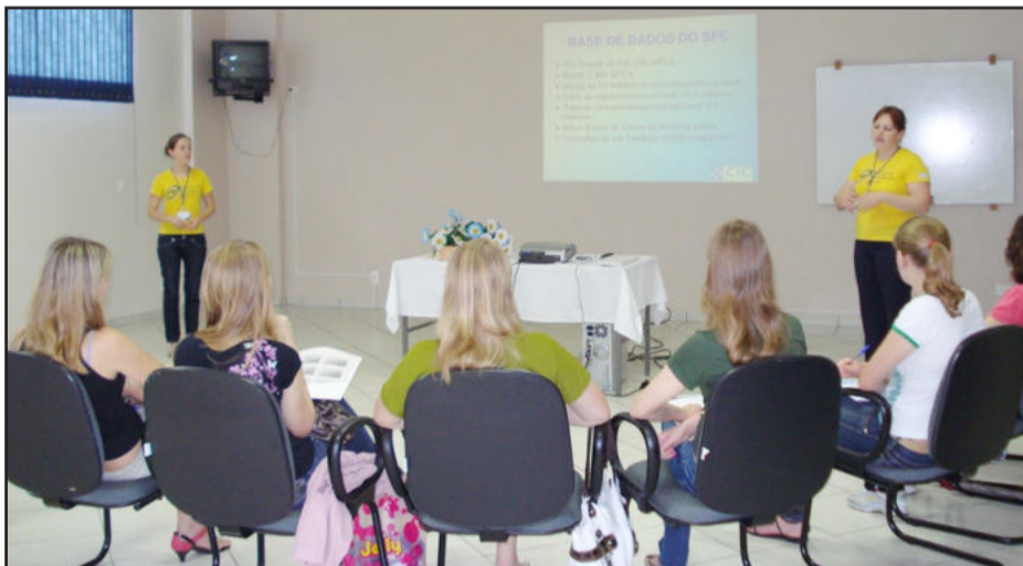
Treinamento será retomado em fevereiro de 2010

No dia 25 de novembro ocorreu o último treinamento do Serviço de Proteção ao Crédito (SPC) de 2009 promovido pela Câmara de Indústria e Comércio (CIC) de Teutônia. Os eventos ocorrem mensalmente e são gratuitos, tratando de inúmeras questões referentes ao SPC, um dos serviços oferecidos pela entidade aos seus associados, que existe no município desde 1986, anterior inclusive à data de fundação da CIC, em 1999.