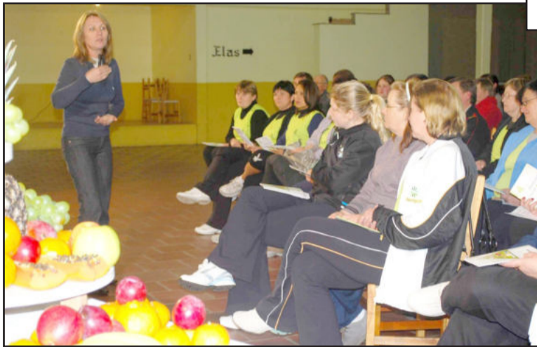
Programa de reeducação alimentar já beneficiou mais de duas mil pessoas

Atualmente, a Certel desenvolve o programa de reeducação alimentar Peso Leve, em sua 13ª edição; o projeto de neutralização dos gases de efeito estufa Energia Verde em