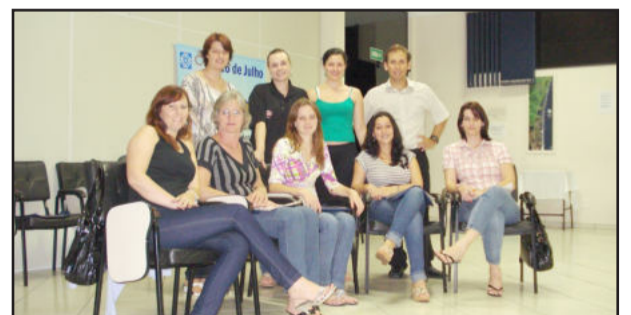
Participantes do curso

Com o objetivo de disponibilizar ferramentas para potencializar os ganhos na época de Natal por meio de técnicas eficazes de vendas e de atendimento a clientes, a Câmara de Indústria e Comércio (CIC) de Teutônia, em parceria com a Câmara de Dirigentes Lojistas (CDL) de Porto Alegre, promoveu o curso “Vendas para o Natal”. A capacitação ocorreu no mês de novembro no auditório da CIC e contou com a participação de oito pessoas.