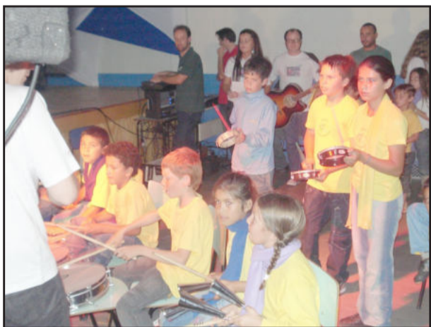
Alunos atendidos pelo projeto Partitura Colorida apresentam-se com os instrumentos doados pela empresa

O projeto tem por objetivo proporcionar atividades artísticas promovendo o desenvolvimento integral do aluno nos aspectos cognitivo, afetivo, social, psicomotor e físico, onde possam compartilhar essas vivências no contexto escolar e social. As atividades desenvolvem valores como disciplina, atenção e integração, além de considerar as diferenças culturais, o respeito à individualidade. O projeto é desenvolvido em forma de oficinas no turno oposto ao escolar.