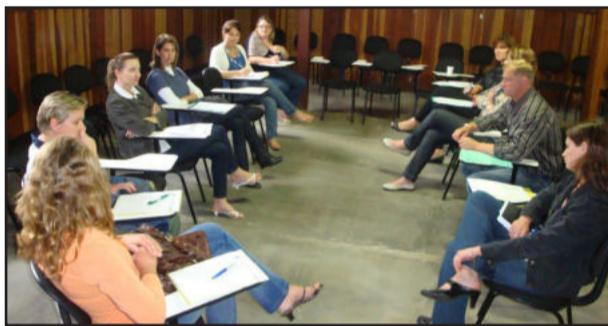
Comitê da Qualidade já planeja 2010

O Comitê da Qualidade da Prefeitura de Estrela está retomando as atividades. O foco principal é a qualidade de vida dos servidores e a eficiência no atendimento ao público.