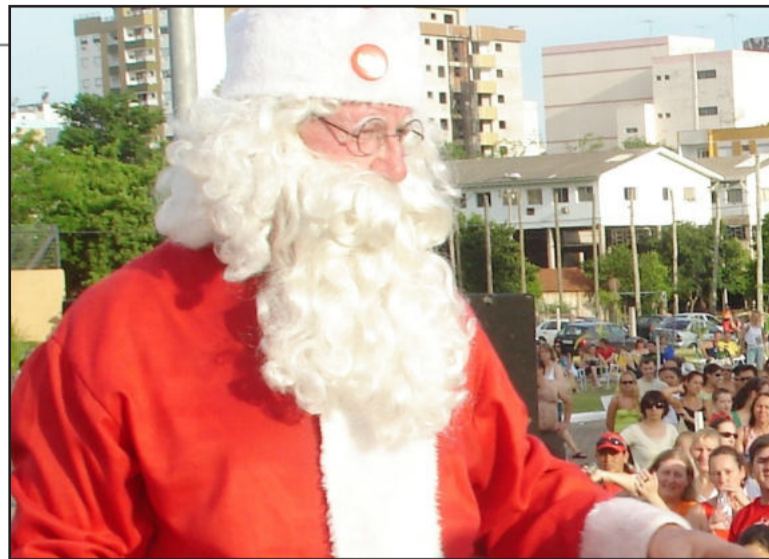
Papai Noel chega ao entardecer de hoje

Desde esta quinta-feira, o Cedelinho está fazendo passeios pela cidade de Lajeado, com saídas da frente da Casa de Cultura, de terça a sexta-feira, a partir das 20h; e nos sábados e domingos, às 19h. O valor do passeio é de R$ 2,00 e o horário de encerramento é conforme o movimento de público. Nos dias 05, 06, 10, 13 e 15 de dezembro, o Cedelinho passará pelo Parque dos Dick, fazendo uma parada, para que as pessoas possam conferir as atrações do Lajeado Brilha previstas para estas datas no local. Os passeios com o Cedelinho vão até o dia 29 de dezembro, sendo que no dia 24 não terá atividade.