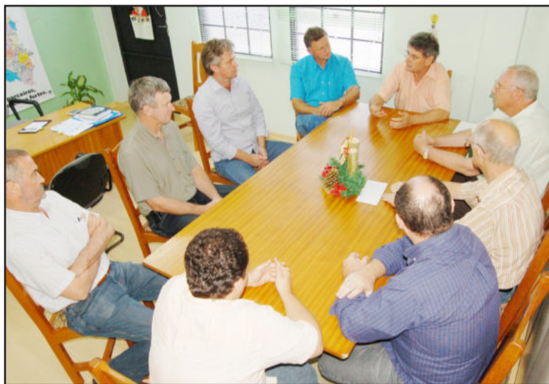
Lideranças dos dois municípios discutiram o tema com empresários

Depois do debate, o grupo foi a campo conhecer os locais, primeiro a ponte atual e depois uma área apontada como ponto de partida para o estudo da nova ponte. No local, o arroio tem um leito profundo e dificilmente sai da calha em caso de enchente. Agora, a equipe técnica dos dois municípios deve elaborar um projeto em conjunto, levando em conta aspectos econômicos, ambientais e técnicos. A intenção é formatar o projeto com a maior brevidade possível para encaminhar para a captação de recursos federais.