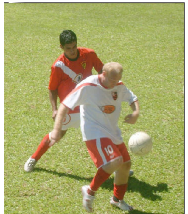
Flamengo e Concórdia decidem título nos Aspirantes