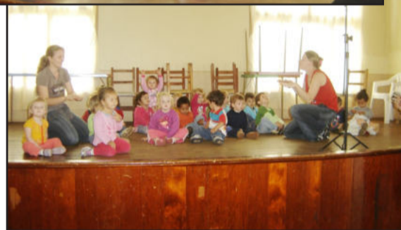
Crianças ensaiaram apresentação

Os alunos da Escola de Educação Infantil Azaléia, do Bairro Teutônia, realizaram durante esta semana os preparativos finais para a apresentação de natalina do educandário. As coreografias e músicas de Natal foram ensaiadas no local onde ocorrerá a festividade. O evento acontece na próxima quinta-feira, dia 9, a partir das 19h30min no Clube Cultural e Recreativo Teutoniense. Todas as turmas da escola farão apresentações artísticas. A noite será abrihantada com a chegada do Papai Noel.