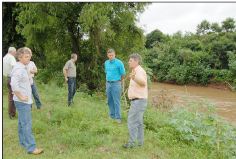
Grupo foi conhecer um local para estudar a implantação da nova ponte